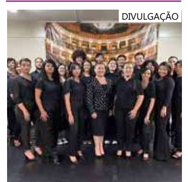
Espectáculo é composto de músicas que fazem alusão às raízes africanas

O Liceu Cláudio Santoro é uma escola de artes gratuita implementada pelo Governo do Amazonas, por meio da Secretaria de Cultura e Economia Criativa, que traz a democratização do ensino de artes como música, dança e teatro.