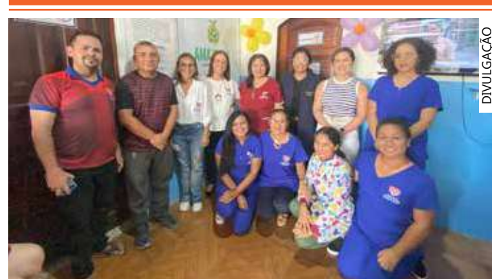
Com mais de 10 anos de serviço, a Adiam promove a inclusão social

Pela primeira vez, as Organizações da Sociedade Civil (OSC's) encontraram no edital do FPS a possibilidade da utilização do recurso público para pagamento de pessoal de Covid-19.