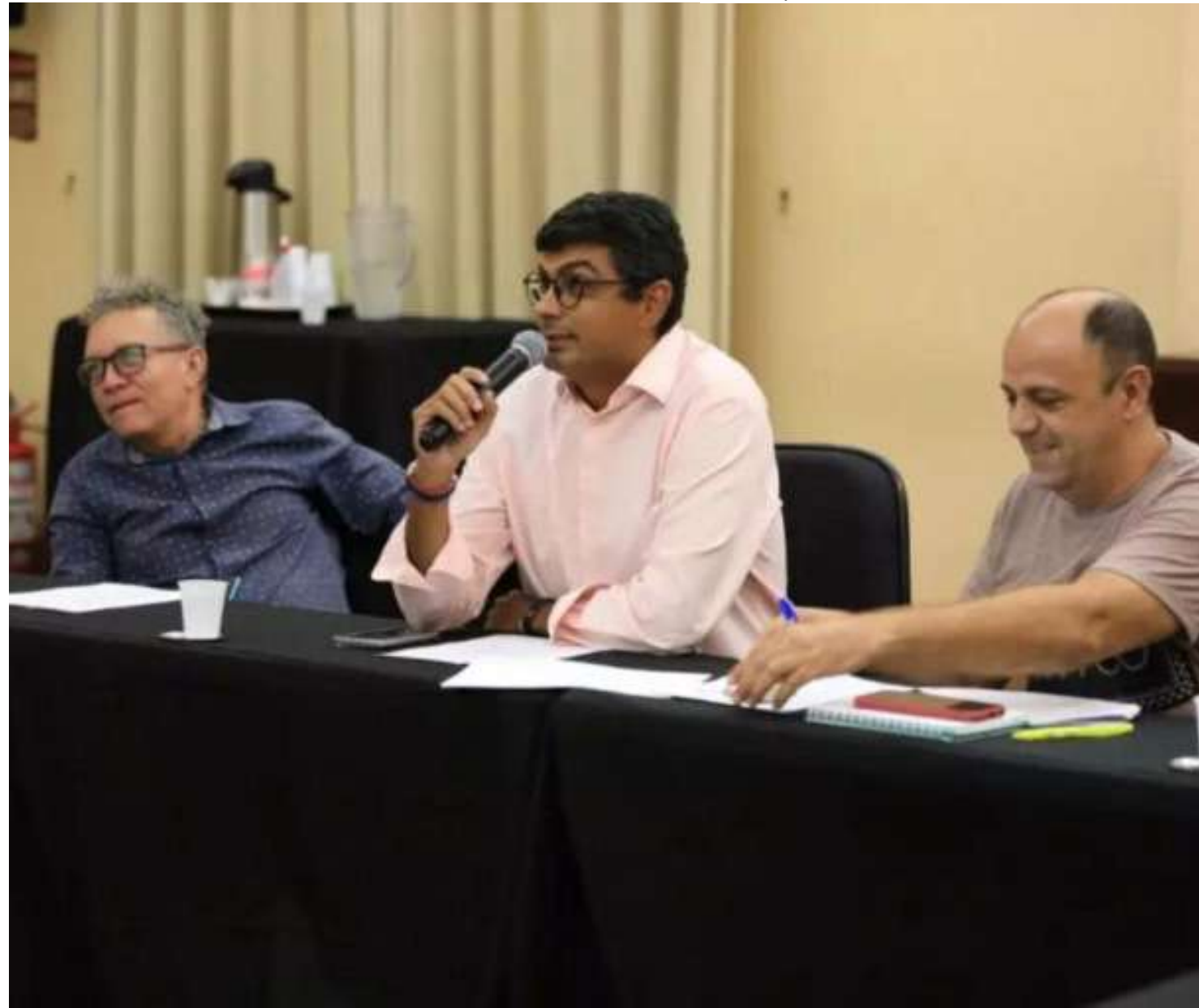
Trata-se de uma chamada pública para a seleção dos representantes da sociedade civil

candidatos precisam se tornar aptos a participar do pleito, cuja votação é um ato democrático não obrigatório, envolvendo os diversos segmentos culturais representados no Conec.