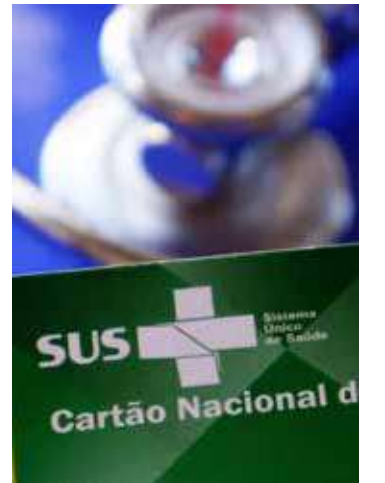
Ação foi movida porque os pacientes fizeram pagamentos indevidos