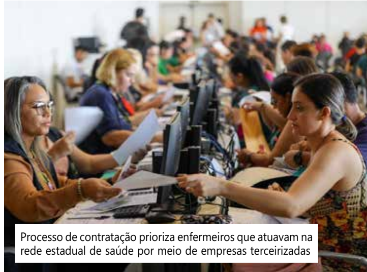
Processo de contratação prioriza enfermeiros que atuavam na rede estadual de saúde por meio de empresas terceirizadas

"Esse é um momento marcante. A história da enfermagem na Secretaria de Saúde do Amazonas tem uma divisória, antes e depois desse momento. Eu vejo como um marco extremamente importante, muito significativo, de valorização, de reconhecimento e de principalmente atender