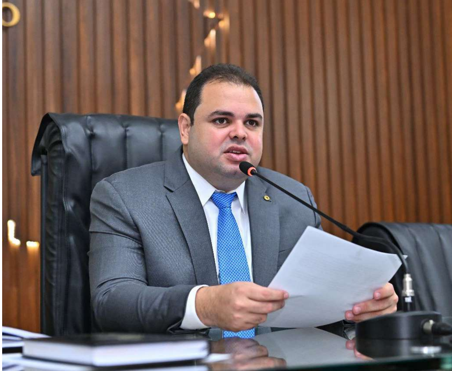
O deputado destinou, em seu primeiro mandato, R$ 9,5 milhões em emendas parlamentares para projetos em todo o Estado.

"Vivemos momentos difíceis na pandemia e a educação foi um dos setores da sociedade mais duramente atingidos. Nossas crianças e jovens foram penalizados e até hoje não conseguiram se recuperar completamente. Nossa lei chega com o intuito de reforçar a importância da educação e também para impedir que os serviços educacionais sejam descontinuados, mas que se encontrem meios e medidas para que os efeitos nocivos da suspensão do ensino sejam mitigados. Os estudantes, sobretudo, as crianças em tenra idade necessitam que a educação seja mantida em