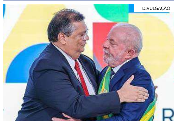
Lula disse que fake news são difundidas numa clara ação coordenada.