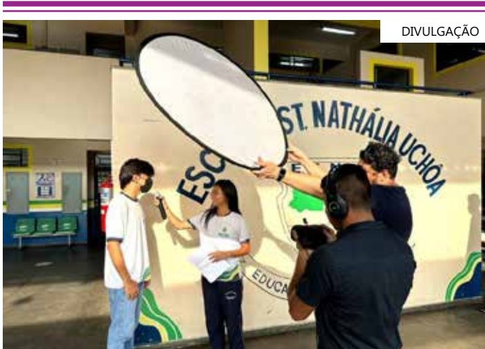
O projeto é amparado pelo Programa Ciência na Escola, da Fapeam

Um total de cinco vídeos foram produzidos pelos envolvidos no projeto e podem ser acessados no Canal do YouTube da coordenadora do projeto: https://www.youtube.com/@profa.denise.arte.manaus ou nos links: