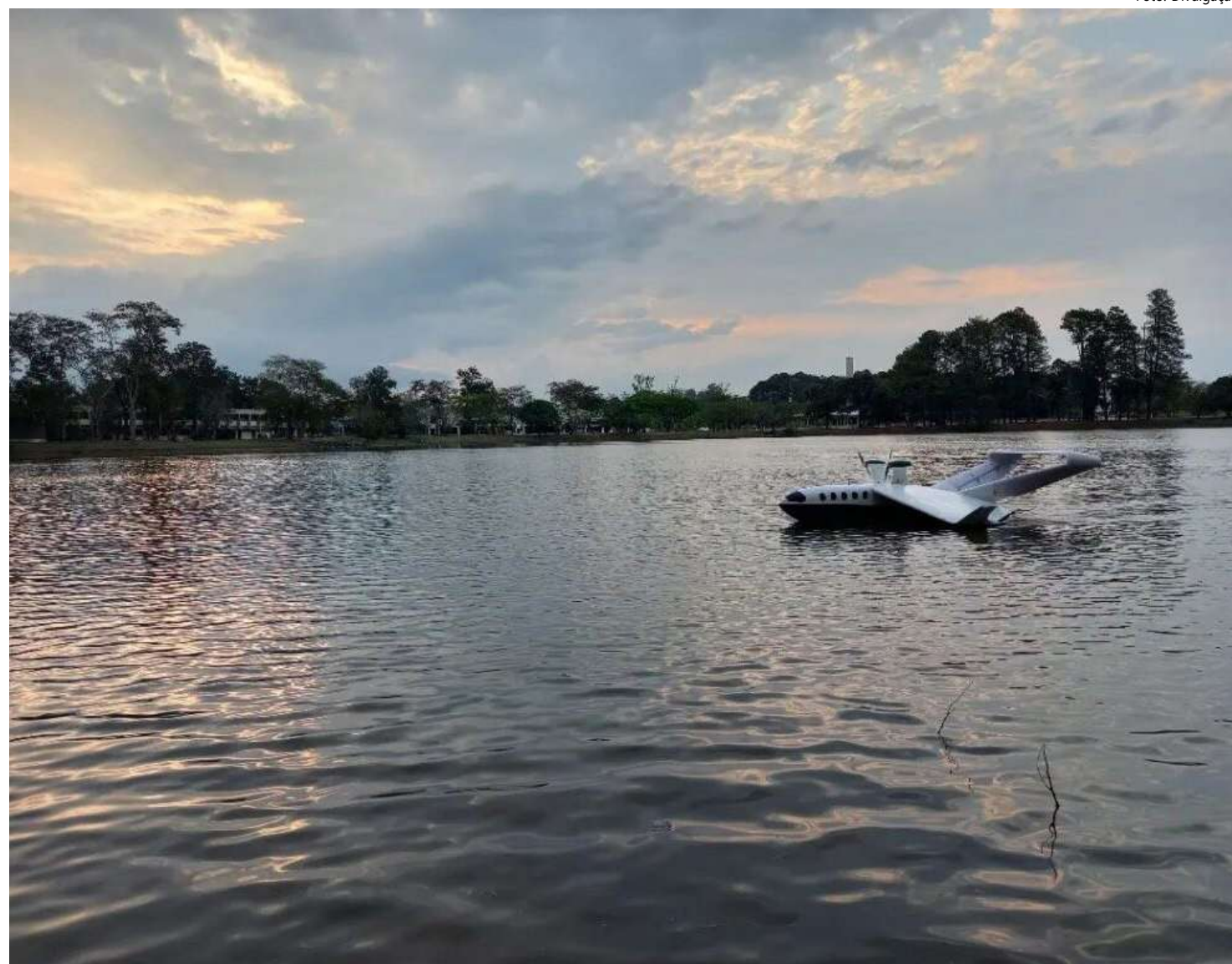
Startup foi criada em 2020 e está com outras 84 iniciativas e 100 empresas brasileiras

O Volitan, que está sendo projetado, terá 18 metros e a capacidade de transporte de dez passageiros