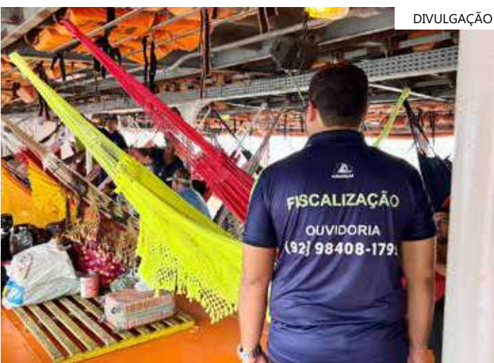
'Operação Viagem Segura - Dia da Consciência Negra' inicia nesta sexta (17)

A Agência Reguladora conta também com uma equipe volante no modal hidroviário intermunicipal, para acompanhar eventuais ocorrências e denúncias em outros portos da capital.