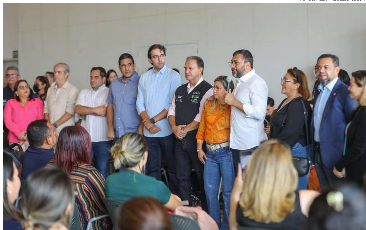
Com a medida, profissionais da enfermagem farão parte do quadro de funcionários temporários do Estado a partir de 1º de dezembro, afirma o governador

da pela Lei 6.472, de outubro deste ano, aprovada pela Assembleia Legislativa do Amazonas (Aleam) e, também, pelo Termo de Ajustamento de Gestão (TAG) 01/2023, firmado junto ao Tribunal de Contas do Estado (TCE-AM). A contratação, segundo o governo, também atende a demanda da categoria.