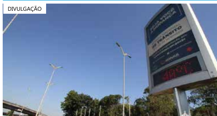
A onda de calor que atinge boa parte do país está fortemente associada ao fenômeno El Niño

A onda de calor que atinge boa parte do país está fortemente associada ao fenômeno El Niño, apontam pesquisadores. O fenômeno é caracterizado pelo enfraquecimento dos ventos alísios (que sopram de leste para oeste) e pelo aquecimento anormal das águas superficiais da porção leste da região equatorial do Oceano Pacífico. As mudanças na interação entre a superfície oceânica e a baixa atmosfera têm consequências no tempo e no clima em diferentes partes do planeta. Isso porque a dinâmica de circulação das massas de ar adota novos padrões de transporte de umidade, afetando a temperatura e a distribuição das chuvas.