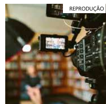
Conselho de Ensino e Pesquisa é o responsável pela aprovação do curso

Após o fim dos trabalhos da Comissão, a proposta segue para a Câmara de Ensino de Graduação (CEG) e depois para o Conselho de Ensino e Pesquisa (CONSEPE), responsável pela aprovação do curso.