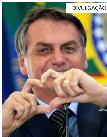
Bolão acertou 4 números da Mega

Cada um dos apostadores investiu pouco mais de R$ 100 no bolão e teve cerca de R$ 200 de retorno por pessoa. O valor será usado em uma nova aposta na Mega.