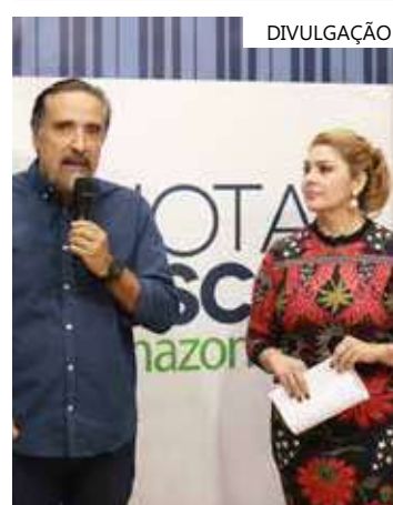
A vencedora do prêmio principal