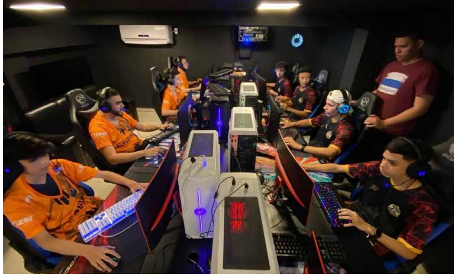
Campeonato acontece em Manaus e segue até o dia 30 deste mês

O Game Challenge é realizado pela Expo Amazônia Bio&TIC e a FAESP. Além do campeonato, na feira também acontecerá a apresentação dos projetos selecionados durante