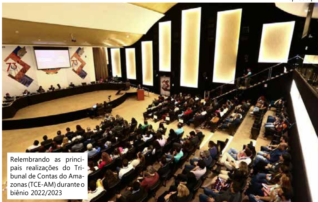
Relembrando as principais realizações do Tribunal de Contas do Amazonas (TCE-AM) durante o biênio 2022/2023

Na área de tecnologia e inovação, foram mencionados avanços como o Domicílio Eletrônico de Contas (DEC) e o Fórum Eletrônico de Discussão Processual. Desterro ressaltou a eliminação total da tramitação física de processos no TCE-AM e a implementação do Pregão Eletrônico. Além disso, destacou o pioneirismo do Tribunal ao contar com uma diretoria de Inteligência Artificial, representada pelo lançamento da ferramenta CHAT-TCE, ação pioneira da Corte de Contas amazonense.