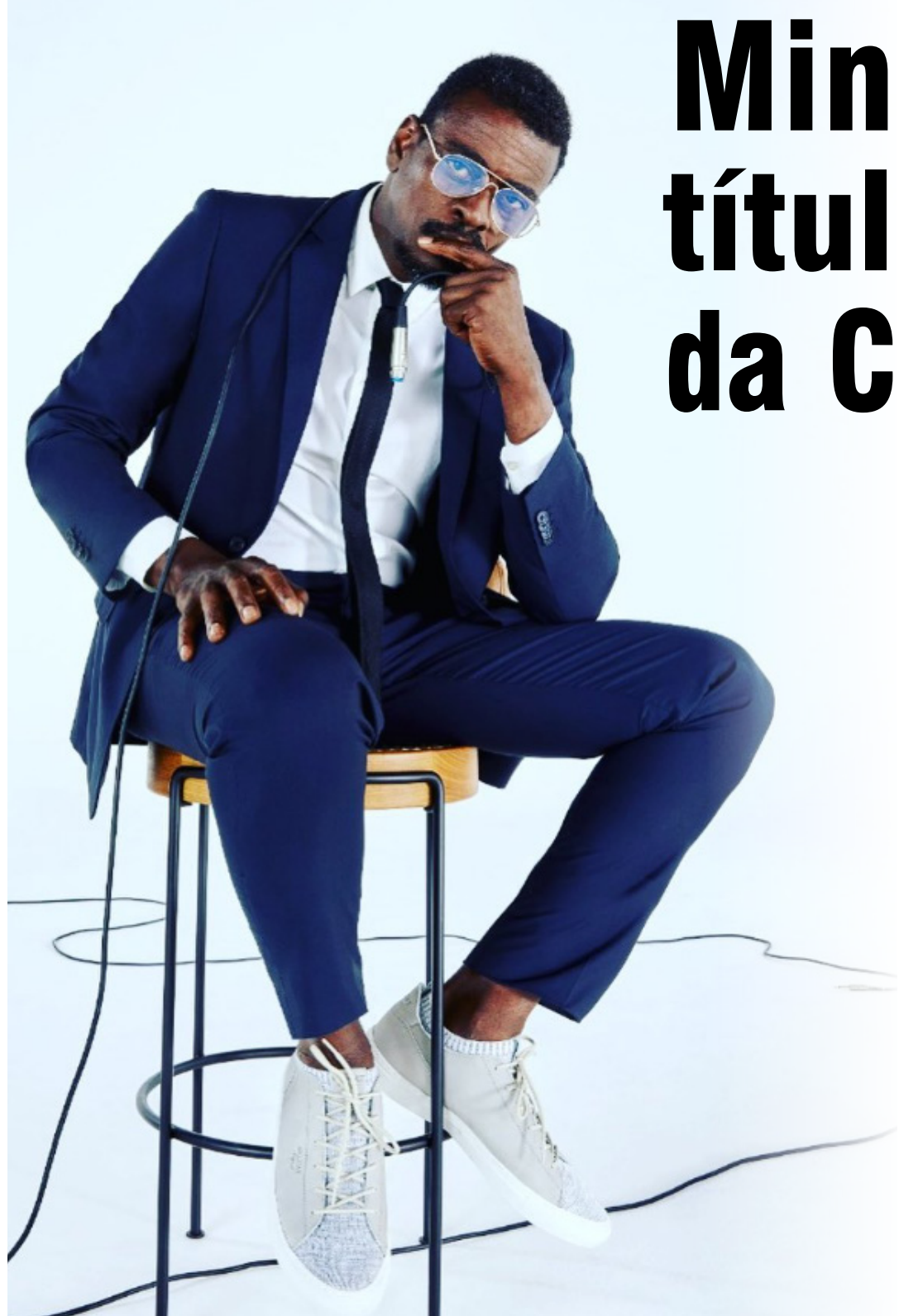
Jorge Mário da Silva, mais conhecido como Seu Jorge, é músico, produtor, ator, instrumentalista, cantor e compositor

De acordo com o governo, o título reconhece a 'destacada e importante' trajetória do cantor 'nos diferentes campos das artes'.