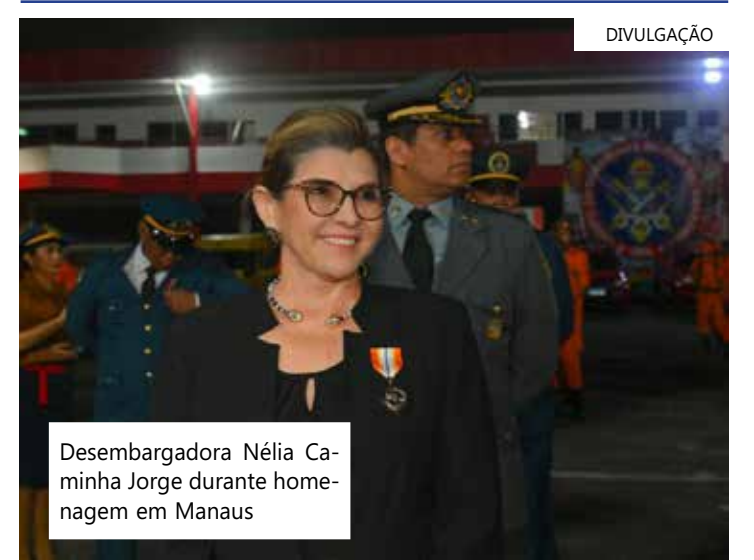
Desembargadora Nélia Caminha Jorge durante homenagem em Manaus

Medalha Dom Pedro II Normalizada pelo Decreto nº 25.717, de 9 de março de 2006, a medalha de mérito Imperador Dom Pedro II é a maior comenda outorgada pela corporação e é destinada a premiar os oficiais superiores do Corpo de Bombeiros, os militares das Forças Armadas e Forças Auxiliares e, ainda, os cidadãos civis.