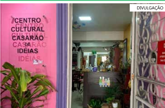
Volumes serão lançados no dia 30 de novembro, às 18h, no Casarão de Ideias

Educação de Manaus (Semmed), com experiência na produção de material didático. Também contou com a parceria do Centro Educacional de Tecnologia e Robótica do Município de Maués (distante 276 quilômetros de Manaus) e da Secretaria de Ciência, Tecnologia e Inovação de Tefé (a 523 quilômetros da capital).