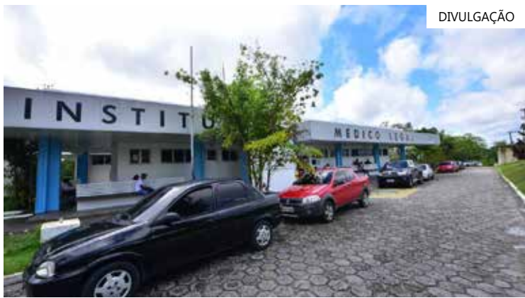
Suspeito conseguiu fugir, correndo para uma área de mata por trás do IML

Emerson tinha um mandado de prisão em aberto, além de ser suspeito na morte do PM Flávio Rodrigues Abraham, de 46 anos. O caso ocorreu no dia 22 de julho deste ano, no conjunto Viver Melhor, quando a vítima estava em frente a uma residência e foi surpreendida por um atirador. Abraham foi executado com vários tiros na cabeça.