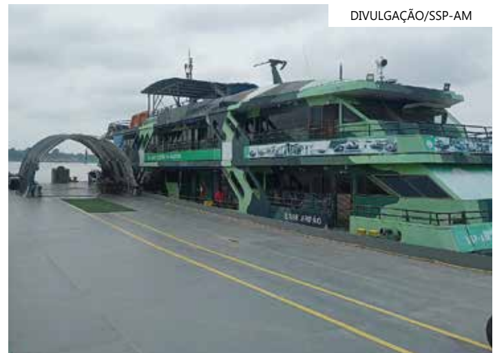
Entorpecentes, armas de fogo, munições e pescado lideram a lista de materiais apreendidos nos rios do Estado

e Divisas do Amazonas (GGI-F) da SSP-AM, ao longo de pouco mais de 11 meses foram apreendidos 1,4 tonelada de skunk (R$ 21.556.586,58), 489 quilos de pasta base de cocaína (R$ 24.782.282,40), 260 quilos de cocaína (R$ 16.591.455,00), 5 quilos de oxi (R$ 75.530,00), 250 gramas de maconha (R$ 786,00) e 2 gramas de crack (R$ 20,00).