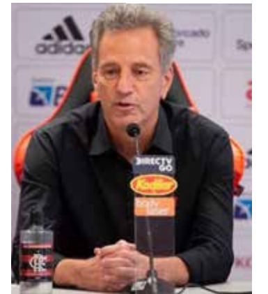
Rodolfo Landim, presidente do Flamengo, durante coletiva