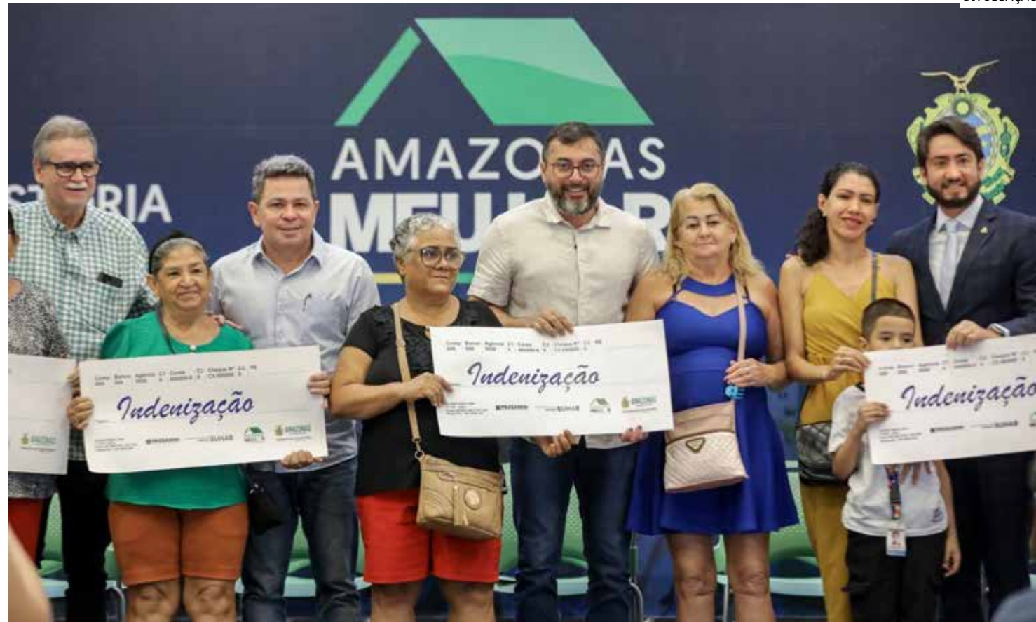
Governador reassentou, na segunda-feira (27), famílias da Sharp e Manaus 2000

Com a ação desta segunda-feira, o Governo do Estado alcança 1.469 soluções de moradias pagas e 1.077 famílias reassentadas, somando R$ 106,3 milhões em investi-