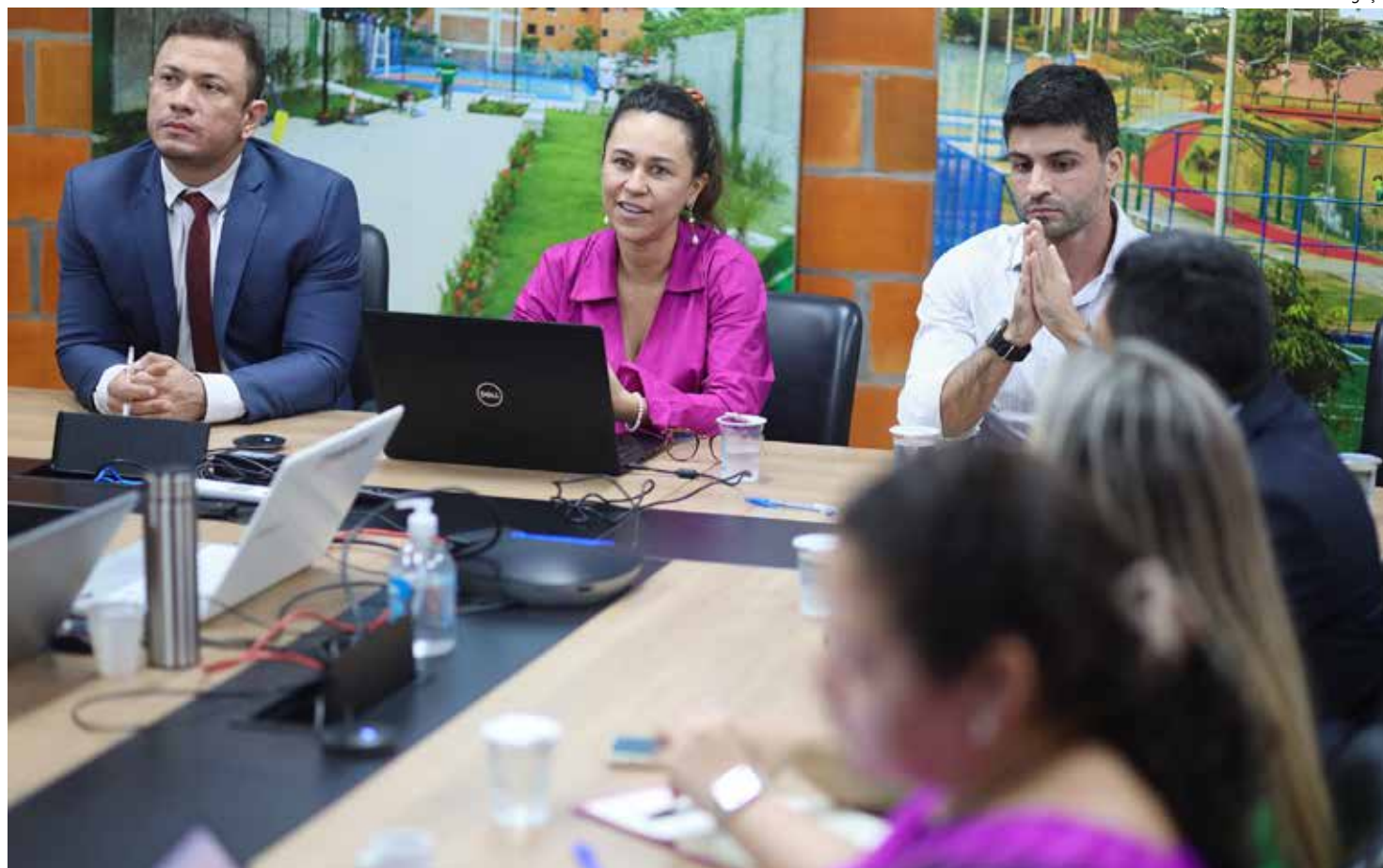
Representando o Estado, participaram da reunião equipe técnica e jurídica da Sedurb

De acordo com o secretário da Sedurb, Marcellus Campêlo, o Estado vai destinar, nos próximos quatro anos, R$ 446 milhões para a linha de atendimento Subsídio Entrada