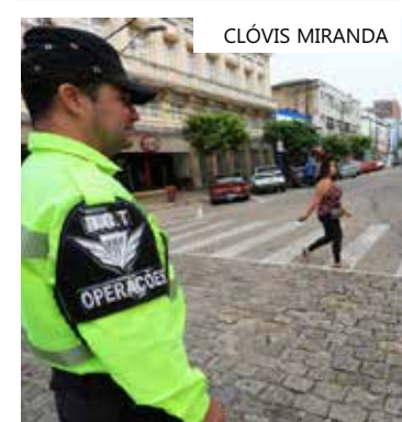
Agentes de trânsito fiscalizam os locais de compras na capital

As ações vão continuar até o final do ano das 6h até às 22h.