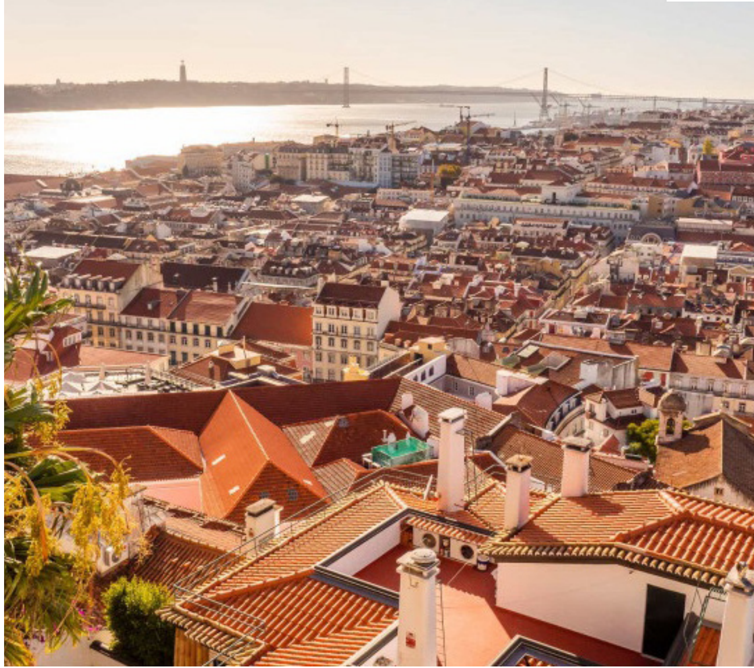
Prêmio tem um valor monetário de um milhão de euros

A capital portuguesa escolheu a Fábrica de Unicórnios (Unicorn Factory), sediada no Beato, como base para a candidatura a este concurso europeu, que iniciou em 2014. "Em apenas 2 anos, a Unicorn Factory Lisboa atraiu 54 novos centros tecnológicos para Lisboa vindos de 23 países, anunciou 10.000 postos de trabalho, lançou 13 programas de incubação e aceleração, triplicou o número de start-ups incuba-