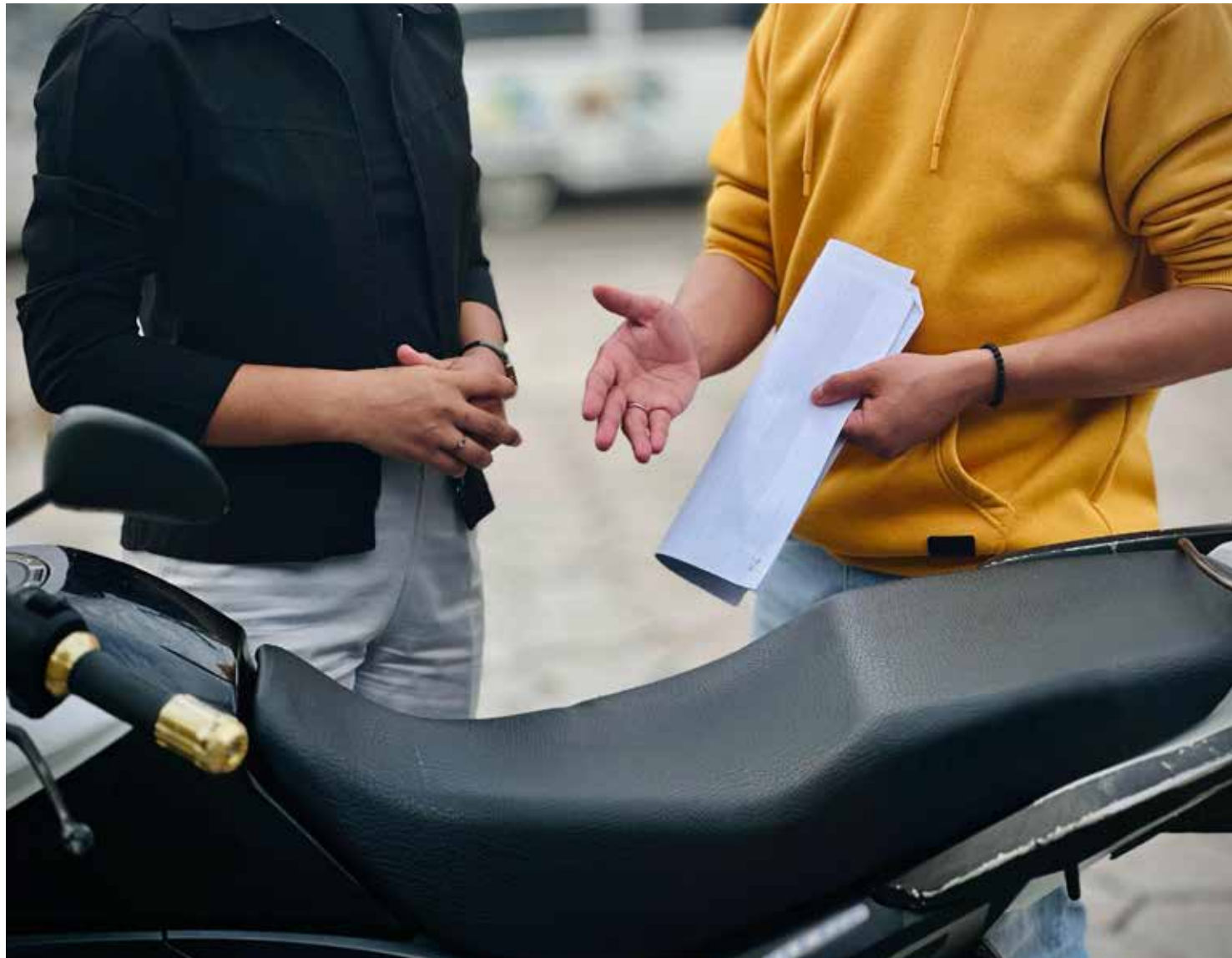
Delegado ressalta que é preciso ter bastante cautela ao se interessar por ofertas divulgadas em redes sociais

Conforme o titular, trata-se de um estelionato no qual o autor consegue obter vantagem financeira de ma-