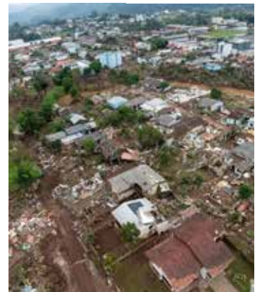
Defesa Civil confirmou reconhecimento de corpo encontrado