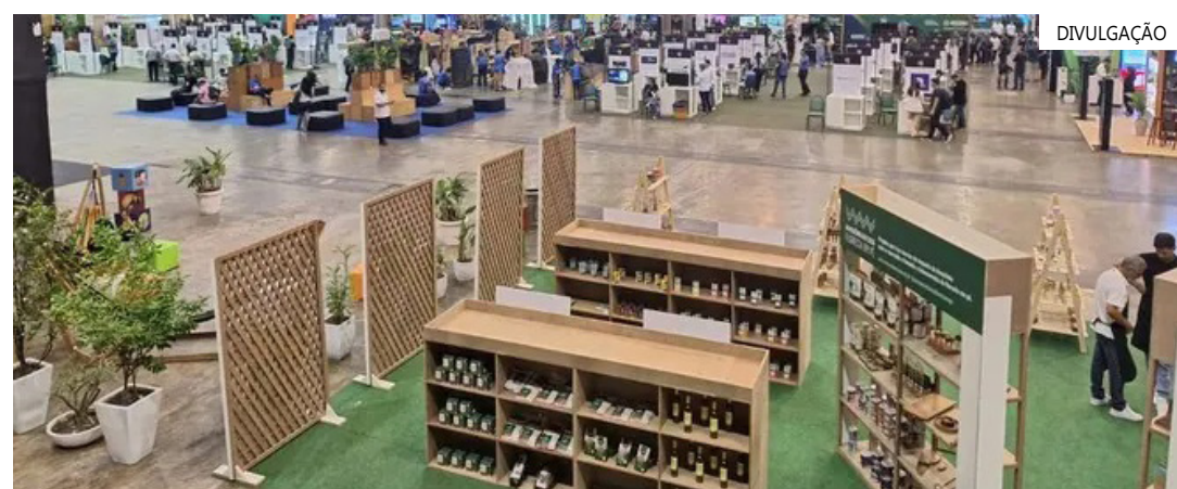
Considerado o maior evento de tecnologia, negócios e bioeconomia da Região Norte

A expectativa dos organizadores é gerar mais de R$ 2,5 milhões em negócios.