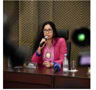
Delegada falou sobre o caso