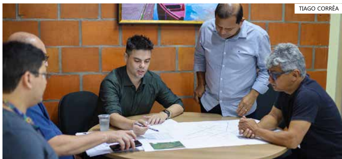
Com a aplicação de R$ 560,4 milhões, programa já beneficiou 23 municípios