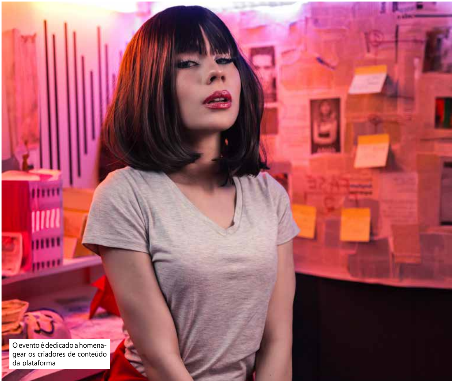
O evento é dedicado a homenagear os criadores de conteúdo da plataforma