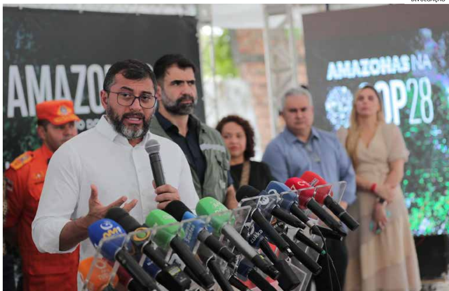
Governo do Amazonas destina R$ 14 milhões para recuperação viária de Novo Aripuanã

O governador Wilson Lima anunciou, na quarta-feira (29), o Programa Amazonas 2030 para redução do desmatamento no estado, que será executado com recursos arrecadados a partir da venda de créditos de carbono. A estratégia será apresentada pelo Governo do Estado, pela primeira vez, na 28ª Conferência das Nações Unidas sobre Mudanças Climáticas, que começa amanhã em Dubai, Emirados Árabes Unidos. A participação do governador no evento inclui encontros com organizações financeiras e potenciais investidores. O objetivo central do Amazonas 2030, segundo Wilson Lima, é alcançar o desmatamento líquido zero no estado nos próximos seis anos com reforço de ações já em execução e com a implementação de novas medidas. Para isso, está em processo de criação o Programa Jurisdicional de REDD+ (sigla para Redução de Emissões por Desmatamento e Degradação florestal) do Amazonas. Para garantir o cumpri-