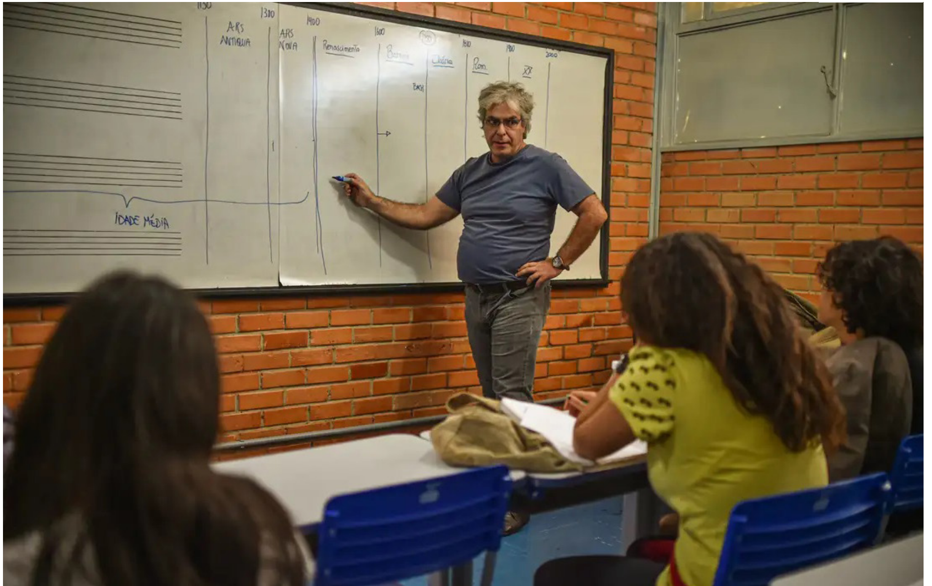
A MP também prevê a articulação com estados, municípios e o Distrito Federal

Um ato conjunto dos ministérios da Educação e da Fazenda vai definir valores, formas de pagamento, critérios de operacionalização e uso da poupança de incentivo à permanência e conclusão escolar. Os valores serão depositados em conta a ser aberta em nome do estudante, que poderá ser a