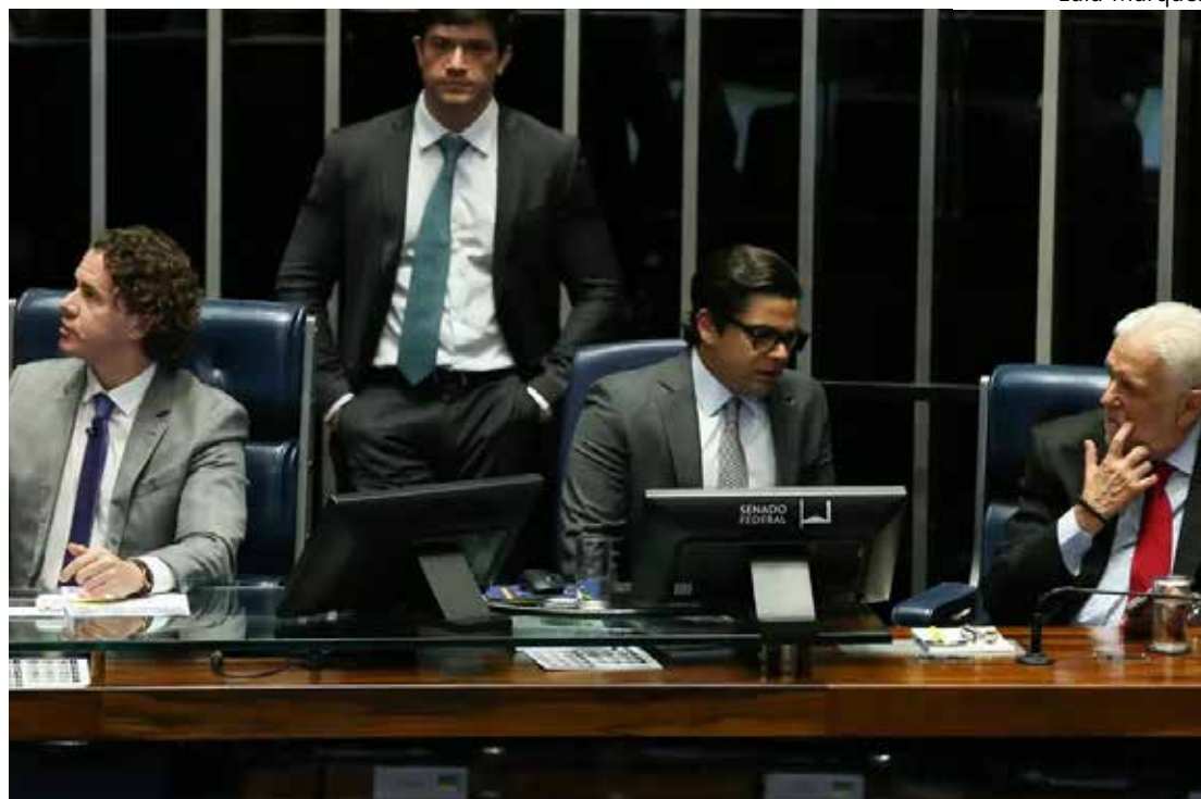
Senadores aprovaram Projeto de Lei na quarta-feira (29)

brasileiros aplicam em fundos exclusivos, que somam R$ 756 bilhões em patrimônio e respondem, sozinhos, por 12,3% da indústria de fundos do Brasil.