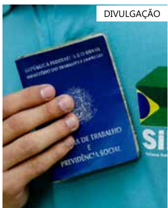
Candidatos devem procurar os postos do Sine Manaus, das 8h às 16h

Os interessados devem estar munidos do comprovante de vacinação (Covid-19), currículo e documentos pessoais (RG, CPF, PIS, CTPS, comprovante de escolaridade e residência). Não é necessário apresentar cópias, somente os documentos originais.