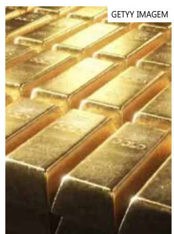
Últimos resultados mais fracos do dólar e a perspectiva de cortes do Fed

podem estar ao alcance a depender do resultado do índice de preços de gastos com consumo (PCE, na sigla em inglês) desta sexta-feira. "Uma inflação mais fraca alimentaria o argumento de que o Fed provavelmente cortará as taxas mais cedo do que o esperado, algo que deve enfraquecer o dólar e impulsionar o ouro", sugere.