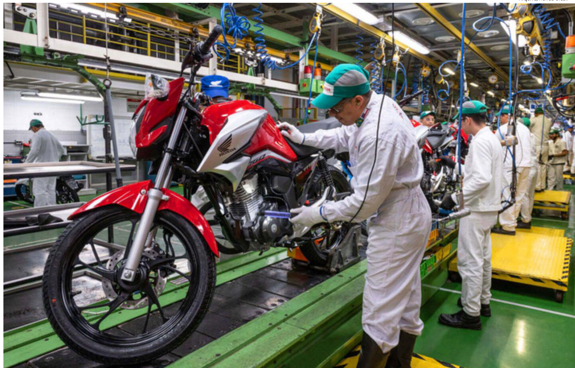
Motocicletas até 250 cilindradas foram o principal produto destinado para a Argentina

Conforme explicou o secretário de Desenvolvimento,