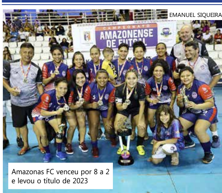
Amazonas FC venceu por 8 a 2 e levou o título de 2023

Os campeonatos da Federação Amazonense de Futsal (FAFs) contam apoio do Governo do Amazonas (Secretaria do Desporto e Lazer), Prefeitura de Manaus (Fundação Manaus Esporte), Kagiva (bolas oficiais), RR Emergências Médicas, Santa Cláudia e Emanuel Sports & Marketing (assessoria de imprensa). A FAFs é filiada à Confederação Brasileira de Futsal (CBFs).