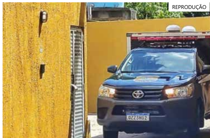
Polícia foi acionada por funcionários do local

Até o fechamento desta matéria, a causa da morte estava sendo apurada pela Polícia Civil, que investiga o caso.