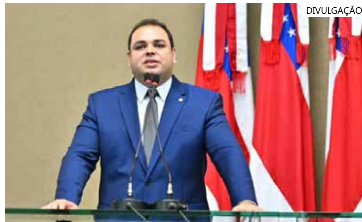
Presidente da Aleam afirma que palavras da ministra são de causar indignação

“A Assembleia Legislativa do Amazonas, em nome de seus 24 deputados estaduais, repudia, veementemente, o posicionamento da ministra do Meio Ambiente, Marina Silva, que durante seu depoimento na CPI das ONGs, no Senado Federal, mais uma vez, se mostrou intransigente e contrária à recuperação da rodovia BR-319. A ministra não consegue reconhecer a importância social e econômica da estrada, fundamental para tirar o Amazonas do isolamento rodoviário, reduzindo o principal pleito de todos os amazonenses a uma ‘vontade de passear de carro’. Esta Casa já emitiu uma Moção de Repúdio contra tal intransigência, anteriormente, e continuará sempre se posicionando todas as vezes em que nosso Estado for prejudicado”.