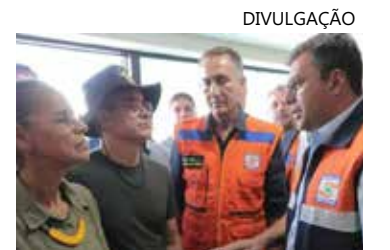
Governador disse que a BR-319 é uma questão social

A ministra disse que estava há 15 anos fora do governo federal e por isso não pode ser condenada pela BR-319. A Assembleia Legislativa do Amazonas (Aleam) TAMBÉM repudiou a fala da ministra, na terça-feira (28), e disse por meio de nota que a opinião dela é uma afronta ao povo do Amazonas.