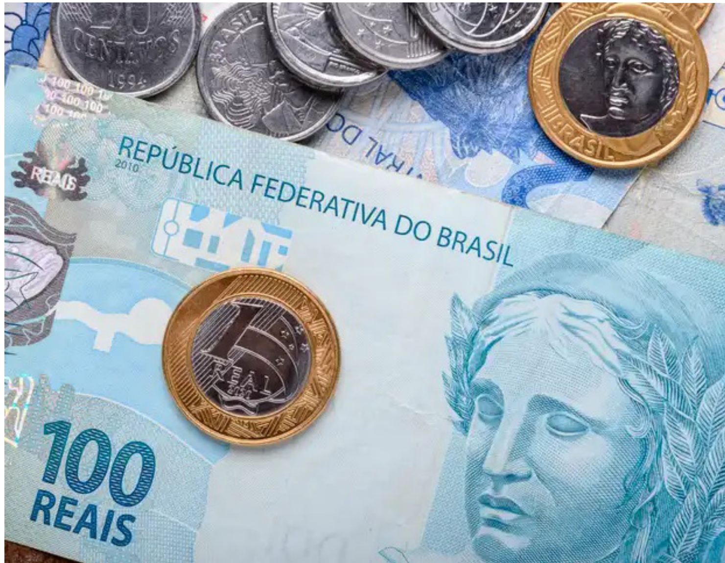
Por meio da apropriação de juros, o governo reconhece, mês a mês, a correção dos juros

souro emitiu R$ 72,224 bilhões em títulos da DPMFi, o volume mais baixo desde fevereiro deste ano. Com o baixo volume de vencimentos em outubro, os resgates somaram R$ 26,107 bilhões, o volume mais baixo desde junho deste ano.