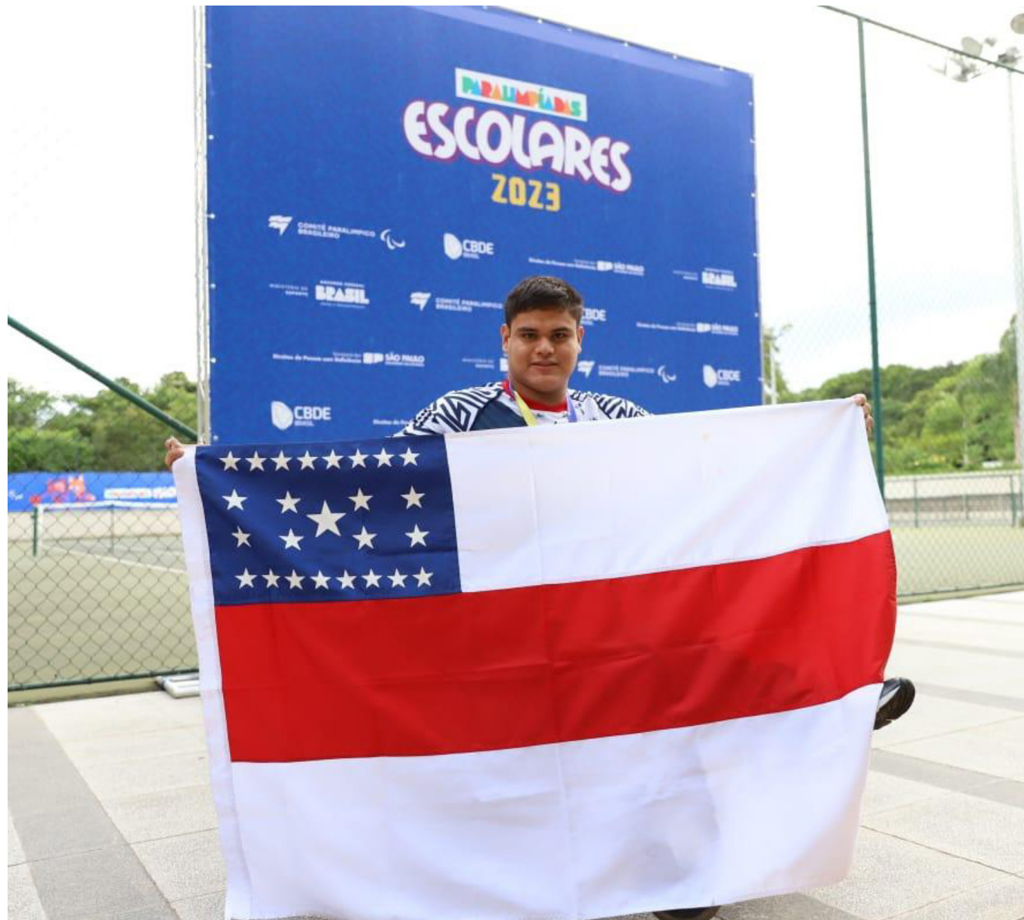
Disputas iniciaram na quarta-feira (29) e seguem até a próxima sexta-feira (1º)

Os paratletas do Amazonas disputarão a fase final das Paralimpíadas Escolares 2023 em cinco modalidades: atletismo, natação, badminton, tênis de mesa e halterofilismo. No total, mais de 1,8 mil alunos de todo o país participam da competição, organizada pelo Comitê Paralímpico Brasileiro (CPB). Em São Paulo, as disputas iniciaram na quarta-feira (29) e se-