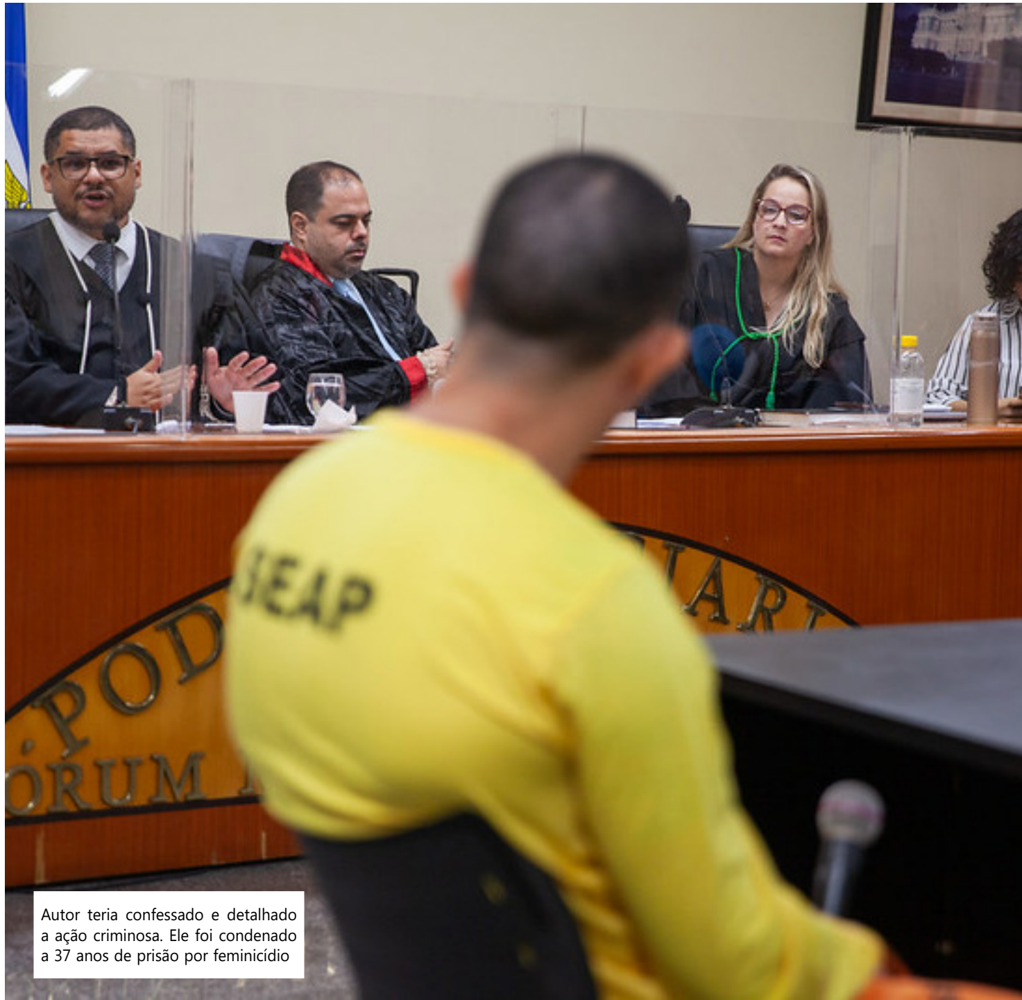
Autor teria confessado e detalhado a ação criminosa. Ele foi condenado a 37 anos de prisão por feminicídio

Conforme o TJAM, o inquérito policial que em-