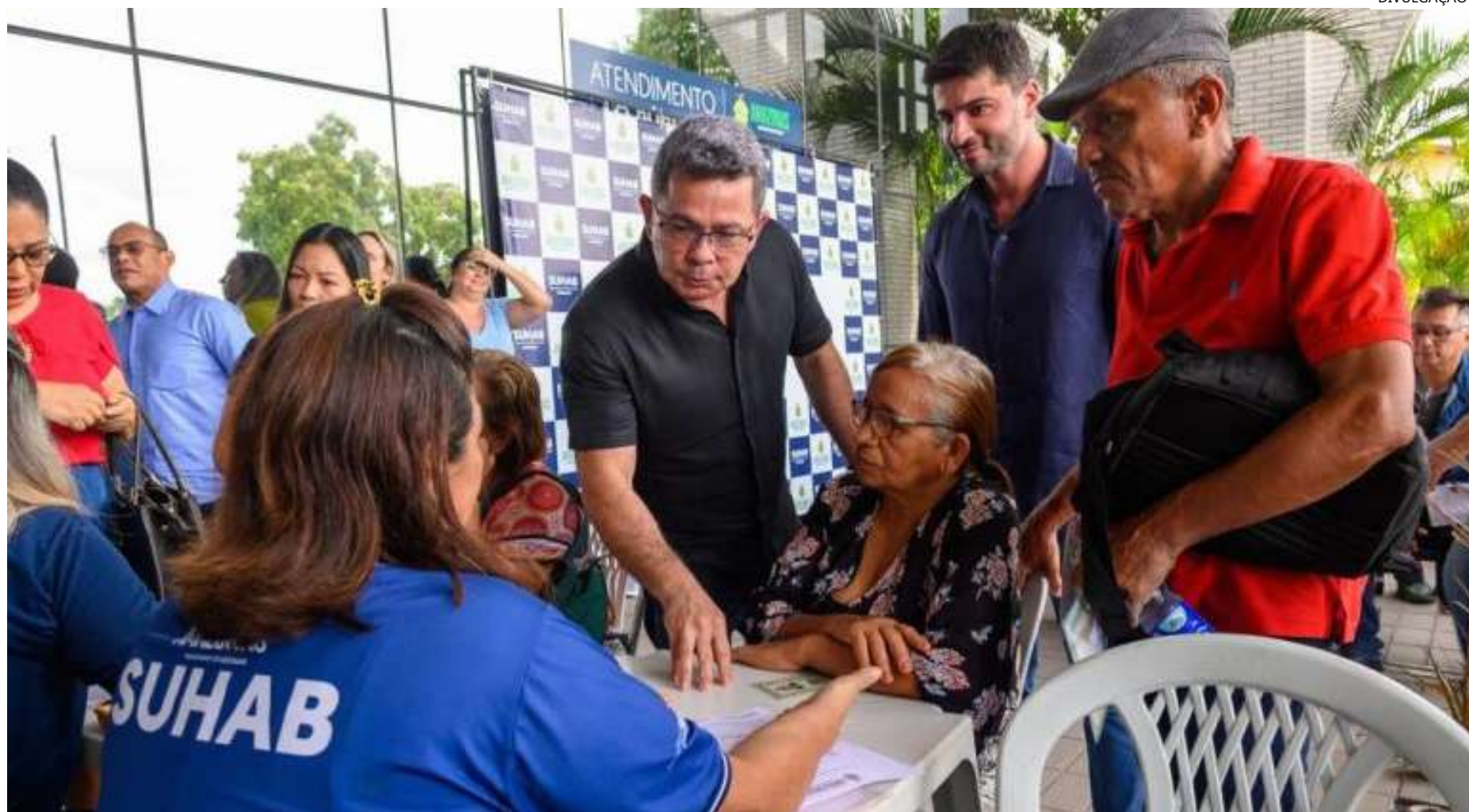
Na ocasião foram entregues 2,2 mil documentos de quitação habitacional

Com a nova entrega, o Governo do Amazonas supera a