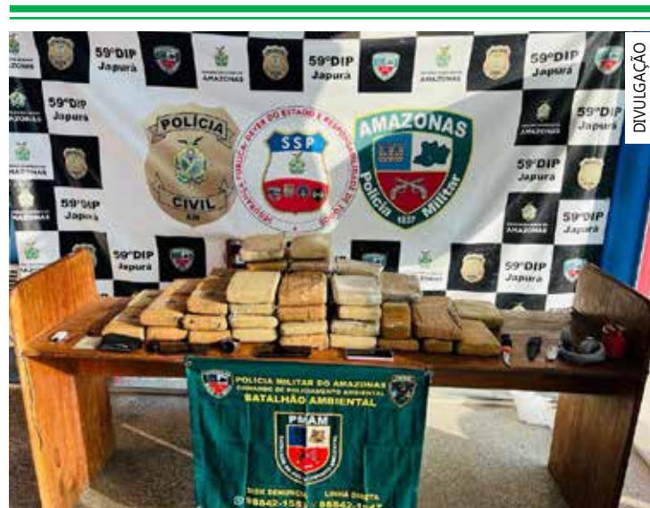
Prejuízo ao crime organizado ultrapassa R$ 570 milhões, diz SSP

Um total de 25 toneladas de pescado e caça ilegal foram apreendidas no período, além de 97 animais vivos. Já as apreensões de minérios chegam a 605 metros cúbicos. As ações reforçam o combate ao crime organizado no Amazonas, com a atuação das Forças de Segurança.