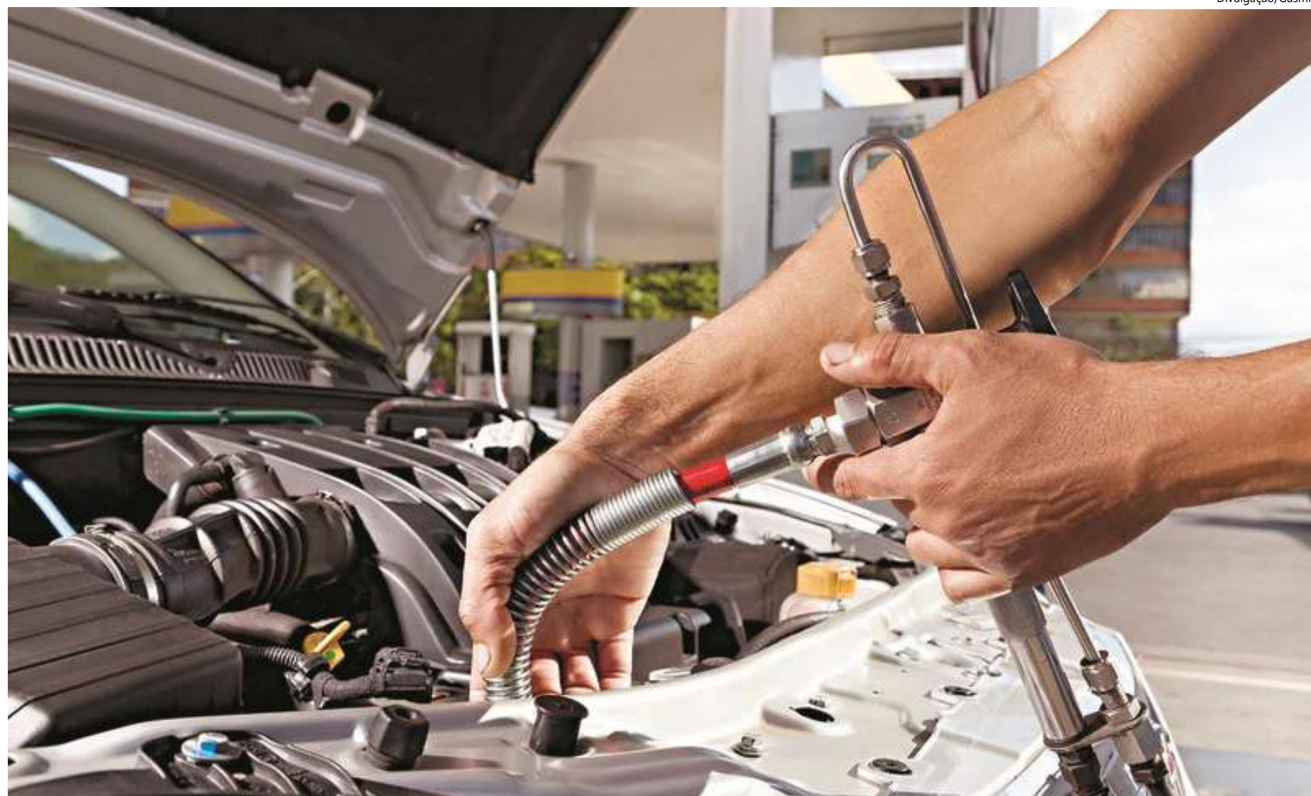
A meta da Cigás é superar a marca de 28 mil unidades consumidoras contratadas até 2027

"Essa campanha deste ano tem R$ 4 mil para 300 beneficiados. Nas três campanhas anteriores, foram investidos R$ 2,6 milhões, e nesta campanha é R$ 1,2 milhão. Vamos fazer com que a frota cresça e possamos fazer novas campanhas. A campanha tem um prazo de um ano, mas espero que seja menos que isso. Qualquer pessoa que tem um