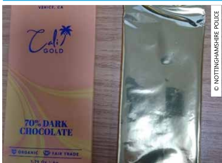
Autoridades estão investigando o caso

As investigações continuam para entender o que teria causado o mal estar que todos sentiram. A Agência de Normas Alimentares do Reino Unido também está a investigar se o chocolate foi vendido noutro lugar.