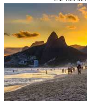
Uma consequência do aquecimento global