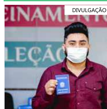
Atendimento ocorre de 8h às 16h, nos postos do Sine Manaus

Os interessados devem estar munidos do comprovante de vacinação (Covid-19), currículo e documentos pessoais (RG, CPF, PIS, CTPS, comprovante de escolaridade e residência). Não é necessário apresentar cópias, somente os documentos originais.