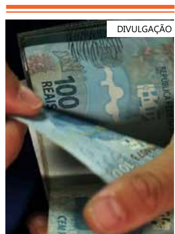
Os números constam do boletim bimestral

valores inscritos em restos a pagar nas operações de equalização de taxa de juros no âmbito do PSI. Como o BNDES empresta com uma taxa de juros mais baixa que a de mercado, o Tesouro precisa cobrir a diferença entre essas taxas e os juros que o governo paga no sistema financeiro.