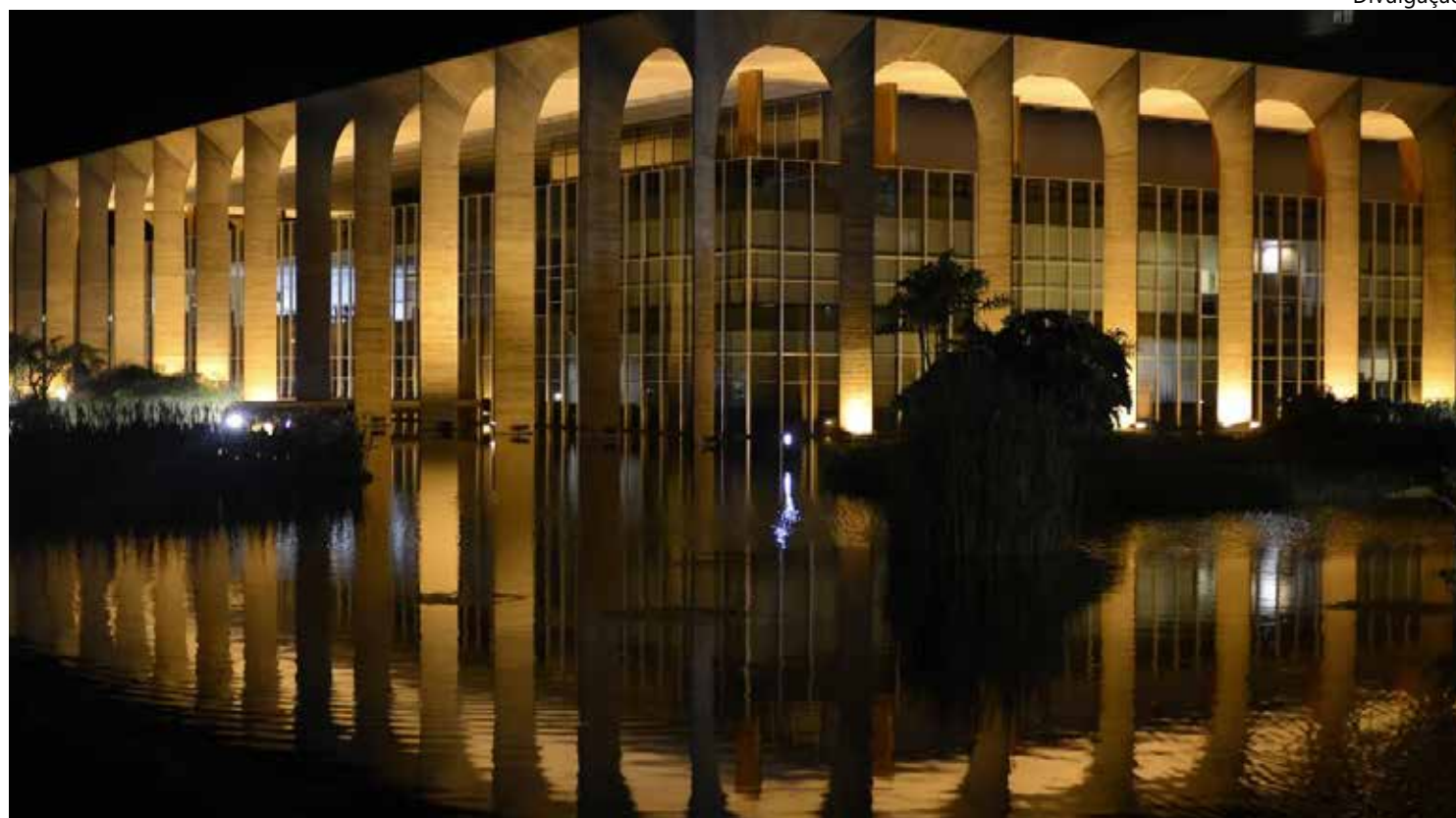
Sede do Itamaraty, em Brasília; governo brasileiro tem dialogado com Venezuela e Guiana

A medida é vista como um passo para uma possível invasão da Venezuela a