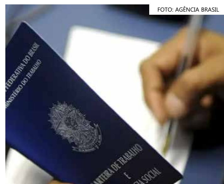
Desemprego de 7,6% é o menor desde 2015, mostra IBGE

A taxa de informalidade foi de 39,1% da população ocupada (ou 39,2 milhões de trabalhadores informais), estável em relação ao ano passado.