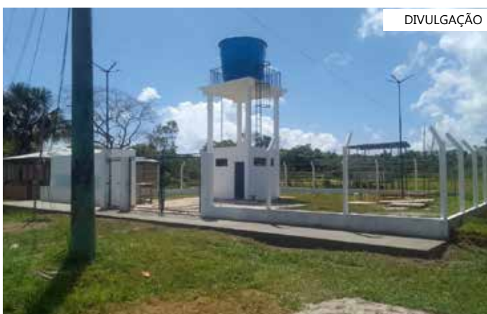
Poços artesianos atenderão três comunidades rurais do município

Além das comunidades rurais de São José do Amajari, Santa Rosa de Lima e São Pedro de Iracema, que estão com obras em andamento, o Governo do Amazonas, por meio da Seinfra, também beneficiou as comunidades Itaubal e Nossa Senhora do Perpétuo Socorro (Vila Batista), localizadas no rio Arari, zona rural de Itacoatiara, com obras de sistema simplificado de abastecimento de água, estando estas obras já concluídas.