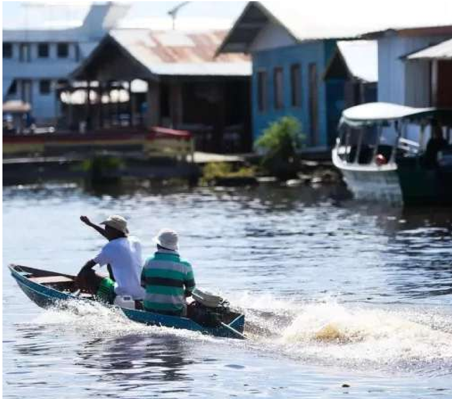
Inscrições para edital ficam abertas até 31 de janeiro do ano que vem

De acordo com a organização, o edital foi elaborado levando em conta que o apoio à resiliência de comunidades tradicionais é central na luta por justiça climática. Entre as propostas selecionadas, ao menos dez deverão ser voltadas para a Amazônia e para o Cerrado, biomas considerados fundamentais para a retenção de carbono e consequentemente para o combate ao aquecimento global. O edital Comunidades Tradicionais Lutando por Justiça Climática está aberto desde segunda-feira (27) e os interessados poderão encaminhar projetos até 31 de janeiro de 2024. As inscrições devem ser feitas no site da organização. As propostas podem envolver temas como direito à terra, alternativas produtivas, atividades de formação, entre outros. Serão consideradas como comunidades tradicionais os grupos culturalmente diferenciados, que se caracterizam por formas próprias de organização social e que se relacionam