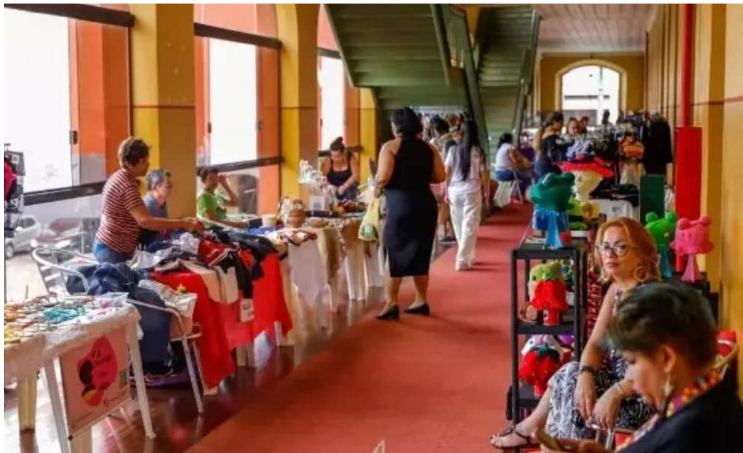
Na ocasião, serão comercializados artesanato, costura criativa, alimentação, cosméticos e produtos naturais

acontece de forma gratuita e aberta ao público, e tem o objetivo de fazer com que as empreendedoras ampliem seus negócios, aumentando assim sua renda e sua qualidade de vida. Na ocasião, serão comercializa-