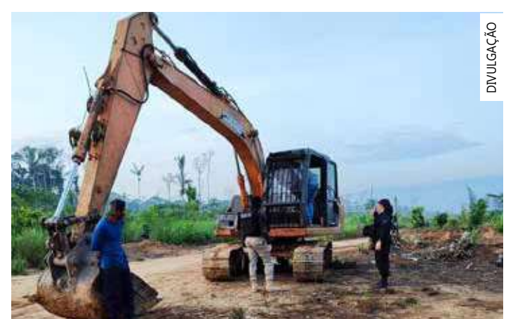
Ação foi desencadeada para apurar a apropriação indevida de terras

A operação iniciou de investigações realizadas pela Polícia Civil, e culminou na ação incisiva que envolvia suspeitos de alta periculosidade, com a questão de invasão de terra.