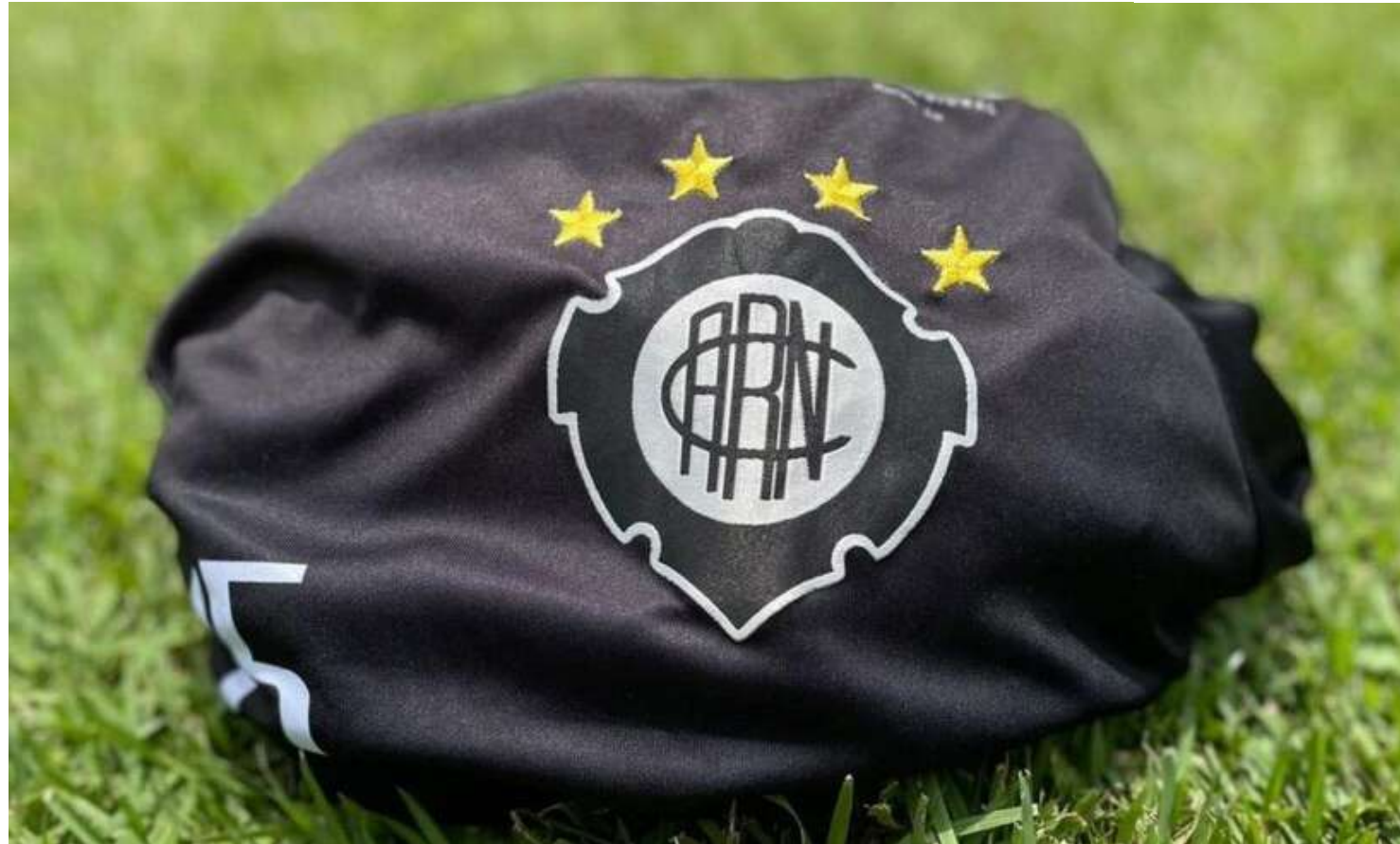
Rio Negro conta apenas com o técnico para o Estadual 2024

São anos sem prestação de contas de receitas, sem