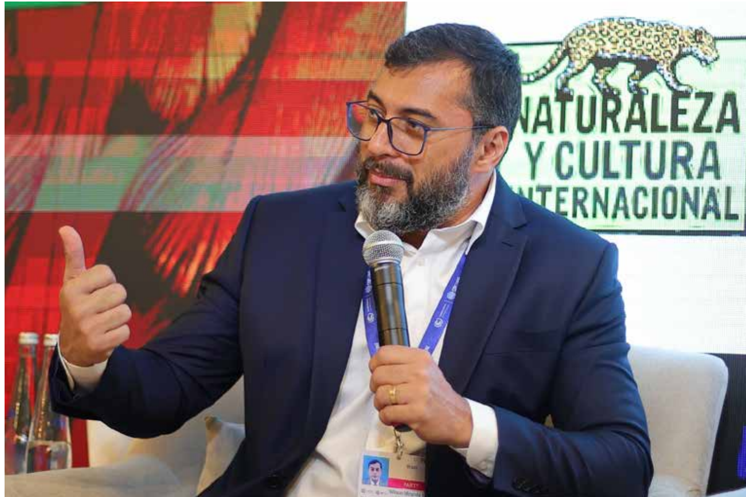
Na ocasião, governador se reuniu com representantes da empresa para discutir sobre investimentos para proteção da biodiversidade no estado