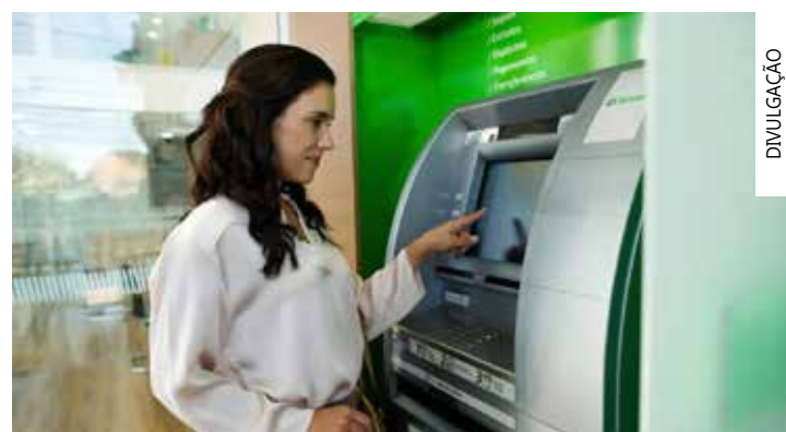
Para quem não ainda não começou a investir e tem esse interesse este é um excelente momento

Para aqueles que já estão com a vida financeira organizada, a especialista afirma que é válido utilizar o valor para iniciar ou ampliar uma poupança, fazer investimentos, para a realização de desejos e sonhos ou, até mesmo, destiná-lo aos possíveis gastos extras que surgem com as festividades de fim de ano.