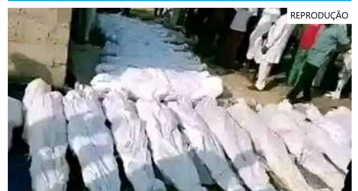
O ataque aconteceu na noite do último domingo (3)

sido cada vez mais comuns. O governo manda aeronaves e drones para áreas em conflito armado, principalmente no centro, norte e noroeste do país. Entre fevereiro de 2014 - quando um avião militar nigeriano lançou uma bomba sobre Daglun, no estado de Borno, matando 20 civis - e setembro de 2022, houve pelo menos 14 bombardeios do tipo em áreas residenciais.