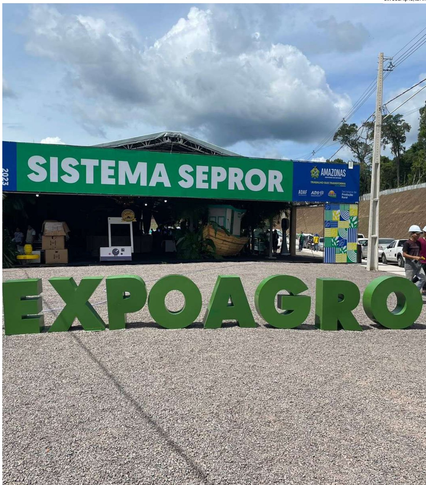
A regularização dos trabalhadores também recebe atenção especial na Expoagro

As capacitações ocorrem nesta terça-feira e na quinta-feira (07) e sexta-feira (08).