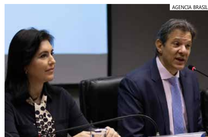
Projeção oficial prevê crescimento de 3% neste ano

colega da Fazenda. Na última etapa da viagem à Alemanha, Haddad disse que o PIB pode fechar 2023 com crescimento um pouco maior que a projeção de 3% divulgada no fim de novembro pela Secretaria de Política Econômica (SPE) do Ministério da Fazenda. Ele, no entanto, disse que o resultado depende de o Banco Central (BC) manter a política de corte de juros.