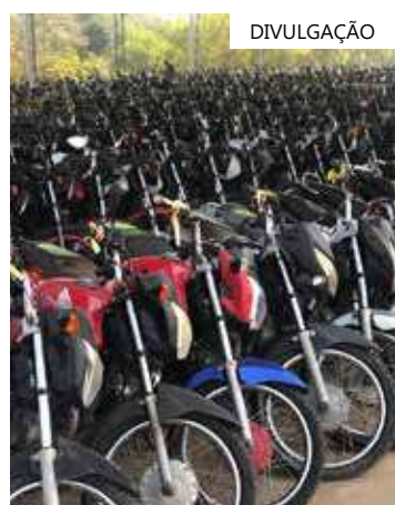
Ao todo, 177 lotes estarão disponíveis

Para mais detalhes, os interessados podem acessar o site institucional do Detran-AM (detran.am.gov.br), clicar em Publicações, em seguida Editais, Editais 2023, aba Leilões, e por fim, acessar o edital do chamamento público.