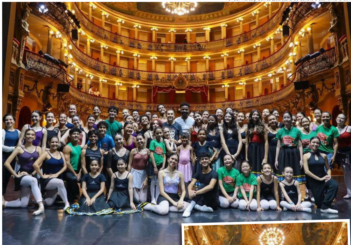
A estreia será nesta sexta-feira (08/12), e a entrada é gratuita

A história se passa na noite de Natal, quando a menina Clara recebe a visita de seu padrinho, o inventor Herr Drosslmeyer. Ele a presenteia com um boneco encantado: o magnífico Quebra-nozes. Ao ganhar vida, o Quebra-nozes leva Clara para uma aventura no Reino dos Flocos de Neve e no Mundo dos Doces, para encontrar a encantadora Fada Açucarada, que lhes apresenta o seu reino.