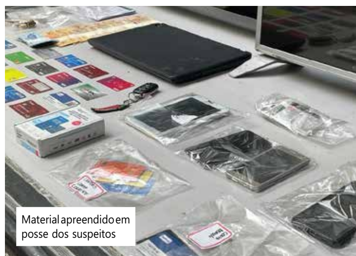
Material apreendido em posse dos suspeitos

Edmeiry e Tancredo responderão por estelionato e ficarão à disposição da Justiça.