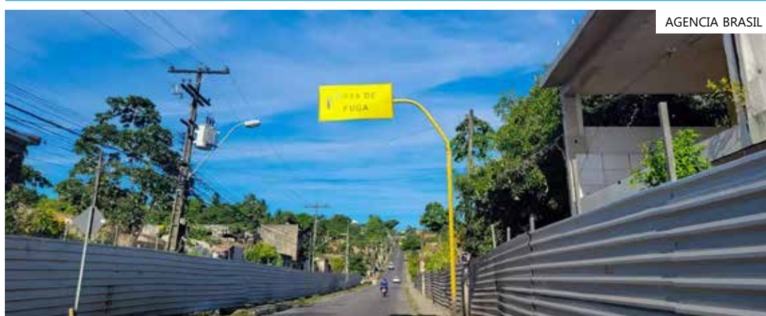
Afundamento acumulado do solo é de 1,86 metro

Pela manhã, o boletim informou que houve leve aceleração na velocidade vertical de afundamento do solo acima da mina da Braskem, com velocidade vertical de 0,27 cm/h, ante os 0,26 cm/h registrado na noite de segunda-feira (4).