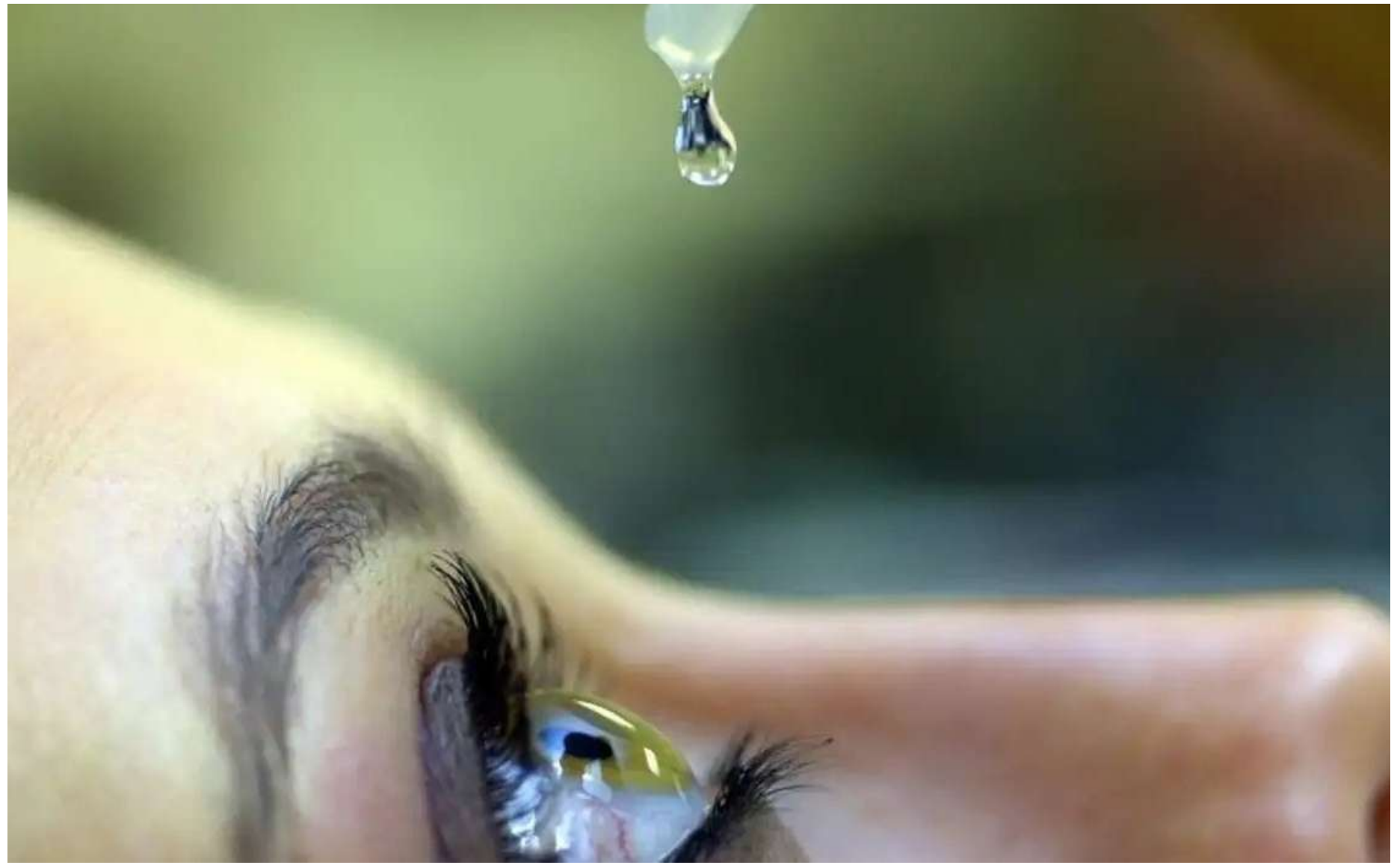
A ideia da campanha nos cinemas é mostrar o que pode se perder ao deixar a doença avançar

Apesar de ser a mais comum causa de cegueira o glaucoma ainda é desconhecido por grande parte da população. Segundo uma pesquisa realizada por oftalmologistas ligados à SBG, com 1.636 indivíduos, 90% ignoravam que já apresentavam sinais de risco da doença. As estimativas da SBG mostram que 2,5 milhões de pessoas vivem com a doença no país.