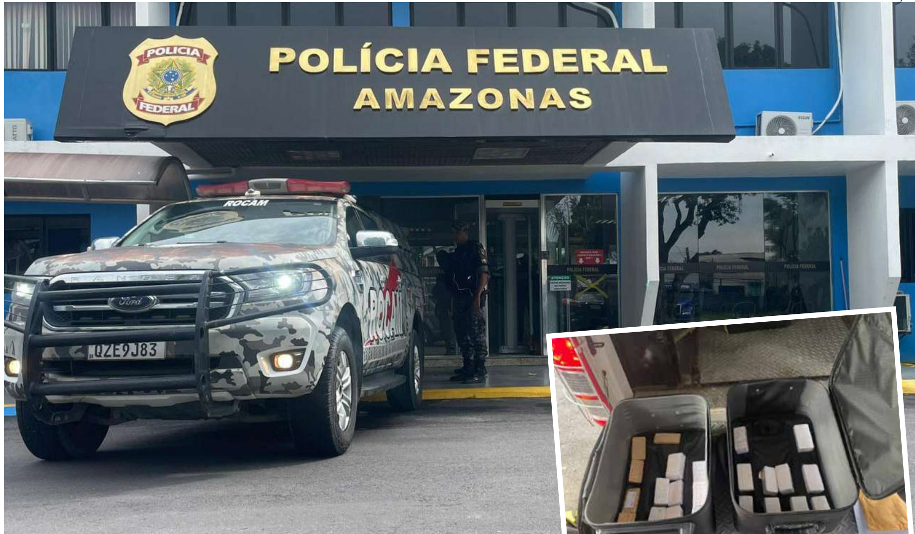
Material foi apreendido por agentes militares da Rocam, em Manaus

Durante busca no veículo Gol, a Rocam encontrou duas malas com as barras de