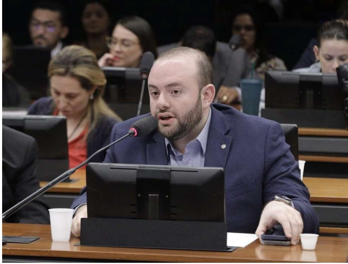
Deputado federal defende pavimentação da BR-319 e lidera movimento político no DF

A Frente Parlamentar em Defesa da BR-319, estabele-