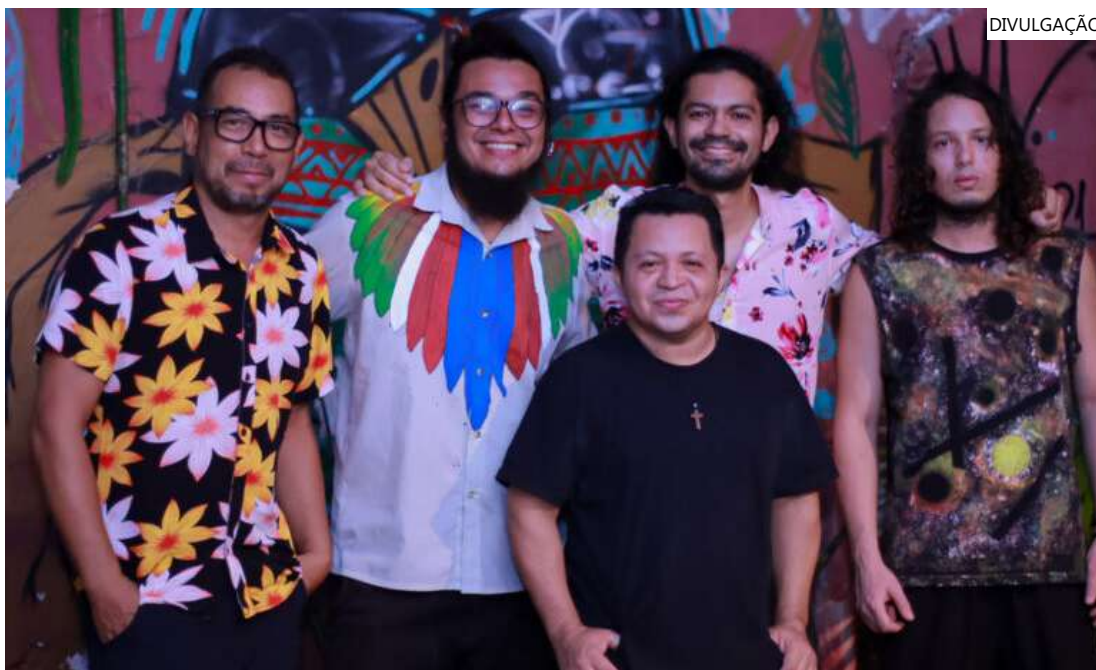
Alaídenegão é uma banda autoral que tem como proposta unir os diversos ritmos brasileiros

A banda amazonense Alaídenegão lançou um novo single na última sexta-feira (8) para encerrar o ano com chave de ouro. A música “Uma Conquista” conta sobre um relacionamento amoroso e cita o eterno rei do Brega, o cantor Reginaldo Rossi. A banda apresenta o single em Manaus com uma performance ao vivo no dia 15 de dezembro no Espaço Cultural Curupira Mãe do Mato, com pré-show de Magaiver. O lote de ingressos é único no valor de R$ 20, a venda será na bilheteria no dia do evento.