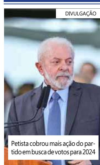
Petista cobrou mais ação do partido em busca de votos para 2024

O presidente Luiz Inácio Lula da Silva participou em Brasília, da abertura da Conferência Eleitoral do Partido dos Trabalhadores (PT), evento que debate as estratégias da legenda para as eleições municipais do ano que vem, quando serão definidos os prefeitos e vereadores de mais de 5,5 mil municípios do país.