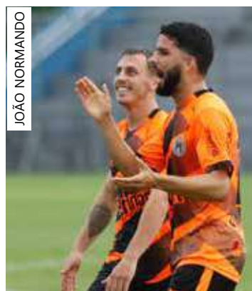
Jogador tem passagem por vários clubes nordestinos

apresentar nos próximos dias para iniciar a preparação para o Estadual. Única competição no calendário azulino em 2024, o Campeonato Amazonense terá um novo formato, com divisão por grupos e início previsto para o fim de janeiro. O Nacional estará no grupo A ao lado de Amazonas, Manaus, Operário e Unidos do Alvorada no primeiro turno.