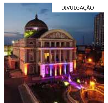
Os teatros representam as artes, a arquitetura e a história da

O Teatro Amazonas, tombado como primeiro monumento em Manaus pelo Iphan, acumula uma história de 127 anos.