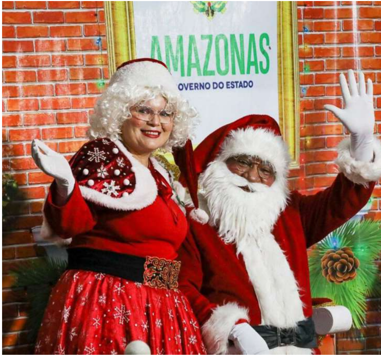
A ação contará com palco móvel para integrar todos os públicos.