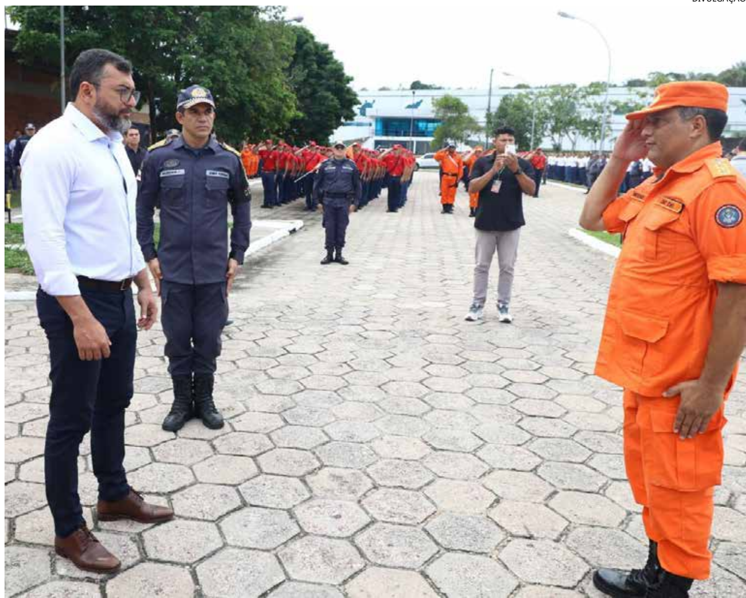
Na ocasião, governador destacou que a convocação de novos servidores vai permitir ao Estado expandir o atendimento à população

parte do programa Amazonas Mais Seguro, tanto de investimento em pessoal quanto de investimento em equipamentos", destaca o governador.