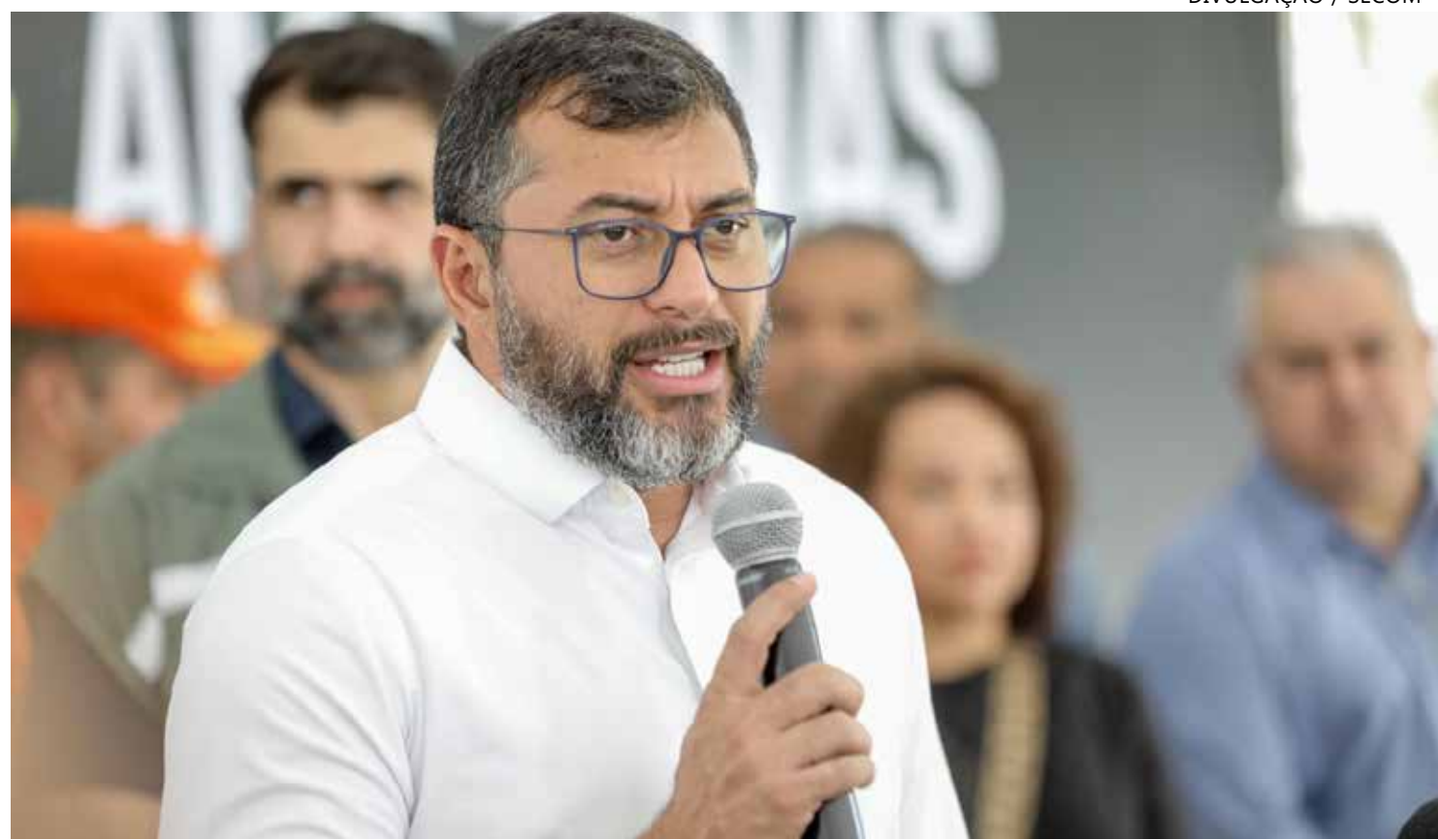
O salário de dezembro será antecipado e creditado em conta nos dias 21 e 22 deste mês

"Além de honrar nosso compromisso com os servidores, vamos aquecer a economia,