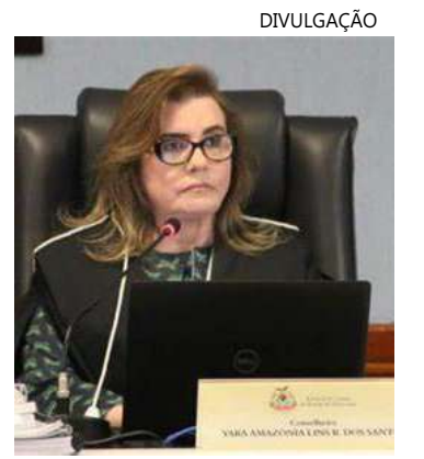
Sessão será nessa terça-feira (12), a partir das 10h