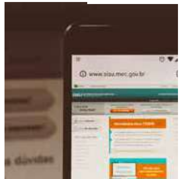
Desde sua criação, em 2010, o Sisu é aberto duas vezes ao ano