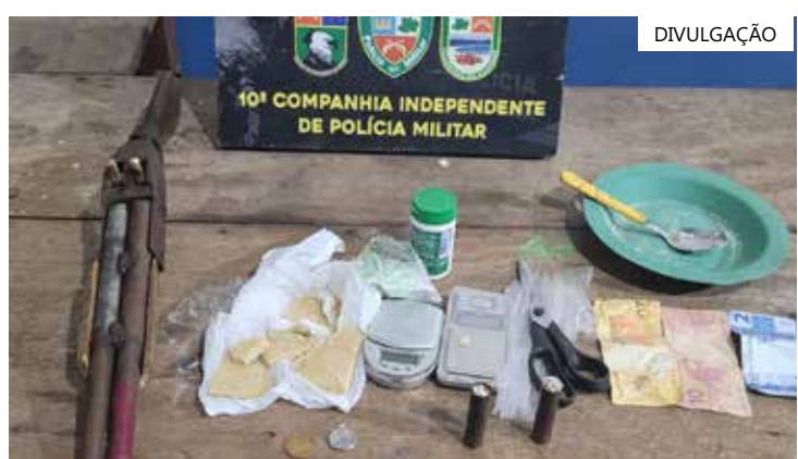
Material apreendido em posse dos suspeitos

Os homens foram encaminhados ao 48º Distrito Integrado de Polícia (DIP).