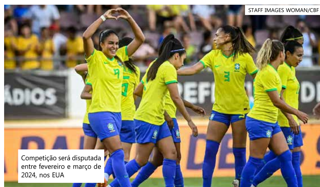
Competição será disputada entre fevereiro e março de 2024, nos EUA

O Grupo A conta com a participação de Estados Unidos, México, Argentina e o vencedor do jogo entre Guiana e República Dominicana. Já o Grupo C é formado por Canadá, Costa Rica, Paraguai e quem triunfar entre El Salvador e Guatemala.