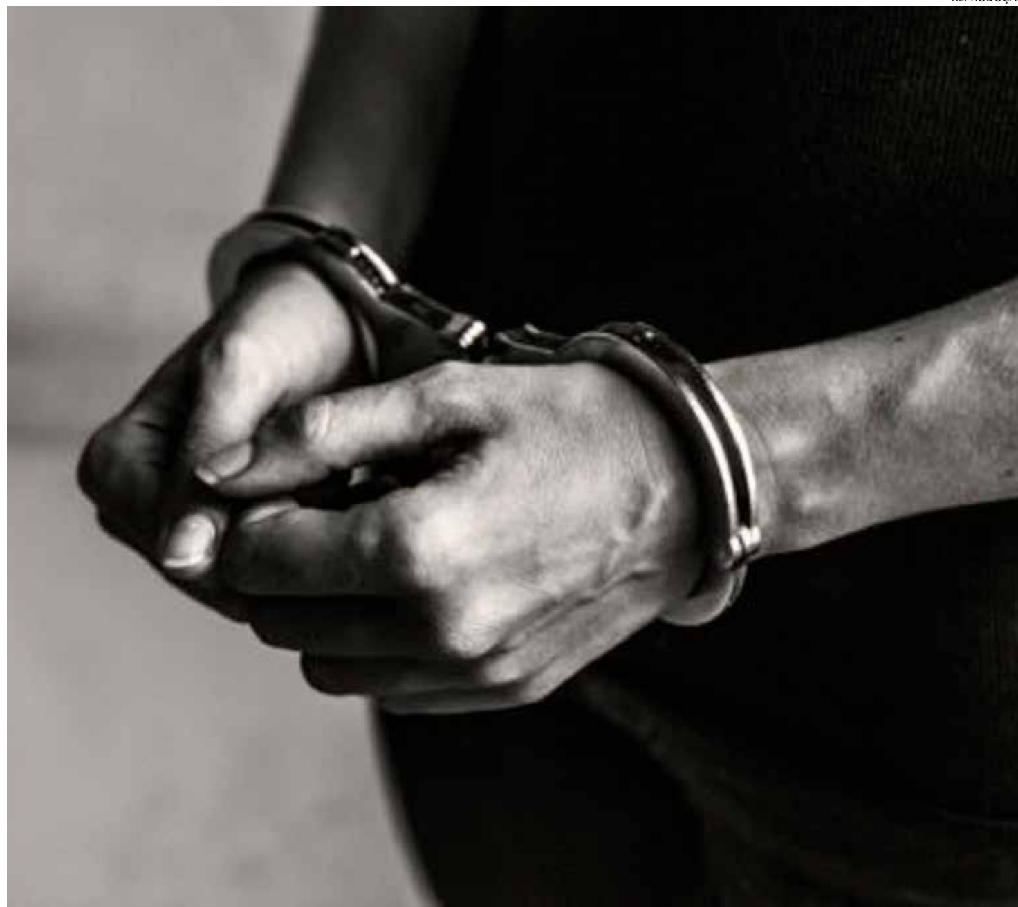
Crime ocorreu em novembro de 2021, no estado do Pará