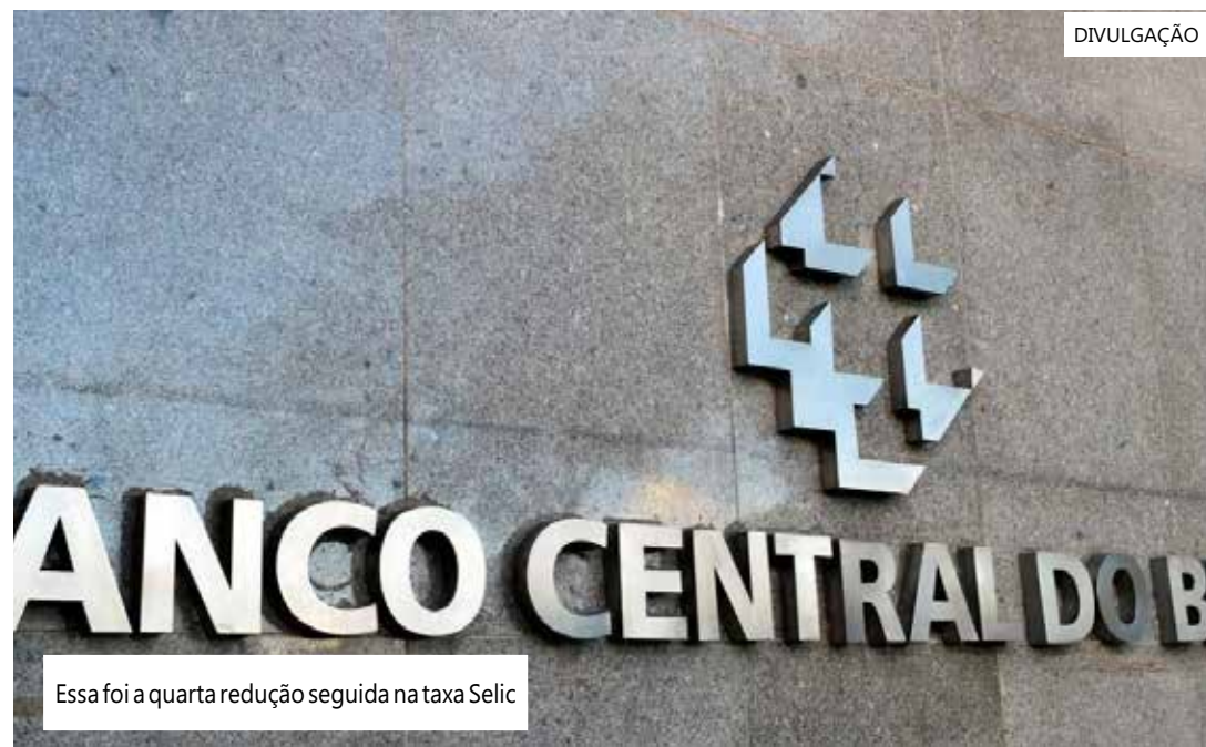
Essa foi a quarta redução seguida na taxa Selic