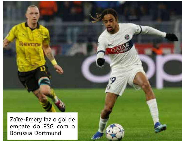
Zaïre-Emery faz o gol de empate do PSG com o Borussia Dortmund

Por terminar como líder, o Borussia Dortmund estará no Pote 1 do sorteio das oitavas de final da Champions, o que garante o direito de decidir a vaga para as quartas de final em casa. O Paris Saint-Germain estará no segundo pote. O sorteio será na segunda-feira da semana que vem, às 8h (horário de Brasília).