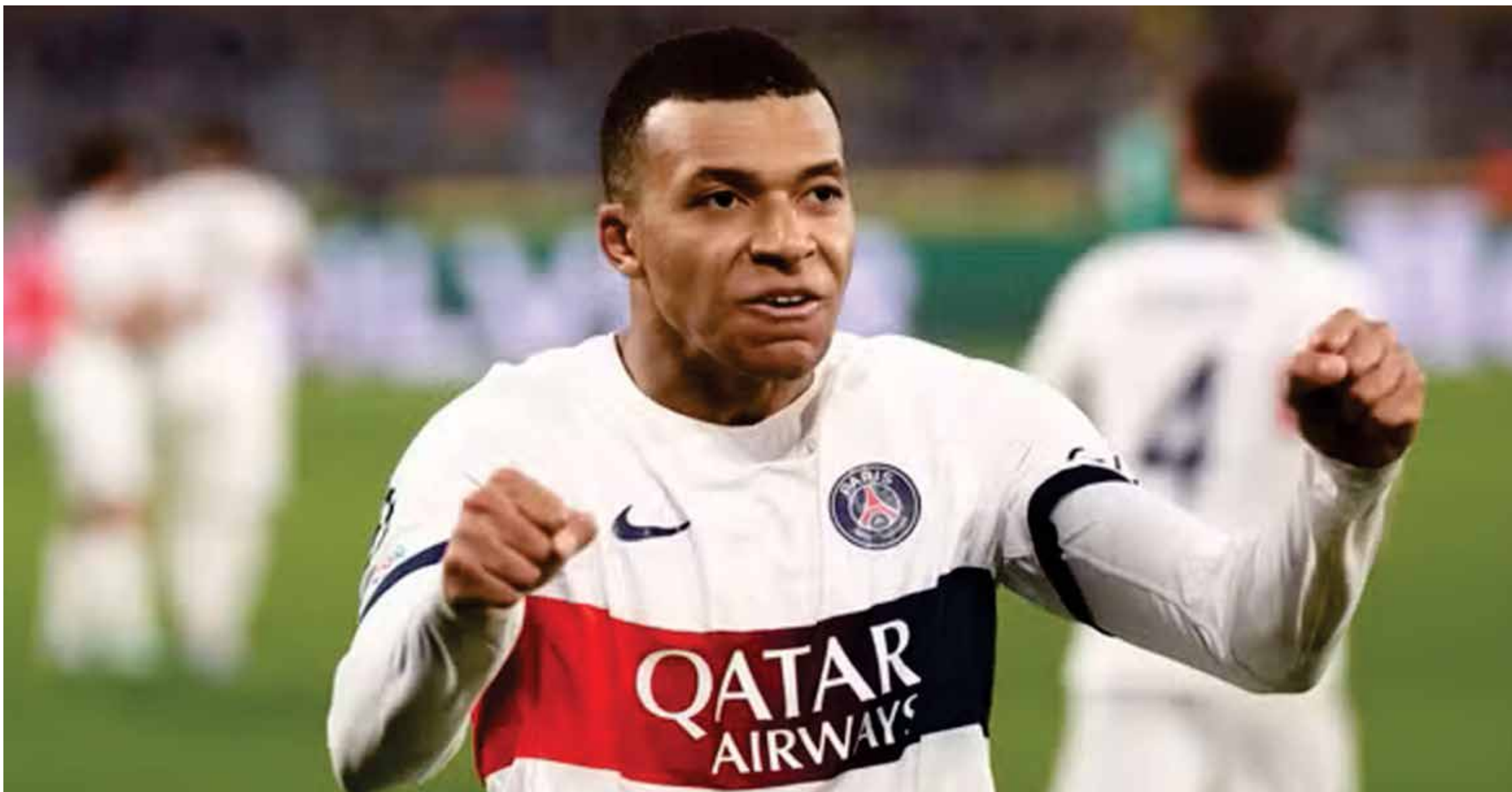
Mbappé comemora a classificação do PSG para as oitavas de final da Liga dos Campeões

Time francês leva vantagem sobre o Milan e garante o segundo lugar no Grupo F; sorteio da próxima fase será na segunda-feira