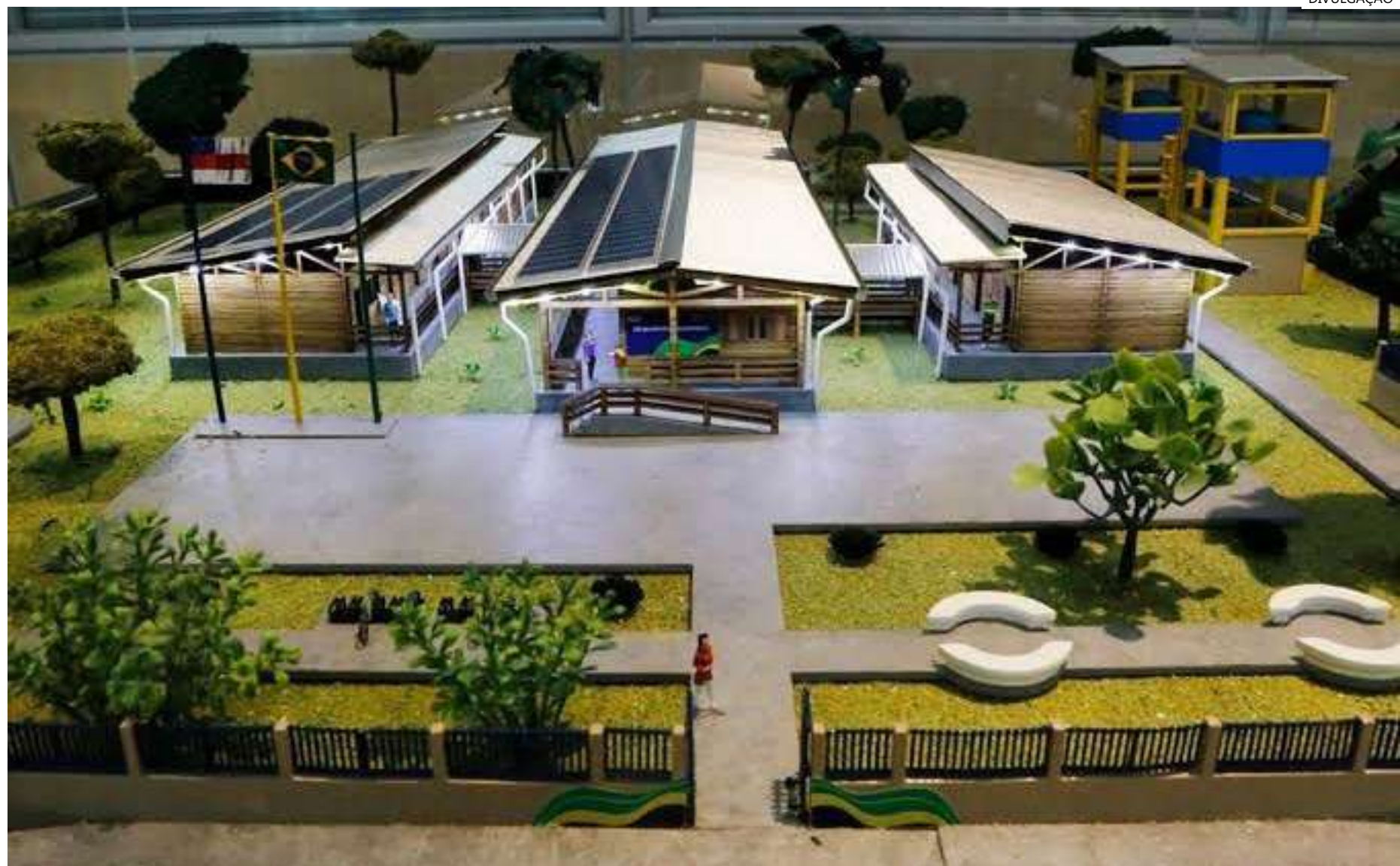
Com o objetivo de ampliar a oferta de vagas de matrículas e melhorar a qualidade da educação do Amazonas

"O governador Wilson Lima não tem medido esforços para fortalecer cada vez mais a educação no Amazonas. Resultado disso são os investimentos reali-