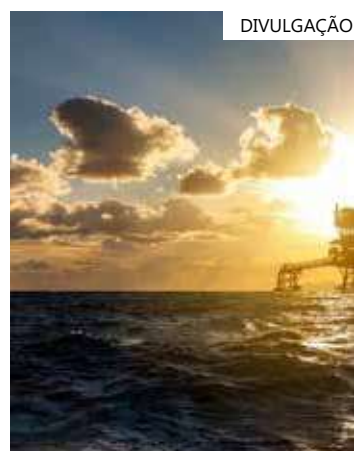
O petróleo WTI para janeiro fechou em alta de 1,25%

Em outro sinal altista para o consumo de petróleo, o relatório da Opep reafirmou expectativa de alta na demanda em 2024 a 2,2 milhões de barris por dia (bpd).