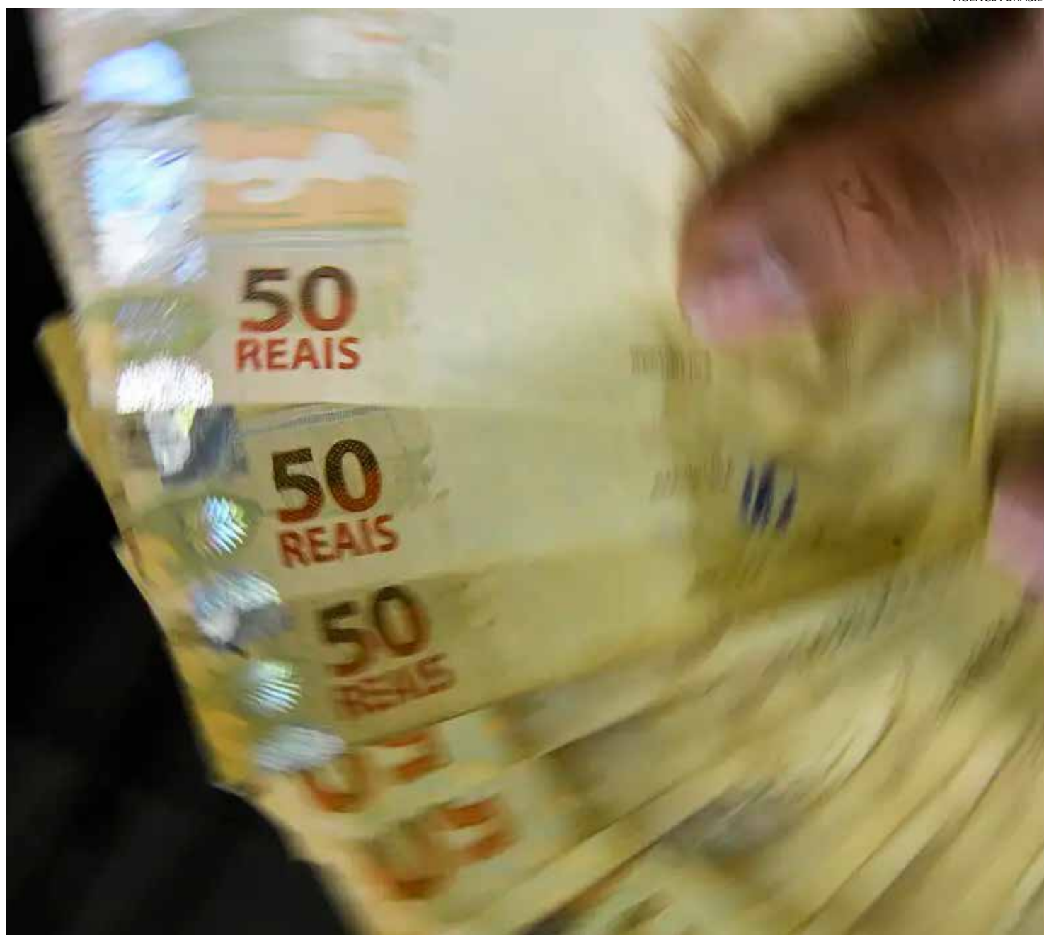
O valor do abono é proporcional ao período em que o empregado trabalhou com carteira assinada

Como ocorre tradicionalmente, os pagamentos serão divididos em seis lotes, baseados no mês de nascimento, no caso do PIS, e no número final de inscrição, no caso do Pasep. O saque terá início nas datas de liberação dos lotes e acabará em 27 de dezembro de 2024. Após esse prazo, será necessário aguardar convocação especial do Ministério do Trabalho e Previdência.