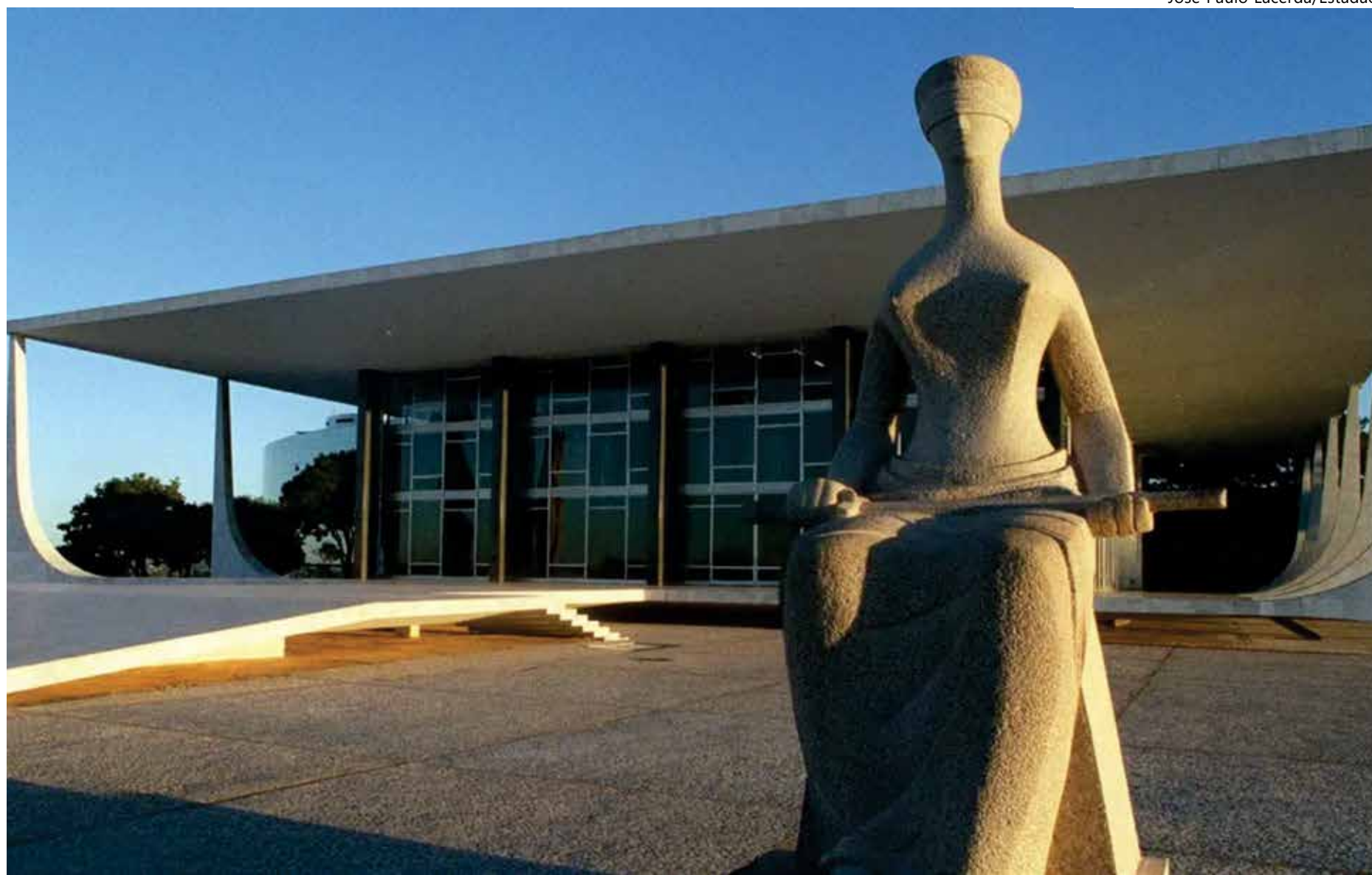
Licença-paternidade é tema de julgamento no STF

paternidade também traz prejuízos aos direitos da criança. A presença da figura paterna na primeira infância contribui para melhor desenvolvimento da criança".