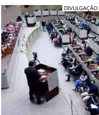
Vereadores aprovaram redução da renovação de frota por maioria

Com os pareceres das comissões rejeitados, o projeto foi arquivado.