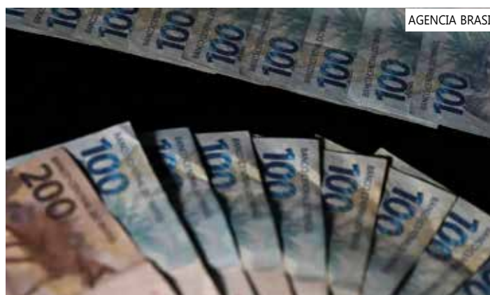
Limite para operações agora é de 1,8% ao mês