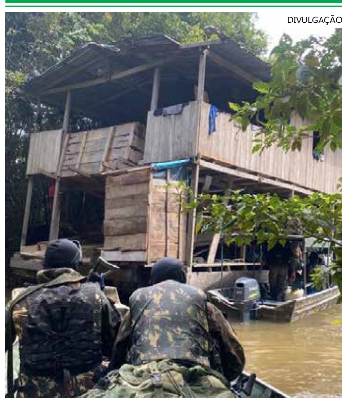
Sétima operação do ano ainda está em curso