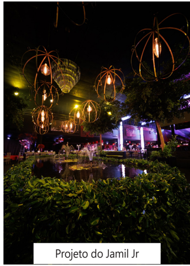
Projeto do Jamil Jr