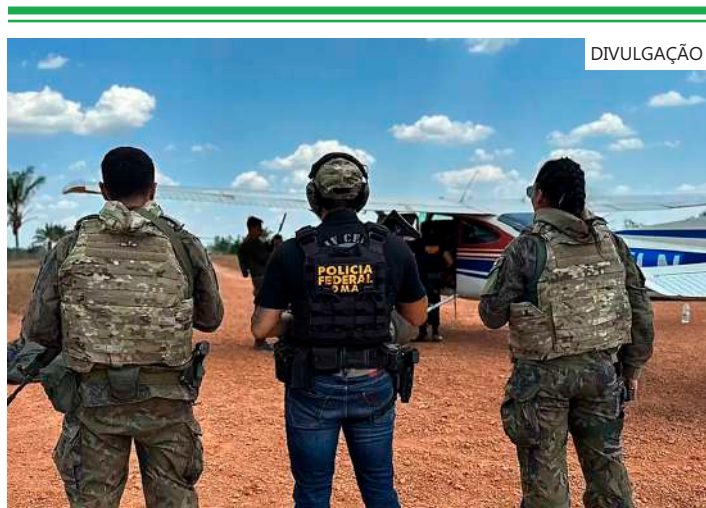
Operação foi a 110 quilômetros de Boa Vista

A Polícia Federal aprendeu o avião após a adoção de Medidas de Controle de Solo por militares do Grupamento de Segurança e Defesa da Base Aérea de Boa Vista e de agentes da PF.