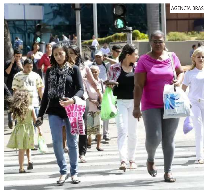
O desemprego médio do ano passado foi 1,8% menor que 2022

Já população subutilizada (19,9 milhões de pessoas) ficou estável no trimestre. O recuo foi de 6,4% no ano, com 21,3 milhões. Foi o menor contingente desde o trimestre encerrado em janeiro de 2016. A população subocupada por insuficiência de horas trabalhadas (5,4 milhões) ficou estável nas duas comparações.