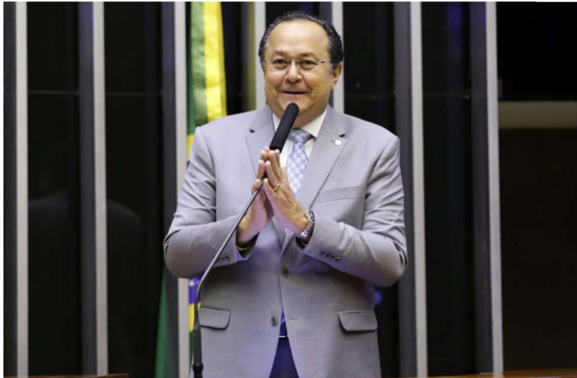
Silas Câmara afirma que seu mandato tem propósito religioso

"A assessoria Jurídica do Deputado Federal Silas Câmara informa que o parlamentar recorrerá da decisão do Tribunal Regional Eleitoral do Estado do Amazonas, reafirmando seu compromisso com a defesa legal de seu mandato, conquistado com muito trabalho, união, por um propósito santo, de