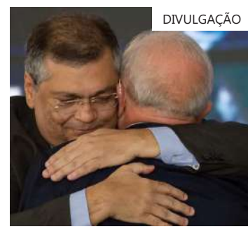
Dino disse que diminuiu a violência

Os dados do MJSP, que consolidam informações repassadas pelas secretarias de Segurança Pública dos estados, mostram