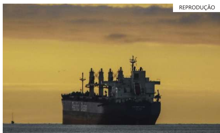
O navio deixou a Austrália em 5 de janeiro com destino a Israel