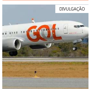
A Gol é a segunda maior empresa aérea brasileira

doméstico. Juntas, as três carregaram 99% dos passageiros no Brasil. É com essa trinca de empresas que o governo tem se reunido no esforço para tentar reduzir o preço das passagens. Esse desejo, porém, esbarrou na realidade. Os mais de R$ 20 bilhões em dívidas da Gol levaram a empresa à Justiça dos Estados Unidos, onde a companhia conseguiu iniciar um processo de recuperação judicial.