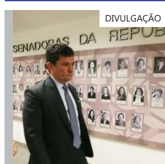
Para MPE, houve uso excessivo de recursos financeiros

Em 2021, Moro estava no Podemos e realizava atos de pré-candidatura à Presidência da República. Em seguida, ele deixou o partido e passou a fazer campanha para o Senado. De acordo com a acusação, houve "desvantagem ilícita" em favor dos demais concorrentes ao cargo de senador diante dos "altos