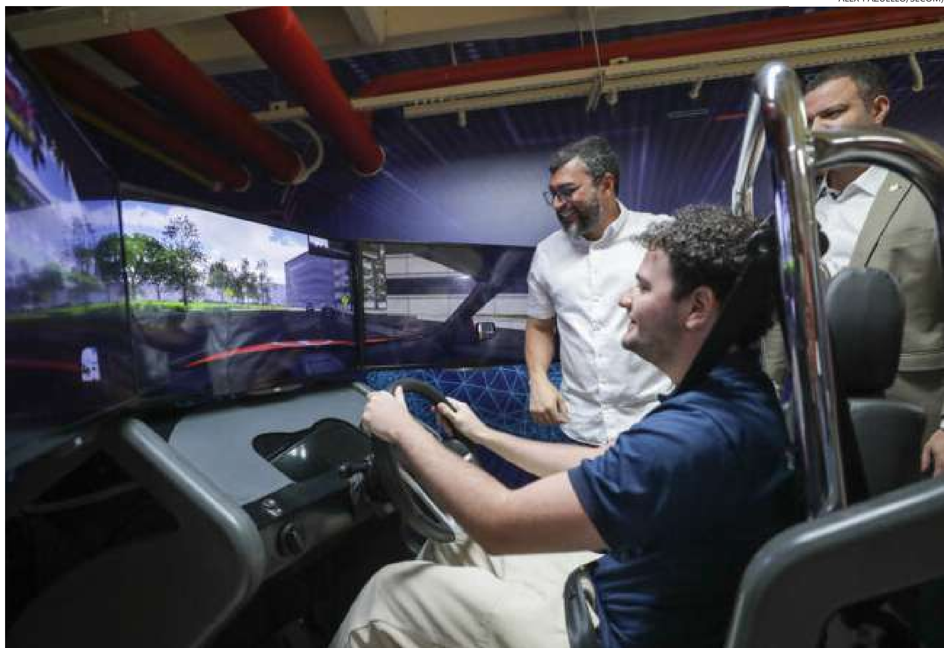
A Eptran está com inscrições abertas para cursos

A Eptran, com aproximadamente 1.250 metros qua-