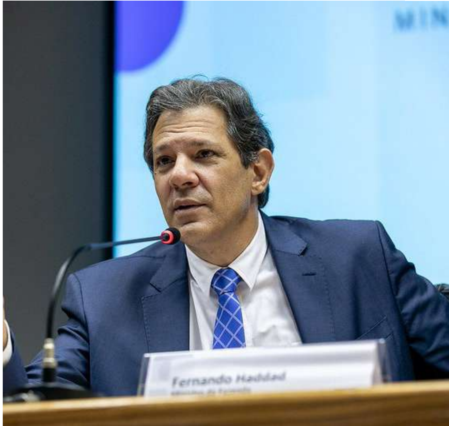
Segundo ministro, alta da dívida pública é herança do governo anterior

Nesta quarta-feira (31), o Comitê de Política Monetária (Copom) do BC promove a primeira reunião do ano para decidir o futuro da Taxa Selic, atualmente em 11,75% ao ano. Em de-