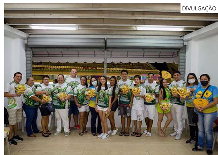
As atividades serão realizadas pela Gerência de Educação Para o Trânsito da instituição

Além da campanha preventiva, as fiscalizações serão intensificadas para coibir infrações como excesso de velocidade, uso do celular ao volante e a condução sob efeito de álcool.