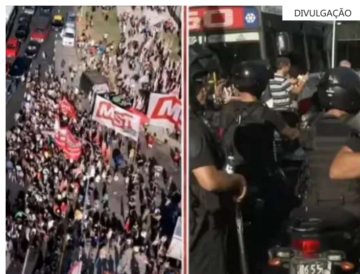
Conjunto de medidas começou a ser analisado pelo Congresso

Os investidores estão observando de perto, na esperança de que a versão reduzida seja aprovada, o que fortaleceria os mercados locais.