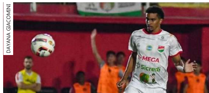
Jogador é o 17º contratado pelo clube amazonense

Única competição no calendário do clube em 2024, o Campeonato Amazonense começa no dia 19 de janeiro. O Nacional estará no grupo A ao lado de Amazonas, Manaus, Operário e Unidos do Alvorada no primeiro turno. A estreia do Leão será diante do São Raimundo, no dia 20 deste mês, às 15h30, no Estádio da Colina.