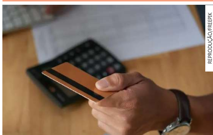
A Lei do Desenrola havia estabelecido 90 dias

Em relação à transparência, a partir de julho, as faturas dos cartões de crédito deverão trazer uma área de destaque, com as informações essenciais, como valor total da fatura, data de vencimento da fatura do período vigente e limite total de crédito.