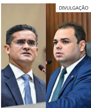
Cidade contesta vídeo de David Almeida sobre ônibus em Manaus

Cidade também lembra das alagações e tem denunciado a falta de planejamento da Prefeitura de Manaus para alagações, outro ponto crítico de Manaus neste período de chuvas.