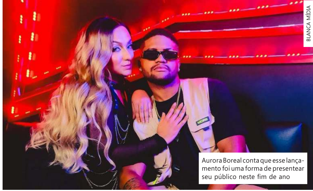
Aurora Boreal conta que esse lançamento foi uma forma de apresentar seu público neste fim de ano

Dentre os vários pontos altos da produção, vale destacar a participação especial da Companhia de Dança GRAVIUM, seguidores e amigos da