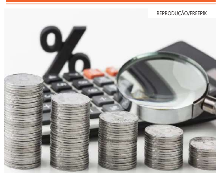
Outros estados estudam elevar suas alíquotas

Rondônia e Tocantins. Outros estados estudam elevar suas alíquotas. Para valer em 2024, é necessário que o aumento seja aprovado pela respectiva Assembleia até 31 de dezembro deste ano, por conta do princípio da anterioridade anual. Desde o ano passado, vários estados alteraram o ICMS para recuperar a arrecadação perdida desde 2022.