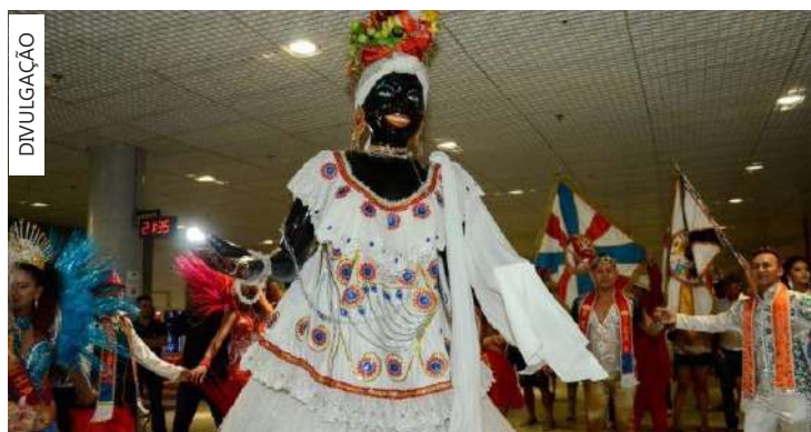
O evento inicia no aeroporto a partir das 20h30

A chegada da Kamélia para abertura do Carnaval passou a ser oficial em 2013, por conta da Lei 1.722/2013 de autoria do vereador Arlindo Júnior. No ano de 2015, a personagem Kamélia foi reconhecida como Patrimônio Cultural Imaterial do Estado do Amazonas.