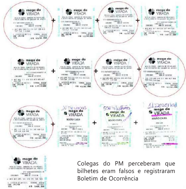
Colegas do PM perceberam que bilhetes eram falsos e registraram Boletim de Ocorrência

O PM está lotado no Batalhão Ambiental e declarou que não vai se pronunciar sobre o assunto antes de prestar depoimento.