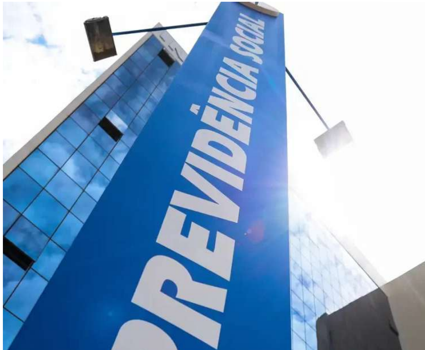
A reforma da Previdência estabeleceu quatro regras de transição, das quais duas previram modificações na virada de 2023 para 2024

Os servidores públicos estão submetidos à mesma regra de pontuação, com a diferença de que é necessário ter 62 anos de idade e 35 anos de contribuição (homens), 57 anos de idade e 30 anos (mulheres). Para ambos os sexos, é necessá-