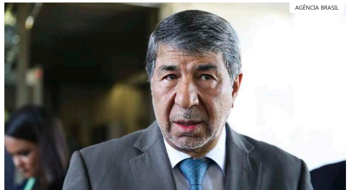
País africano aponta genocídio do povo palestino

O presidente brasileiro também já conversou, por telefone, com o presidente da Autoridade Palestina, Mahmoud Abbas, e este com ele em reunião bilateral em setembro do ano passado, em Nova York. Pelo lado de Israel, Lula teve dois te-