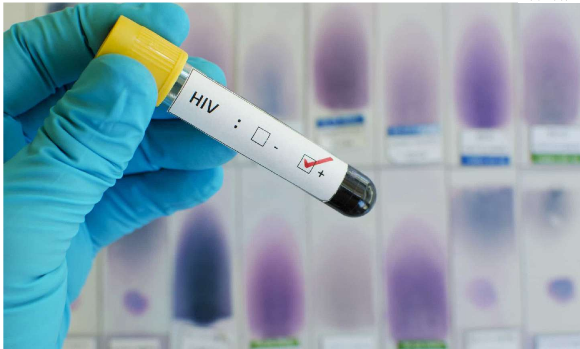
A outra forma de aumentar a diversidade é pelas mutações que ocorrem com a replicação do vírus nas células

As autoras partiram de uma hipótese a partir de estudos observados em animais em laboratório e órgãos em placas, onde a co-infecção de múltiplas variantes do vírus nas células favorece a recombinação destas diferentes formas do vírus. A recombinação é a mis-