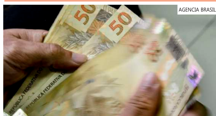
Prazo de adesão vai até 30 de abril

Os editais estão divididos nas seguintes categorias: dívidas de pequeno valor, débitos de difícil recuperação ou irrecuperáveis, capacidade de pagamento, inscrições garantidas por seguro garantia ou carta fiança e microempreendedores individuais. Segundo a PGFN, o governo espera recuperar cerca de R$ 24 bilhões com as Transações por Adesão.