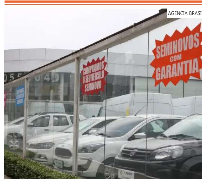
Vendas de veículos novos tiveram alta de 9,7%