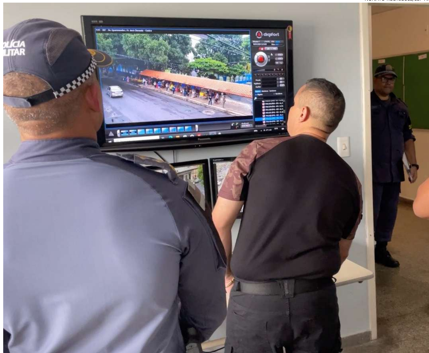
Rede é composta por mais de 50 câmeras instaladas em pontos estratégicos da área central

A rede é composta por mais de 50 câmeras instaladas em pontos estratégicos da área central. O espaço vai funcionar 24 horas por dia e será monitorado por policiais da