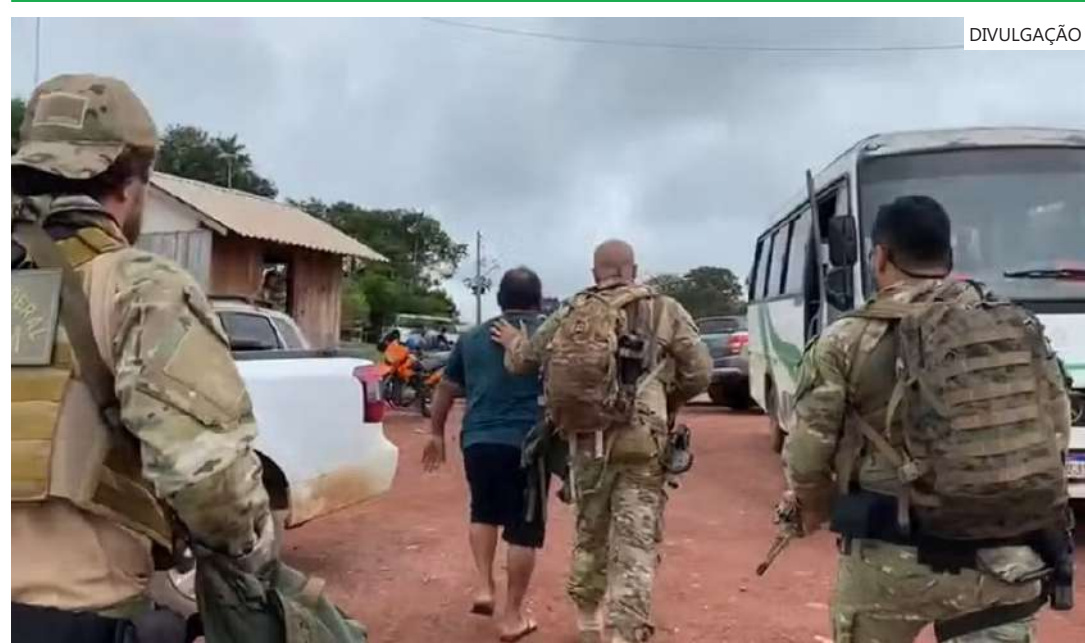
Conforme a polícia, uma das vítimas é neta do suspeito, que tinha oito anos quando foi abusada

O suspeito que foi preso durante a operação da Polícia Federal é um "Tuxaau", considerado como a liderança indígena da aldeia Muratuba, onde os crimes aconteceram. Cerca de 20 famílias moram no local.