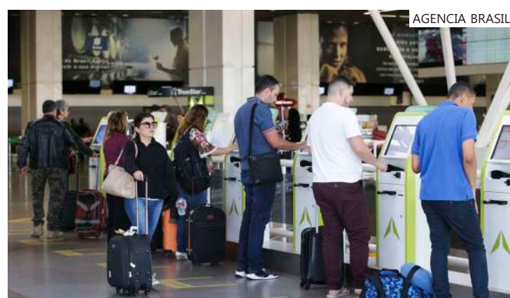
Programa de passagens a R$ 200 será lançado em fevereiro

Silva até o início do mês que vem. "A gente espera que o presidente possa anunciar, agora no final de janeiro, mais tardar no início de fevereiro, um programa de passagens a R$ 200, que serão para dois públicos específicos num primeiro momento, o público de aposentados do INSS, que dá em torno de 20 milhões de brasileiros, e também para alunos do Prouni, que atinge 600 mil estudantes", anunciou em entrevista a jornalista, nesta terça-feira (9), no Palácio do Planalto, após se reunir com o presidente.