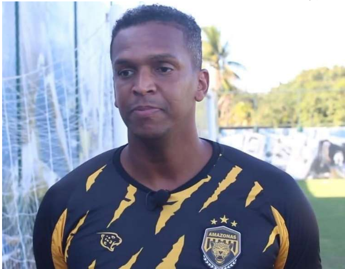
Jô retornou da aposentadoria para jogar pelo Amazonas FC na Série B

Jô havia anunciado que jogaria pelo Existente Futebol e Samba, clube amador da zona norte de São Paulo, em 2024. Planejava curtir a aposentadoria, ainda que com o futebol na rotina, mas teve dificuldade na adaptação. "Muito difícil ficar longe do ambiente de trabalho, toda aque-