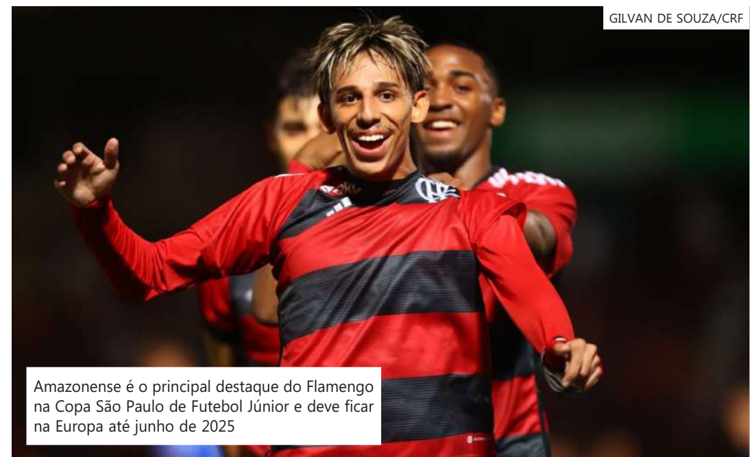
GILVAN DE SOUZA/CRF

Werton tem oito jogos como profissional - estreou em julho de 2021. Em 2022, na reta final do Campeonato Brasileiro, marcou um gol contra o Juventude.