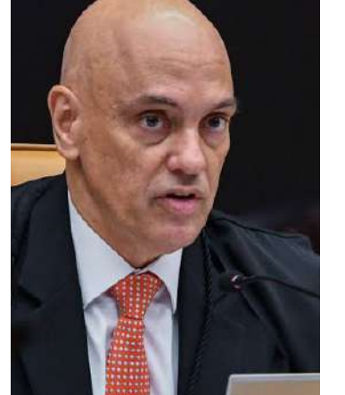
Ministro teve segurança reforçada desde aquele episódio