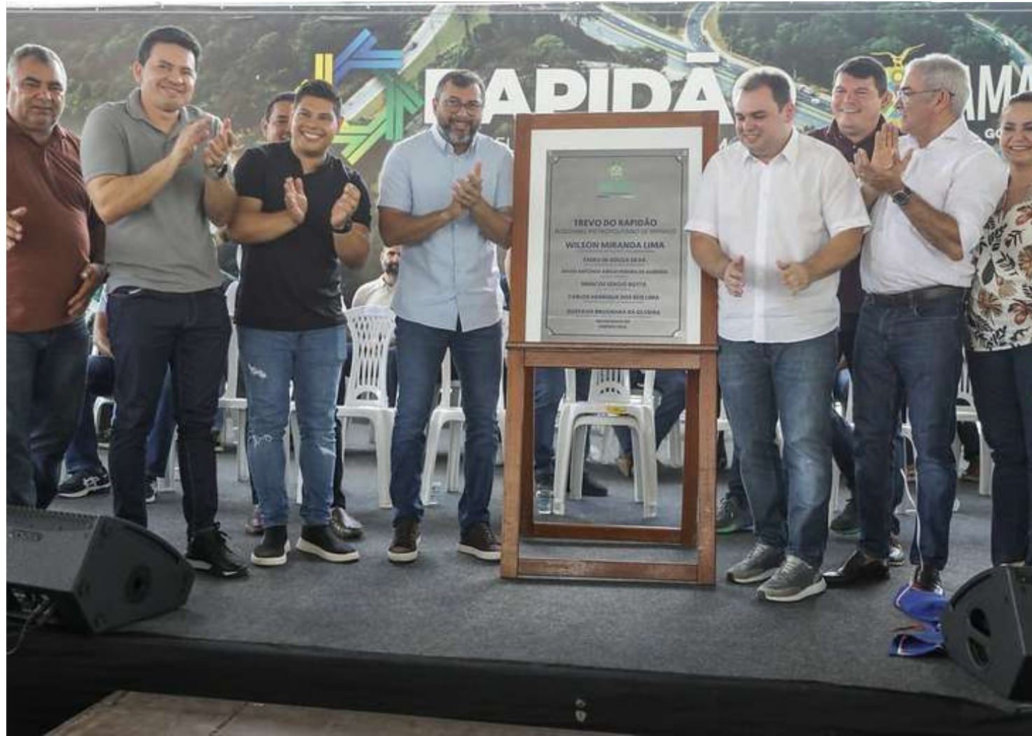
Cidade é o nome mais forte do UB, caso o partido deseja lançar candidatura própria

Entre as leis sancionadas pelo governador em exercício está a n.º 6.746/2024, que institui o dever de o motorista de aplicativo encaminhar passageiros em estado de incapacidade ou