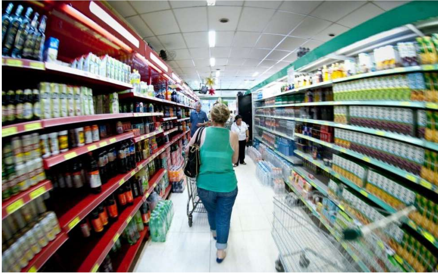
O comitê informou que deve seguir com cortes de 0,5 ponto percentual nas próximas reuniões

Para alcançar a meta de inflação, o BC usa como principal instrumento a