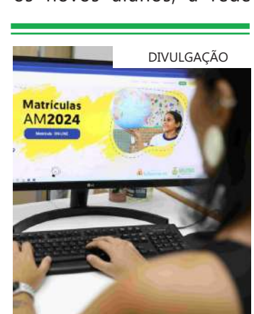
O prazo para reserva de vagas encerra na próxima sexta-feira (19/01)

“Estamos realizando todos os trâmites referentes às matrículas desde o ano passado. Após o atendimento voltado para os novos alunos, a rede