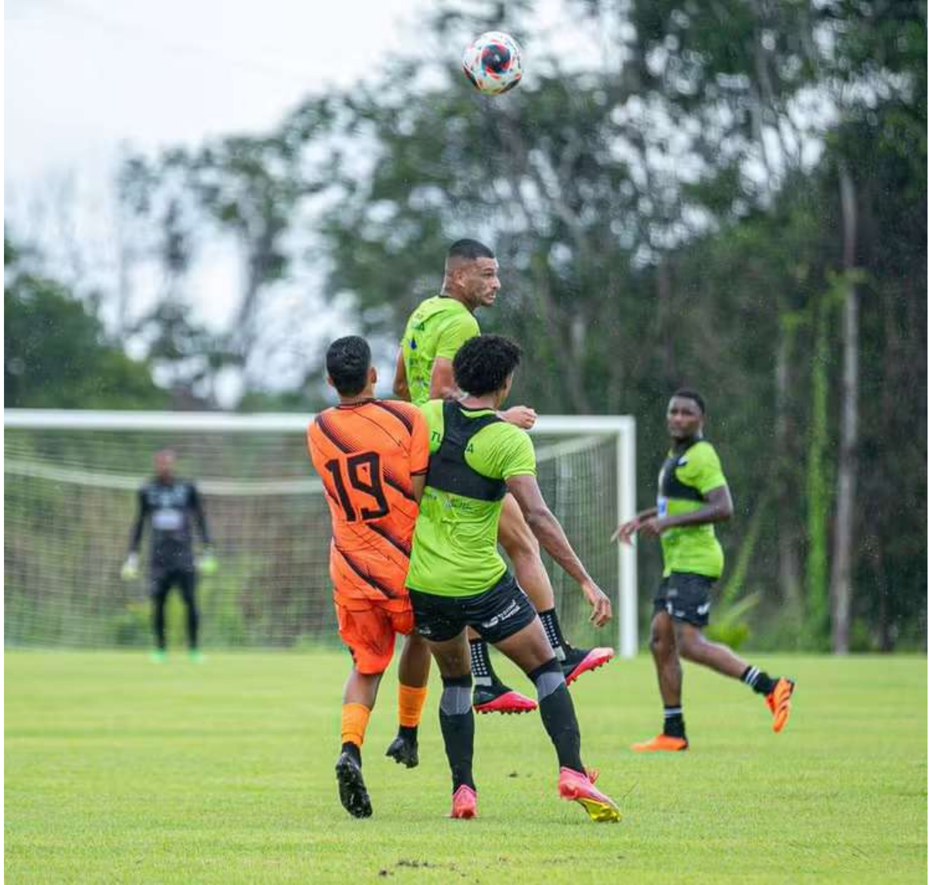
Manaus vence o Manauara em amistoso