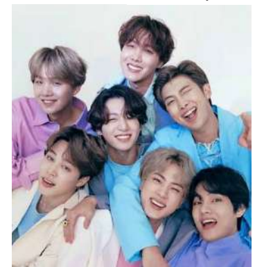
O Arm Nation é um dos maiores fãs clube da cultura sul-coreana no Brasil