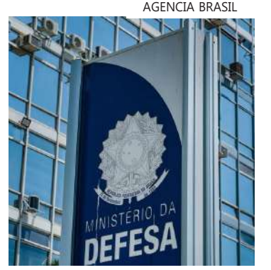
Medida entra em vigor no dia 1º de fevereiro

O Programa de Prevenção e Vigilância em Saúde Mental das Forças Armadas foi lançado pelo Ministério da Defesa nesta segunda-feira (15), com a publicação de uma portaria assinada pelo ministro José Mucio Monteiro, no Diário Oficial da União. A medida, que entra em vigor dia 1º de fevereiro, também cria um banco de dados unificado para acompanhamento epidemiológico dos casos de transtornos identificados entre os militares. Embora não haja um estudo atual e específico sobre saúde mental nas Forças Armadas brasileiras, de acordo com o último relatório da Organização Mundial de Saúde (OMS), publicado em junho de 2022, cerca de 1 bilhão de pessoas no mundo, viviam com algum transtorno mental em 2019. A portaria destaca que o objetivo do programa é "desenvolver intervenções que contribuam para o aumento da informação e da percepção aos transtornos mentais e comportamentais em militares da ativa". Para isso estão previstas ações educativas, capacitação das equipes que atuam no setor e padronização das atividades de prevenção e vigilância em saúde mental, a partir de análises dos tratamentos ofertados e do intercâmbio de conhecimento sobre o tema com Ministério da Saúde e outras iniciativas nacionais e internacionais.