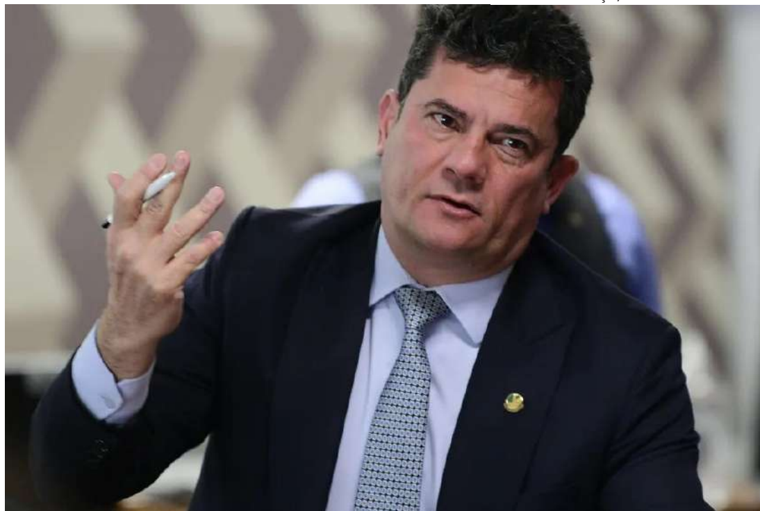
Moro diz desconhecer a ação do ministro Dias Toffoli