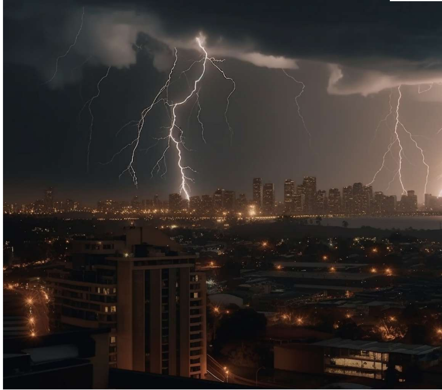
Observatório da Branquitude diz que a população é deixada para morrer