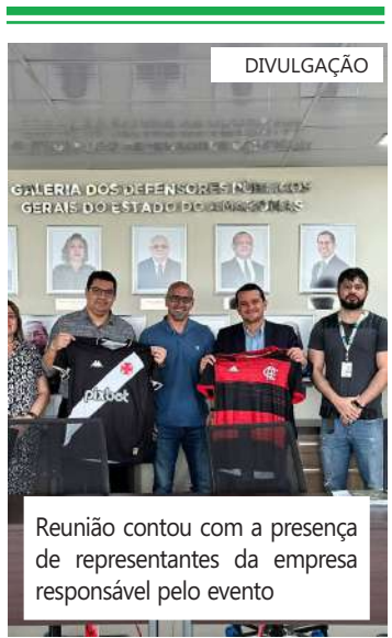
Reunião contou com a presença de representantes da empresa responsável pelo evento