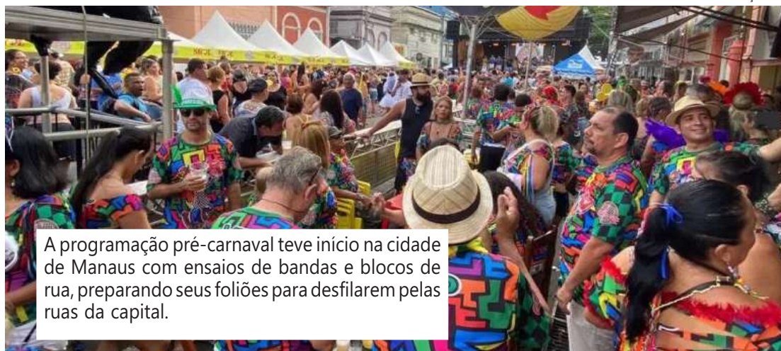
A programação pré-carnaval teve início na cidade de Manaus com ensaios de bandas e blocos de rua, preparando seus foliões para desfilarem pelas ruas da capital.