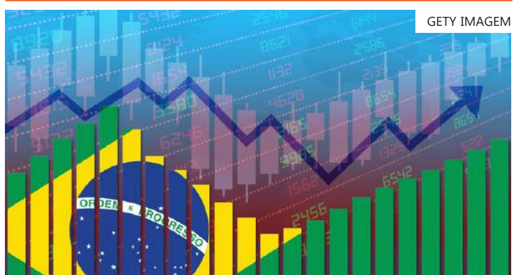
A projeção está na edição de janeiro

principalmente pelo maior gasto público com transferências de renda, além da dinâmica do mercado de trabalho e da inflação, contrabalançaram os efeitos da política monetária contracionista e criaram o ambiente para um crescimento econômico maior no ano passado. Para 2024, espera-se que esses fatores exerçam menos impacto, mas a redução das taxas de juros deve contribuir para sustentar o consumo e impulsionar os investimentos, diz a IFI.