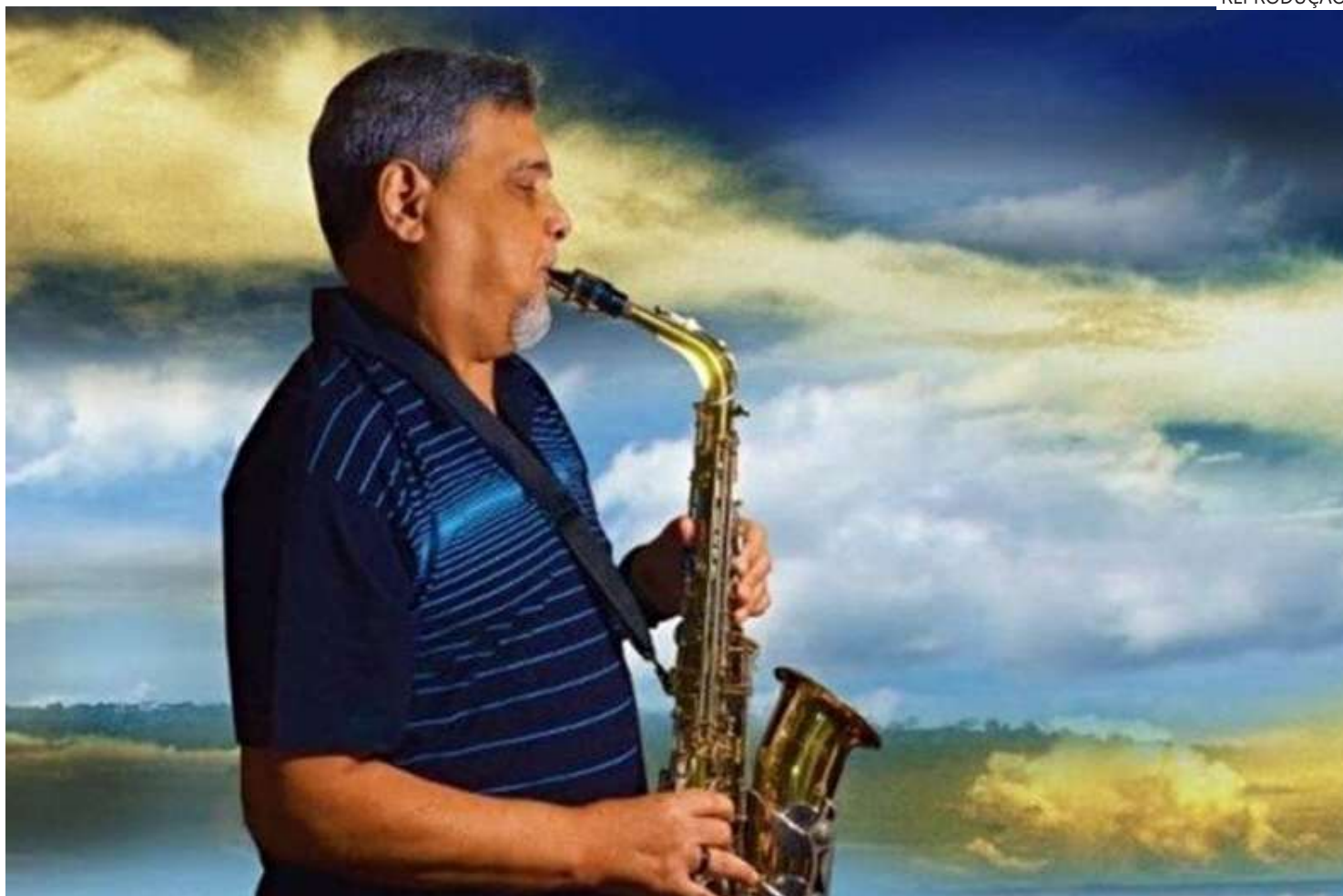
Artista amazonense ficou conhecido como o precursor do movimento musical conhecido como o "beiradão".

O artista lutava contra um câncer na hipófise (responsável pelo controle da maioria das outras glândulas)