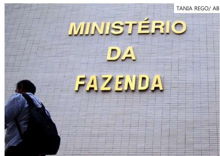
Orçamento é inconstitucional desde a Reforma da Previdência

acabando em 2027. A proposta selecionou, inicialmente, as atividades entre as 20% com maior participação de massa salarial em relação ao total. A partir dessa triagem, foram levantadas as atividades que estavam entre as 50% com maiores participação da renúncia antiga à massa salarial.