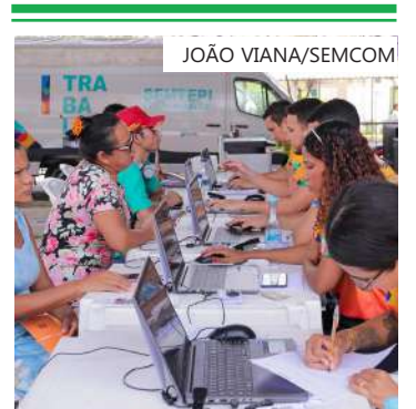
Ação itinerante ocorrerá nos bairros Puraquequara e Petrópolis

Os interessados em participar da ação devem comparecer aos locais mencionados com comprovante de vacinação (Covid-19), currículo e documentos pessoais (RG, CPF, PIS, CTPS, comprovante de escolaridade e residência). Não é necessário apresentar cópias, somente os documentos originais.