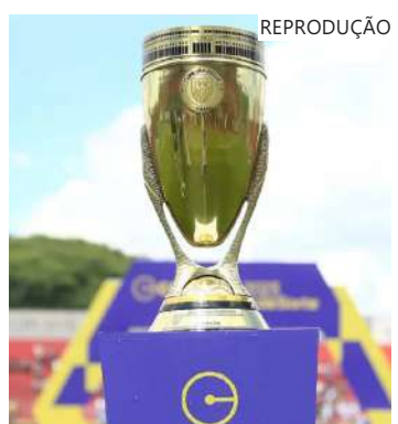
Próxima etapa da competição de base iniciou na quinta-feira (18)