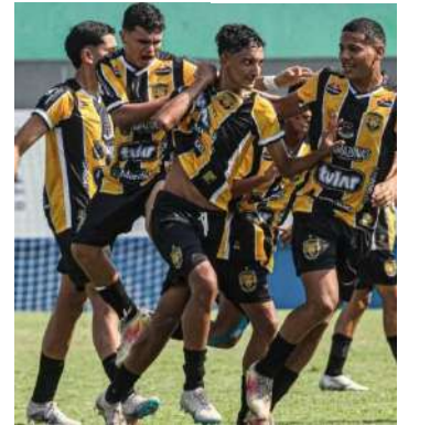
Duelo único acontece no dia 28 de fevereiro, em Manaus