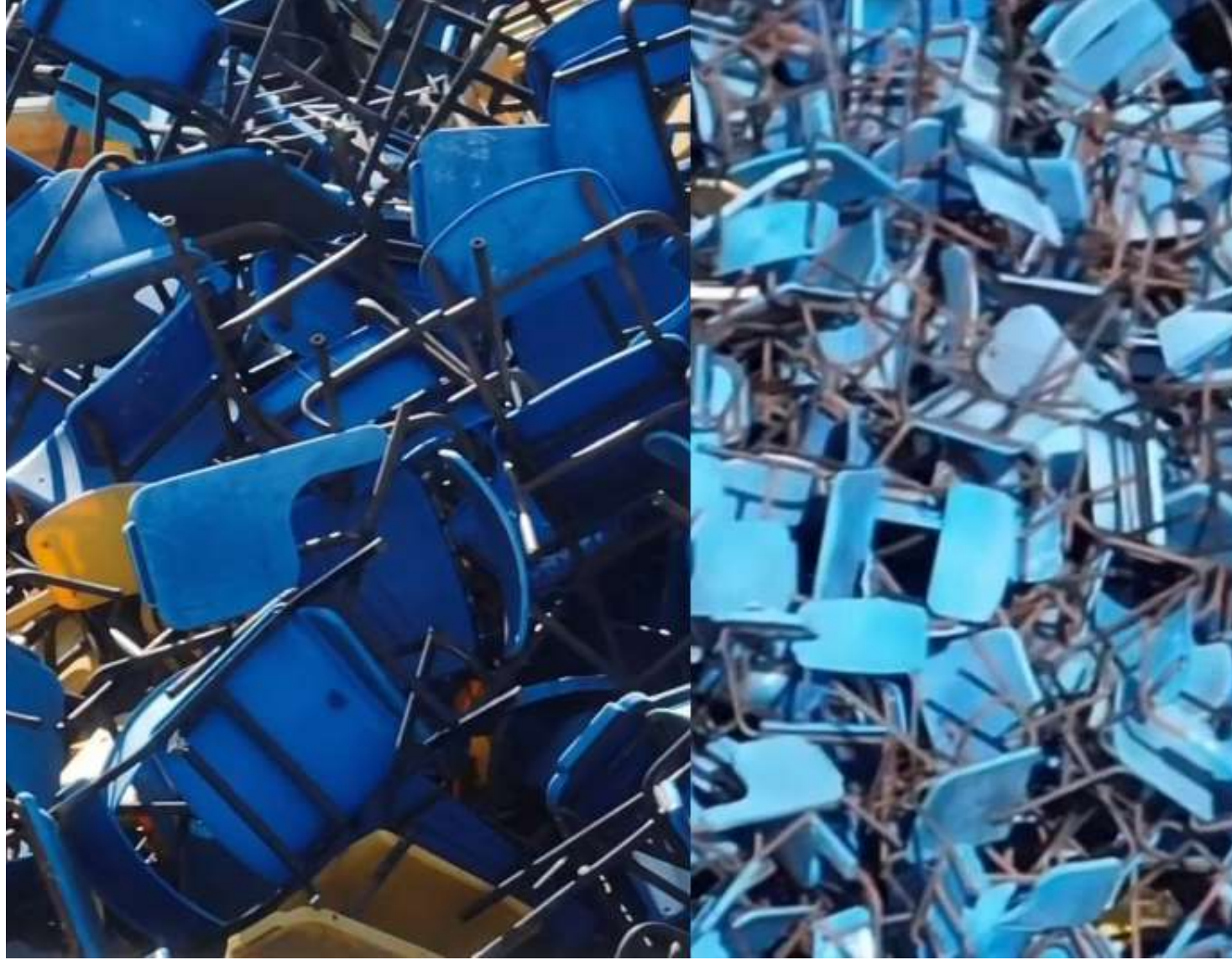
Milhares de carteiras foram filmadas jogadas no depósito da Prefeitura de Manaus