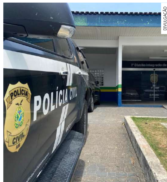
Foco da investigação está em identificar e responsabilizar os envolvidos

de drogas apreendidas nos primeiros 17 dias deste ano. Estima-se que o prejuízo causado ao crime organizado esteja avaliado em cerca de R$ 1 milhão.