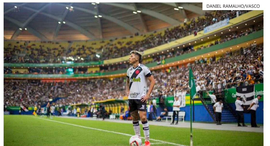
Último jogo do Cruzmaltino em Manaus foi contra o Guarani, em 2022

Na ocasião, o clube afirmou que o Amazonas tem o sócio-torcedor fora do Rio de Janeiro mais antigo do país e uma das maiores torcidas descentralizadas do Vasco.