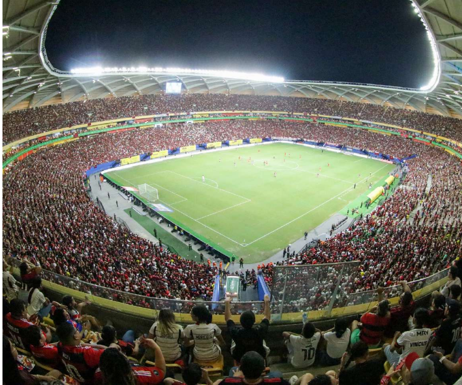
Em campo, Flamengo aplica 4 a 0 e vence Audax

"É um grande palco, já tiveram vários jogos grandiosos aqui na Arena da Amazônia e a gente sempre espera ter essa qualidade. O gramado foi elogiado, as áreas comuns