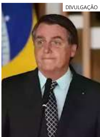
Bolsonaro beneficiou igrejas com incentivos fiscais

tera, que qualquer manifestação formal do órgão sai apenas quando ministros tomam decisões solitariamente ou em plenário. "O TCU se manifesta apenas por meio de seus acórdãos ou por decisões monocráticas dos seus ministros", destacou.