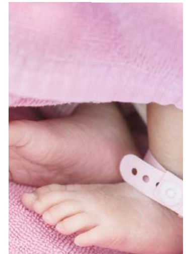
A notícia causou indignação nas redes sociais e moradores da cidade