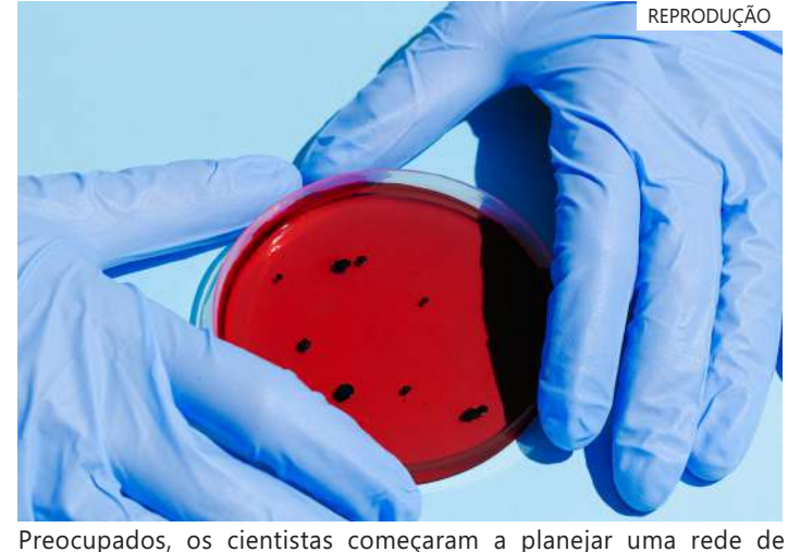
Preocupados, os cientistas começaram a planejar uma rede de monitoramento do Ártico

também que, mesmo não sabendo ao certo que vírus podem encontrar no gelo, "existe um risco real de haver um capaz de desencadear um surto de doença - por exemplo, uma forma antiga de poliomielite. Temos de partir do princípio de que algo deste gênero pode acontecer".