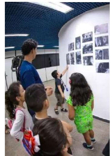
Programação também abrirá espaço para jovens e adultos