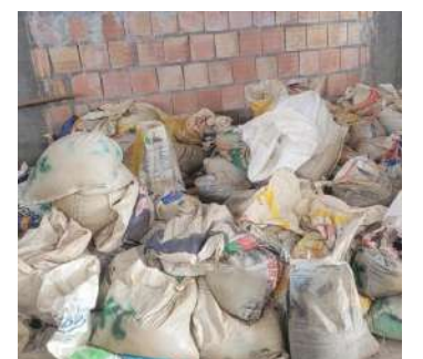
A cassiterita possui grande valor no mercado, e é conhecido como "ouro negro"

O indivíduo e o material apreendido serão encaminhados à Superintendência Regional da Polícia Federal no Amazonas, onde será lavrado o flagrante de usurpação de patrimônio da União.