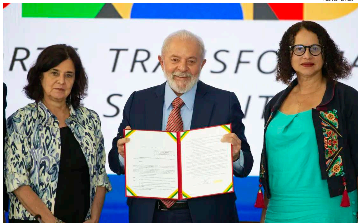
Chamado Nova Indústria Brasil (NIB), o plano tem, como centro, metas e ações até 2033

Lula iniciou sua fala comparando o CNDI ao Conselho de Desenvolvimento Econômico Social Sustentável (CDESS), mais conhecido como Conselho. Segundo ele, ambos têm ajudado significativamente o governo na formulação de políticas e diretrizes voltadas ao desenvolvimento econômico, social e sustentável do país. "Tenho dito que a capacidade de trabalhos apre-