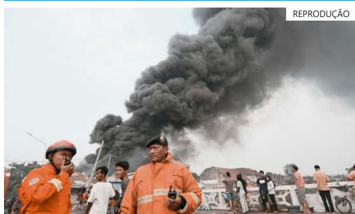
A morte do jovem provocou um protesto na cidade

Entretanto, o Ministério da Segurança Pública disse ter detido quatro policiais por suspeitas de terem estado envolvidos no homicídio.