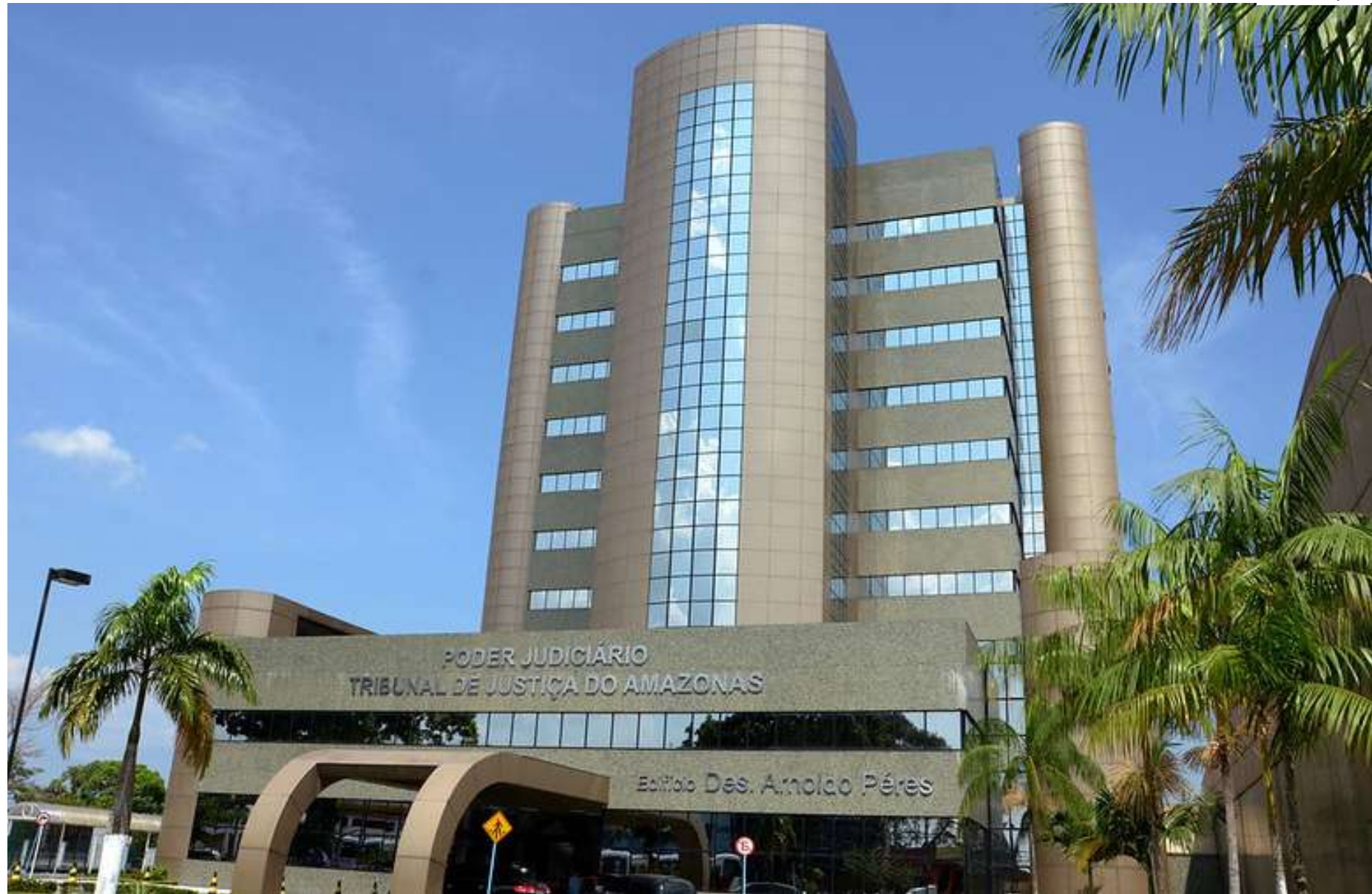
TJAM terá em 2024 um ano marcado por muito trabalho e prestação de serviços

A ferramenta é de iniciativa da Associação dos Membros do Tribunal de Contas do Brasil (Atricon) que, pela