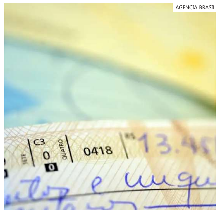
Em 2023 foram compensados 168,7 milhões de cheques

A Febraban credita a diminuição no número de cheques devido ao avanço de meios de pagamento digitais, como internet e mobile banking, e a criação do Pix em 2020.