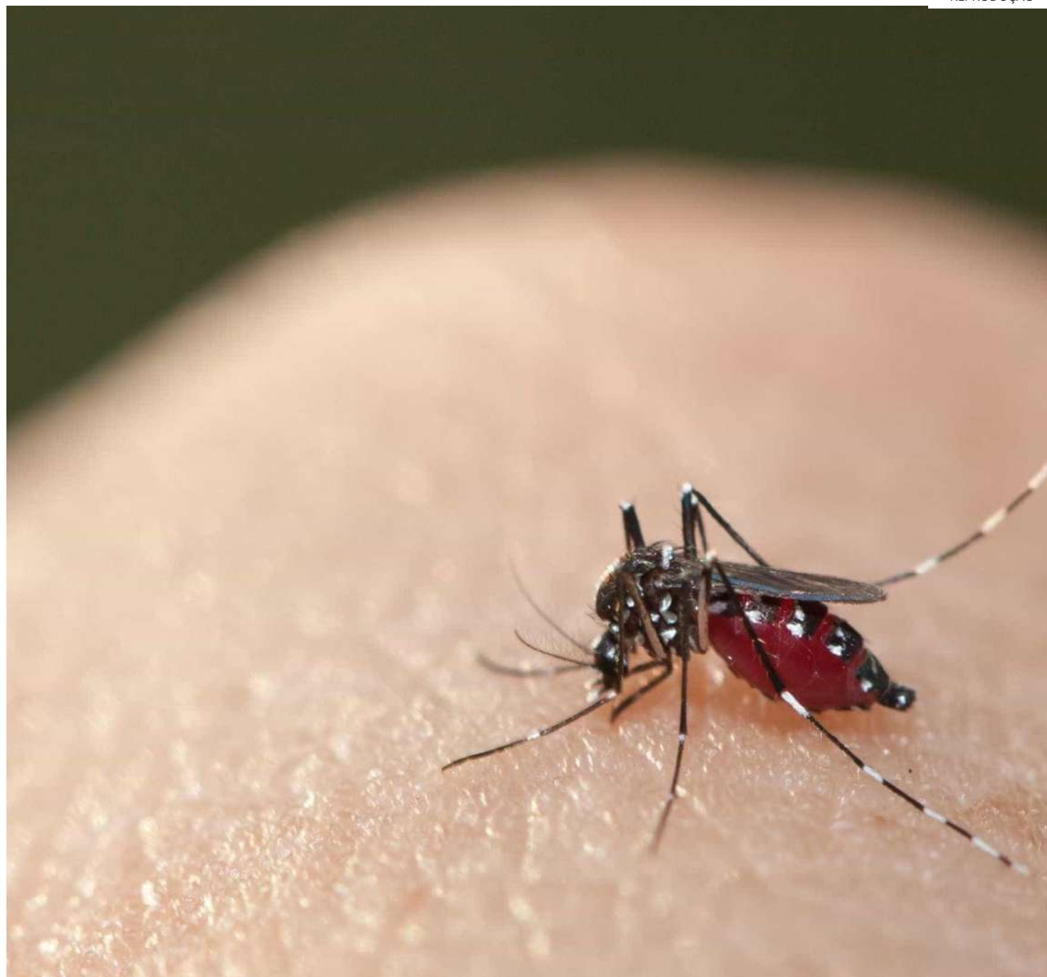
O Brasil já havia fechado o ano de 2023 com um recorde de mortes por dengue, com 1.094 vidas perdidas

De acordo com os critérios de vacinação estabelecidos pela pasta em conjunto com estados e municípios, as vacinas serão destinadas a regiões de saúde com municípios de grande porte - população igual ou superior a 100 mil habitantes - e com alta transmissão da doença nos últimos dez anos. Além disso, serão vacinadas crianças e adolescentes de