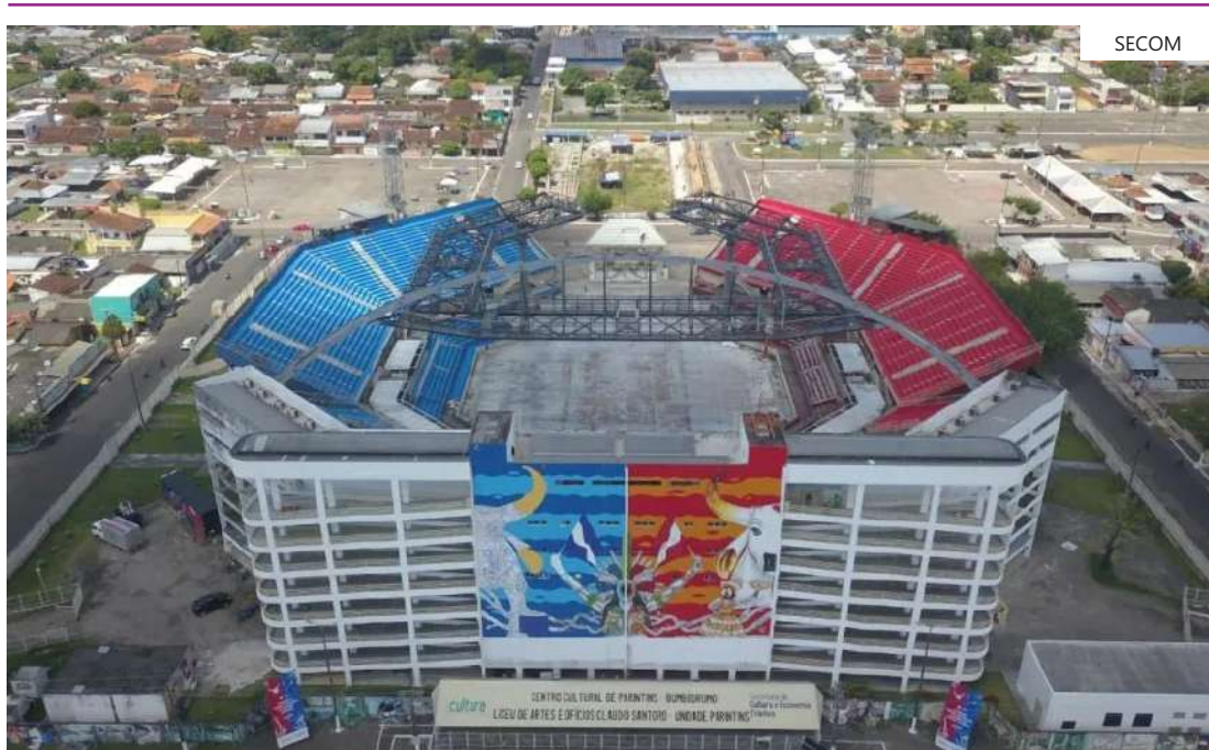
Duelo entre Caprichoso e Garantido acontece nos dias 28, 29 e 30 de junho, no Bumbódromo

De 28 a 30 de junho, Parintins irá revelar ao mundo mais uma vez a explosão de alegria, sons, magia e cores do Festival Folclórico de Parintins. Nesses dias, os bois Caprichoso e Garantido realizam, na arena do Bumbódromo, um espetáculo emocionante, envolvente, interativo e que, há seis anos, conta com os serviços de excelência e organização da Amazon Best, a empresa responsável pela venda dos ingressos e controle de acesso do público ao palco da festa.