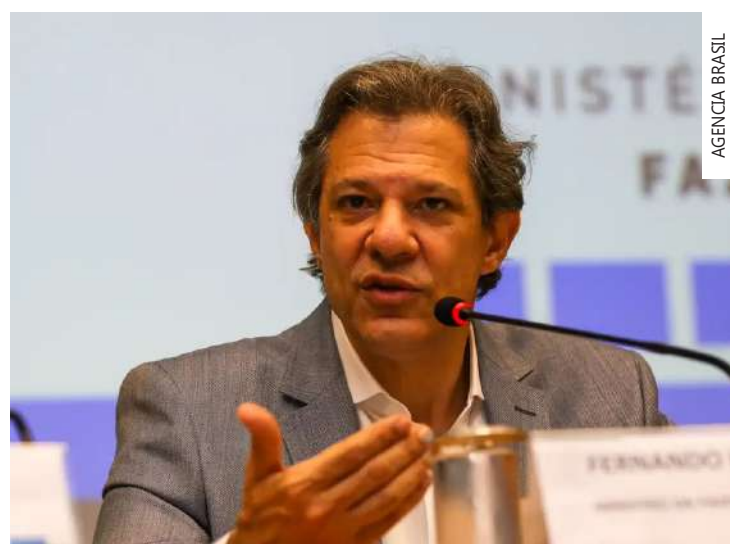
Regime especial foi prorrogado até 2028