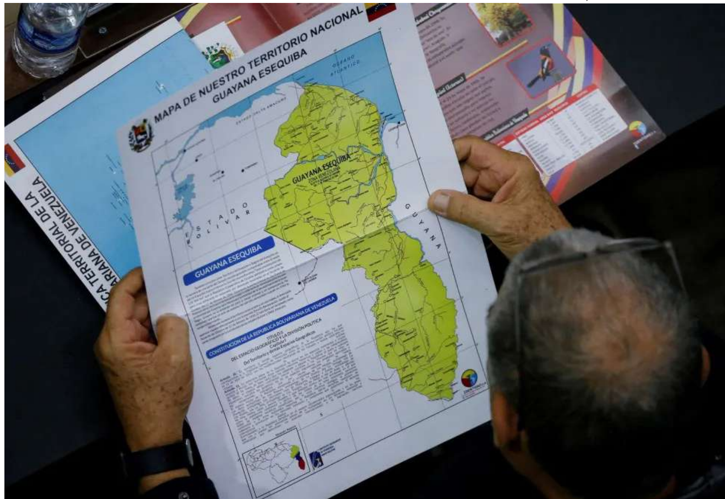
Venezuela reivindica o território de Essequibo, na fronteira entre os dois países

Interlocutores do Palácio do Planalto afirmam que, apesar de a conversa ocorrer em meio a tensão e ameaças de confronto, a