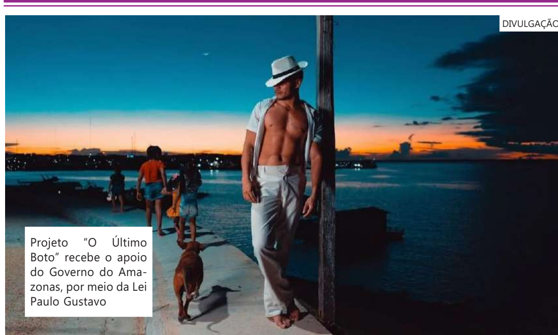
Projeto "O Último Boto" recebe o apoio do Governo do Amazonas, por meio da Lei Paulo Gustavo

No mês de fevereiro, o artista lançará a exposição "O Último Boto", que vai misturar lenda e realidade para conscientizar sobre a importância da preservação dos rios, florestas e das espécies de golfinho amazônico, endêmicas da região. Segundo ele, o boto-cor-de-rosa e o tucuxi estão classificados como "em perigo de extinção"