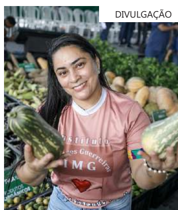
Alimentos foram adquiridos de produtores participantes do PAA

No local, também foram entregues 7,8 mil unidades de mudas de café e 900 mudas de citros (laranja e limão), totalizando 8,7 mil mudas, beneficiando 230 famílias da zona rural. Os 70 agricultores da Comunidade São Francisco, na AM-010, receberam mudas para incentivar a produção.