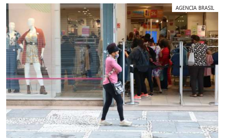
Índice alcançou 109,1 pontos em janeiro