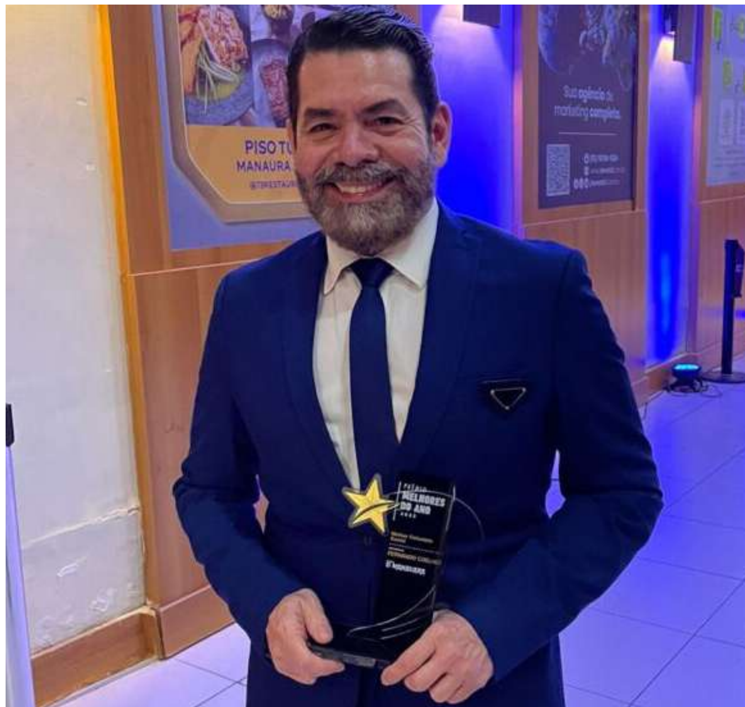
Premiação aconteceu no Teatro Manauara, na última segunda-feira (22)