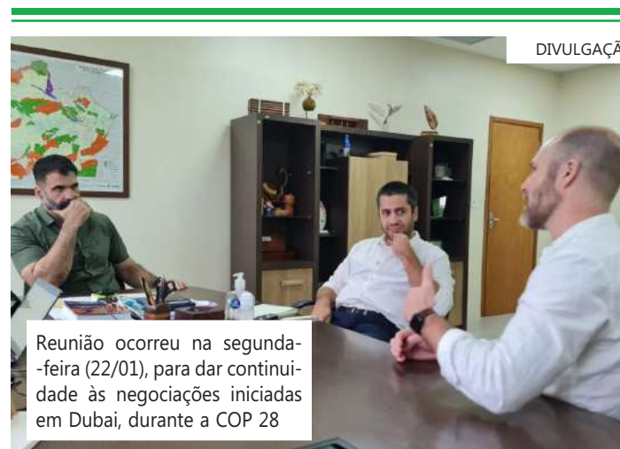
Reunião ocorreu na segunda-feira (22/01), para dar continuidade às negociações iniciadas em Dubai, durante a COP 28

"Esse encontro com representantes da Sema já é fruto da conversa que tivemos em Dubai e, por isso, a expectativa para uma futura parceria com a Amazon é muito positiva. No ano passado, em Dubai, conversei com os representantes da Amazon sobre investimentos para a Amazônia e iniciamos, também, uma conversa sobre investimentos socioambientais especificamente para o Amazonas", afirmou o governador. No encontro, ocorrido na