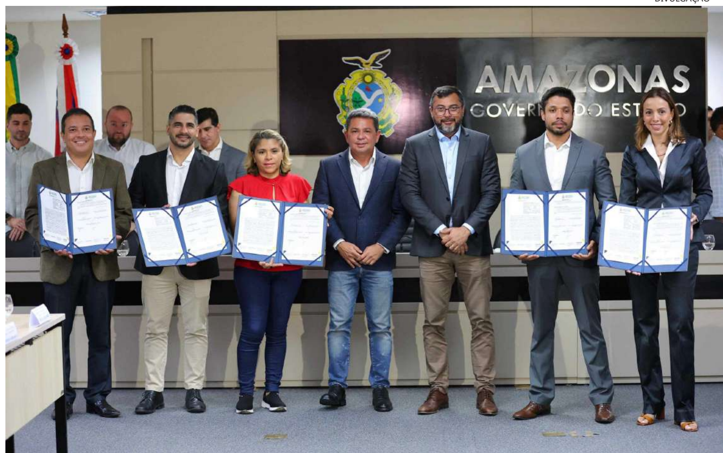
Serão ofertadas 1.106 unidades habitacionais em 13 empreendimentos já construídos, ou em construção

A assinatura foi realizada na sede do Governo do Estado, com