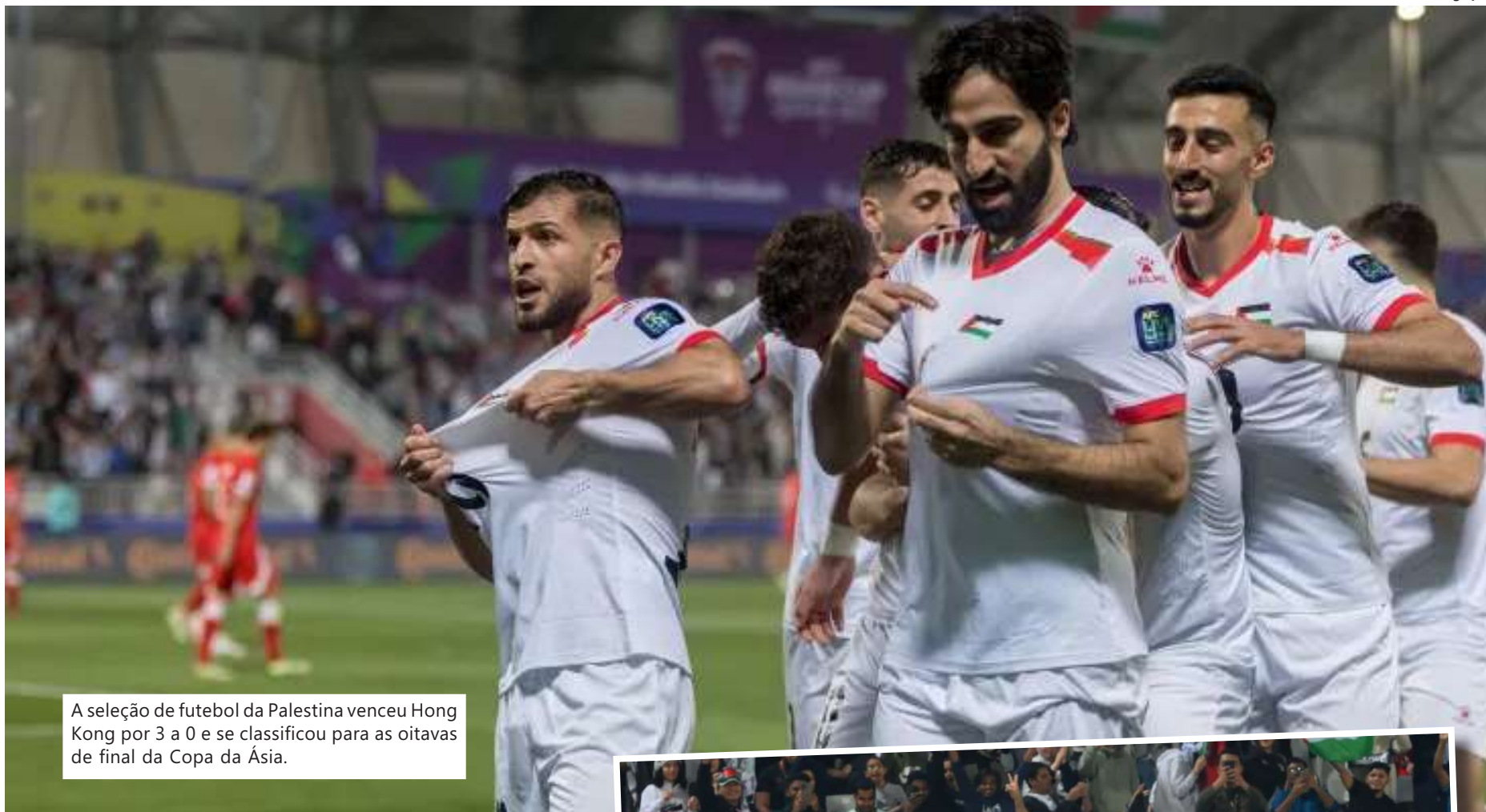
A seleção de futebol da Palestina venceu Hong Kong por 3 a 0 e se classificou para as oitavas de final da Copa da Ásia.

Seleção conseguiu sua primeira vitória no torneio e, de quebra, a classificação para as oitavas