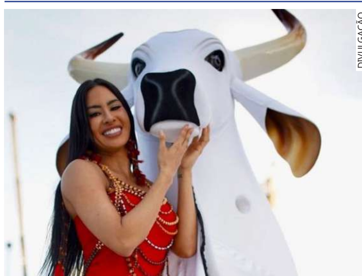
Sucesso da Cunhã no BBB chega ao parlamento municipal

A honraria medalha Mérito Cultural "Jair Mendes", maior da Casa Legislativa, deve ser votada para a sister após o recesso, que termina em fevereiro.