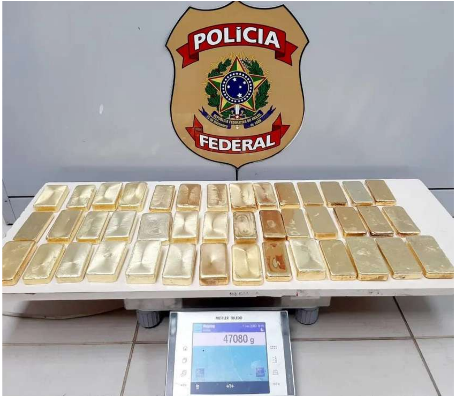
PM apreende 47 kg de ouro do garimpo ilegal em Manaus e PF diz que é a maior apreensão da história do Amazonas

Doblò interceptando o Gol, até que um homem sai e atira. A equipe da Rocam foi acionada em seguida, mas quando os policiais chegaram ao local, os atiradores já tinham fugido e abandonado o carro. Até a publicação desta matéria, nenhum dos