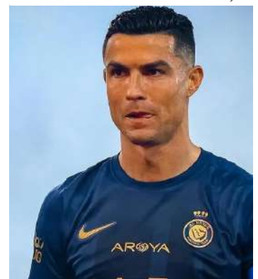
Cristiano Ronaldo sofreu lesão na panturrilha