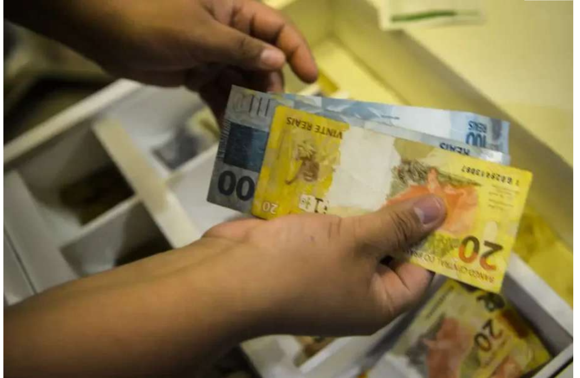
Em dezembro do ano passado, a arrecadação totalizou R$ 232,22 bilhões

o resultado o desempenho da arrecadação da Receita Previdenciária, que registrou crescimento real de 5%, e o crescimento real de 21,60% da arrecadação do Imposto sobre a Renda Retido na Fonte Capital (IRRF), especialmente nos itens títulos e fundos de renda fixa.