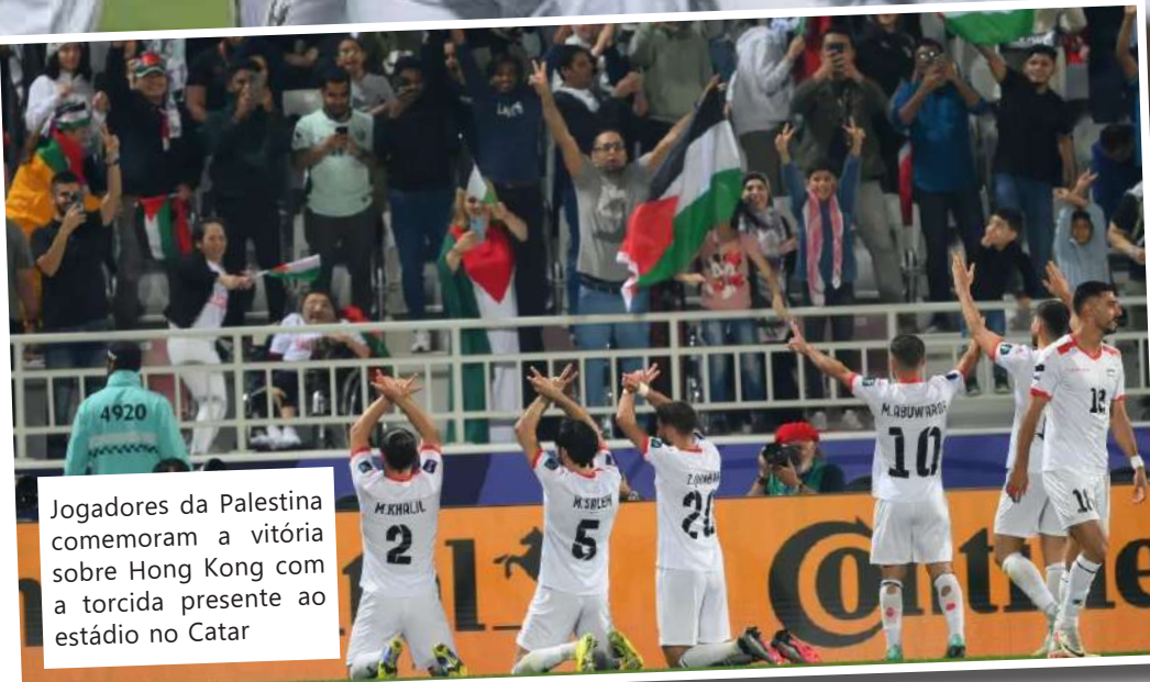
Jogadores da Palestina comemoram a vitória sobre Hong Kong com a torcida presente ao estádio no Catar

A guerra em Gaza, iniciada em outubro, obviamente