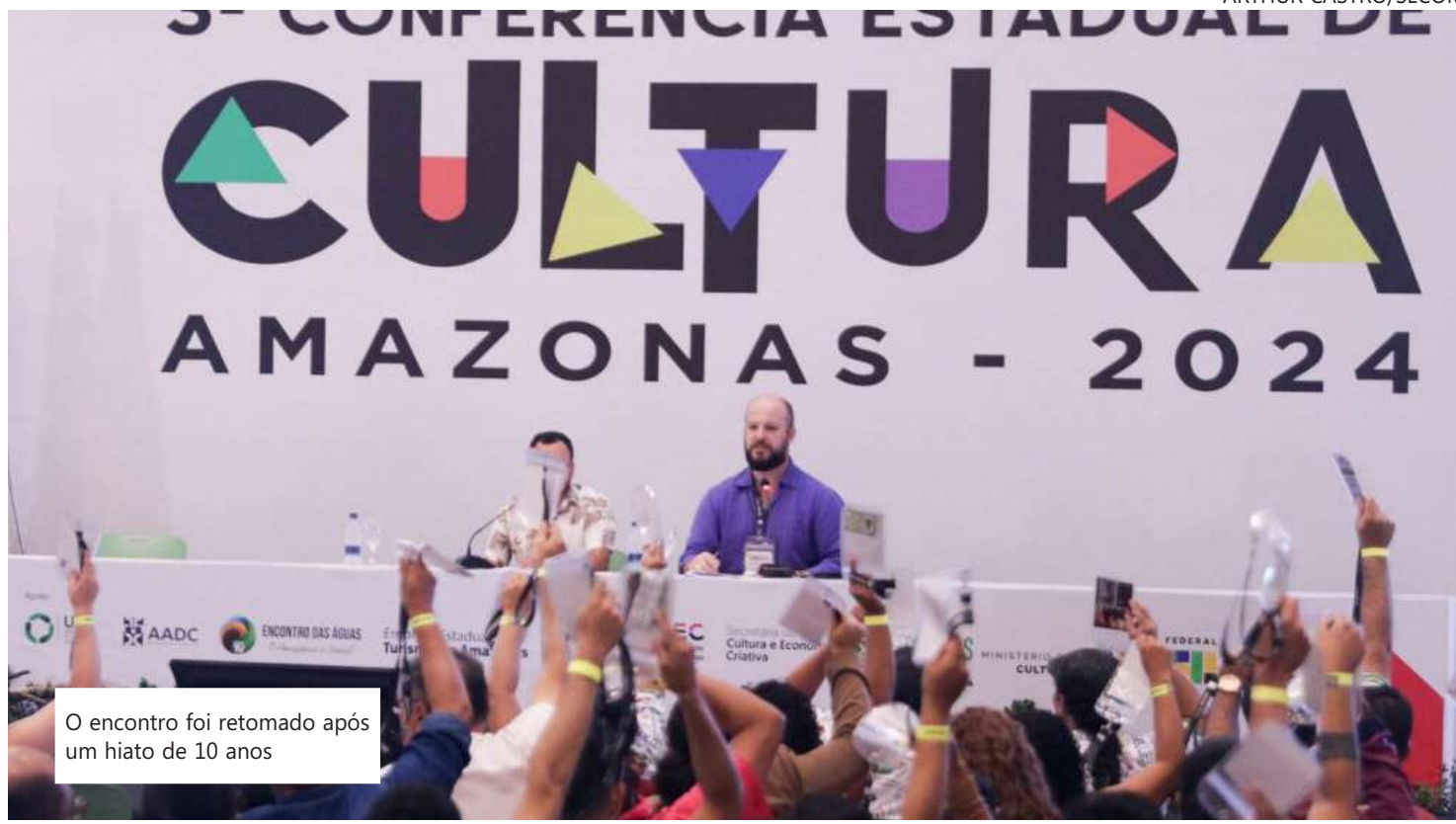
O encontro foi retomado após um hiato de 10 anos

A conferência, promovida pelo Governo do Estado, por meio da Secretaria de Cultura e Economia Criativa, aconteceu de 21 a 23 de janeiro no Centro de Convenções Vasco Vasques. O evento de colaboração interinstitucional teve o apoio do Conselho Estadual de Cultura, Universidade Estadual do