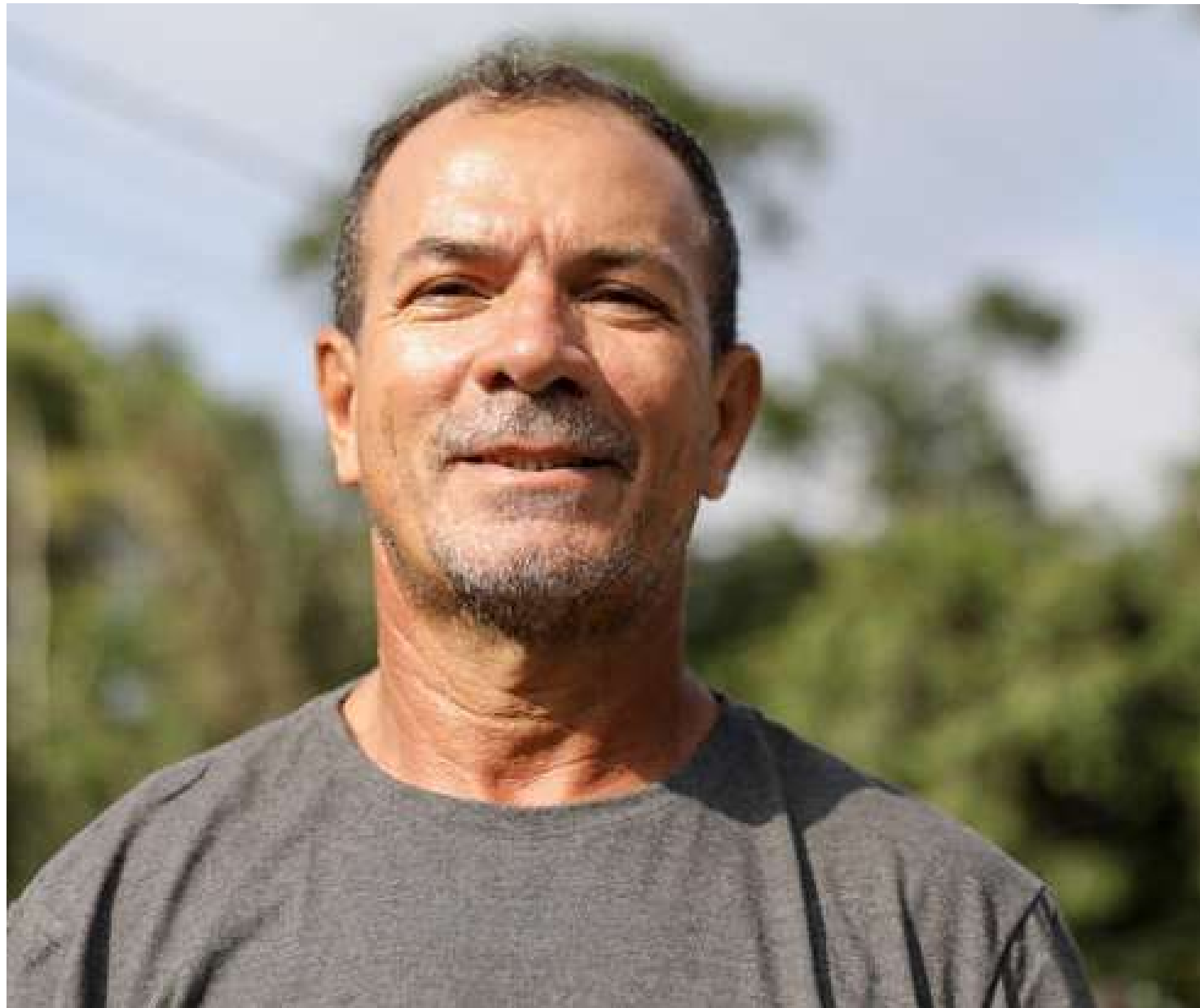
Moradores dos ramais Nova Esperança, Anjo Gabriel e Parú, no KM 62 da rodovia estadual AM-070, zona rural de Manacapuru