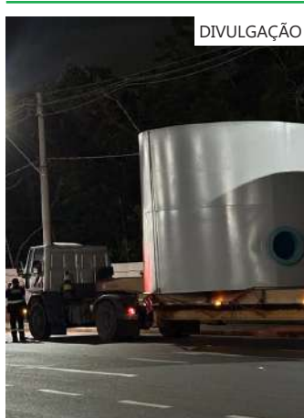
As autuações ocorreram na noite de terça-feira (23/01), no bairro Tarumã, zona oeste da capital

Também durante a ação da Fiscalização do Detran-AM, na noite de terça-feira, outro caminhão foi removido por transporte de carga de forma irregular. O veículo estava transportando um carregamento de paletes (estrado de madeira) com fitas de nylon puídas e presas de forma incorreta.