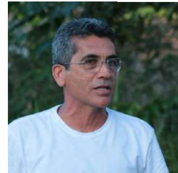
Diploma de Lúcio Flávio segue cassado