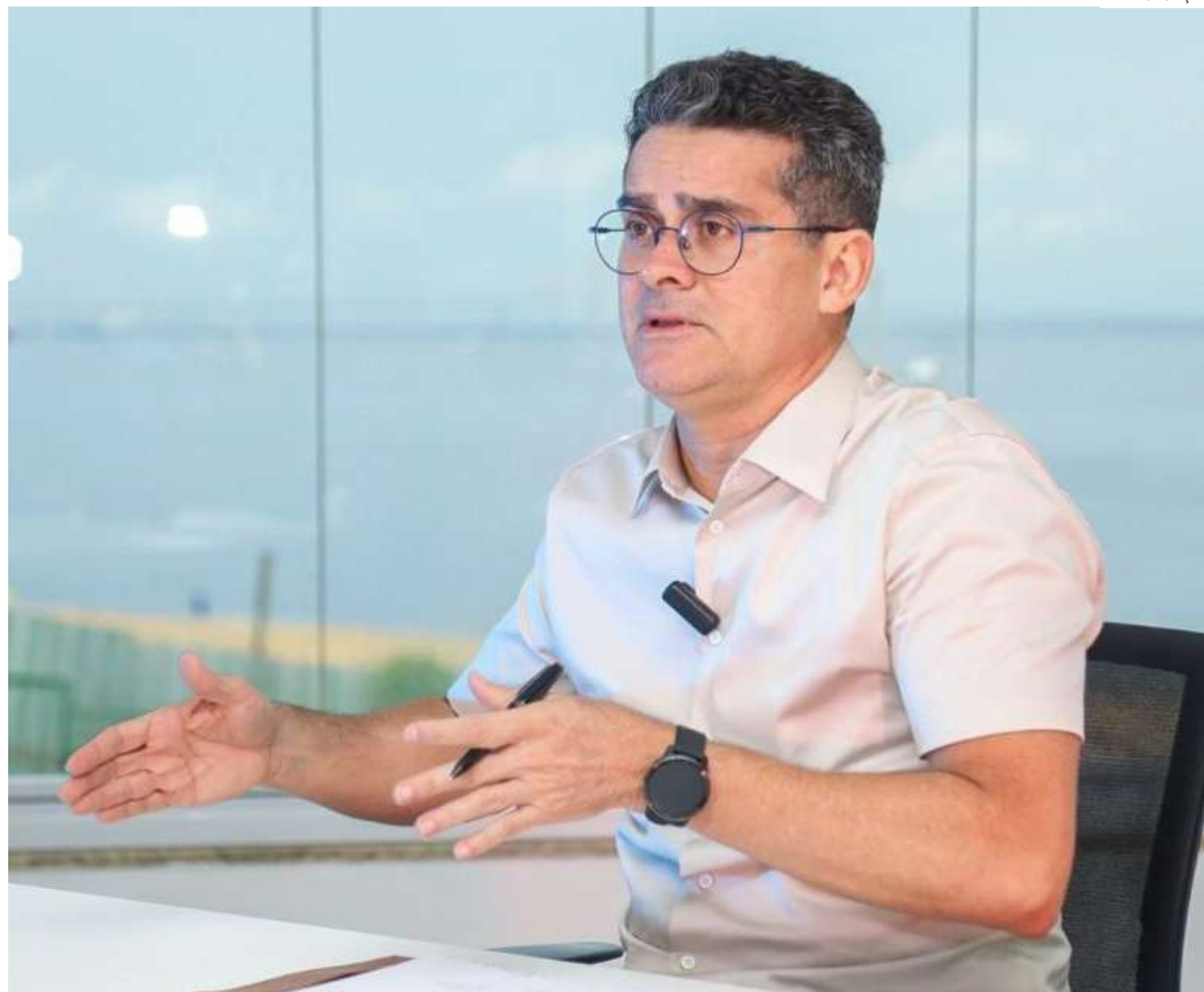
David Almeida volta a ter seu mandato marcado por investigação na Corte de Contas