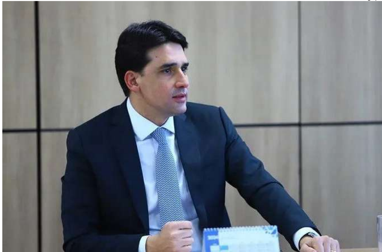
Ministro também disse que o governo vai criar um fundo de até R$ 6 bilhões para financiar companhias aéreas do país

O "Voa Brasil" será anunciado dia 5 de fevereiro pelo presidente da República. Passa a valer dia 5 de fevereiro. Eu quero agradecer à Abear (Associação Brasileira das Empresas Aéreas) e a todas as companhias aéreas que estão ajudando na construção do "Voa Brasil" Silvio Costa Filho