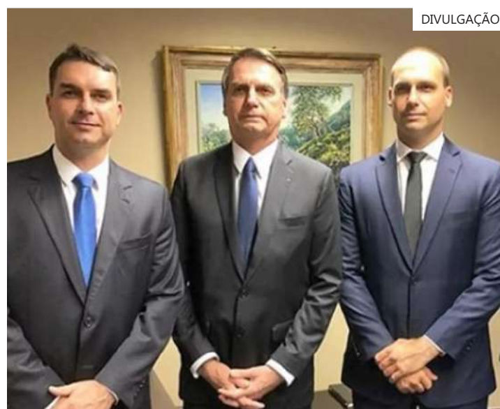
Bolsonaro promete mostrar que segue forte em engajamento nas redes sociais