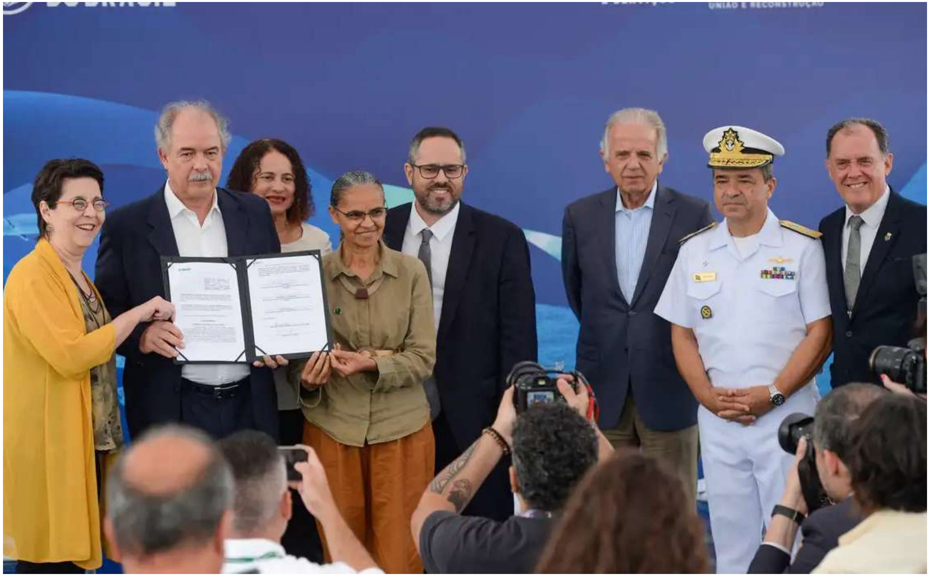
Além das novas frentes, o banco dispõe de cerca de R$ 22 bilhões em carteira

Segundo o presidente do BNDES, Aloizio Mercadante, o objetivo é colocar o mar de volta no centro da agenda estratégica nacional para fortalecimento da indústria naval e o aprofundamento de pesquisas marinhas no país. "Os interesses que estão nos oceanos, especialmente para um país com 8,5 milhões de quilômetros de costa, são de-