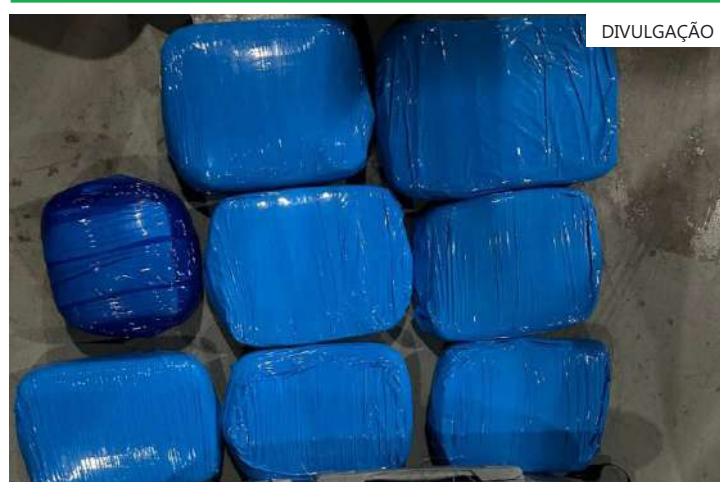
As apreensões são as primeiras realizadas pela base flutuante após reinício das operações

27 anos, responsável pela mala, afirmou que não sabia o que carregava. Ele disse que receberia uma quantia de R$ 2 mil, após a entrega a um cidadão que aguardava no município de Tefé.