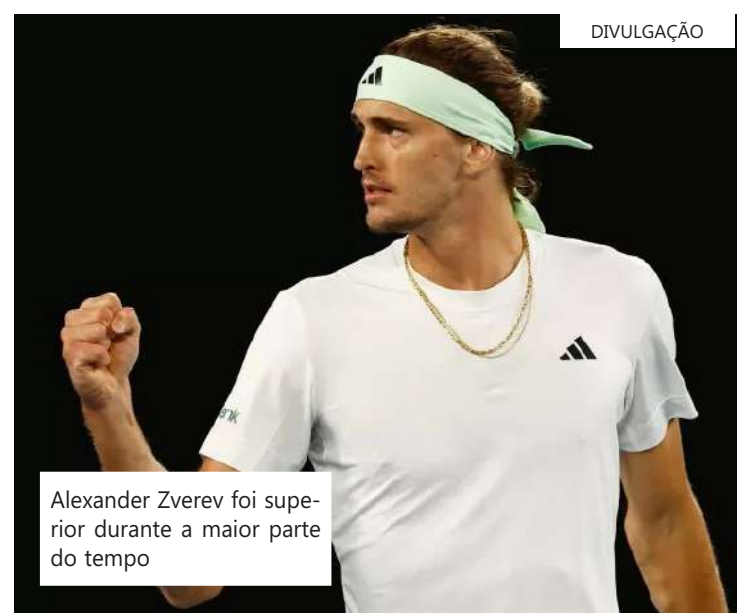
Alexander Zverev foi superior durante a maior parte do tempo

meçou, Alcaraz parecia perdido taticamente. Tentava curtinhas e subidas à rede, mas escolhia mal quando usar as alternativas. Enquanto isso, Zverev seguia sacando bem, com mais de 80% de aproveitamento de primeiro saque, e apostando em trocas mais longas do fundo de quadra. Os erros de Alcaraz continuavam aparecendo, e Sascha anotou mais uma quebra no quarto game. Pouco depois, confirmou o saque mais uma vez e abriu 4/1. Na hora de fechar, porém, Alcaraz finalmente deu sinais de vida. Conseguiu quebrar de volta e teve a chance de sacar em 4/5 para empatar a parcial. Pouco depois, fez 5/5. A parcial só foi decidida no tie-break, e Carlitos abriu o game com dois erros, mas compensou com quatro pontos perfeitos