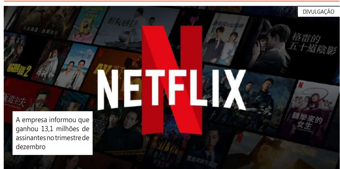
A empresa informou que ganhou 13,1 milhões de assinantes no trimestre de dezembro

priedade intelectual, como "Round 6: O Desafio", um reality show baseado em sua série mais assistida, novas séries originais, como "Toda Luz que Não Podemos Ver", filmes como "Rebel Moon - Parte 1: A Menina do Fogo" de Zack Snyder, e a programação em idiomas não ingleses, incluindo a terceira temporada de "Lupin" da França.