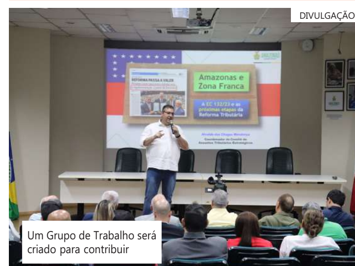
Um Grupo de Trabalho será criado para contribuir

"Fomos vitoriosos em relação à Emenda Constitucional (132/2023), que veio com vários fatores que são favoráveis ao Amazonas, mas que traz uma série de preocupações, porque depende de lei complementar, o que ainda pode causar incertezas jurídicas nesse processo", ponderou o secretário.