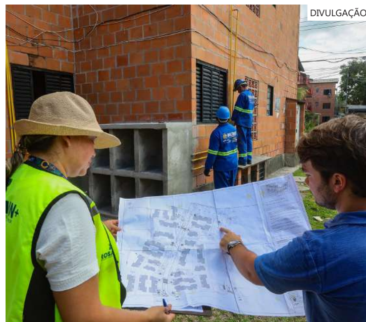
As intervenções são necessárias para a regularização fundiária dos antigos habitacionais do Prosamín

Na inspeção, o Corpo de Bombeiros considerou que as intervenções de segurança predial executadas pela UGPE no habitacional estão dentro do padrão exigido.