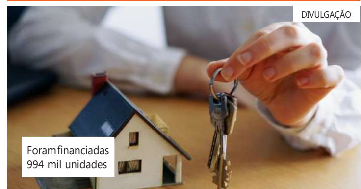
Foram financiadas 994 mil unidades

"Mesmo com a queda, o crédito SBPE poupança teve o terceiro melhor ano da série em 2023", disse Gamba. No ano passado, foram financiadas 994 mil unidades habitacionais no Brasil, sendo que 500 mil receberam o crédito através da poupança e o restante via FGTS.