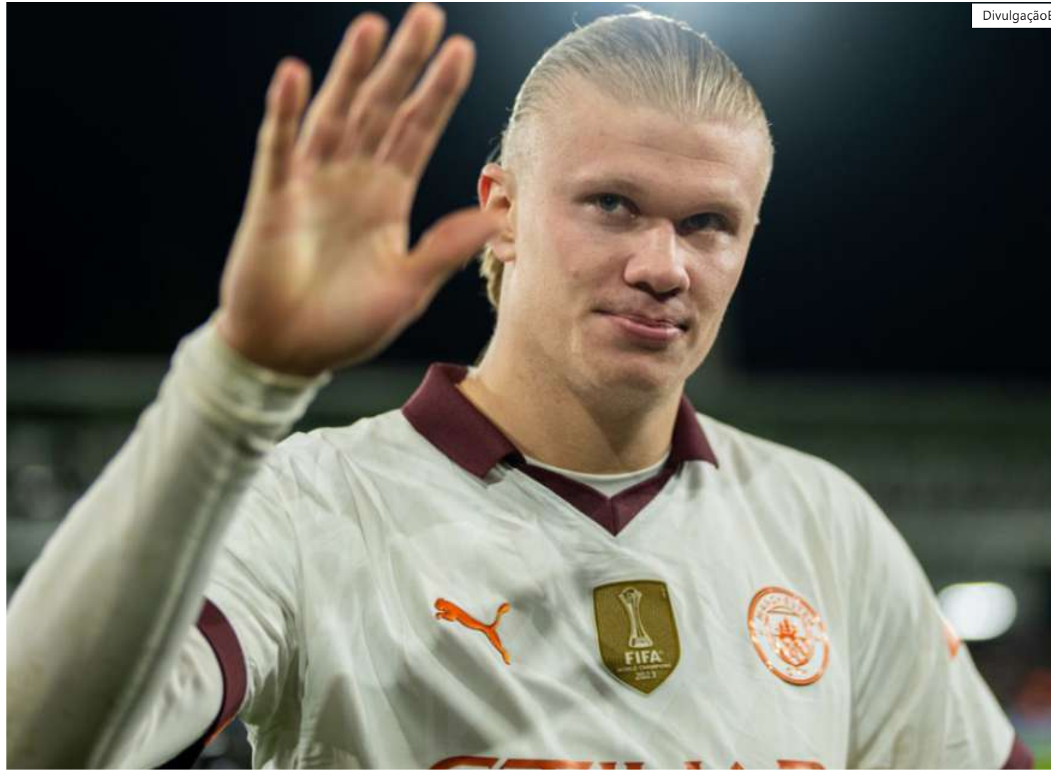
Haaland marcou cinco gols em um único jogo

"Kevin precisa de jogadores como Erling e Erling precisa de jogadores como Kevin. Não estamos aqui sem