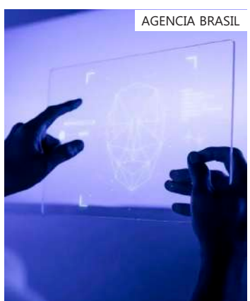
Medida é para evitar circulação de fake news e montagens

Para combater a desinformação durante a campanha, o TSE vai determinar que as redes sociais deverão tomar medidas para impedir ou diminuir a circulação de fatos inverídicos, ou descontextualizados. As plataformas que não retirarem conteúdos antidemocráticos e com discurso de ódio, como falas racistas, homofóbicas ou nazistas, serão responsabilizadas.