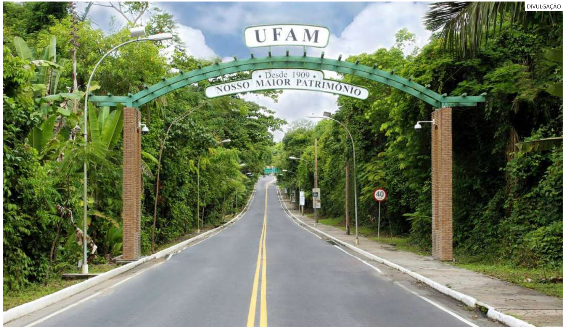
Universidade Federal do Amazonas fica em área de floresta urbana

Além disso, o desembargador destaca que "discriminação alguma pode ser feita entre eles, simplesmente em razão da área espacial em que estejam sediados", já que o motivo para a concessão do bônus de 20% é em virtude da disparidade educacional do Amazonas com outros estados brasileiros.