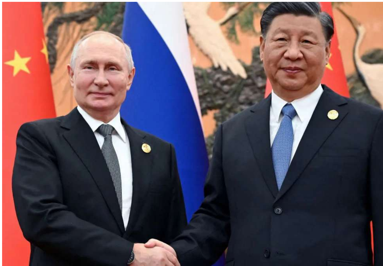
Vladimir Putin e Xi Jinping em Pequim

"Qualquer pessoa que se preocupa com a democracia, qualquer pessoa que se preocupa com os direitos huma-