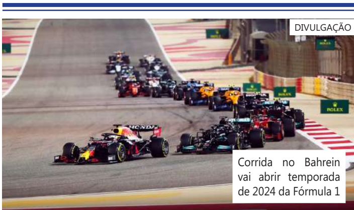
Corrida no Bahrein vai abrir temporada de 2024 da Fórmula 1

A temporada de 2024, depois do início no "Mundo Árabe", vai para a Austrália. O GP disputado em Melbourne, será no dia 24 de março. O calendário da F1 prevê 24 provas ao longo do ano. A última etapa será em Abu Dhabi, no dia 8 de dezembro.