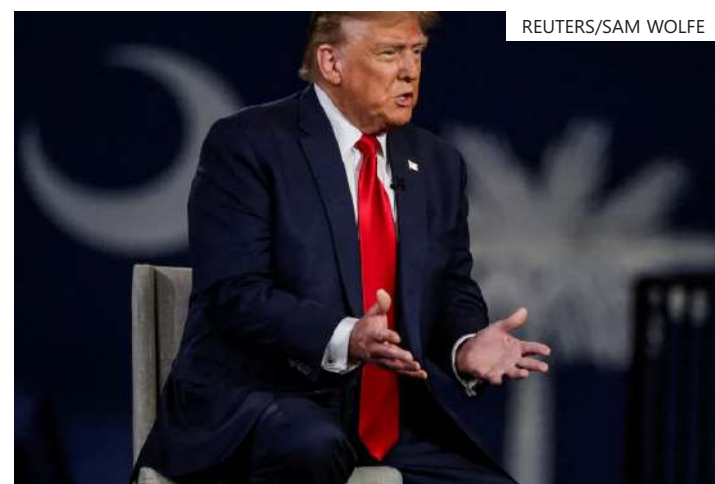
Cohen deve ser uma testemunha-chave contra Trump

Cohen se declarou culpado em 2018 de violar leis federais de financiamento de campanha pelo pagamento a Daniels, que excedeu os limites de contribuição, e de ter mentido para o Congresso.