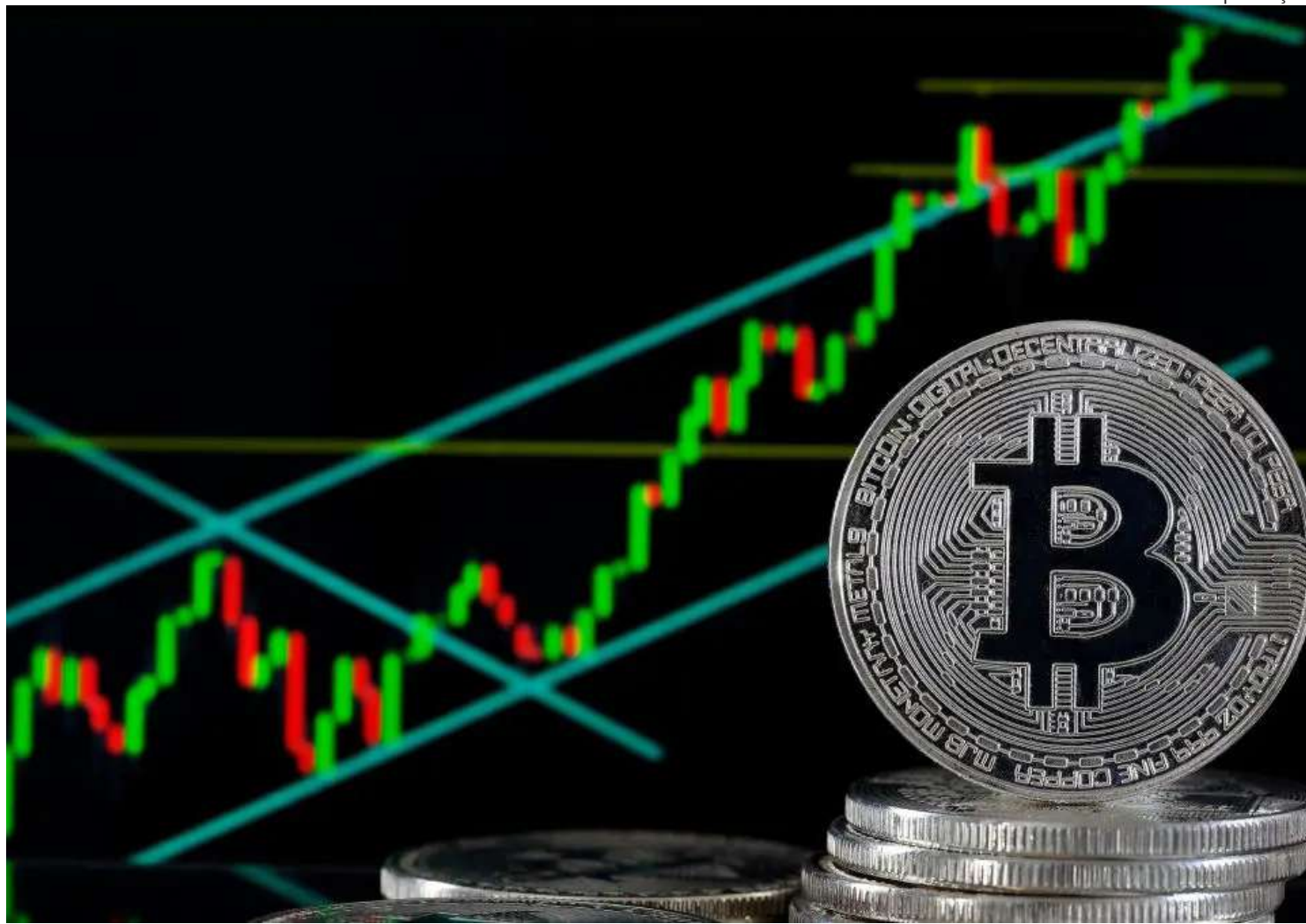
Bitcoin (BTC) avançou pelo quinto dia consecutivo

Por volta da 10h40 desta quarta-feira (28), a criptomoeda opera em alta de +6,40%,