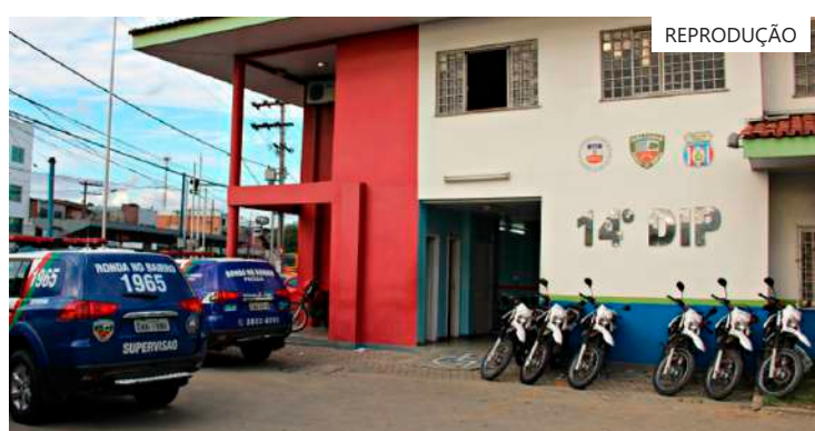
Dupla estava com mais de 4 mil reais em dinheiro

Os suspeitos foram imediatamente detidos e encaminhados para o 14º Distrito Integrado de Polícia (DIP), onde ficam à disposição da justiça para as devidas providências legais. A operação reforça o compromisso das autoridades em combater o tráfico de drogas e garantir a segurança da população na região.