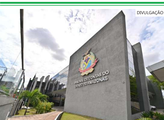
Tribunal de Contas do Estado do Amazonas

A Corregedoria-Geral do TCE atua na fiscalização do efetivo cumprimento das deliberações, assim como o desempenho, a postura, o comportamento ético, a produção e a produtividade dos setores.