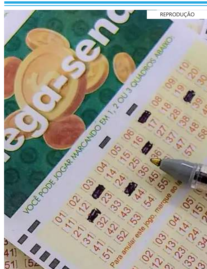
Números sorteados foram 11 - 29 - 44 - 45 - 46 - 50

O jogo simples, com seis números marcados, custa R$ 5.