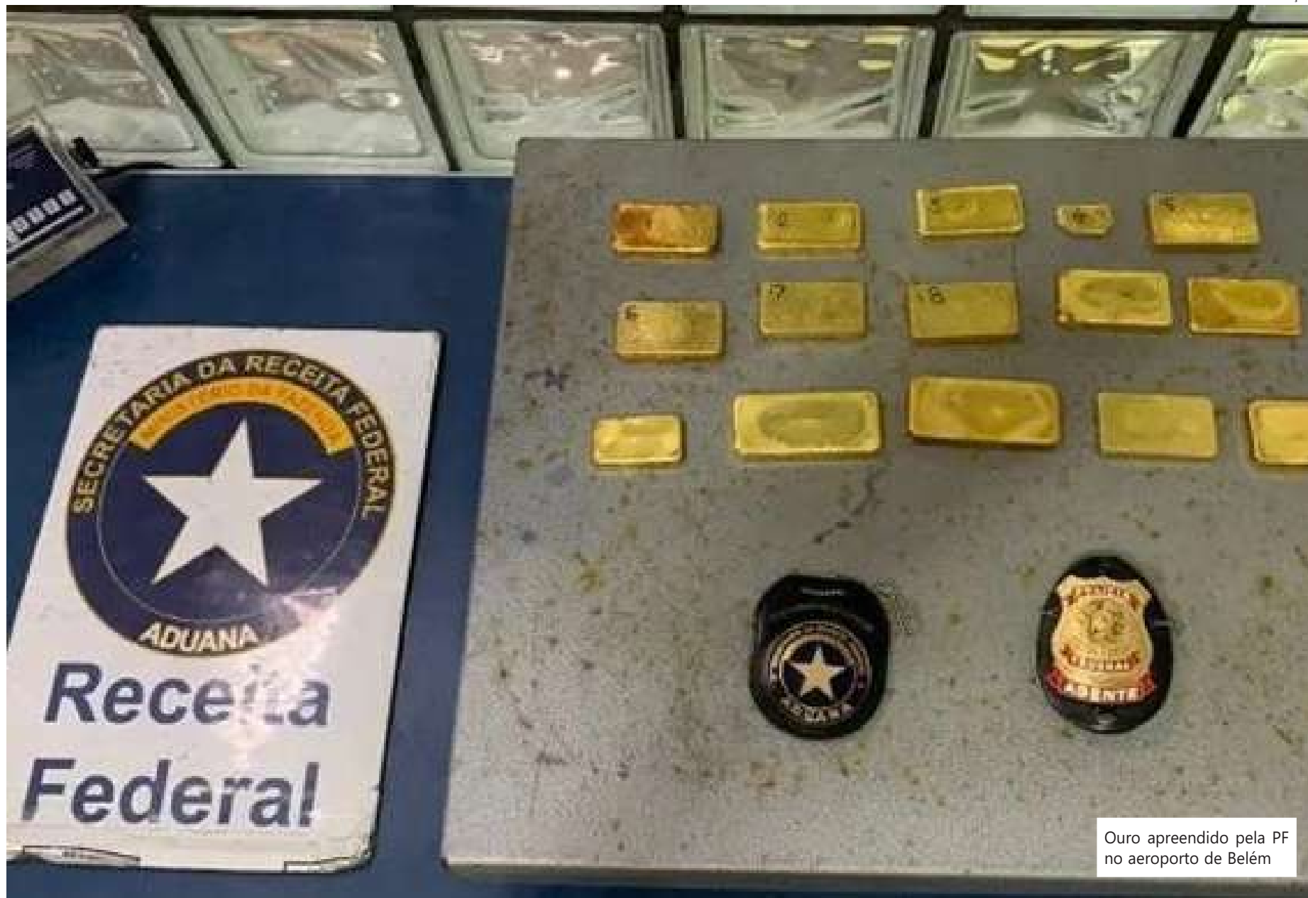
Ouro apreendido pela PF no aeroporto de Belém

Uma pessoa foi presa e 13 mandados de busca e apreensão cumpridos nesta quarta-feira em quatro estados