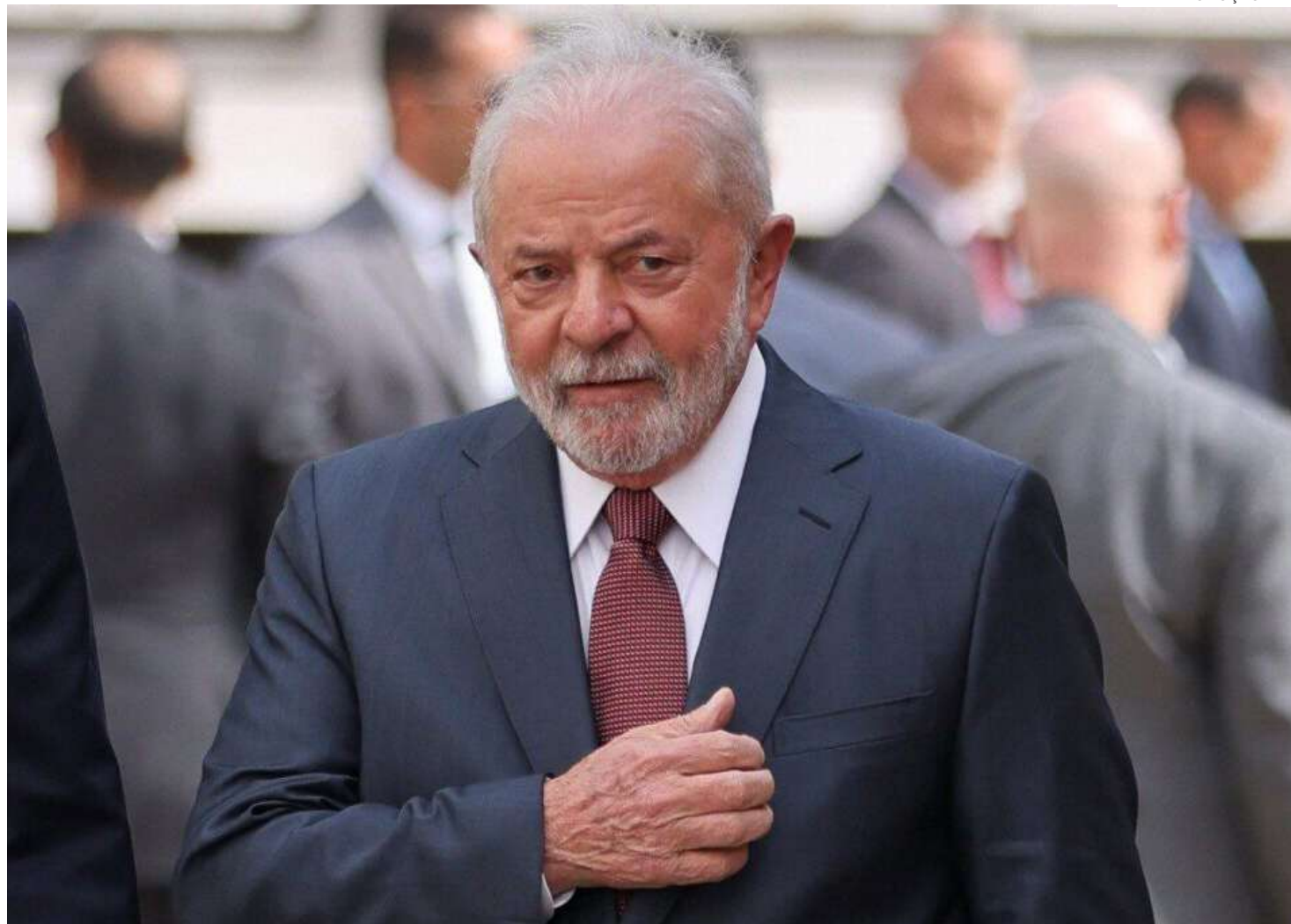
Lula foi convidado para discursar no encerramento da cúpula

A presidência brasileira no grupo está baseada em um