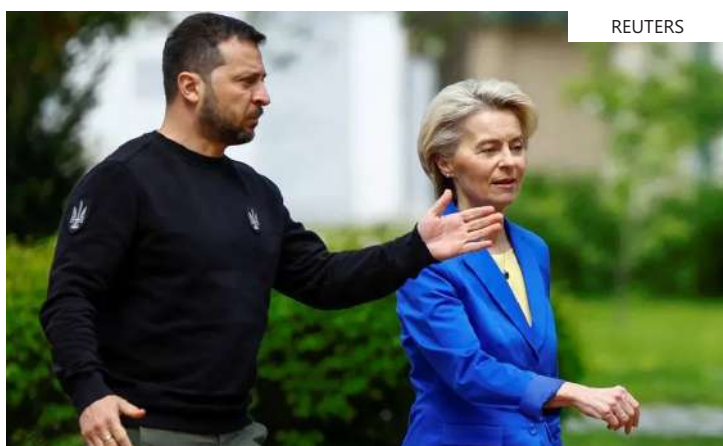
O presidente da Ucrânia, Volodymyr Zelensky, caminha com a presidente da Comissão Europeia, Ursula von der Leyen

"Na verdade, uma UE mais soberana, em particular na defesa, é vital para fortalecer a OTAN", disse ela.