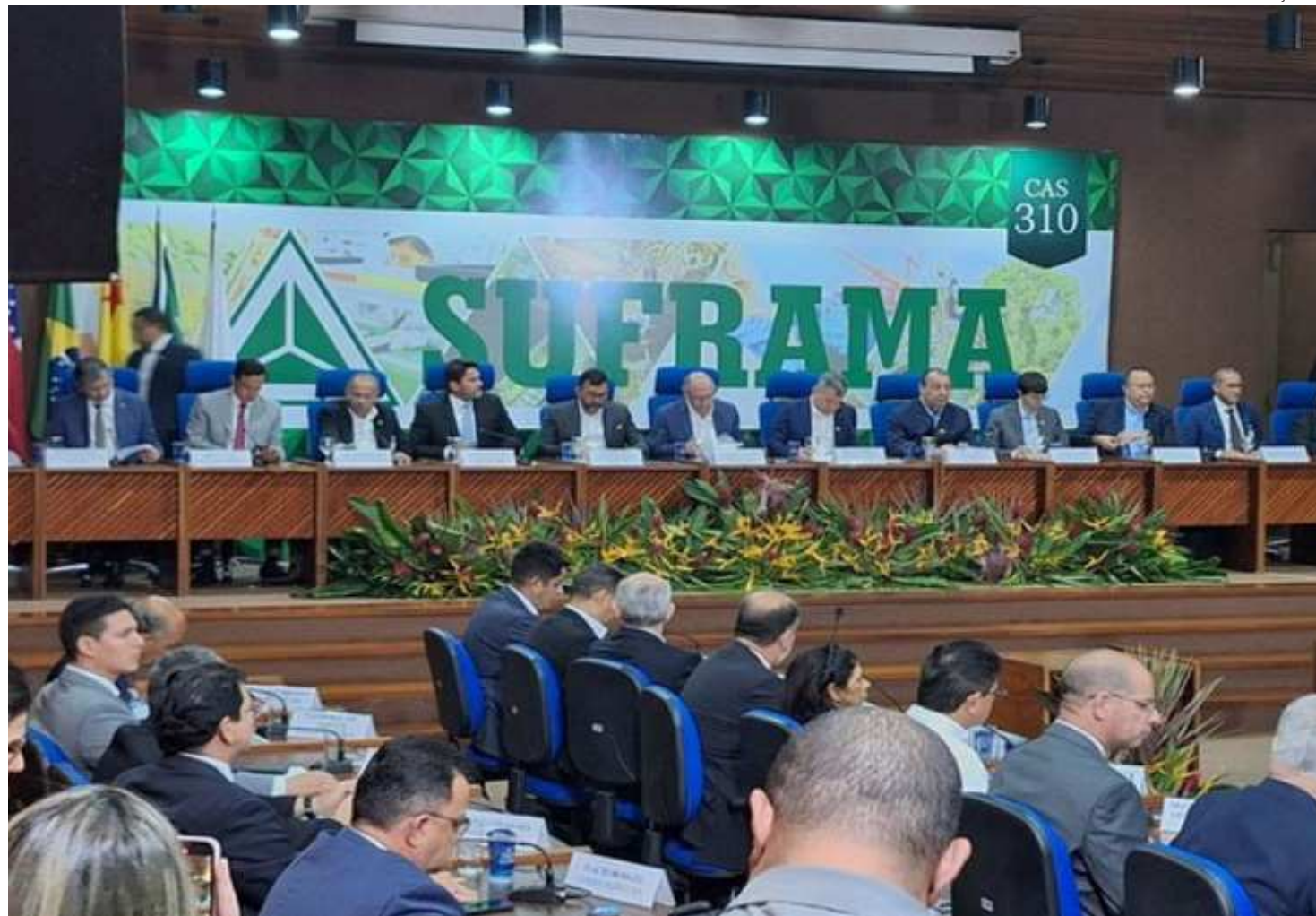
313ª Reunião Ordinária, no auditório da Autarquia

contará com a participação do superintendente da Suframa, Bosco Saraiva, o ministro de Empreendedorismo, da Microempresa e da Empresa de Pequena Porte, Márcio França, além de autoridades, parlamentares, representantes de entidades de classe e governantes da