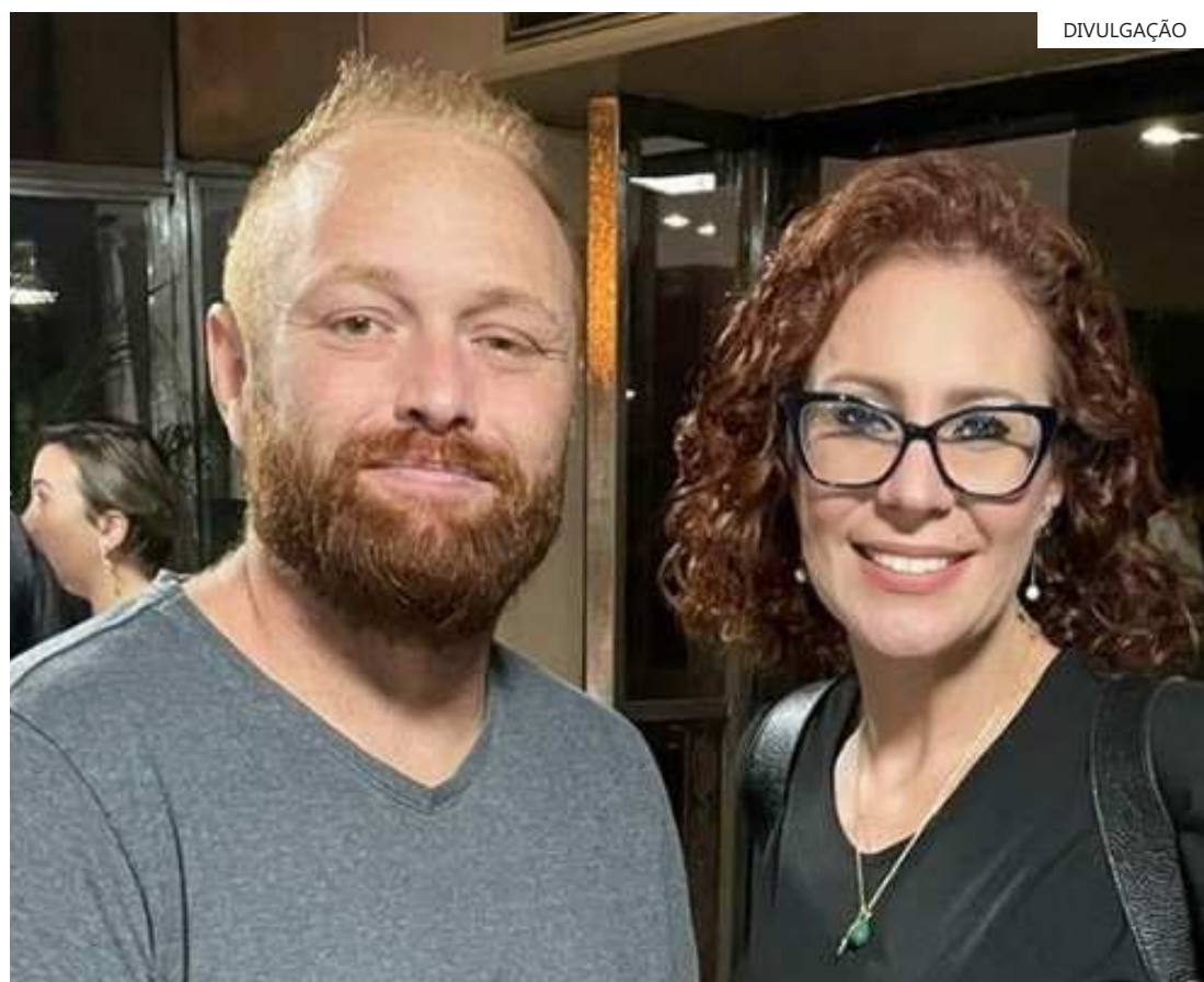
Deputada vai responder na Justiça por supostos atos ilegais

"A arbitrária interpretação deduzida pela autoridade policial asseverando que a deputada tenha recebido eventualmente documentos não evidencia adesão ou qualquer tipo de colaboração, ainda mais que ficou demonstrado que não houve qualquer encaminhamento a terceiros, bem como ficou igualmente comprovado que incorreram repasses de valores [a Delgatti ou outros investigados]", conclui o advogado.