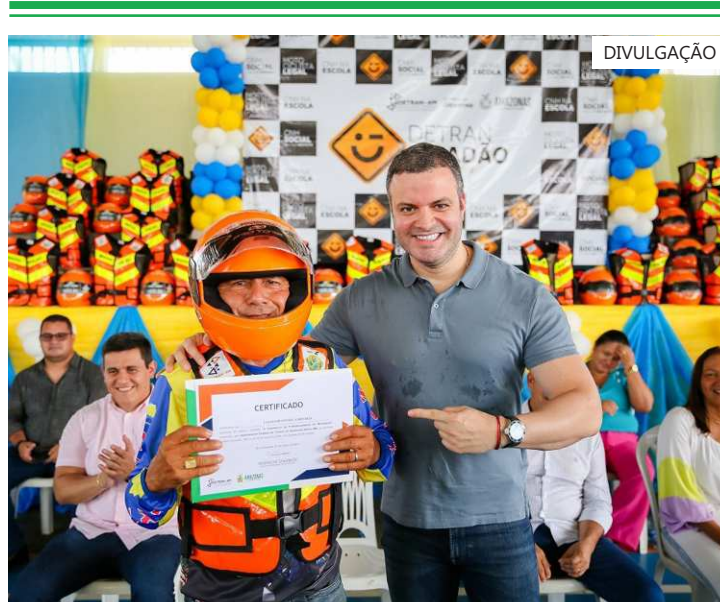
Programa "Detran Cidadão no Interior" está em sua 14ª edição

O programa "Detran Cidadão no Interior" está em sua 14ª edição. A equipe da instituição chegou ao município nesta terça-feira (27/02) e segue com uma programação até sábado (02/03). Ainda serão promovidas palestras, capacitações e blitze educativas.