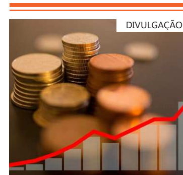
A queda de 1,2% das importações também contribuiu para o resultado

Na passagem do terceiro para o quarto trimestre do ano, o PIB manteve-se estável. Já na comparação do quarto trimestre de 2023 com o mesmo período do ano anterior, houve alta de 2,1%.