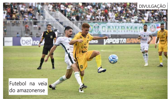
Futebol na veia do amazonense

Data e hora: Sábado (02/03), às 13h Entrada: Gratuita