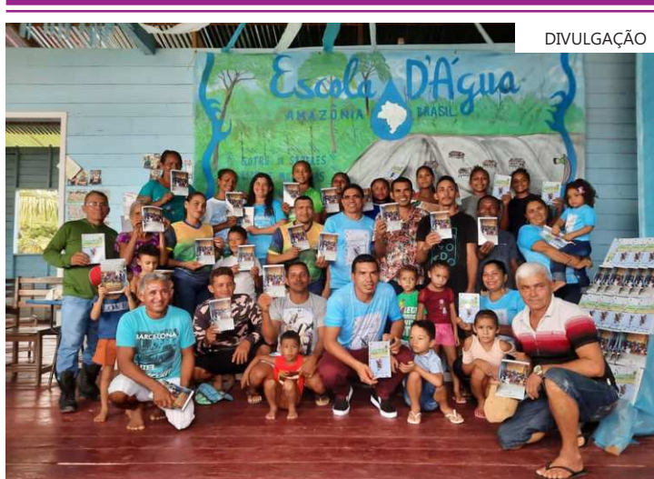
O "Semente Materna Poética" já transformou mais de 100 alunos em escritores, nos últimos anos