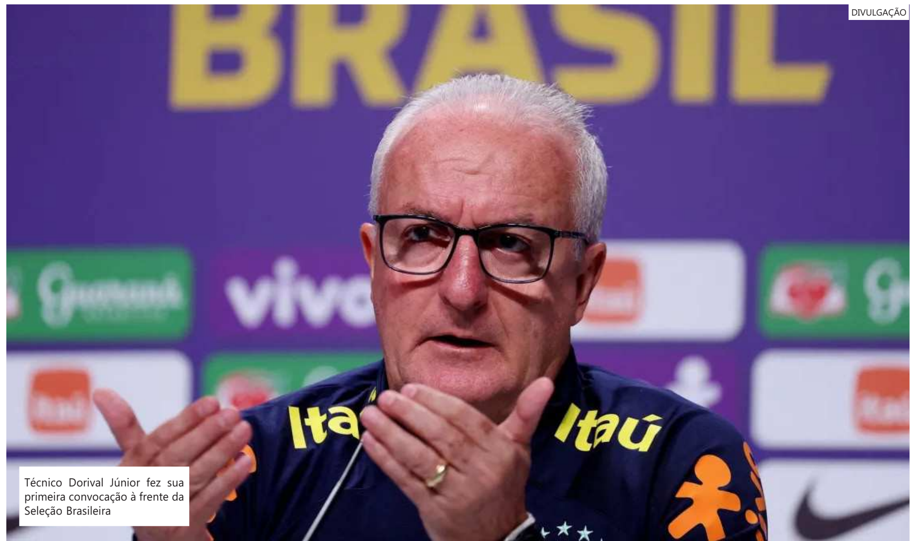
Técnico Dorival Júnior fez sua primeira convocação à frente da Seleção Brasileira

"Temos alguns jogadores com funções, Andreas, Paquetá, os próprios volantes,