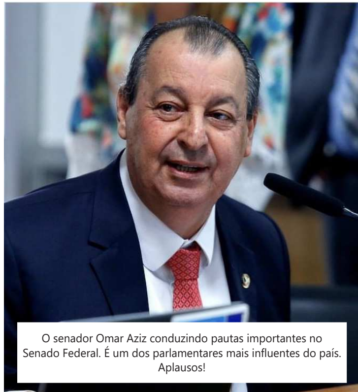
O senador Omar Aziz conduzindo pautas importantes no Senado Federal. É um dos parlamentares mais influentes do país. Aplausos!