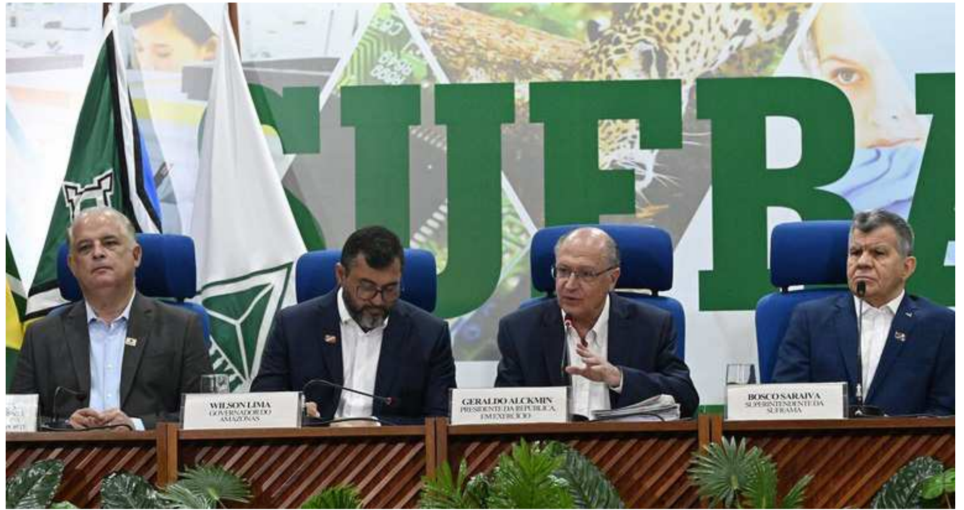
Reunião celebrou os 57 anos da Autarquia e da Zona Franca de Manaus (ZFM), a manutenção das vantagens comparativas do modelo