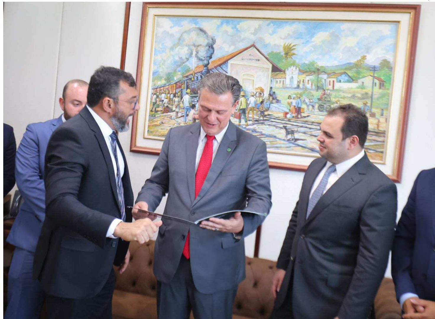
Encontro foi considerado um sucesso e um marco para o Amazonas

"Acabamos de receber uma notícia muito importante do ministro Fávaro e também de toda sua equipe que, depois da análise feita, da análise técnica, já há uma