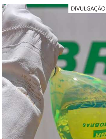
Novo percentual ajuda na redução de emissão de gases poluentes

A próxima alteração no percentual de mistura do biodiesel será em 1º de março de 2025, quando o diesel passará a ter 15% de biodiesel (B15).