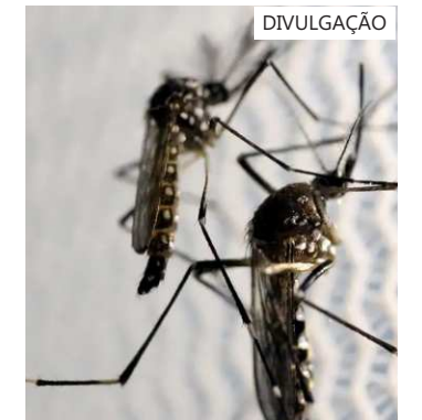
521 municípios foram escolhidos pelo Governo Federal para receber vacina

Isabella foi levada à tenda de atendimento montada na Ceilândia, região administrativa do Distrito Federal, e, na sequência, foi diagnosticada e encaminhada para a UBS 7.