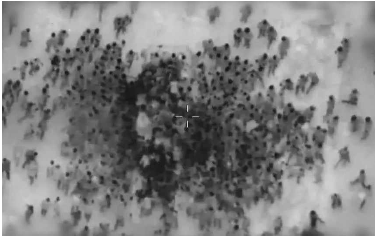
Pessoas em Gaza se aglomerando ao redor de caminhões de ajuda humanitária

Um comboio de pelo menos 18 caminhões chegou