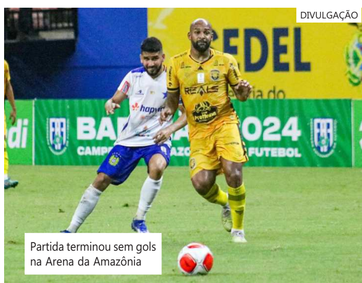
Partida terminou sem gols na Arena da Amazônia

na segunda rodada e só volta a campo também diante do Manaus pela terceira rodada, com data, local e horário a serem definidos pela FAF. "Os detalhes ainda não estão marcados por conta da campanha do adversário na Copa Verde", explica a federação.