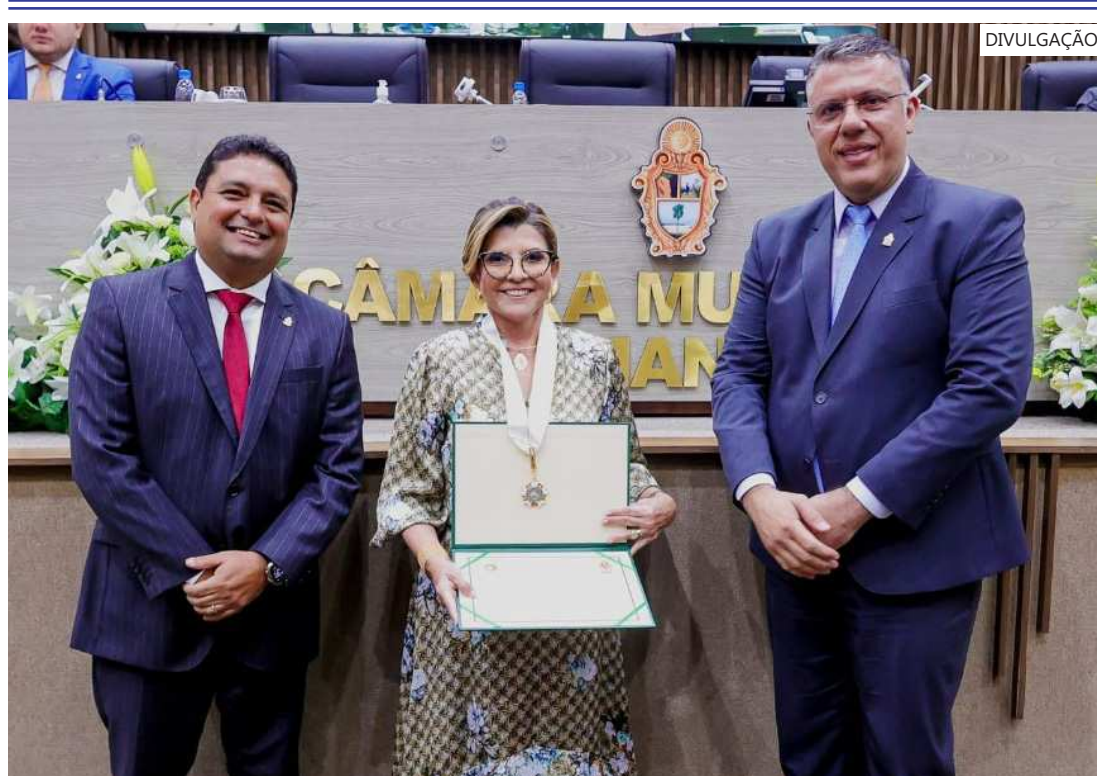
Desembargadora foi reconhecida por serviços relevantes prestados no Amazonas