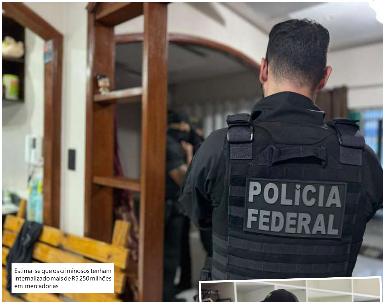
Estima-se que os criminosos tenham internalizado mais de R$ 250 milhões em mercadorias

Policiais federais cumprem os mandados de prisão e de busca e apreensão, no Amazonas, em Minas Gerais e no Paraná. Os alvos da operação poderão responder pelos crimes de associação criminosa, estelionato previdenciário, falsificação e uso de documentos falsos, com penas que podem chegar a