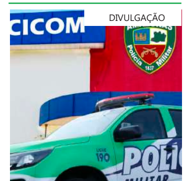
A mãe relatou que o filho de criação havia acariciado partes íntimas da vítima

A Polícia Militar do Amazonas orienta a população que informe imediatamente ao tomar conhecimento de qualquer ação criminosa, por meio do disque denúncia 181 ou pelo 190. A identidade do denunciante será mantida em sigilo.