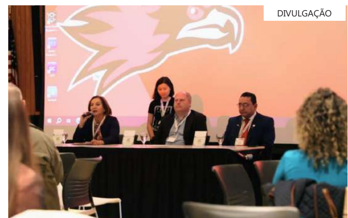
Destaque internacional do Amazonas, desembargadora está nos EUA

No último dia de evento os participantes farão visita guiada à Instituição para conhecerem projetos de pesquisa e ações da instituição em prol da preservação ambiental e do desenvolvimento sustentável.