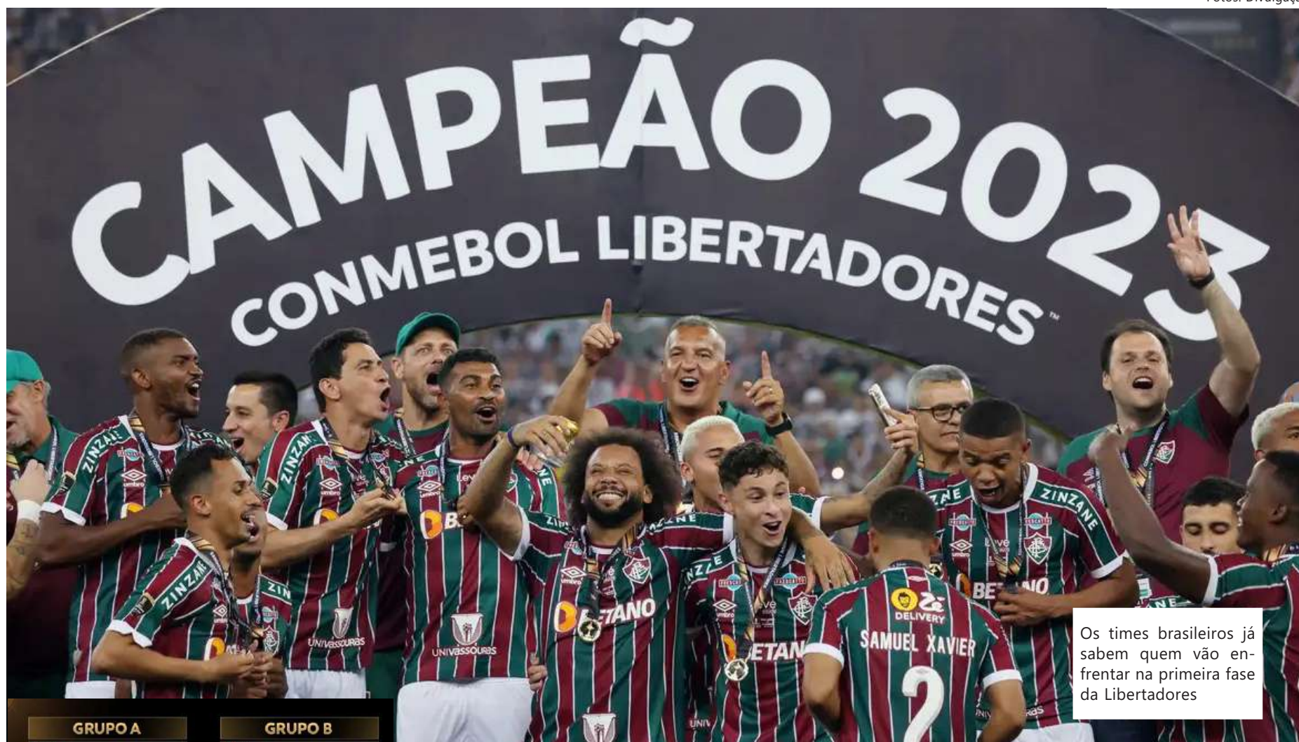
Os times brasileiros já sabem quem vão enfrentar na primeira fase da Libertadores