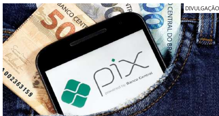
Dados protegidos por sigilo, como saldos e senhas, não foram afetados

A exposição de dados não significa necessariamente que todas as informações tenham vazado, mas que ficaram visíveis para terceiros durante algum tempo e podem ter sido capturadas. O BC informou que o caso será investigado e que sanções poderão ser aplicadas. A legislação prevê multa, suspensão ou até exclusão do sistema do Pix, dependendo da gravidade do caso.