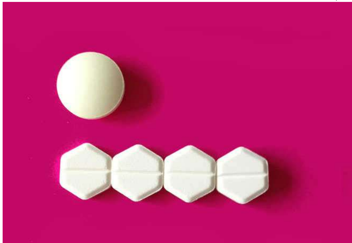
Pílulas abortivas - Mifepristona

À medida que a geografia da assistência ao aborto mudou em meio a um cenário político fragmentado, o aumento de 10% nos abortos em todo o país significou que os estados sem proibições totais tiveram um aumento de 25%