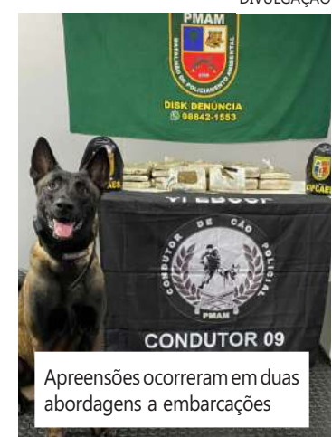
Apreensões ocorreram em duas abordagens a embarcações