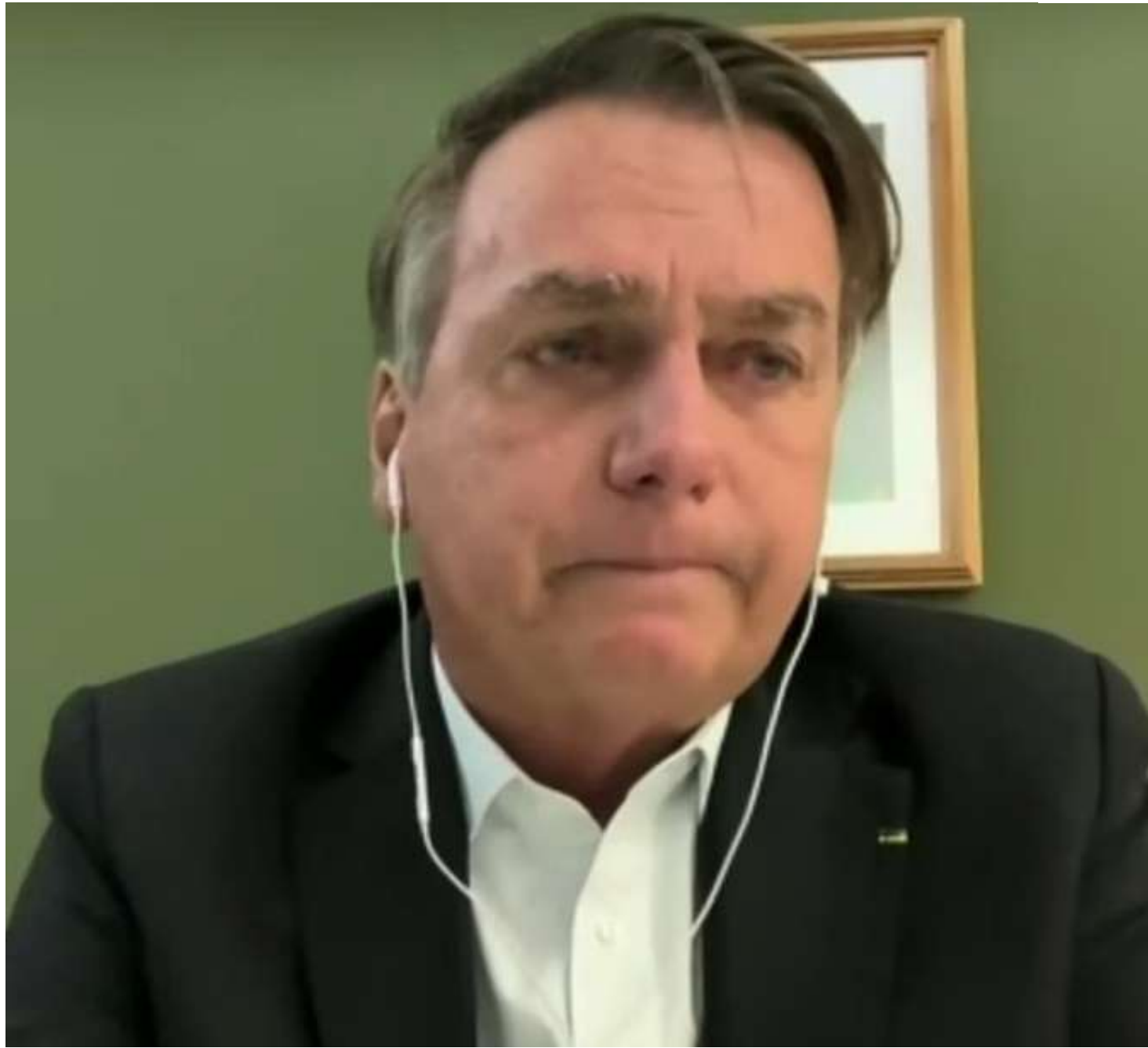
Bolsonaro diz que não tem medo, mas pede julgamento justo