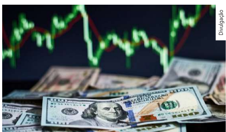
A expectativa é de que qualquer sinalização mais dura ou cautelosa do Fed em relação às pressões de preços impulse o dólar globalmente

“O Copom deverá sinalizar este movimento com uma pequena, mas importante mudança no comunicado que se seguirá à reunião desta semana. Em especial, a afirmação de que novas quedas da taxa de juros de mesma magnitude deverão ser implementadas nas próximas reuniões deverão ser alterada.”