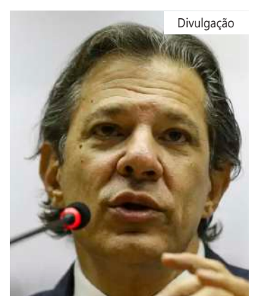
Segundo Haddad, tributação de dividendos ficará para depois

“No fim de dezembro, já estávamos cumprindo a norma constitucional”, disse Haddad ao deixar o Ministério da Fazenda. O ministro explicou que o governo optou por fatiar a reforma tributária sobre a renda em diversos projetos de lei. No ano passado, o governo adiantou parte da reforma ao enviar ao Congresso o projeto que tributa as offshores (empresas de investimentos no exterior) e antecipa a cobrança de Imposto de Renda de fundos exclusivos.