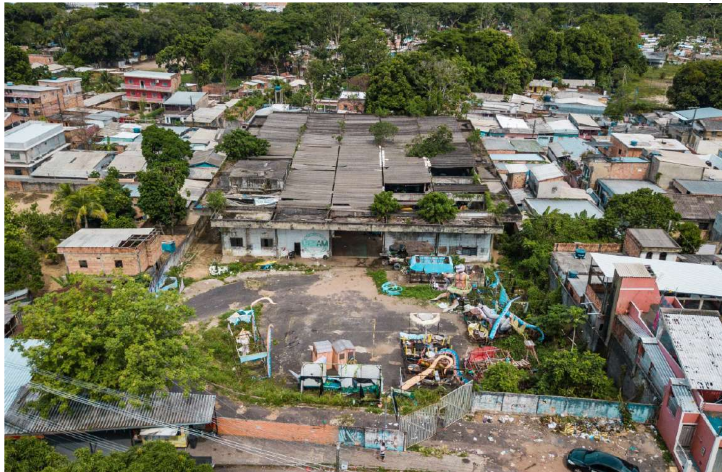
Terreno localizado no bairro Alvorada

As tratativas para a doação dos imóveis em Manaus estavam sendo realizadas há quase dois anos pelo Governo do Amazonas, por meio da Suhab em parceria com a SPU, em Manaus, representada pelo