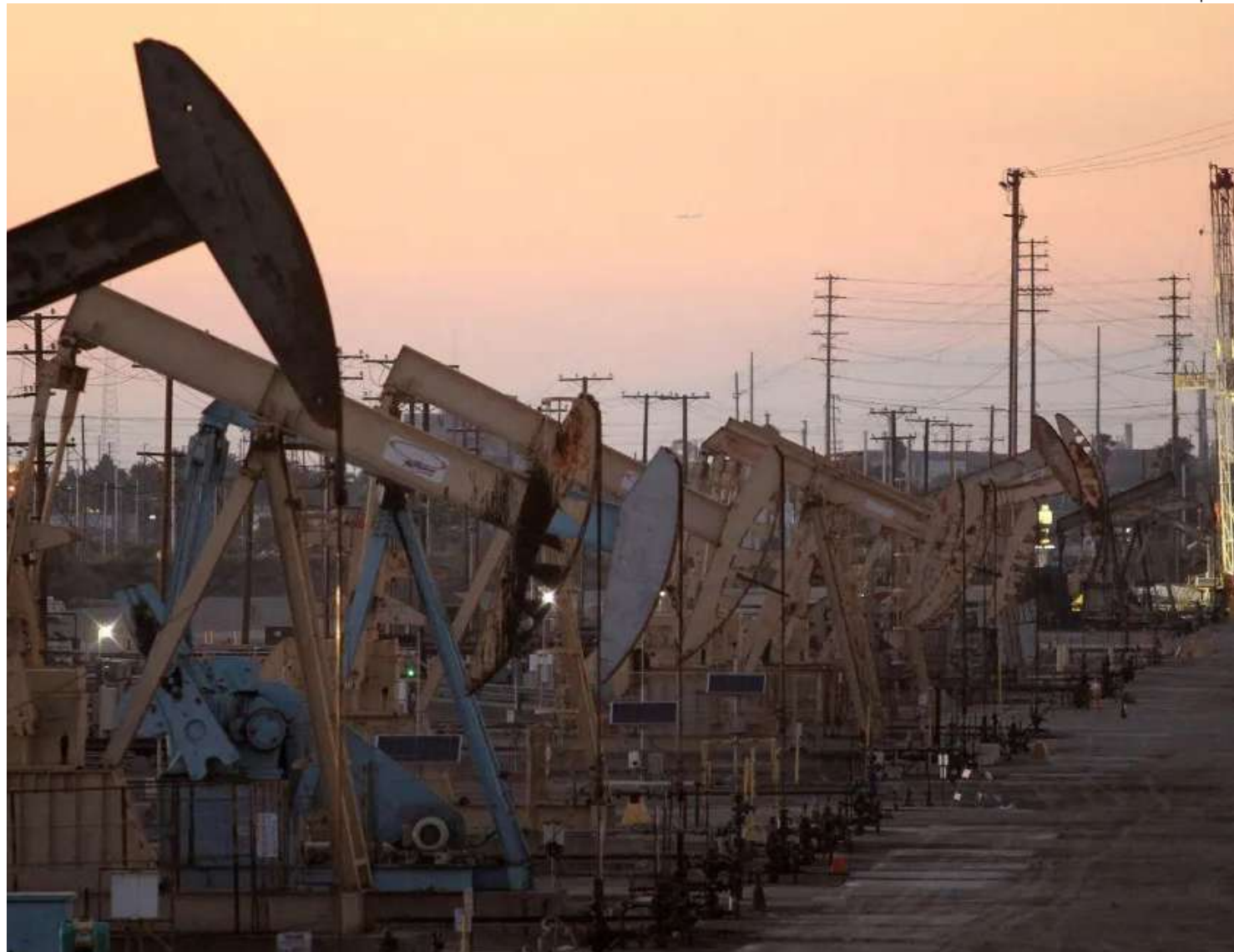
Equipamentos de bombeamento extraem petróleo bruto no Campo de Wilmington, Califórnia, EUA 30/7/2013

A Ucrânia intensifica os ataques à infraestrutura de petróleo russa este ano, com pelo menos sete refinarias sendo alvos de drones apenas neste mês. Os ataques reduziram 7% da capacidade de refino russa, ou