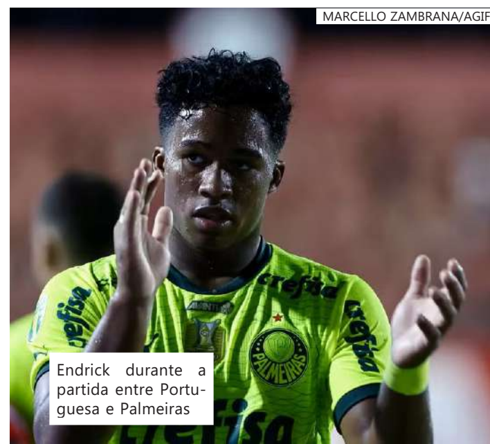
Endrick durante a partida entre Portuguesa e Palmeiras