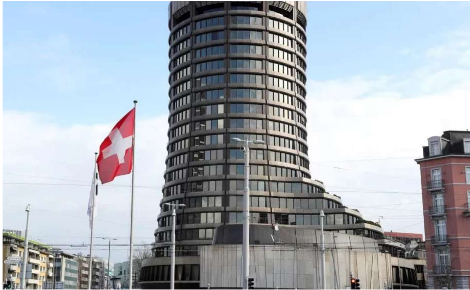
Sede do BIS em Basileia, Suíça

O Gaia conseguiu superar diferenças nas definições e estruturas de divulga-