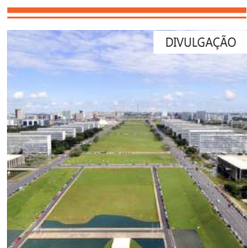
Blockeio é necessário para cumprir regras fiscais

Em entrevista ao jornal Folha de S.Paulo publicada nesta quarta-feira (20), o subsecretário da Dívida da Pública do Tesouro Nacional, Otávio Ladeira, disse que o relatório bimestral deve servir como um "freio de arrumação" e também melhorar as expectativas do mercado financeiro em relação às contas públicas.