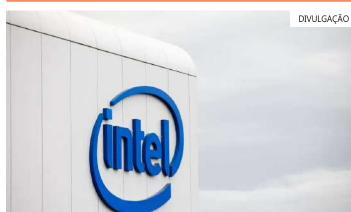
Recursos anunciados são garantidos pela Lei CHIPS

Gelsinger já havia dito anteriormente que uma segunda rodada de financiamento dos EUA para fábricas de chips provavelmente será necessária para restabelecer o país como líder na fabricação de semicondutores, o que ele reiterou na terça-feira.