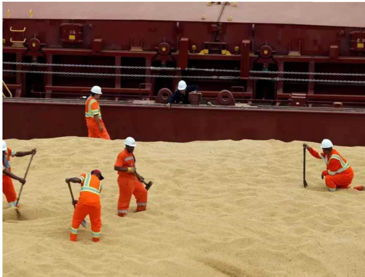
Navio carregado com soja no Porto de Santos

A primeira é sobre o crescimento da China, que poderá ficar abaixo dos 5% projetados pelo governo do país, assim afetando o crescimento