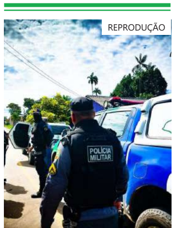
As ações aconteceram na tarde de terça-feira e madrugada desta quarta-feira

Os policiais militares foram ao endereço, durante o cerco, nas proximidades da avenida Coronel Ferreira de Araújo, realizaram a abordagem ao condutor, que ao ser questionado sobre documentação e a propriedade do veículo, falou que ele pegou a motocicleta para abastecer, porém, não falou de quem era o veículo. O suspeito foi conduzido ao 1º DIP.