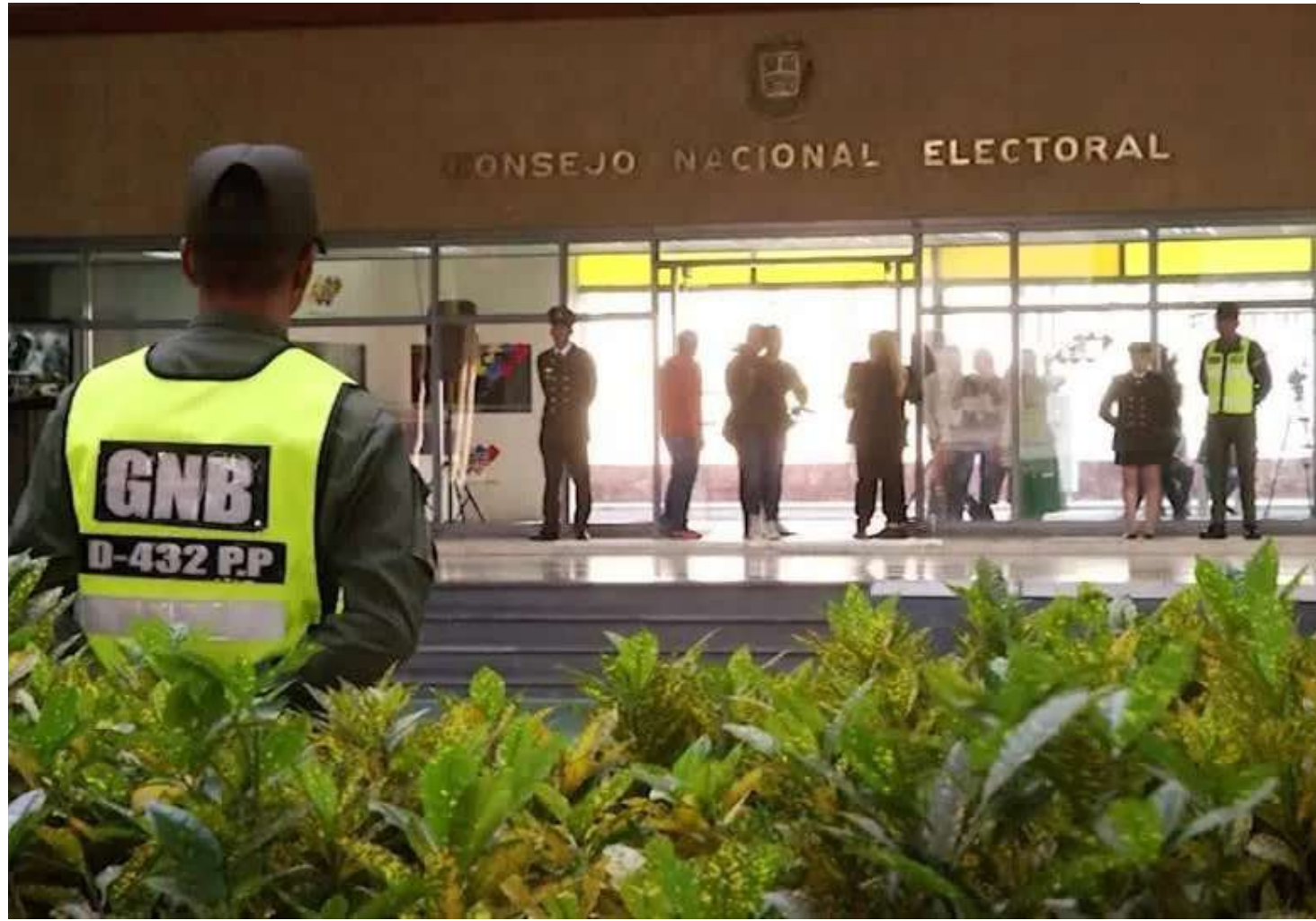
Conselho Nacional Eleitoral da Venezuela

na ONU também diz constatar que as autoridades venezuelanas falam em "conspirações reais ou fictícias para amealhar, prender e processar pessoas opositoras ou críticas ao governo".