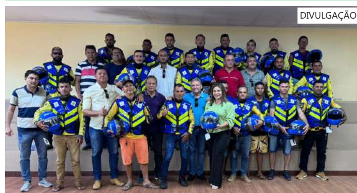
Também foram entregues 54 Carteiras Nacionais de Habilitação oriundas do projeto "CNH Social"