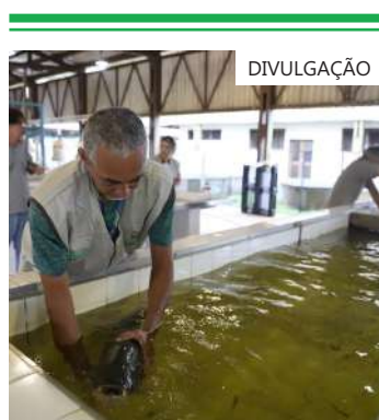
Atendimento aos principais municípios com potenciais produtivos

Aos piscicultores interessados em receber o incentivo, devem procurar a unidade local do Instituto de Desenvolvimento Agropecuário e Florestal Sustentável (Idam) ou a Secretaria Municipal de Produção Rural do município para solicitar o fomento. Após a solicitação, o pedido será encaminhado para a Sepror, onde será verificado se o piscicultor está apto a receber o benefício.