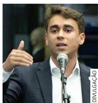
Nikolas desponta na política como um forte expoente da direita no Brasil

Na Câmara, Nikolas Ferreira atua em pautas ligadas à família, à religião e à liberdade econômica.