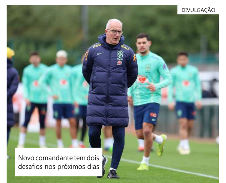
Novo comandante tem dois desafios nos próximos dias

em como lidar com a ansiedade, com a pressão, em controle dos pensamentos e várias questões que eles podem ter algumas dificuldades. A psicologia do esporte vai exatamente trabalhar nesses pontos para ajudá-los a dar o melhor desempenho técnico e tático", acrescentou.