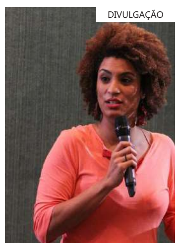
Caso está perto de ser esclarecido

quérito será devolvido à PF para continuidade das investigações.