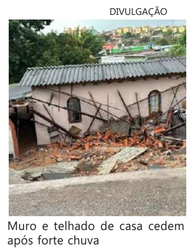
Muro e telhado de casa cedem após forte chuva

"Isso é muito importante para que a gente possa orientar os serviços de saúde", destacou a secretária. "Nessa epidemia, o quarto dia tem sido um alerta de que as pessoas podem agravar. Então, um monitoramento que faça com que essa pessoa volte no quarto dia da doença pode salvar muitas vidas", alerta.