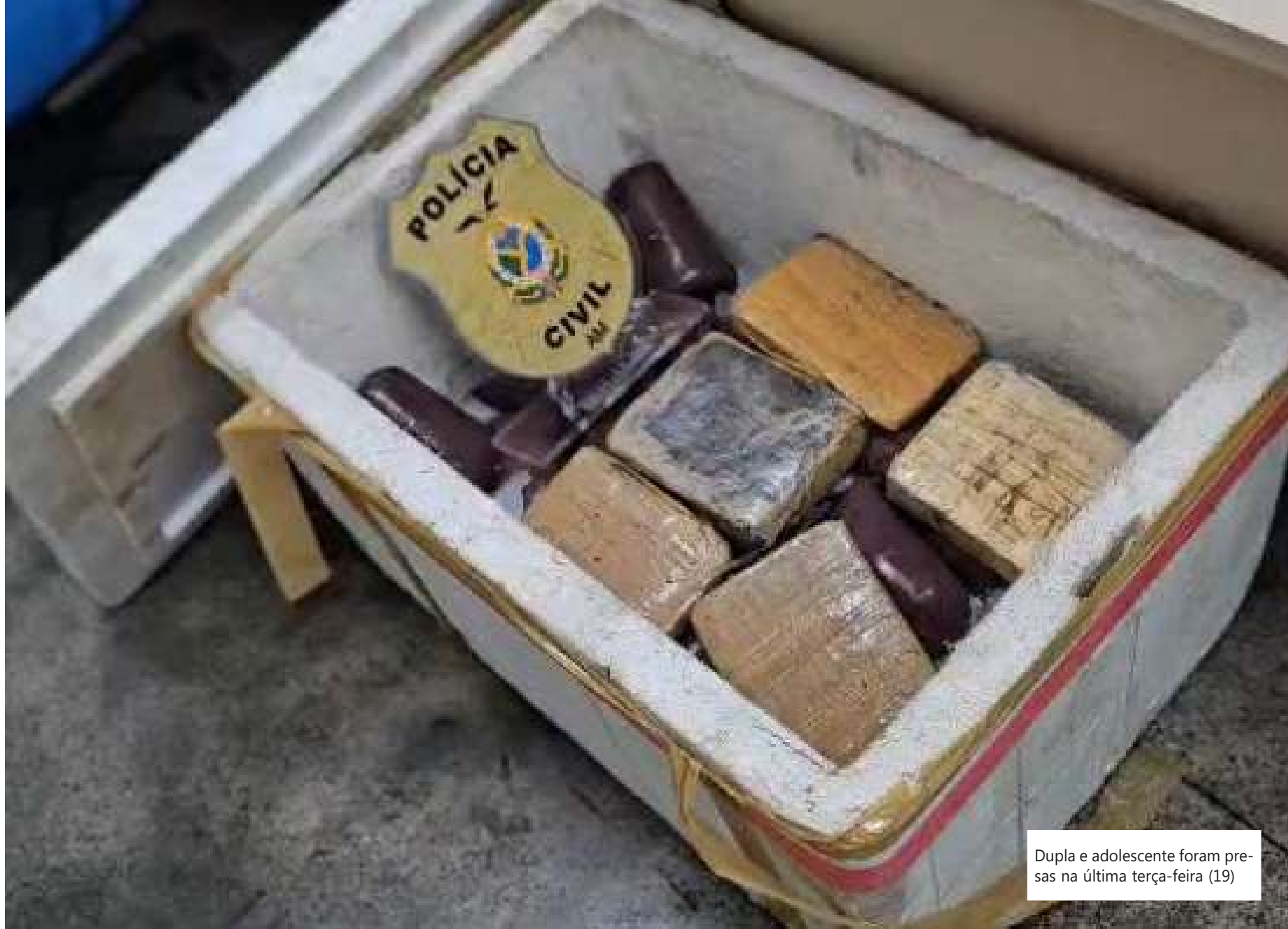
Dupla e adolescente foram presas na última terça-feira (19)