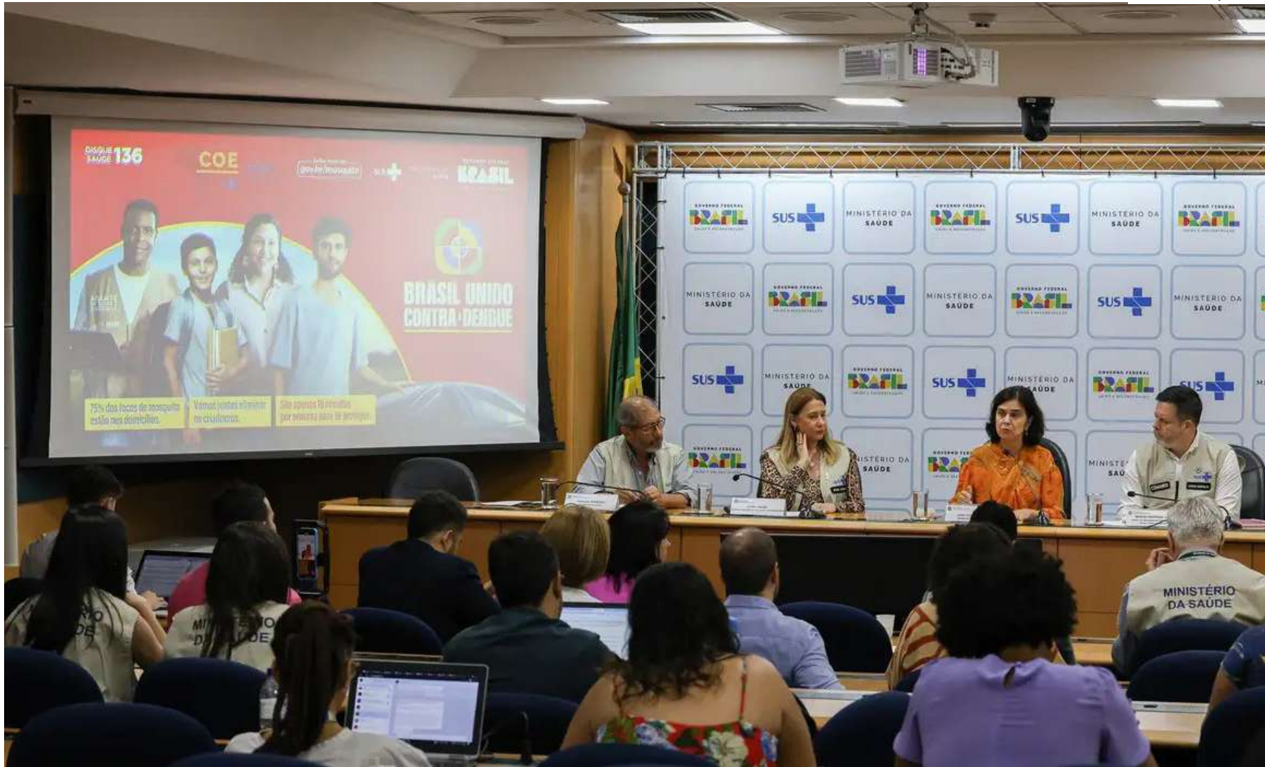
O tempo médio entre o início dos sintomas e a notificação de caso de dengue é de 4 dias

Coefficiente da doença é de 954,2 casos para cada 100 mil habitantes