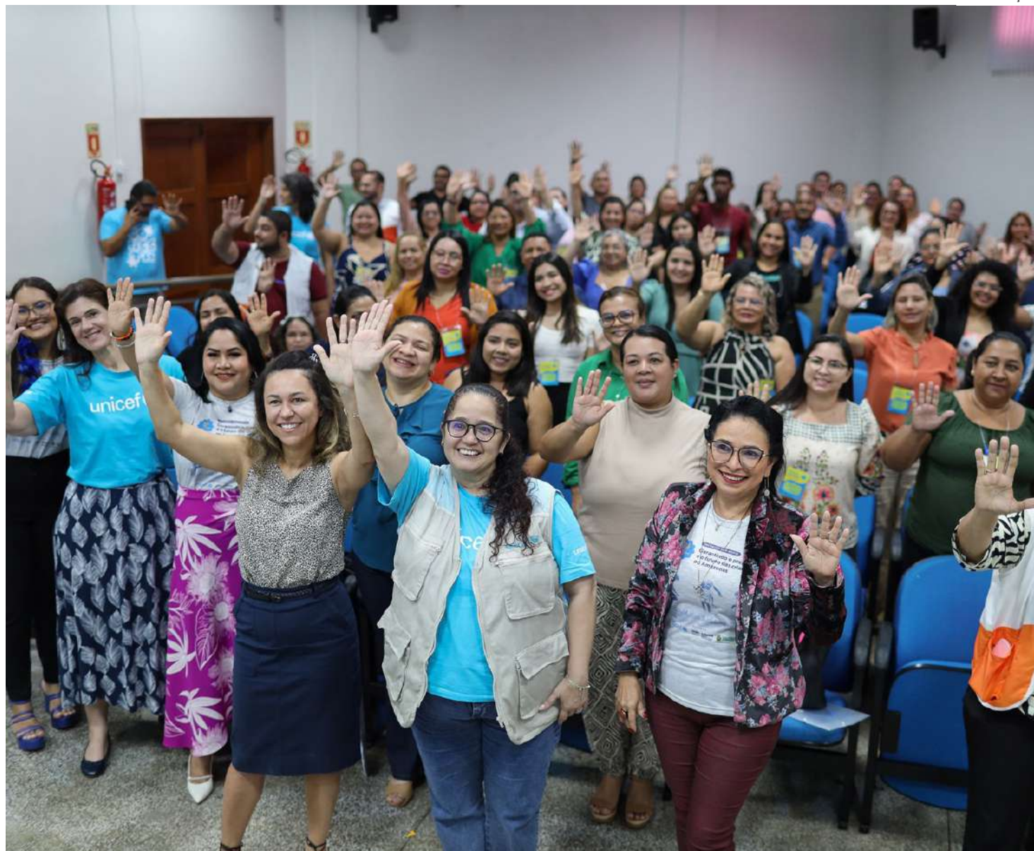
Atendimento aos principais municípios com potenciais produtivos na atividade