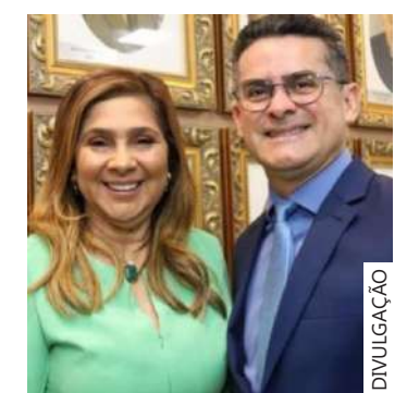
Irmã do prefeito vai coordenar campanha de reeleição dele em Manaus