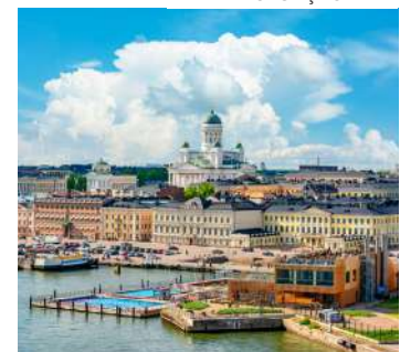
A Finlândia lidera a lista pelo sétimo ano consecutivo