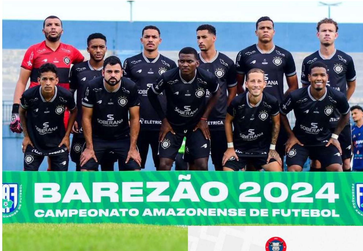
Time está rebaixado para a série B do Campeonato Amazonense

Vale lembrar que a instabilidade no clube começa antes do Barezão 2024. Desde novembro o Rio Negro passa por conturbações internas que vão