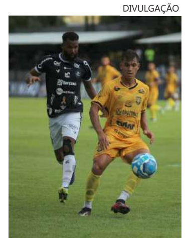
Amazonas e Remo jogam às 19h (de Manaus) em Belém, no Pará.

Na quinta-feira (21), é a vez do Manaus entrar em campo para representar o futebol regional. Na Arena da Amazônia, localizada no bairro Flores, zona centro-sul da capital, o Gavião recebe o Paysandu (PA), às 20h.