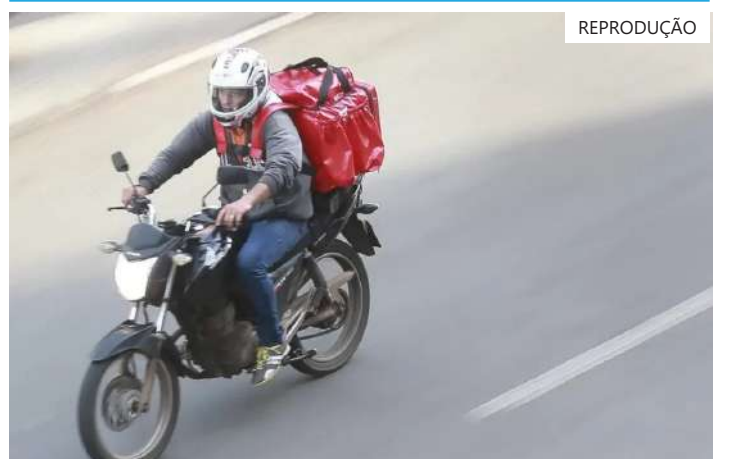
PL pode sofrer modificações em relação ao que foi assinado pelo presidente

Em entrevista a emissoras de rádio no programa Bom Dia, Ministro, Marinho destacou que as plataformas de entrega que utilizam serviços de motociclistas não concordam com o patamar de contribuição definido pelo governo. "Estabelecemos como um padrão mínimo aceitável do ponto de vista da sustentabilidade do sistema previdenciário brasileiro e também da proteção e remuneração ao trabalho. E é isso que está em discussão em relação a entregas".