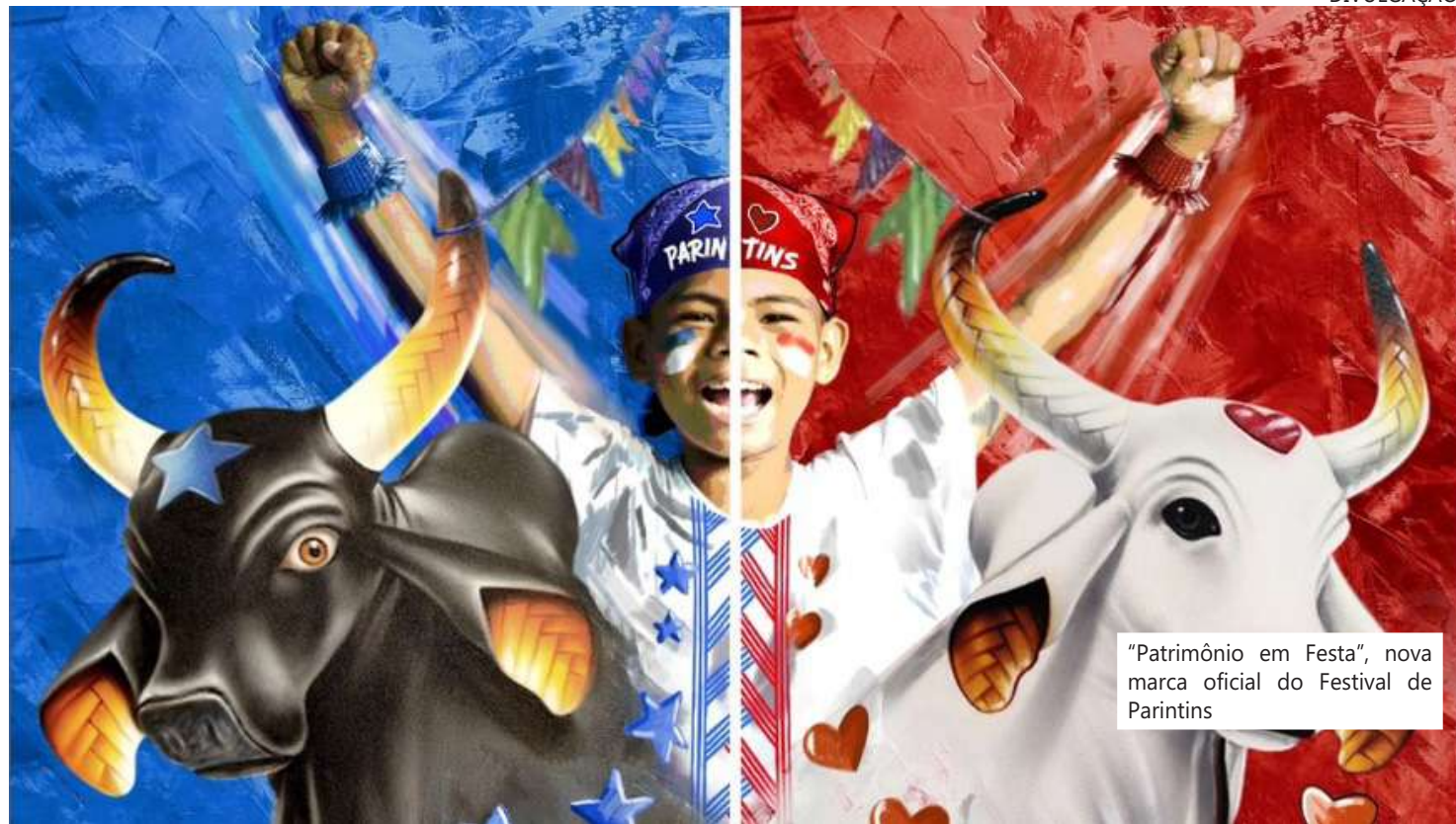
"Patrimônio em Festa", nova marca oficial do Festival de Parintins

Silva, a obra foi criada para passar uma mensagem direta e de alcance ao Festival de Parintins, representado pelos bois Caprichoso e Garantido, e por uma criança. "A inspiração vem muito de berço. Cresci vendo assim. É uma