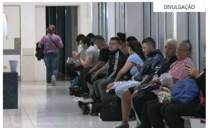
Pessoas esperam atendimento na ala de emergência de hospital em Buenos Aires

Ele afirmou que ao vacinar a população agora, "a imunização seria atingida em quatro meses, quando o mosquito já não for um inconveniente". E acrescentou que "a eficácia da vacina também não está comprovada".