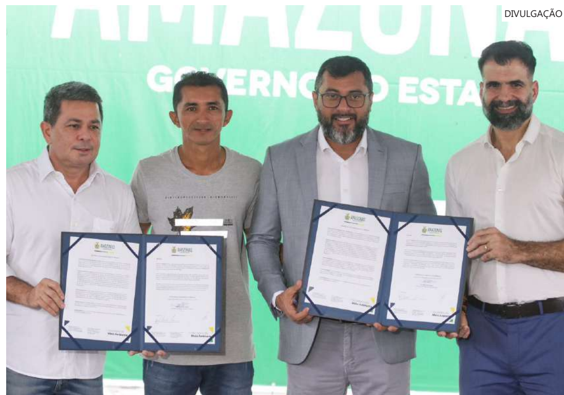
R$ 3,3 bilhões em novos créditos de carbono em duas Unidades de Conservação (UCs) do Estado

“Para que a gente pudesse chegar aqui, nós percorremos um longo caminho na construção de arcabouço legal, com a regulamentação da lei de Serviços Ambientais, consultando experiências já imple-