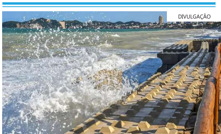
Segundo o Censo 2022, 111,28 milhões de pessoas moram próximo ao mar

Os dados mostram que o setor censitário mais populoso é o presídio da Papuda, no Distrito Federal, com 10.163 habitantes. Brasília também abriga o setor com maior número de domicílios: Condomínio Itapoã Parque, com 6.322 domicílios. A área com maior média de moradores por domicílio é Toricueije, em Barra do Garça (MT).