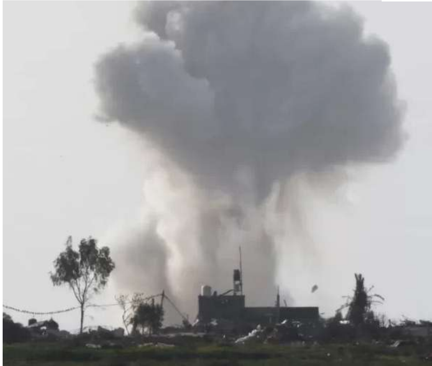
Fumaça é vista após ataque aéreo israelense em Gaza

Os palestinos deveriam ser transportados de ônibus para Gaza na manhã de quinta-feira. No entanto, após a liminar temporária, o governo de Israel adiou isso pelo menos até segunda-feira (25), disseram