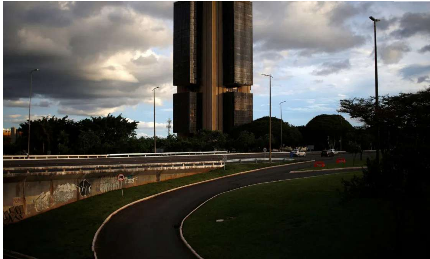
Prédio do Banco Central em Brasília

“Se não se alterou substancialmente, realmente significa que um corte 50 pontos-base em junho ainda é possível, mesmo que essa tese tenha perdido força”, diz.