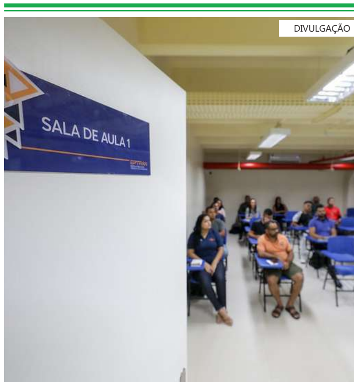
Inscrições abertas e gratuitas

O curso de Atualização de CNH é para pessoas que estão em processo de renovação ou adição de categoria, ou que a habilitação esteja vencida a mais de cinco anos, ou que CNH seja oriunda de um país estrangeiro.