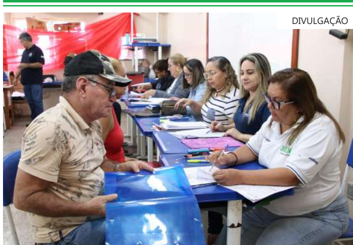
A ação de regularização fundiária foi realizada no Ceti Garcitylzon Silva, entre os dias 4 a 22 de março

Para informações sobre a ação de regularização fundiária no conjunto, o morador pode entrar em contato com o Setor de Habitação da Suhab, pelos números (92) 99297-6476 e (92) 3647-1088.