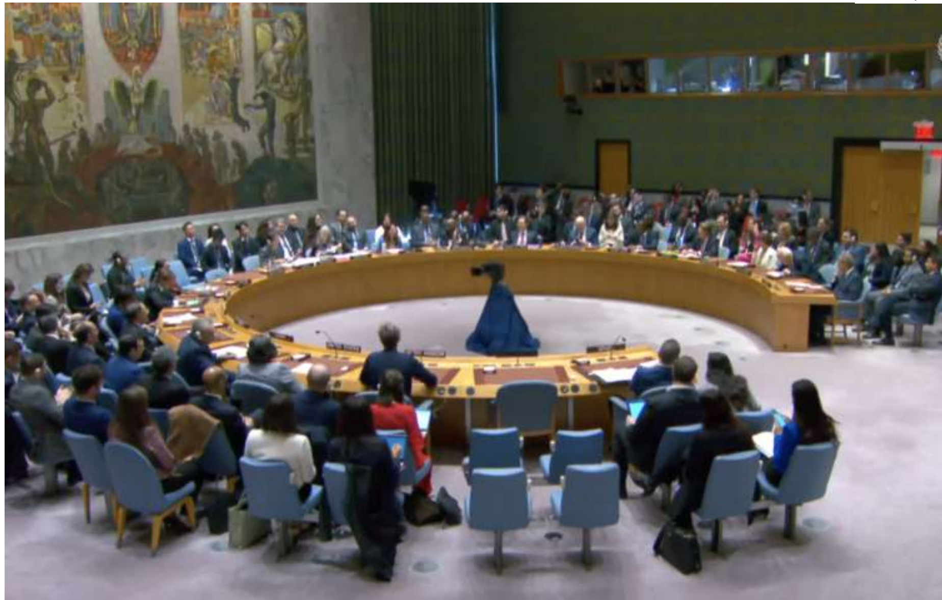
Estados Unidos se abstiveram na votação; todos os outros 14 membros restantes do colegiado votaram a favor