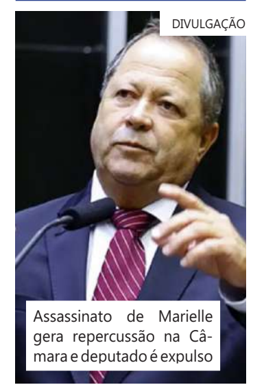
Assassinato de Marielle gera repercussão na Câmara e deputado é expulso

Segundo a Constituição Federal, deputados e senadores são invioláveis, civil e penalmente, por opiniões, palavras e votos e não poderão ser presos, salvo em flagrante de crime inafiançável. Nessas situações, os autos são remetidos à Câmara ou ao Senado para que a maioria absoluta da Casa (no caso da Câmara, o voto de 257 deputados) decida, em voto aberto, sobre a prisão.