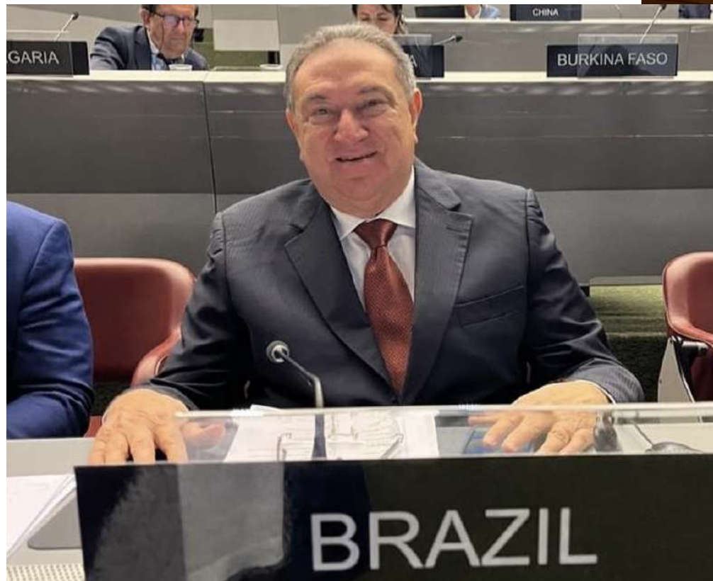
O deputado federal Átila Lins, na Assembléia Geral da União Interparlamentar-UIP, em Genebra

. A feira é uma excelente oportunidade para se posicionar perante ao mercado externo latino-americano. Empresários do setor, vale conferir.