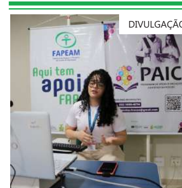
Ao todo, 61 estudantes universitários foram selecionados no Paic 2024-2025

Há, também, projetos de pesquisa que envolvem a qualidade de vida dos pacientes e pesquisa com foco no profissional de saúde da Fcecon, buscando avaliar níveis de depressão nos profissionais de saúde da área oncológica.