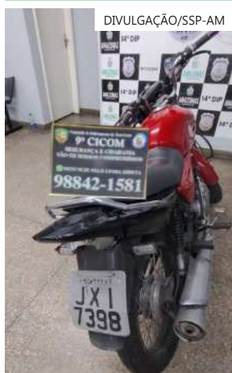
Durante as ações, três homens foram presos e um adolescente foi apreendido

Após consultar o chassi, foi verificado que a motocicleta, de placa NON-0516, tinha restrição de furto. O caso foi encaminhado para o 1º DIP.