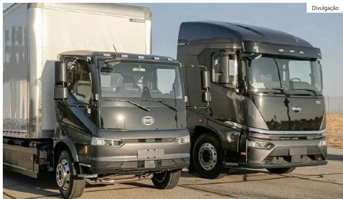
Empresa assinou com o governo definição que dá acesso a benefícios fiscais

A fábrica de baterias de fosfato de ferro-lítio da BYD foi inaugurada em 2020, com investimento inicial de 15 milhões de reais em uma área de 5 mil metros quadrados. A capacidade de produção atual é de 1 Gwz de baterias por ano, destinadas ao abastecimento de ônibus elétricos da empresa montados em Campinas (SP).