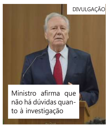
Ministro afirma que não há dúvidas quanto à investigação