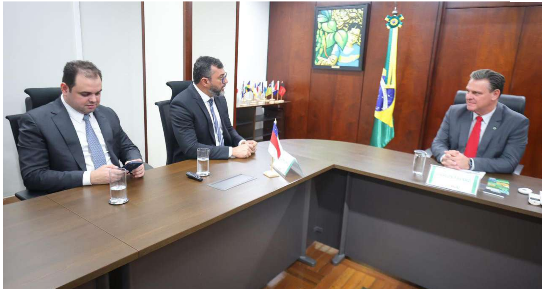
Em reunião com o ministro da Agricultura e Pecuária, Carlos Fávaro, no último dia 29/02, em Brasília

"Atendendo a um pleito nosso, o Ministério da Agricultura e Pecuária reconheceu o Amazonas como estado livre de febre aftosa sem vacinação. Isso é importante porque abre as portas para que possamos exportar nossos produtos e fortalece a produção rural do nosso estado", destacou o governador Wilson Lima. No entanto, reforçou o