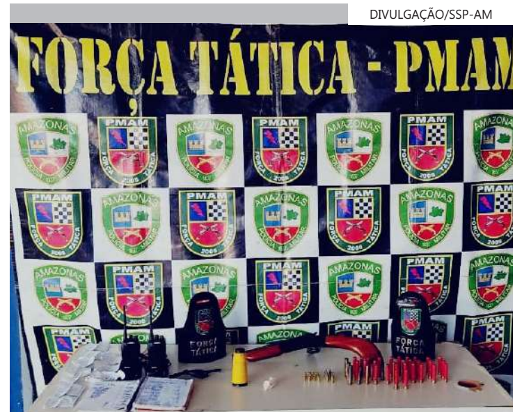
Ação reforça o policiamento no interior do Amazonas

Conforme investigações, o infrator "urubu" é responsável por realizar o abastecimento e venda de entorpecentes no município. Ele foi encaminhado para o 42º DIP.