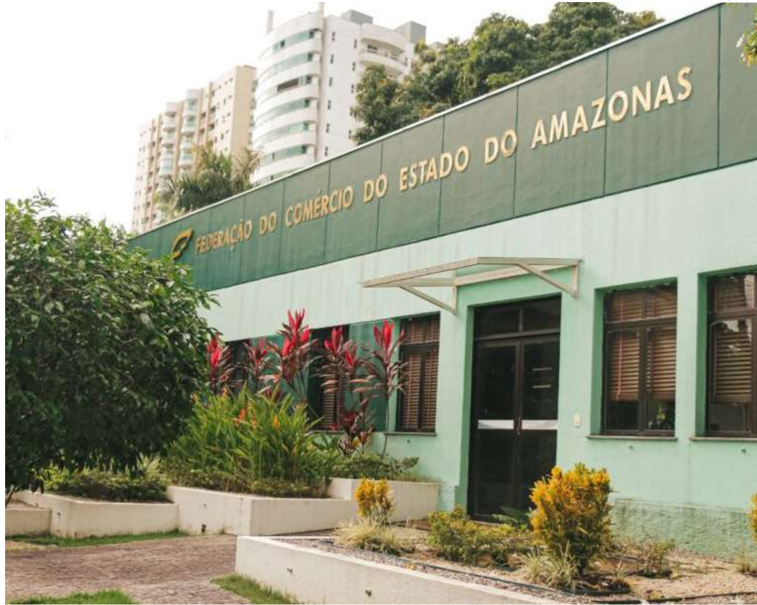
O evento será aberto ao público, com realização da Sedecti em parceria com a Fecomércio e o Sebrae