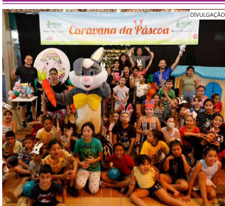
A programação será realizada em dois Centros Estaduais de Convivência da Família do Governo do Amazonas

Em celebração ao feriado da páscoa deste ano, o Governo do Amazonas por meio da Secretaria de Cultura e Economia Criativa, promove a Caravana da Páscoa 2024. O evento é dedicado à celebração da data, além de oferecer acesso a atividades artísticas e culturais para crianças. Com uma programação repleta de atividades, a iniciativa visa proporcionar momentos de diversão e aprendizado para toda a família.