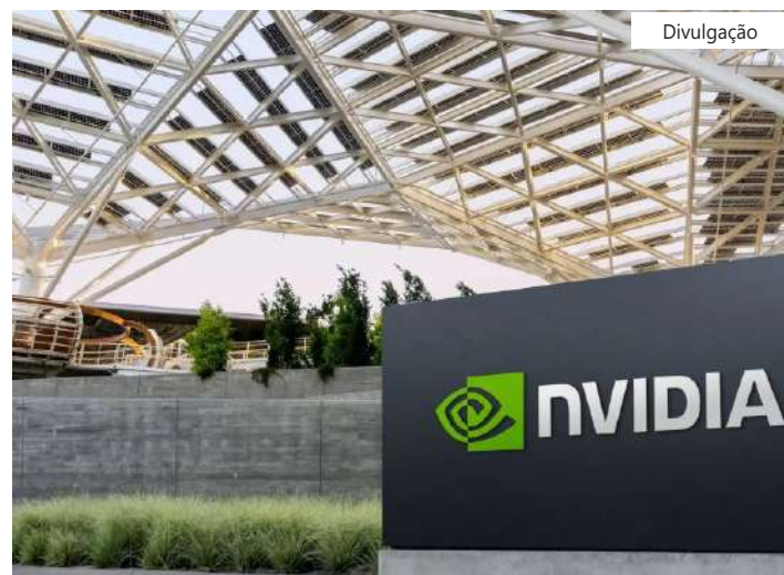
Quase 100 startups apostam no projeto

Eles enfatizaram a necessidade de construir uma base sólida para incluir contribuições de diversas empresas que também possam ser implantadas em qualquer chip ou hardware.