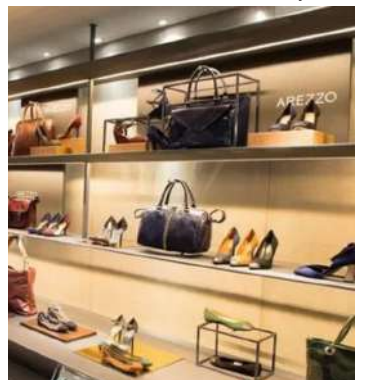
A junção dos negócios foi celebrada entre as companhias e seus acionistas