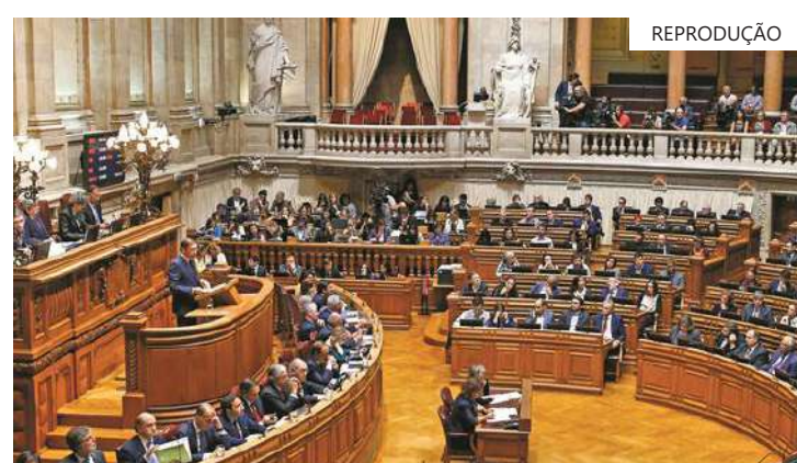
Coalizão Aliança Democrática venceu a eleição de 10 de março por pequena margem sobre o Partido Socialista

Analistas previram instabilidade para o governo minoritário da AD, que tem apenas 80 assentos e provavelmente não conseguirá aprovar leis sem o apoio do Chega, cujo líder André Ventura exigiu um acordo de longo prazo em troca de apoio.