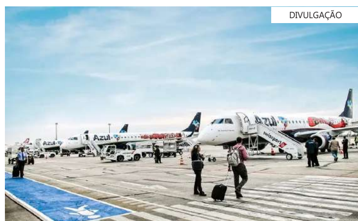
Um modelo de apoio, que terá participação do BNDES e do Ministério da Fazenda, já havia sido prometido por Costa Filho em fevereiro

Recentemente, o presidente do BNDES, Aloizio Mercadante, demonstrou disposição para auxiliar as empresas aéreas, mas salientou que o banco de fomento só forneceria suporte à operação mediante garantias sólidas para os empréstimos destinados ao setor.