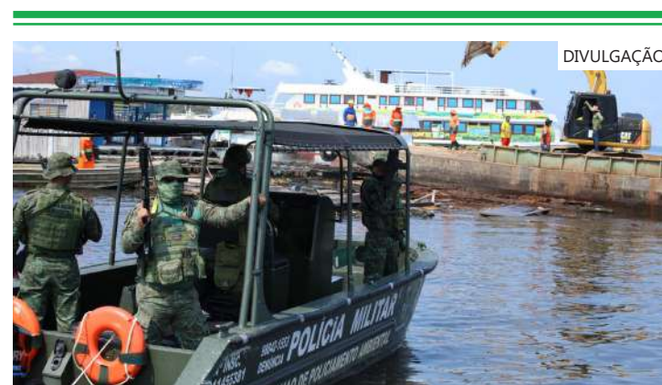
Trabalho termina em até cinco dias