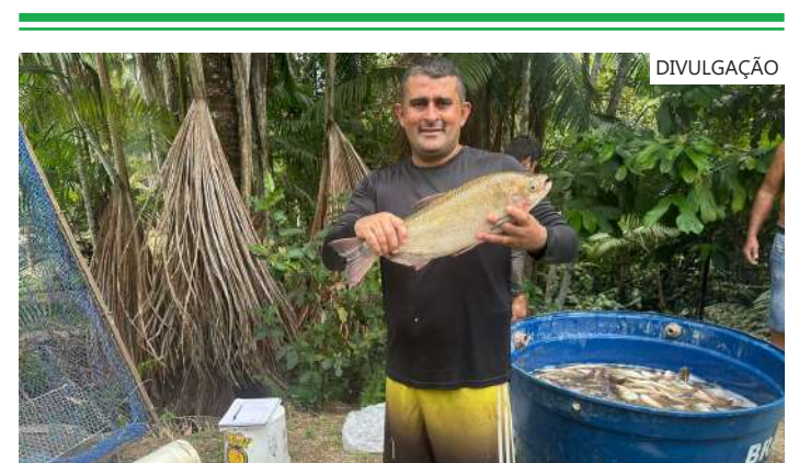
Economia e boas vendas em Manaus

No total, cerca de 95 feirantes, entre produtores regionais, artesãos e empreendedores da economia solidária, serão beneficiados por meio da iniciativa.