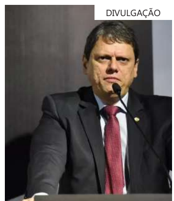
GOVERNO DE SP Governador de São Paulo, Tarcísio de Freitas

A estimativa de Tarcísio é que sejam gastos R$ 4 bilhões na parceria público-privada. A previsão é que o concurso seja finalizado em agosto, o leilão seja realizado em 2025 e as obras durem quatro anos. A empresa vencedora será responsável pela construção, gestão, manutenção e zeladoria dos prédios.