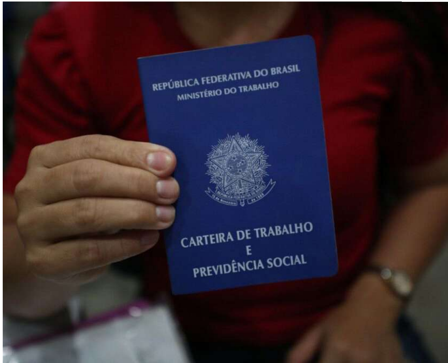
No acumulado do primeiro bimestre de 2024, o saldo é de 474.614 empregos

Segundo dados comparativos do Ministério, esse saldo para o primeiro bimestre é superior ao observado em todos os anos das duas primeiras gestões de Luiz Inácio Lula da Silva (2003-2010), exceto no último quando foram gerados mais de 498 mil