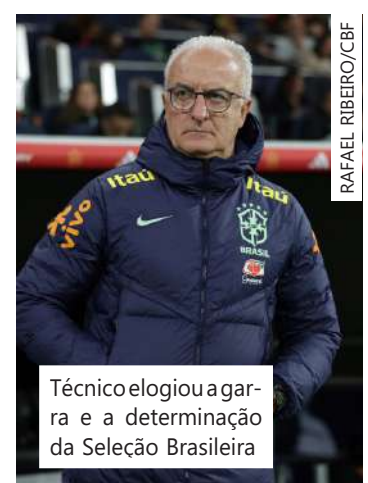
Técnico elogiou a garra e a determinação da Seleção Brasileira

isso é muito positivo, um grupo que se reuniu há poucos dias, que assimilou uma ideia, que entendeu tudo aquilo que nós queríamos na primeira partida. Hoje, tivemos no segundo tempo um esboço do que poderíamos talvez ter feito já na etapa inicial e logo depois sofremos o terceiro gol", comentou Dorival.