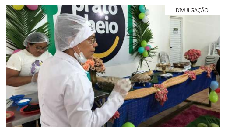
Capacitação e estímulo ao empreendedorismo

Esse é o segundo curso profissionalizante em uma unidade do programa no interior. Em fevereiro deste ano, o restaurante popular de Manacapuru promoveu um curso básico de confeitaria para os usuários da unidade. A iniciativa deve se estender às outras 24 unidades presentes no interior do Amazonas.