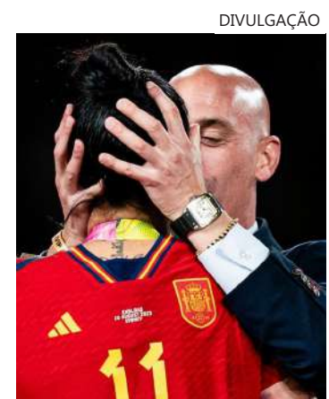
Caso aconteceu em 20 de agosto do ano passado