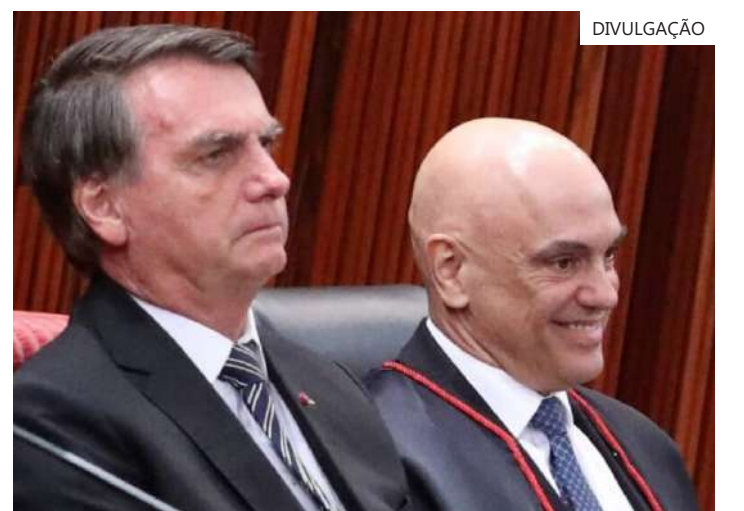
Moraes aperta o cerco contra Bolsonaro em Brasília

As embaixadas são ambientes protegidos, fora do alcance das leis e das autoridades brasileiras. A permanência nesses locais, em tese, pode configurar burla à determinação de não se ausentar do país, já que o objetivo da medida é exatamente manter o investigado ao alcance das forças de segurança nacionais.