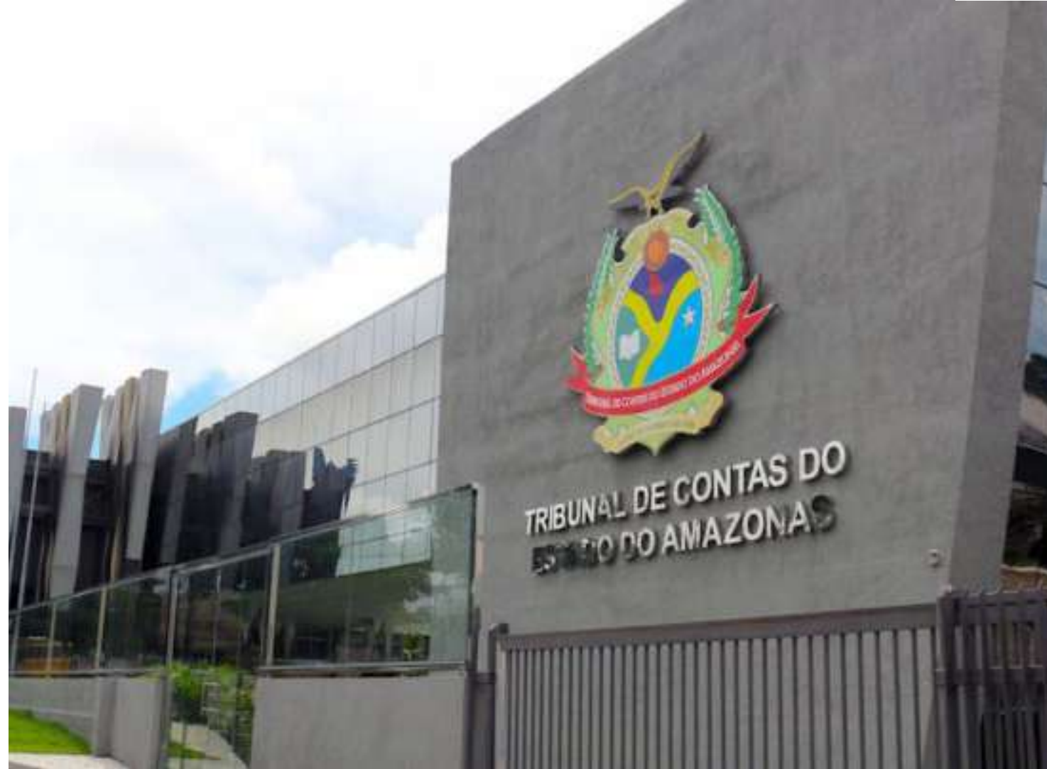
Prefeito Beto D'Ángelo (Republicanos) terá de explicar possíveis irregularidades

nicos da Corte de Contas identificou, em todos os cinco editais, a falta de inclusão social, não contemplando o percentual mínimo de vagas para candidatos com deficiência (PCD) e tampouco reservando vagas para candidatos negros, em desacordo com a legislação do município. Também foi constatada a ausência de bibliografia para elaboração das provas em alguns casos.