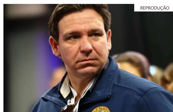
Governador da Flórida, Ron DeSantis

Críticos disseram que o projeto de lei viola as proteções da Primeira Emenda da Constituição dos EUA à liberdade de expressão e que os pais, não o governo, deveriam tomar as decisões sobre a presença online de seus filhos, independente da idade.