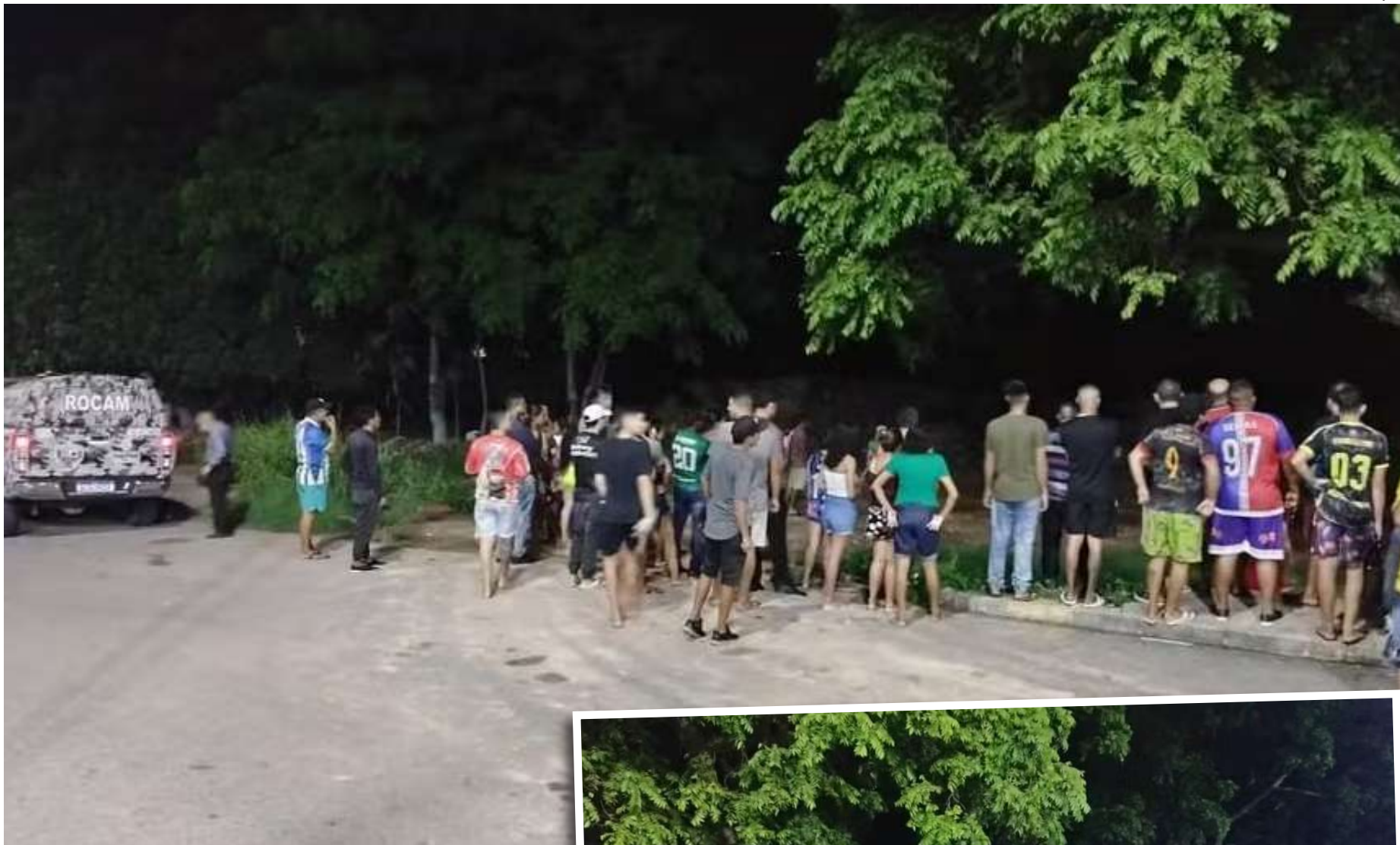
Chacina no São Raimundo, em Manaus

MP apura irregularidades na contratação de serviços