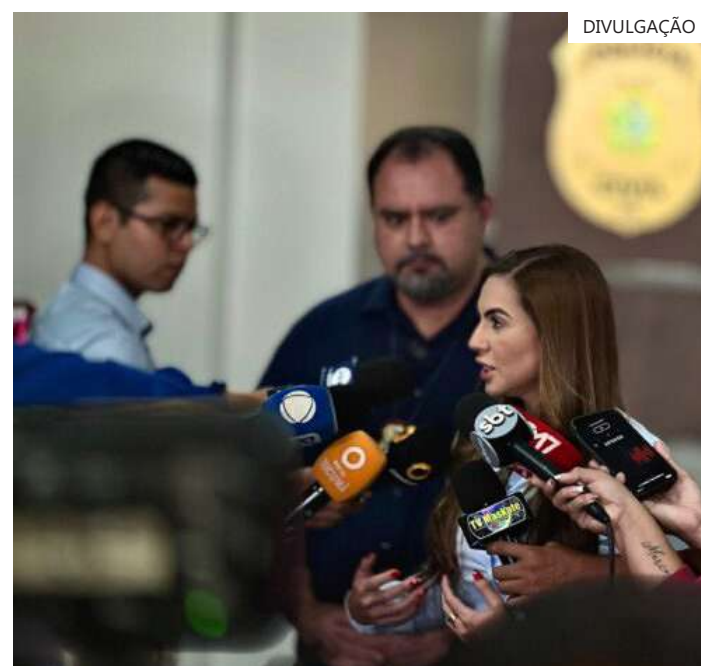
Infrator foi condenado a mais de 9 anos de reclusão pelo crime

"Temos ajudado à PC-AM com uma parte logística e também ajudamos no acolhimento das vítimas e na assistência psicológica.