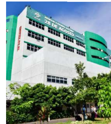
Justiça também determinou o sequestro de R$ 1,8 milhão de bens dos envolvidos