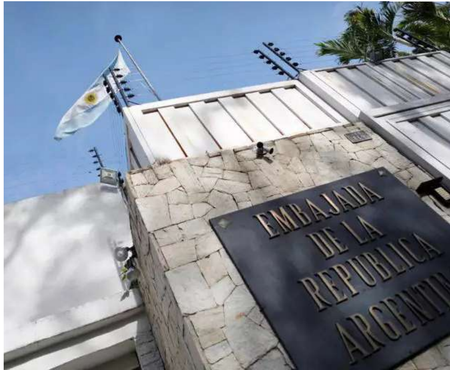
Fachada da Embaixada da Argentina em Caracas, na Venezuela

O texto do comunicado, emitido pelo escritório do presidente Javier Milei, explica que o acolhimento dos