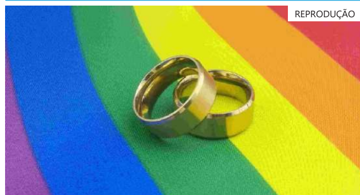
REPRODUÇÃO Dados são da pesquisa Estatísticas do Registro Civil 2022, divulgadas na manhã desta quarta-feira (27)

Entre 2020 e 2021, o número de casamentos aumentou, dando indícios de que as cerimônias matrimoniais voltaram a acontecer em razão das campanhas de vacinação em massa e da flexibilização das medidas para contenção da Covid-19.