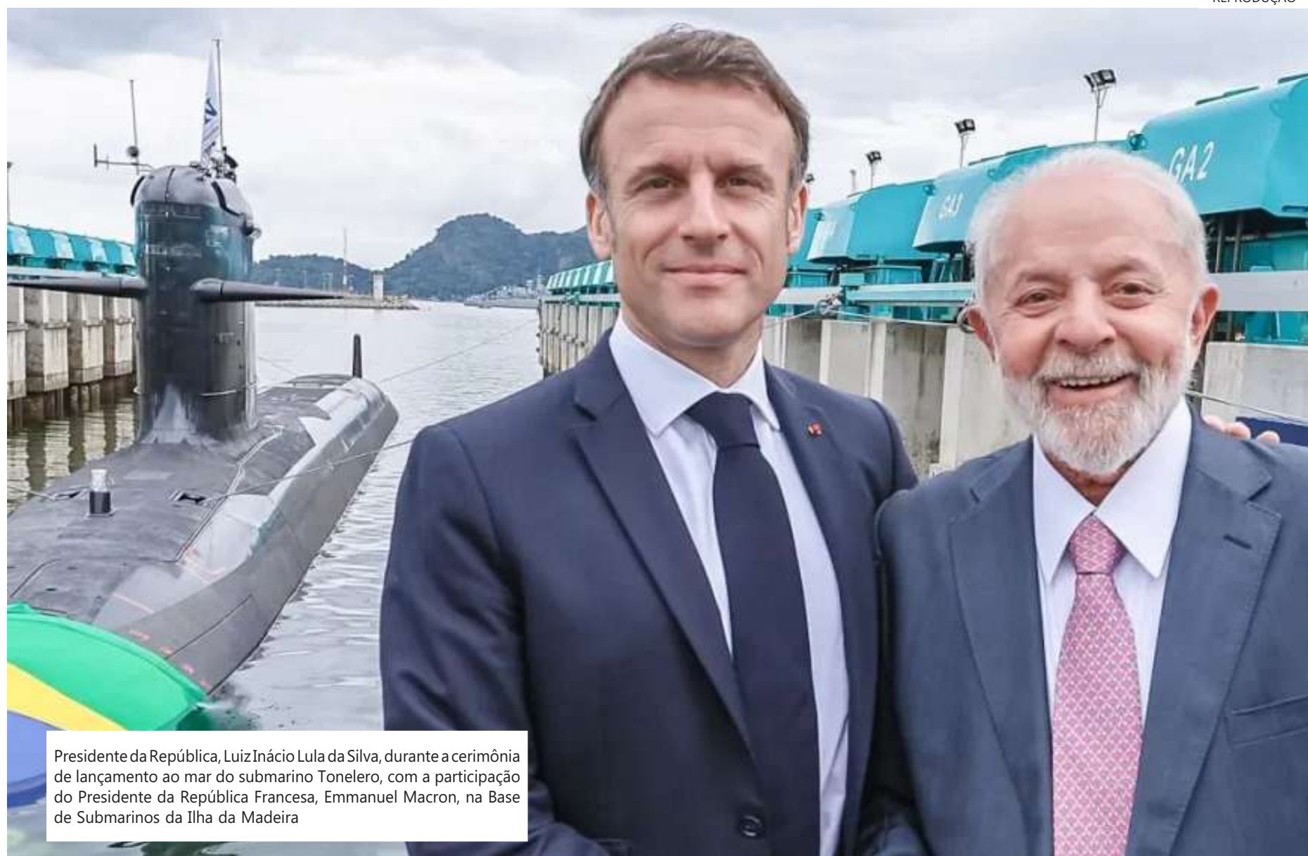
Presidente da República, Luiz Inácio Lula da Silva, durante a cerimônia de lançamento ao mar do submarino Tonelero, com a participação do Presidente da República Francesa, Emmanuel Macron, na Base de Submarinos da Ilha da Madeira

O governo brasileiro disse que sua frota de submarinos é necessária para defender a costa de quase 7.500 km do país