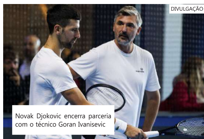
Novak Djokovic encerra parceria com o técnico Goran Ivanisevic

O sérvio desistiu do Miami Open em andamento para limitar o número de eventos que disputa durante a atual temporada, com essa decisão ocorrendo após uma surpreendente derrota na terceira rodada para Luca Nardi em Indian Wells.