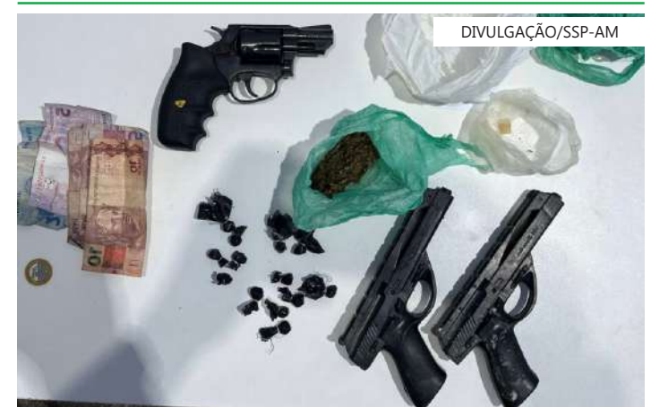
Três armas de fogo, dois simulacros e drogas foram apreendidas durante as ocorrências

O adolescente e o material apreendido foram conduzidos para a 66ª DIP.