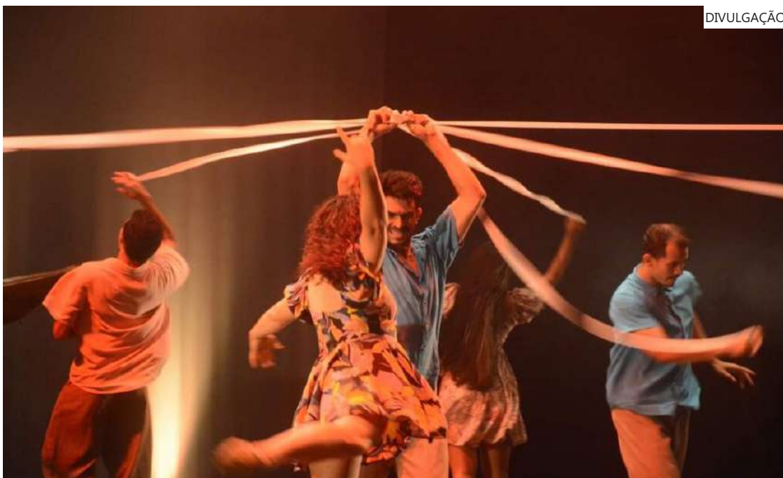
Coral do Amazonas e Balé Folclórico

A composição musical monumental do século XX, Carmina Burana, conhecida por suas melodias marcantes e coros emocionantes, estreia nesta quinta-feira (11/03), às 20h, na Temporada de Corpos Artísticos, no Teatro Amazonas, e segue em cartaz nos dias 12, 13 e 14 de abril. Os ingressos estão à venda na bilheteria do teatro e no www.shoppingrossos.com.br .