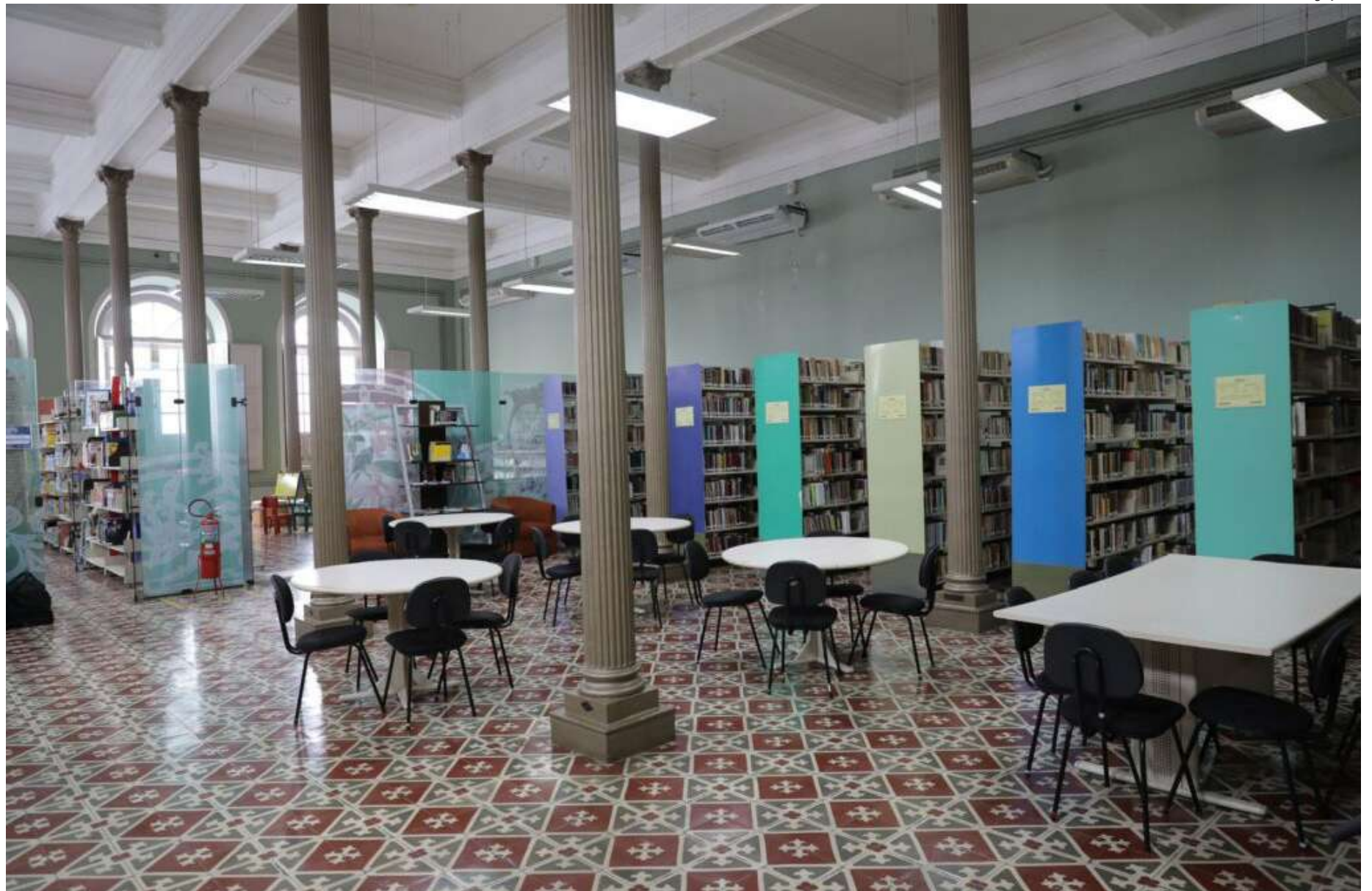
A Biblioteca Pública do Amazonas tem um acervo de 300 mil itens, entre livros, jornais e revistas

Em meio ao acervo de 300 mil itens, entre livros, jornais e revistas, o bibliotecário David Carvalho conta um pouco da relação dele com o espaço, onde trabalha há 11 anos na função e também ressalta o papel importante do Estado para manter as memórias do local vivas para os moradores da cidade.