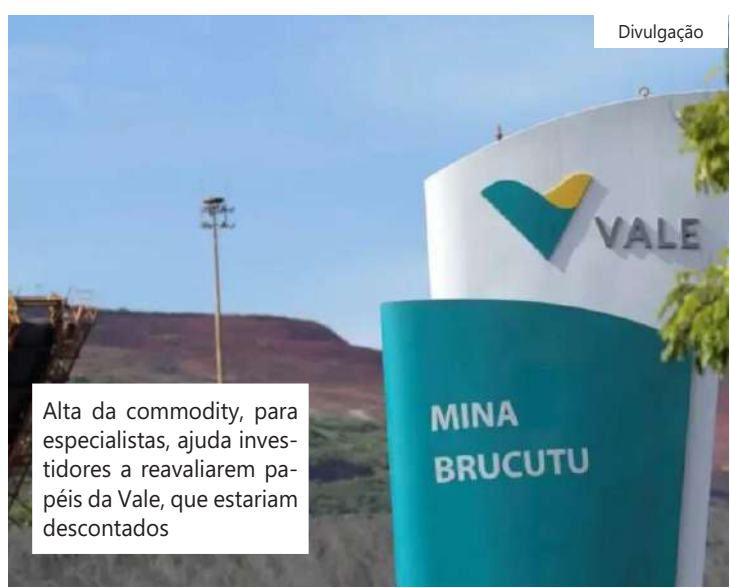
Alta da commodity, para especialistas, ajuda investidores a reavaliarem papéis da Vale, que estariam descontados

No estudo, a CNI destaca os benefícios de o país buscar uma pauta mais diversificada, como a menor vulnerabilidade a choques externos.