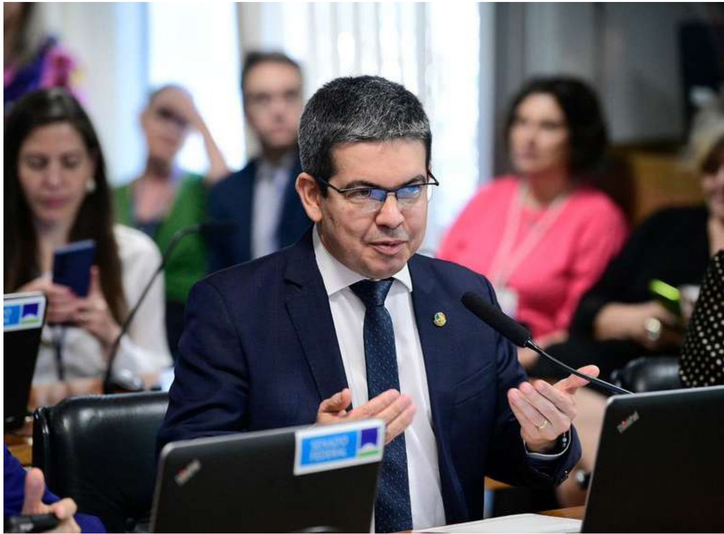
A matéria foi distribuída ao líder do governo, senador Randolfe Rodrigues (S/Partido-AP), que ainda não apresentou relatório sobre a proposição

Aprovado na Câmara em 12 de março, o texto é um substitutivo do relator, deputado Emanuel Pinheiro Neto (MDB-MT), que excluiu do projeto original um trecho que não constava na MP sobre permissão dada ao Poder Executivo para atualizar por decreto a tabela progressiva mensal do IRPF a partir de 2025 a fim de manter com alíquota zero a faixa igual a dois salários mínimos.