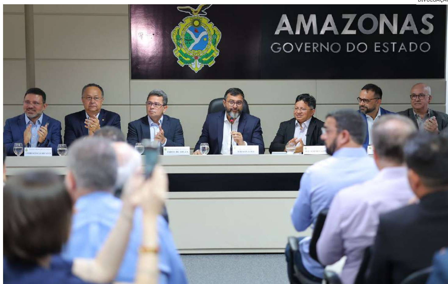
O governador também destacou a importância do empreendimento para o povo Mura, que vive na região e terá as terras indígenas preservadas

O governador também destacou a importância do empreendimento para o povo Mura, que vive na região e terá as terras indígenas preservadas, além de serem beneficiados com o crescimento socioeconômico local. Ele reforçou, ainda, o compromisso do Estado em fiscalizar e cobrar que a empresa Potássio do Brasil cumpra todos os requisitos