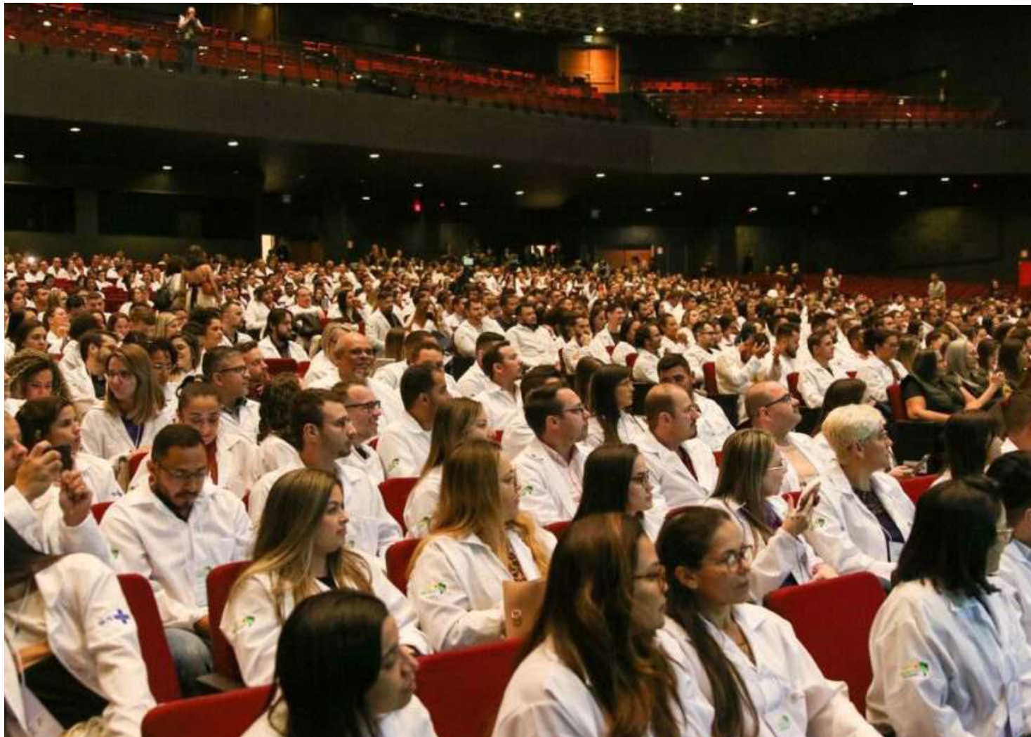
Nas capitais, a média de médicos por mil habitantes alcança o patamar de 7,03, contra 1,89 observada no conjunto das cidades do interior

Para o CFM, o crescimento foi impulsionado por fatores como a expansão do ensino médico, sobretudo nas últimas duas décadas, e pela crescente demanda por serviços de saúde.