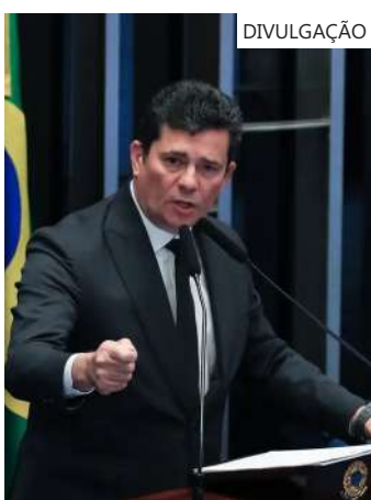
Moro vai surpreendendo e vencendo no TRE