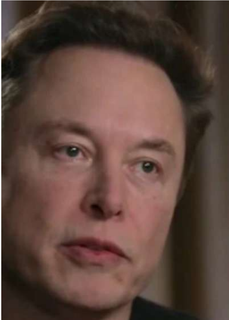
Musk resolve colocar a colher no STF e pede impeachment de Moraes

"Determino, ainda, que a provedora de rede social X se abstenha de desobedecer qualquer ordem judicial