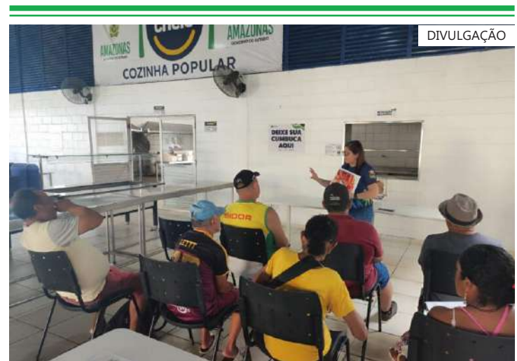
O programa, além de oferecer refeições acessíveis, desempenha um papel fundamental na promoção da saúde e bem-estar da comunidade

Prato Cheio é um programa social que tem como público-alvo as pessoas em situação de vulnerabilidade, entre os quais desempregados, pessoas com deficiência, trabalhadores informais e mulheres que chefiam famílias e que se encontram em situação de extrema pobreza, pobreza ou baixa renda. O programa tem 44