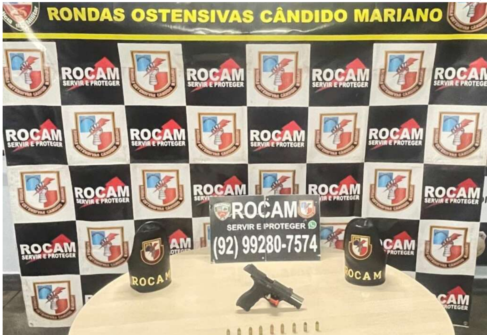
Por volta das 13h30 de domingo, um homem, de 21 anos, foi preso pelo crime de porte ilegal de arma de fogo, na rua Quintino Bocaiúva, no Centro

Ocorrências foram atendidas em Manaus e no município de Canutama