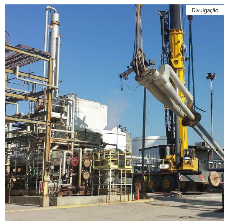
As exportações do Brasil de produtos de alta intensidade tecnológica seguem abaixo do nível de antes da pandemia