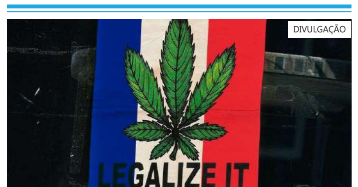
Medicamentos à base de cannabis deverão obter licença do regulador francês até 31 de dezembro deste ano

variações específicas de epilepsia resistentes aos medicamentos; dor neuropática; sintomas oncológicos relacionados a crâncos (uma espécie de tumor); situações paliativas; e patologias que afetam o sistema nervoso, como a esclerose múltipla, informou a RTP.