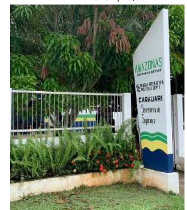
O homem foi preso momentos após matar a vítima