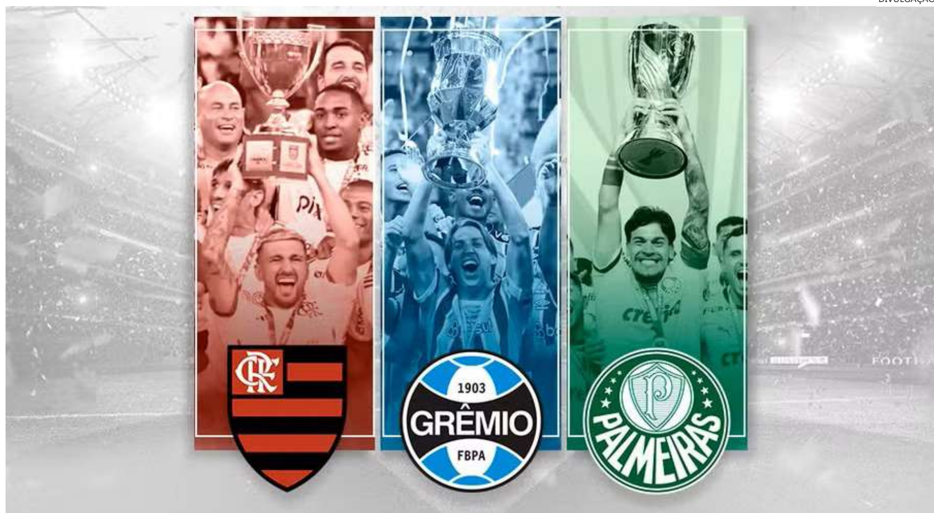
Flamengo, Grêmio e Palmeiras estão empatados entre os times com mais títulos nos últimos 10 anos

Dividindo a liderança, o Flamengo tem a maioria das