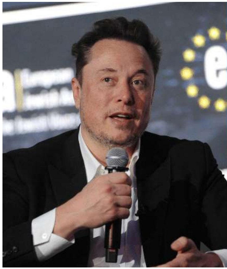
Dúvidas sobre se a plataforma pode ser retirada do ar no Brasil por determinação judicial

Depois, o bilionário compartilhou uma série de mensagens criticando o ministro e o acusando de praticar "censura" e "violar a lei" brasileira. Sobre a questão da censura, Marcelo Crespo explica que a