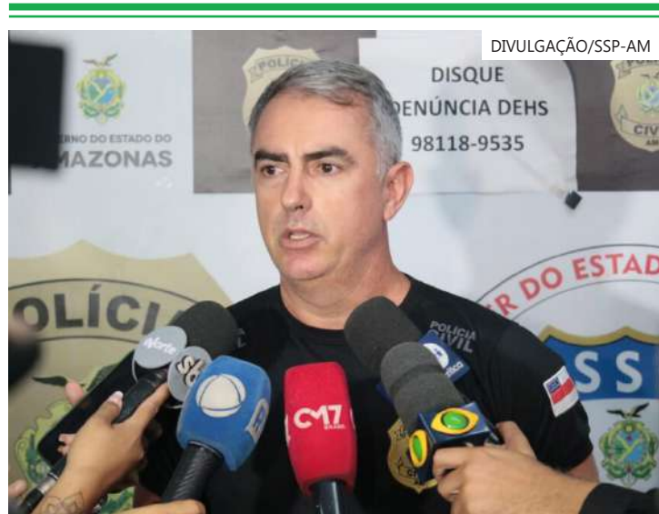
Ele responderá por homicídio culposo e lesão corporal culposa no trânsito

O indivíduo passará por audiência de custódia e ficará à disposição da Justiça.