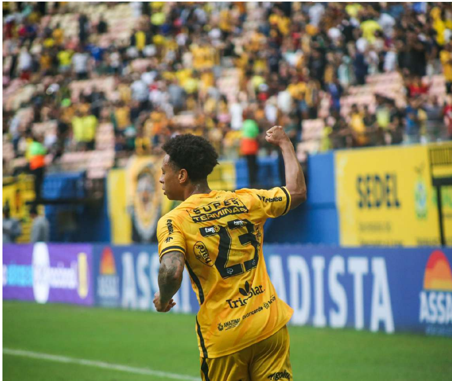
Partida válida pela 4ª rodada da Série B do Campeonato Brasileiro

No próximo sábado, na Arena da Amazônia, o Amazonas FC busca reabilitação no Brasileirão Série, com um ponto, a equipe vem de derrota fora de casa para a Ponte Preta. O Santos está invicto na competição, conquistando três vitórias em três rodadas, além de possuir o melhor ataque e defesa da competição.