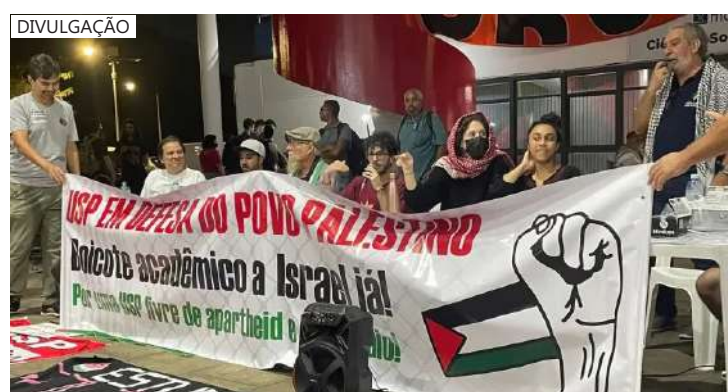
Participam do encontro 150 pessoas

O governo brasileiro, por meio do Itamaraty, condenou a ação das forças armadas de Israel, em Rafah, alegando que essa ação mostra um desdém pela observância aos princípios básicos dos direitos humanos e humanitário.