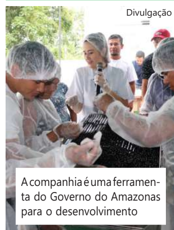
A companhia é uma ferramenta do Governo do Amazonas para o desenvolvimento

tado do Amazonas; o início do Programa Social e Ambiental dos Igarapés de Manaus (Prosamin); todas as etapas da Ponte Rio Negro; o Ginásio Amadeu Teixeira; além de projetos implementados no interior, como o Programa de Desenvolvimento Regional do Alto Solimões, executado em parceria com Banco Mundial (Bird), que mudou a realidade socioeconômica naquela região, com ações integradas de desenvolvimento, saneamento e saúde.