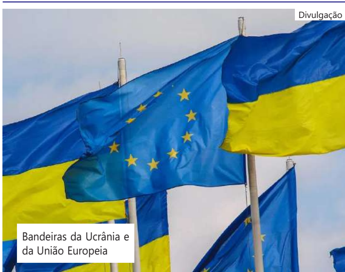
Bandeiras da Ucrânia e da União Europeia

A Euroclear disse que obteve 1,6 bilhões de euros em juros dos ativos no primeiro trimestre, dos quais quase 400 milhões de euros foram impostos para a Bélgica.