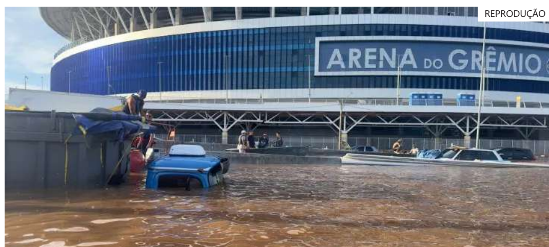
Uruguai disponibilizou helicópteros para auxiliar nos resgates, enquanto Argentina vai enviar pastilhas purificadoras de água

O Uruguai, país que faz fronteira com o estado, já anunciou a disponibilização de helicópteros para auxílio nos resgates. Já a Argentina, outro país fronteiriço com o Rio Grande do Sul, vai enviar pastilhas purificadoras de água. Há falta de água para consumo e higiene básica, principalmente na Região Metropolitana de Porto Alegre.