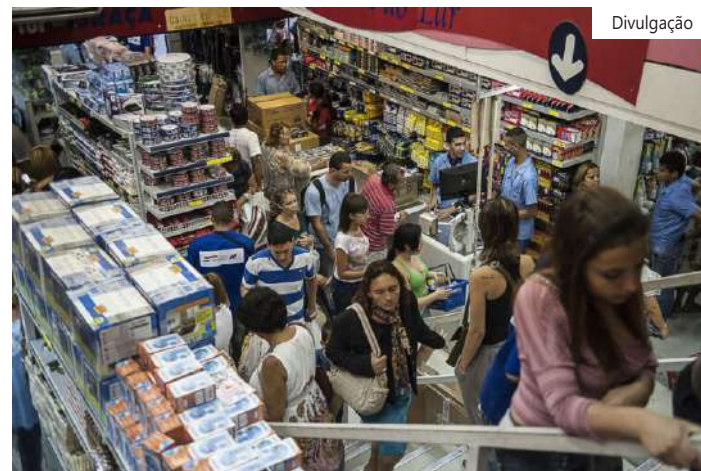
Expectativa em pesquisa da Reuters era de baixa de 0,10% na comparação mensal e de avanço de 5,05% sobre um ano antes

A única atividade a apresentar aumento das vendas foi Artigos farmacêuticos, médicos, ortopédicos e de perfumaria, de 1,4%.