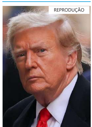
Reprodução Ex-presidente norte-americano, Donald Trump

O advogado de Trump, Steve Sadow, disse que o