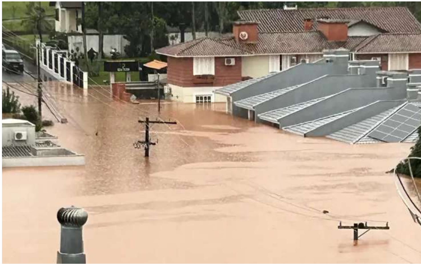
Leite solicitou ao Ministério da Justiça mais homens da Força Nacional

Outra medida será a contratação temporária de policiais da reserva.