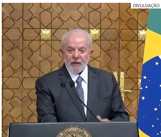
Lula afirma que Brasil precisa avançar em infraestrutura

lugar do país e do mundo. Não é apenas agora. Temos tempo de mudar isso e é por isso que estamos muito empenhados em fazer uma COP30 no estado do Pará, em que a gente vai pedir para a Amazônia falar para o mundo”, completou, ao se referir ao evento programado para 2025.