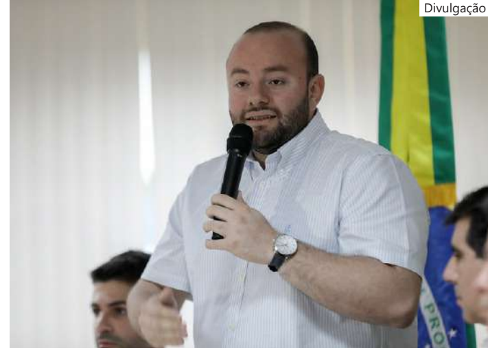
À frente da Sedurb, secretário destaca importância do evento

Após 10 anos, será realizada a 6ª Conferência Nacional das Cidades, sendo a primeira convocação feita pelo Governo do Amazonas através da Sedurb.