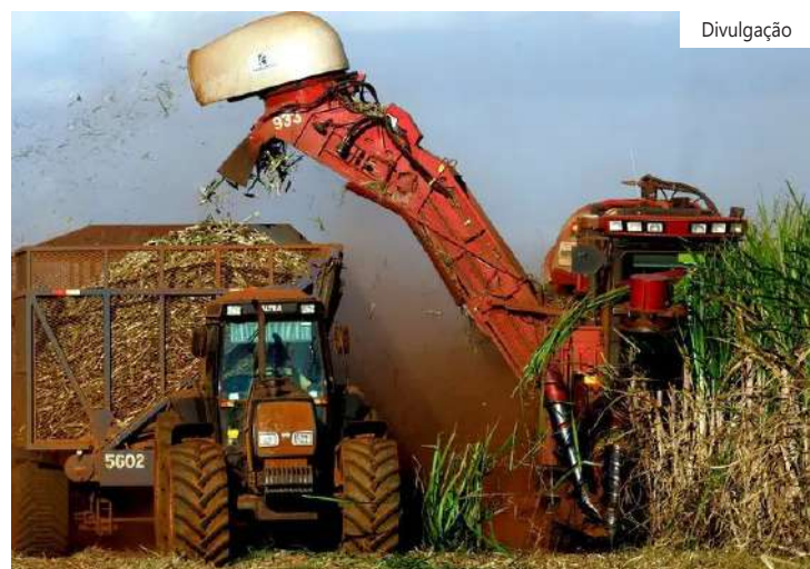
Desempenho foi resultado de exportações de US$ 30,9 bilhões, contra importações de US$ 21,9 bilhões

No acumulado do ano, comparando com igual período do ano anterior, o desempenho mostrou crescimento de US$ 0,27 bilhões (16,5%) em Agropecuária; queda de US$ 600 milhões (-10,1%) em Indústria Extrativa e crescimento de US$ 2,08 bilhões (2,9%) em produtos da Indústria de transformação.