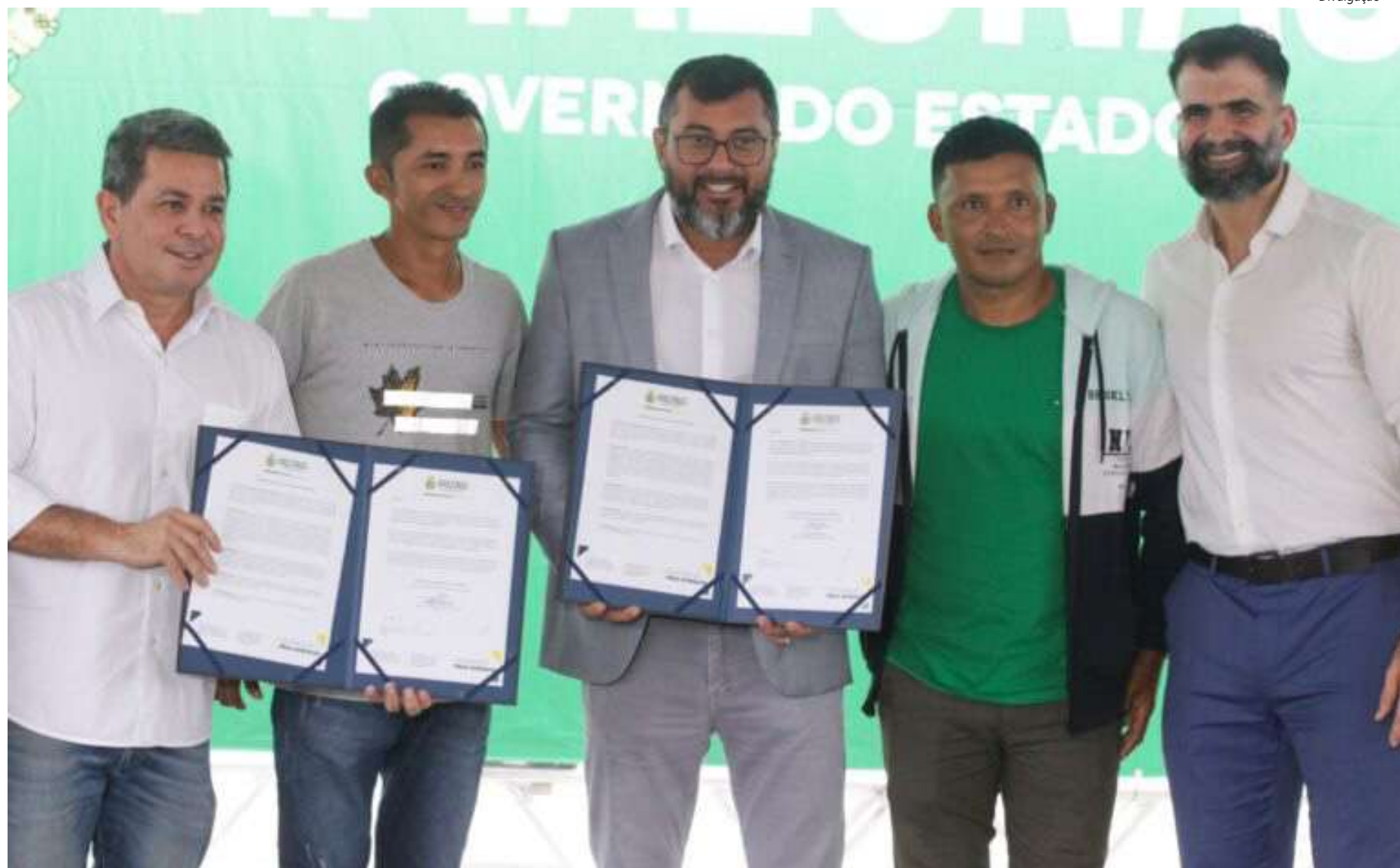
O resultado foi publicado pelo Governo do Amazonas no Diário Oficial do Estado, no dia 3 de maio

O resultado foi publicado pelo Governo do Amazonas no Diário Oficial do Estado, no dia 3 de maio. Os proponentes vencedores serão responsáveis por implementar projetos ambientais capazes de gerar novos créditos de carbono nas UC pretendidas. As iniciativas devem gerar benefícios dire-