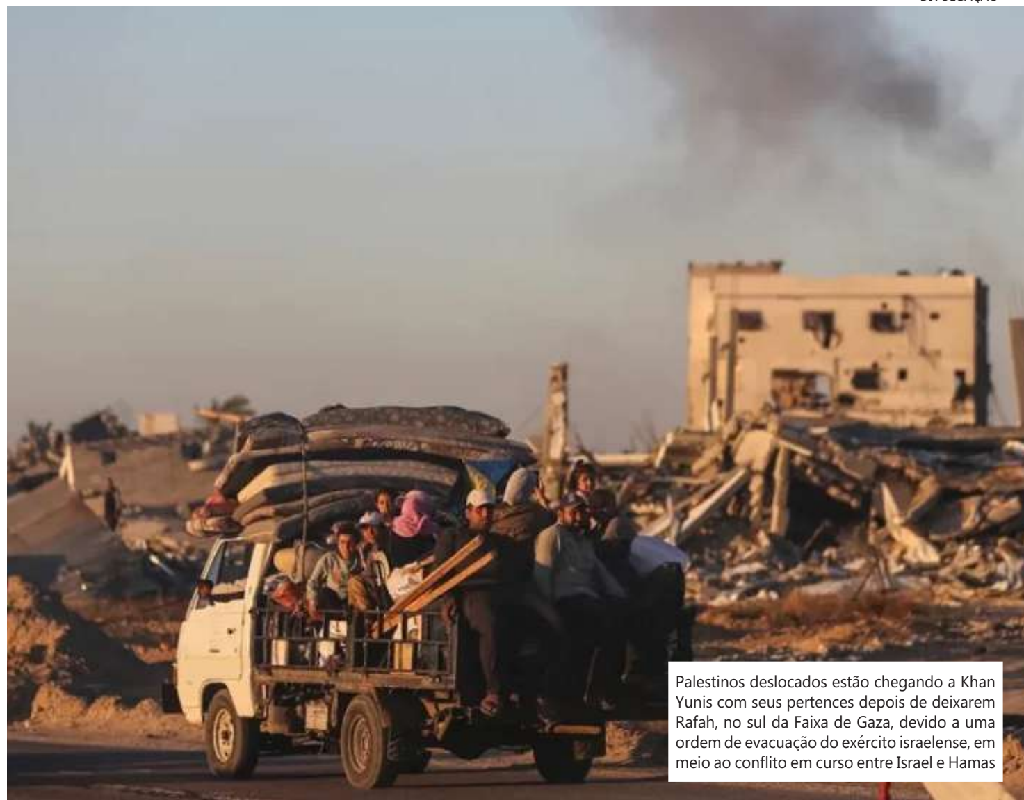
Palestinos deslocados estão chegando a Khan Yunis com seus pertences depois de deixarem Rafah, no sul da Faixa de Gaza, devido a uma ordem de evacuação do exército israelense, em meio ao conflito em curso entre Israel e Hamas

Na segunda-feira (6), Israel realizou o que os EUA descreveram como uma operação "limitada" em Rafah, assumindo a passagem da fronteira com o