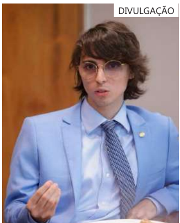
Pré-candidato a prefeito divide o dia de trabalho entre Manaus e Brasília

essa especificação já é regulamentada em diversos estados, mas Mandel acredita que uma lei federal irá facilitar o acesso aos direitos para a população com deficiência, especialmente o autismo, e evitará burocracia. “Se a pessoa precisar se deslocar, não tem condições de ficar repetindo o mesmo processo em todo lugar que ela vá. Essa é uma burocracia desnecessária; podemos simplificar”, opinou o parlamentar.