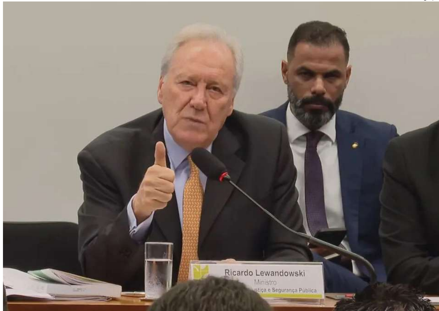
Ministro enviou ontem pedido à PF para que se apure a divulgação de informações sem veracidade

Ontem, o ministro enviou pedido à PF para que se apure a divulgação de in-