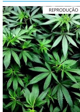
Reprodução Planta de maconha

Os comentários de Srettha vieram depois de uma reunião com agências envolvidas na repressão ao narcotráfico, na qual ele prometeu adotar uma posição dura em relação