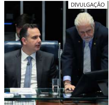
Senadores aceleram ajuda às vítimas das enchentes no RS

O número de municípios do Rio Grande do Sul afetados pelas fortes chuvas chega a 401, e já foram confirmadas 95 mortes decorrentes dos temporais. O número de desaparecidos no estado chegou a 131 e o de desalojados passa de 159 mil.