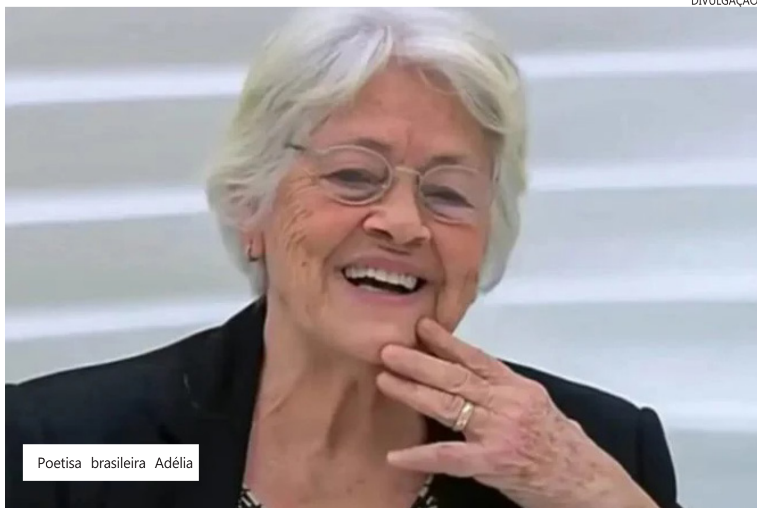
Poetisa brasileira Adélia

do é autora de uma obra muito original, que se estende ao longo de décadas, com destaque para a produção poética. Herdeira de Carlos Drummond de Andrade, o autor que a deu a conhecer e