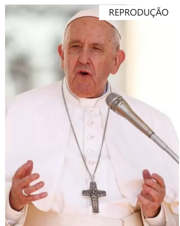
Papa Francisco durante audiência geral semanal no Vaticano

Francisco emitiu um alerta sobre os perigos e desafios da mudança climática e sobre a