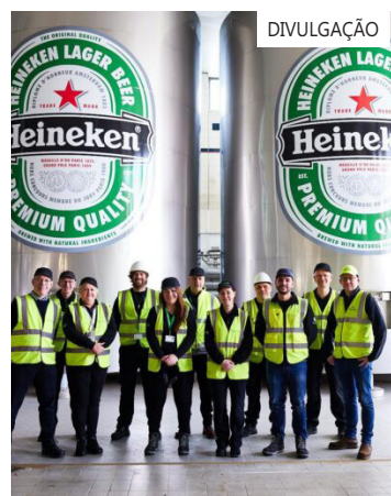
investimentos iniciais combinados de aproximadamente R$ 150 milhões