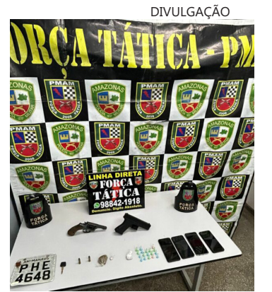
Um dos suspeitos portava um revólver

O trio foi conduzido ao 6º Distrito Integrado de Polícia (DIP).