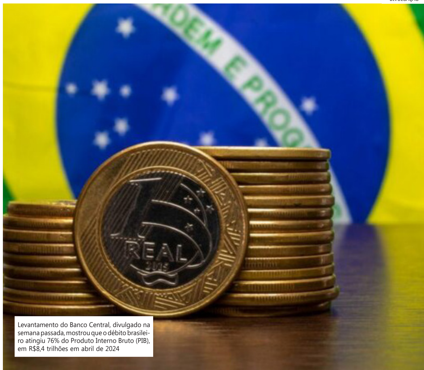
Levantamento do Banco Central, divulgado na semana passada, mostrou que o débito brasileiro atingiu 76% do Produto Interno Bruto (PIB), em R$8,4 trilhões em abril de 2024

O avanço da dívida pública reflete diretamente