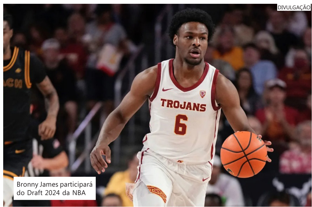
Bronny James participará do Draft 2024 da NBA

Em abril, o armador usou as redes sociais para confirmar que estava elegível para o Draft da NBA. O jogador de 19 anos disputou apenas uma temporada na faculdade, defendendo a Universidade do Sul da Califórnia. Em julho do ano passado, Bronny sofreu uma parada cardíaca após um treino com a equipe. Ele foi autorizado a voltar ao esporte apenas em novembro de 2023.