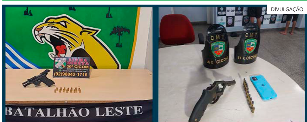
As equipes policiais conseguiram realizar as prisões através de denúncias anônimas

ções, identificou-se que diversas fazendas próximas, em nome de pessoas diversas, tiveram suas florestas intensamente desmatadas, com característica de ação de desmate em bloco, ou seja, uma decisão em comum entre os posseiros de tais áreas, visto a dimensão e a rapidez dos desmatamentos", destacou a PF.