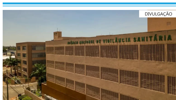
Conselho Federal de Farmácia apoia restrição imposta por agência

“A resolução é positiva no sentido de ordenar fluxos relacionados ao uso do fenol, que vinha sendo comercializado sem maior controle até mesmo pela internet. No entanto, entende-se que a regra necessita de ajustes, pois se mostra excessiva ao proibir o uso do fenol também pelos médicos, os quais constituem um grupo de profissionais capacitados e habilitados para seu manuseio em tratamentos oferecidos aos pacientes em locais que obedeçam às normas da vigilância sanitária”, destaca o ofício do Conselho Federal de Medicina (CFM).