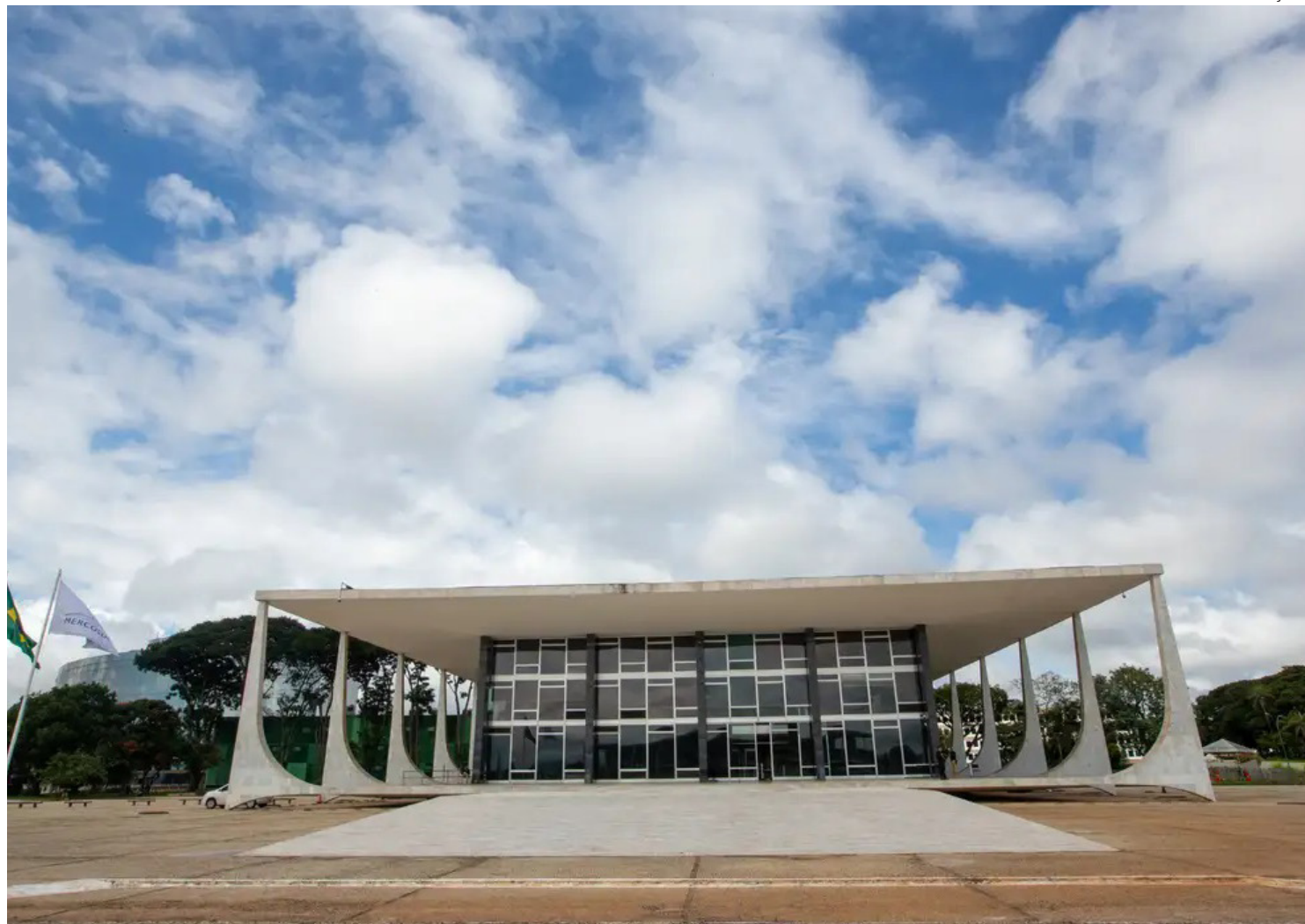
Supremo Tribunal Federal (STF)

quadrar como traficantes pessoas que forem abordadas com uma quantidade