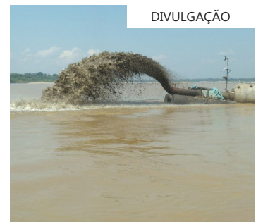
Ações contra a estiagem

“O DNIT se prepara para assinar nas próximas semanas as Ordens de Serviço no trecho Norte do Rio Paraguai, entre os municípios de Cáceres, no estado do Mato Grosso, e Corumbá, no estado do Mato Grosso do Sul, além do Rio Taquari, no estado do Rio Grande do Sul. Com uma extensão navegável de 86,5 quilômetros, a hidrovia do rio Taquari conecta o porto rodo-hidro-ferroviário de Estrela aos portos de Porto Alegre e Rio Grande, passando por terminais de uso privado nas margens das hidrovias estaduais.