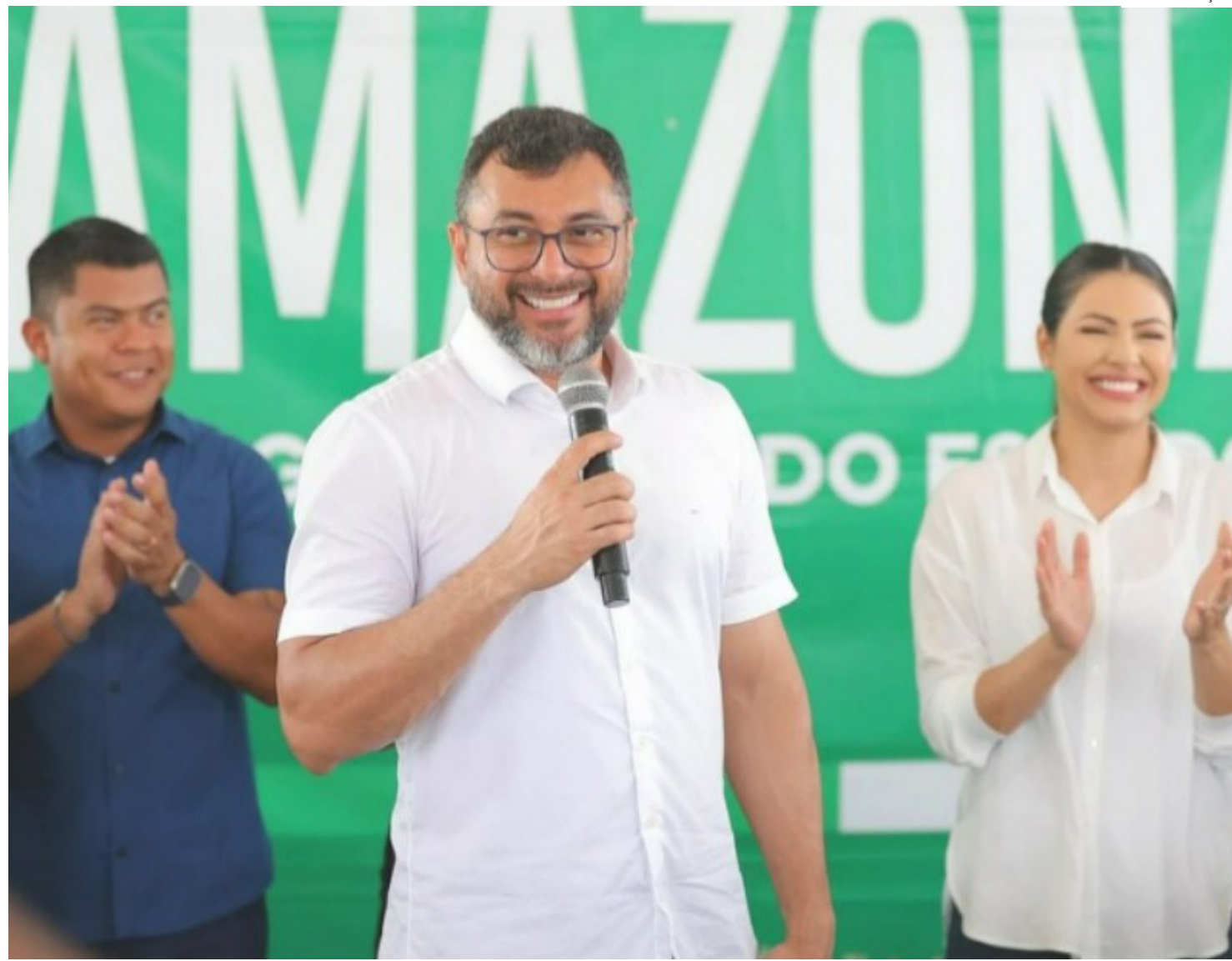
Wilson Lima está no segundo mandato, como forte liderança política no Amazonas