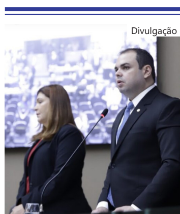
Deputados analisam orçamento do Governo do Amazonas para 2025