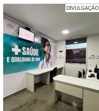
A reforma realizada no local permitiu aumentar de cinco para oito o número de consultórios médicos

Além disso, a Policlínica Codajás conta com uma unidade do Componente Especializado de Assistência Farmacêutica (Ceaf), que distribui medicamentos de alto custo para pacientes inseridos no Sistema Único de Saúde (SUS) com diagnóstico especializado.