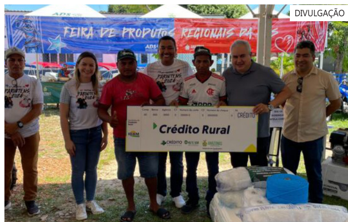
Viabilizado pelo Idam e Afeam, o recurso teve como destino a aquisição de equipamentos e implementos de pesca, além do custeio da atividade