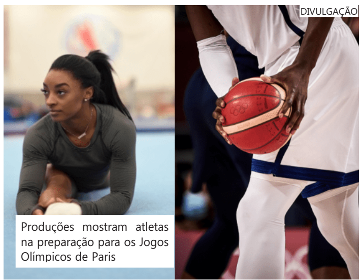
Produções mostram atletas na preparação para os Jogos Olímpicos de Paris

Sinopse: Esta série acompanhará candidatas a medalhas e aspirantes promissores no basquete masculino, enquanto equipes de todo o mundo competem na Olimpíada de Paris 2024 e nos eventos de qualificação que antecedem as Olimpíadas. Juntamente com o acesso exclusivo aos bastidores, a história de como o basquete se tornou tão competitivo será globalmente explorada por meio de gerações de lendas.