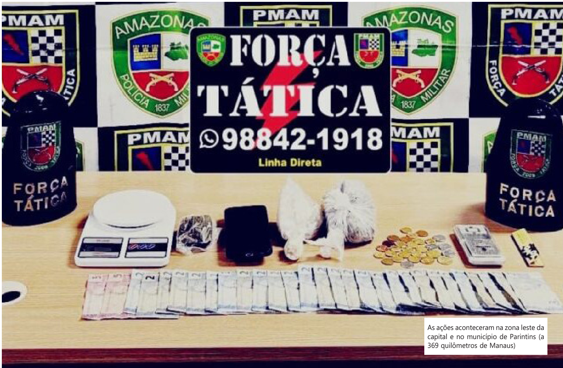
As ações aconteceram na zona leste da capital e no município de Parintins (a 369 quilômetros de Manaus)