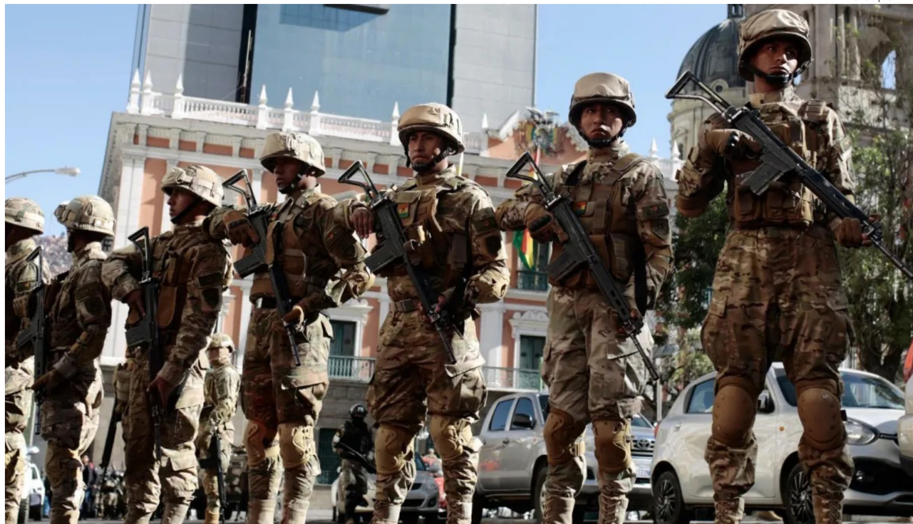
Soldados montam guarda na Plaza Murillo em 26 de junho de 2024 em La Paz, Bolívia

O presidente da Bolívia, Luis Arce, denunciou um possível levantamento militar no país depois de grupos