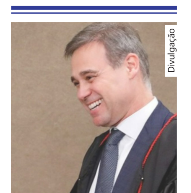
Mendonça tem longa trajetória no judiciário brasileiro

Antes de assumir uma cadeira no STF, em 16 de dezembro de 2021, foi diretor do Departamento de Patrimônio e Probidade da Advocacia-Geral da União (AGU), sendo vencedor da categoria especial do Prêmio Innovare, com o tema "combate ao crime organizado".