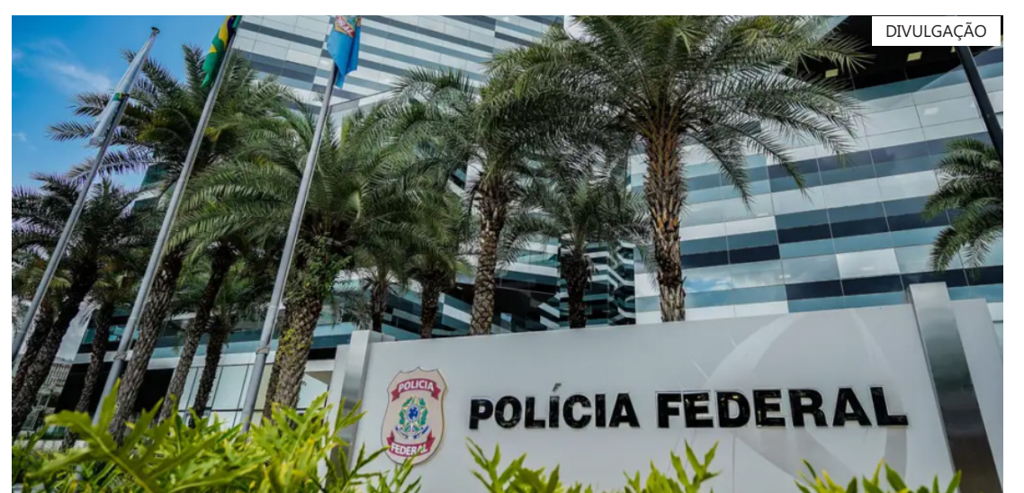
Ação cumpre oito mandados de busca e apreensão em dois estados, diz PF