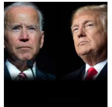
Presidente norte-americano, Joe Biden e ex-presidente dos EUA, Donald Trump