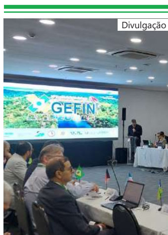
O evento reúne técnicos dos 26 estados da Federação e do Distrito Federal