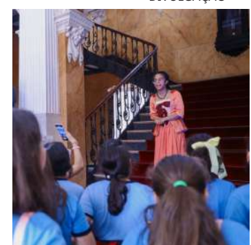
A celebração aos 18 anos de CCPJ, ocorreu de 9h às 17h da quarta-feira