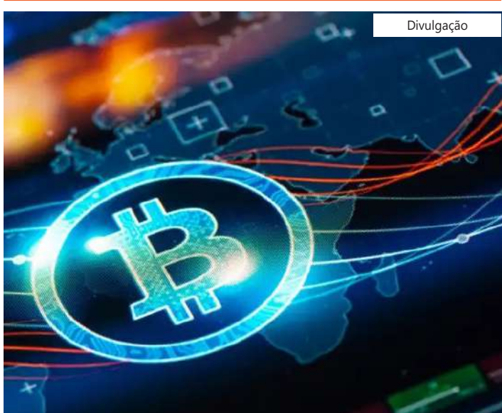
Ethereum e principais criptos também operam no campo negativo nesta tarde

As principais criptomoedas operam no vermelho. Entre os tokens pequenos, apenas três sobem nesta tarde. Em Wall Street, os principais índices também estão no campo negativo. Dow Jones cai -0,70%, S&P 500 recua -0,25% e Nasdaq encolhe -0,12%.