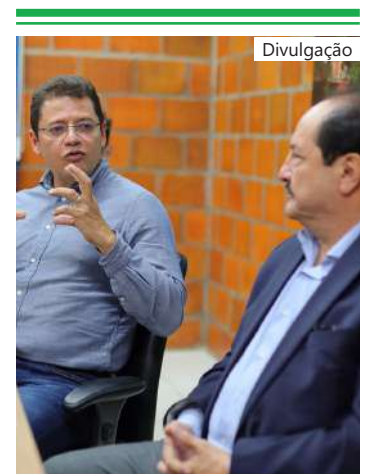
O objetivo é ampliar o acesso da população a serviços adequados de água, esgoto e manejo de resíduos

Este diagnóstico incluirá aspectos como organização comunitária, participação social, abastecimento de água, esgotamento sanitário, manejo de resíduos sólidos e águas pluviais, entre outros.