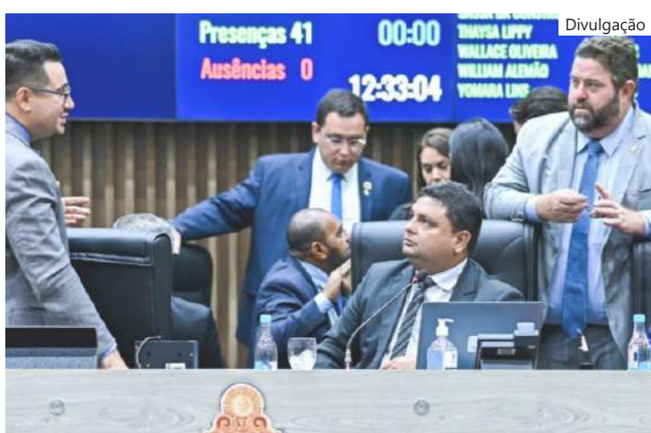
Vereadores de Manaus focam na paisagem urbanística da cidade

A defesa de Chiquinho Brazão também alegou que as acusações não têm ligação com seu mandato parlamentar e disse que não há provas da ligação dos irmãos com ocupação ilegal de terrenos no Rio de Janeiro.