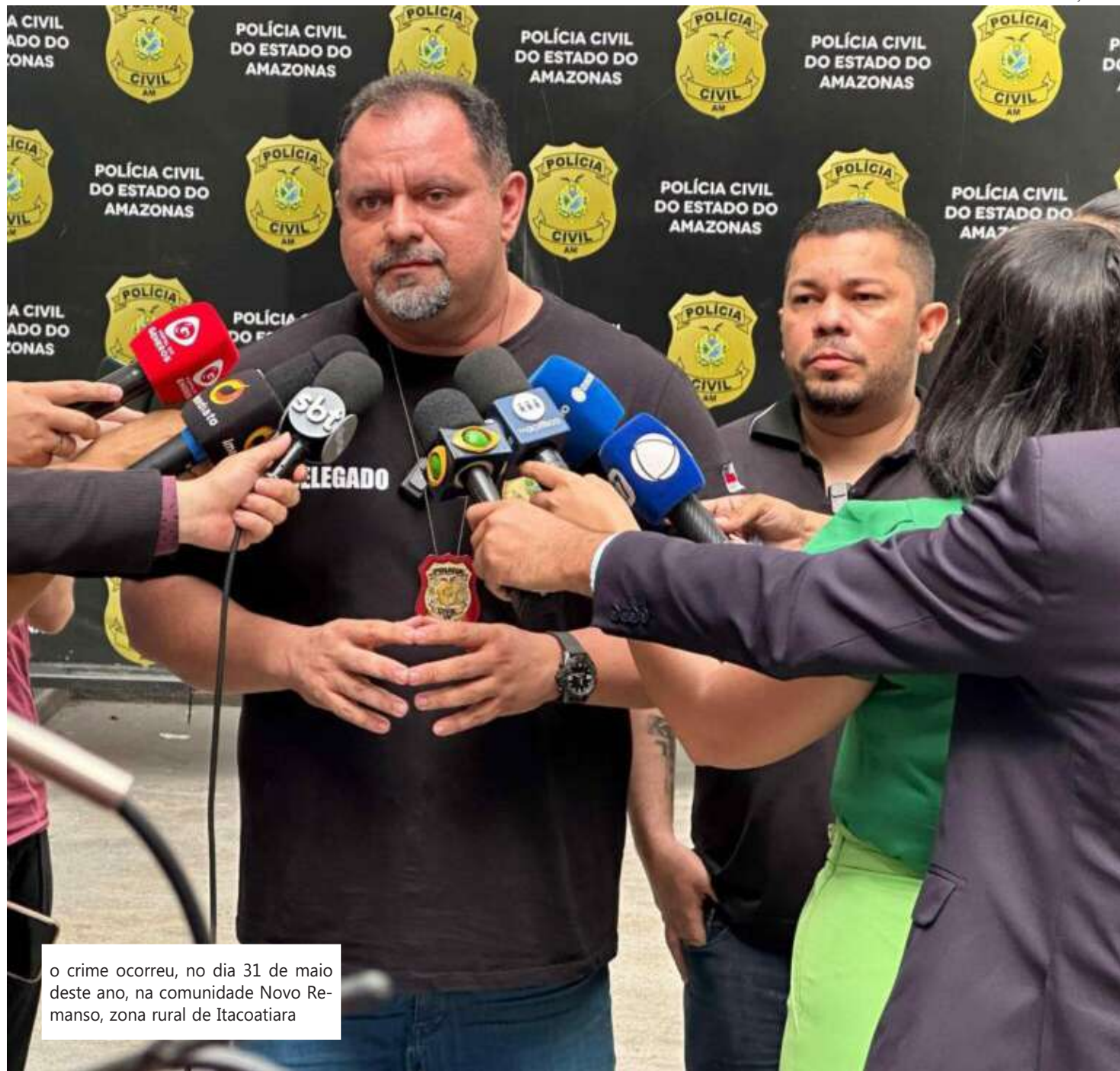
o crime ocorreu, no dia 31 de maio deste ano, na comunidade Novo Remanso, zona rural de Itacoatiara

O delegado enfatizou, ainda, que o reforço dos