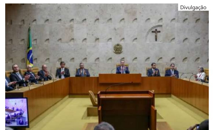
Caso Marielle Franco volta à pauta no Supremo