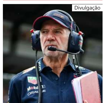
Adrian Newey deixará a Red Bull em 2025

Considerado o "mago da F1", o britânico de 65 anos fez história na categoria com passagens marcantes por Williams, McLaren e Red Bull. Entre 1992 e 2023, seus carros conquistaram 13 títulos do Mundial de Pilotos e 12 do Mundial de Construtores.