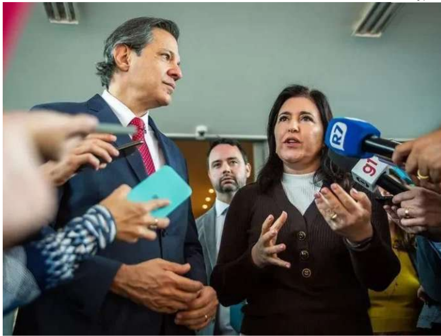
Ministros Fernando Haddad (Fazenda) e Simone Tebet (Planejamento) falam com jornalistas após reunião 13/06/2024

Os ministros da equipe econômica do governo Fernando Haddad (Fazenda) e Simone Tebet (Planejamento) defenderam nesta quinta-feira (13) uma agenda de revisão de gastos do governo. As declarações vêm em meio ao ceticismo do mercado financeiro quanto ao fiscal do país, que tem focado mais em aumentar tributos para arrecadar do que propostas efetivas para cortar despesas. Os ministros falaram em conjunto na portaria do Ministério da Fazenda após uma reunião ocorrida nesta manhã para debater sobre este tema.