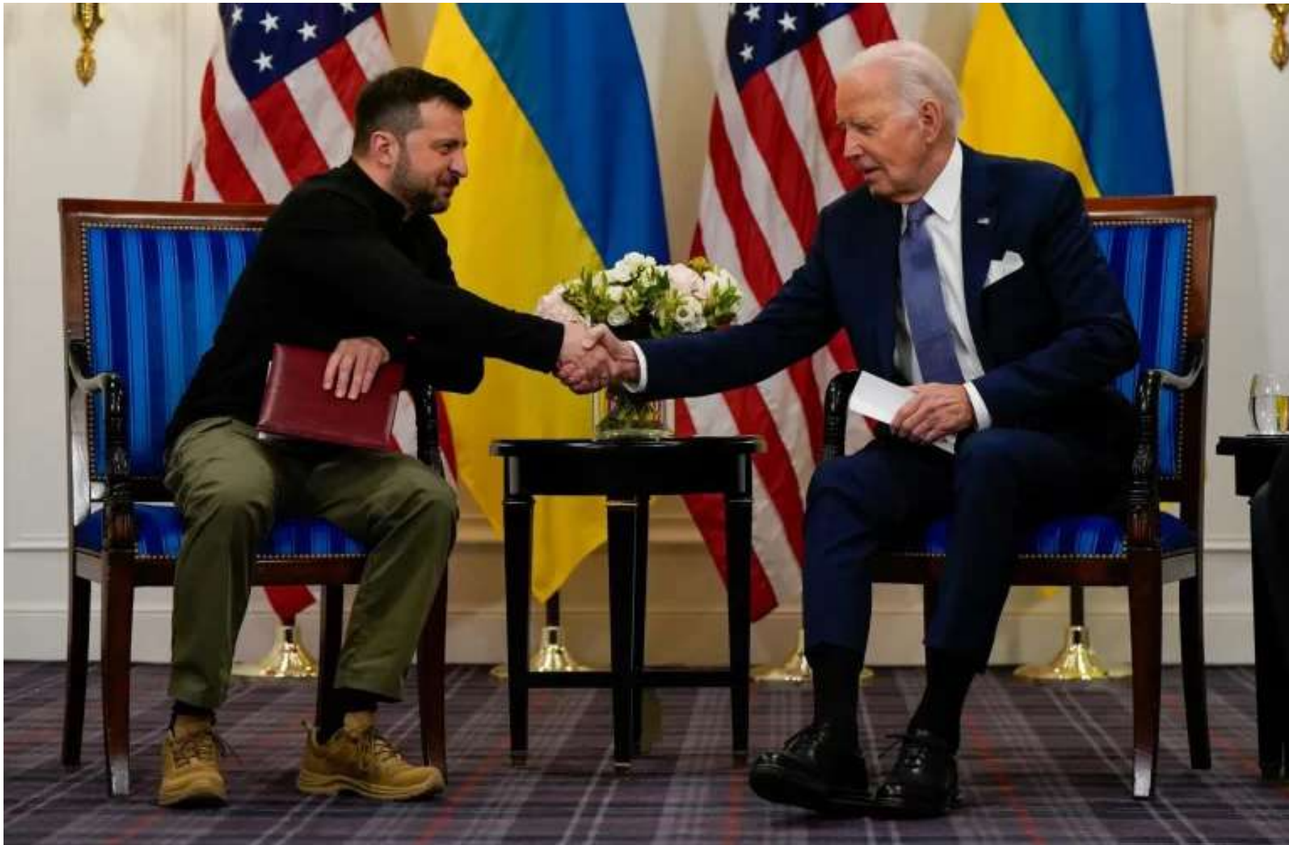
Joe Biden e Volodymyr Zelenskiy em Paris

O acordo, assinado à margem da cúpula do G7 na Itália, pretende ser um passo em direção à eventual adesão da Ucrânia à Otan