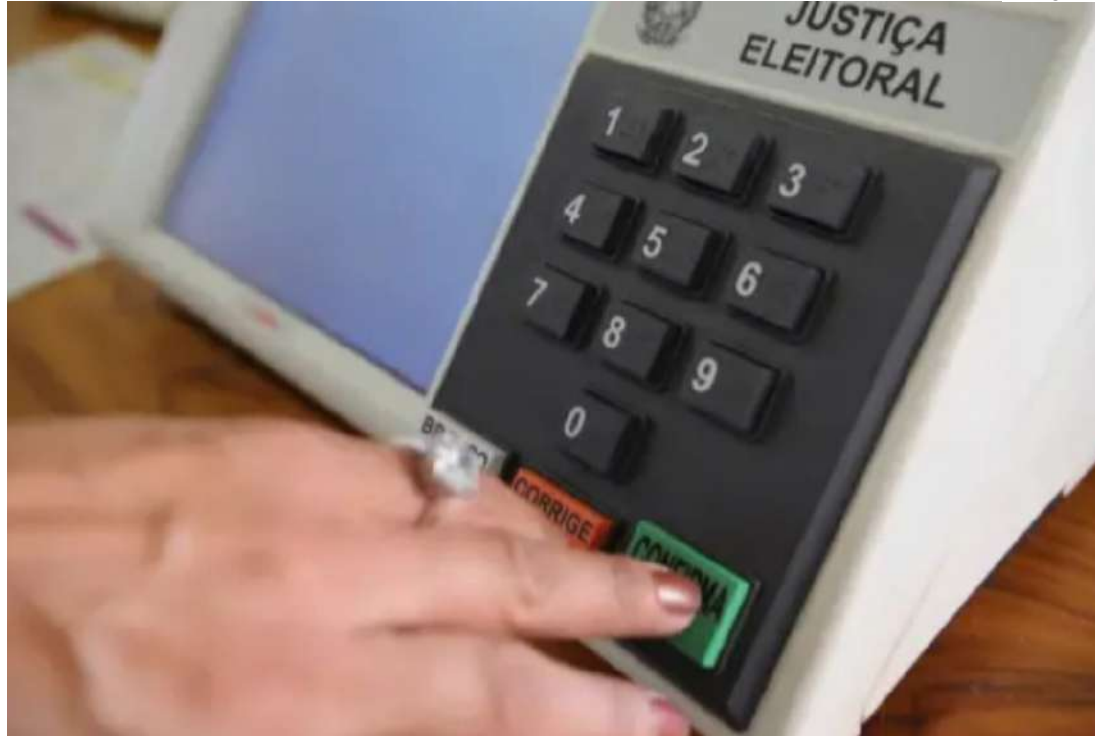
Eleitor pode levar cola, mas o voto continua secreto no Brasil em 2024

Já para o cargo de prefeito, são apenas dois dígitos. Confira as fotos, o número, os nomes do candidato e do vice e a sigla do partido. Se as informações estiverem corretas, é só clicar no botão "CONFIRMA".