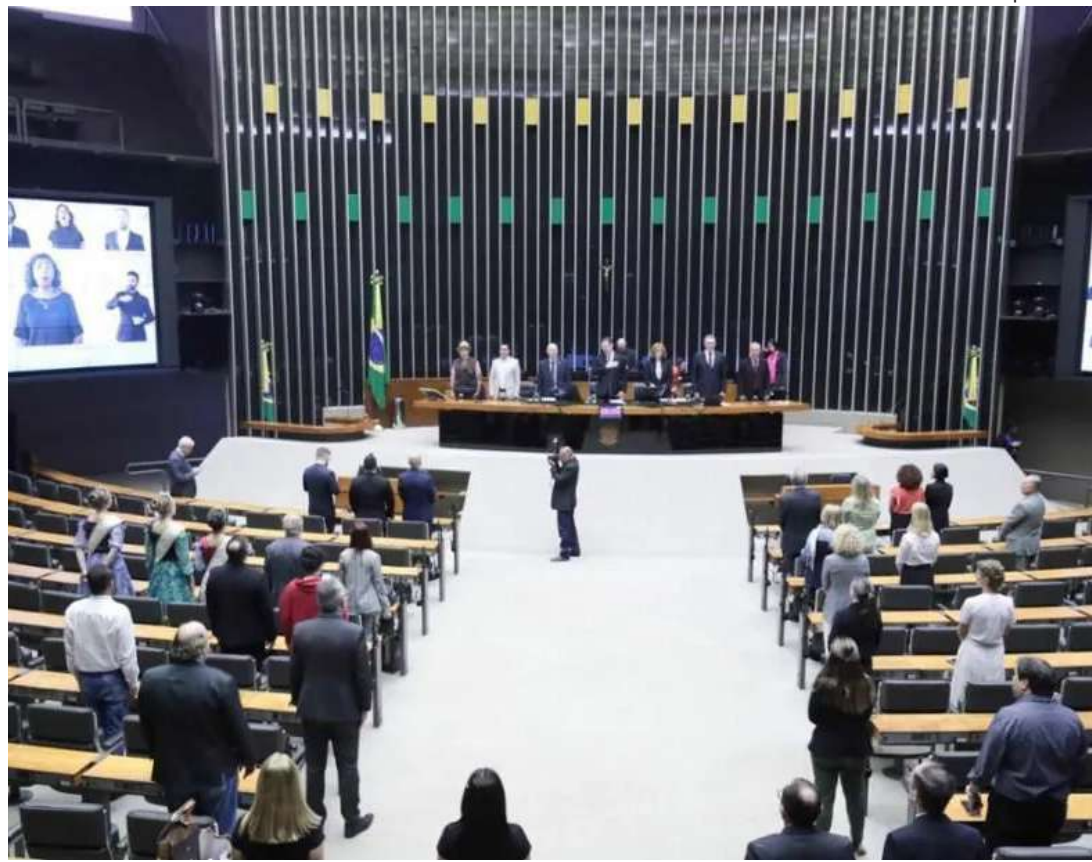
Projeto que equipara pena do aborto até 22 semanas de gestação ao de homicídio simples prevê até 20 anos de prisão

Aprojetado de lei 1904/2024, que pode promover uma pena maior a mulher do que ao em caso de aborto do que ao esturpador, foi apro-