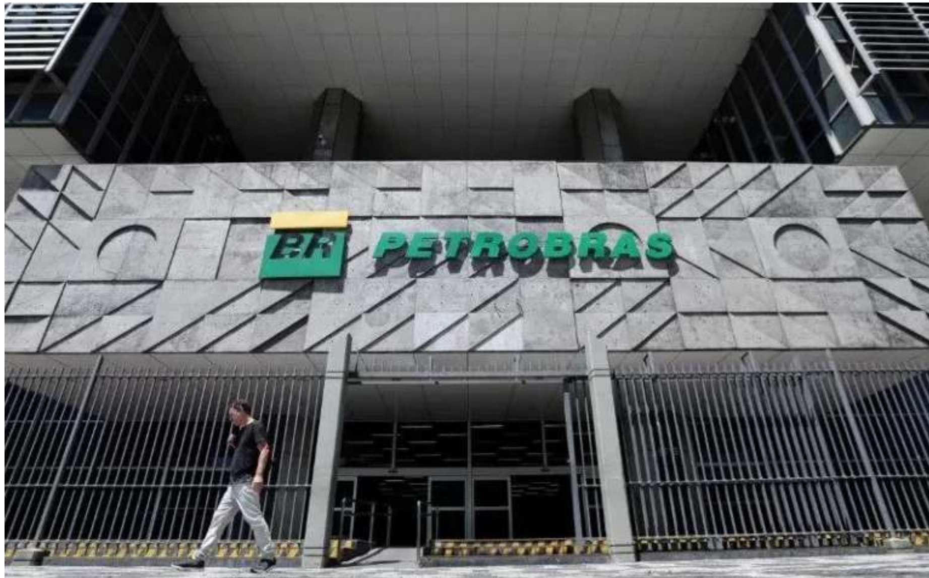
Os litígios estão relacionados às discussões sobre incidência do IRRF, da Cide, do PIS e da Cofins sobre remessas ao exterior