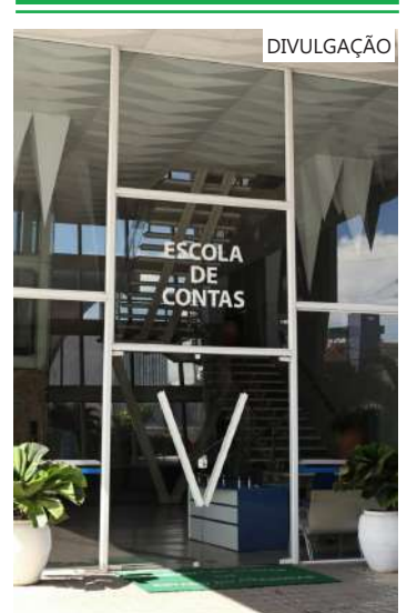
Escola de Contas Públicas do Tribunal de Contas do Amazonas

O curso faz parte do Programa de Capacitação dos Jurisdicionados do Estado do Amazonas (PJAM) que tem o objetivo de qualificar os servidores a partir de cursos e formações promovidos pela ECP da Corte de Contas.