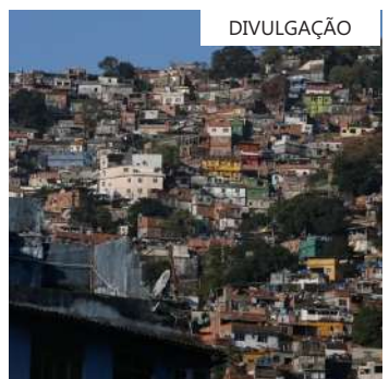
O MP-RJ apresentou uma nova visão sobre temas tratados no processo

O MPRJ apresentou, ainda, análise sobre resoluções recém-editadas pelo Estado do Rio para tratar do protocolo de segurança e prevenção de incidentes em unidades escolares estaduais; da capacitação de agentes de segurança para prestar atendimento hospitalar tático; do serviço de atendimento psicológico da tropa; do sistema de controle de armas, munições e demais materiais bélicos; e da meta sugerida de redução da letalidade policial.