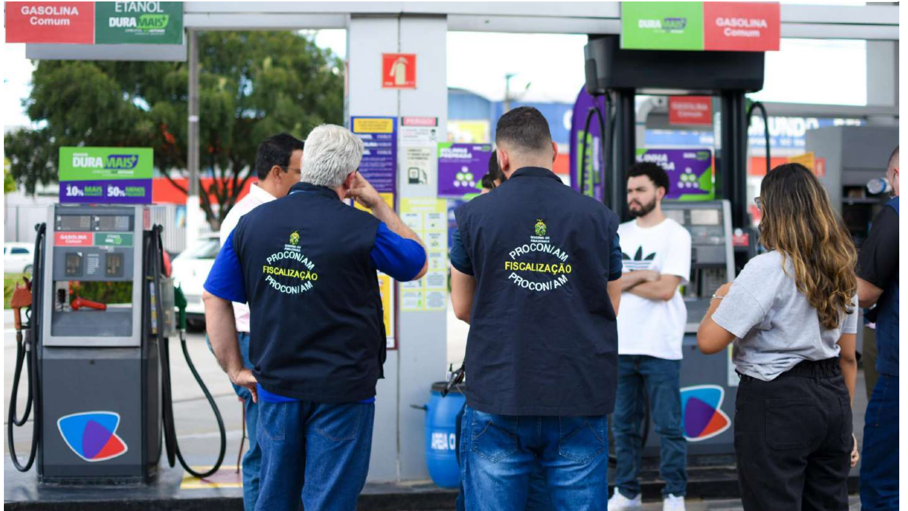
O posto de gasolina foi notificado e tem um prazo de 10 dias para fornecer esclarecimentos