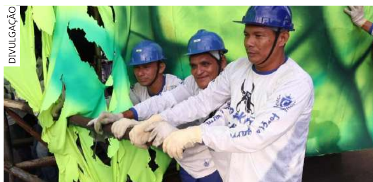
O evento acontece nos dias 28, 29 e 30 de junho.

"A gente sabe que a alegoria é muito dentro do Bumbódromo, mas é muito legal esse momento e a Nação Azul e Branca, poder vir dizer o nosso muito obrigado pelo empenho, pela dedicação e pela doação que eles têm feito. Será um grande festival e o Caprichoso sobe a régua do espetáculo e os nossos artistas merecem esse abraço", disse Amoedo.