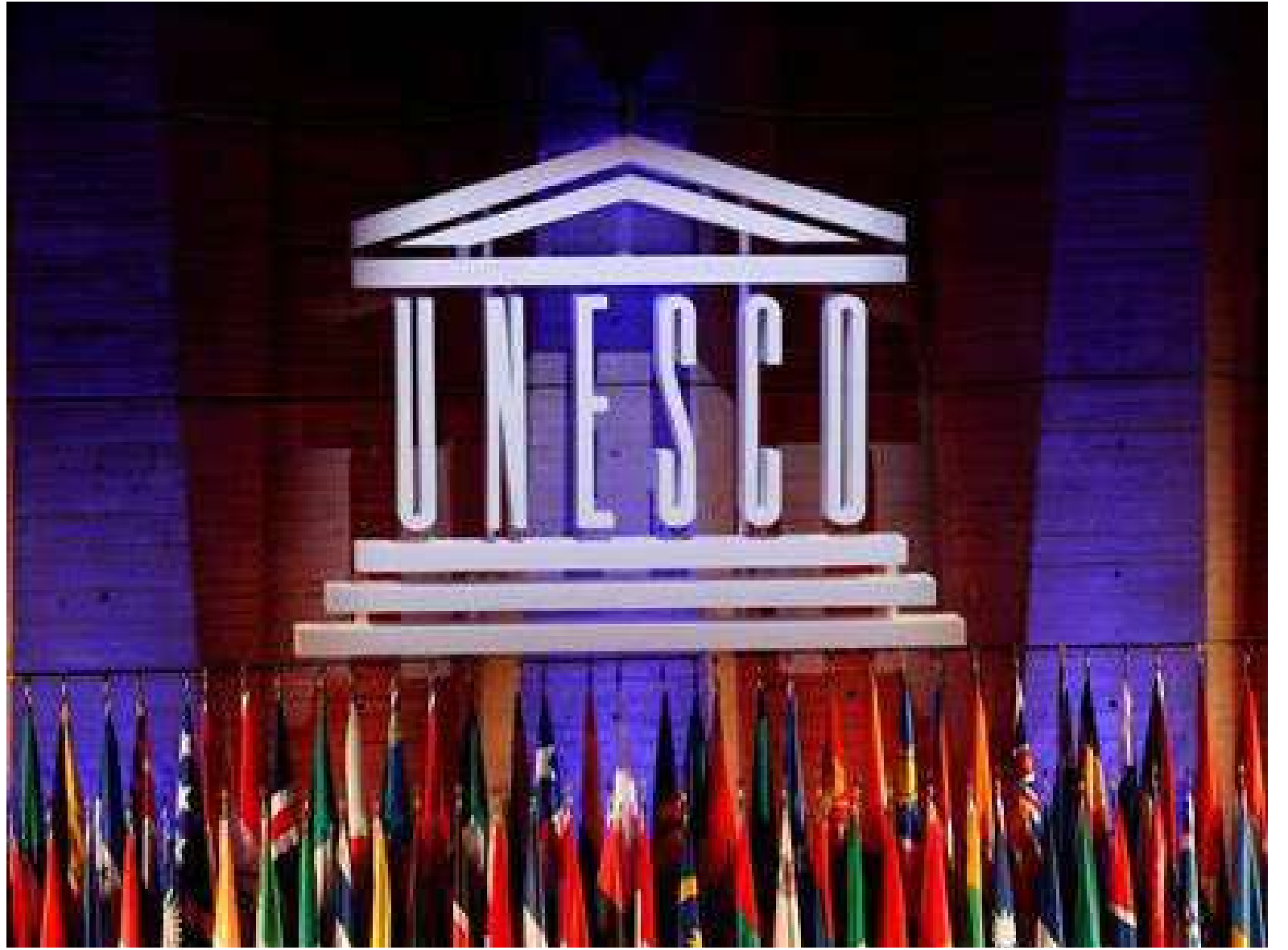
Sede da UNESCO

O Brasil tem um representante participando, mas o projeto de lei sobre fake news está travado no Congresso. A iniciativa se inspira na legislação europeia, mas enfrenta resistências para avançar.