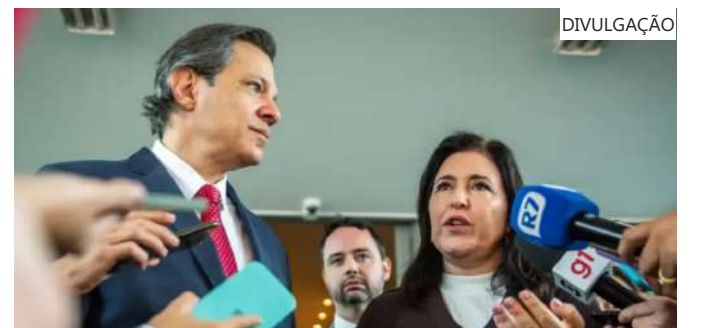
Lula cobra ministros e teme que as contas do governo não fechem

Segundo Tebet, Lula pediu que a equipe econômica apresente alternativas para reduzir os inventivos fiscais e os subsídios. "O presidente ficou extremamente impressionado, mal impressionado, com o aumento dos subsídios, que está batendo quase 6% do PIB [Produto Interno Bruto] do Brasil", acrescentou.