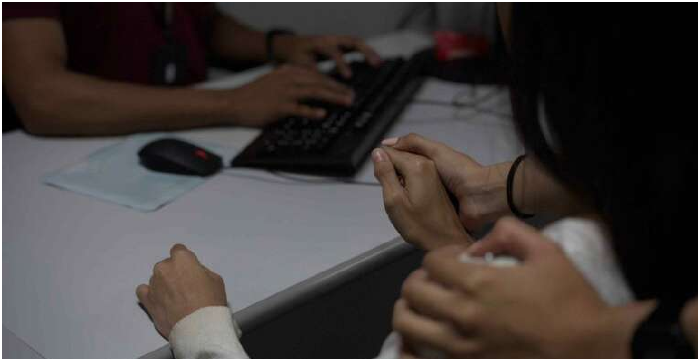
Segundo a delegada, a principal prevenção para os crimes contra crianças e adolescentes é a atenção dos pais ou responsáveis

Por se tratar de um grande evento, um dos crimes mais pausados é o turismo sexual infanto-juvenil