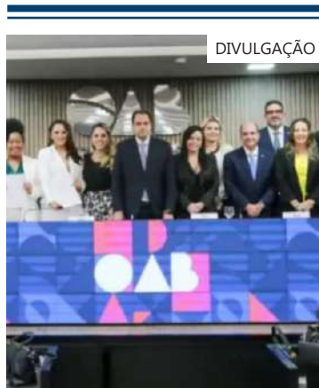
OAB diz que Lei do Aborto é uma aberração jurídica no Brasil