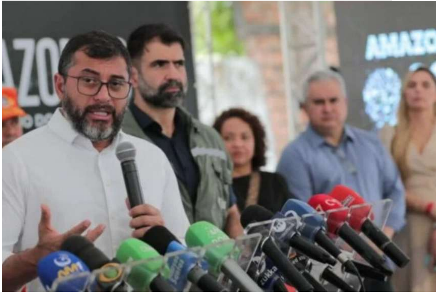
Wilson Lima disse que o Amazonas está à espera de ajuda

Governo do Estado do Amazonas realizou uma série de reuniões com o Governo Federal para solicitar ajuda para o enfrentamento da estiagem de 2024, além de encontro com o vice-presidente e ministro do Desenvolvimento, Indústria, Comércio e Serviços, Geraldo Alckmin, para tratar sobre o tema.