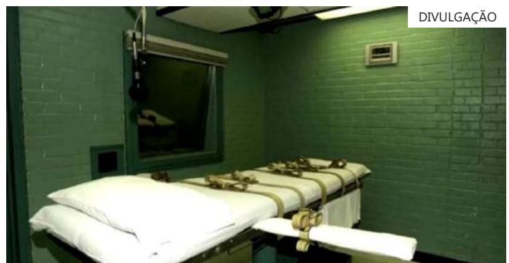
Governador do Tennessee sancionou lei que pode pressionar Suprema Corte

Espera-se que a Malásia e a China assinem vários acordos durante a visita de Li, incluindo a renovação de um acordo de cooperação comercial e econômica de cinco anos.