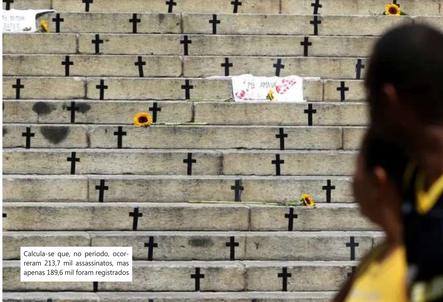
Calcula-se que, no período, ocorreram 213,7 mil assassinatos, mas apenas 189,6 mil foram registrados

Segundo ele, as secretarias de Saúde poderão buscar informações na polícia, mas quando nem os investigadores sabem ou quando não há comparti-