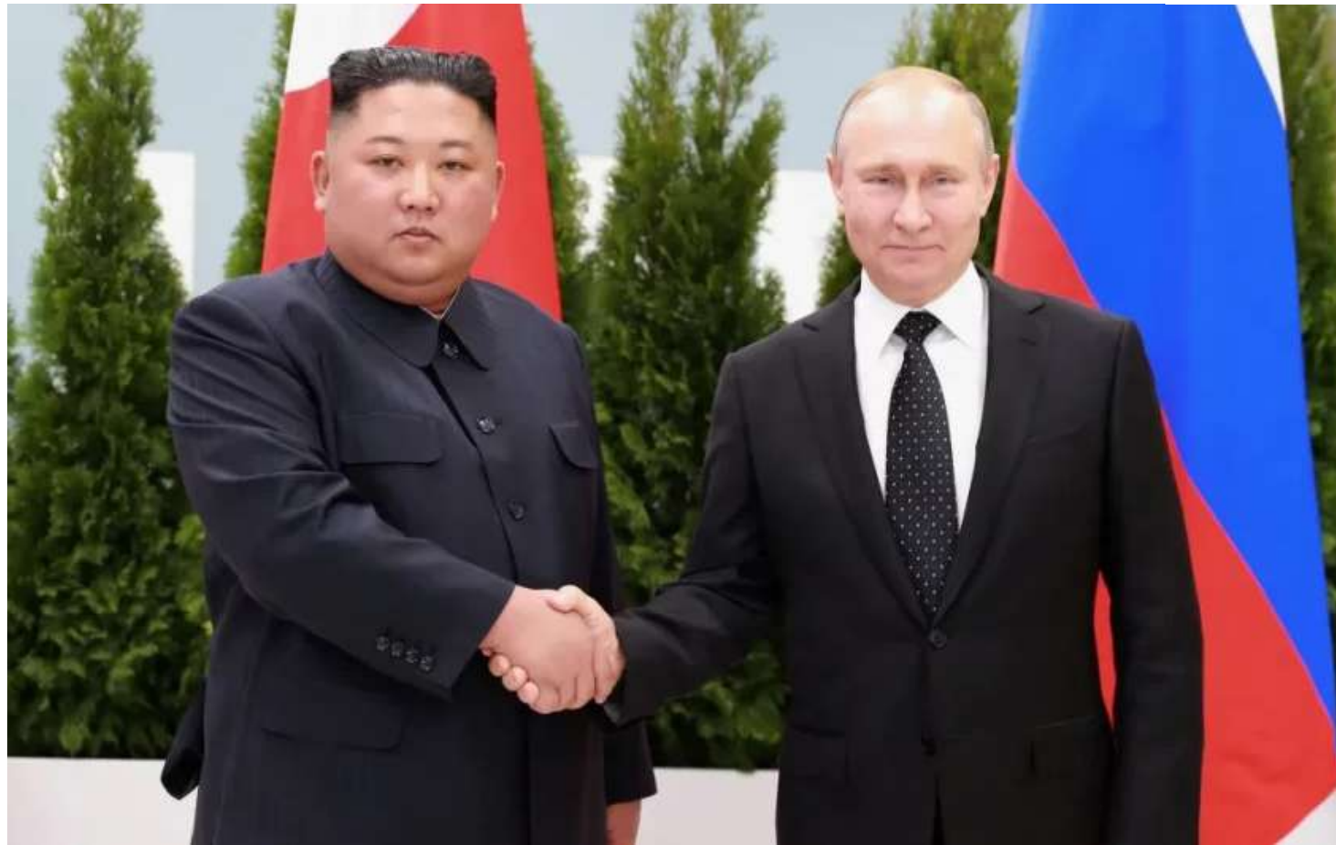
Kim Jong Un e Vladimir Putin devem se encontrar na Coreia do Norte

"A Rússia sempre apoiou e continuará a apoiar a RPDC e