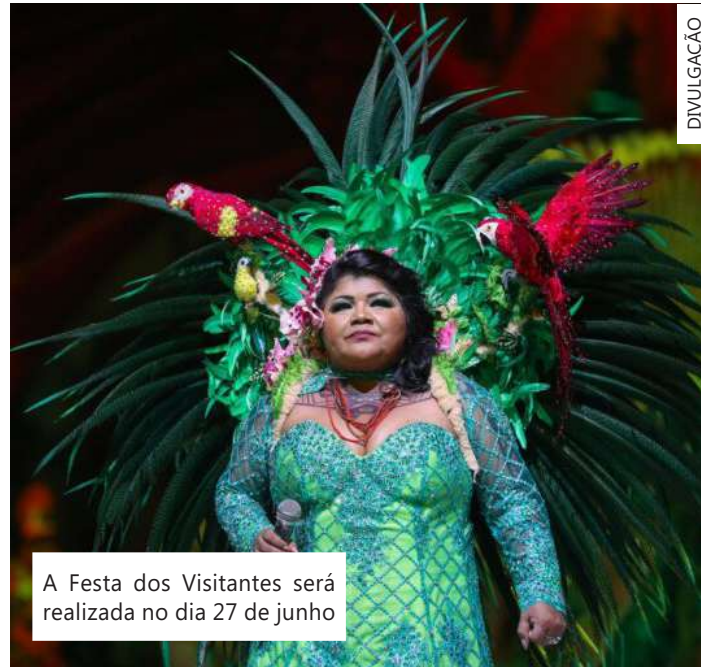
A Festa dos Visitantes será realizada no dia 27 de junho

O evento, que antecede o 57º Festival de Parintins, é operacionalizado pelo Governo do Amazonas, por meio da Secretaria de Estado de Cultura e Economia Criativa. "Após a histórica noite