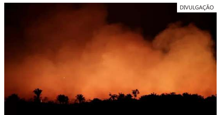
Número de queimadas aumentou 14% no primeiro semestre 2023

"Onde queima mais, Cerrado, Amazônia, e, agora, infelizmente, no Pantanal, é período seco, período em que, provavelmente, é bastante difícil de acontecerem as descargas elétricas das tempestades", detalha Ane Alencar.