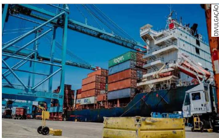
Dados são do Indicador de Comércio Exterior (Icomex) divulgados nesta terça-feira (18)

Considerando o volume importado total de bens intermediários no país, houve um avanço de 8,9% no acumulado de janeiro a maio de 2024 ante o mesmo período de 2023.