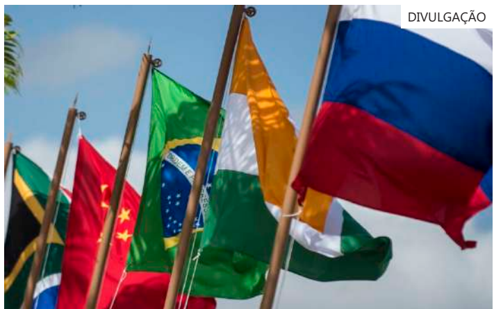
Ministros das Relações Exteriores Wang Yi, Sergei Lavrov e Mauro Vieira em Nizhny Novgorod