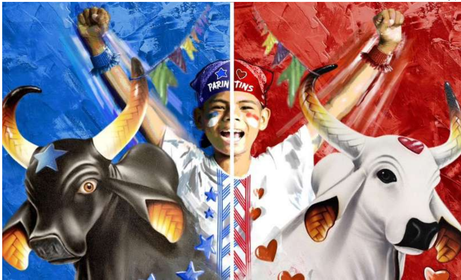
"Patrimônio em Festa", nova marca oficial do Festival de Parintins

O ponto de partida é quando os irmãos resolvem seguir para ramos diferentes em busca de uma vida melhor e saem do Nordeste. O mais velho, Pedro Cid, resolveu ficar em Belém, pois precisava de trabalho urgentemente. Os