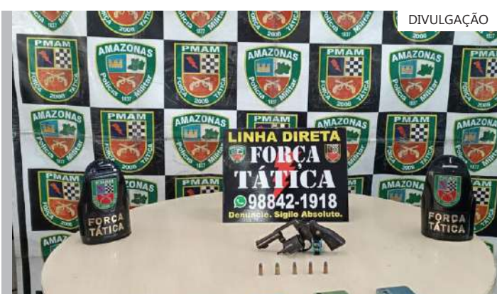
Um policial militar que estava indo trabalhar notou a atitude suspeita no veículo e interceptou a ação criminosa

Roubos no Transporte Coletivo e Rotas do Polo Industrial de Manaus foi instalado dia 23 de abril, pela Secretaria de Segurança Pública do Amazonas (SSP-AM). Ele funciona nas dependências da Delegacia Especializada em Roubos, Furtos e Defraudações (DERFD), na rua J, no bairro Alvorada 3, na zona centro-oeste de Manaus. O Centro é coordenado pela Polícia Civil do Amazonas (PC-AM) e tem como finalidade proporcionar mais tranquilidade para quem utiliza do transporte coletivo.