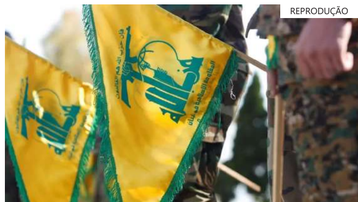
Troca de advertências acontece após grupo do Líbano publicar vídeo que mostraria localizações militares e civis israelenses em várias cidades