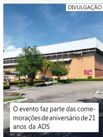
O evento faz parte das comemorações de aniversário de 21 anos da ADS

Comando Geral da Polícia Militar, rua Benjamin Constant, Petrópolis Das 5h às 9h