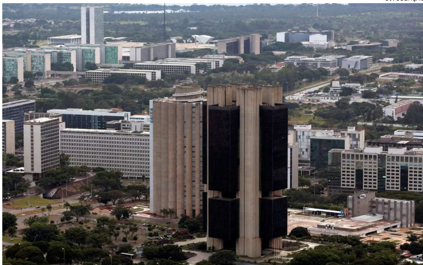
Sede do Banco Central, em Brasília

Segundo o BC, a decisão foi tomada diante do cenário doméstico, apresentando resiliência nas atividades, elevação das projeções para a inflação e expectativas desancoradas. Na cena global, o colegiado