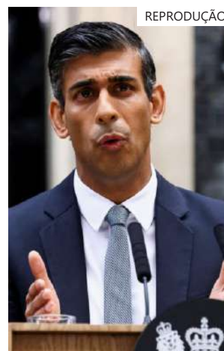
Primeiro-ministro britânico, Rishi Sunak