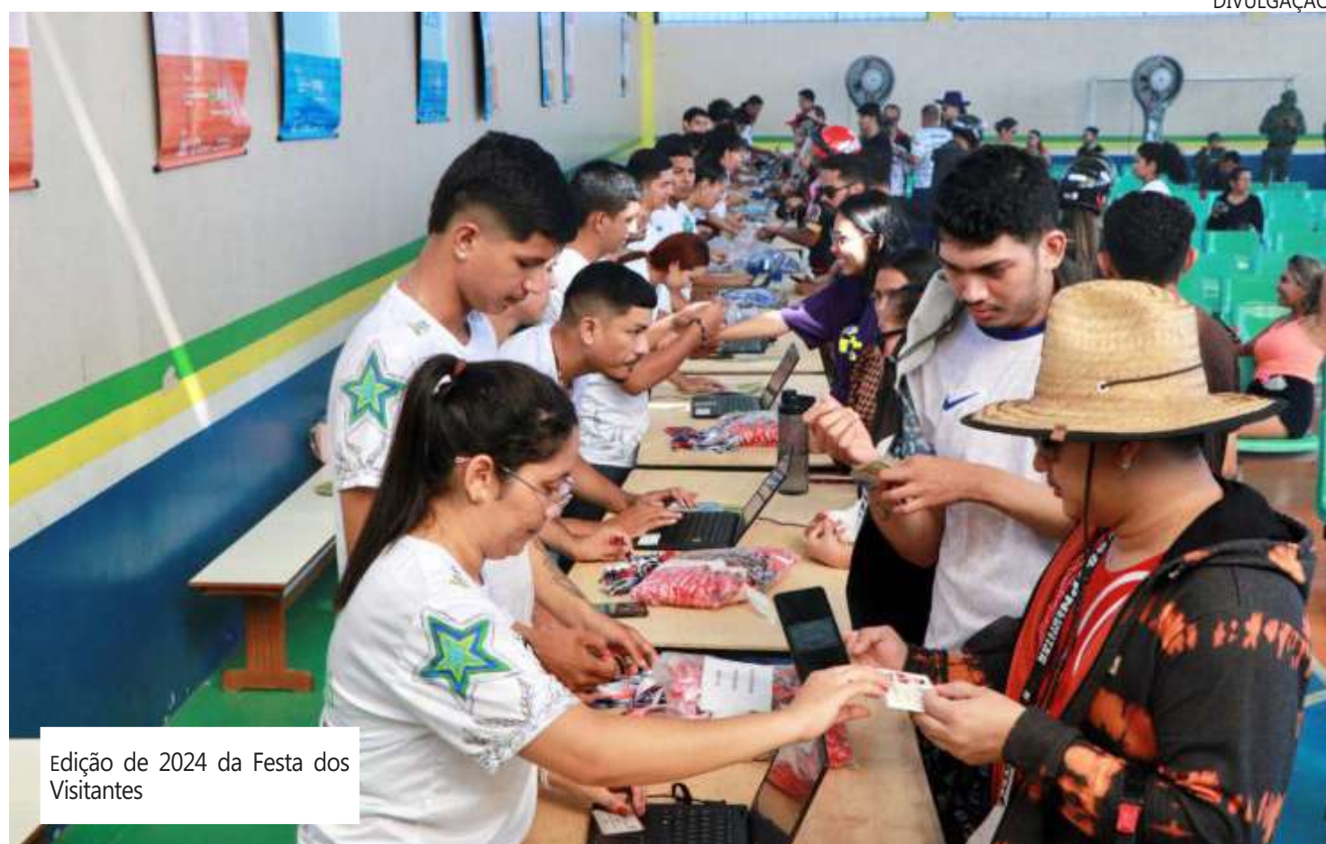
Edição de 2024 da Festa dos Visitantes

Assim como no ano passado, a festa está sendo patrocinada pela empresa Eneva e será organizada pelo Governo do Amazonas, por meio da Secretaria de Estado de Cultura e Economia Criativa. Para a edição deste ano serão disponibilizadas 20 mil pulseiras