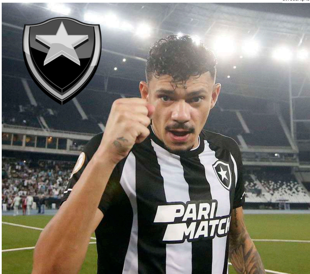
Botafogo joga em casa para frear ímpeto recente do Coxa

Um dia antes, no sábado (15), numa virada histórica, o Atlético-GO bateu o Fluminense no Maracanã por 2 a 1 e também deixou o Z-4, e o Red Bull Bragantino venceu em casa o Juventude por 2 a 1.