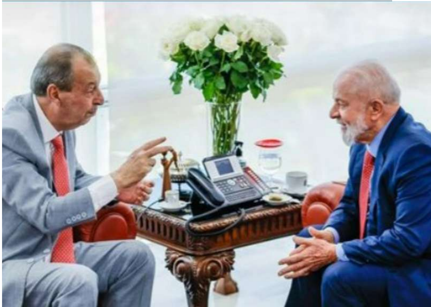
Omar e Lula discutem problemas do Amazonas e soluções a curto prazo

Além da preocupação com a estiagem no Estado, que neste ano tem previsão de ser até mais severa que a de 2023, Omar e Lula também trataram de dois projetos relevantes para a economia de