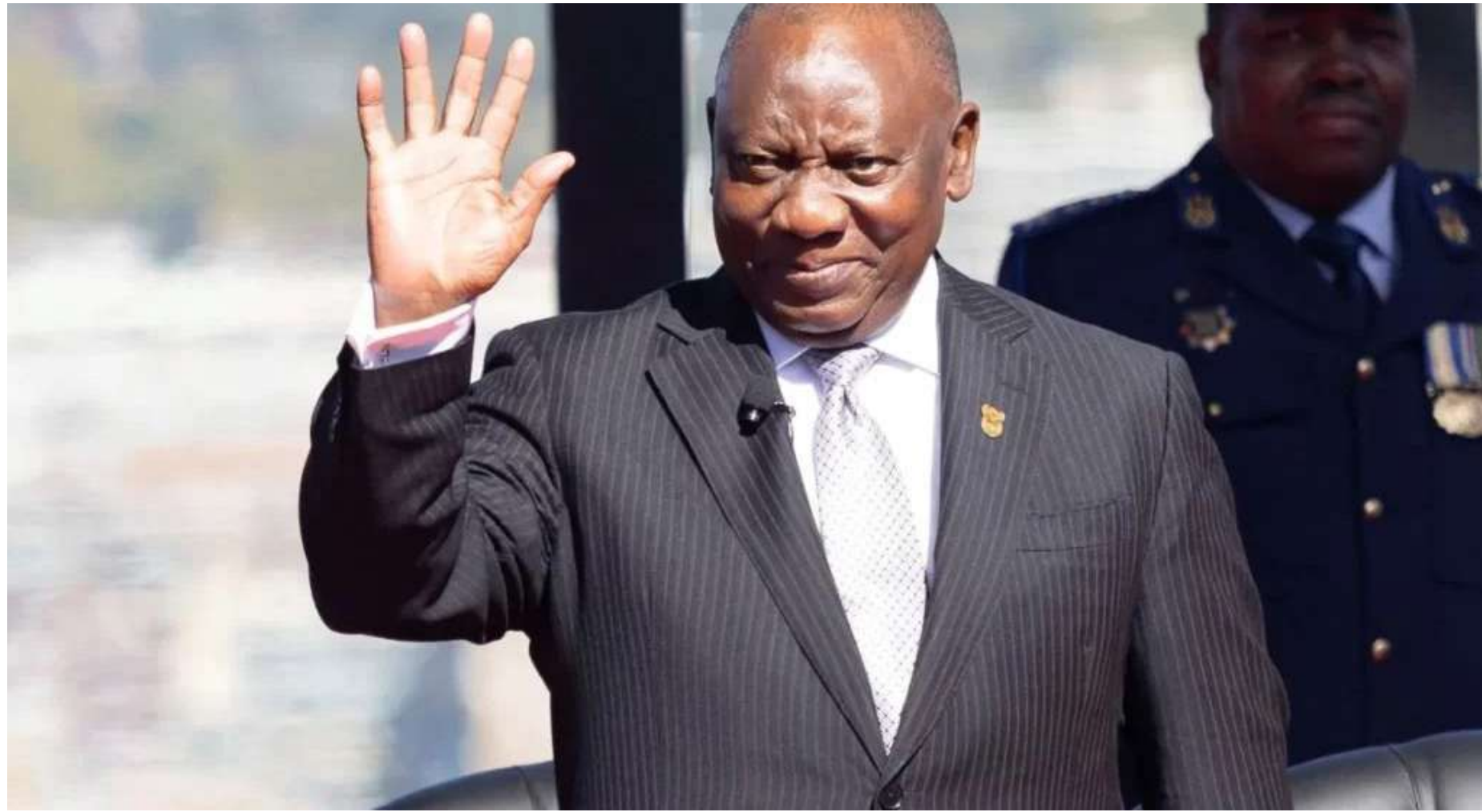
Presidente da África do Sul, Cyril Ramaphosa, após prestar juramento em cerimônia de posse para novo mandato como presidente do país, em Pretória

Congresso Nacional Africano terá que compartilhar poder com outros partidos depois de perder a maioria no Parlamento