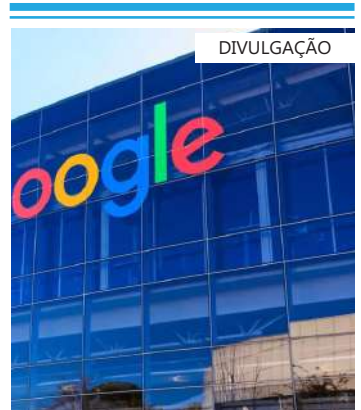
Medida liminar atinge conteúdos específicos de canais no YouTube

A Polícia Militar do Estado do Rio de Janeiro também foi notificada para prestar informações sobre os procedimentos adotados para efetivar os termos da Instrução Normativa n.º 0234/2023 (sobre o controle de postagens em redes sociais). O Ministério Público do Estado do Rio de Janeiro foi oficiado para que, no prazo de 15 dias, manifeste se tem interesse em