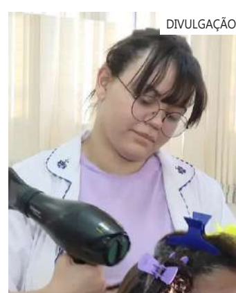
Mais de 30 mil micro e pequenos empreendedores aderiram ao programa

No Rio Grande do Sul, o Desenrola Pequenos Negócios beneficiou 1,2 mil empresários que, até o momento, renegociaram R$ 62 milhões em dívidas. O estado passa por recuperação econômica após enfrentar situação de calamidade pública provocada pelas chuvas.