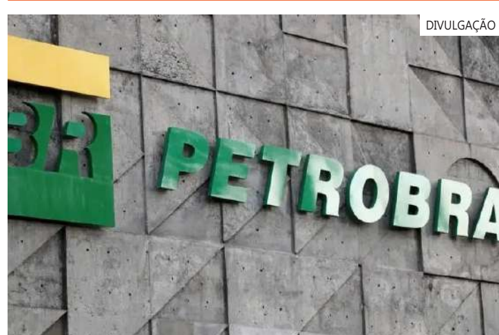
O valor é muito próximo à receita prevista no Orçamento deste ano com a recuperação de tributos

O valor é muito próximo à receita prevista no Orçamento neste ano com a recuperação de tributos por meio de transações relacionadas a temas em disputa na Justiça, de R$ 12,17 bilhões, segundo informou à Reuters o Ministério da Fazenda. Essa previsão foi mantida no mais recente relatório bimestral de avaliação de receitas e despesas do governo, disse a pasta.