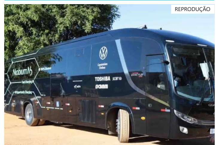
Protótipo dispõe de recarga ultrarrápida capaz de atingir autonomia máxima em apenas dez minutos

Primeiro ônibus elétrico do mundo com bateria de nióbio é lançado em Minas Gerais / Gil Leonardi/Imprensa MG. O governador Romeu Zema acompanhou o lançamento do ônibus elétrico movido à bateria de íons de lítio com nióbio, uso inédito na indústria automotiva mundial.