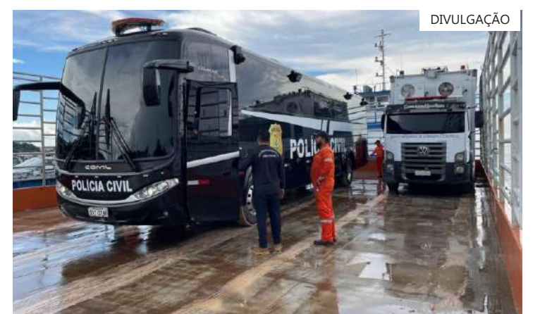
No comboio, além de viaturas da SSP-AM, foram enviados, ainda, VTRs da PM-AM e da PC-AM

As Plataformas de Observação Elevada (POEs) serão gerenciadas pela SSP-AM, por meio da Seagi e vão começar a operar na quinta-feira (27/06) durante a Festa dos Visitantes. O serviço vai funcionar 24 horas por dia e será integrado na base do Centro Integrado de Comando e Controle Local (CICC-L) onde os controladores acompanham as câmeras de segurança em tempo real.