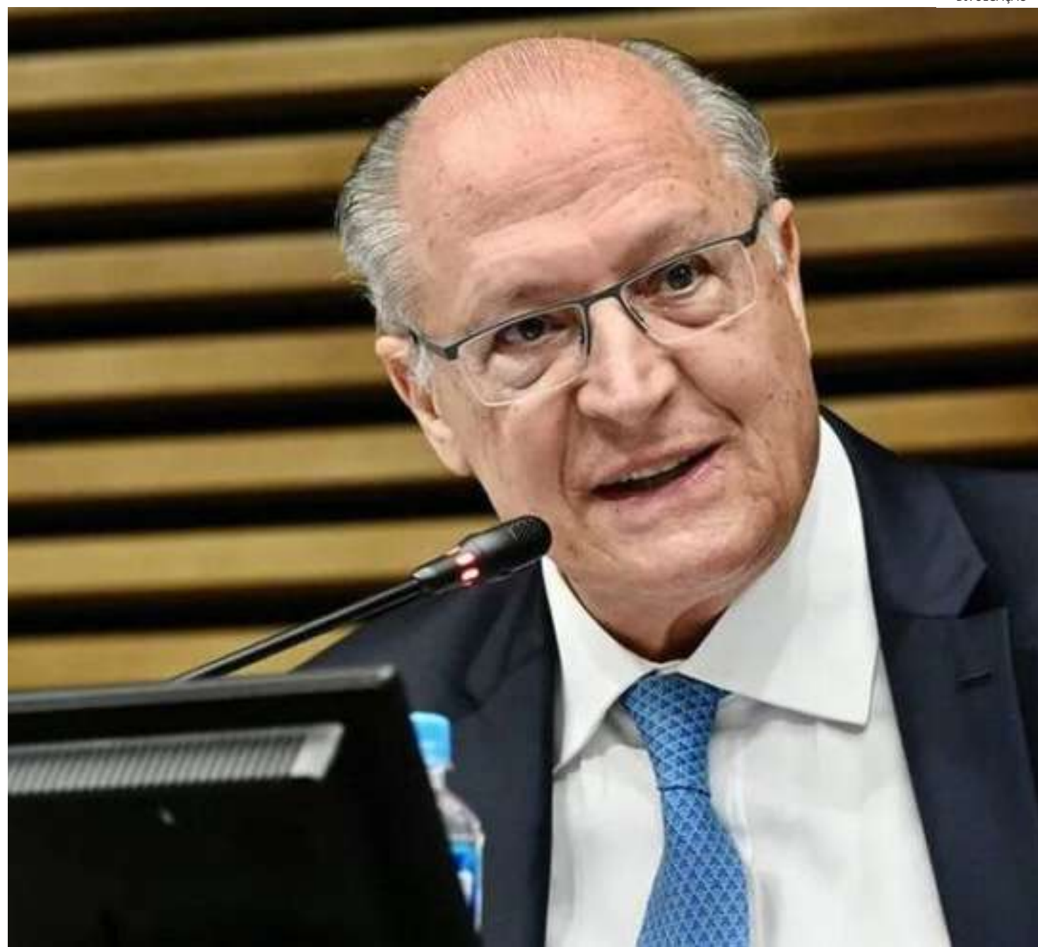
Ministro do Desenvolvimento, Indústria e Comércio Exterior (MDIC) e vice-presidente Geraldo Alckmin

Segundo ele, o programa será coordenado pelo MDIC e o Selo Verde será voluntário e poderá ser obtido para produtos que atendam aos critérios de sustentabilidade socioambiental a serem definidos em norma técnica elaborada pela Associação Brasileira de Normas Técnicas (ABNT). Poderão ser incluídos, por exemplo, critérios relacionados à rastreabilidade da produção, pegadas de carbono, resíduos sólidos e eficiência energética. O Selo Verde Brasil será concedido por certificadoras que serão acreditadas pelo Inmetro ao Instituto Nacional de Metrologia, Qualidade e Tecnologia (Inmetro). A iniciativa contribuirá ainda com a redução de custos do processo produtivo e diminuição ou