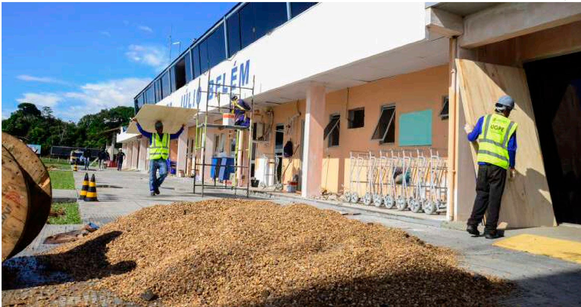
Governo do Amazonas realizou a manutenção corretiva e substituição de equipamentos na pista do Aeroporto Regional Júlio Belém

Instrumentos da pista passaram por correções e substituições para os pousos e decolagens que acontecem à noite, durante o Festival