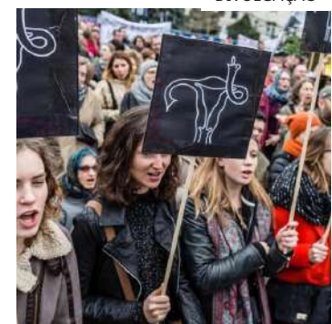
Mulher de 41 anos estava grávida de 14 semanas