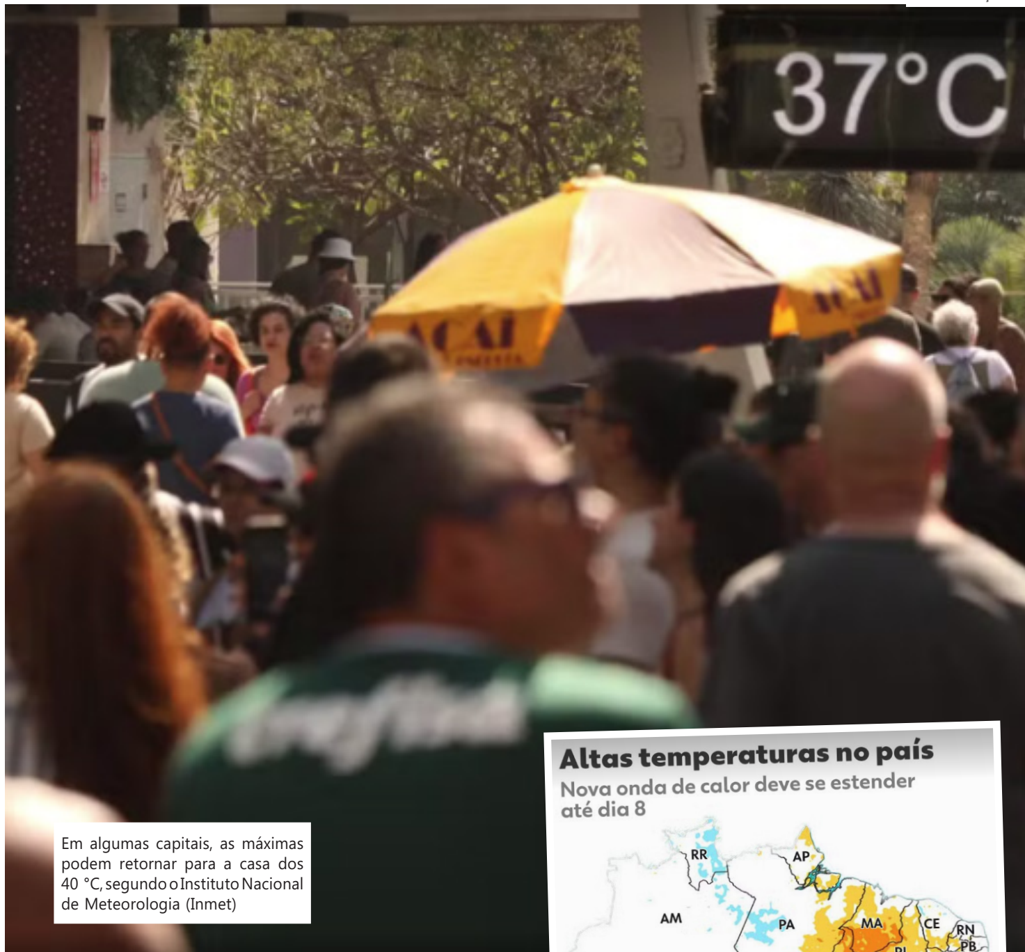
Em algumas capitais, as máximas podem retornar para a casa dos 40 °C, segundo o Instituto Nacional de Meteorologia (Inmet)