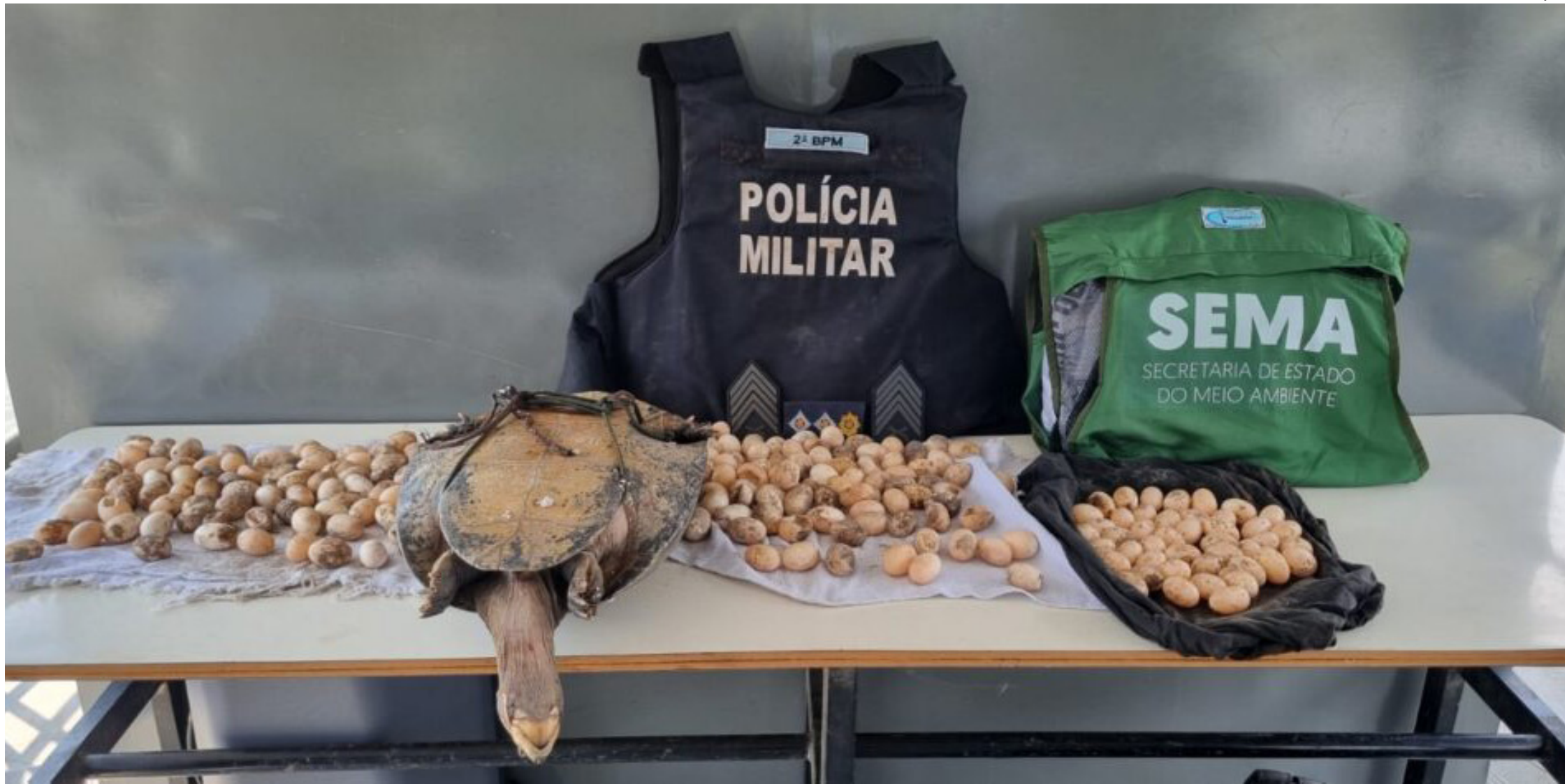
A ação foi conduzida pela Secretaria de Estado do Meio Ambiente (Sema), gestora da área protegida, com apoio do 2º Batalhão da Polícia Militar de Itacoatiara

Tracajás, tartarugas e tucunarés que seriam vendidos ilegalmente também foram encontrados pela Sema e Polícia Militar