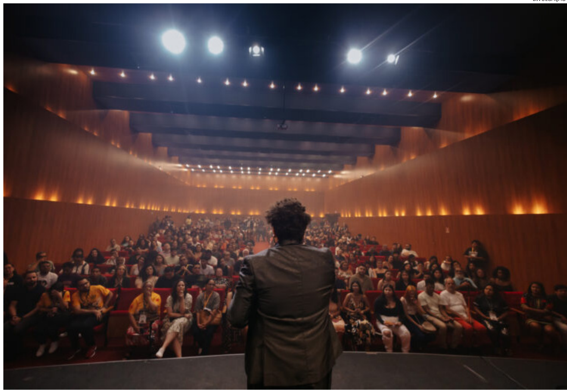
A cerimônia de abertura aconteceu no último domingo (29/09), com a plateia do Teatro Ícbeu lotada, para assistir "Cabaré Chinelo"

"Viva o Festival de Teatro da Amazônia, um festival pulsante, idealizado pela diretoria da Fetam e com todos os federados que participam do movimento. São discussões, assembleias e decisões que