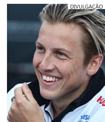
Lawson valorizou parceria com Ricciardo na RB

Lawson vai assumir a titularidade na RB a partir do GP dos Estados Unidos, no dia 20 de outubro, e em breve também deve ser confirmado no grid para a temporada 2025 da Fórmula 1.