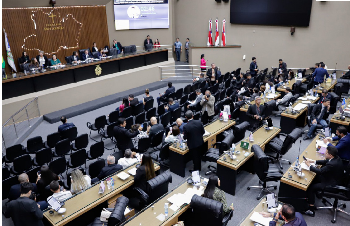
Governador e deputados participam

"Ao incentivar a verificação do histórico criminal dos parceiros, o projeto busca não apenas a proteção individual das mulheres, mas também a criação de uma cultura de conscientização. A proposta almeja aumentar o conhecimento sobre os riscos envolvidos em relacionamentos, promovendo uma cultura de