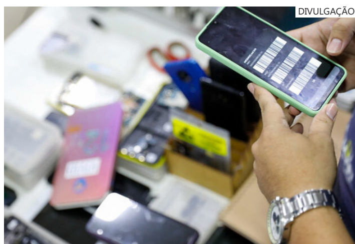
A inclusão do número auxilia as equipes de investigação na localização do aparelho

O programa RecuperaFone foi lançado pelo Governo do Amazonas, no dia 17 de setembro. Ele integra o Núcleo de Investigação e Recuperação de Celulares (NIRC) da SSP-AM. O objetivo é desencorajar a compra e o uso de aparelhos adquiridos ilegalmente no estado.