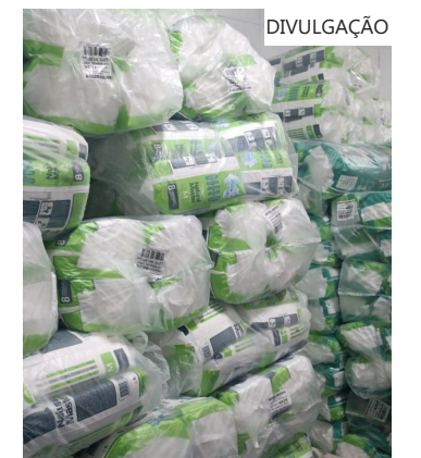
Quatro Policlínicas da SES-AM farão a distribuição do produto, que beneficia cerca de 5 mil pacientes

No último domingo (30/09), a SES-AM iniciou o envio de mensagens aos usuários, via aplicativo WhatsApp, informando o novo local para retirada das fraldas, assim como a data e horário. "Os usuários estão sendo notificados, de forma individual. Eles serão atendidos conforme as informações que estão recebendo no contato cadastrado em nosso sistema", disse.