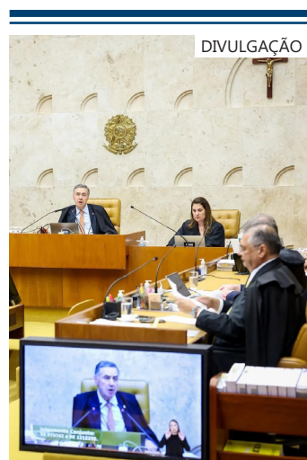
Sessão plenária no STF

sões relacionadas ao bloqueio do X, tomadas inicialmente pelo ministro Alexandre de Moraes e validadas na turma, provocaram desconforto em parte do STF. Nas conversas reservadas, ministros como André Mendonça e Kássio Nunes Marques indicaram insatisfação com o fato de o caso não ter sido remetido ao plenário.