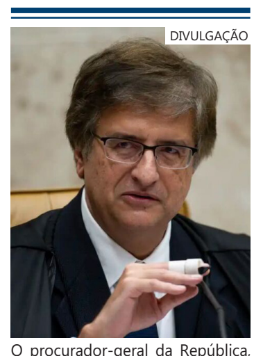
O procurador-geral da República, Paulo Gonet

Na semana passada, o órgão solicitou ao Banco Central que encaminhe nota técnica com todas as informações disponíveis sobre o tema. O Ministério da Fazenda também terá de informar as providências que vêm sendo adotadas para regulamentar o setor e corrigir eventuais abusos e distorções.