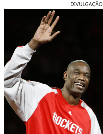
Dikembe Mutombo morreu aos 58 anos

"Dikembe Mutombo era simplesmente maior que a vida. Na quadra, ele foi um dos maiores bloqueadores de arremessos e jogadores defensivos da história da NBA. Fora da quadra, ele dedicou seu coração e alma para ajudar os outros", declarou Adam Silver, comissionário da NBA.