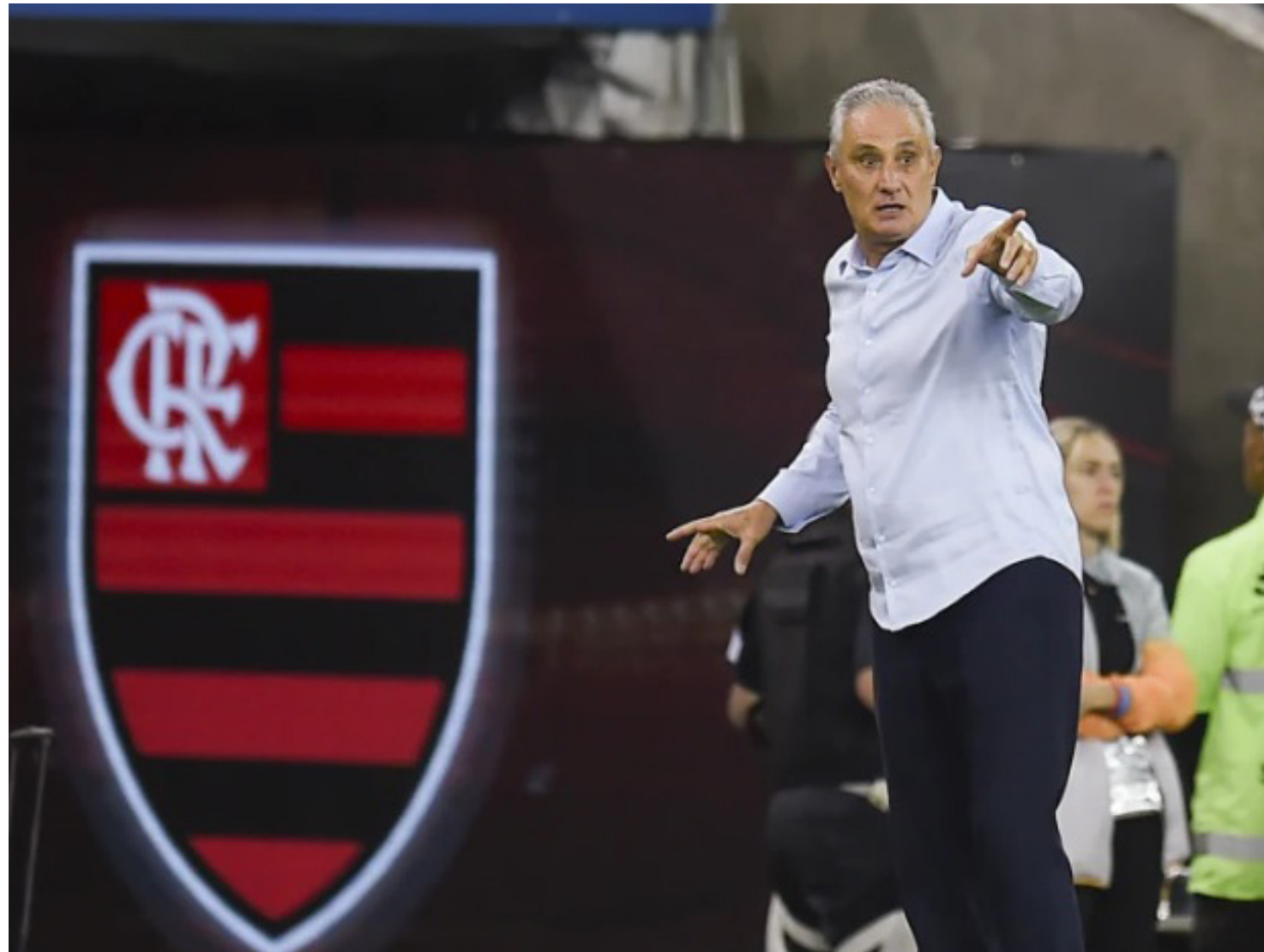
Ex treinador do Flamengo Tite

O segundo mandato de Rodolfo Landim foi conquistado em dezembro de 2021. Na época, o atual presidente havia demitido Renato Gaúcho uma semana antes do pleito, após a derrota na final da Li-