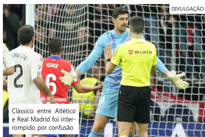
Clássico entre Atlético e Real Madrid foi interrompido por confusão

"O clube tomou a decisão de expulsar permanentemente a pessoa identificada pela polícia em colaboração com nossos serviços de segurança ontem. Nosso departamento de segurança continua a trabalhar com a polícia para identificar os demais envolvidos no arremesso de objetos, e todos eles serão expulsos permanentemente assim que forem localizados", disse o clube.