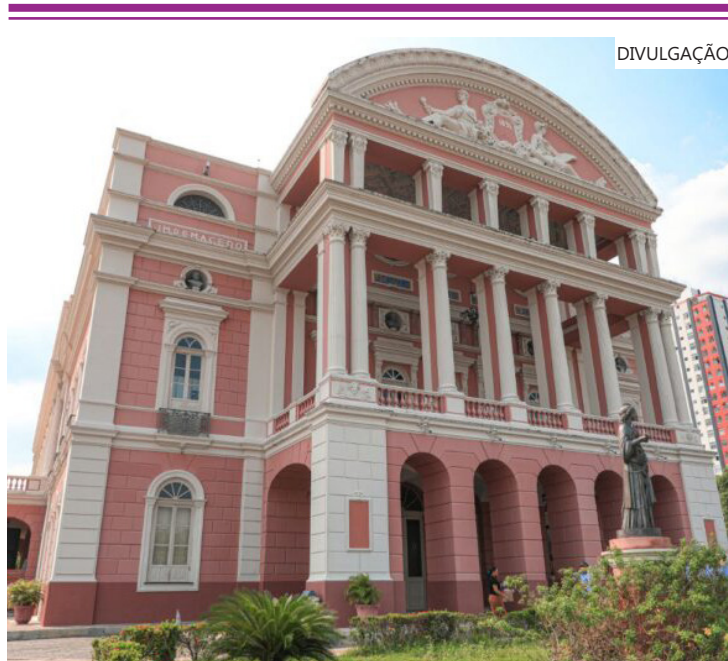
A semana será recheada de cultura e arte, contando com festival de teatro, concertos e lançamentos de livros

A semana cultural que se inicia promete ser repleta de atrações diversificadas, celebrando a arte e a criatividade na nossa cidade. De festival de teatros a concertos, passando por lançamentos de livros, há atividades para todos os gostos. Confira a programação.