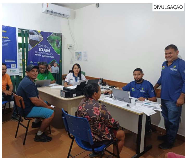
Os recursos são referentes às demandas de pescadores artesanais do município

O Idam informa que para garantir o acesso ao benefício é necessária a apresentação dos seguintes documentos: RG; CPF; Certidão do Pescador Artesanal (RGP) atualizada; proposta de aquisição de máquinas, equipamentos e apetrechos de pesca; comprovante de residência; e cartão do banco (conta-corrente).