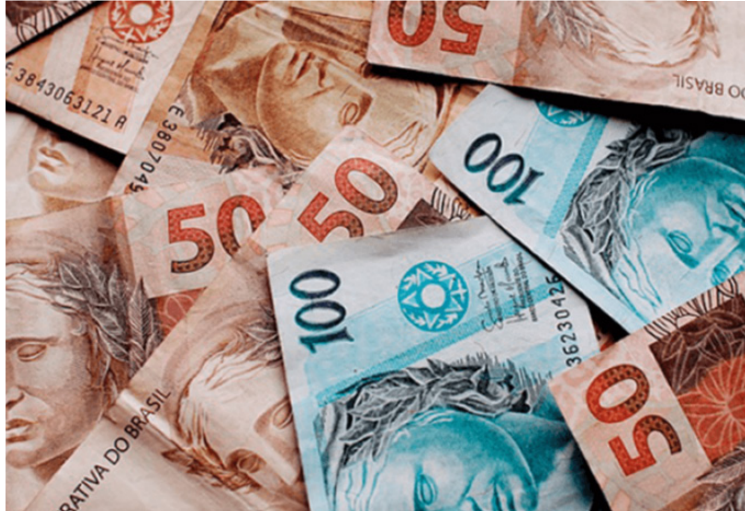
Para este ano, a expectativa para o crescimento da economia está em 3%

Índice Nacional de Preços ao Consumidor Amplo (IPCA) - considerada a inflação oficial do país - permaneceu em 4,37% nesta edição do Focus. Para 2025, a estimativa de inflação é de 3,97%. Para 2026 e 2027, as previsões também são de 3,6% e 3,5%, respectivamente.