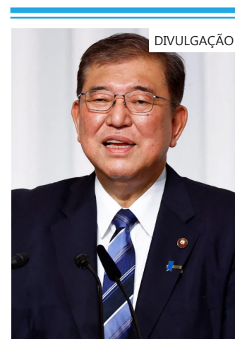
Shigeru Ishiba, novo primeiro-ministro do Japão, em Tóquio

Até o momento, essas escolhas incluem dois candidatos rivais na corrida pela liderança, Katsunobu Kato como ministro das Finanças e Yoshimasa Hayashi para permanecer como secretário-chefe do gabinete, um cargo fundamental que inclui a função de principal porta-voz do governo, disseram à Reuters duas fontes familiarizadas com