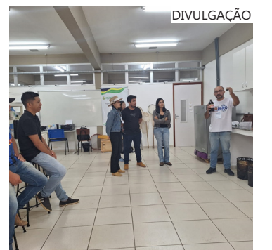
O evento terá palestras, mesa-redonda, minicurso, ludociêntoteca, e concurso de fotos

Amparado via Programa de Apoio à Realização de Eventos Científicos e Tecnológicos no Estado do Amazonas (Parev), Edital nº 001/2024, da Fapeam, a semana pretende destacar que, no setor agroflorestal-pecuário, os institutos de ensino, pesquisa e extensão estão entre os principais mediadores e estimuladores dos contatos e diálogos entre profissionais.