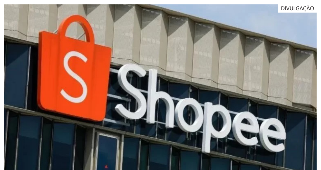
Objetivo é otimizar a operação logística e acelerando significativamente a entrega para consumidores, de acordo com a empresa

O marketplace conta com centros logísticos nos estados de São Paulo e outras no Rio de Janeiro, Minas Gerais, Paraná, Bahia, Pernambuco, Goiás e Rio Grande do Sul.