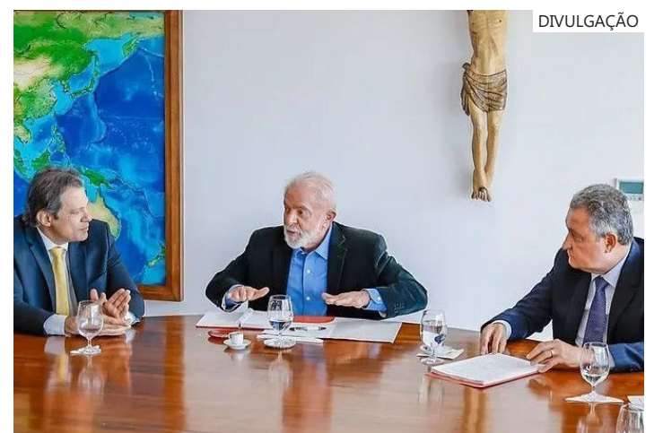
Lira tensionou Congresso e mirou no Governo Lula

Ainda não está claro qual será a posição do governo sobre apostas por beneficiários do Bolsa Família. Lula quer uma alternativa que não estigmatize a população mais pobre.