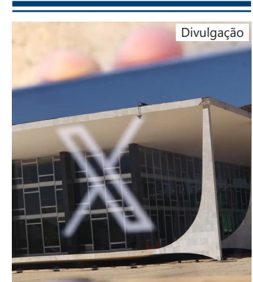
X (antigo Twitter) está bloqueado desde 30 de agosto

A quitação dos valores foi uma condição para que a plataforma seja desbloqueada no país. A suspensão foi determinada em 30 de agosto.