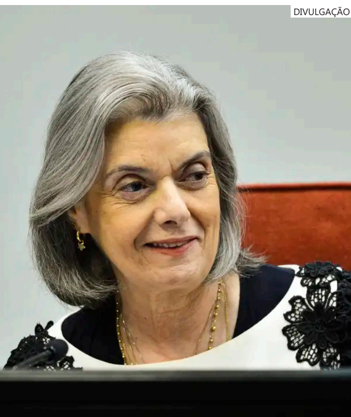
Para a ministra, é necessário resgatar a plena liberdade de voto

ções será no domingo (6). O segundo turno da disputa poderá ser realizado em 27 de outubro em 103 municípios com mais de 200 mil eleitores, nos quais nenhum dos candidatos à prefeitura atingirá mais da metade dos votos válidos, excluídos os brancos e nulos, no primeiro turno.