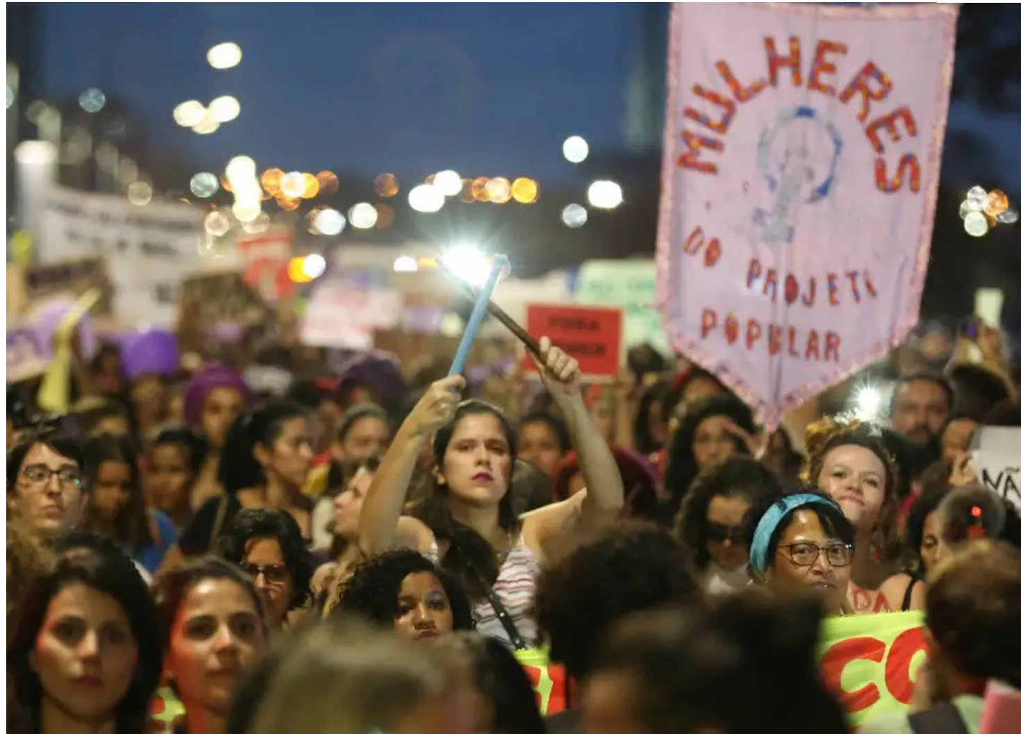
Relatório revela que o aumento dos casos de violência em 2024 é 130% superior aos das eleições de 2020

O relatório revela que o aumento dos casos de violência em 2024 é 130% superior aos das eleições de 2020. Se hoje são registrados 1,5 caso diário de violência política pelo país, em 2020 o resul-