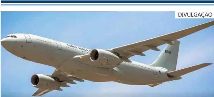
Avião enviado para repatriação

A maior preocupação tanto para brasileiros quanto para integrantes da Embaixada em Beirute é com as estradas. As vias de acesso à capital libanesa estão entre os alvos de ataque.