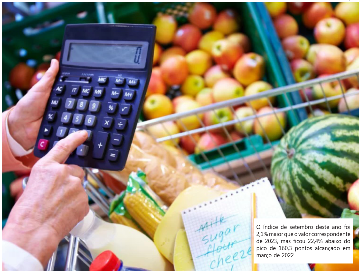
O índice de setembro deste ano foi 2,1% maior que o valor correspondente de 2023, mas ficou 22,4% abaixo do pico de 160,3 pontos alcançado em março de 2022

O excesso de umidade no Canadá causou atrasos na colheita e levaram a cortes na projeção de safra da União Europeia, disse a FAO. No entanto, os preços competitivos da região do Mar Negro limi-