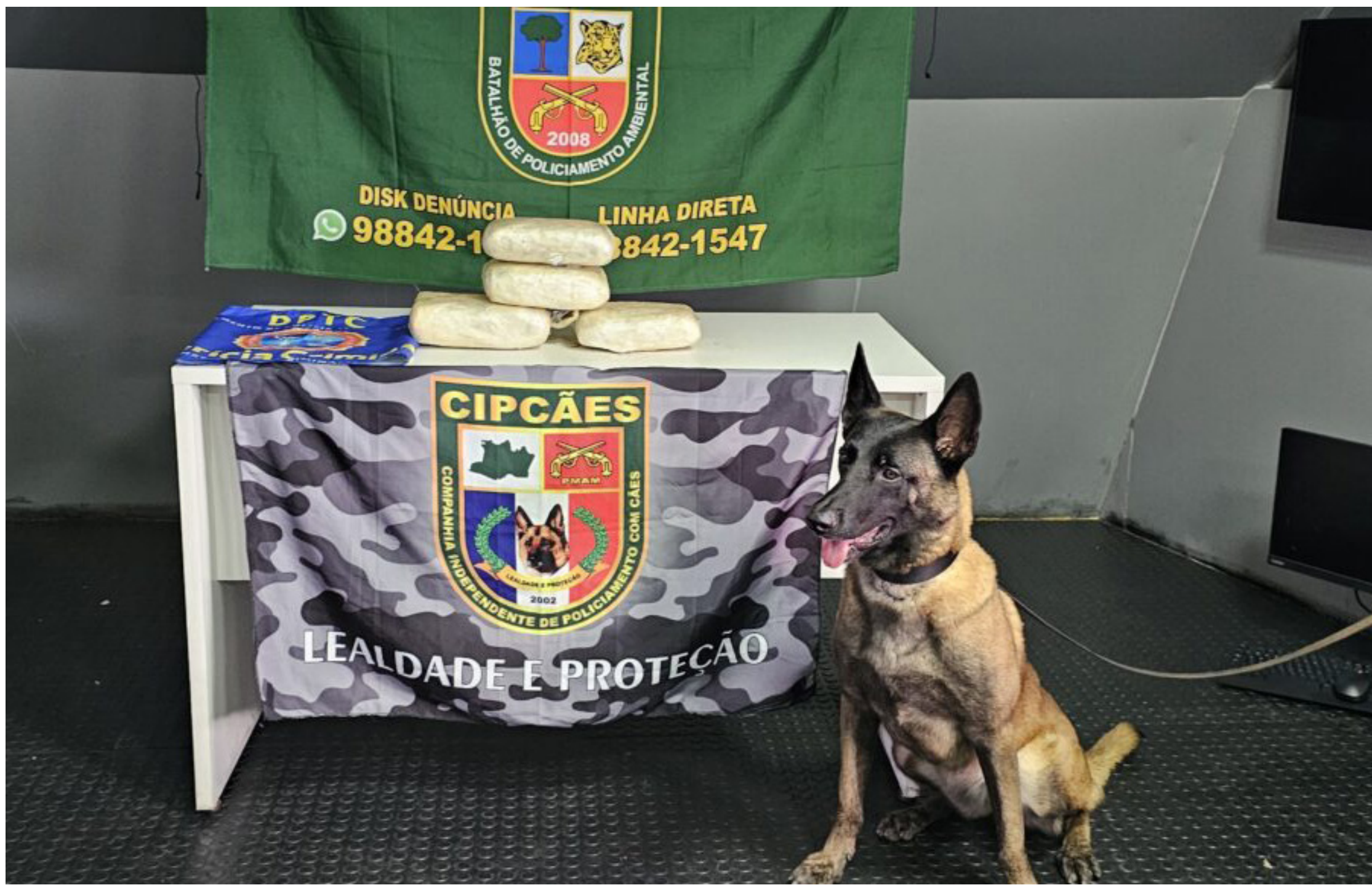
Durante a operação, a cadela Havana, da Companhia Independente de Policiamento com Cães (CIPCães), sinalizou aos policiais a presença de entorpecentes nas malas

A apreensão causou mais de $104 mil em danos ao crime