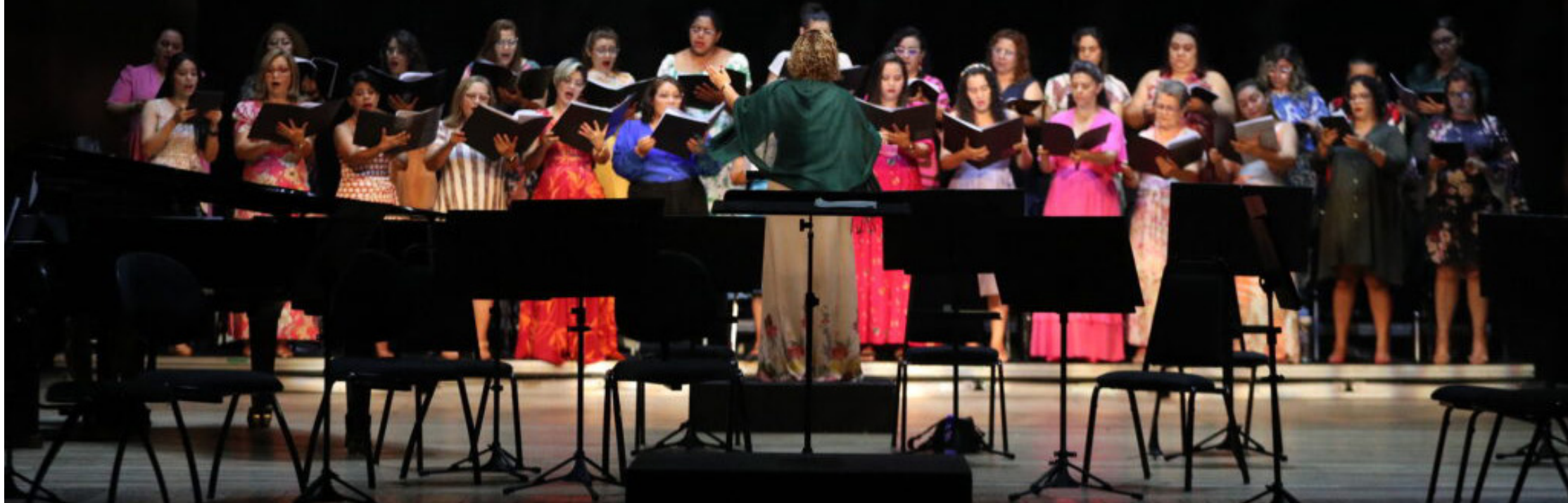
A cantata cênica "Carmina Burana" segue em cartaz até domingo (14/04) no Teatro Amazonas

Programação inclui feiras de economia criativa, música eletrônica, jazz, cinema e festival de teatro