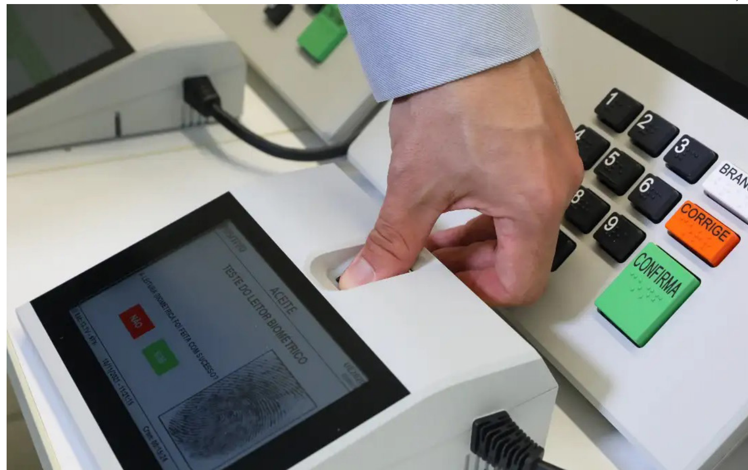
Urna Eleições 2024

Consiste em divulgar, na propaganda ou durante período de campanha eleitoral, fatos inverídicos - as chamadas "fake news" - em relação a partidos ou a candidatas. A pena é de