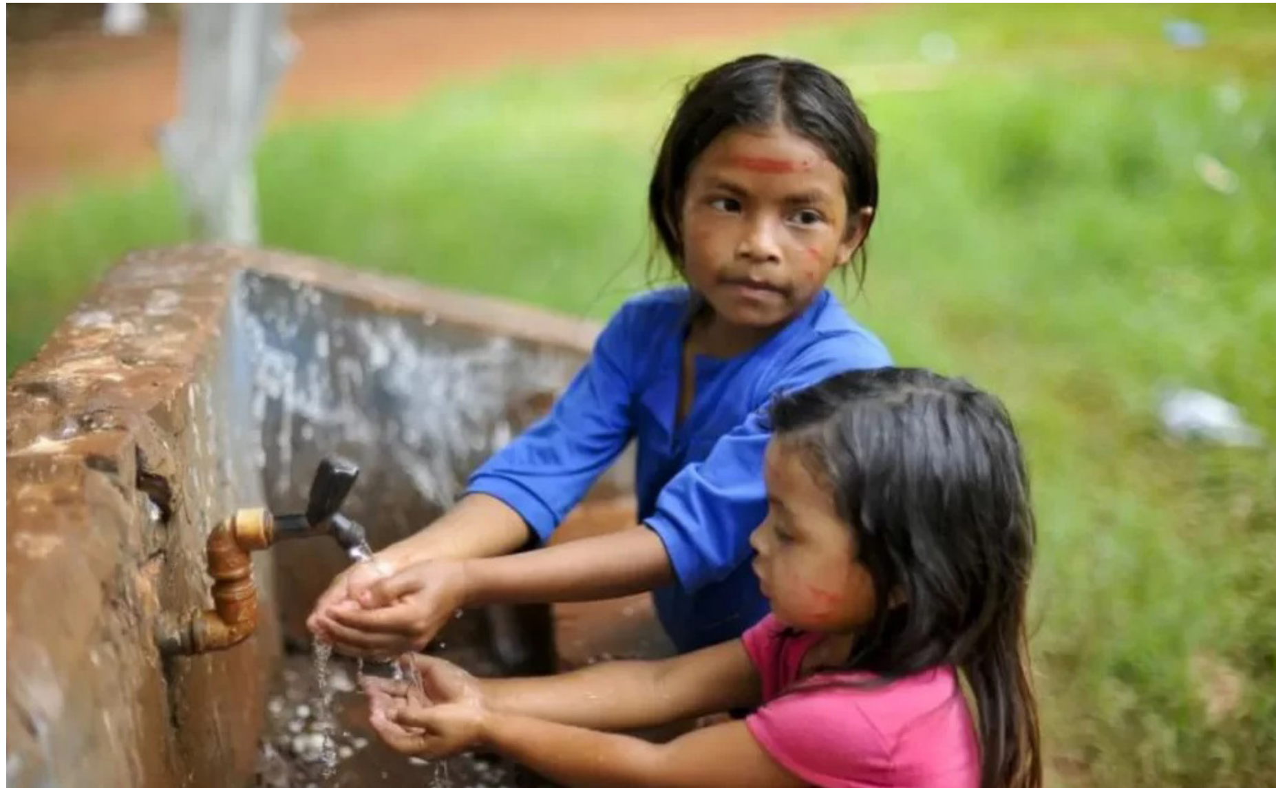
No caso de moradores de Terras Indígenas, 56,98% vivem sem condições adequadas de saneamento

Em 2022, 36,79% dos domicílios onde há ao menos um indígena não contava com abastecimento de água, seja por rede geral de distribuição, poço, fonte, nascente ou mina encanada.