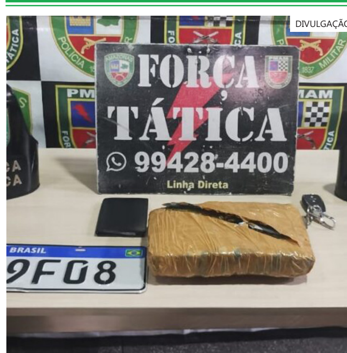
Homem já possui antecedentes criminais pelo crime de tráfico de drogas

Para acompanhar mais notícias sobre a Polícia Militar do Amazonas, acesse o portal Vanguarda do Norte.