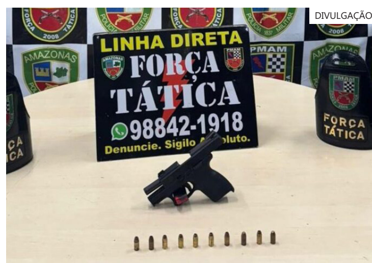
Uma das ações foi executada com apoio dos alunos soldados da PMAM

A arma de fogo foi encaminhada para o 19º DIP.