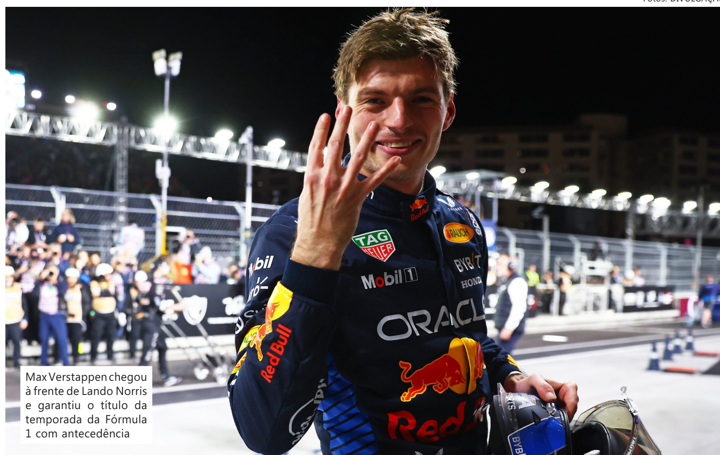
Max Verstappen chegou à frente de Lando Norris e garantiu o título da temporada da Fórmula 1 com antecedência

Em uma prova extremamente apagada para quem ainda tinha chances matemáticas de conquistar o título e era o único piloto com a possibilidade de evitar o tetra antecipado de Verstappen, Norris teve de se contentar com o sexto lugar e foi para uma parada estratégica no final da corrida para trocar os pneus e fazer a volta mais rápida da prova, garantindo assim um ponto a mais para a McLaren na briga pelo Mundial de Construtores. Oscar Piastri, também da equipe de Woking, terminou a corrida em sétimo.