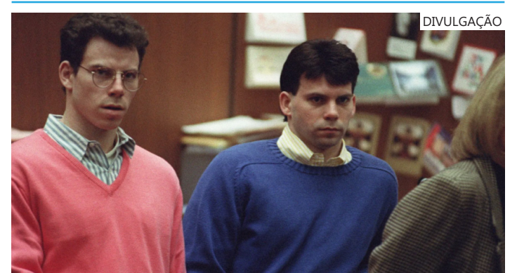
Os dois homens foram vistos em público pela última vez em 1996, durante o segundo julgamento pelo assassinato dos pais

O esforço para reexaminar o caso começou em 2023, quando uma série documental do Peacock apresentou outra suposta vítima dizendo que foi estuprada por Jose Menendez - pai dos dois irmãos.