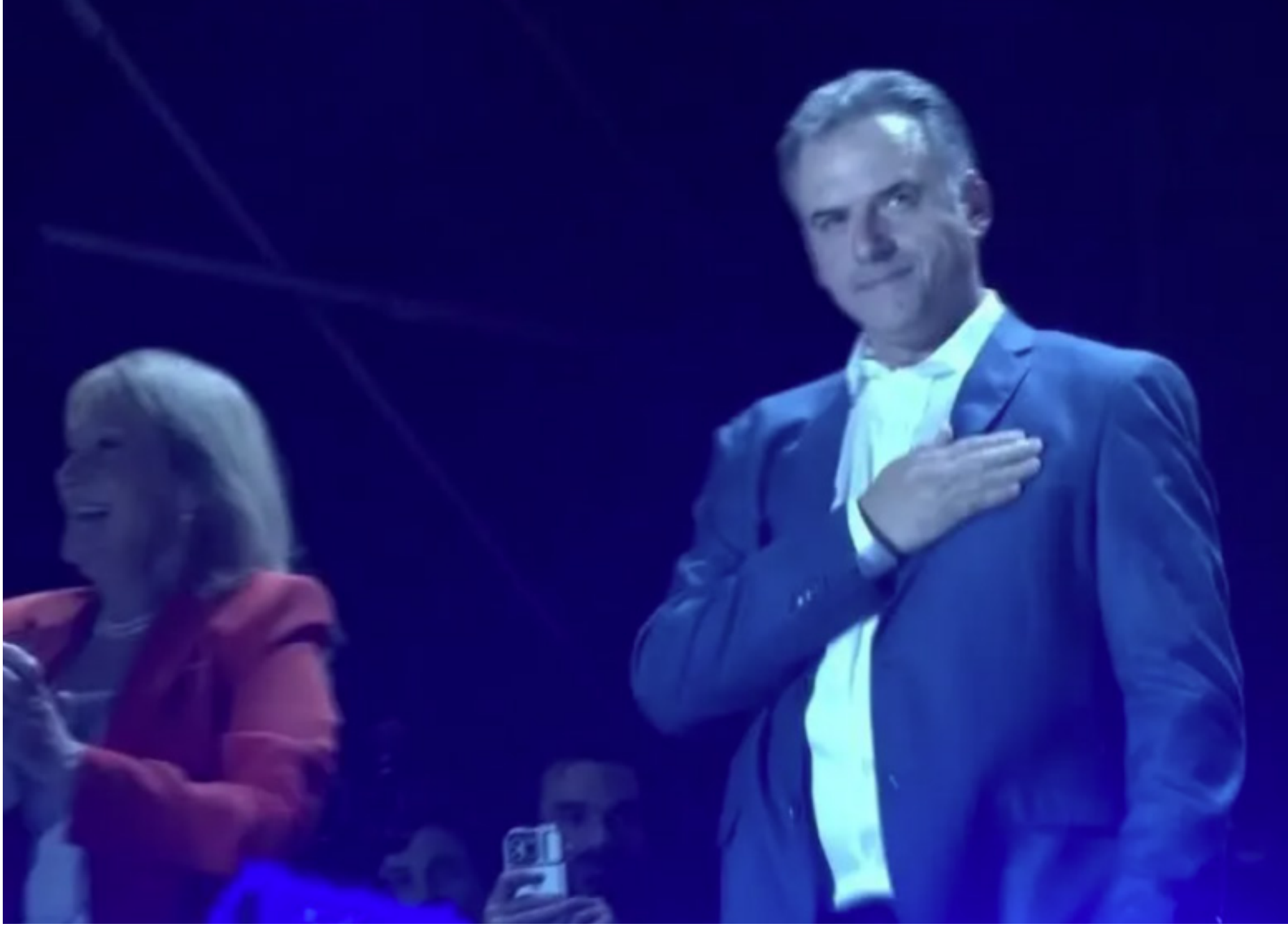
"Vou ser o presidente que constrói uma sociedade mais integrada"

“Vida longa ao nosso sistema democrático”, disse candidato da Frente Ampla