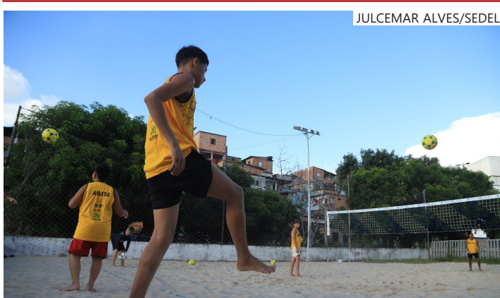
Projeto Mais Futevôlei nos Bairros está presente em nove núcleos de Manaus

A popularidade do futevôlei tem crescido significativamente, com estudos apontando que cerca de 44% da população brasileira adulta, em um universo de mais de 110 milhões de pessoas, é fã da modalidade. Conforme a Confederação Brasileira de Futevôlei, o Brasil conta com cerca de 500 mil praticantes da modalidade.