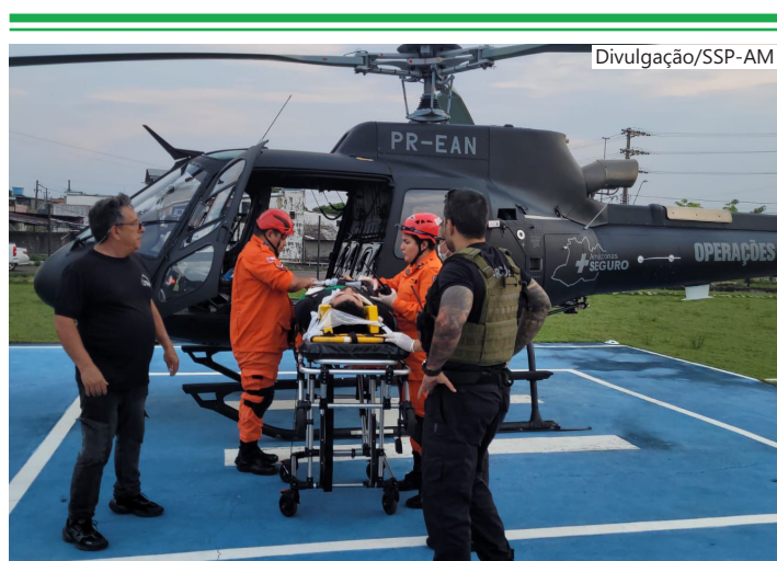
Os resgates aconteceram na capital e em municípios do estado

Embora o Dioa seja reconhecido por suas missões de salvamento, remoção e transporte de vítimas, sua atuação vai além dos serviços de emergência. O departamento também se destaca na reanimação e estabilização de pacientes.