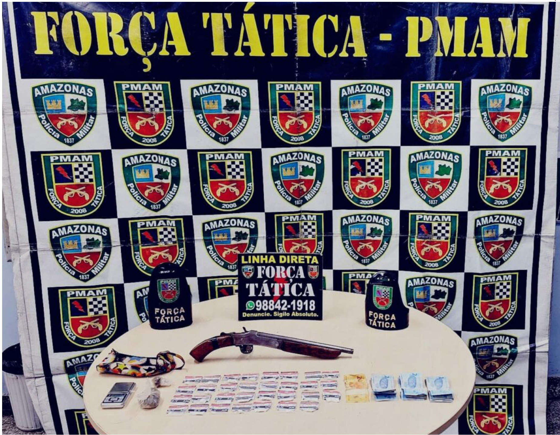
O material apreendido foi encaminhado para o 19º Distrito Integrado de Polícia (DIP)

O suspeito, preso em Iranduba, possui passagem pela polícia com registros pelos crimes de homicídio e roubo