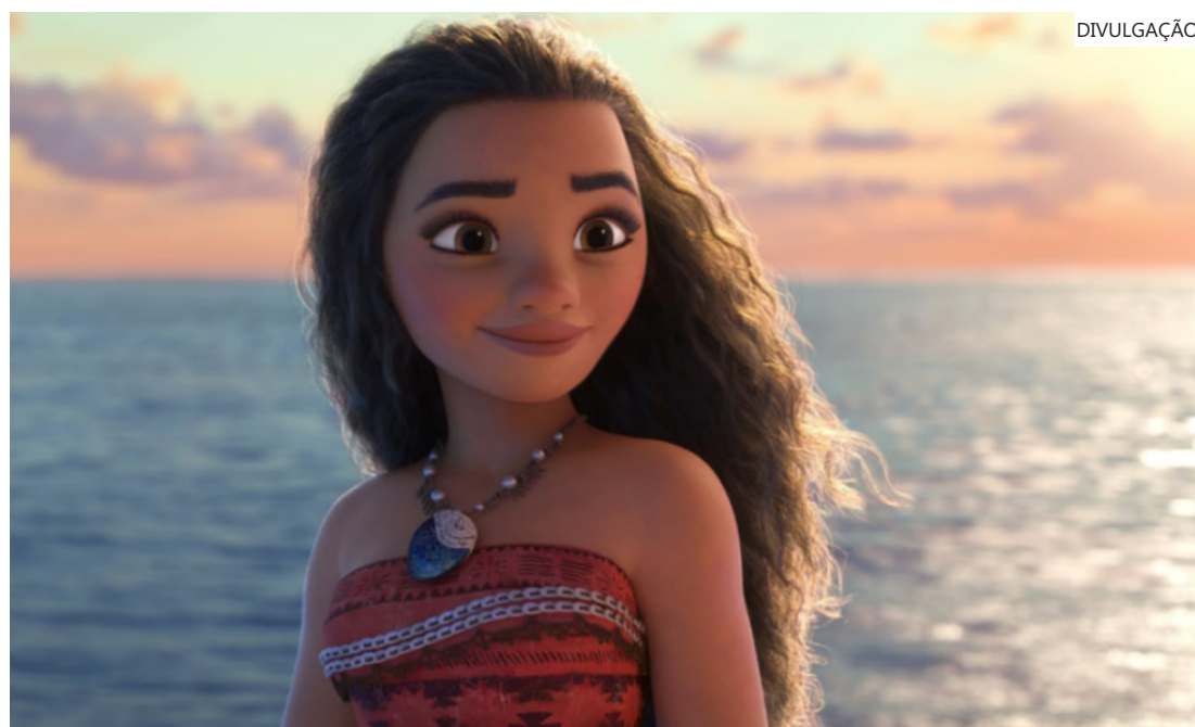
Moana 2 - 28 de novembro nos cinemas

Toda semana, novas produções estreiam nos cinemas e nos streamings. Para você ficar por dentro de tudo que está acontecendo no universo de filmes e séries, veja os principais lançamentos dos próximos dias.