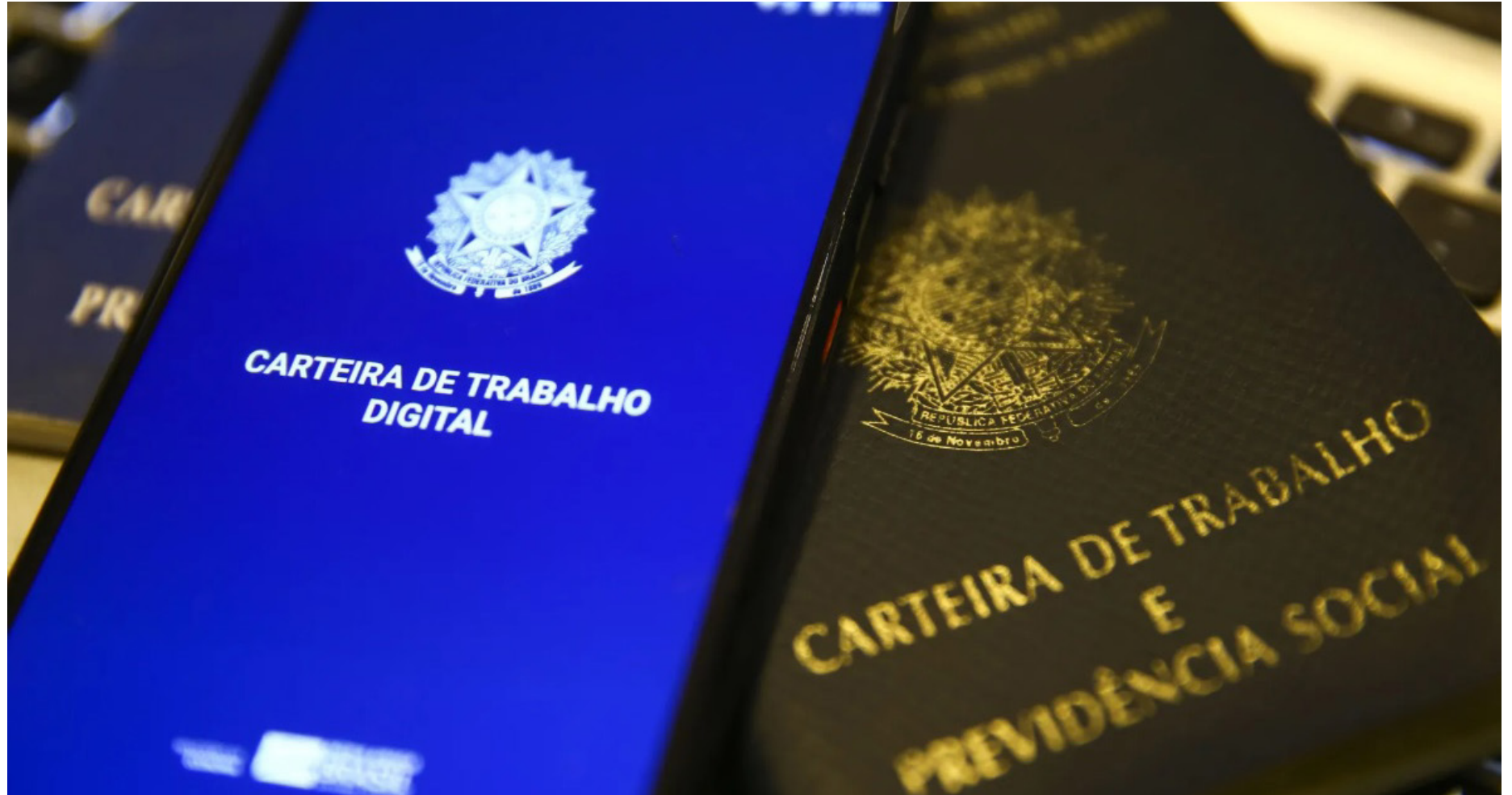
Decisão definiu que os empregadores não precisam garantir aos funcionários contratados antes da reforma os direitos que foram extintos por ela

A lei passou a dar mais importância a acordos negociados diretamente entre patrões e empregados, prevendo que