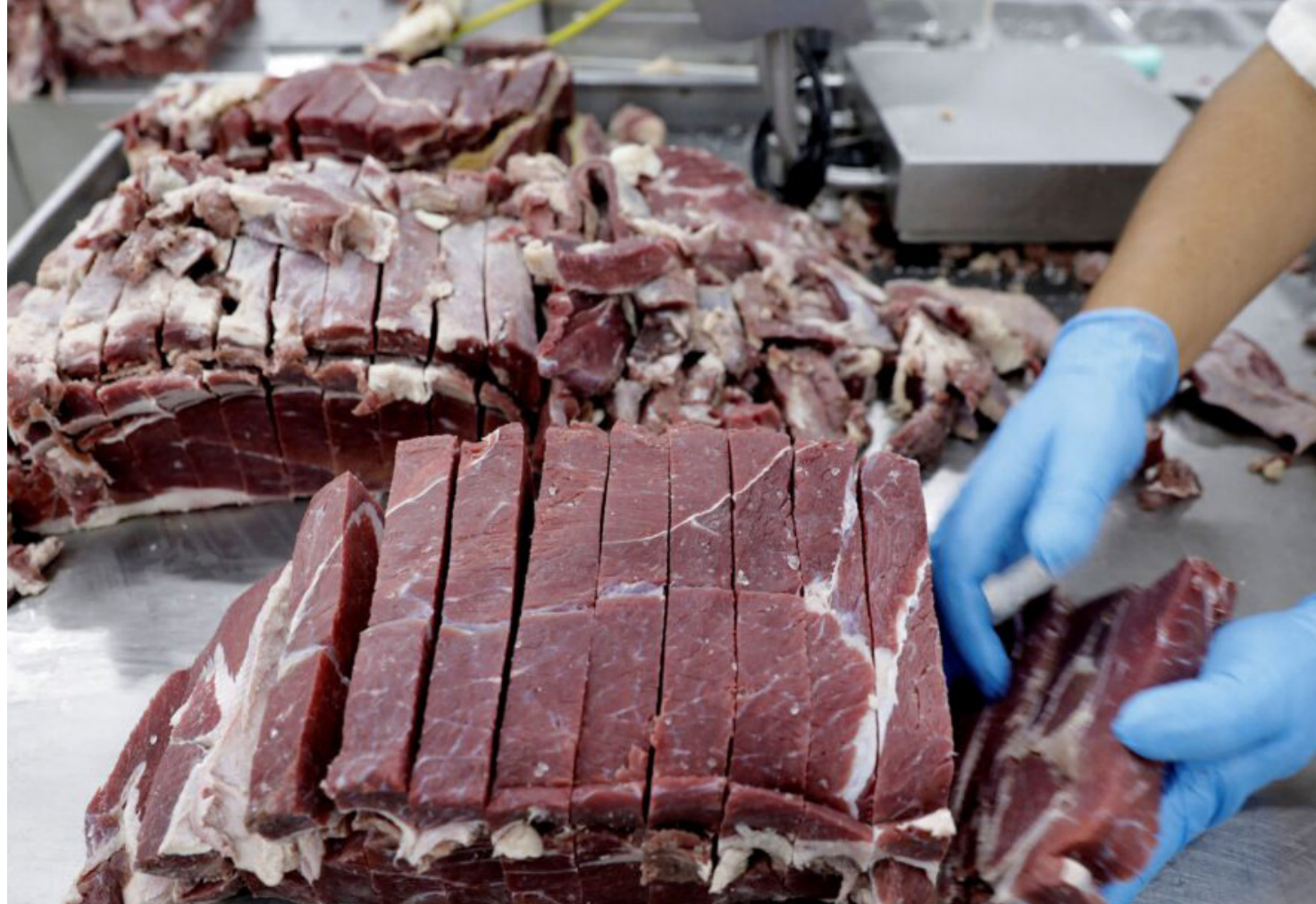
Funcionário da JBS trabalha em unidade da empresa em Santana de Parnaíba

O grupo varejista também lamentou a decisão pelos frigoríficos e comentou o impacto da suspensão.