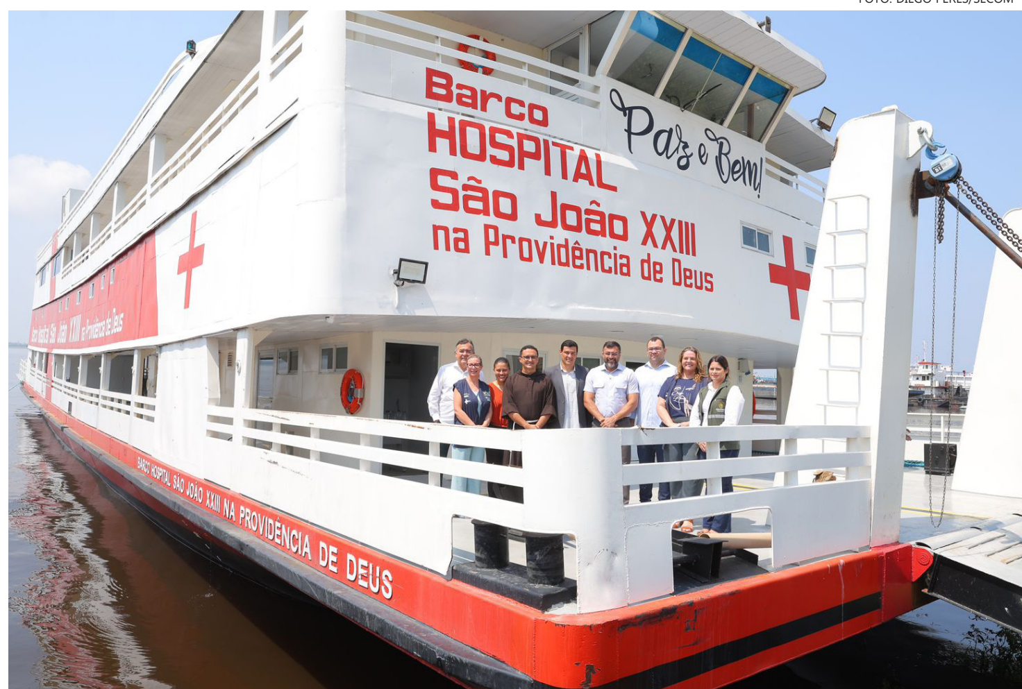
Barco Hospital São João XXIII