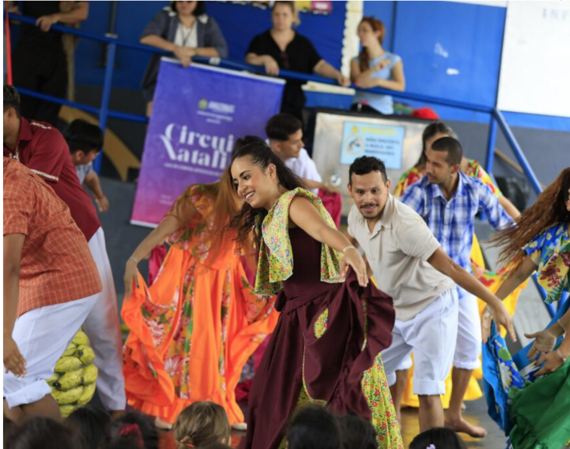
Circuito Natalino dos Corpos Artísticos do Estado agita o fim de semana

Na quarta-feira (27/11), das 14h às 16h, a Orquestra Jovem do Liceu de Artes e Ofícios Claudio Santoro se apresenta no CETI Doriana Correa Lopes, rua Grajauna, conjunto habitacional Lagoa Azul. Na apresentação, a Orquestra Jovem do Liceu de Artes