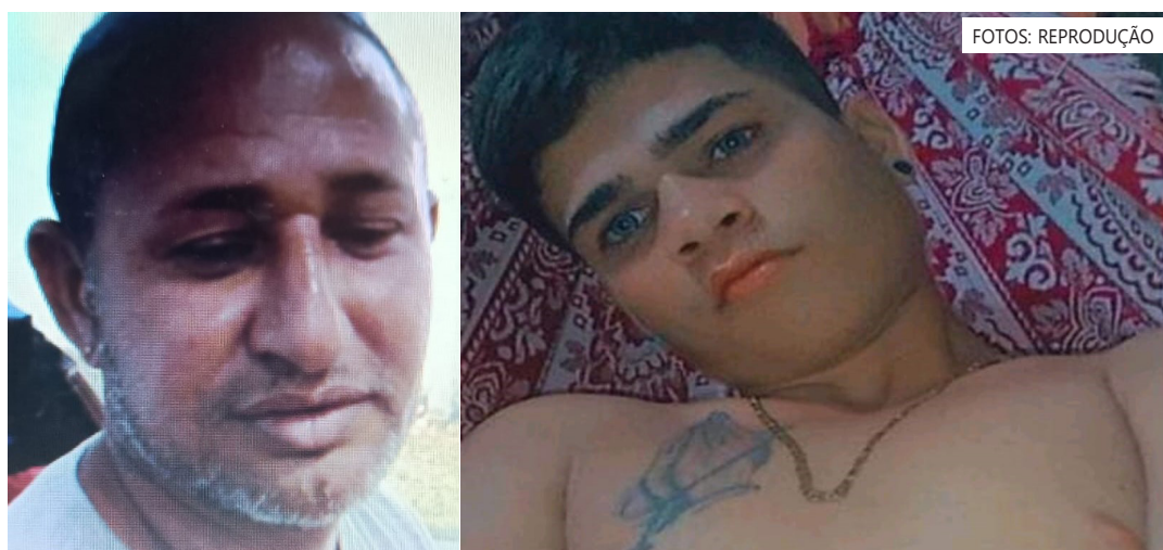
Os dois possuem envolvimento com tráfico de drogas no município

“Em geral, os autores são usuários de entorpecentes, comercializados pelos mesmos indivíduos que praticam o ‘tribunal do crime’ na cidade”, acrescentou Jailton Santos.