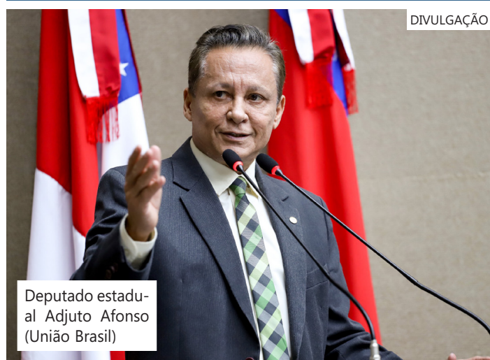
Deputado estadual Adjuto Afonso (União Brasil)

empreendedorismo, ao cooperativismo, ao comércio e ao setor primário, principal vetor de desenvolvimento econômico do interior do Amazonas. Ele também defende a Zona Franca de Manaus e trabalha para a ampliação do modelo econômico sustentável no Estado. Além disso, luta pela regulamentação da navegação fluvial e melhorias na infraestrutura de portos e aeroportos, essenciais para o Amazonas, onde os rios desempenham o papel de estradas.