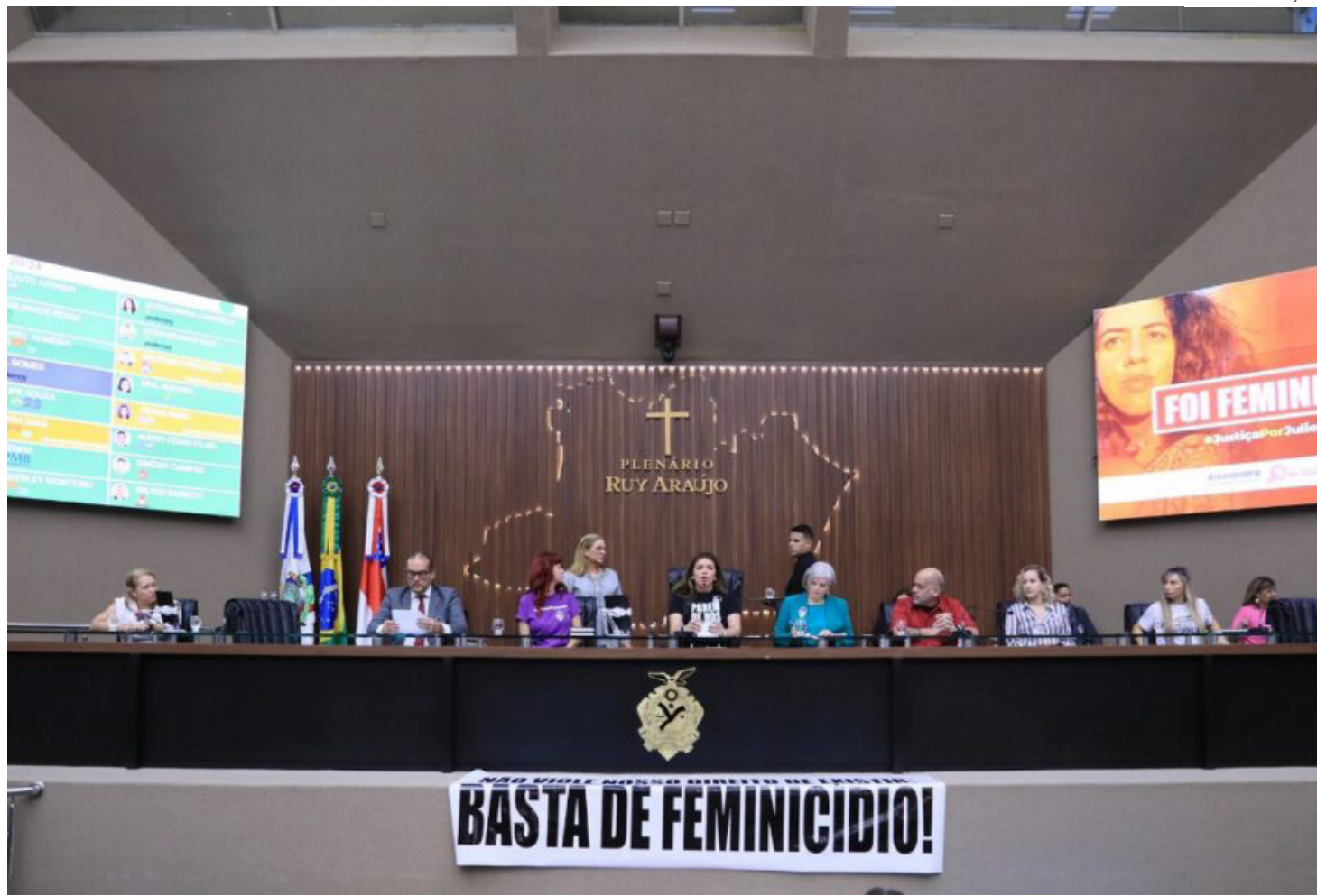
Comissão da Mulher, Procuradoria Especial da Mulher e programas da Escola do Legislativo

A Assembleia Legislativa do Amazonas (Aleam) atua permanentemente no combate à violência de gênero, com a produção e aprimoramento de Leis neste sentido, além de ter ferramentas de apoio à população feminina, como a Comissão da Mulher, a Procuradoria Especial da Mulher e programas da Escola do Legislativo, que promove palestras de direitos humanos e conscientização sobre violência de gênero. "Infelizmente, ainda são alarmantes os números de violência contra as mulheres. Na Aleam, temos procuramos trabalhar para atender as demandas das mulheres, que são vítimas de violência, seja com ações e auxílio na Procuradoria Especial da Mulher ou na criação de Leis que possam fortalecer a política de defesa da mulher", analisou o presidente da Aleam,