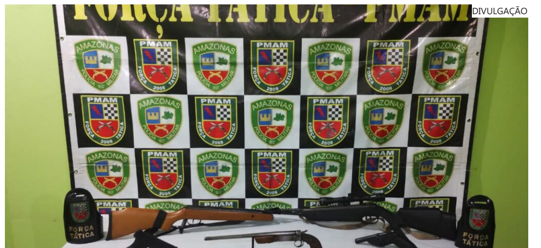
O material apreendido foi apresentado à autoridade policial na 36ª Delegacia Interativa de Polícia (DIP)

O material apreendido foi apresentado à autoridade policial na 36ª Delegacia Interativa de Polícia (DIP).