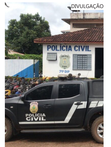
As investigações crime iniciaram com a denúncia da própria vítima

O homem responderá por estupro de vulnerável e está à disposição da Justiça.