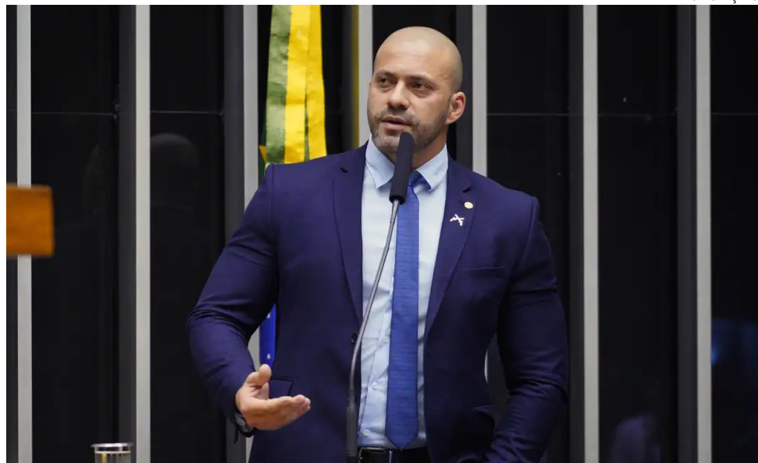
Ex-deputado federal Daniel Silveira

Logo em seu primeiro dia em livramento condicional, o sentenciado desrespeitou as condições impostas, pois, conforme informação prestada pela Seape/RJ, no dia 22 de dezembro, somente retornou à sua residência às 2h10 horas da madrugada, ou seja, mais de quatro horas