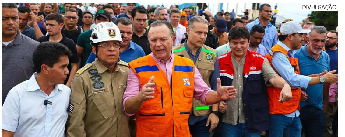
Ministério dos Transportes decretou situação de emergência na região

Segundo o ministro, a pasta trabalha para que os recursos sejam liberados ainda este ano. "Com a emergência decretada, queremos contratar a reconstrução da ponte ainda dentro do exercício de 2024. Isso será um trabalho de muita resolutividade do ministério", completou.