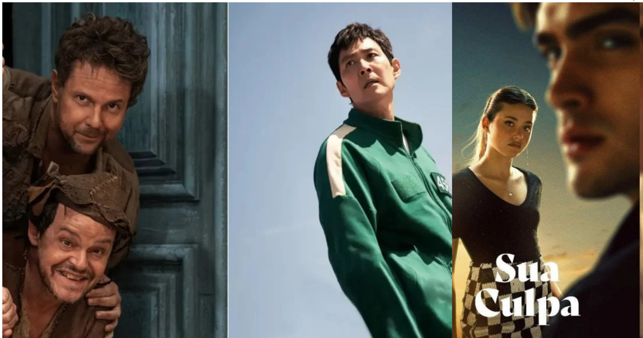
Toda semana novas produções estreiam nos cinemas e nos streamings

Produções com Austin Butler, Selton Mello, Jim Carrey e mais estreiam nos próximos dias