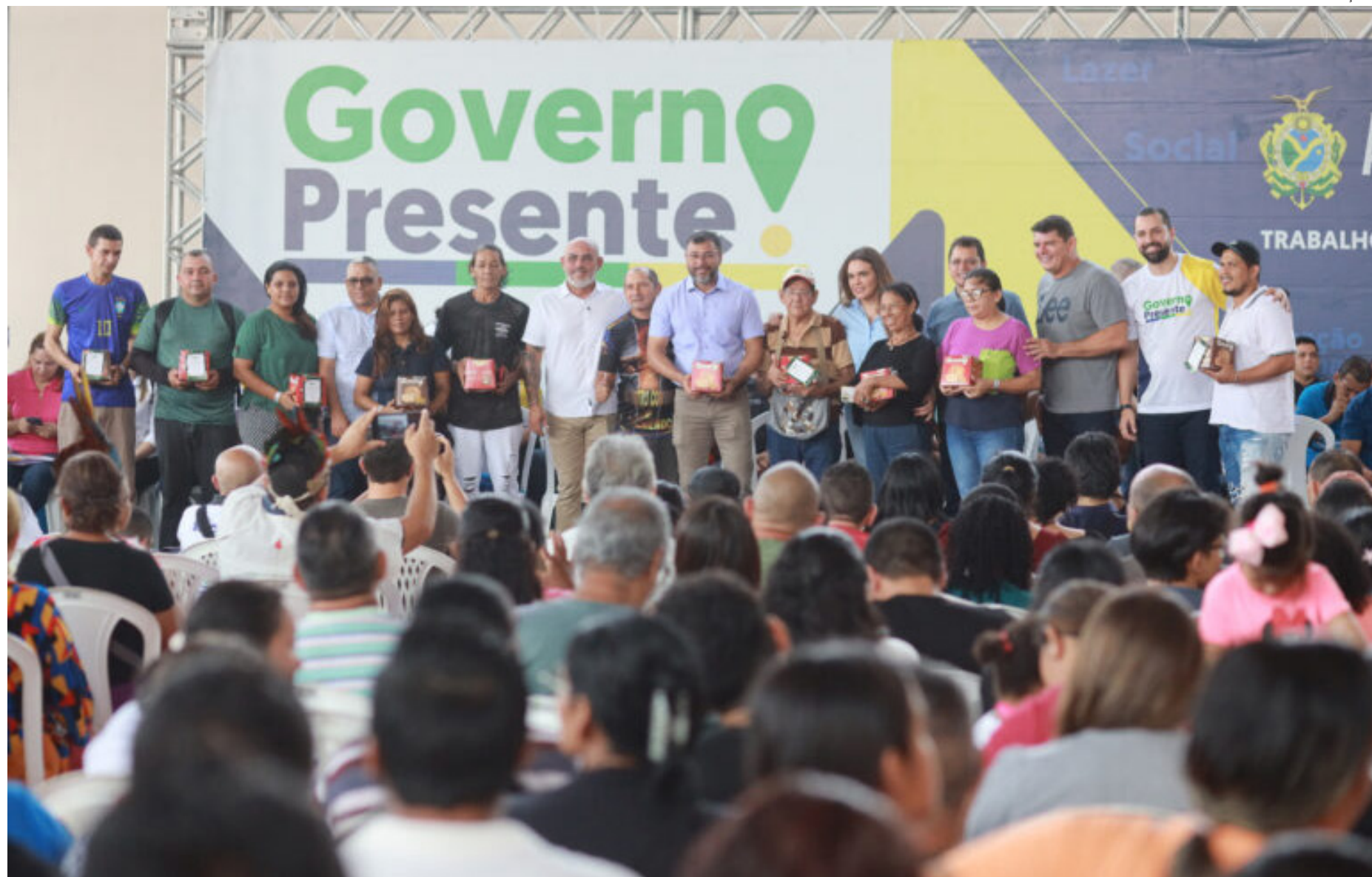
19ª edição do Governo Presente

A Secretaria de Estado de Saúde (SES-AM) fez 711 atendimentos na última edição. Foram disponibilizadas 128 fichas para atendimento médico com especialistas, como clínico geral, oftalmologista, ginecologista e otorrinolaringologista.