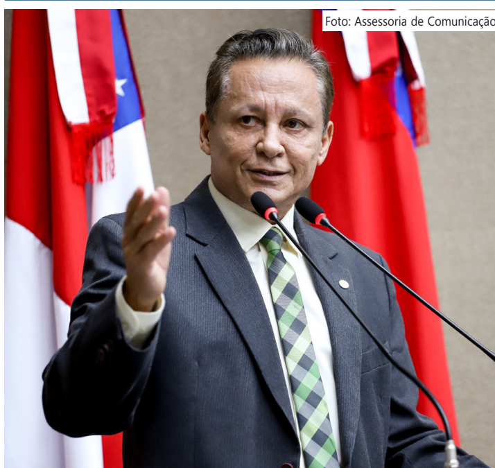
Deputado estadual Adjuto Afonso (União Brasil)

Os resultados refletem não apenas a produtividade do parlamentar, mas também na sua capacidade de diálogo e articulação em temas relevantes para o Estado. Com o olhar voltado para 2025, Adjuto reforça sua determinação em continuar contribuindo para o progresso do Amazonas.