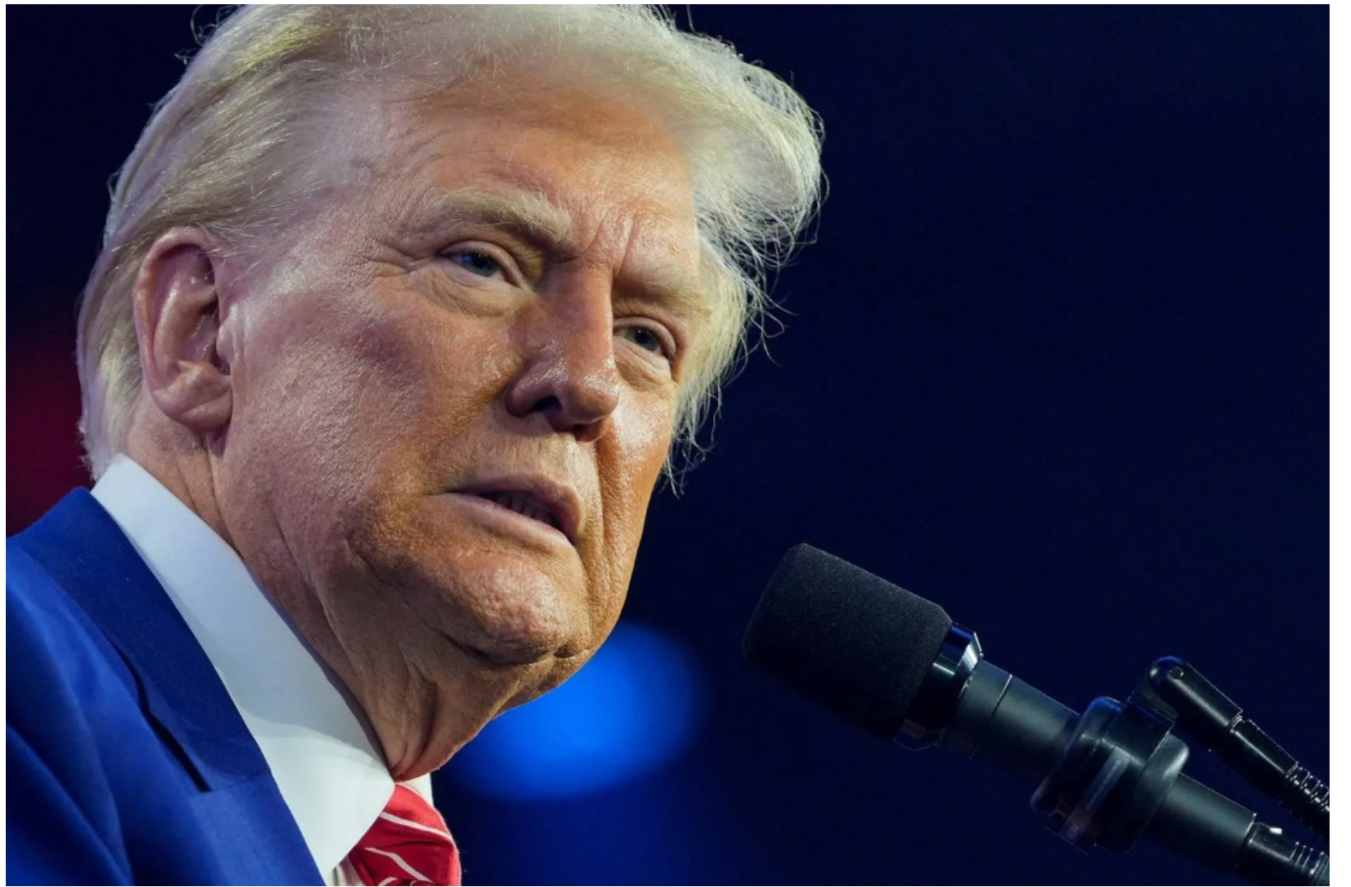
Donald Trump em Phoenix

Nas semanas anteriores, foi o Canadá que teve de