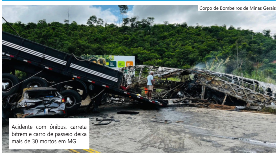
Corpo de Bombeiros de Minas Gerais

Nesta segunda, três pessoas permanecem internadas no Hospital Santa Rosália, em Teófilo Otoni. Um adulto está na Unidade de Terapia Intensiva, uma criança de 13 anos está na Unidade Coronariana e outra de oito anos está na enfermaria. Os três estão estáveis e não correm risco.