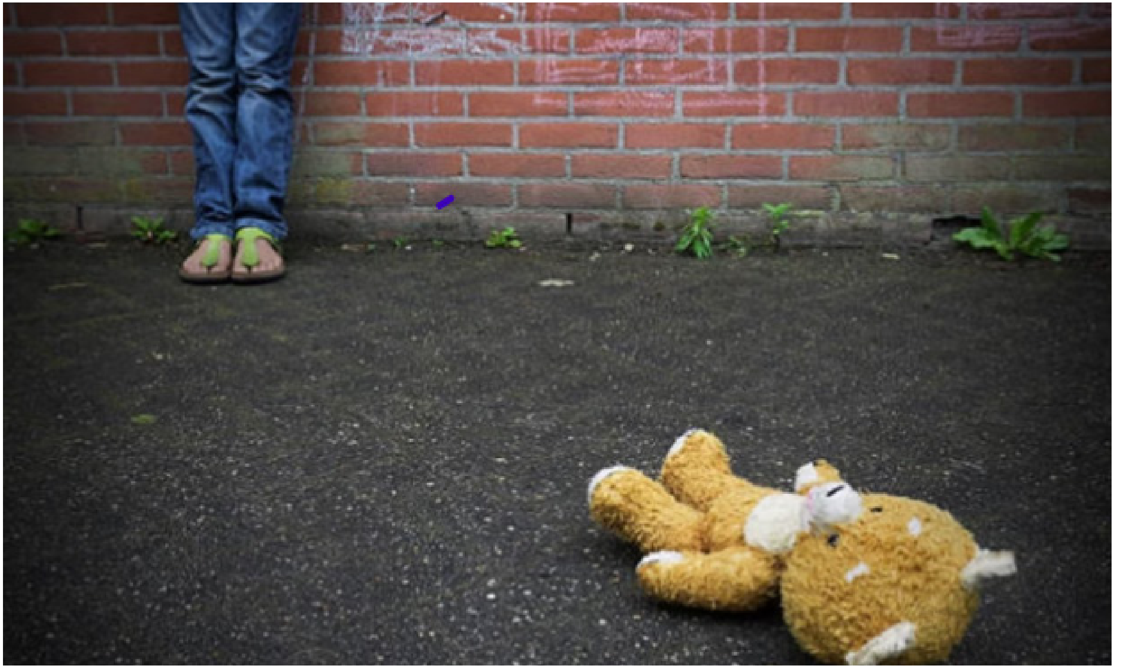
O réu encontra-se preso

Em juízo, a adolescente disse que os abusos tiveram início quando ela começou a "virar mocinha".