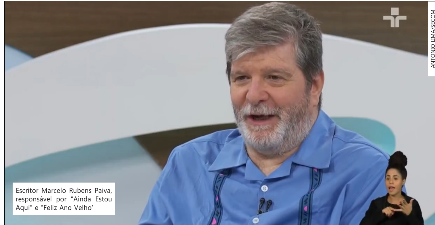
Escritor Marcelo Rubens Paiva, responsável por “Ainda Estou Aqui” e “Feliz Ano Velho”

“A arte tem essa função de registrar o tempo”,