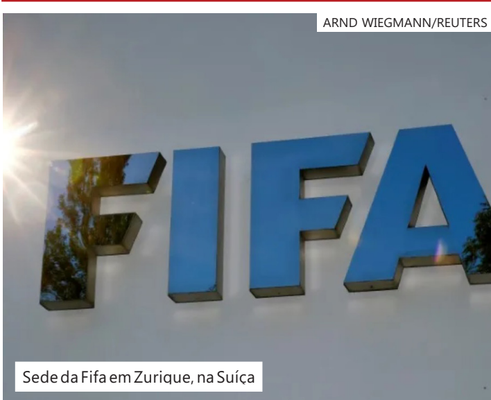
Sede da Fifa em Zurique, na Suíça

A Fifpro emitiu um comunicado criticando a decisão da Fifa e disse que não conseguiu chegar a um consenso sob o qual pudesse negociar alterações aos regulamentos para refletir a decisão.