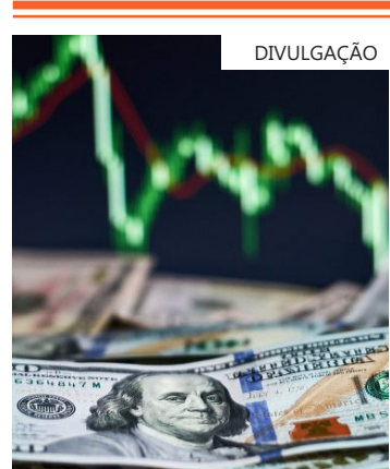
Taxa de corte foi de R$ 6,02; oferta total era de US$ 1 bilhão

"O dólar, no início da tarde, mais uma vez, começou a