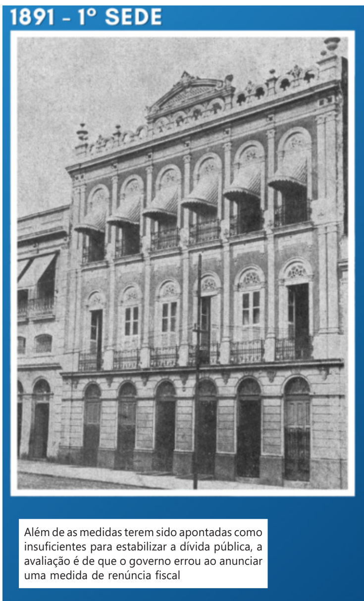
Além de as medidas terem sido apontadas como insuficientes para estabilizar a dívida pública, a avaliação é de que o governo errou ao anunciar uma medida de renúncia fiscal

Ela ressaltou que o objetivo é manter a evolução no atendimento, gerando melhorias em sistemas e no trabalho humano oferecido aos usuários. Para a gestora, estes investimentos "impulsionam o ambiente de negócios e auxiliam o fomento econômico do estado". "Anualmente, temos a certeza que estamos encaminhando a ascensão de negócios do Amazonas, nossos registros sempre apontam saldos positivos, ano a ano, pelo crescimento de registros mercantis. Acredito que nosso propósito, em ser o facilitador e impulsionar os empreendedores, estejam com ótimos resultados, para o empresário e para nosso estado", afirmou a presidente da Jucea.