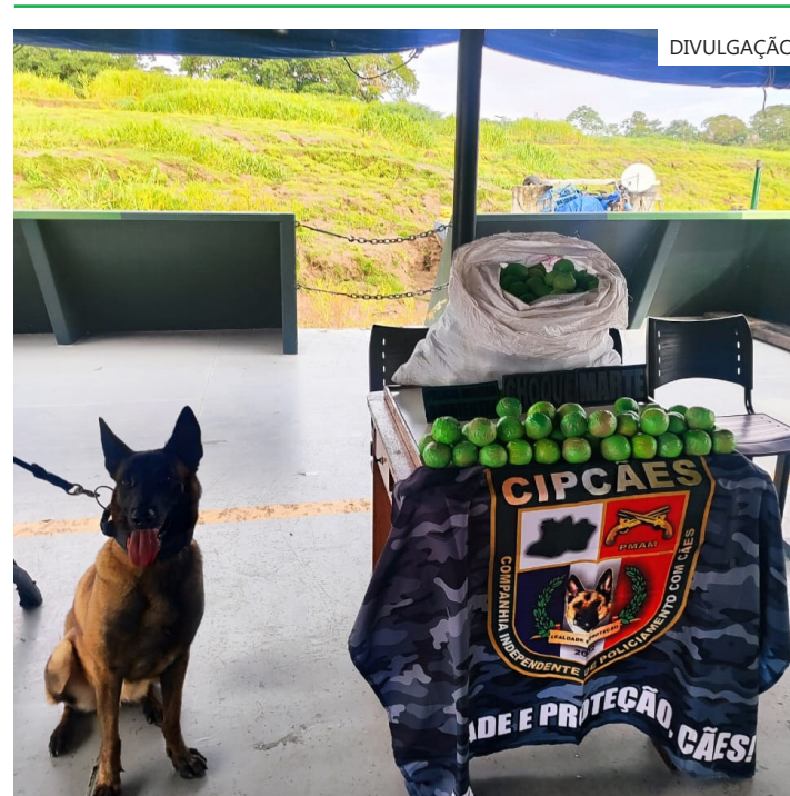
Toda a droga apreendida foi entregue à Polícia Civil (PC-AM), que dará seguimento às investigações

todo, a apreensão gerou R$ 2.775.000 de prejuízo ao crime. As equipes policiais chegaram a realizar buscas na embarcação e checagem das câmeras de vigilância para tentar localizar o responsável pela droga, mas o suspeito não foi localizado.