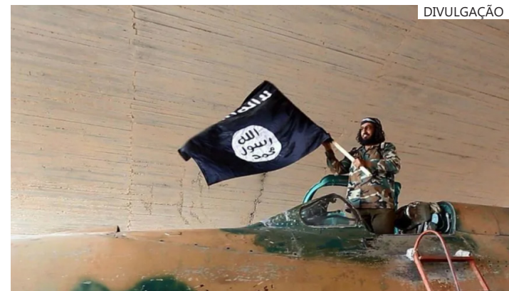
Grupo radical chegou a criar um califado dentro do país durante a guerra civil e continua ativo na região

Por conta da volatilidade da situação, os líderes da SDF tiveram que suspender as suas operações militares contra o ISIS, complicando ainda mais os esforços dos Estados Unidos para impedir que o grupo radical islâmico se reorganize de maneira efetiva.