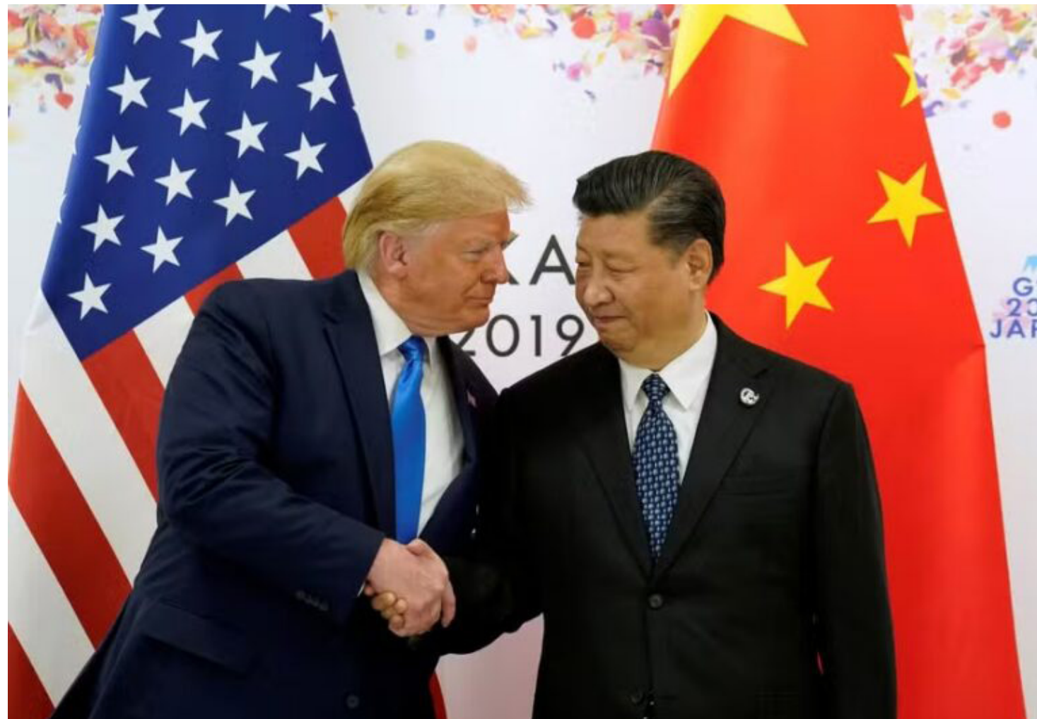
Presidente eleito dos EUA, Donald Trump, e presidente da China, Xi Jinping

Tal visita colocaria o presidente chinês na posição de prestar homenagem a Trump e ao poderio americano - o que entraria em conflito com sua visão para a China assumir um papel legítimo como uma