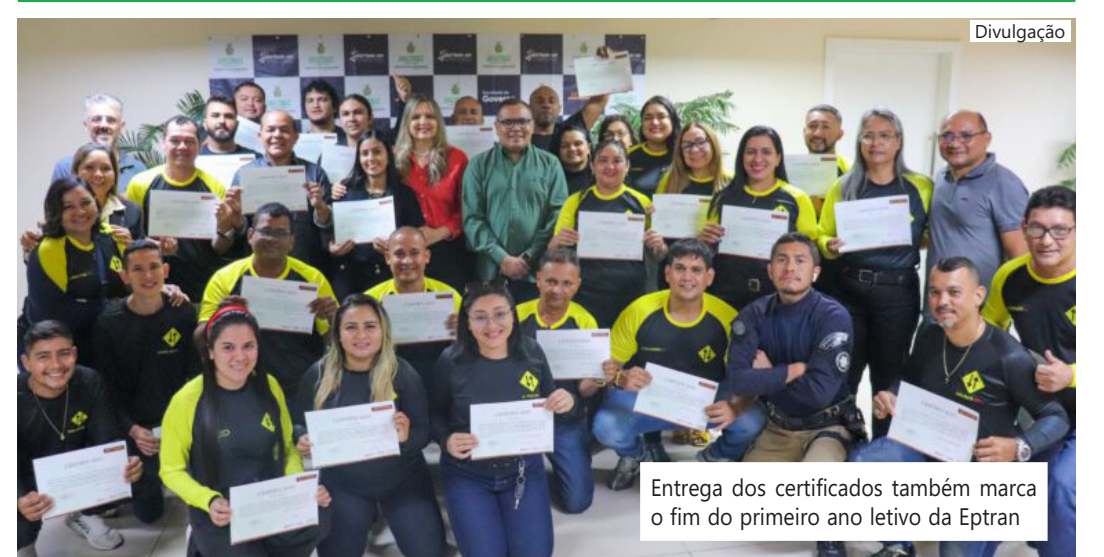
Entrega dos certificados também marca o fim do primeiro ano letivo da Eptran