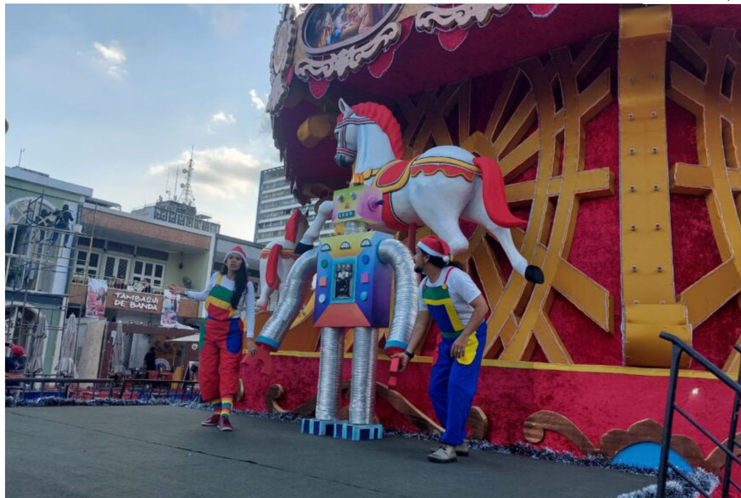
Palco da Árvore de Natal do Largo São Sebastião

questra de Câmara do Amazonas (OCA) se une ao coral do Colégio Santo Afonso para apresentar o "Concerto Natalino", às 20h, no Santuário Nossa Senhora de Fátima, avenida Tarumã - Praça 14, com entrada gratuita.