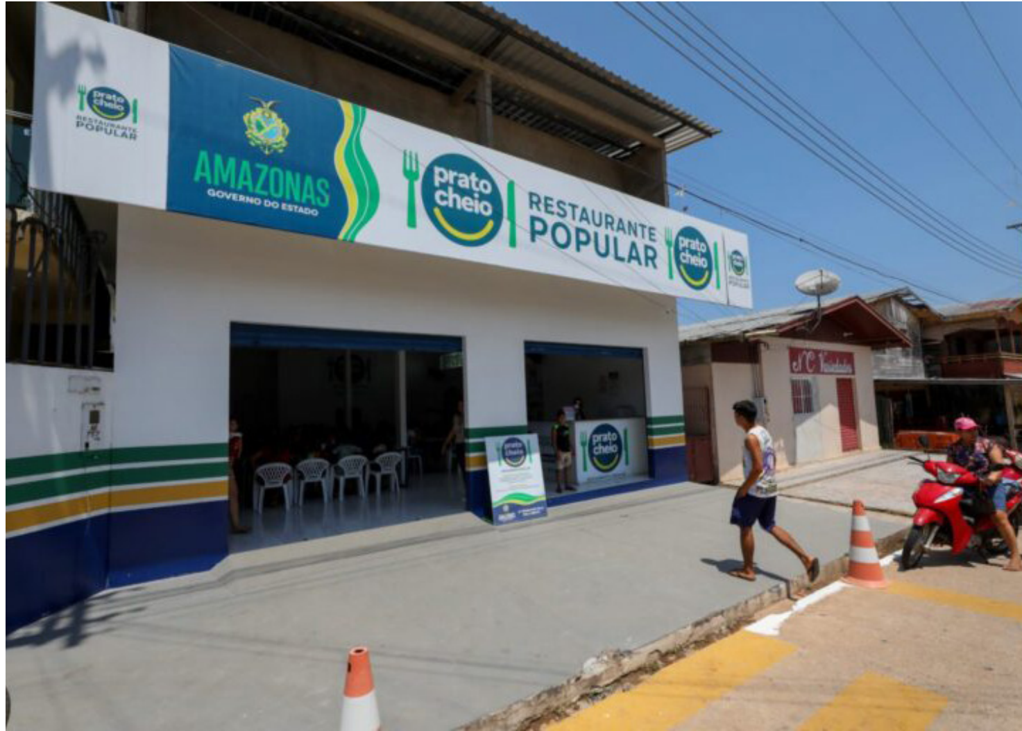
Programa Prato Cheio do Governo do Amazonas