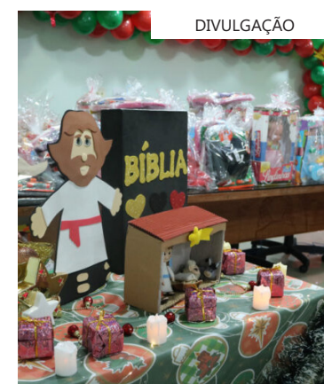
A festa foi organizada pelo serviço de Pediatria e contou com doações de empresários, grupos religiosos, ONGs e pessoas físicas

A ação também teve a presença do "Bom velhinho", que animou a criançada presente.