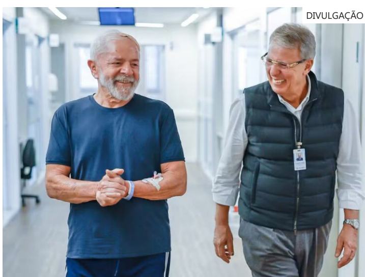
Presidente agradeceu às mensagens de carinho que recebeu após internação

À noite, Lula retirou um dreno que foi colocado na cabeça dele. Ainda não há previsão de alta hospitalar, mas os médicos estimam que o presidente possa deixar o hospital no início da semana que vem.