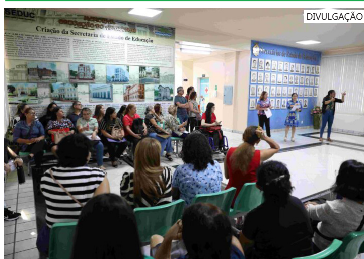
Os profissionais atuarão nas modalidades de Ensino Regular, Educação Especial e Ensino Mediado por Tecnologia

O atendimento de lotação seguirá a ordem de classificação quando houver mais de um candidato para o cargo, seguindo o horário e a data estabelecidos no cronograma. O não comparecimento do convocado excluirá o candidato do certame, ocasionando a perda do direito à vaga, conforme o Edital de n.º 01-PSS/SE-DUC/2023/2024.