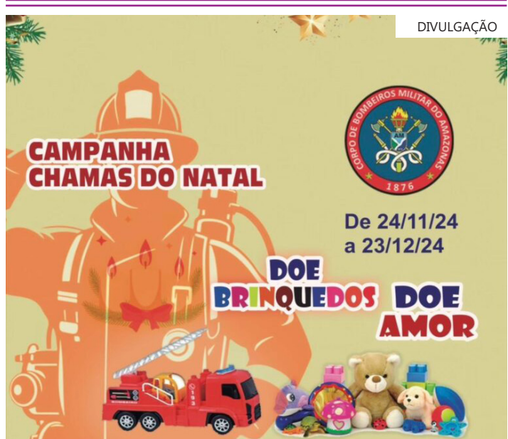
A doação pode ser feita em todos os postos da corporação na capital

Além dos brinquedos, os interessados que preferirem também podem ajudar com valor em dinheiro entrando em contato pelo telefone (92) 98192-5040.