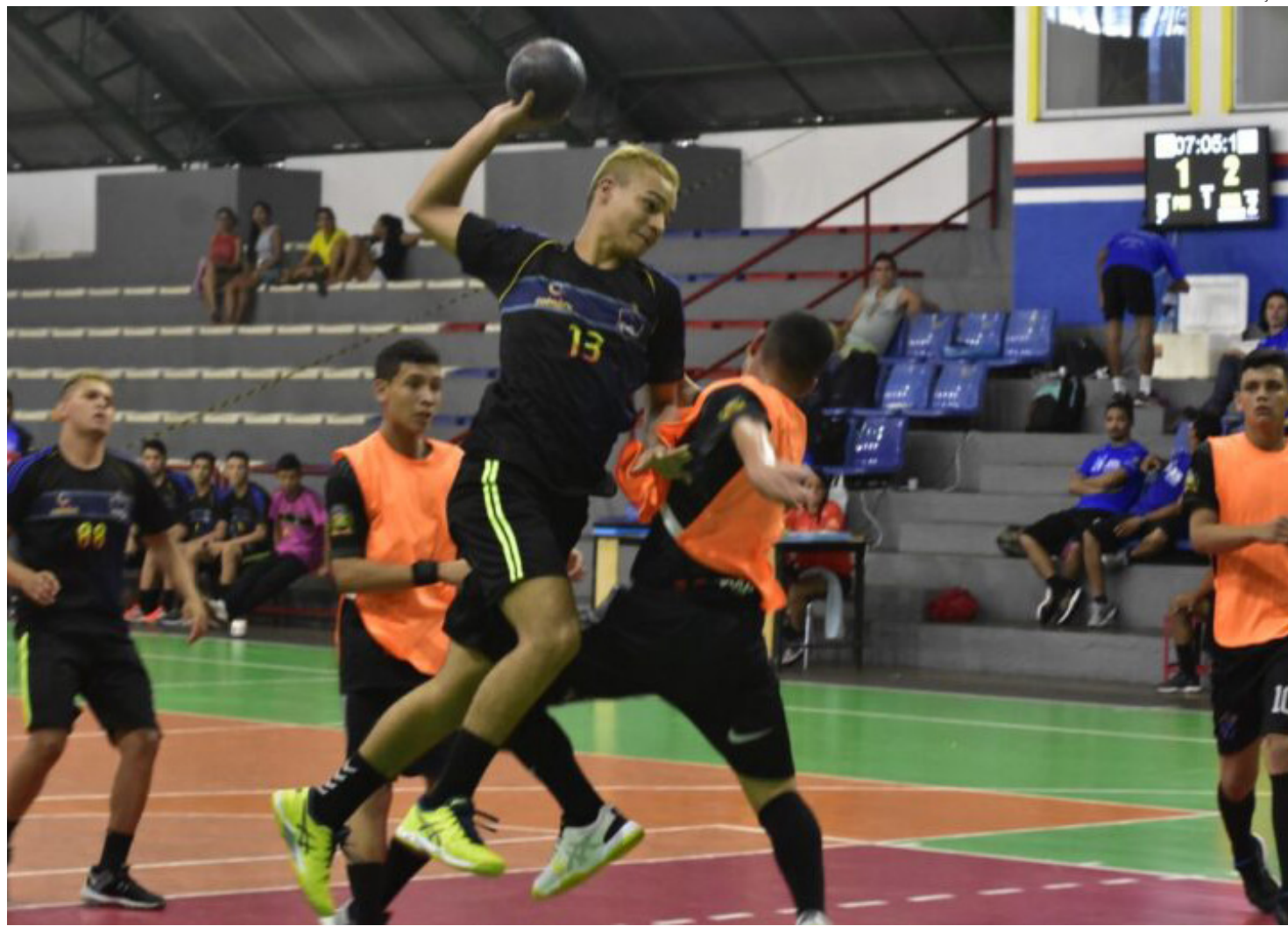
Campeonato Amazonense Juvenil de Handebol 2024

O campeonato encerra o calendário de jogos de 2024 e será disputado na categoria adulto, nos naipes masculino e feminino, entre os times estão: Atlético Nilton Lins, Novo Airão, A.E. Manacapuru, Manauense A.Desportiva, Atlético Rio Negro e Liga de Santa Etelvina/CJB. Organizada pela Liga de Handebol do Amazonas (Liham), o Campeonato Amazonense Juvenil tem entrada gratuita no Ginásio