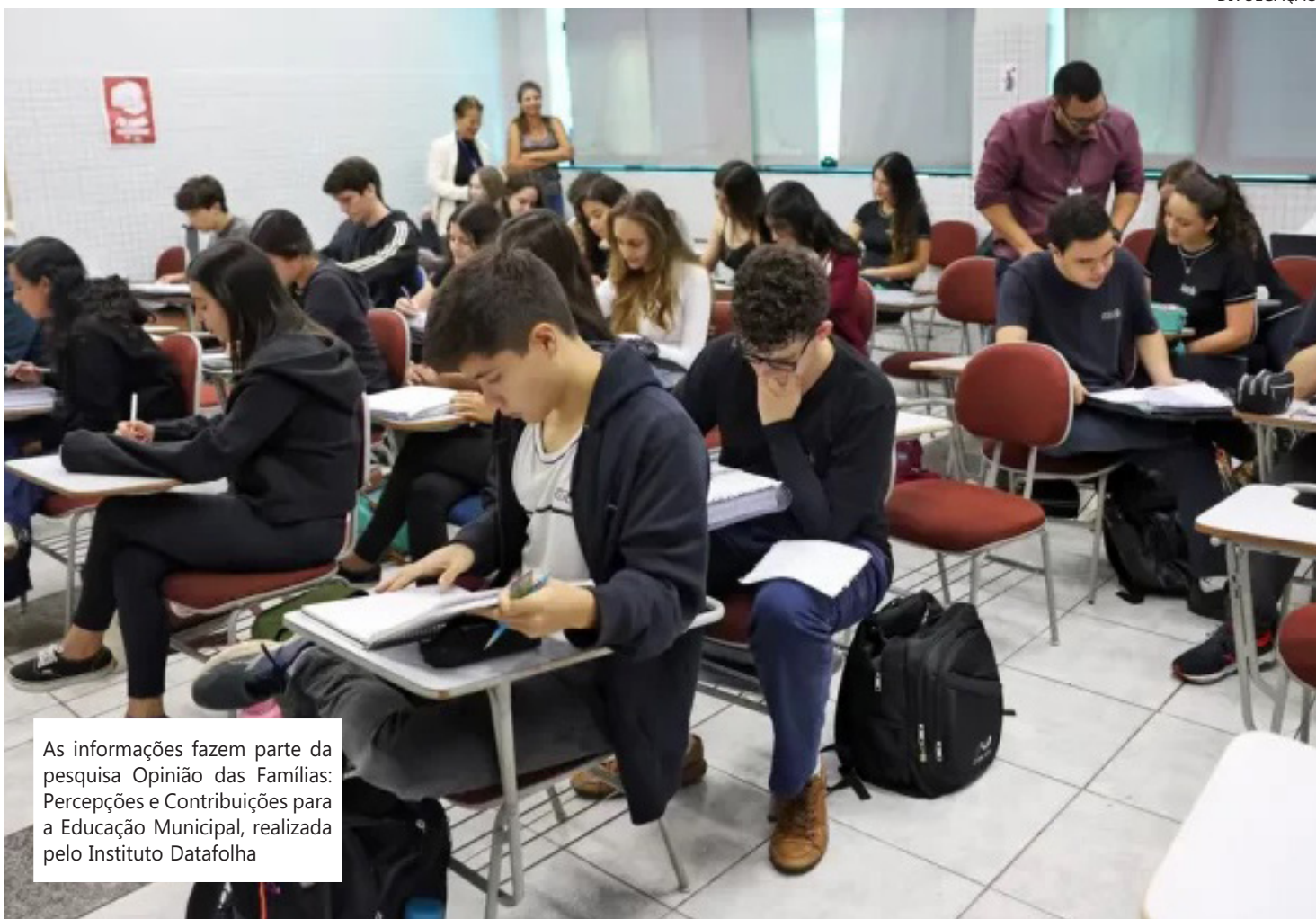
As informações fazem parte da pesquisa Opinião das Famílias: Percepções e Contribuições para a Educação Municipal, realizada pelo Instituto Datafolha

Para ela, isso é uma sinalização importante para os governantes: “É uma percepção da sociedade de que a educação precisa melhorar. Então, acho que é uma sinalização muito importante para os governadores, para os prefeitos, para todos os governantes, de que é preciso