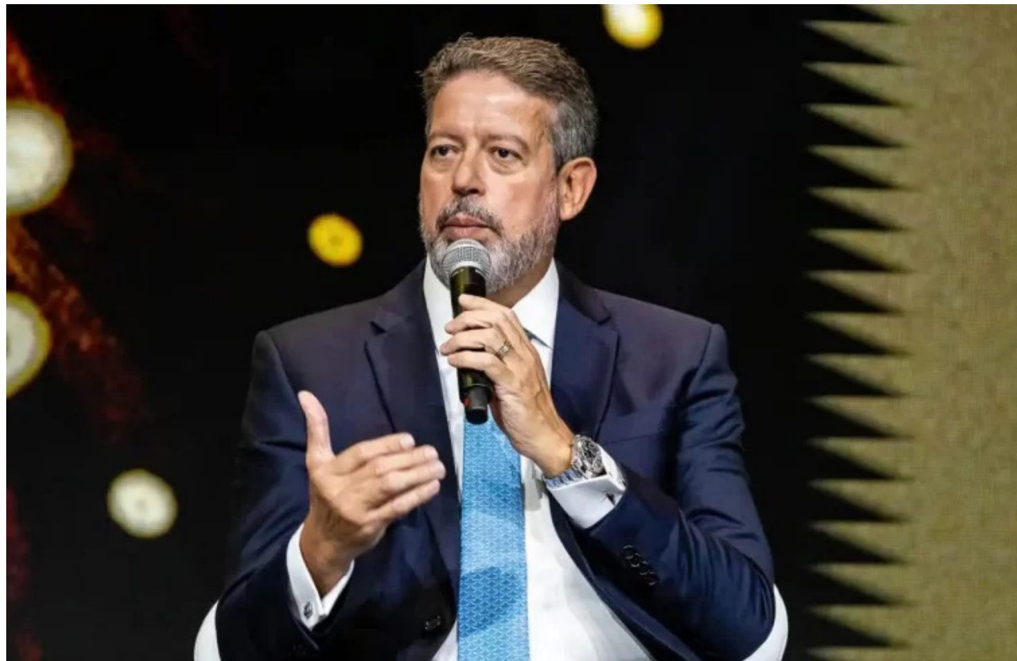
O presidente da Câmara dos Deputados, Arthur Lira

Nesta quinta-feira, 12, o presidente da Câmara, Arthur Lira (PP-PI), anunciou que, na próxima semana, serão suspensas as reuniões em comissões permanentes na Casa. O objetivo é priorizar a discussão e aprovação de projetos no plenário, como o pacote fiscal e a regulamentação da reforma tributária. Lira destacou a "proximidade do encerramento" do ano legislativo, marcado para 22 de dezembro. As sessões serão retomadas em 2 de fevereiro, quando haverá uma eleição para a sucessão do comando da Casa.