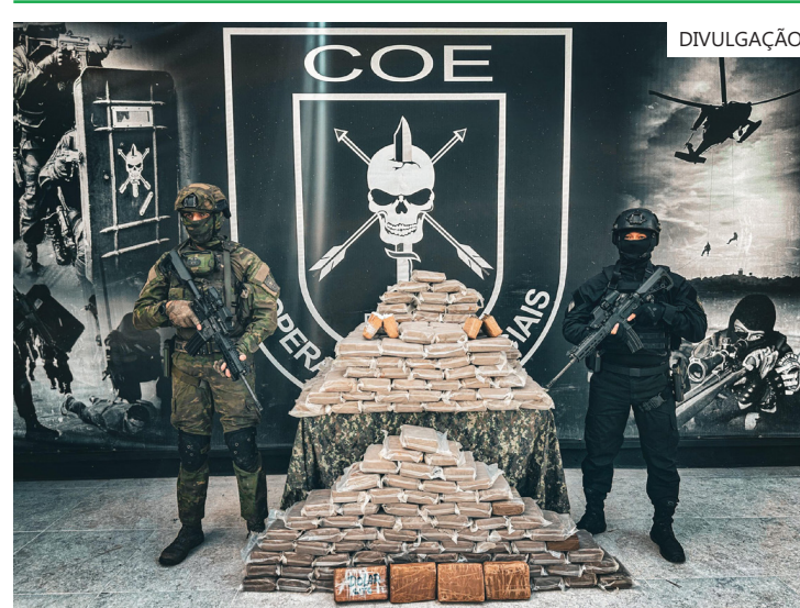
Em Anamã, PMAM e FICCO/AM apreendem 256 kg de entorpecentes e helicóptero

A operação reforça o comprometimento das Forças de Segurança no combate ao tráfico de drogas e na desarticulação de rotas ilícitas na Amazônia. Essa apreensão também destaca a importância da cooperação entre as forças policiais e o papel da população no fornecimento de informações que contribuem para a eficácia das operações na região.