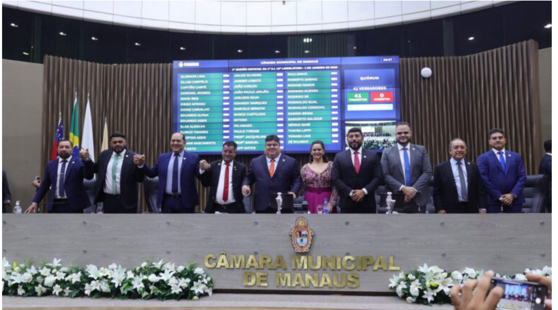
Mesa Diretora que comandará a Casa Legislativa no biênio 2025-2026