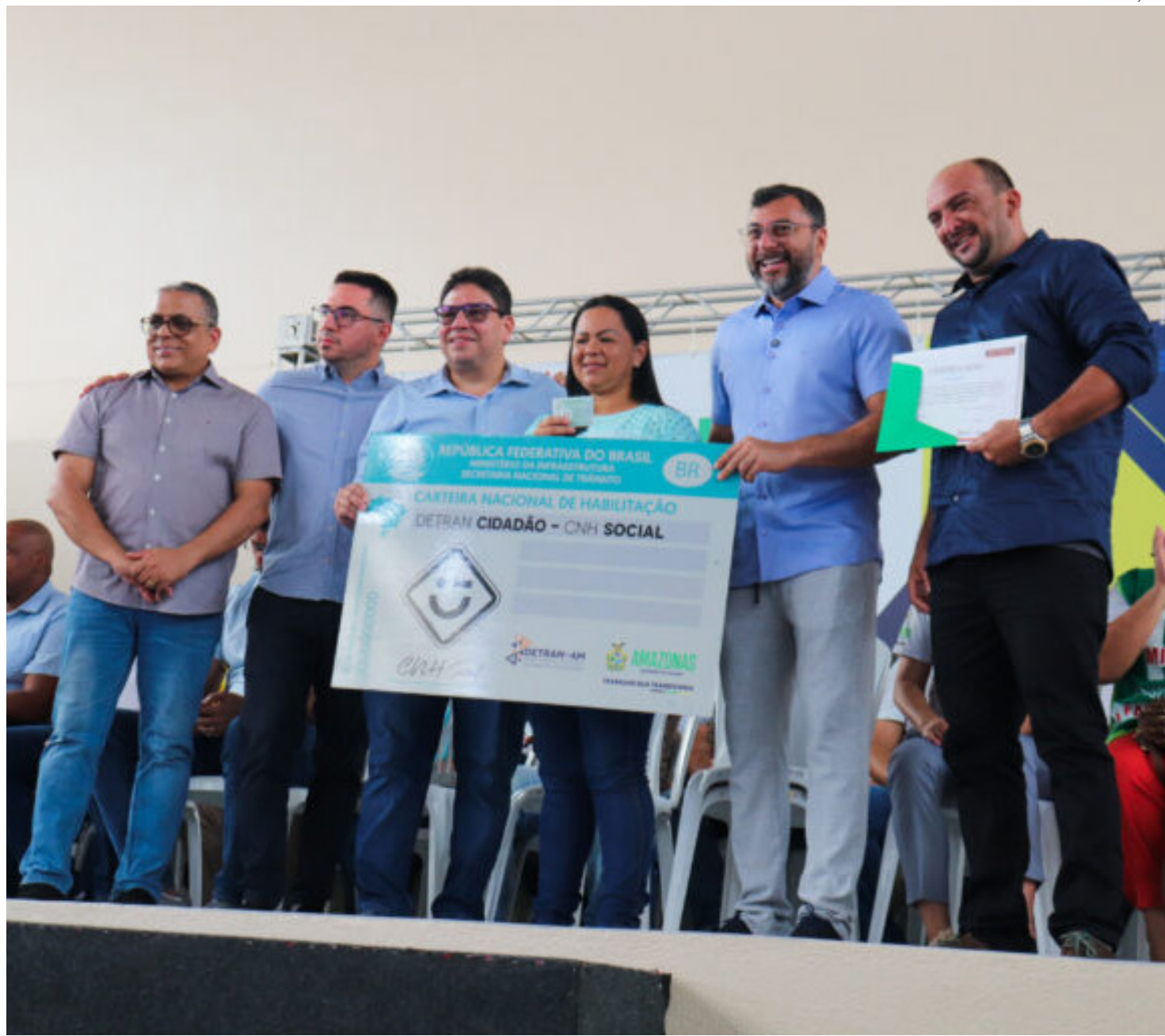
Departamento Estadual de Trânsito do Amazonas (Detran-AM)

Ainda segundo o diretor-presidente, entregas como essas são de suma importância para dar oportunidade e dignidade àquelas pessoas de baixa renda, que de alguma forma não teriam a possibilidade de tirar a sua habilitação ou de fazer cursos profissionalizantes e, com isso, entrarem no mercado de trabalho.