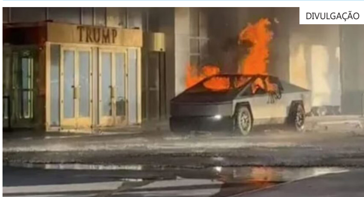
Polícia declara explosão de Tesla Cybertruck no hotel Trump em Las Vegas um caso isolado