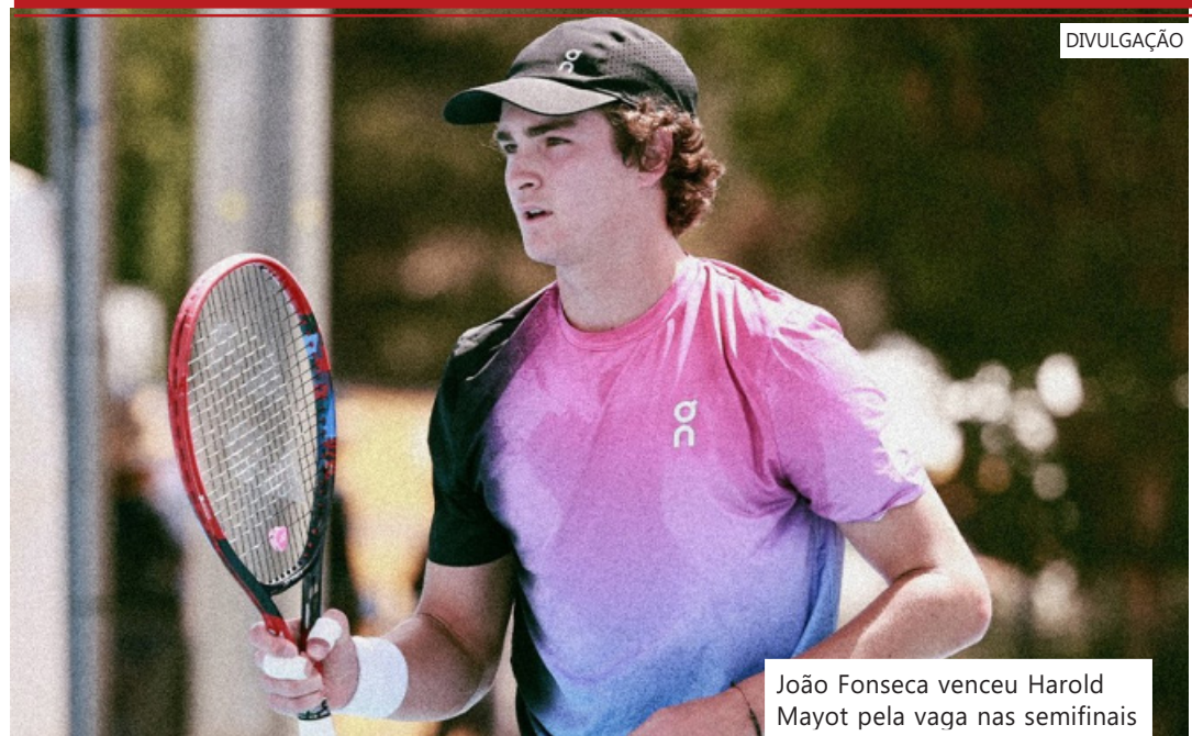
João Fonseca venceu Harold Mayot pela vaga nas semifinais

seca, que está invicto desde sua conquista no Next Gen Finals, em Jeddah. O brasileiro enfrenta agora o britânico Jacob Fearnley, um confronto inédito entre os dois. A partida está prevista para a noite desta quinta-feira, às 23h20 (horário de Brasília). O challenger de Camberra é um dos torneios preparatórios para o Australian Open. João jogará o qualificatório do Grand Slam a partir da próxima segunda-feira, dia 6 de janeiro.