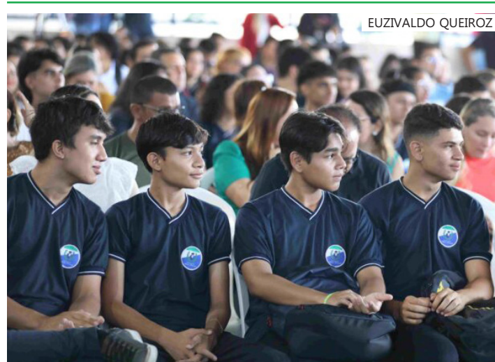
Poderão participar alunos da rede pública estadual que concluíram o 9º ano em 2024

A homologação das inscrições será divulgada no dia 22 de janeiro de 2025, no site da Fundação Matias Machline. Seguindo o cronograma especificado no edital, os candidatos podem interpor recursos até que o resultado final seja divulgado. As matrículas serão realizadas no período entre 29 de janeiro e 1º de fevereiro, e as aulas iniciam no dia 3 de fevereiro de 2025.