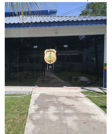
O autor não aceitava o fim do relacionamento