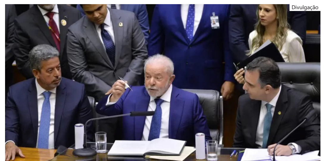
Presidente da República, Luiz Inácio Lula da Silva, ao lado dos presidentes da Câmara, Arthur Lira e do Senado, Rodrigo Pacheco