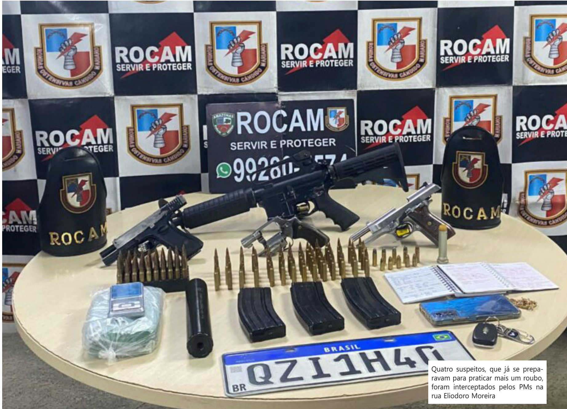
Quatro suspeitos, que já se preparavam para praticar mais um roubo, foram interceptados pelos PMs na rua Eliodoro Moreira

Ao todo, foram cumpridos 17 mandados de prisão preventiva em Manaus e na cidade de Brusque (SC)