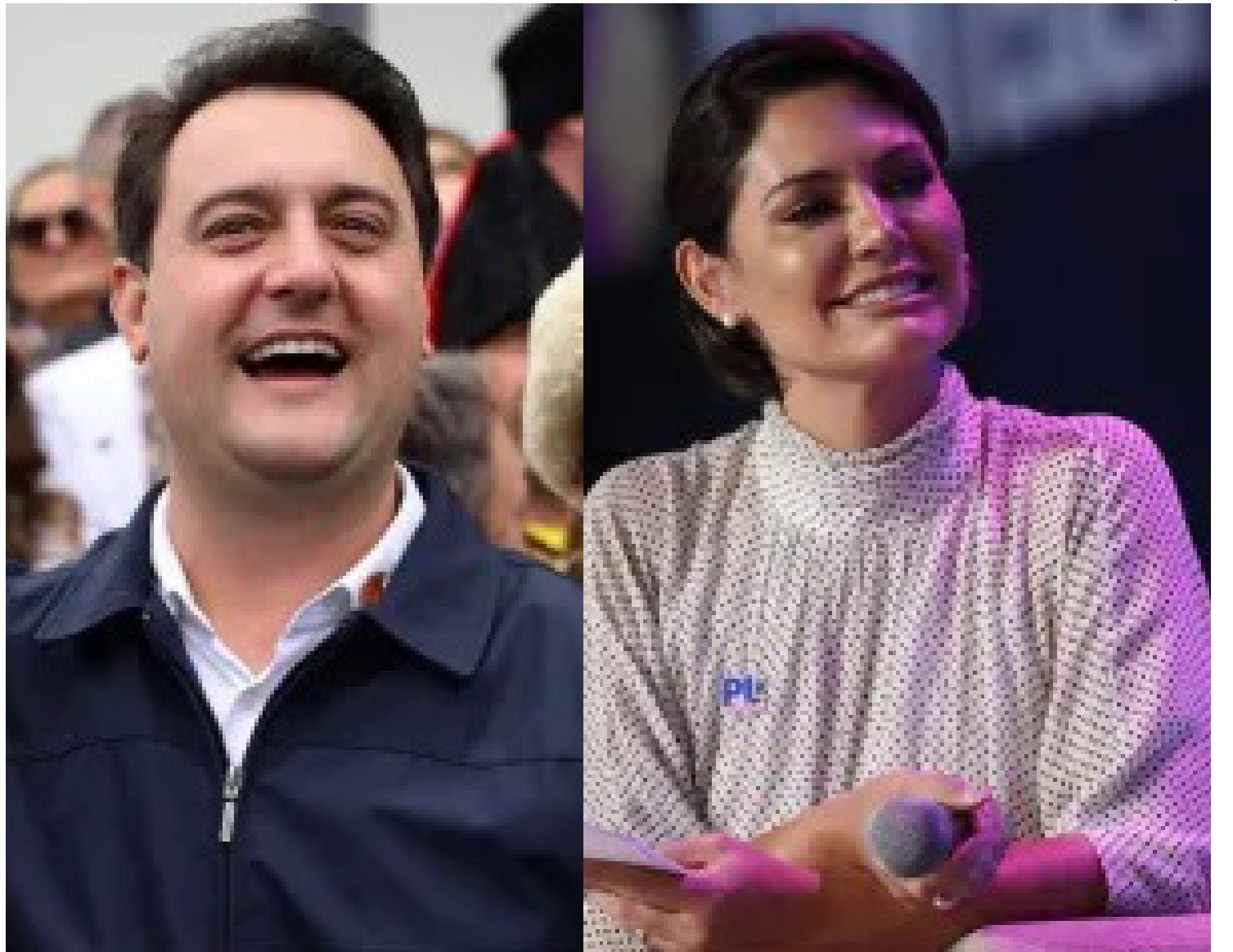
O governador do Paraná, Ratinho Júnior (PSD), e a ex-primeira-dama da República Michelle Bolsonaro

Ratinho Júnior poderia romper essa barreira caso tenha apoio do pai, o apresentador Ratinho, do SBT, que é um fenômeno de comunicação popular, com capilaridade inclusive