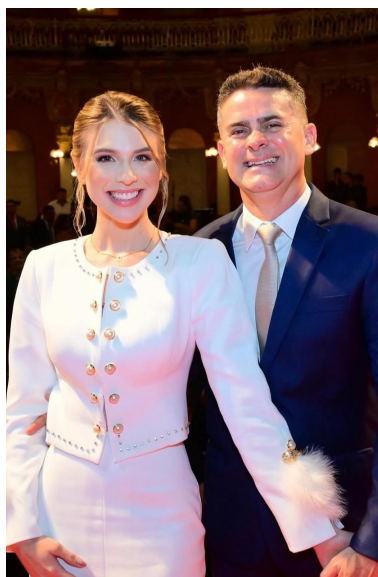
A primeira-dama de Manaus, Izabelle Almeida e o prefeito David Almeida