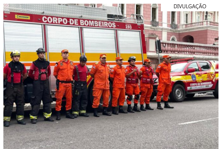
Integração assegura sucesso do planejamento operacional na capital amazonense