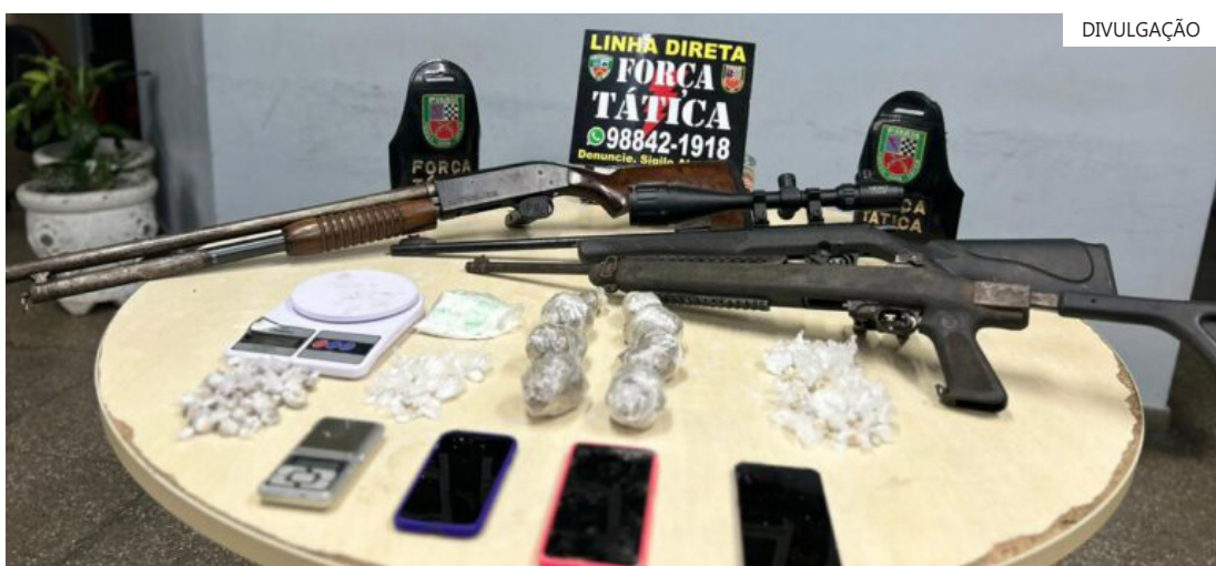
Fuzil, espingarda, rifle e uma luneta foram apreendidos em uma residência