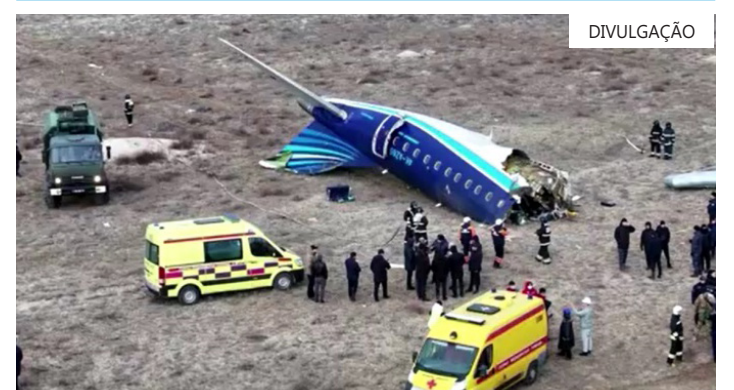
Material chegou a Brasília na quarta-feira (1º) em Brasília; aeronave foi fabricada pela brasileira Embraer

O jato E190, fabricado pela brasileira Embraer, havia decolado de Baku, capital do Azerbaijão, e tinha como destino a cidade russa de Grózni, capital da Chechênia. Vinte e nove pessoas sobreviveram à queda.