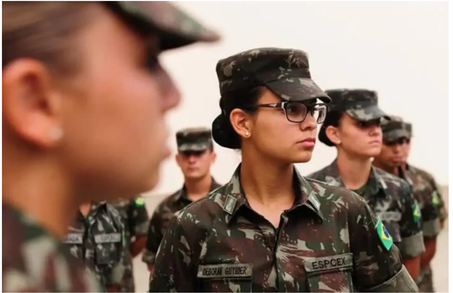
O número de vagas para mulheres no serviço militar voluntário crescerá progressivamente até que atinja 20% das vagas

O número de vagas para mulheres no serviço militar voluntário crescerá progressivamente até que atinja 20% das vagas. Este ano estão sendo oferecidas 1.465 vagas - 1.010 vagas para o Exército;