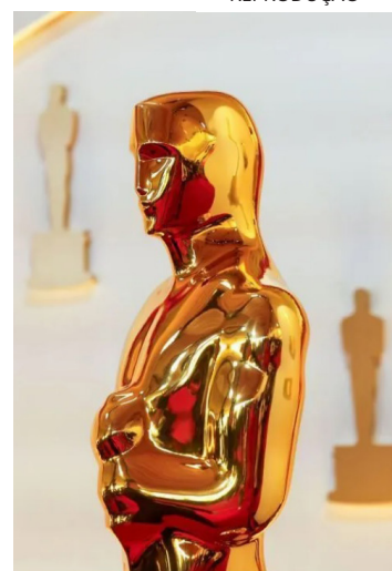
97ª edição do Oscar acontece em 3 de março de 2025