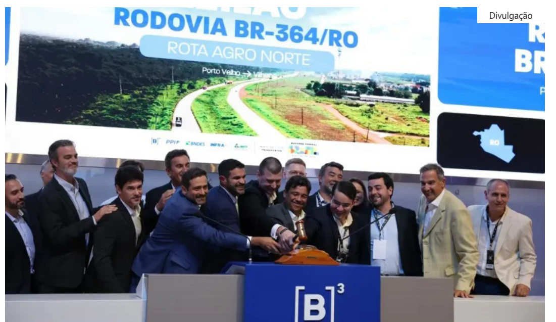
Consórcio 4UM-Opportunity ofereceu 0,05% de desconto no pedágio