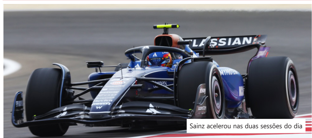
Sainz acelerou nas duas sessões do dia

Os pilotos voltam ao Circuito Internacional do Bahrein nesta sexta-feira, 28, para o terceiro e último dia dos testes de pré-temporada. O BandSports transmite as atividades ao vivo a partir das 6h (horário de Brasília).