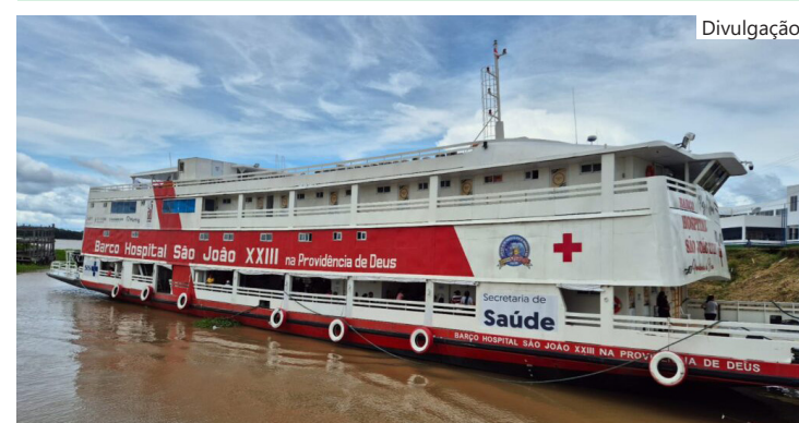
A unidade fluvial recebeu moradores da comunidade Vila do Jacaré, distante mais de uma hora de lancha rápida da sede do município