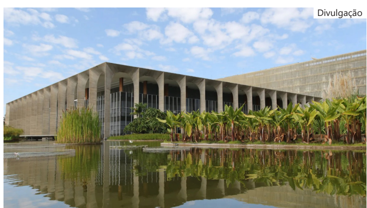
Palácio do Itamaraty, na Esplanada dos Ministérios, em Brasília

“Aquilo que for necessário fazer em cada estado, em cada cidade, que a gente tiver dinheiro, a gente vai fazer. Portanto, Tarcísio, não se preocupe que vai ter muita foto da gente junto. O que é mais grave para os nossos adversários é a gente sorrindo junto nas fotos, isso vai deixar muita gente... pode até ter infarto na história”, completou.