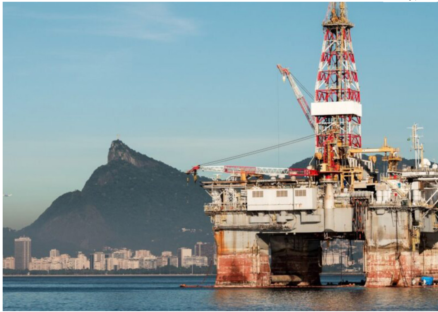
O dividendo anunciado de equivalente a US$ 1,6 bilhão ficou bem abaixo do consenso, conforme destacou a XP em relatório

O resultado contribuiu para um recuo 70,6% no lucro líquido de