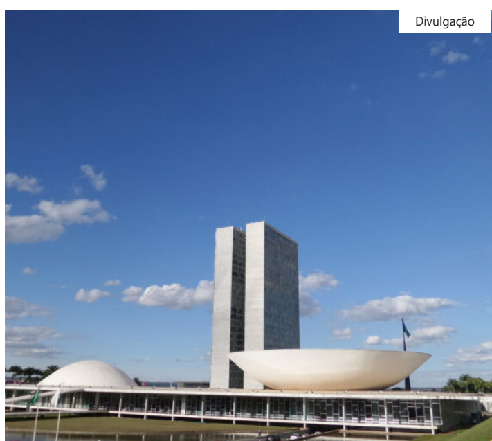
O número representa uma alta nominal de 6,8% em relação ao ano passado

A estimativa do ministério é que a concessão possa gerar mais de 92 mil empregos.