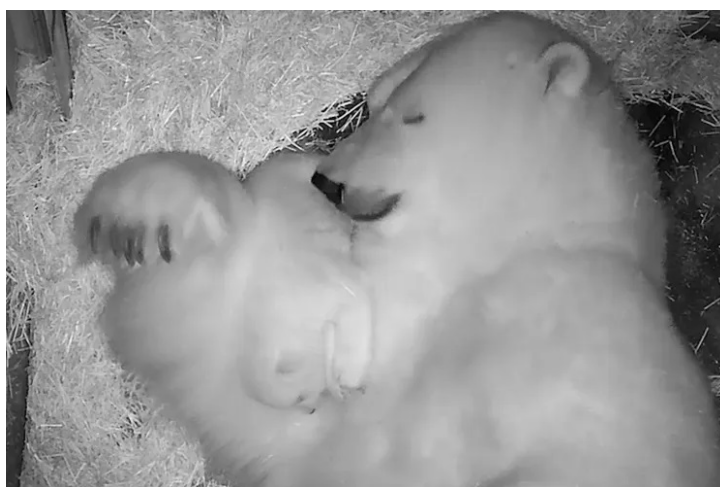
A ursinha é filha do casal Aurora e Peregrino, que vivem no Aquário de São Paulo há 10 anos.

O resultado mais significativo da parceria foi a tradução para o russo da obra "Polar Bears: The Natural History of a Threatened Species" (em tradução: "Ursos Polares: A História Natural de uma Espécie Ameaçada"), do pesquisador canadense Ian Stirling (1941-2024).