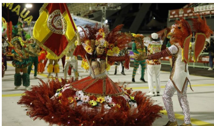
As escolas de samba do Grupo Especial desfilam na passarela do samba no dia 1º de março

determinado pelo regulamento aprovado pelas diretorias das escolas de samba, a campeã do Grupo de Acesso A de 2024 abrirá o desfile no Grupo Especial em 2025, às 20h, enquanto a atual campeã do Grupo Especial teve o direito de escolher seu horário de apresentação: vai ser a quinta a desfilar, à 1h20 da manhã.