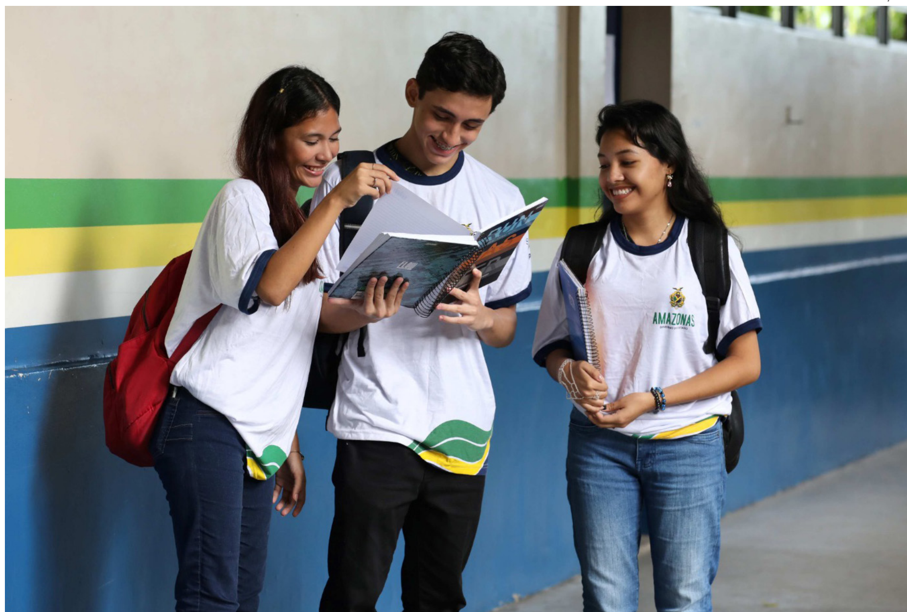
Estudantes do ensino regular e da Educação de Jovens e Adultos (EJA)

O pagamento das duas parcelas para estudantes que