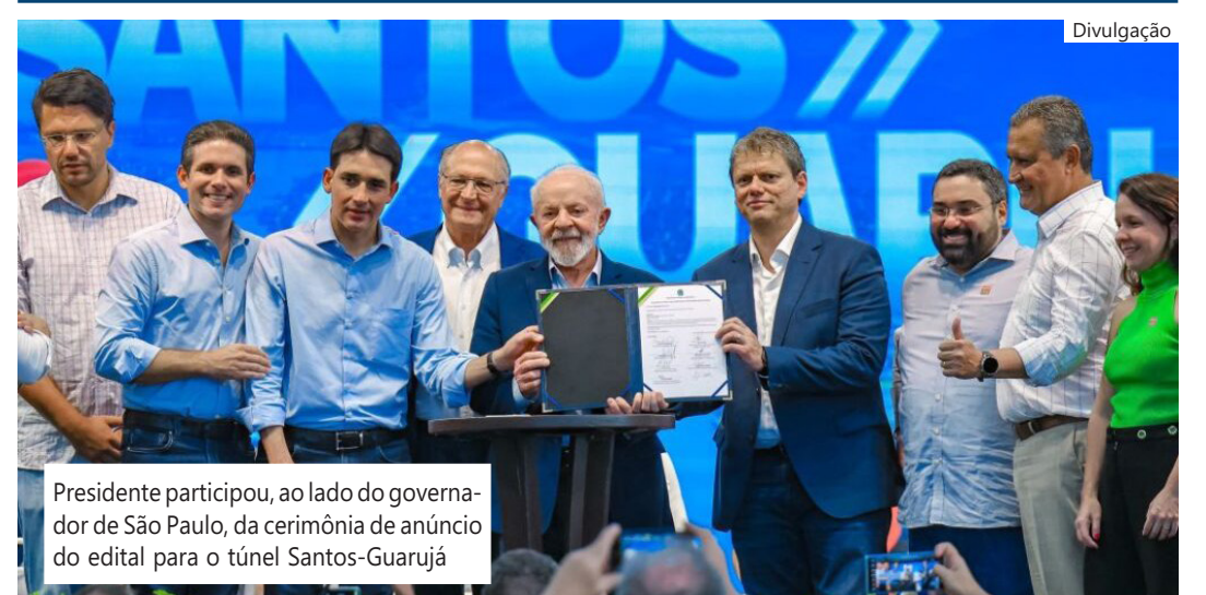
Presidente participou, ao lado do governador de São Paulo, da cerimônia de anúncio do edital para o túnel Santos-Guarujá