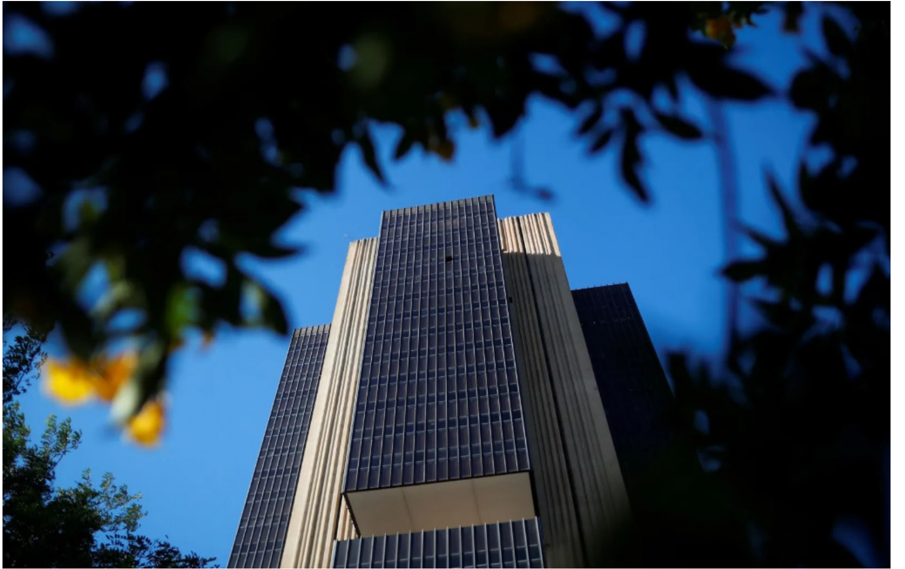
Sede do Banco Central, em Brasília

Já em 2022, houve um prejuízo de R$ 298,5 bilhões na autoridade monetária.