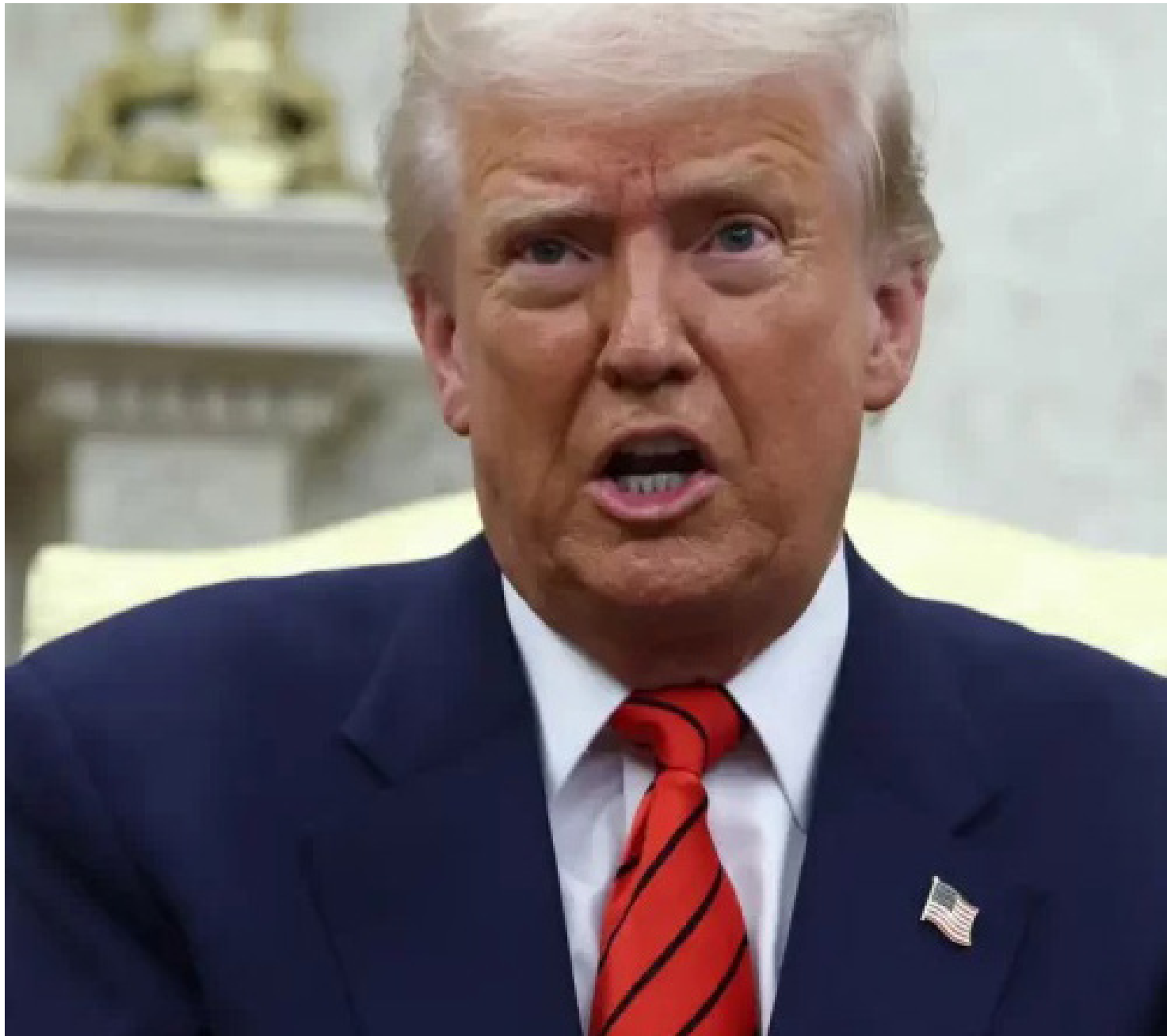
Presidente norte-americano, Donald Trump

A ordem do republicano é que suas forças empregariam