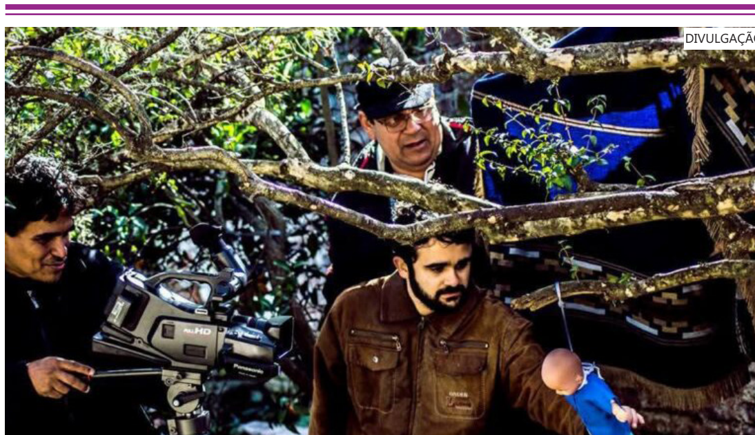
Evento reúne seis obras audiovisuais do diretor amazonense