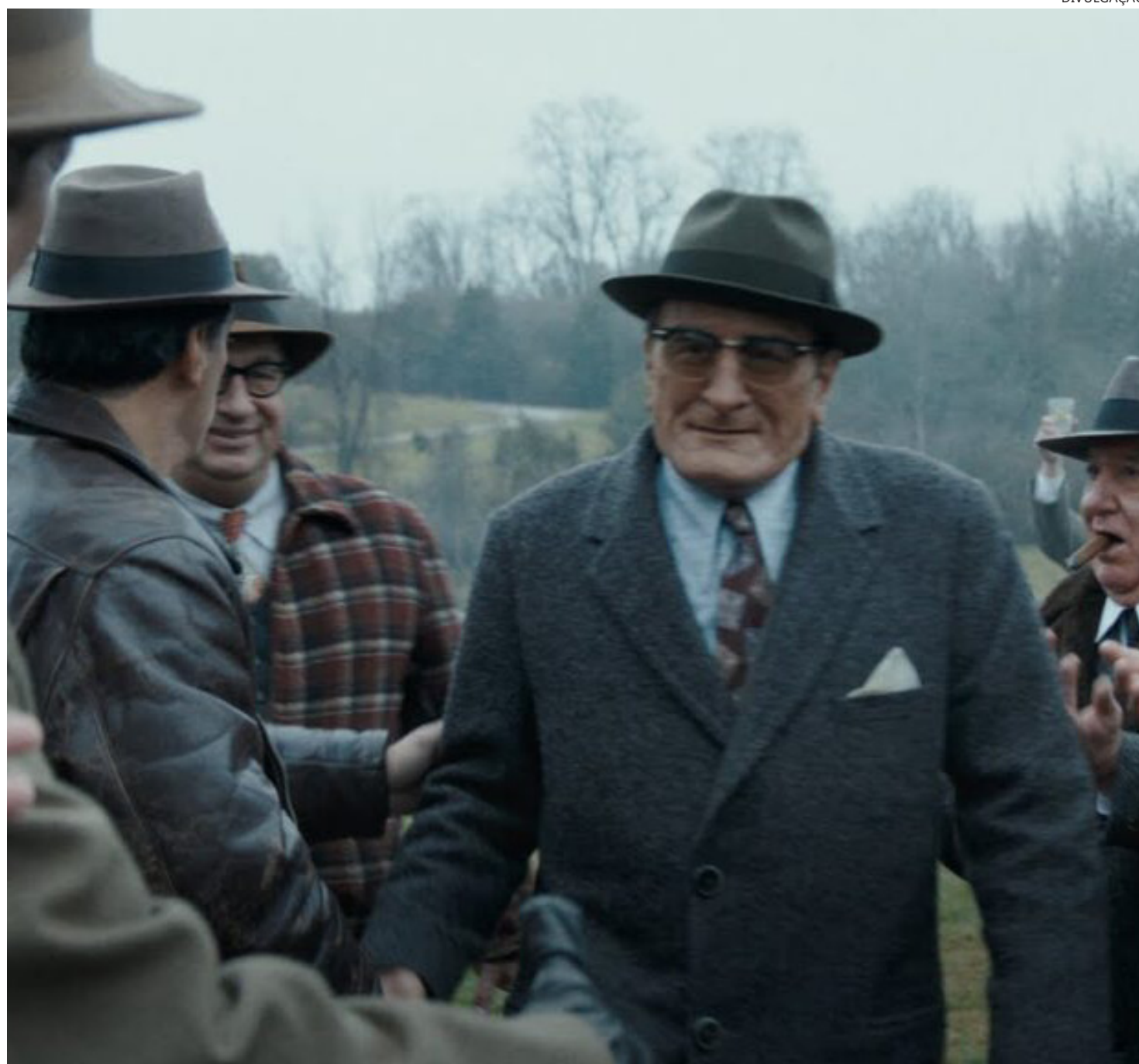
Este é um filme biográfico sobre Frank Costello e Vito Genovese, dois chefões do crime. Ambos são interpretados por Robert De Niro

Dois dos mais notórios chefes do crime organizado de Nova York, Frank Costello e Vito Genovese, outrora melhores amigos, disputam o controle das ruas. Ciúmes mesquinhos e uma série de traições os colocam numa rota de colisão fatal que transformará a máfia (e a América)