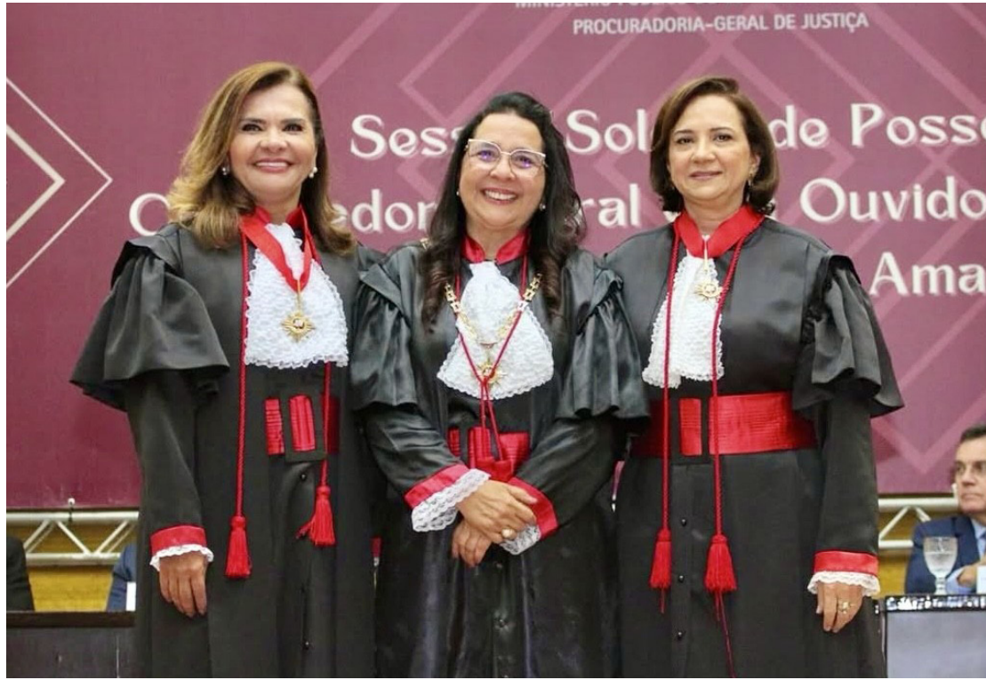
A ouvidora-geral Silvia Tuma, a procuradora geral Leda Mara Albuquerque e a corregedora geral Silvana Nobre, na cerimônia de posse que contou com a presença de autoridades, no no auditório do Ministério Público do Amazonas

. Em janeiro, foram licenciados 67,3 mil metros quadrados e, em fevereiro, mais 111,5 mil metros quadrados. Em fevereiro de 2025, o incremento recorde comparando com 2024 é de 1.118%.