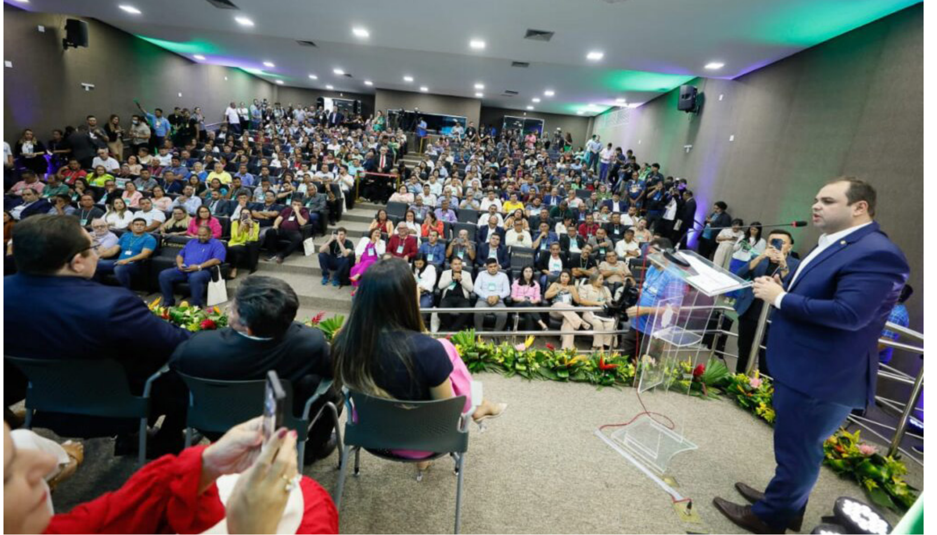
5ª edição do Fórum Estadual das Casas Legislativas do Amazonas (Feclam 2025)

A 2ª edição, realizada em 2022, trouxe um marco importante: o fórum foi oficialmente incorporado