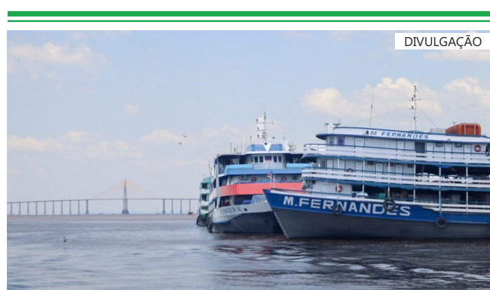
Lei traz novas regras para credenciamento de operadoras, direitos dos passageiros e a fiscalização da Arsepam

Além disso, a Lei reforça que o Estado do Amazonas tem a exclusividade sobre a exploração desse serviço, obrigando as operadoras a cumprirem os padrões de qualidade e tarifas justas.