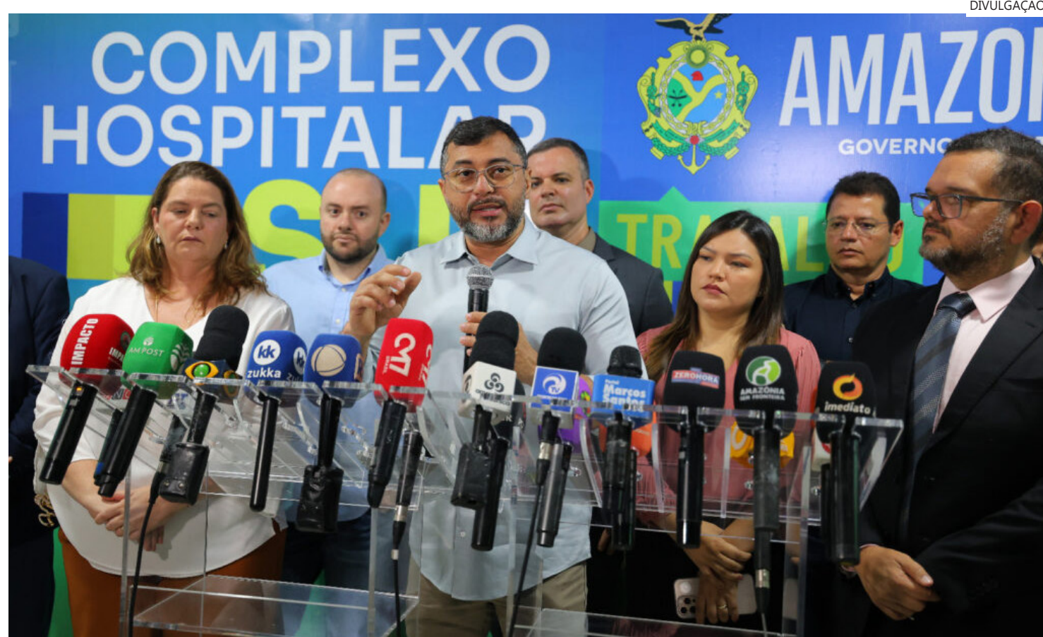
Complexo Hospitalar Sul (CHS), composto pelo Hospital e Pronto-Socorro (HPS) 28 de Agosto e o Instituto da Mulher Dona Lindu

O cronograma apresentado pelo governador Wilson Lima prevê ações para os próximos 90 dias a um ano, em que o padrão da qualidade dos serviços oferecidos nas unidades será o mesmo que hoje é ofertado no Hospital Delphina Aziz.