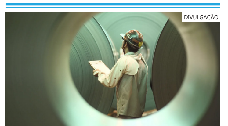
Brasil é a "China da América Latina"

Apesar da capacidade ociosa, a associação afirma que as siderúrgicas brasileiras anunciaram recentemente um plano de R$ 100 bilhões para expandir sua produção.