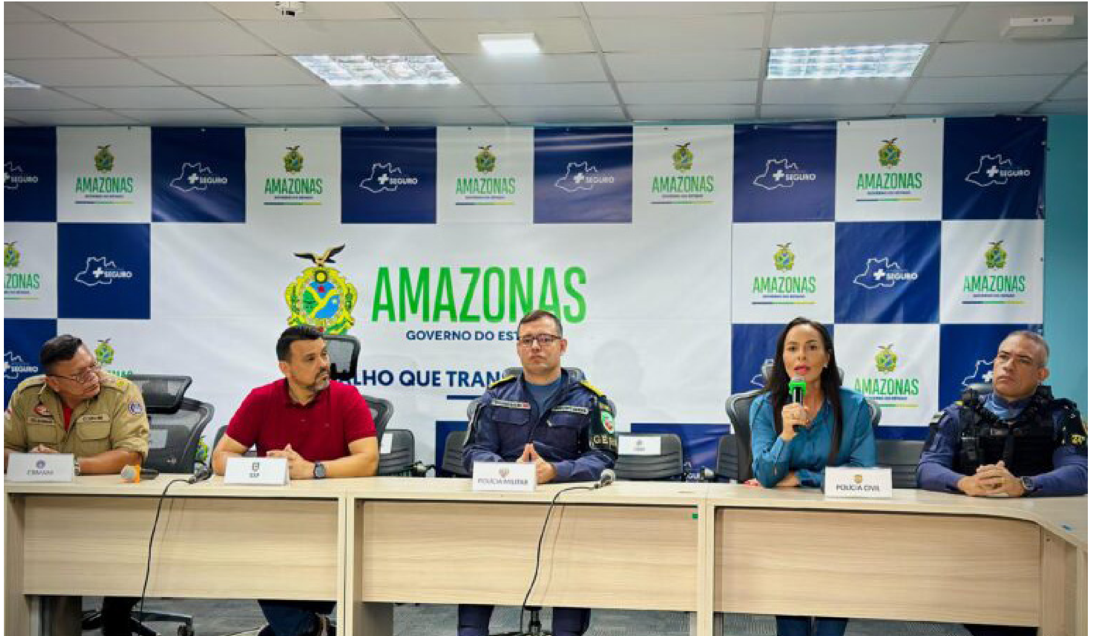
O homem responderá por estupro de vulnerável

As investigações vão continuar para apurar outros possíveis crimes cometidos pelo autor