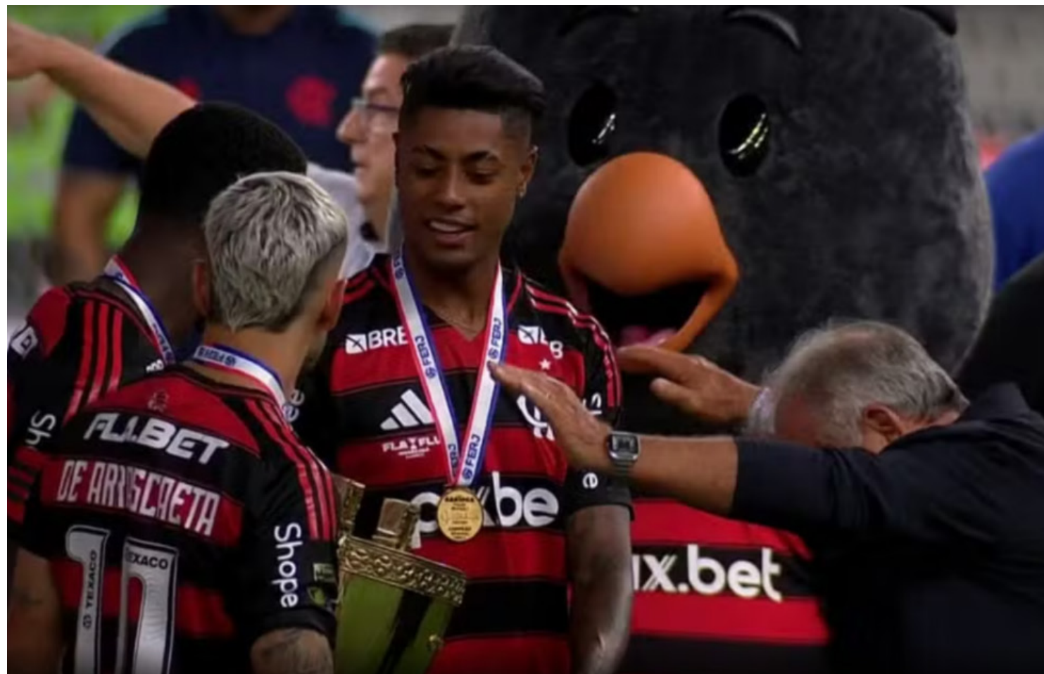
Zico reverenciando os jogadores do Flamengo

Obviamente, o Fluminense, em desvantagem, não entrou