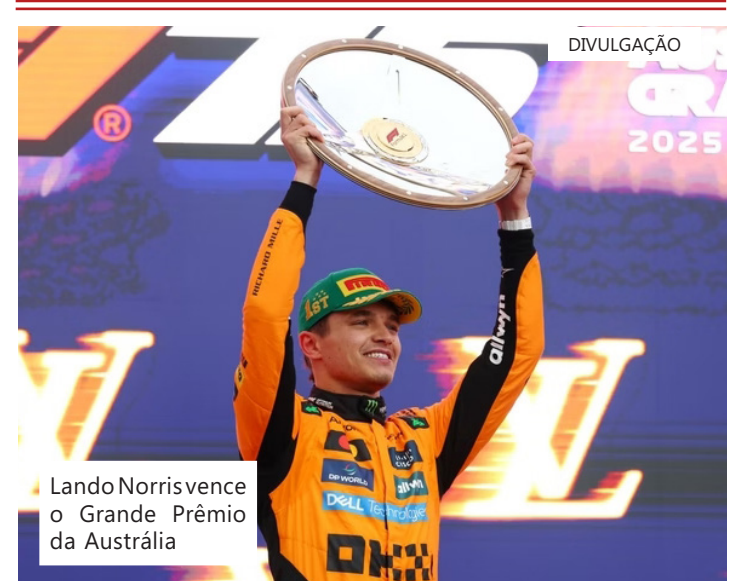
Lando Norris vence o Grande Prêmio da Austrália

Quando a pista foi liberada, Norris segurou Verstappen enquanto Piastri continuava atrás do holandês.