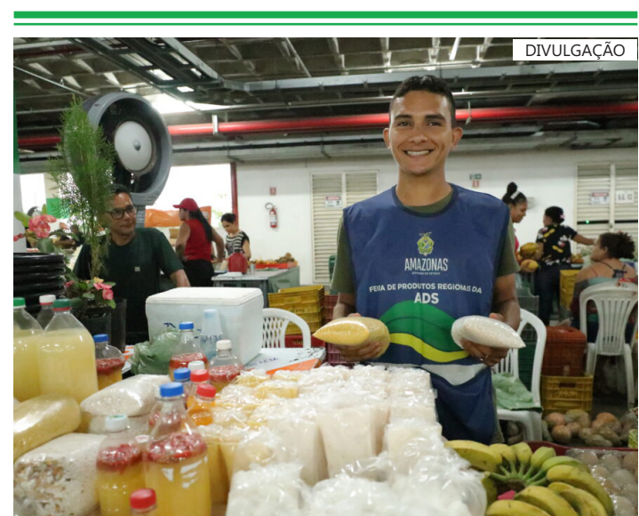
A programação segue de terça a quinta-feira, além do fim de semana

PARA AGENDA COMPLETA ACESSE NOSSO PORTAL: VANGUARDADONORTE.COM.BR