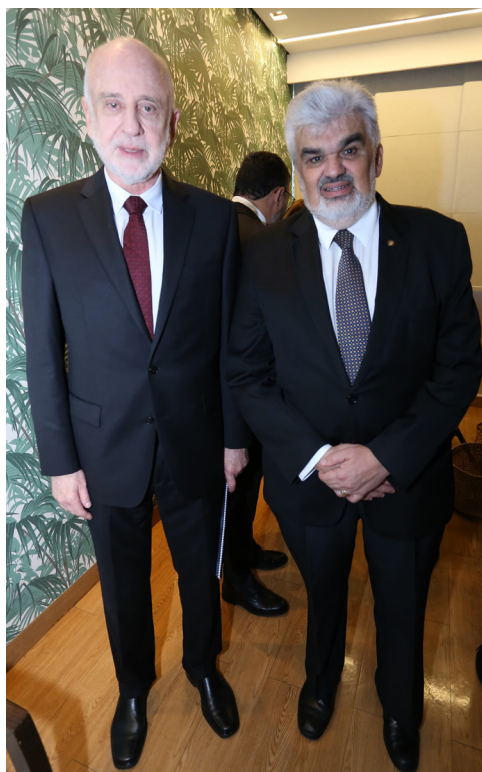
O ministro do TCU, Benjamin Zymler e conselheiro Julio Pinheiro