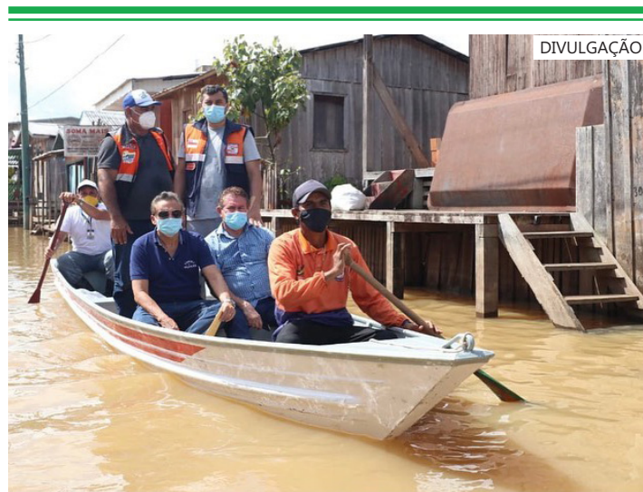
A proposta visa criar mecanismos legais para que municípios reconhecidos em estado de calamidade pública

A proposta visa criar mecanismos legais para que municípios reconhecidos em estado de calamidade pública possam contar com