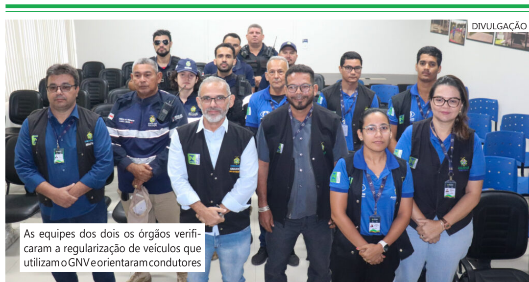
As equipes dos dois órgãos verificaram a regularização de veículos que utilizam o GNV e orientaram condutores

Na manhã desta terça-feira (08/04), o Departamento Estadual de Trânsito do Amazonas (Detran-AM) e o Instituto de Pesos e Medidas (Ipem-AM) promoveram uma ação conjunta de fiscalização de veículos que utilizam o Gás Natural Veicular (GNV). A ação de fiscalização ocorreu na avenida Rodrigo Otávio, bairro Distrito Industrial I, zona sul da capital.