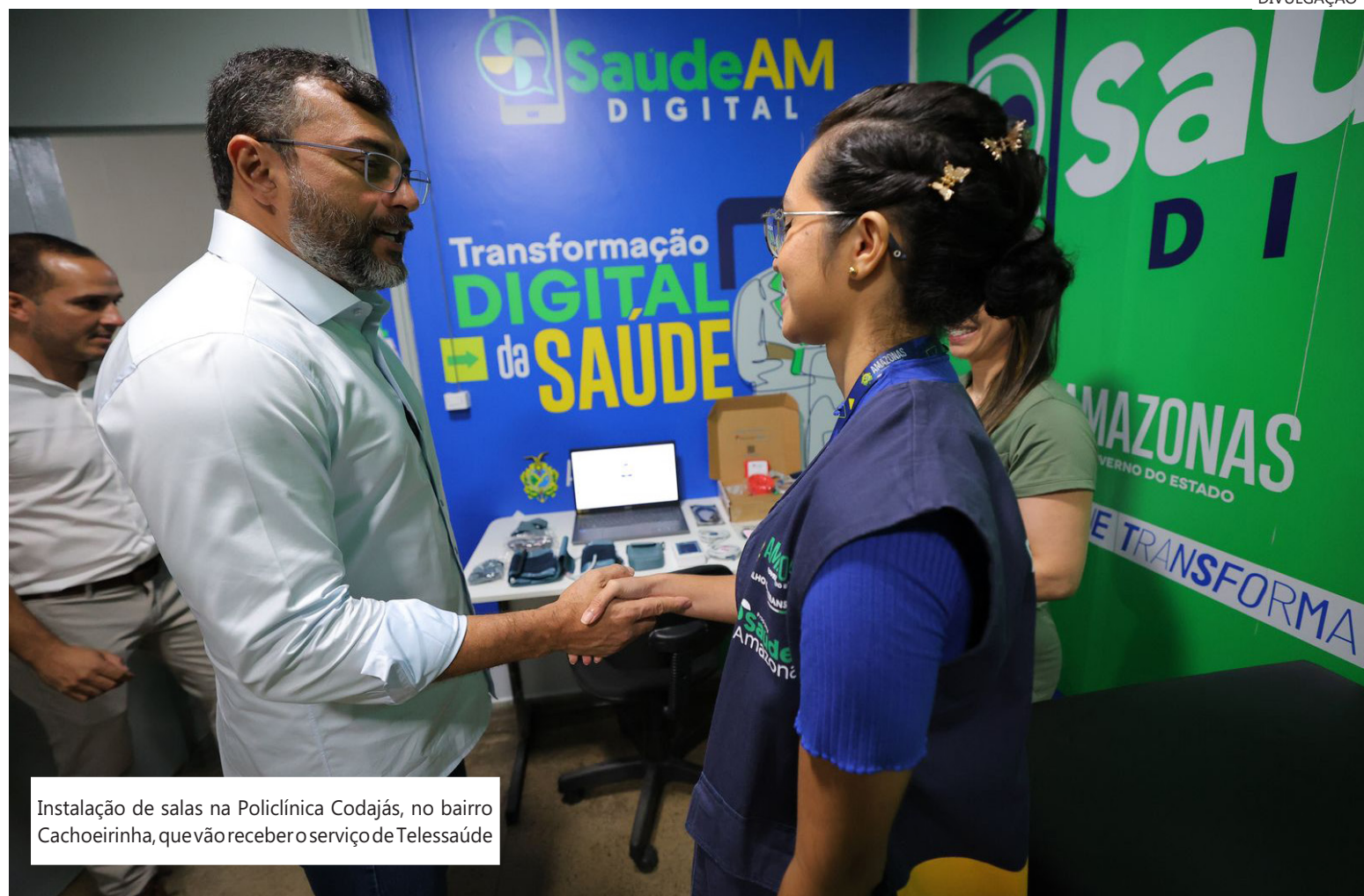
Instalação de salas na Policlínica Codajás, no bairro Cachoeirinha, que vão receber o serviço de Telessaúde

Com o novo serviço, o paciente que optar por realizar a sua consulta ou exame de forma virtual, poderá realizar os atendimentos em uma das salas que serão instaladas em policlínicas e em Centros de Atenção Integral de Crianças e Adolescentes (CAICs) da rede estadual, ou por meio de seu próprio celular ou computador conectado à internet.