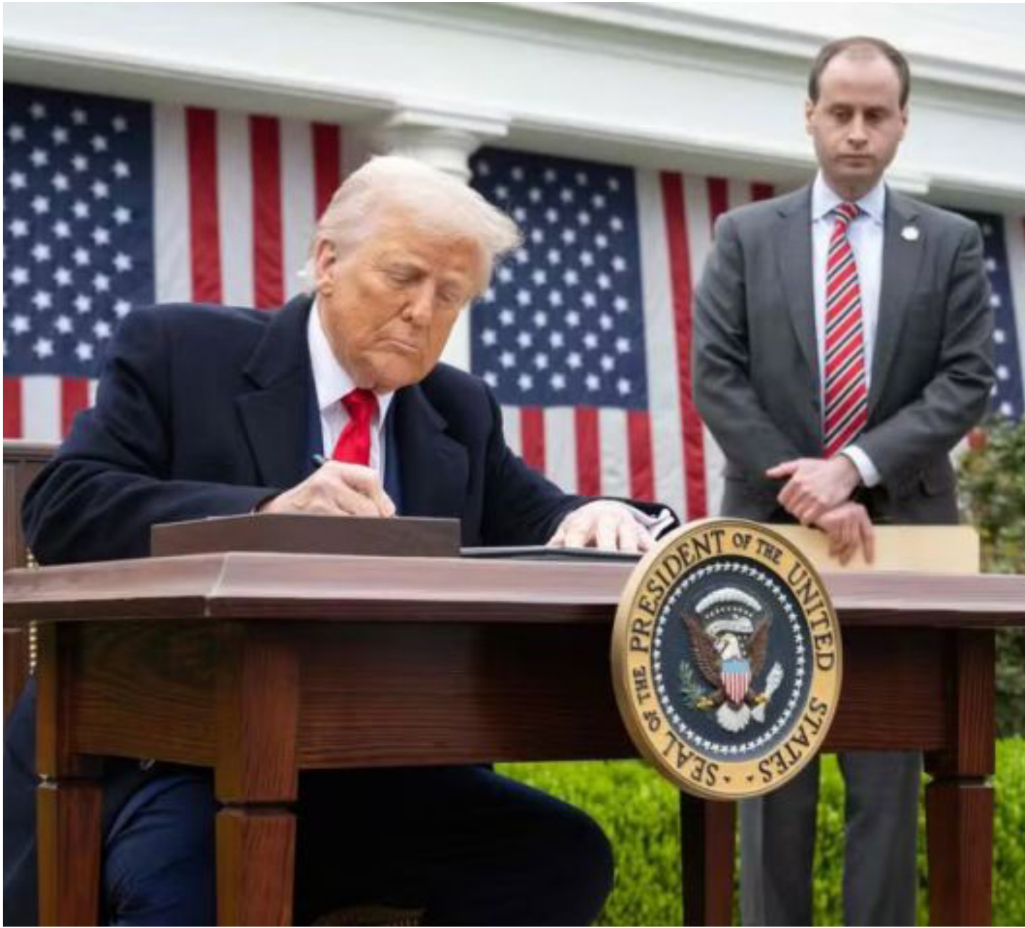
Presidente dos EUA, Donald Trump

As tarifas da China já estavam previstas para aumentar em 34% na quarta-feira, como parte do pacote de tarifas "recíprocas" de Trump. Mas o presidente acrescentou mais 50% depois que Pequim não recuou em sua promessa de impor tarifas retaliatórias de 34% sobre os produtos americanos até o meio-dia de terça-feira.