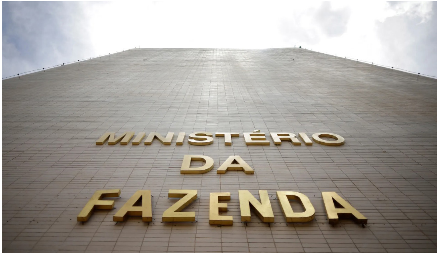
Fachada do prédio do Ministério da Fazenda em Brasília • 14/02/2023

Entre as medidas com maior relevância citadas estão a Reforma Tributária, aprovada e sancionada no ano passado ainda sob a gestão de Lira, o pacote de medidas fiscais, do fim do ano passado e o