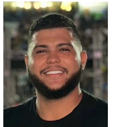
As denúncias podem ser realizadas pelos números (92) 3667-7734 ou 3667-7733, da DECCM Centro-Sul, ou pelo 181