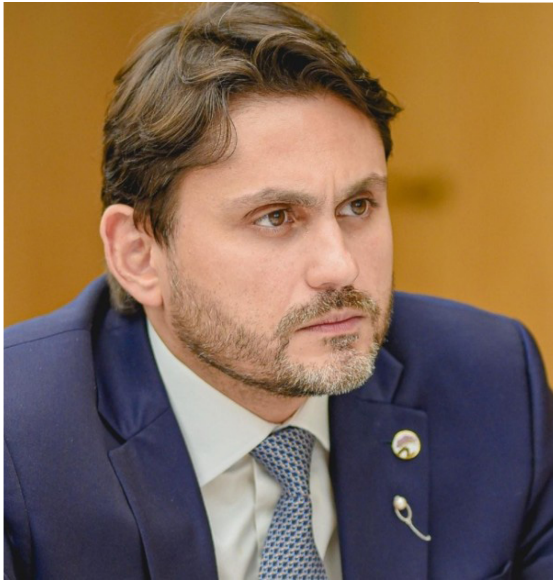
Ministro das Comunicações, Juscelino Filho

De acordo com as investigações, quando era deputado federal, Juscelino teria direcionado recursos para Vitorino Freire (MA), cidade na qual sua irmã era prefeita. Há ainda suspeitas de que ele tenha recebido propina por meio de empresas de fachada.