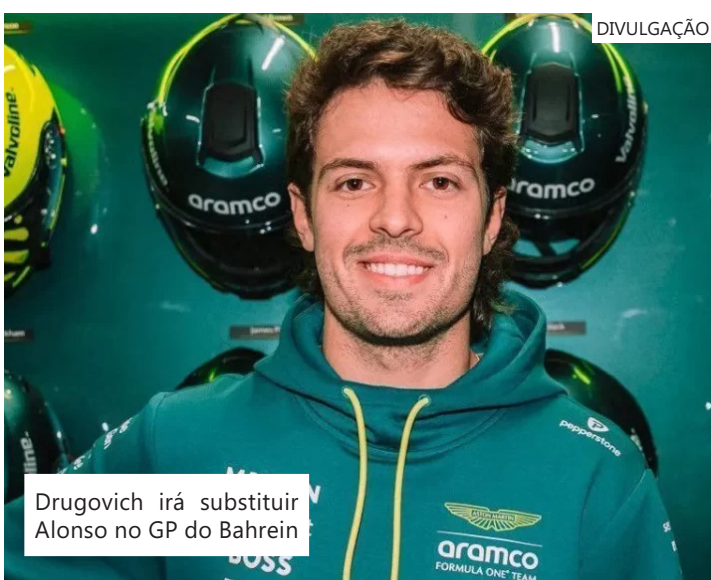
Drugovich irá substituir Alonso no GP do Bahrein

O brasileiro também irá disputar as 24 Horas de Le Mans, pela Cadillac, em junho.