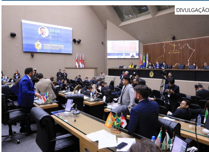
Debate durante a Sessão Plenária desta terça-feira (8/4)

A melhoria da estrada AM-010, a melhoria nos serviços de internet, energia elétrica e logística também foram apontados pelo deputado como essenciais para o desenvolvimento da região.