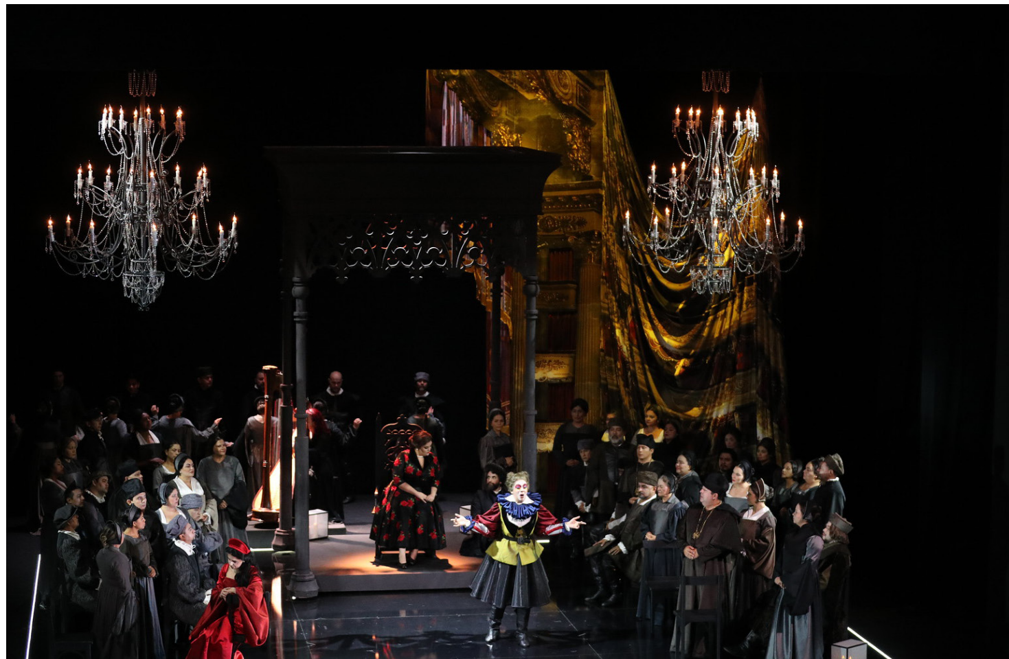
Festival Amazonas de Ópera no Teatro Amazonas

A abertura será no dia 15 de abril, às 19h, com "La Voragine", uma ópera contemporânea baseada em um romance histórico colombiano, ambientado no ciclo da borracha. Os personagens saem da Colômbia com destino à capital amazônica, que vivia seu apogeu econômico devido à exploração do látex. A obra é