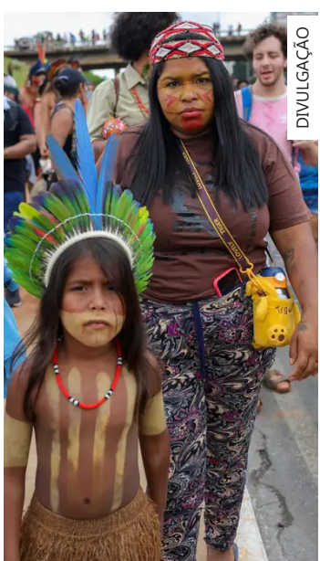
Demarcação das terras e saúde e educação fortalecidas são as demandas