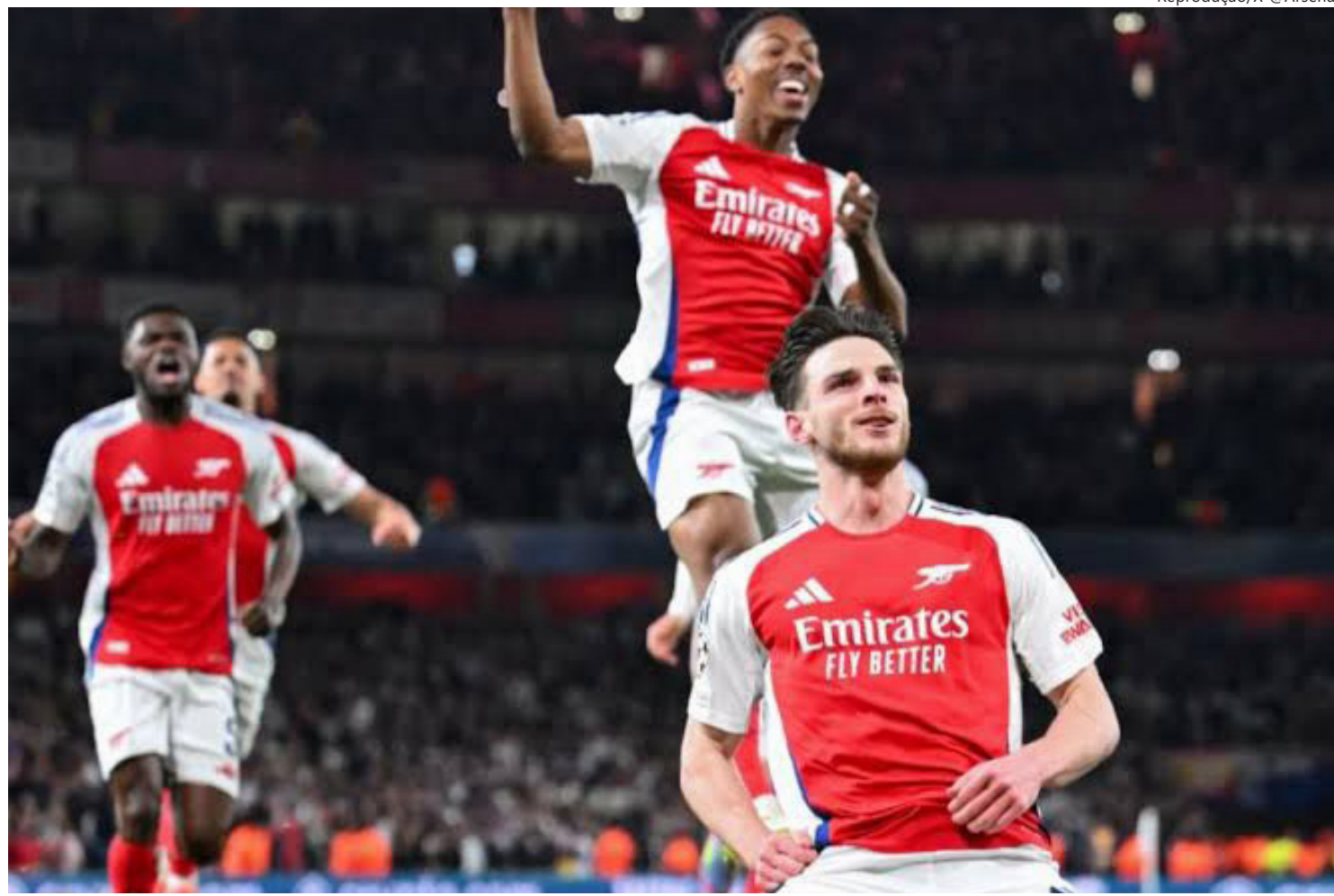
Jogadores do Arsenal comemoram gol de Rice contra o Real Madrid

Em um primeiro tempo amarrado no meio, mas com muita movimentação, as