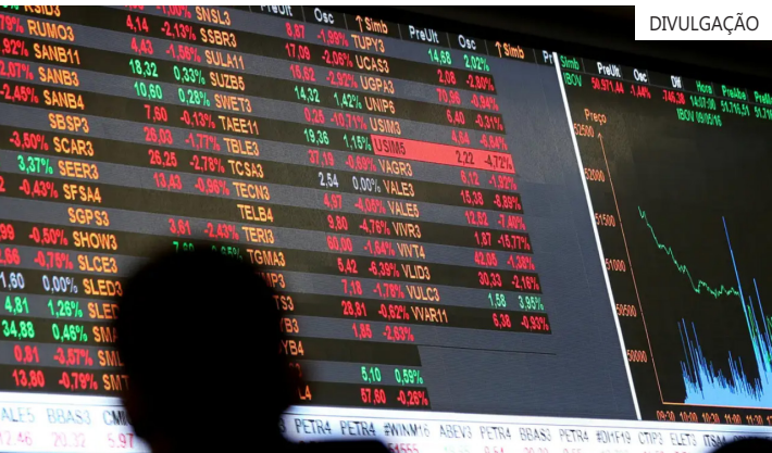
Disputa presidencial no Brasil em 2026 entra cada vez mais no radar de investidores na bolsa paulista