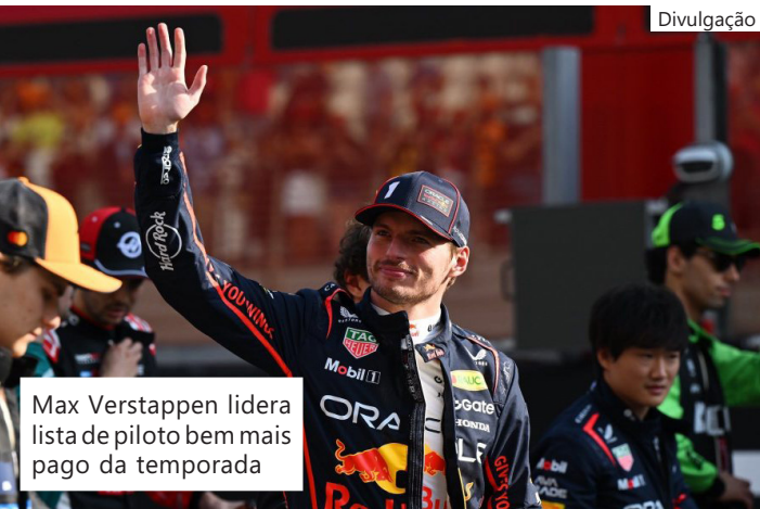
Max Verstappen lidera lista de piloto mais bem pago da temporada

va da publicação especializada em finanças - os valores reais são conhecidos apenas por equipes e pilotos -, os dez nomes do ranking somaram um total de US$ 363 milhões (cerca de R$ 1,9 bilhão), contando com salários e bônus. Além disso, o valor teve um aumento de 15% em comparação ao ano de 2024, o que demonstra a força da Fórmula 1 como uma indústria bilionária e que tem alcançado recordes financeiros a cada temporada, com um aumento que tem refletido diretamente nas equipes e no salário dos pilotos.