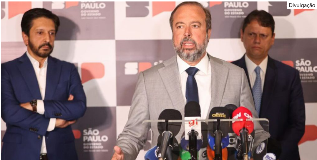
Decisão foi anunciada em coletiva de Ricardo Nunes, Tarcísio de Freitas e Alexandre Silveira

dual e da Prefeitura de São Paulo, intensificada após apagões recentes provocados por fortes ventos. Na quarta-feira passada (10), rajadas acima de 90 km/h deixaram cerca de 2,2 milhões de pessoas sem energia em todo o estado. De acordo com Nunes, ainda na noite de segunda-feira (15) havia “quase 50 mil domicílios sem energia”. “A população não aguenta mais e está sofrendo”, disse. “Agora é que a Aneel possa, com celeridade, cumprir sua função de declarar a caducidade. A partir daí, entra o processo de substituição por uma empresa que tenha condições de atender São Paulo”, concluiu o prefeito.