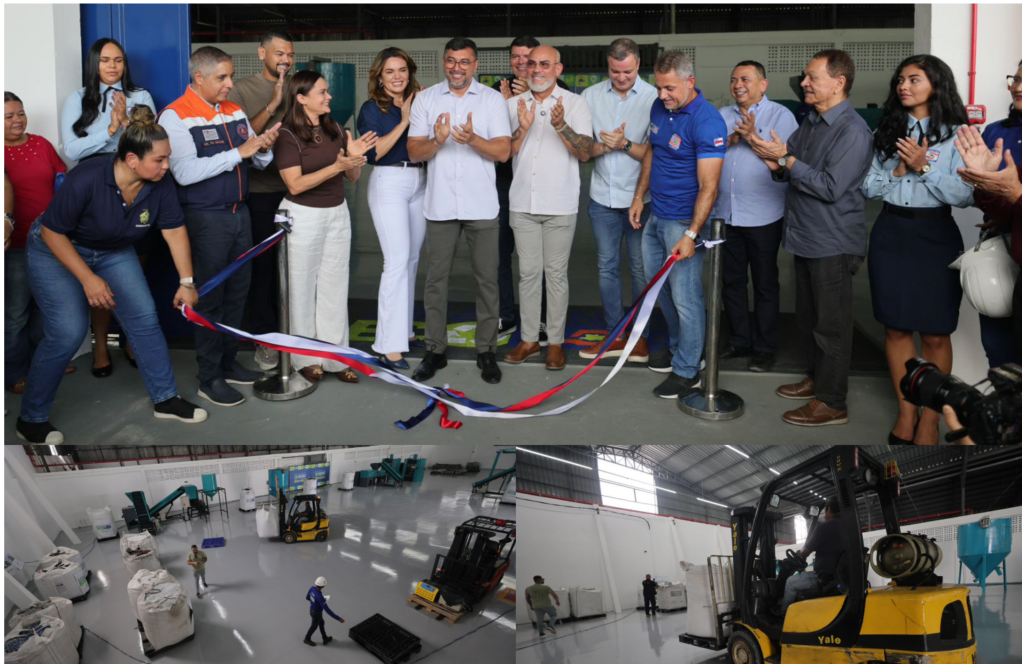
Inauguração do Centro de Reciclagem do Amazonas

“O que nós estamos trazendo aqui não é apenas uma estrutura. É uma solução. Uma ideia que cuida das pessoas, protege o meio ambiente e pode ser replicada em outros estados. Estamos mostrando que é possível enfrentar dois grandes desafios ao mesmo tempo: a habitação e a destinação correta dos resíduos (plásticos)”, destacou Wilson Lima.