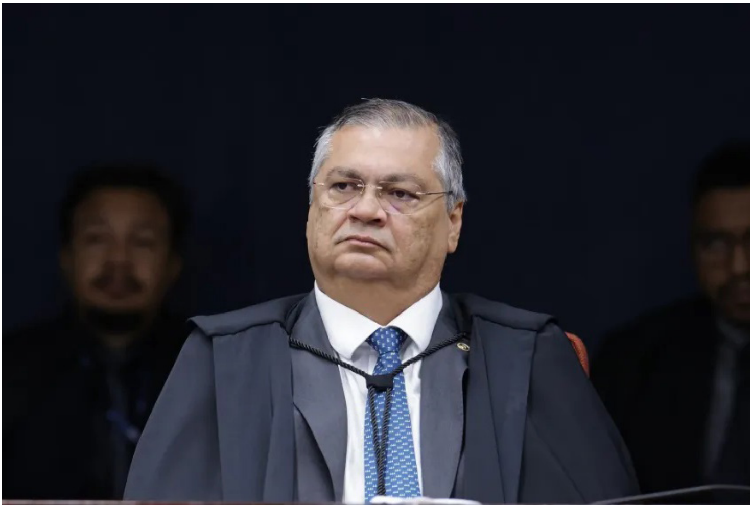
Ministro Flávio Dino, do STF