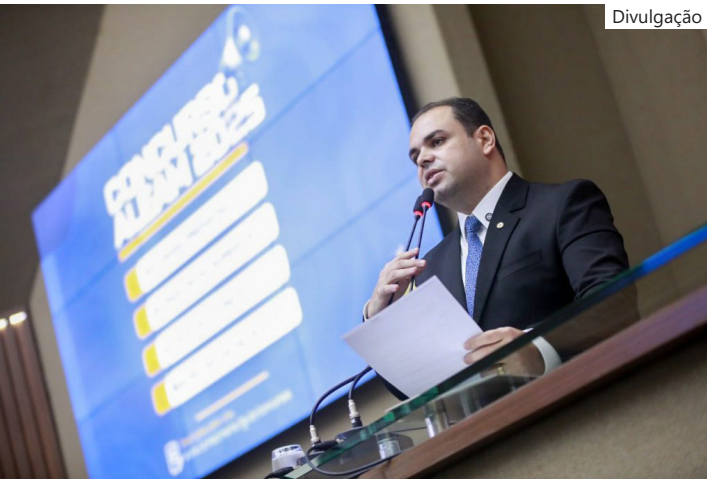
Assembleia Legislativa do Amazonas (Aleam)

que concorreu ao cargo de fotógrafo (nível médio), disse estar confiante após conferir o gabarito preliminar. “Já estou conferindo o gabarito no site da FGV. Fiz a prova para fotógrafo e as expectativas são as melhores. Pela análise que fiz até agora, estou me saindo bem e tenho boas chances de assumir uma vaga futuramente”, destacou. Cronograma do concurso 16/12/2025 - Divulgação do gabarito preliminar 17 e 18/12/2025 - Período para interposição de recursos 22/1/2026 - Divulgação do gabarito definitivo e do resultado preliminar 5/2/2026 - Resultado definitivo e convocação para provas práticas/discursivas 1/3/2026 - Aplicação da prova discursiva