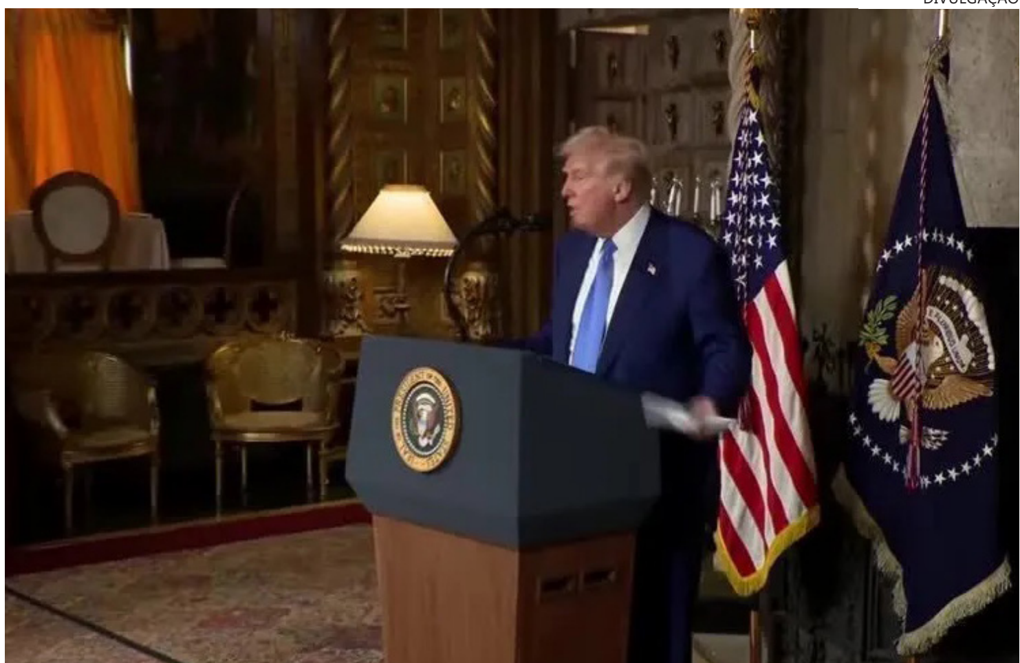
Presidente dos EUA, Donald Trump

O governo Trump tem mobilizado tropas e atacado barcos que supostamente transportavam drogas no Caribe e no Pacífico sob a justificativa de combater os cartéis. Mas a ditadura de Nicolás Maduro afirma que o real objetivo americano é promover a mudança de regime na Venezuela.