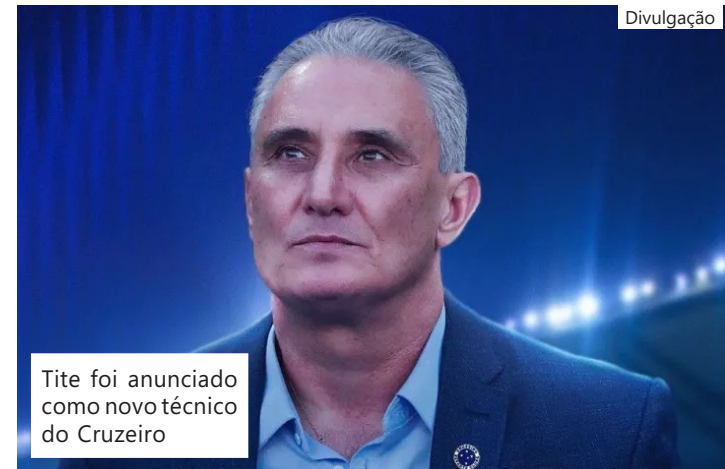
Tite foi anunciado como novo técnico do Cruzeiro

-RS, Ypiranga-RS, Juventude, Grêmio-RS, São Caetano, Corinthians, Atlético, Palmeiras, Al Ain-EAU, Internacional, Al-Wahda-EAU, Corinthians, Seleção Brasileira e Flamengo. Os principais títulos vieram sob o comando do Corinthians. Na equipe paulista conquistou o Brasileirão (2011 e 2015), Copa Libertadores (2012), Mundial de Clubes da Fifa (2012), Recopa Sul-Americana (2013) e Paulistão (2013). No Sul, também foi vitorioso. Conquistou um Gauchão e uma Copa do Brasil pelo Grêmio, em 2001. tda pré-temporada no início de janeiro.