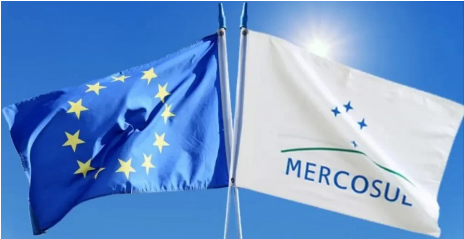
Votação ocorre um dia depois que a França se uniu à Itália para pressionar pelo adiamento da votação do acordo

Deputados europeus e Estados-membros correm para finalizar o acordo com o bloco do Mercosul – Argentina, Brasil, Uruguai e Paraguai – antes de uma possível cerimônia de assinatura no próximo sábado,