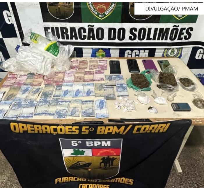
Equipe policial chegou até o grupo após denúncia anônima

policiais militares apreenderam cinco porções de maconha, uma porção de cocaína e dinheiro em espécie. Diante do flagrante, o homem também foi preso.