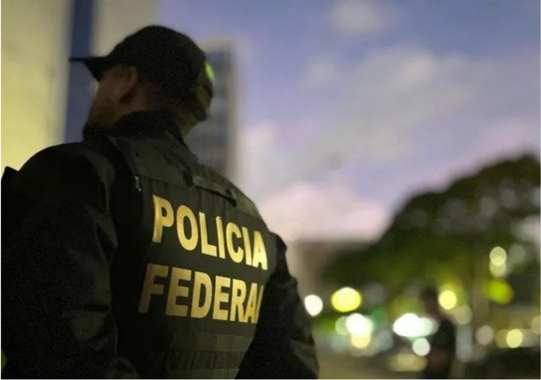
Representação foi enviada no âmbito de investigação sobre vazamento de informações sigilosas em operação