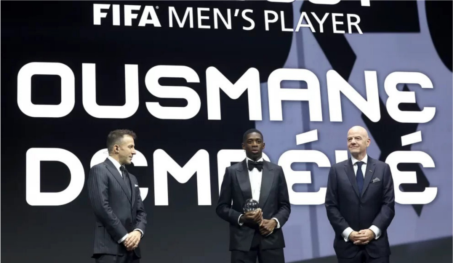
Seleção com as melhores jogadoras do mundo no futebol feminino em 2025

Dembélé pode enfrentar o Flamengo na quarta (17) Segundo francês a vencer o The Best, depois de Zinedine Zidane, o atacante viajou