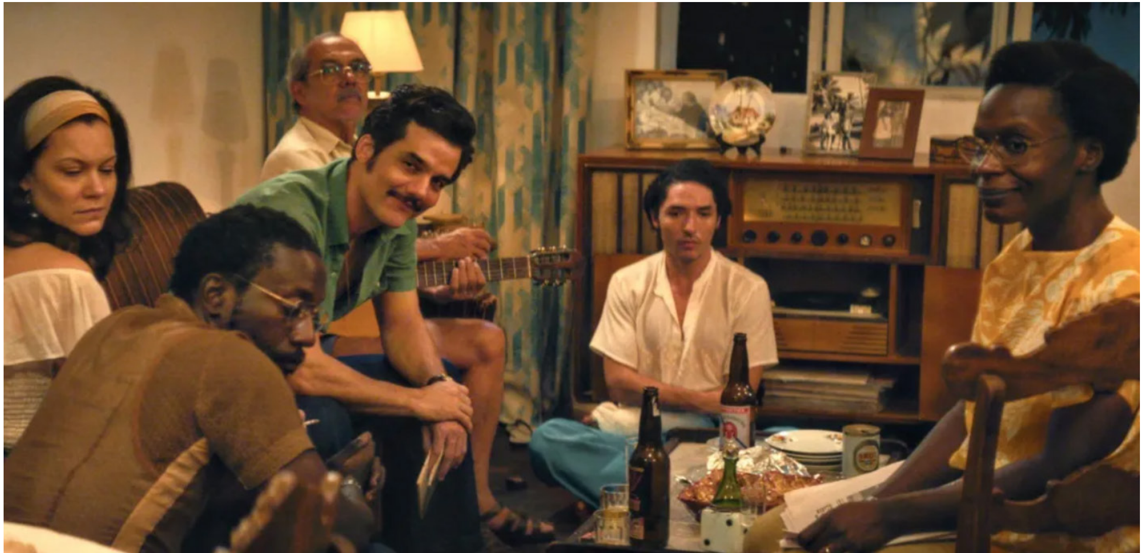
O filme marca o retorno de Wagner Moura ao cinema brasileiro

Lista oficial de indicados à premiação será divulgada em 22 de janeiro de 2026; filme brasileiro de Kleber Mendonça Filho foi pré-indicado em duas categorias