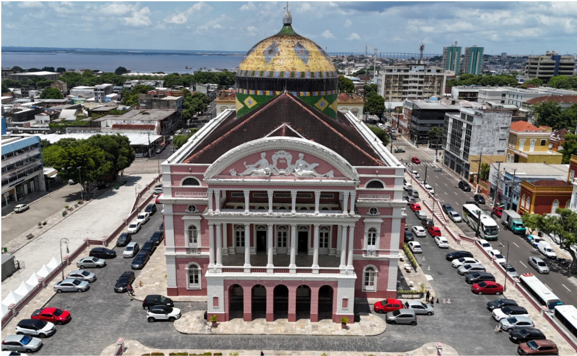
A capital amazonense mantém 6ª posição no ranking nacional de PIB municipal e lidera economia regional em 2023

De acordo com o assessor econômico da Sedecti, Alcides Saggiaro, o crescimento do PIB se deve às atividades do Polo Industrial de Ma-