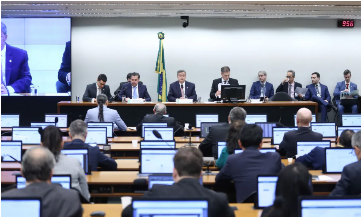
Peça orçamentária prevê superávit de R$ 34,5 bilhões no próximo ano; projeto vai à sanção presidencial

Para o ano que vem, a meta fiscal prevê superávit de 0,25% do PIB (Produto Interno Bruto), ou seja, de R$ 34,3 bilhões. O