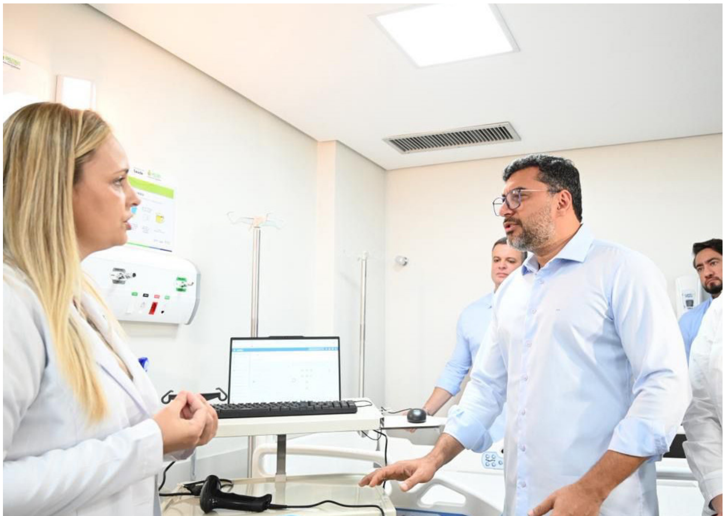
Segunda Unidade de Internação do Hospital e Pronto-Socorro (HPS) 28 de Agosto, no Complexo Hospitalar Sul

O governador ressaltou, ainda, que a transformação digital já alcança outras áreas do complexo. “Tem alguns sistemas