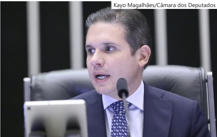
Presidente da Câmara, deputado Hugo Motta (Republicanos-PB)

Poder Judiciário”, disse. Para Hugo Motta, cabe à presidência da Câmara acompanhar eventuais “exacerbações” e atuar com diálogo, que classificou como o “melhor caminho”. Na visão dele, eventuais “exageros” dos Poderes não são positivos para o país. “Acho que essa linha precisa ser estabelecida. Porque, quando há exagero, seja do Supremo, seja do próprio Poder Legislativo, em qualquer ponto da relação, isso é ruim para o país. Repito, nós respeitamos o papel do Supremo, não temos compromisso com quem não trabalha correto. E vamos sempre acompanhar na presidência da Câmara para que exageros não sejam cometidos”, declarou.