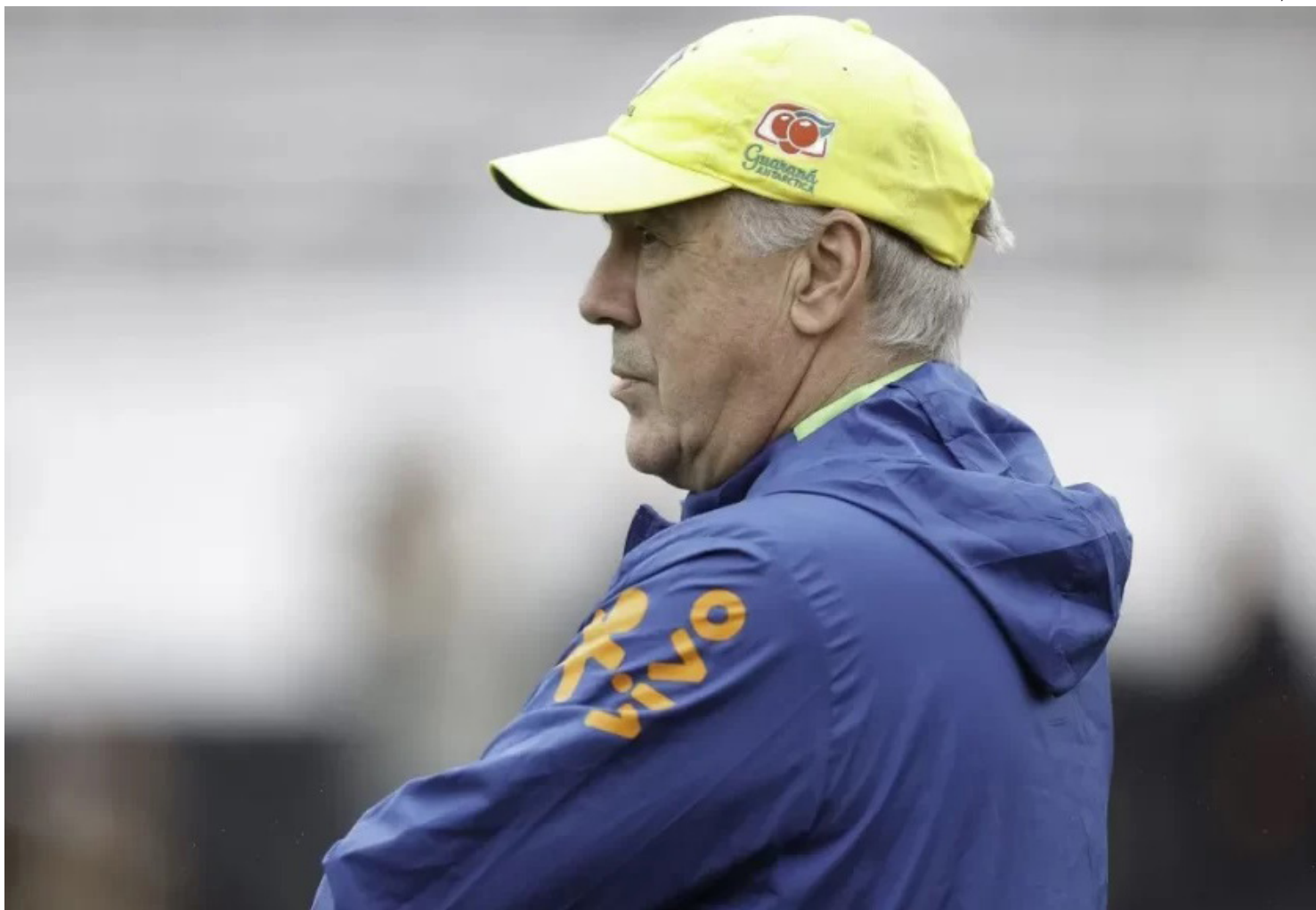
Carlo Ancelotti comanda treino da Seleção Brasileira

A Confederação Brasileira de Futebol anunciou, nesta sexta-feira (19), detalhes dos amistosos da Seleção contra França e Croácia. As partidas serão disputadas nos Estados Unidos, na primeira Data FIFA de 2026, e servirão como preparação para a Copa do Mundo. O Brasil enfrentará a França no dia 26 de março, no Gillette Stadium, em Boston. Já o segundo jogo, contra a Seleção Croata, será dia 31 de março, no Camping World Stadium, em Orlando. Os horários e informações de venda de ingressos para as partidas serão divulgados em janeiro. A delegação da CBF ficará instalada em Orlando, na Flórida. A Seleção se hospedará e treinará no complexo ESPN Wide World of Sports, no Walt