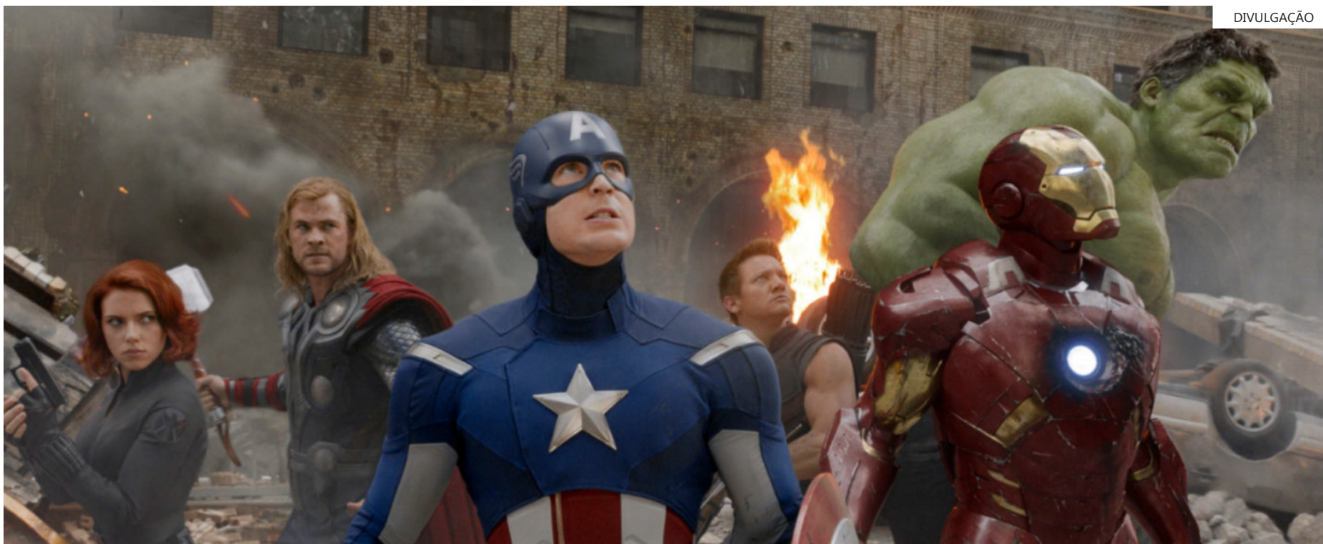
“Vingadores” é a maior franquia da Marvel Comics

Os fãs da sequência não perderam um segundo sequer com a postagem, o que gerou 2,4 milhões de reproduções, 263 mil curtidas e 2600 comentários no X (antigo Twitter) em cinco horas, fazendo o nome do filme entrar nos assuntos mais comentados do momento.