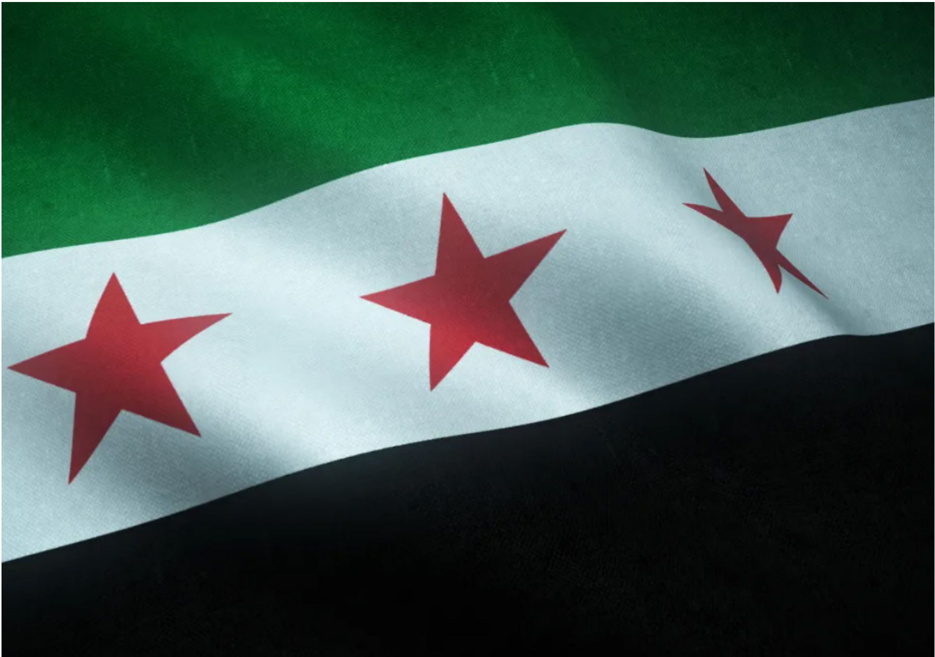
Grupo terrorista não reivindicou autoria do ataque de 13 de dezembro

Posteriormente, as operações dos EUA e de seus parceiros, juntamente com uma