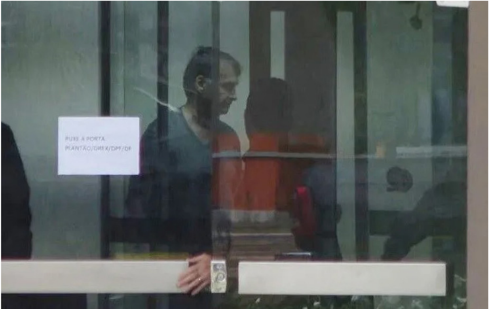
Bolsonaro na Superintendência da PF

No jargão médico, uma cirurgia eletiva é aquela que não precisa ser realizada de forma imediata para evitar risco iminente à vida ou agravamento súbito do quadro clínico do paciente. Diferentemente das cirurgias de urgência ou emergência, esse tipo de procedimento pode ser planejado com anteci-