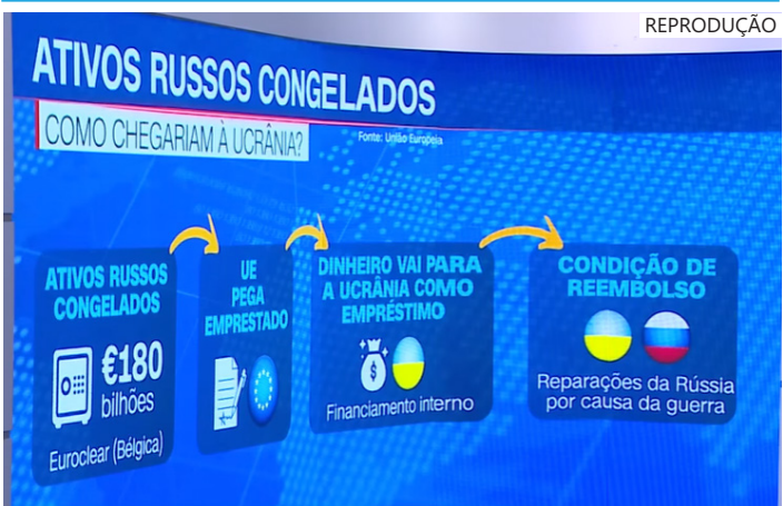
Estratégia envolve empréstimo de 90 bilhões de euros para Kiev dos 180 bilhões em ativos russos congelados

Nesse cenário, os ativos russos congelados funcionariam como uma espécie de caução, permitindo que a UE retenha permanentemente esses recursos caso a Rússia não pague as reparações de guerra.