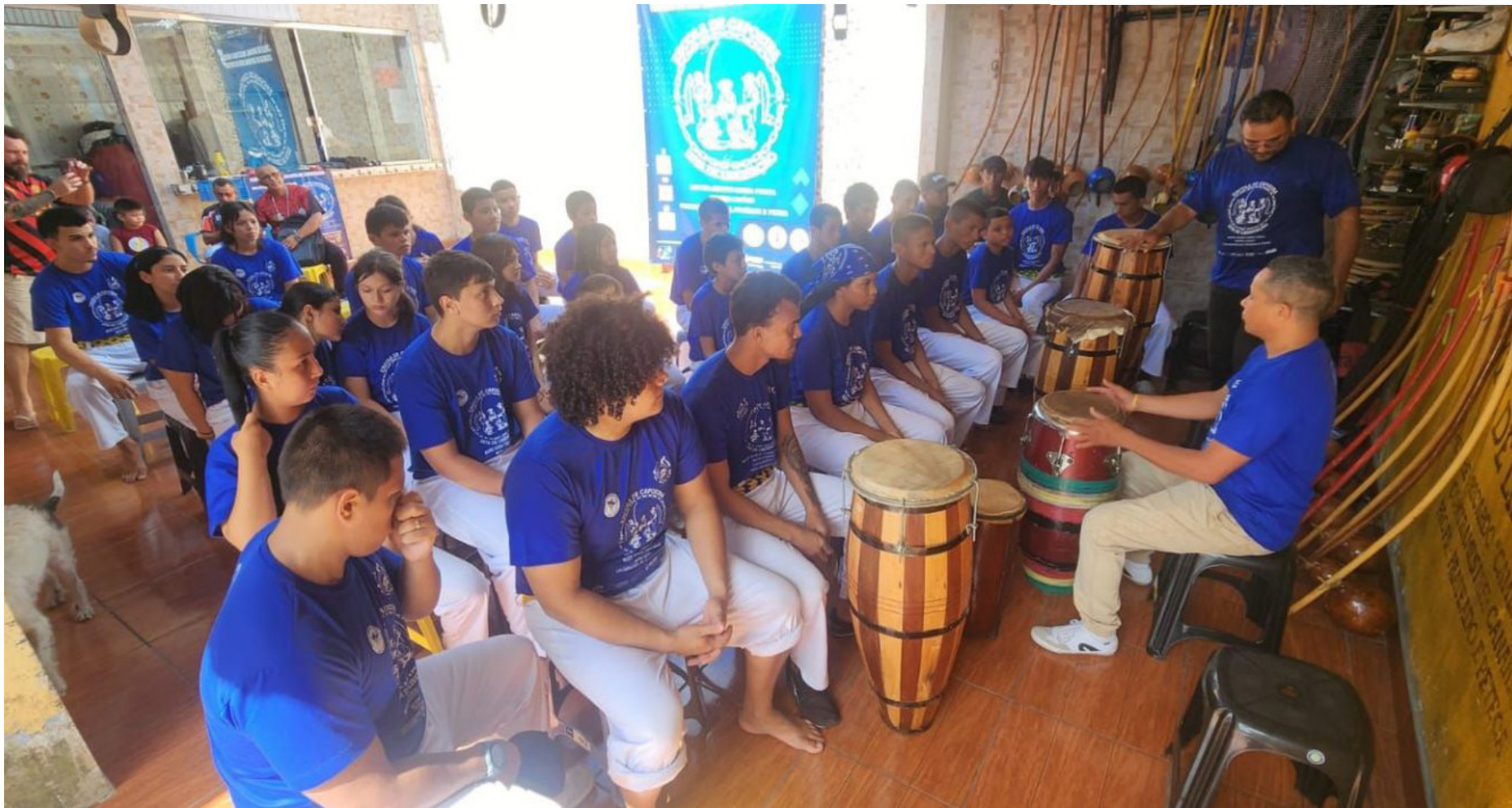
Evento gratuito reúne oficinas, graduação de alunos e apresentação cultural