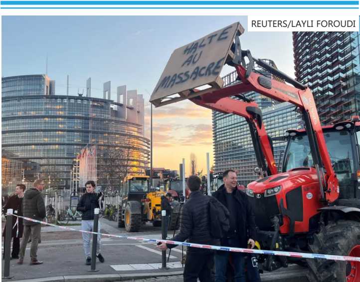
Produtores rurais estão insatisfeitos e temem perder mercado com a entrada de itens sul-americanos

A porta-voz do governo, Maud Bregeon, afirmou na rádio RTL que o governo não toleraria mais bloqueios e faria “todo o necessário” para evitá-los.