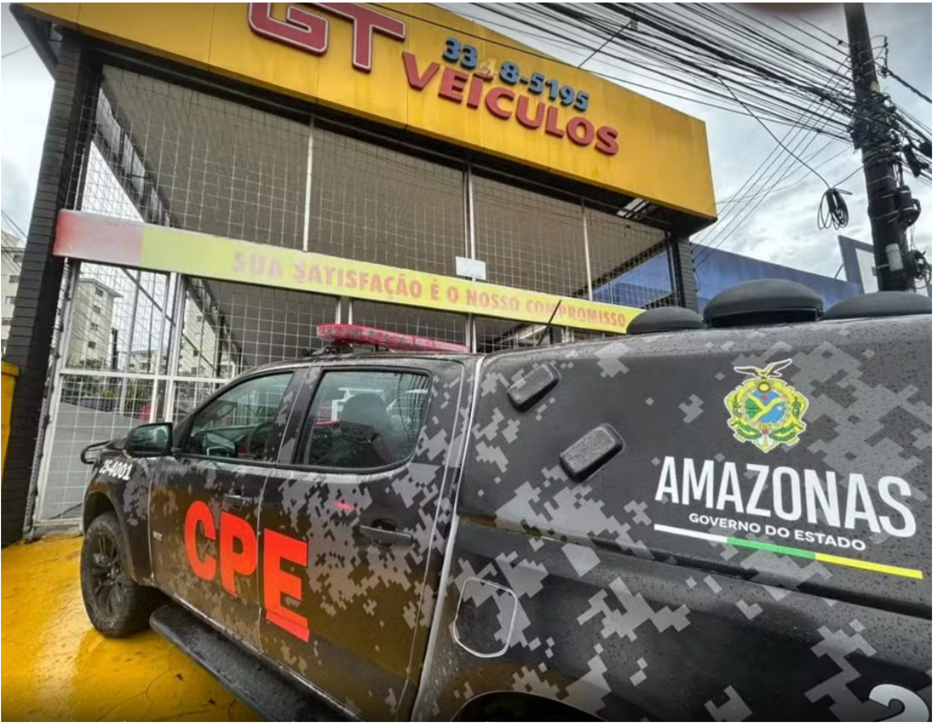
Tentativa de assalto foi registrada na manhã desta sexta-feira, na Zona Norte de Manaus

Criminosos armados invadiram uma concessionária de veículos localizada na Avenida Max Teixeira, bairro Cidade Nova, Zona Norte de Manaus, e fizeram funcionários reféns durante uma tentativa de assalto na manhã desta sexta-feira (19). Quatro suspeitos foram presos e um conseguiu fugir. Ninguém ficou ferido. Segundo a polícia, uma equipe realizava patrulhamento na região quando percebeu a movimentação suspeita no local. Dentro da concessionária estariam quatro suspeitos, enquanto do lado de fora um homem aguardava para auxiliar na fuga. Os policiais solicitaram reforços de agentes da Ronda Ostensiva Cândido Mariano (Rocam) e da Força Tática. O suspeito que aguardava do lado de fora conseguiu fugir. Os outros quatro envolvidos na ação criminosa foram rendidos pelos policiais e presos em flagrante. A polícia também apreendeu duas armas de fogo. Os quatro suspeitos presos foram encaminhados ao 1º Distrito Integrado de Polícia (DIP). Após prestar depoimento, o grupo ficará à disposição da Justiça.