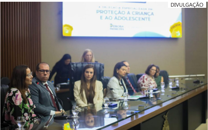
Assembleia Legislativa do Amazonas (Aleam)

julho de 2025, que acrescenta medidas de combate à pedofilia em terminais aquaviários, rodoviários, incluindo o interior das barcas e ônibus intermunicipais, prevendo promover campanhas com a participação dos órgãos responsáveis para alertar pessoas que utilizem terminais aquaviários e rodoviários, para que possam identificar, denunciar e solicitar ajuda sobre a exploração sexual de crianças e adolescentes e treinamento dos funcionários dos terminais aquaviários e rodoviários para reconhecer os sinais de exploração infantil.