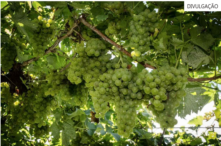
Instituto prevê produção de 900 milhões de quilos e crescimento de 15% em relação à colheita anterior

O Consevitis-RS estima que nessa safra serão produzidos aproximadamente 850 milhões de quilos de uva industrial e 50 milhões da fruta destinada a consumo in natura e ao vinho industrial.