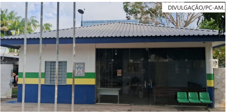
Autor não aceitava o fim do relacionamento

“As denúncias relataram ameaças com o uso de um terço, motivadas pelo fato de o agressor, que também é usuário de drogas, não aceitar o fim do relacionamento com a mulher. As irmãs da vítima estavam com medo, pois a situação havia se tornado insustentável”, afirmou a delegada. Conforme a autoridade policial, após as ameaças, o infrator se deslocou para a zona urbana de Carauari. Diante das informações, equipes da PC-AM e da PMAM iniciaram diligências nos portos do município.