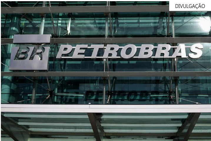
Ainda de acordo com a empresa, desde dezembro de 2022, o preço médio da molécula vendido às distribuidoras acumula uma redução da ordem de 38%

o preço final do gás natural ao consumidor não é determinado apenas pelo preço de venda da molécula pela companhia, mas também pelo custo do transporte até a distribuidora, pelo portfólio de suprimento de cada distribuidora, assim como por suas margens (e, no caso do GNV – Gás Natural Veicular, dos postos de revenda) e pelos tributos federais e estaduais.