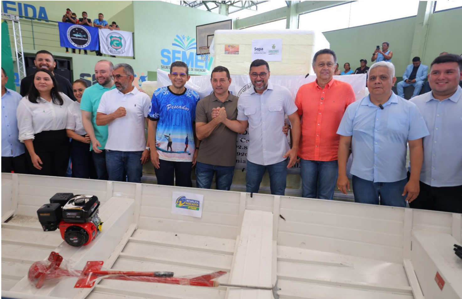
4ª fase do programa Atualiza Pescador

“A atualização é importante para que os pescadores