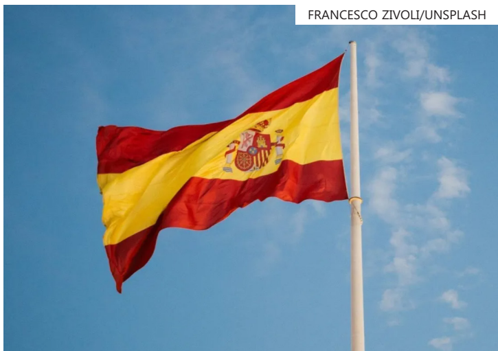
Bandeira da Espanha

A autorização concedida aos candidatos terá uma validade inicial de um ano e será acompanhada de uma autorização de trabalho temporária válida em todo o território, que lhes permitirá ingressar em qualquer setor.