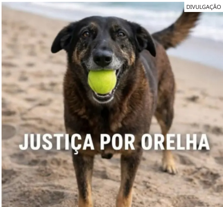
Cão era cuidado pela comunidade havia cerca de dez anos

Agora, com a confirmação da autoria dos adolescentes, o relatório das investigações foi encaminhado à Delegacia Especializada no Atendimento ao Adolescente em Conflito com a Lei, em razão da idade dos envolvidos.