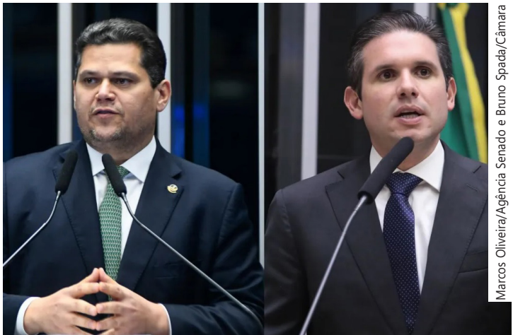
O senador Davi Alcolumbre (União-AP) e o deputado federal Hugo Motta (Republicanos-PB)

O presidente da Câmara, segundo interlocutores, também pretende tocar projetos da segurança pública, educação e saúde. A PEC da segurança e o PL antifacção são duas pautas herdadas de 2025.