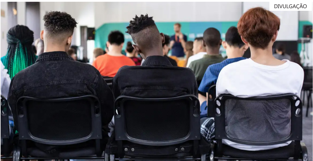
Pedido de suspensão feito pelo diretório estadual do PSOL

“A proibição legislativa genérica e desvinculada de avaliação concreta de necessidade ou adequação revela-se, ao menos em juízo de cognição sumária, dissonante da interpretação constitucional já consolidada”, disse a desembargadora.