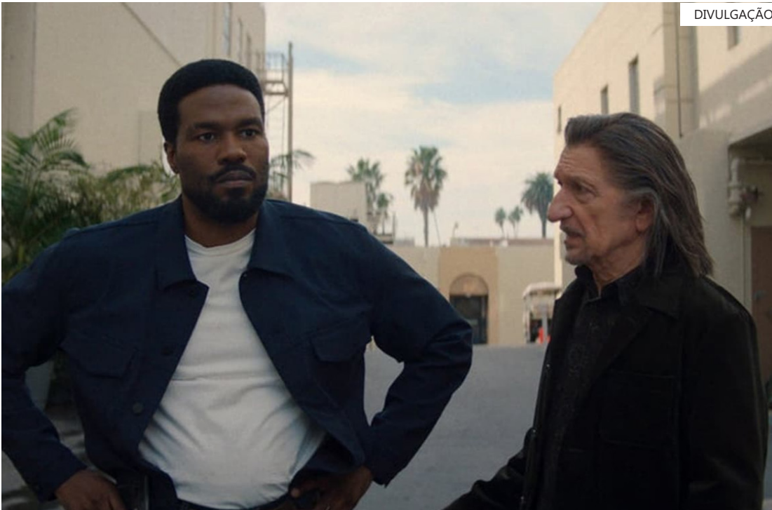
Produções com Harrison Ford, Kate Hudson, Hugh Jackman e mais estreiam nos próximos dias