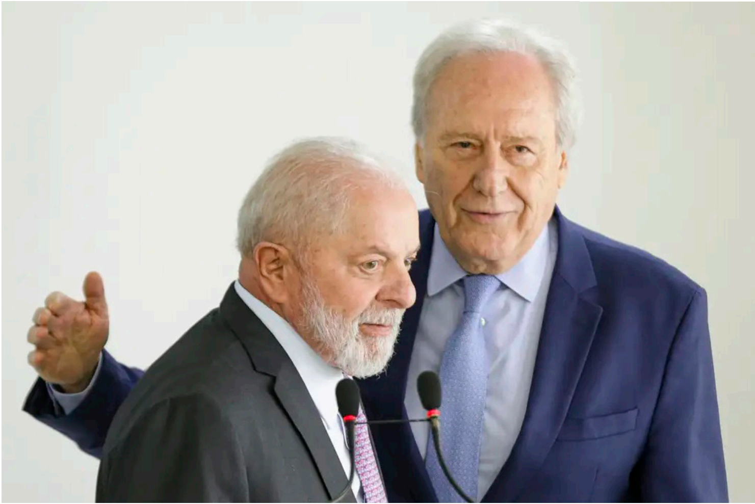
Presidência Luiz Inácio o ex-ministro da Justiça e Segurança Pública Ricardo Lewandowski