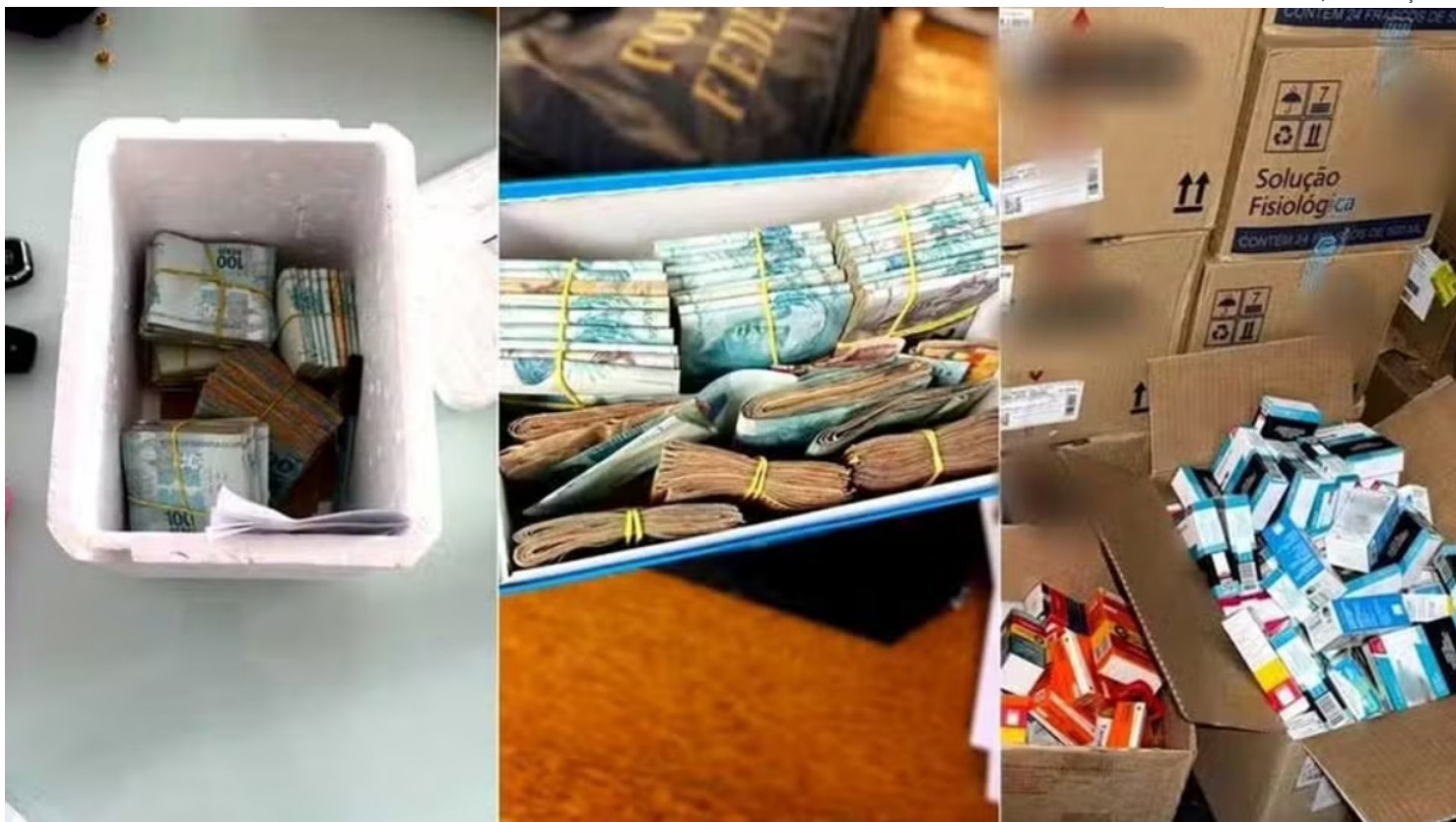
Dinheiro foi apreendido na casa de sócio de distribuidora de medicamentos

A operação tem como base auditorias da Controladoria-Geral da União (CGU). Documentos do órgão apontam que há falhas na execução contratual. Inclusive, indícios de compra de materiais