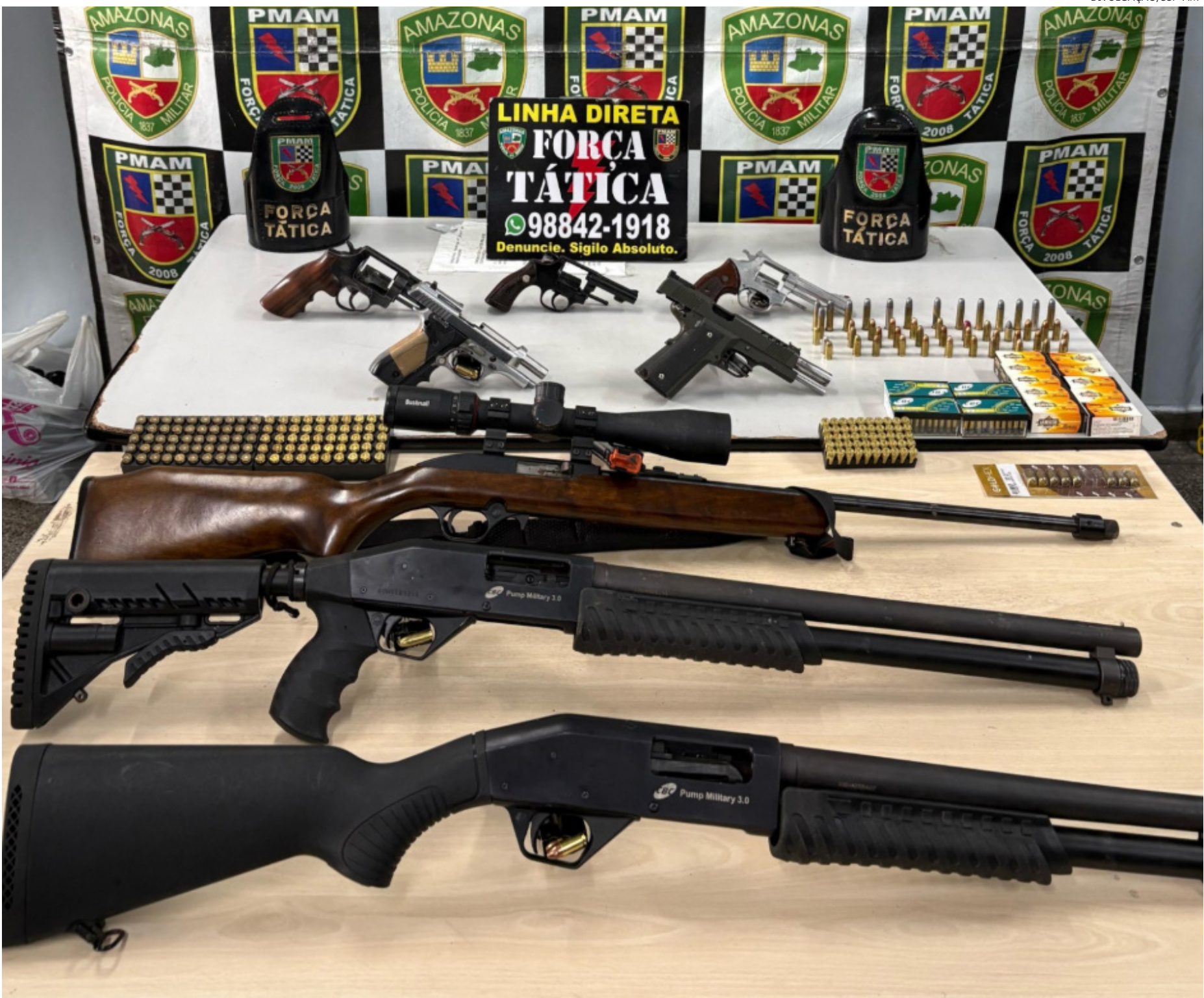
Cada arma de fogo apreendida influencia diretamente na redução da prática de outros crimes

Entre os meses de janeiro a dezembro de 2015, foram apreendidas no Amazonas