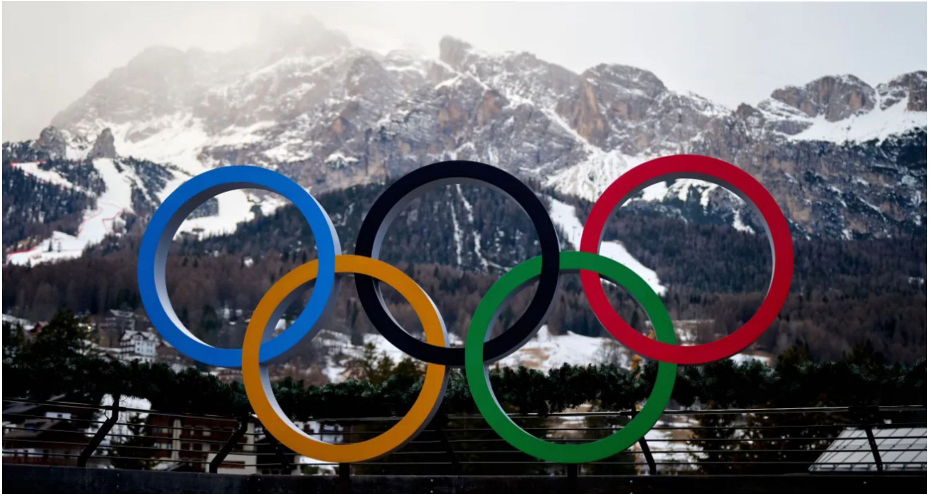
Anéis olímpicos em Cortina d'Ampezzo, na Itália

Agentes do Serviço de Imigração e Alfândega dos Estados Unidos (ICE) ajudarão a proteger delegações americanas nos Jogos Olímpicos de Inverno do próximo mês, na Itália, provocando reação política no país. Integrantes do ICE e da Patrulha de Fronteiras vêm sendo duramente criticados pela aplicação da política migratória do presidente Donald Trump após matarem dois cidadãos americanos em incidentes separados neste mês, em Minnesota. A divisão de Investigações de Segurança Interna do ICE dará apoio ao Serviço de Segurança Diplomática do Departamento de Estado durante os Jogos de Milão-Cortina, entre 6 e 22 de fevereiro, informou o Departamento de Segurança Interna (DHS) em publicação no X. Segundo o DHS, o papel dos agentes será “avaliar e mitigar riscos de organizações criminosas transnacionais”, ressaltando que “todas as operações de segurança permanecem sob autoridade italiana”. Atuação do ICE no exterior “Obviamente, o ICE não