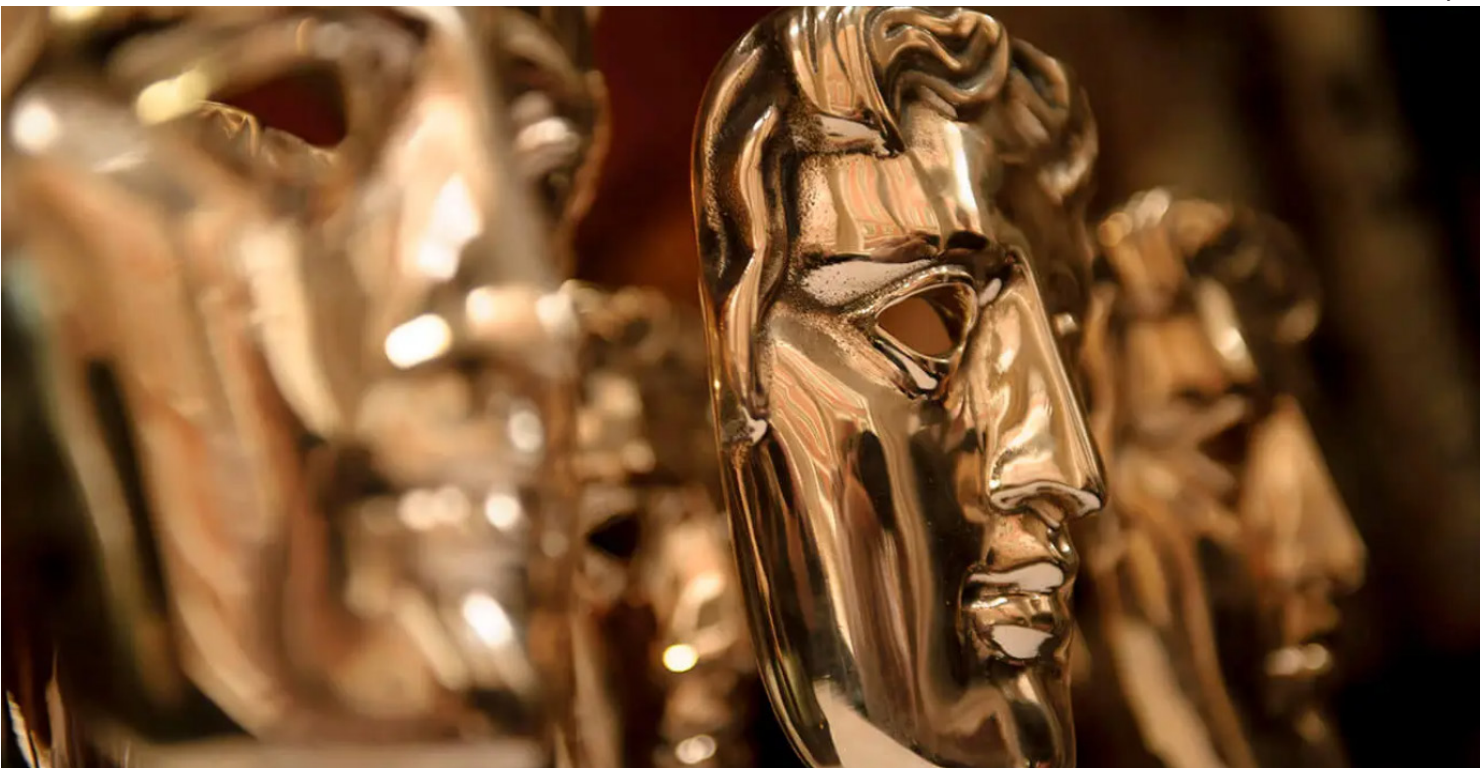
Premiação da Academia Britânica de Cinema está marcada para 22 de fevereiro, em Londres, no Reino Unido

Foi Apenas um Acidente O Agente Secreto Valor Sentimental Sirāt A Voz de Hind Rajab