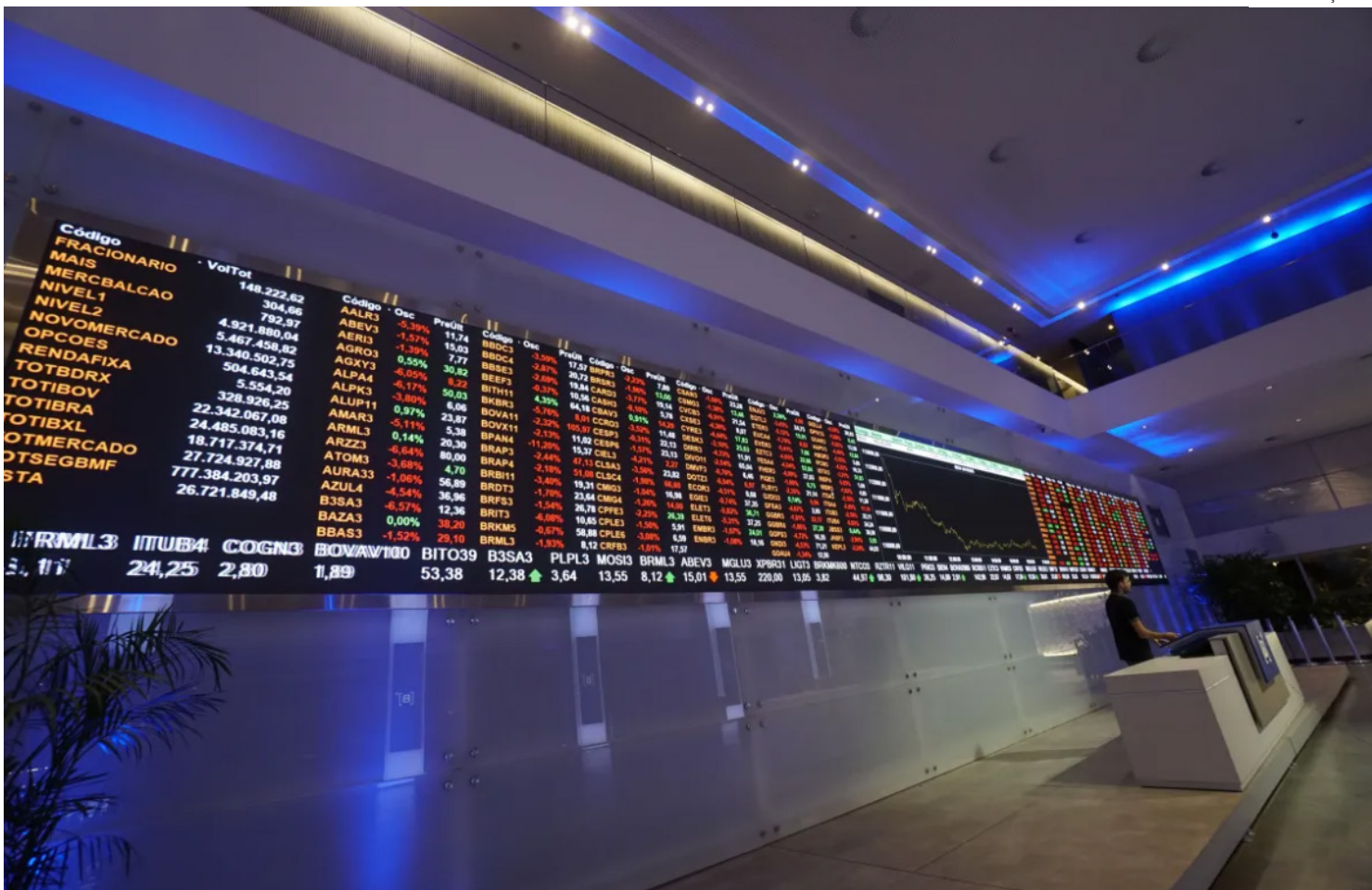
Principal índice da bolsa renova recorde e moeda norte-americana vai ao menor valor desde maio de 2024

Ainda dentre as commodities, a Vale se recuperou do tombo da véspera, com alta de 2,20%.