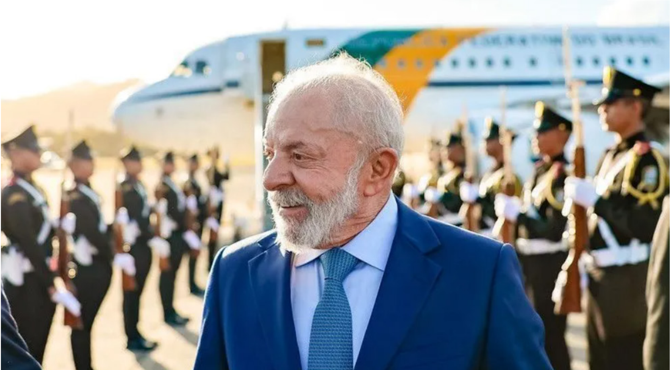
Presidente da República, Luiz Inácio Lula da Silva, durante chegada ao Aeroporto Panamá Pacífico. Cidade do Panamá - Panamá

Presidente confirmou sua viagem oficial à Washington e pretende fortalecer o diálogo entre EUA e Brasil