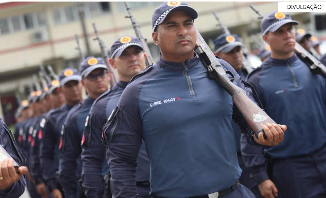
Governador Wilson Lima anunciou a convocação de mais 600 candidatos em dezembro de 2025

rança do Amazonas. Com este novo chamamento, o total de profissionais convocados pelo Governo do Amazonas chega a 3,7 mil, número que supera as 2,4 mil vagas inicialmente previstas no edital do concurso, realizado em 2022, após quase onze anos sem um certame para a Polícia Militar, Polícia Civil, Corpo de Bombeiros, Secretaria de Segurança e Detran.