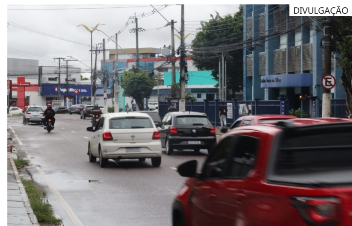
Até o ano passado, apenas veículos de propriedade dos responsáveis tinham direito à isenção do IPVA

Além dos pontos de atendimento disponíveis nos Postos de Atendimento ao Cidadão (PAC) e Agências e Postos no Interior do estado.