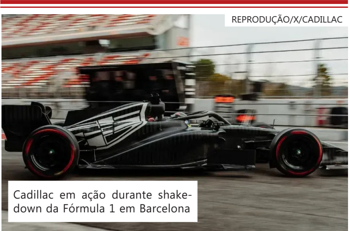
Cadillac em ação durante shakedown da Fórmula 1 em Barcelona

dia 8 de fevereiro (domingo) – durante o Super Bowl da NFL. Equipe estreante na Fórmula 1 A Cadillac estreia na Fórmula 1 na temporada 2026, com apoio da TWG Motorsports e da General Motors (GM). A equipe foi oficializada como 11ª escuderia do grid ainda em 2025. A escuderia, que usará o nome GM/Cadillac na Fórmula 1, fabricará seus próprios motores para a categoria a partir de 2029. Até lá, a equipe fará parceria com a Ferrari para a utilização de motores e outros componentes.