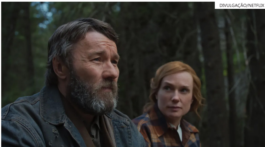
Joel Edgerton e Kerry Condon em “Sonhos de Trem”

guiou as escolhas visuais do diretor, que buscou uma abordagem que não criasse barreiras entre o público e os personagens.