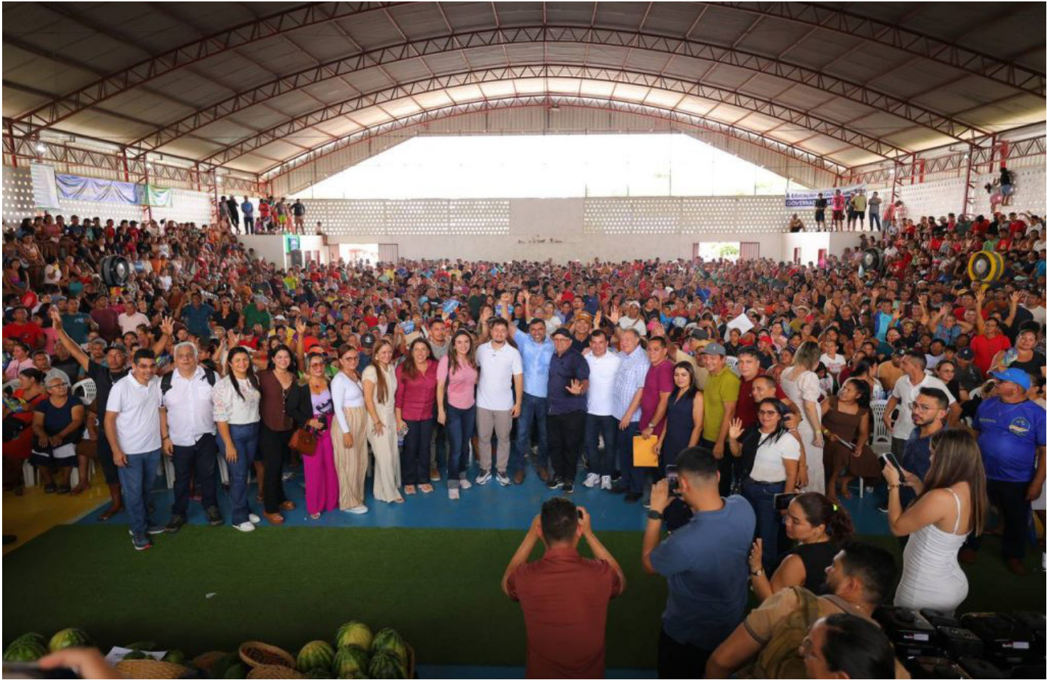
Programa 'Inclusão Sobre Rodas'

O governador Wilson Lima fortaleceu o setor social do município de Caapiranga com a entrega de novas cadeiras de rodas, na manhã desta sexta-feira (16/01). Ao todo, já foram entregues 900 unidades em todo o estado, por meio do programa 'Inclusão Sobre Rodas', criado em dezembro de 2024. No município, também foram entregues equipamentos, cartões e repasse de recursos no setor primário. "Em Manaus, nós zeramos a fila de espera por cadeira de rodas e nós estamos fazendo a mesma coisa no interior. Onde tiver uma pessoa no estado precisando, nós chegaremos lá para resolver", destacou o governador Wilson Lima. A entrega das cadeiras de rodas é realizada pelo Governo do Amazonas, por meio da Secretaria de Estado de Justiça, Direitos Humanos e Cidadania (Sejusc), e visa a distribuição de cadeiras