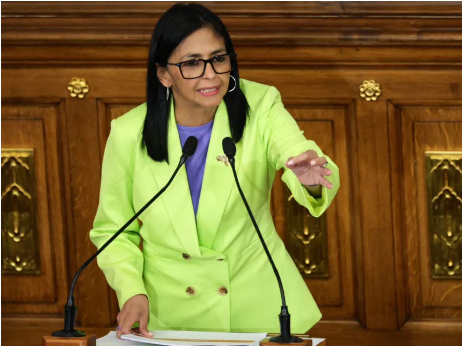
Delcy Rodriguez discursa na Assembleia Nacional da Venezuela

Delcy anunciou, nesta quinta-feira (15), que seu governo vai enviar à Assembleia Nacional (o Poder Legislativo da Venezuela) um projeto de lei para reformar a Lei de Hidrocarbonetos, que prevê a participação do Estado venezuelano sobre toda a cadeia