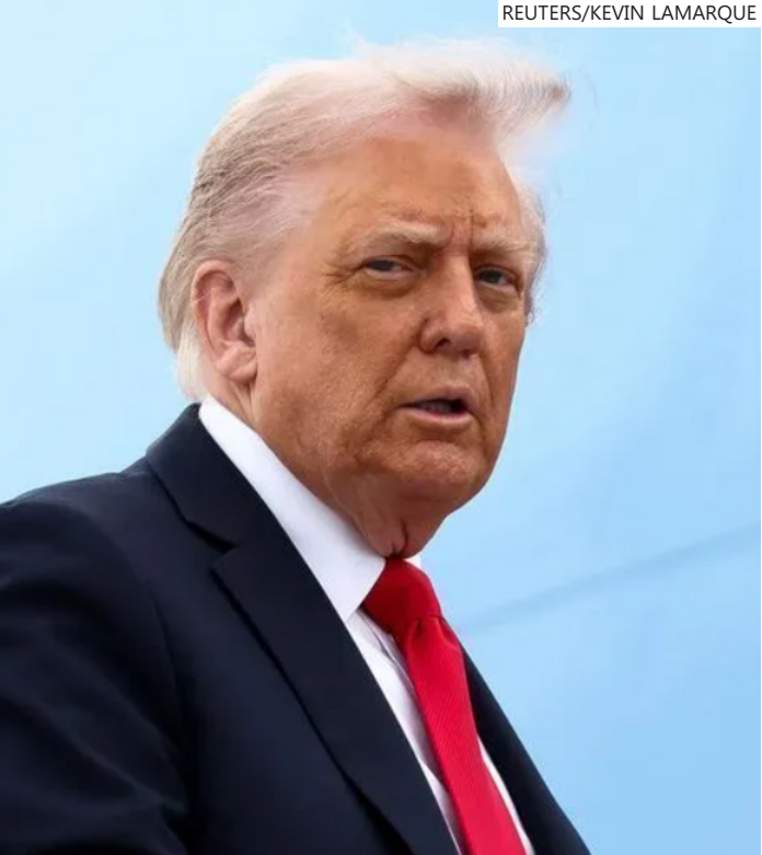
Presidente tem reforçado ameaças de tomar o território dinamarquês em meio a contestação de nações europeias aliadas dos EUA na Otan

visitaram a Casa Branca esta semana para reuniões inconclusivas sobre os planos de Trump.