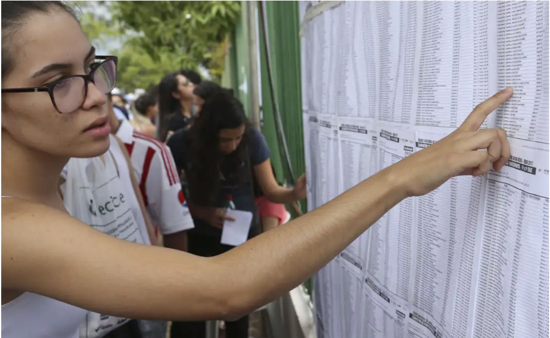
Especialistas orientam sobre o funcionamento dos sistemas e a importância do planejamento

O SisU, principal ferramenta de seleção para universidades públicas, é um sistema dinâmico. As inscrições para o programa começam na segunda-feira