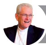
Cardeal Leonardo Steiner

da mais crucial nesse processo. Na Lava Jato, não havia, como há hoje, parentes de ministros do Supremo que tenham recebido, direta ou indiretamente, milhões de reais dos investigados. Agora, há.