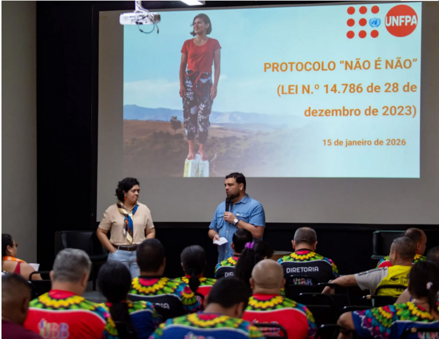
Capacitação integra as ações do Cedim, em parceria com a Sejusc, Unfpa e Abrasel