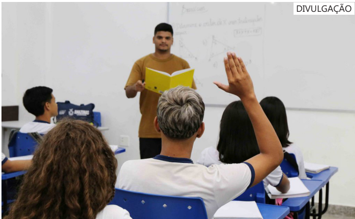
Serão 688 bolsas de R$ 2.100 para professores da rede estadual do Amazonas

portante que, de imediato à divulgação do edital, os professores que se enquadram nos critérios organizem seus documentos pessoais e profissionais de modo que facilite no processo de inscrição no certame. "O edital trará as escolas elegíveis pelo MEC disponíveis para atender o programa. É importante que os professores dessas localidades já deixem organizados seus principais documentos, como CPF, certificados de graduação, certificado de tempo de serviços que comprovem vínculos, atualizados para facilitar sua inscrição no processo", ressaltou a gerente.