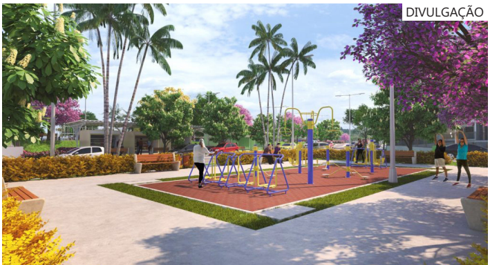
O programa está executando, no momento, as intervenções na área de saneamento básico, com água tratada para toda a cidade e a implantação de rede de esgoto

uma etapa do Prosaí Parintins reafirma o compromisso do Governo do Amazonas com o desenvolvimento regional e a execução de obras estruturantes, que melhoram a infraestrutura urbana e a qualidade de vida da população. "O Governo do Amazonas avança com o cronograma do Prosaí Parintins. Este mês, o edital de licitação para as obras de urbanização será publicado, marcando o início da maior transformação urbana da história da Ilha Tupinambá. O programa não é apenas asfalto e concreto, é a priorização da qualidade de vida e do bem-estar das famílias parintinenses", destacou o secretário.