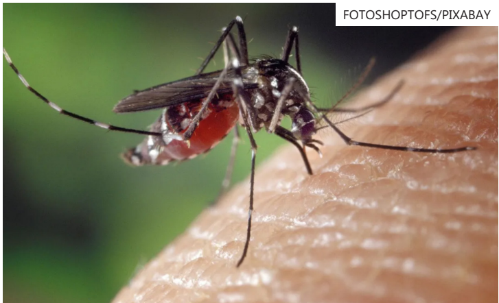
Os sintomas tiveram início no dia 3 de janeiro de 2026 e óbito foi registrado nesta sexta-feira (16) no município de Nova Guataporanga

O tratamento inicial da dengue deve focar no alívio dos sintomas e, principalmente, na hidratação. Esper Kallás, infectologista e diretor do Instituto Butantan, explicou à imprensa Sinais Vitais que recomenda o uso de medicamentos como paracetamol ou dipirona para controle da febre e dor, evitando anti-inflamatórios.