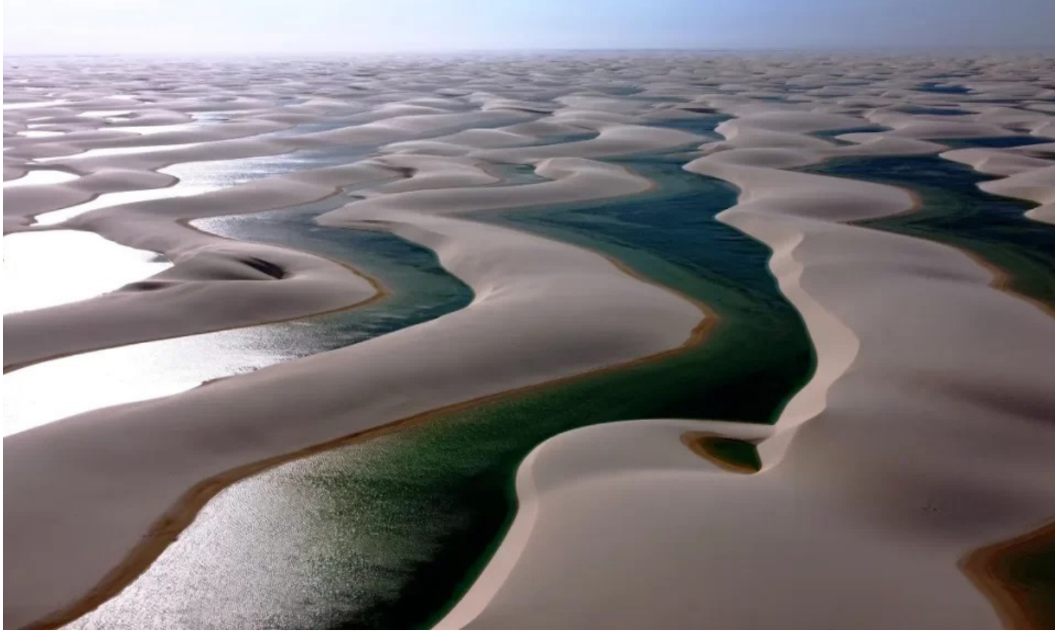
Parque Nacional dos Lençóis Maranhenses é reconhecido como Patrimônio Natural da Humanidade pela Unesco

Águas de Lindóia, a cerca de 160 quilômetros de São Paulo, é conhecida como a capital termal do Brasil. Alguns dos pontos turísticos são a Praça Adhemar de Barros, cartão-postal da cidade, que foi projetada por Roberto Burle Marx na década de 1950, e o Balneário Municipal, que oferece mais de 30 banhos de imersão e pisci-