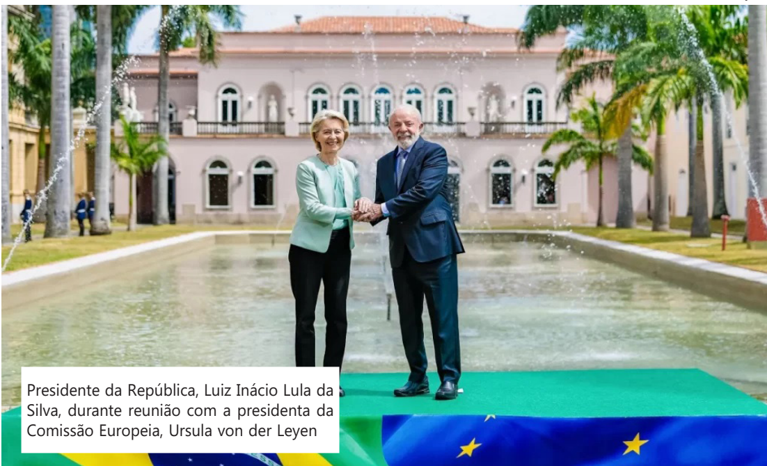
Presidente da República, Luiz Inácio Lula da Silva, durante reunião com a presidenta da Comissão Europeia, Ursula von der Leyen

“O acordo prevê dispositivos que incentivam empresas