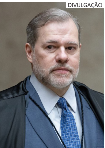
Ministro Dias Toffoli durante a Sessão Plenária

A perícia do material apreendido na mais recente fase da Operação Compliance Zero será realizada pela PGR (Procuradoria-Geral da República) com o acompanhamento e acesso da PF. Quatro peritos da corporação foram designados por Toffoli para acompanhar o processo.