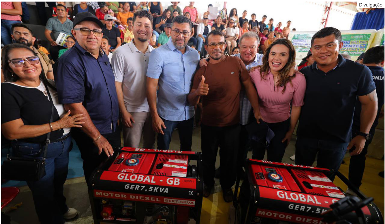
População foi beneficiada com a entrega de cadeiras de rodas, equipamentos, cartões do Produtor Primário, além de outros investimentos