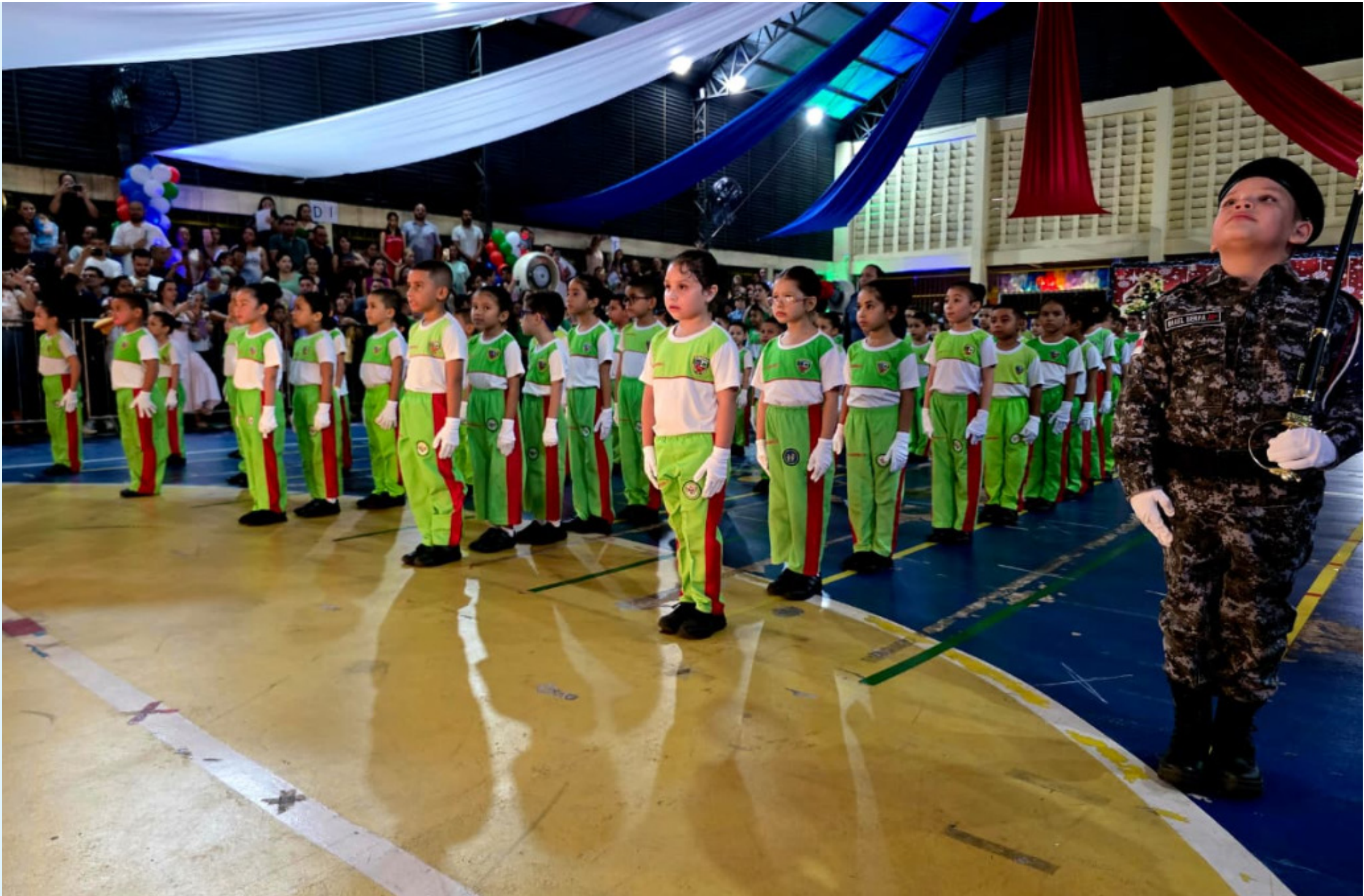
O processo seletivo é integralmente gratuito e tem vagas para fases do Maternal 1, 2 e 3, além do 1º e 2º anos