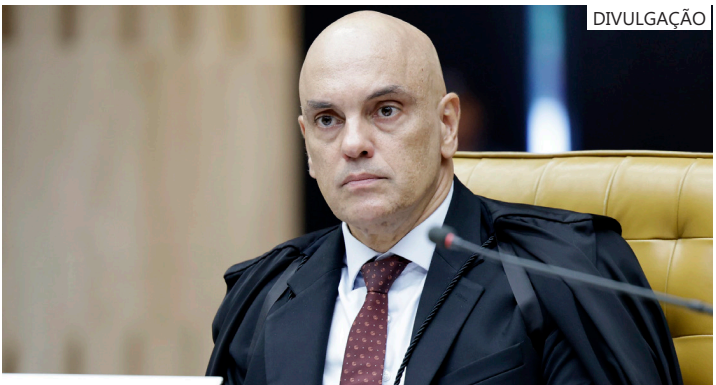
Ministro Alexandre de Moraes do STF

A determinação de Moraes também menciona que “a prisão não é hotel ou colônia de férias”, reforçando sua posição de que, apesar das alegações da defesa sobre condições inadequadas, a solução não seria a prisão domiciliar, mas sim a transferência para outro estabelecimento prisional com melhores instalações.