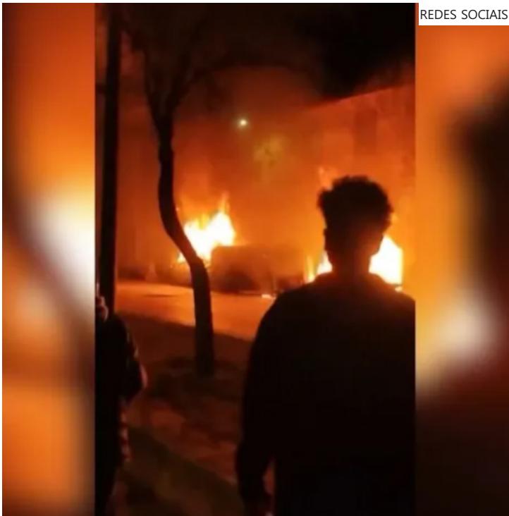
Video mostra um carro virado e vários incêndios enquanto manifestantes protestam em frente a uma delegacia de polícia no Irã

os violentos protestos contra o regime teocrático, mas alguns iranianos dizem que ainda se preparam para uma possível intervenção dos Estados Unidos.