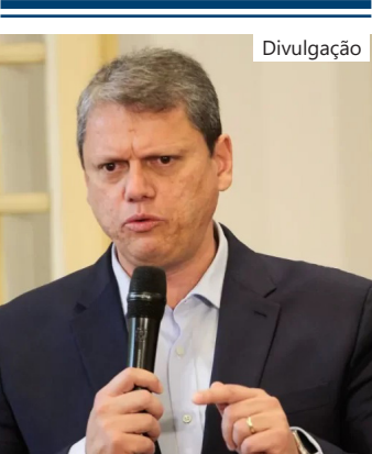
O governador de São Paulo, Tarcísio de Freitas (Republicanos)

a visita ao ex-presidente. Em nota divulgada pelo Palácio dos Bandeirantes, o chefe do Executivo paulista alegou motivos de agenda e disse que uma nova data seria solicitada para visitar Bolsonaro. Nos bastidores, o adiamento da visita teve motivos que envolvem disputas no campo da direita sobre a eleição presidencial deste ano.