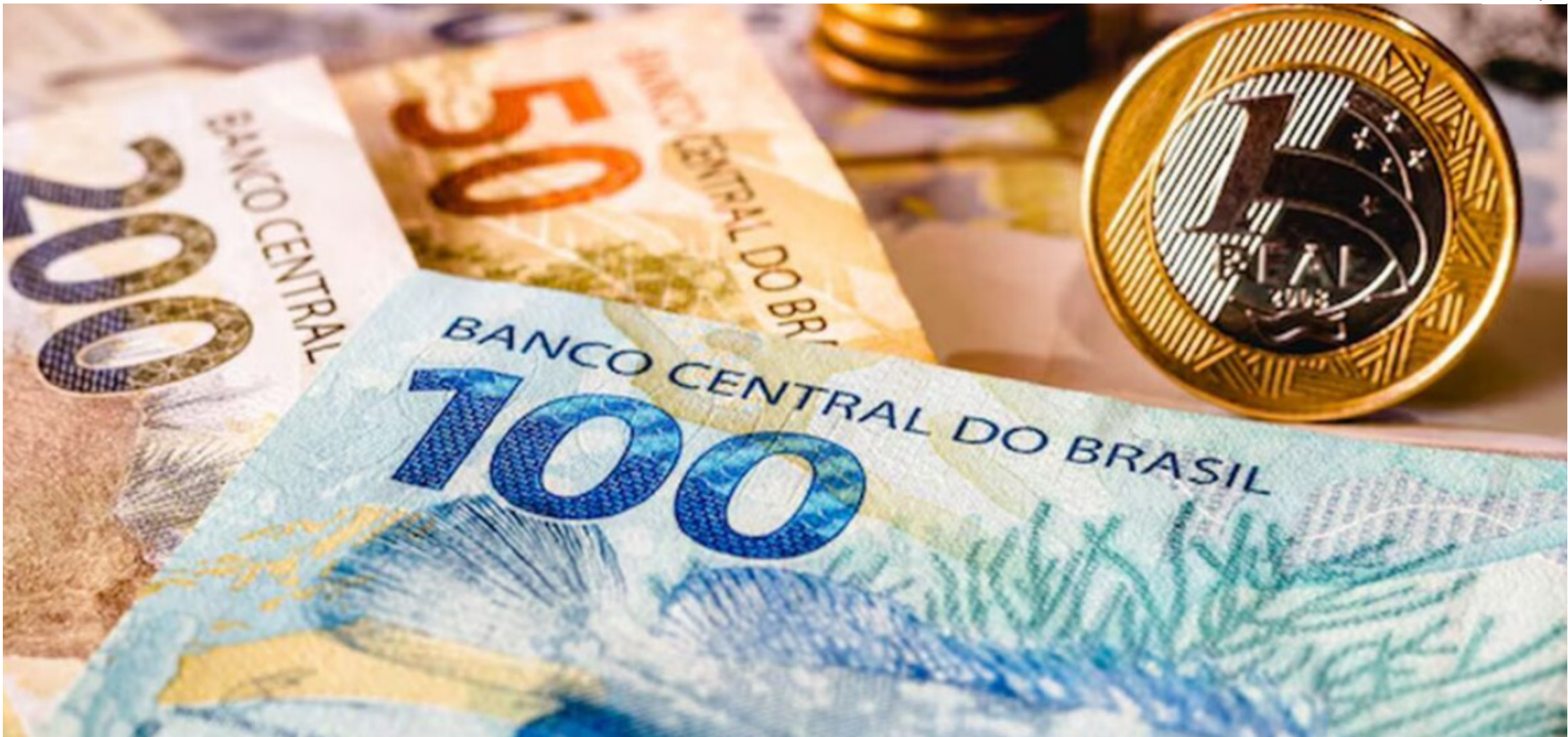
Dados da Receita Federal foram divulgados nesta quinta-feira (22)