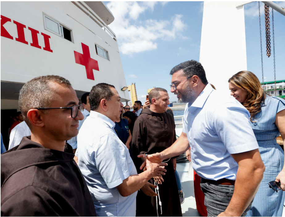
Barco Hospital São João XXIII

A unidade fluvial foi construída pela Associação e Fraternidade São Francisco de Assis na Providência de Deus, com apoio do Ministério Público do Trabalho da 11ª Região (MPT-AM), do Tribunal Regional do Trabalho da 11ª Região (TRT-11), do Superior Tribunal de Justiça (STJ) e de outras instituições parceiras, que contribuíram para viabilizar a concepção e implantação do projeto.