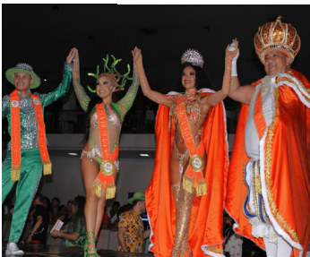
Evento acontece neste sábado às 16h, no Mercado de Origem da Amazônia