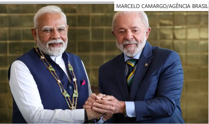
Telefonema antecede ida de Lula à Índia, em fevereiro

trâmites de implementação do acordo de parceria comercial que representantes políticos do Mercosul e da União Europeia assinaram no último sábado (17). Ele apontou que as exportações brasileiras para o país de cerca de 1,45 bilhão de habitantes (número mais de seis vezes maior do que a população brasileira) ainda tem muito espaço para crescer.