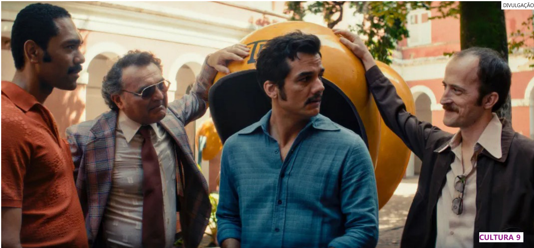
Obra brasileira de Kleber Mendonça Filho concorre às categorias principais da premiação