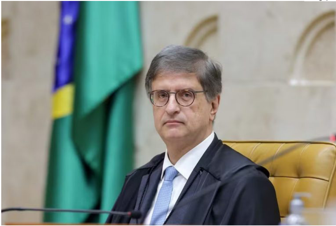
Procurador-geral da República, Paulo Gonet

Na decisão pelo arquivamento, Gonet afirma que os fatos narrados já estão sendo analisados no âmbito do Supremo Tribunal Federal, com acompanhamento regular da própria Procuradoria-Geral da República. Para o chefe do Ministério Público, não há providência adicional a ser tomada pela PGR neste momento, o que levou ao arquivamento da representação. “O caso a que se refere a representação já é objeto de apuração perante o Supremo Tribunal Federal, com atuação regular da Procuradoria-Geral da República. Não há, portanto, qualquer providência