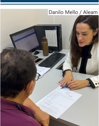
Campanha Janeiro Roxo

da hanseníase em áreas rurais e ribeirinhas no âmbito do Estado do Amazonas. Entre os objetivos da matéria estão garantir a detecção precoce da hanseníase por meio de campanhas permanentes de conscientização e triagens em comunidades vulneráveis; apoiar campanhas itinerantes de conscientização, diagnóstico e tratamento.