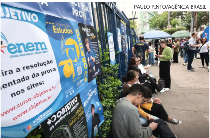
Podem concorrer participantes das últimas três edições do Enem

A seleção do candidato será com base na nota do Enem de 2023 a 2025 que resulte na melhor média ponderada, de acordo com a opção de curso. O participante não pode ter tirado nota zero na redação.