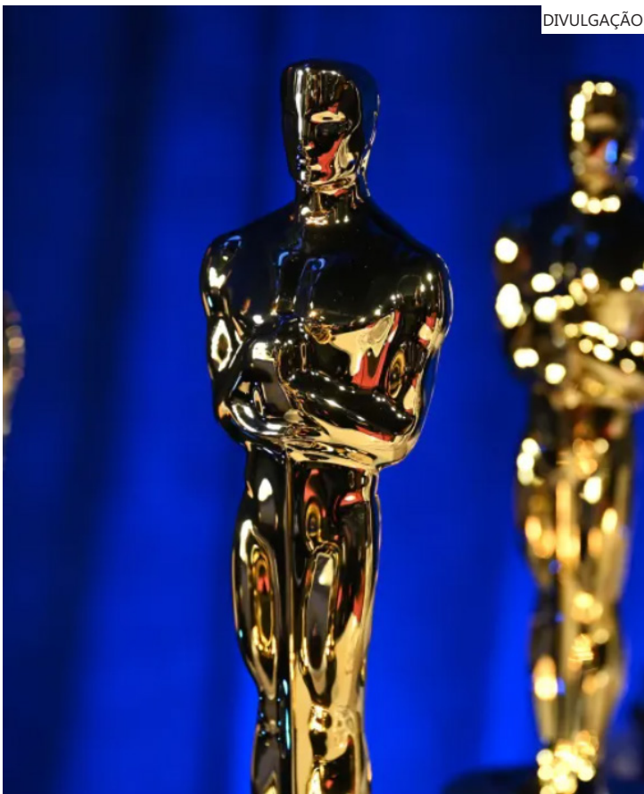
Academia de Cinema divulgou todos os concorrentes da premiação

A Academia de Artes e Ciências Cinematográficas anunciou, nesta quinta-feira (22), a lista dos indicados a todas as categorias do Oscar 2026, a mais importante da indústria cinematográfica no mundo. A cerimônia de entrega dos prêmios deste ano será realizada em 15 de março, em Los Angeles, nos Estados Unidos.