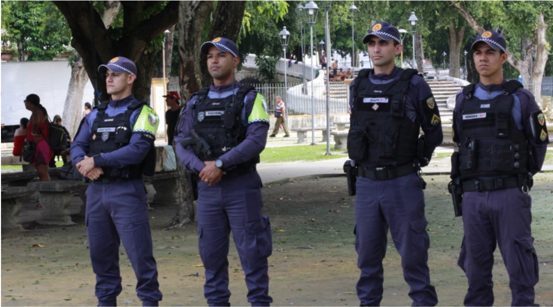
Amazonas obteve, também, a maior redução percentual de homicídios do país