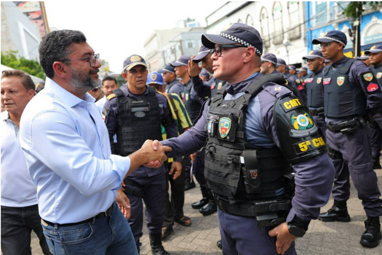
Secretaria de Segurança Pública do Amazonas (SSP-AM)

O Amazonas encerrou 2025 com queda expressiva nos principais indicadores de violência, consolidando um dos melhores desempenhos do país na área de segurança pública. Sob a liderança do governador e presidente estadual do União Brasil, Wilson Lima, os resultados refletem a atuação do Estado na condução das políticas de segurança ao longo do ano, com ações integradas, uso de inteligência, reforço do policiamento e investimentos contínuos. Dados da Secretaria de Segurança Pública do Amazonas (SSP-AM), consolidados no Relatório de Indicadores de Segurança e alinhados ao Mapa da Segurança Pública do Ministério da Justiça e Segurança Pública (MJSP), indicam redução consistente da criminalidade em diferentes frentes, tanto na capital quanto no interior, posicionando o Amazonas entre os estados com melhor desempenho proporcional do país. O governador Wilson Lima afirmou que os números refletem uma política de segurança baseada em planejamento, integração das forças e monitoramento permanente