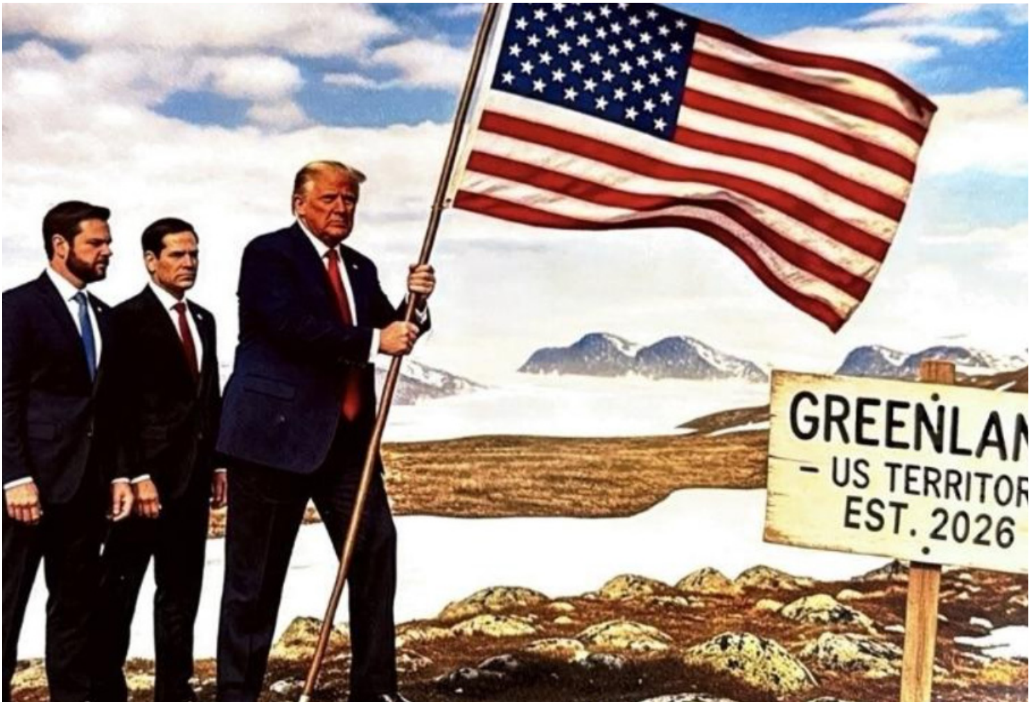
Imagem publicada por Trump na Truth Social mostra o presidente dos EUA fincando bandeira americana na Groenlândia

Trump fez o anúncio após a realização de diálogos durante o Fórum Econômico Global em Davos, na Suíça. “Com base em uma reunião muito produtiva que tive com o secretário-geral da Otan, Mark Rutte, formamos a estrutura de um futuro acordo em relação à Groenlândia”, postou o presidente americano na sua plataforma Truth Social. Trump não forneceu detalhes, mas comentou que as discussões continuarão até que se chegasse ao acordo. Rutte afirmou que não discutiu a questão principal da soberania dinamarquesa sobre a Groenlândia, na sua reunião com Donald Trump. A primeira-ministra dinamarquesa Mette Frederiksen declarou que a Dinamarca pode negociar sobre tudo, menos