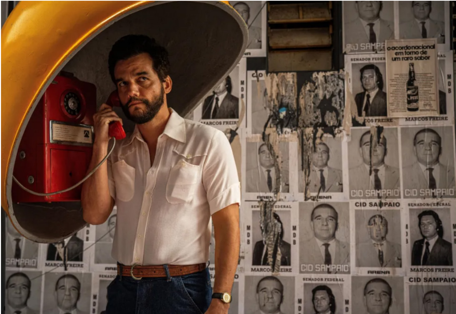
Wagner Moura em “O Agente Secreto”

Obra brasileira de Kleber Mendonça Filho concorre à categorias principais da premiação