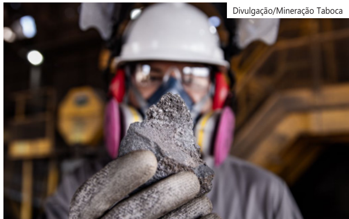
O anúncio reforça o protagonismo do Amazonas no setor mineral brasileiro

Do total anunciado, US$ 25 milhões serão destinados à pesquisa mineral, com foco na ampliação dos recursos da Mina de Pitinga, no reprocessamento de rejeitos – alinhado à economia circular – e no desenvolvimento de novos alvos estratégicos, como a região de Água Boa.