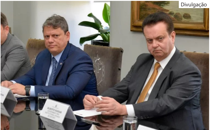
Governador São Paulo, Tarcísio de Freitas e o secretário de Governo e Relações Institucionais, Gilberto Kassab

Com a saída de cena do governador paulista, o Partido Social Democrático (PSD), presidido por Kassab, passou a trabalhar com três nomes como possíveis candidatos à Presidência: Eduardo Leite, governador do Rio Grande do Sul; Ronaldo Caiado, governador de Goiás; e Ratinho Jr., governador do Paraná. Caso a estratégia se confirme, será a primeira vez que o partido lançará uma candidatura própria ao Palácio do Planalto.