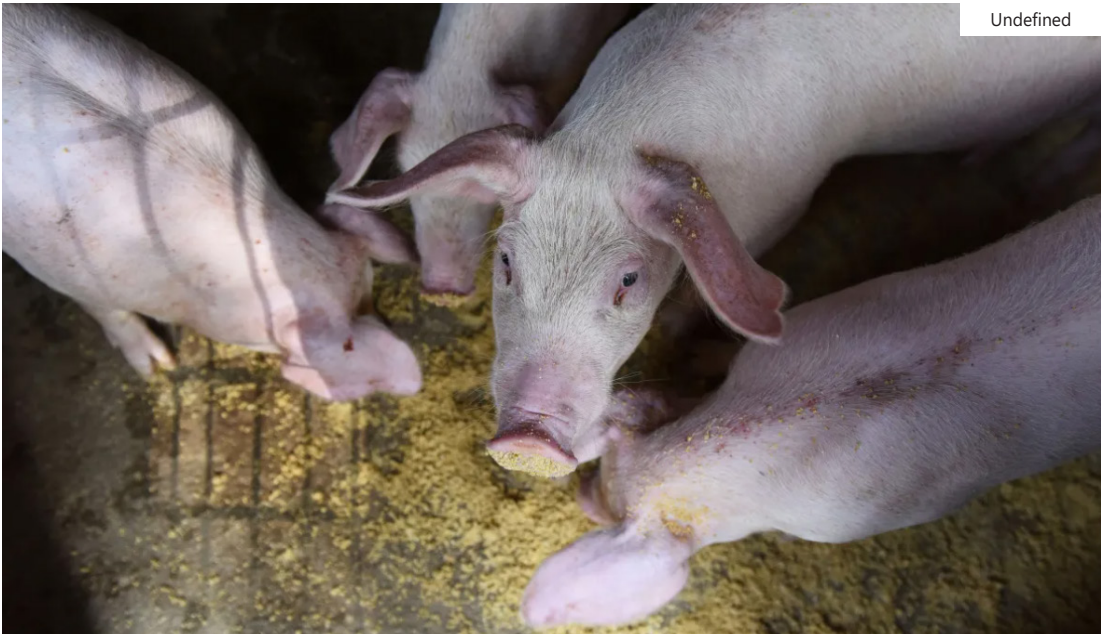
O levantamento considera valor do quilo exportado, que em 2025 foi de US$ 2,57 pelo produto nacional

Historicamente, a cotação no mercado independente é mais elevada devido aos maiores custos envolvidos.