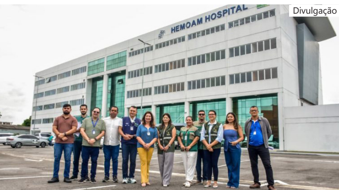
Ações incluem logística de equipamentos, infraestrutura operacional, protocolos de vigilância hospitalar, treinamento e qualificação dos profissionais