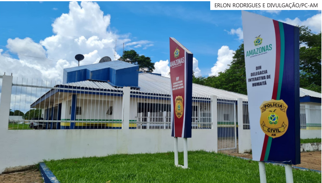
O objetivo do crime era extorquir cerca de R$ 250 mil das vítimas

Ainda segundo a autoridade policial, após um período de monitoramento, os suspeitos deixaram o local sem perceber a presença da polícia.