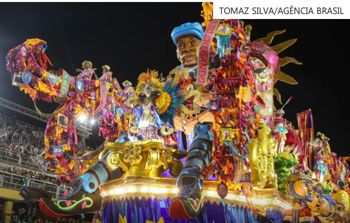
Contrato de patrocínio foi publicado no Diário Oficial do Estado

mento cultural em diferentes regiões do estado. Em 2026, os desfiles das escolas de samba do Grupo Especial do Rio de Janeiro ocorrerão em três dias, repetindo o formato do ano anterior. As 12 escolas se apresentam no domingo, segunda e terça-feira de carnaval, nos dias 15, 16 e 17 de fevereiro, com apresentações de quatro escolas por noite.