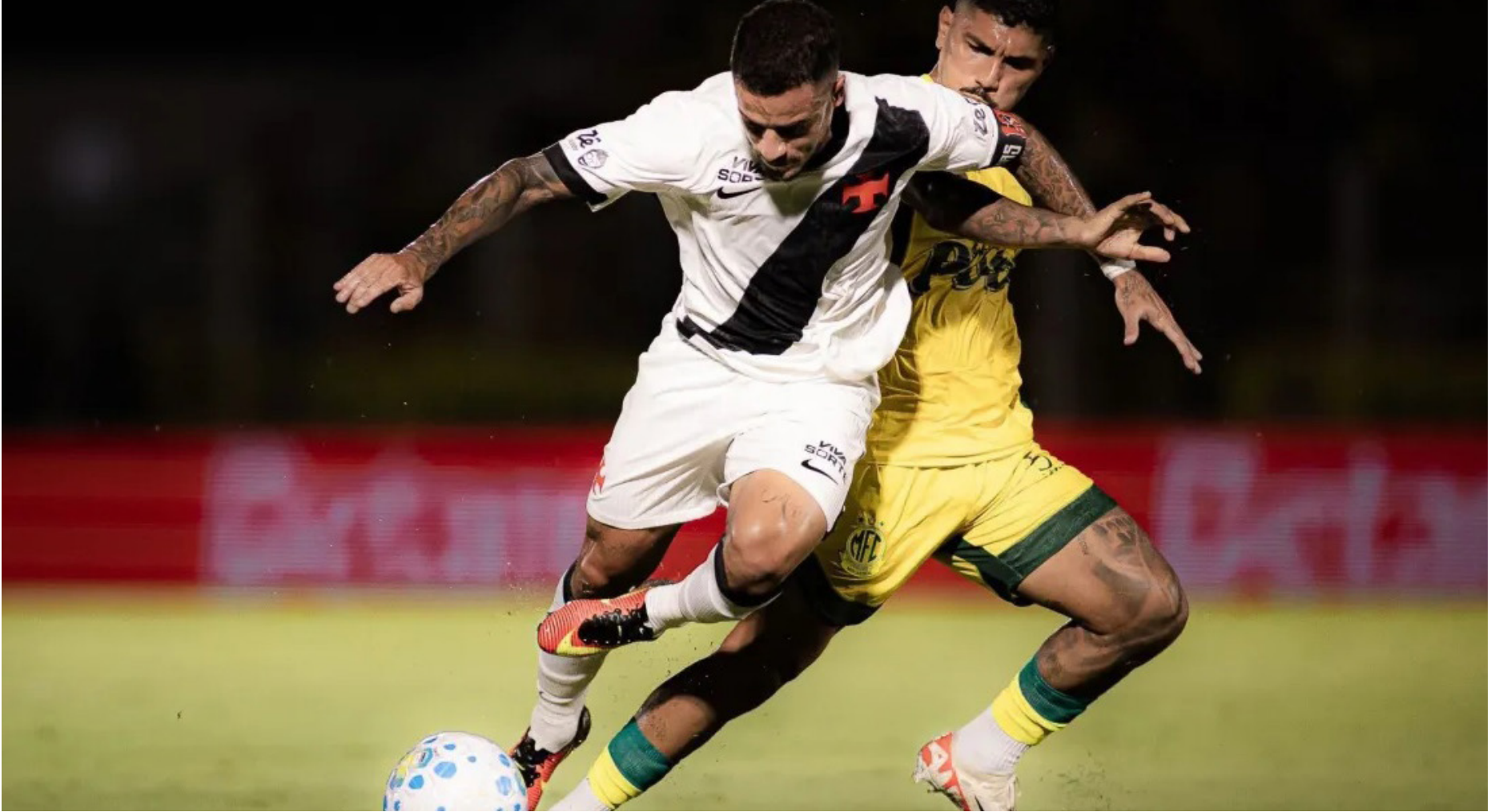
Lance de Mirassol x Vasco pelo Brasileirão