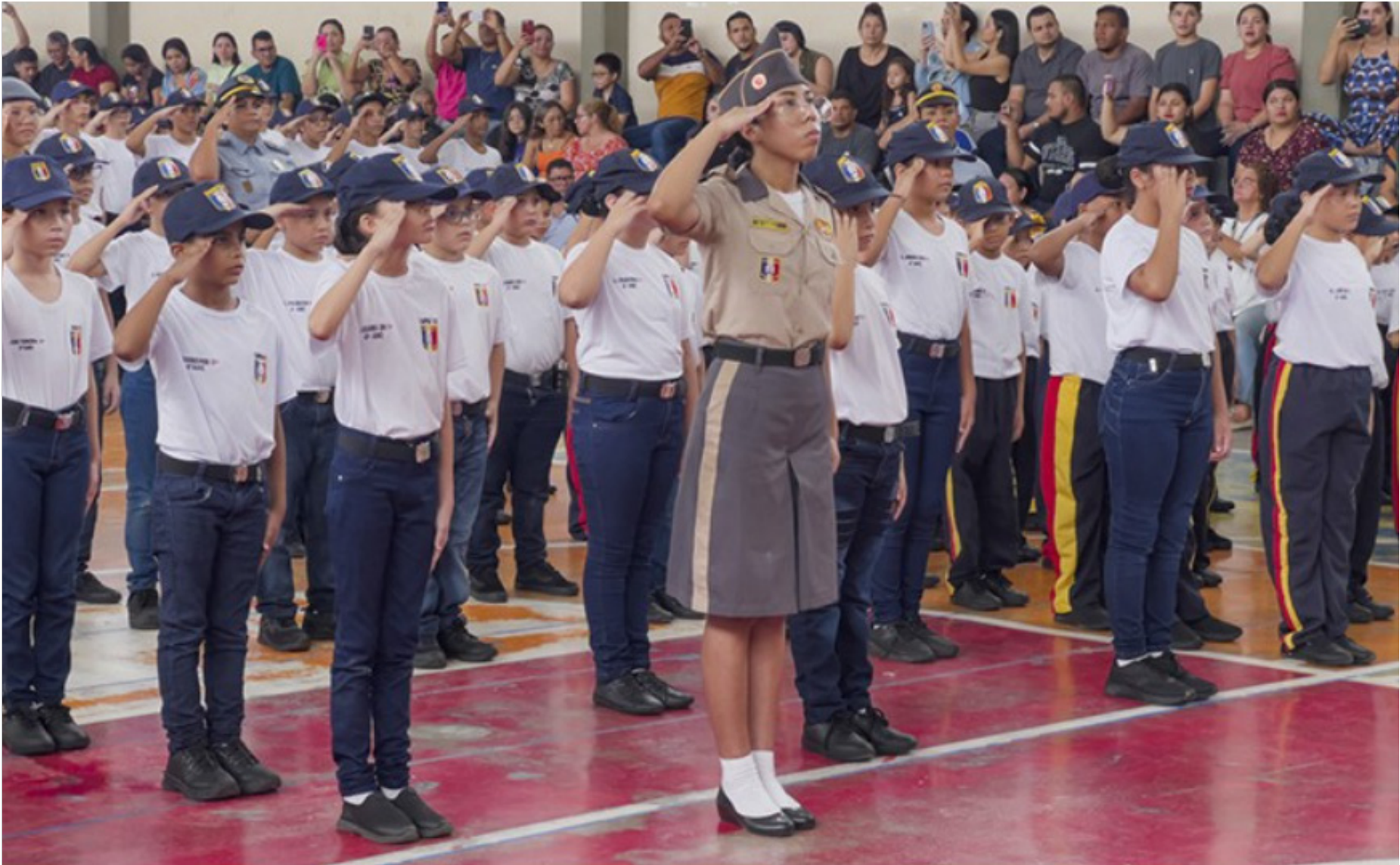
O objetivo é apresentar para os novos integrantes a rotina escolar, orientações gerais e instruções disciplinares do ensino militar