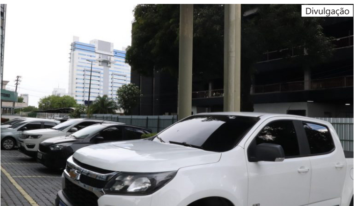
Proprietários de veículos de placa de final 1 têm até esta sexta-feira (30/01) para pagar a conta única com desconto de 10%

os 10% de desconto (em cota única ou na primeira parcela) termina no último dia útil de fevereiro, dia 27. Caso o contribuinte perca este primeiro prazo, ainda terá até o dia 31 de março para quitar o imposto com 5% de desconto. O prazo limite para o pagamento integral da cota única, sem descontos, para a placa final 2, está fixado para o dia 30 de abril. É possível acessar a tabela com todos os prazos de pagamento ao clicar no link https://online.sefaz.am.gov.br/doe/toPdf.asp?idPublicacao=2784 .