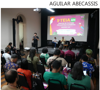
Debates, oficina formativa e apresentações culturais marcaram a programação da quarta-feira, no Palacete Provincial

“Hoje, nós começamos a fazer a estética da composição da rede estadual de pontos de cultura. Estamos colocando os possíveis delegados dentro da estrutura da Comissão Nacional, que são os grupos de trabalho temáticos. Foi um dia de esclarecimento sobre como fortalecer a nossa base de atuação”, destacou.