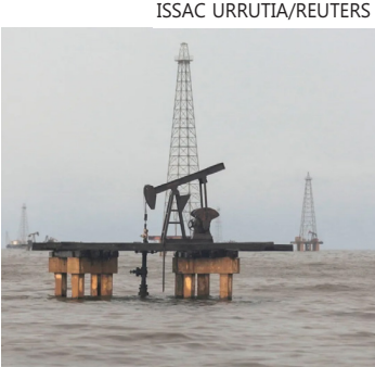
Bomba de petróleo em Cabimas, Venezuela

O CEO da Exxon Mobil afirmou, em uma reunião na Casa Branca logo após a captura de Maduro, que o país é “inviável para investimentos” em seu estado atual.