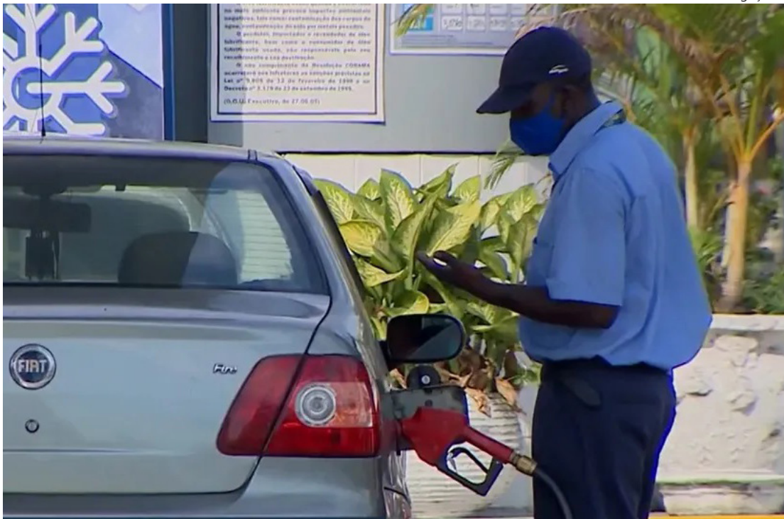
Posto de combustível manaus

O Ministério Público do Amazonas arquivou cinco inquéritos que investigavam uma suposta formação de cartel entre postos de combustíveis em Manaus. A decisão foi publicada no Diário Oficial do órgão na quarta-feira (28). As apurações começaram após aumento uniforme no preço da gasolina em 2023. Os inquéritos tiveram origem em levantamentos do Instituto de Defesa do Consumidor do Amazonas (Procon-AM), que apontaram reajustes simultâneos nos postos, com valores de R$ 5,99 e R$ 6,59 na época. Atualmente, o litro da gasolina custa, em