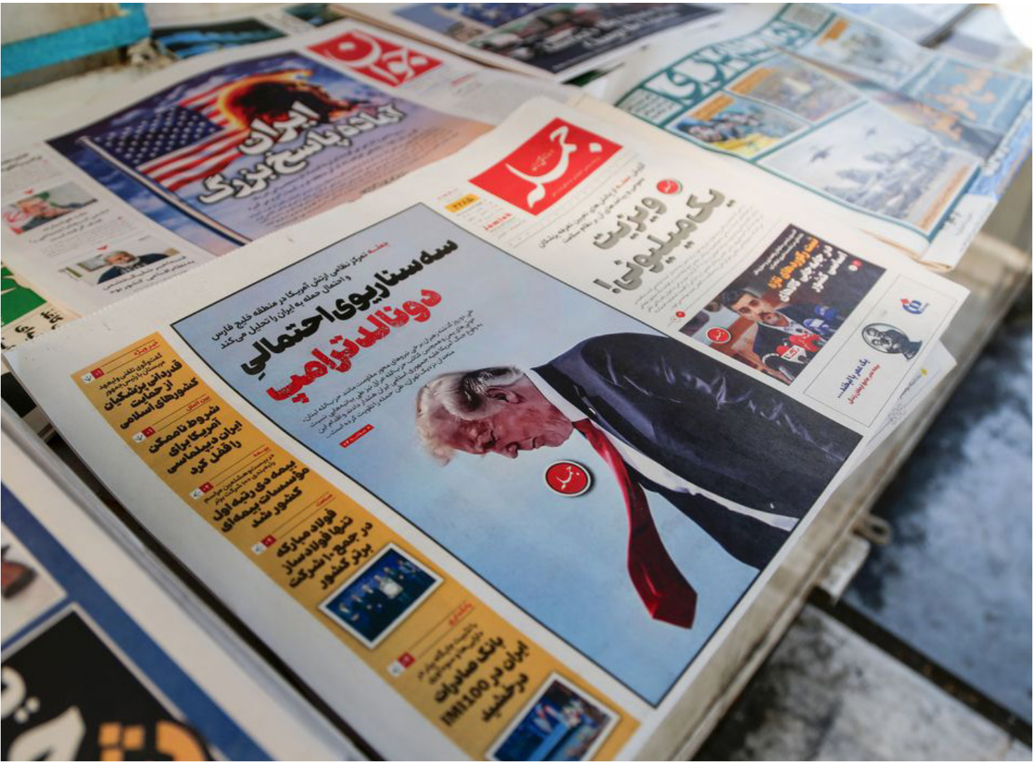
Manobras iranianas no estreito de Ormuz preocupam mercado de petróleo

Autoridades do Irã emitiram um alerta nesta quinta-feira (29) à navegação marítima no Estreito de Ormuz, na saída do Golfo Pérsico, anunciado que realizarão exercícios militares na rota comercial por onde circulam cerca de 20% do petróleo mundial. O fechamento do estreito chegou a ser considerado uma retaliação aos ataques de junho do