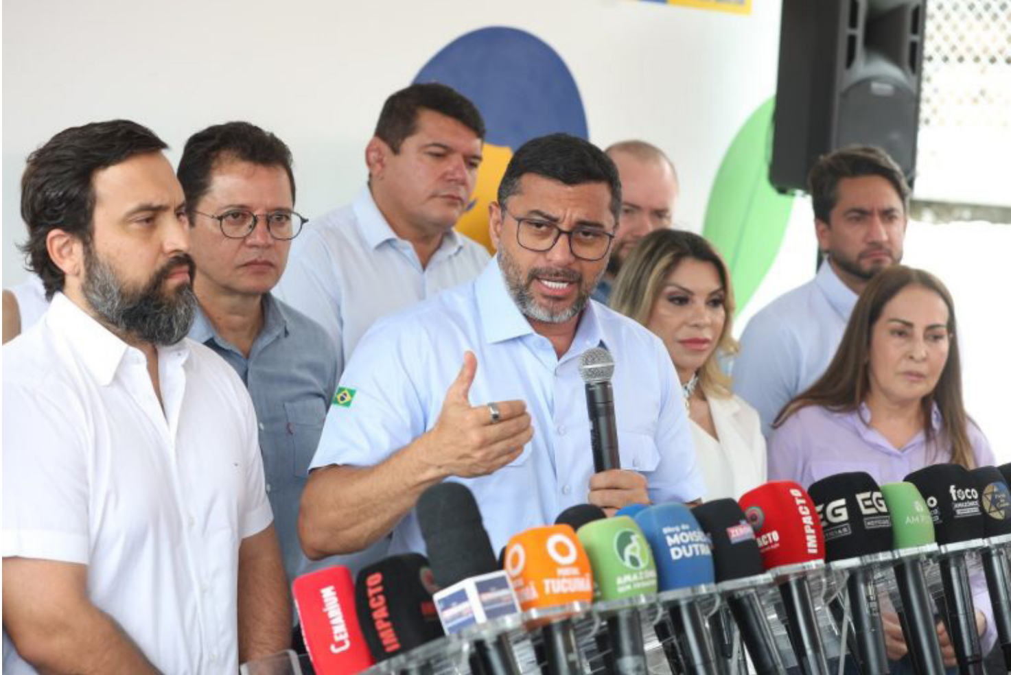
Ampliação do Centro de Saúde Mental do Amazonas (Cesmam)

O governador Wilson Lima entregou, nesta quinta-feira (29/01), a ampliação do Centro de Saúde Mental do Amazonas (Cesmam), no bairro Planalto, zona oeste de Manaus, consolidando a unidade como hospital de referência em Saúde Mental no estado. Inaugurado em 2022, o Cesmam aumenta em 125% a capacidade de internação, que passa de 16 para 36 leitos. A entrega ocorre durante o Janeiro Branco, mês de conscientização sobre a importância do cuidado com a saúde mental. Para o governador Wilson Lima, a ampliação representa um avanço na política pública de atenção psicossocial no Amazonas. “Nosso objetivo principal é fazer com que a gente esteja cada vez mais inserido nesse processo de humanização e de acolhimento, não só do paciente, mas também da família e da comunidade. É disso que trata o atendimento à saúde mental: um compromisso de toda a sociedade. Cuidar da saúde mental é cuidar da vida e das pessoas”, afirmou o governador. Além da ampliação das enfermarias, o Cesmam passa a contar com prédio admi-