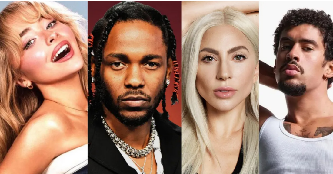
Kendrick Lamar lidera a lista com nove indicações; Lady Gaga lidera entre as mulheres

Confira a lista de indicados ao Grammy 2026 Álbum do Ano “DeBí TíRAR Más FOTOS” – Bad Bunny “Swag” – Justin Bieber