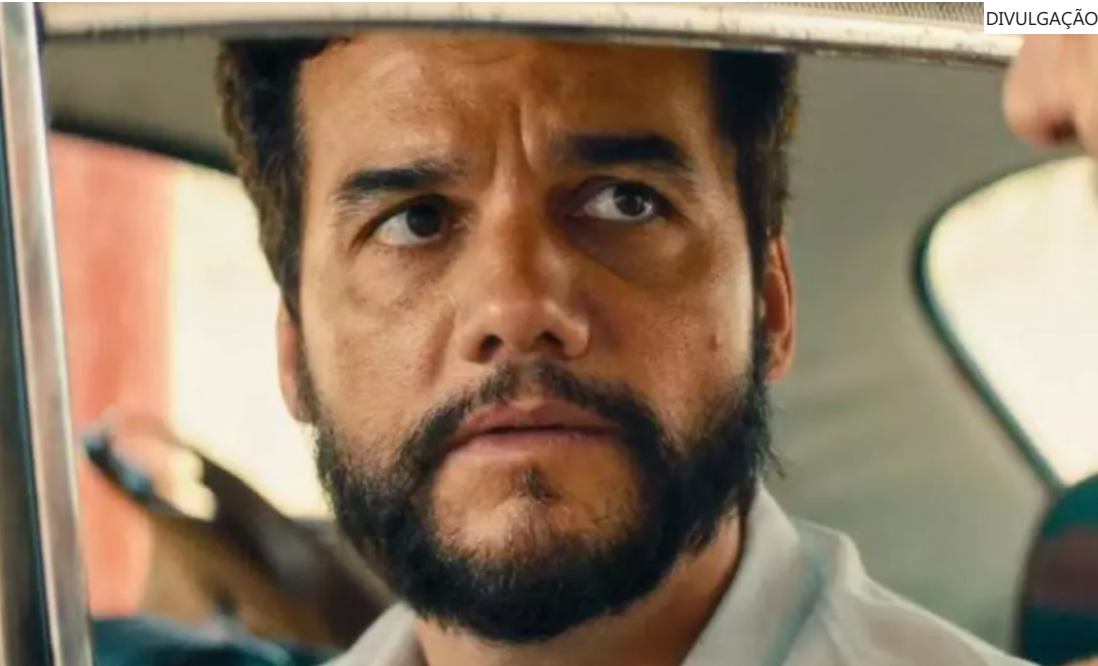
Ator está indicado ao Oscar de Melhor Ator

Wagner Moura segue sua jornada de entrevistas e campanha para O Agente Secreto na corrida de mais um Oscar para o Brasil. Indicado ao prêmio de Melhor Ator, o protagonista do filme de Kleber Mendonça Filho falou à Variety sobre o reconhecimento que a indicação ao prêmio trouxe, mas não deixou de fora sua visão política, assunto que tem pautado muitas de suas declarações.