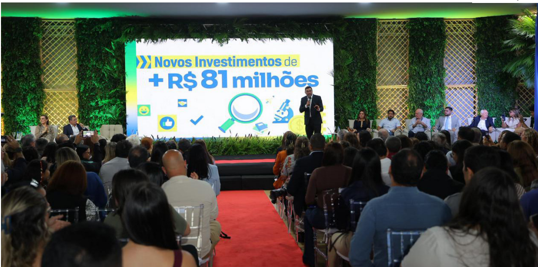
O Amazonas alcança a marca de R$ 1 bilhão investidos em ciência, tecnologia e inovação desde 2019

Do total de editais lançados, cinco são inéditos, ampliando