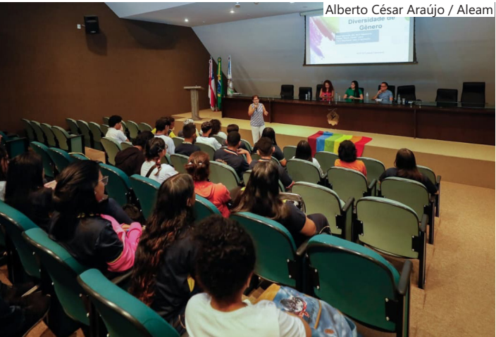
Assembleia Legislativa do Amazonas (Aleam)

Também de Campelo, a Lei nº 4.946/2019 dispõe sobre a inclusão e o uso do nome social por pessoas travestis e transexuais em todos os órgãos e entidades da administração pública direta, indireta, autárquica e fundacional do Estado, que deverão adotá-los, a qualquer tempo, de acordo com seu requerimento e com o disposto na legislação.