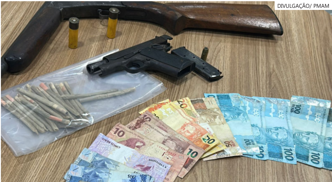
Homem, condenado por tráfico de drogas e com ligação ao crime organizado, foi encontrado com armas, drogas e veículo

"O suspeito não ofereceu resistência no momento da prisão e, durante a abordagem, já indicou a localização das armas que estavam escondidas", afirmou o subcomandante.