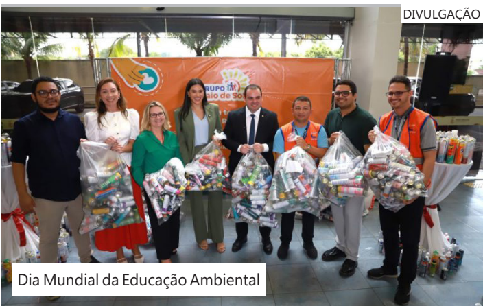
Dia Mundial da Educação Ambiental

proposta pelo deputado Cristiano D’Angelo (MDB), criou a Política Estadual de Incentivo à Reciclagem. O diferencial desta lei é o foco humano, promovendo a Educação Ambiental prática, valorizando os Agentes de Materiais Recicláveis. Calendário de ações Para garantir que o debate ambiental seja permanente, a Lei nº 7.751/2025, da deputada Mayra Dias (Avante), instituiu a campanha “Junho Verde”. A iniciativa dedica o mês inteiro a ações intensivas de conscientização, aproveitando o período em que se celebra o Dia Mundial do Meio Ambiente (5 de junho) para mobilizar a sociedade civil e o poder público.