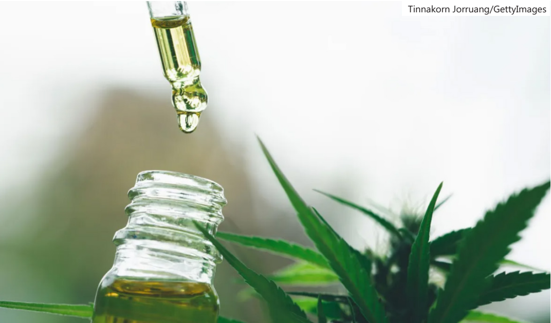
A cannabis medicinal é um produto obtido pela extração dos canabinoides, substâncias presentes na Cannabis sativa

a pessoas jurídicas. Cada unidade produtora estará sujeita à fiscalização e poderá cultivar somente a quantidade necessária para suprir a demanda de medicamentos previamente autorizados. O teor de THC deverá ser de, no máximo, 0,3%, e todos os lotes produzidos serão submetidos a inspeções. “Estamos avançando de forma bastante técnica em todas essas resoluções, com auto debate, com outras discussões, e entendemos que estamos, nesse sentido, enfrentando essa questão e cumprindo essa demanda judicial.”