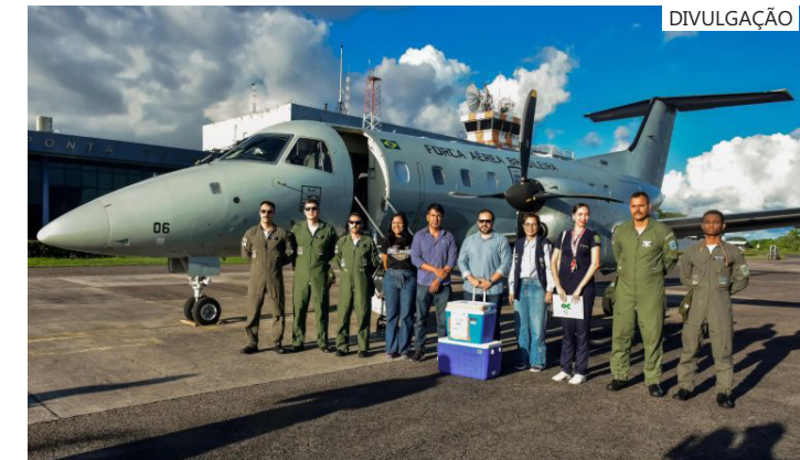
Trabalho foi articulado com Rondônia e Pernambuco e com as centrais Nacional e Estaduais de Transplantes para salvar várias vidas