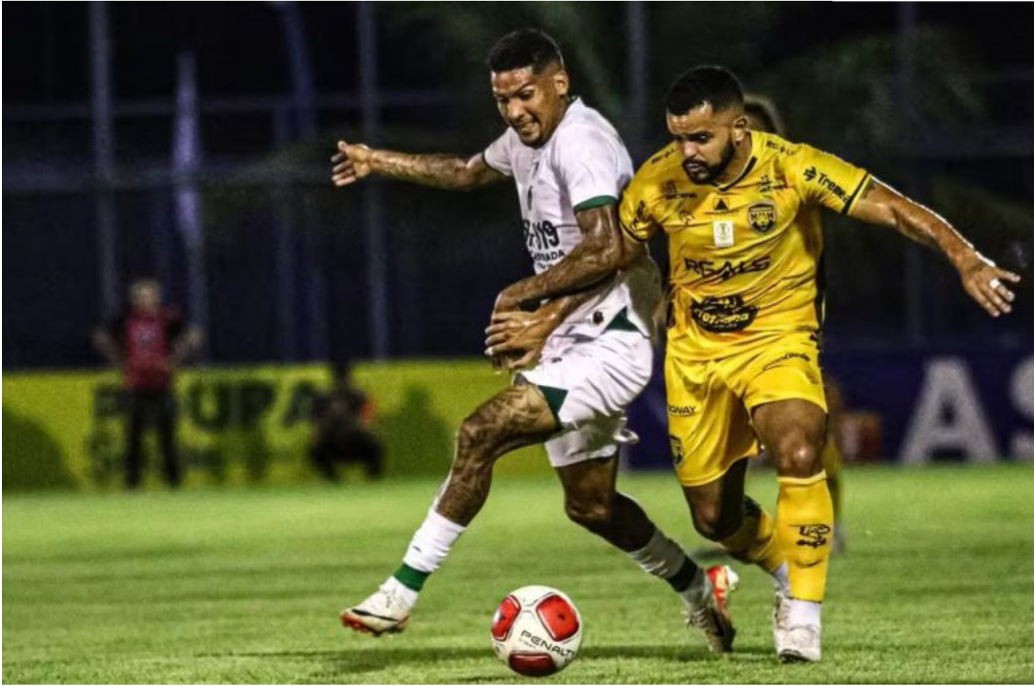
Campeonato Amazonense de 2026

Fundado há apenas seis anos, o clube aurinegro saiu da Série D para a Série B nacional em apenas três temporadas, conquistou o título brasileiro da Série C em 2023,