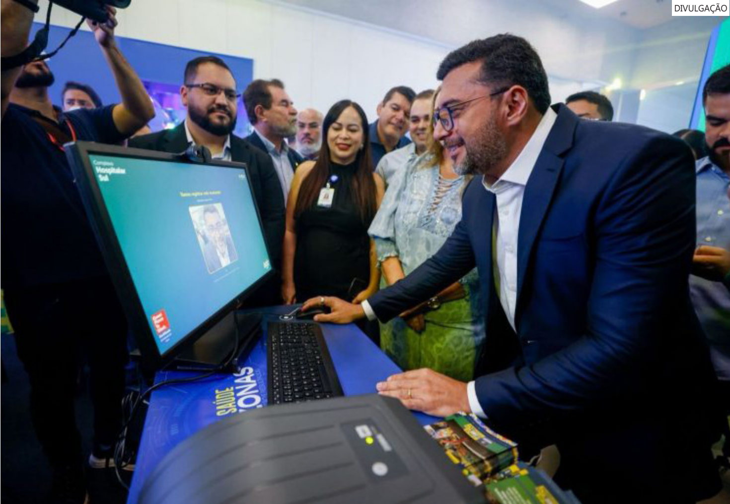
Portal Saúde AM em Tempo Real

seada em dados. A ferramenta mostra, em tempo real, o movimento nas unidades de saúde da capital, indicadores como atendimentos de vítimas de acidentes de trânsito e um ‘mapa de calor’ com a intensidade da demanda nos serviços de pronto atendimento de Manaus.