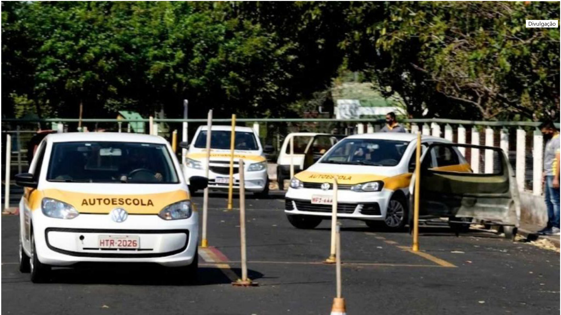
Departamento Nacional de Trânsito do Amazonas (Detran-AM)

O teste de baliza deixou de ser obrigatório nos exames práticos para obtenção da Carteira Nacional de Habilitação (CNH) no Amazonas. A mudança iniciou no dia 1º de janeiro e ocorre após o Departamento Nacional de Trânsito do Amazonas (Detran-AM) adotar integralmente as novas regras da Resolução nº 1.020/2025 do Conselho Nacional de Trânsito (Contran), que reformula o processo de formação de condutores em todo o país. A nova norma não exige mais, de forma explícita, a realização do teste de baliza. A partir de agora, o exame prático avalia as habilidades gerais de condução do candidato, com foco na segurança no trânsito. Além do Amazonas, outros três estados também adotaram a mudança: Espírito Santo, Mato Grosso do Sul e São Paulo. A nova resolução não menciona a baliza como etapa obrigatória do exame prático.