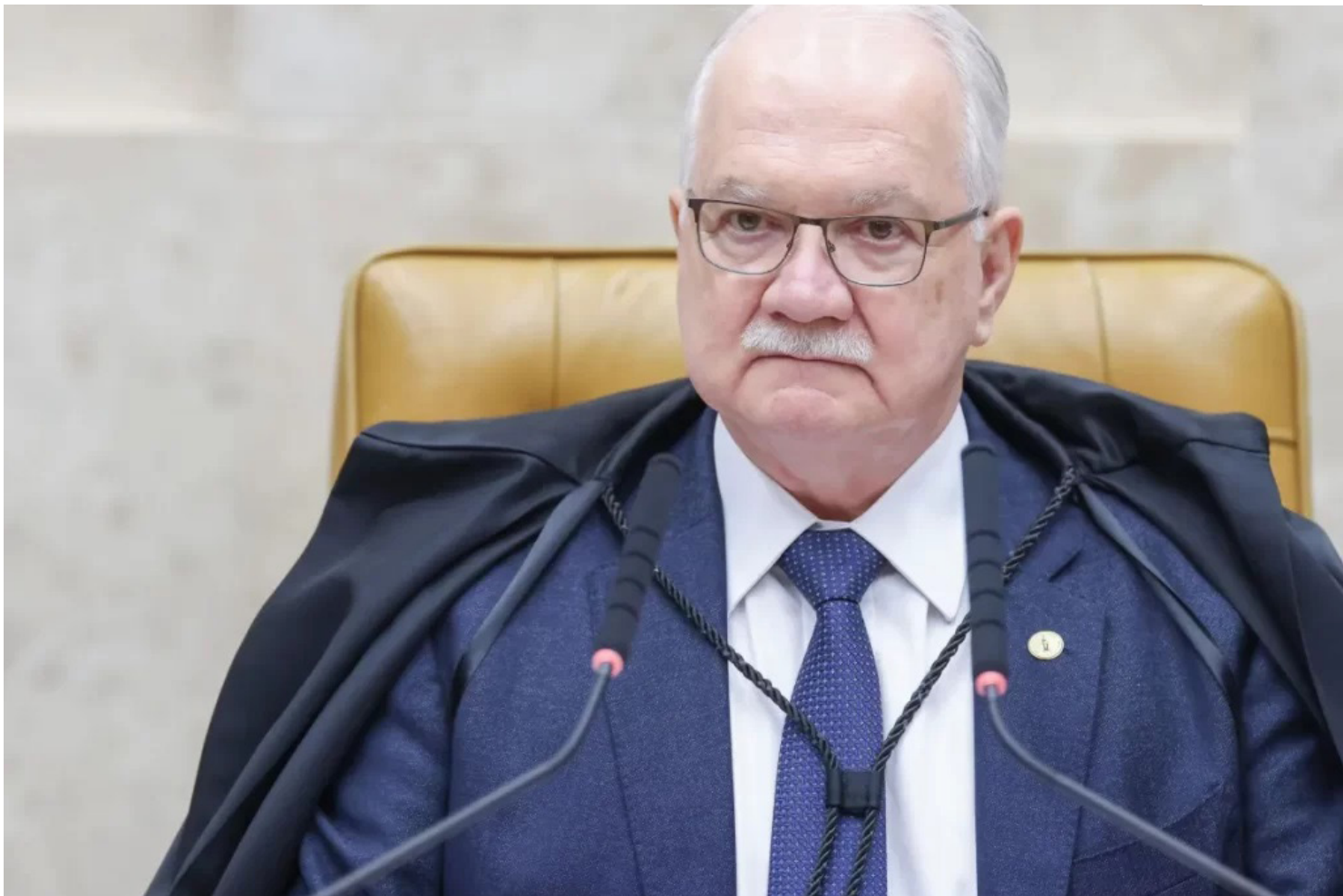
Ministro Edson Fachin, presidente do Supremo Tribunal Federal

“Até porque, ou nós encontramos um modo de nos autolimitarmos, ou poderá haver eventualmente uma limitação que venha de algum poder externo, e não creio que o resultado seja bom, haja vista o que aconteceu na Polônia, na Hungria, no México”, acrescentou o magistrado. Desde que assumiu a presidência do STF, Fachin vem conversando com colegas da Corte e de outros tribunais superiores sobre a questão. Em outro momento da en-