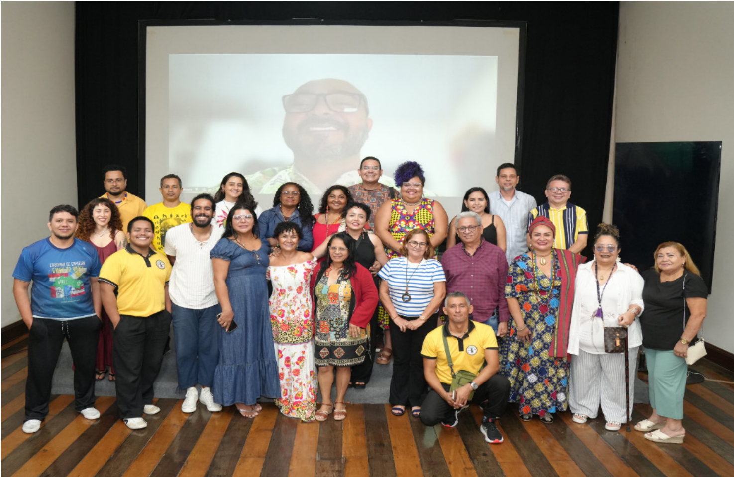
O encontro faz parte da programação da 1ª Teia Estadual do Amazonas, que acontece nesta semana

“A cultura viva é uma conquista histórica. Agente discutiu aqui os grandes desafios do programa e dos pontos de cultura, principalmente a sustentabilidade. O ponto de cultura não adere à lógica do mercado, ele não vende, ele distribui. Então, o grande desafio é garantir fomento para além dos editais,