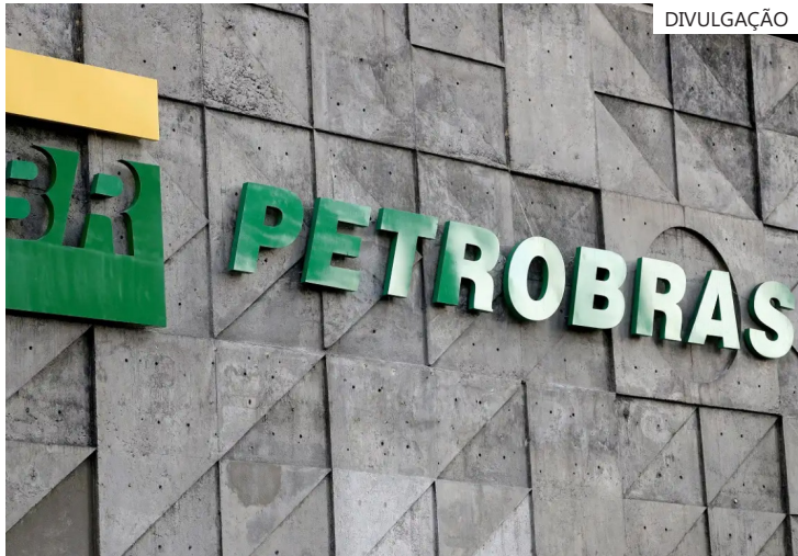
Combustível fica, em média, R$ 0,14 mais barato para as distribuidoras

Em relação ao crescimento bruto, São Paulo foi o estado com mais entrada de mulheres, com 17.768 novas investidoras. Atrás dele, estão Rio de Janeiro, com 6.598 investidoras, e Minas Gerais, com 6.089. Em todos os estados, a variação da presença feminina foi positiva.