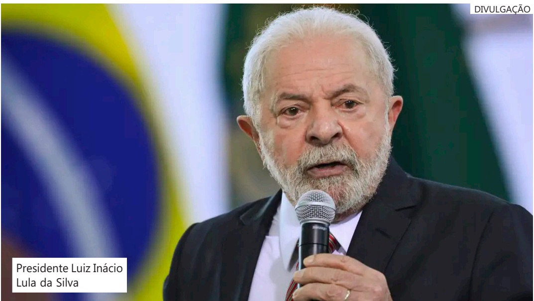
Presidente Luiz Inácio Lula da Silva