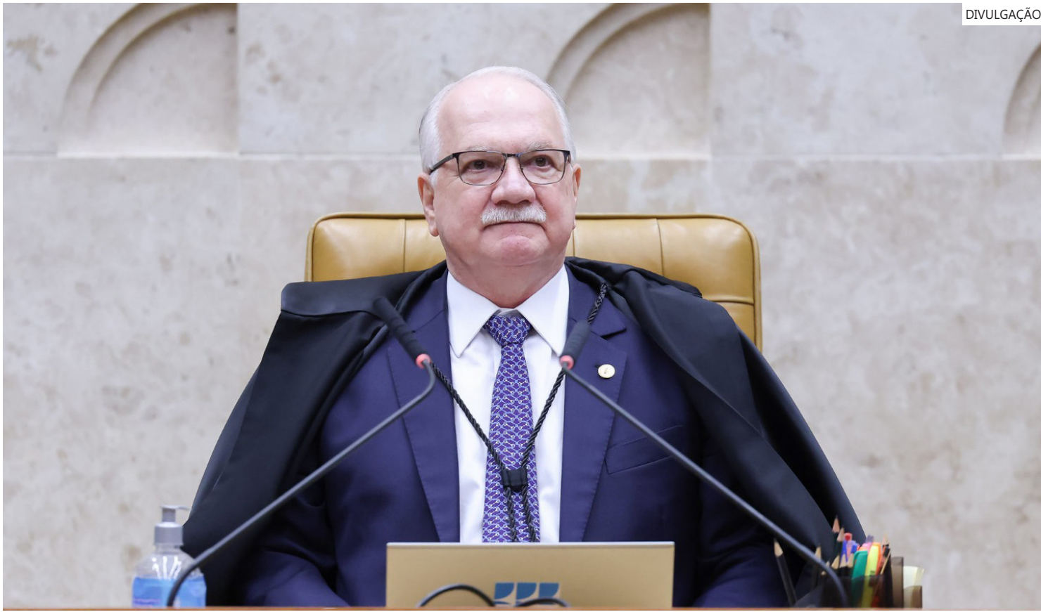
Ministro Edson Fachin, presidente do Supremo Tribunal Federal