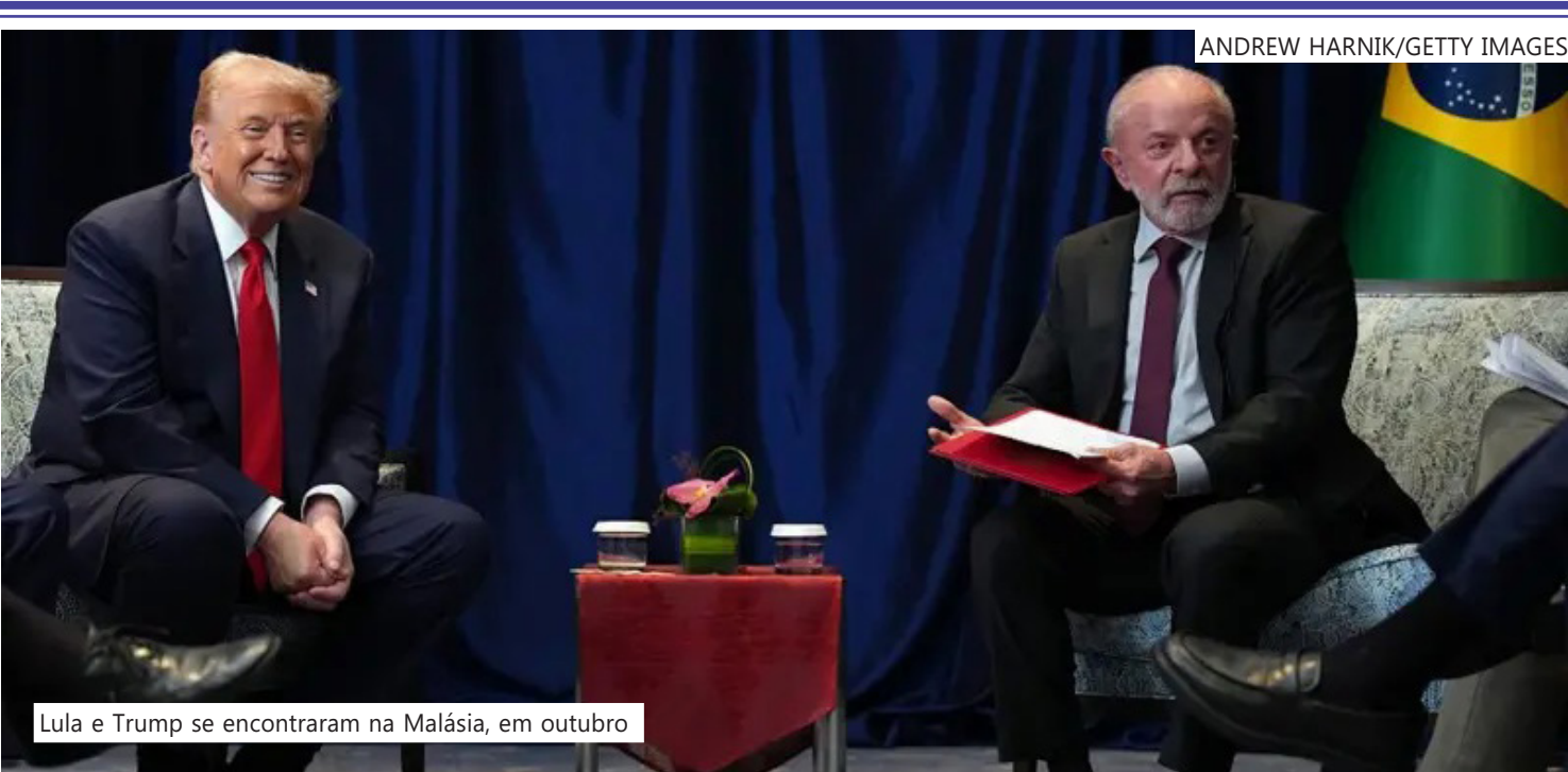
Lula e Trump se encontraram na Malásia, em outubro

O presidente do Brasil, Luiz Inácio Lula da Silva (PT), e dos Estados Unidos, Donald Trump, acertaram que o brasileiro fará uma visita a Washington assim que Lula voltar de uma série de viagens à Índia e à Coreia do Sul, em fevereiro. O assunto foi discutido durante uma ligação telefônica entre Trump e Lula realizada nesta segunda-feira (26/1), segundo nota divulgada pela Secretaria de Comunicação da Presidência da República (Secom). A data exata da viagem, no entanto, ainda não foi acordada, segundo a nota e segundo um integrante do governo com quem a BBC News Brasil conversou em caráter reservado. Esta é a terceira vez que os dois trocam telefonemas desde que se aproximaram politicamente, em setembro do ano passado, quando puseram um fim, ao menos temporariamente, a um período de tensão que chegou ao ápice quando Trump anunciou um tarifaço de 40% a produtos brasileiros, em julho do ano passado. Desde setembro, quan-