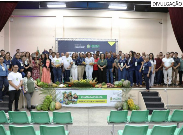
Itens alimentícios subsidiarão a merenda escolar de estudantes da rede estadual de ensino do Amazonas

o incentivo aos produtores primários, e a garantia das políticas públicas”, ressaltou a coordenadora. As sessões públicas de abertura dos envelopes acontecem no Centro de Formação Padre José Anchieta (Cepan), localizado na sede da Secretaria de Educação, na Avenida Waldomiro Lustoza, 250 – Japiim II, zona sul de Manaus.