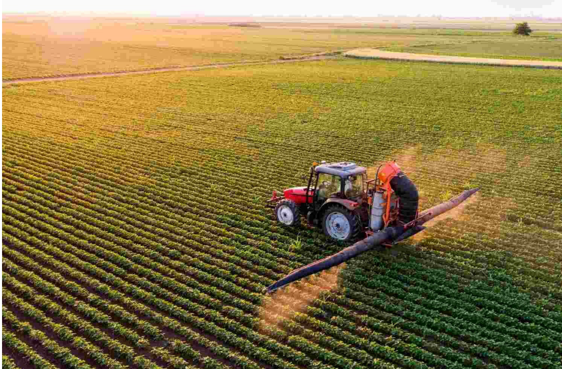
Como principal canal de entrada de fertilizantes importados no país, manteve-se o Porto de Paranaguá (PR)

As exportações de milho em grãos em dezembro de 2025 alcançaram 40,9 milhões de toneladas, acima das 39,7 milhões de toneladas registra-