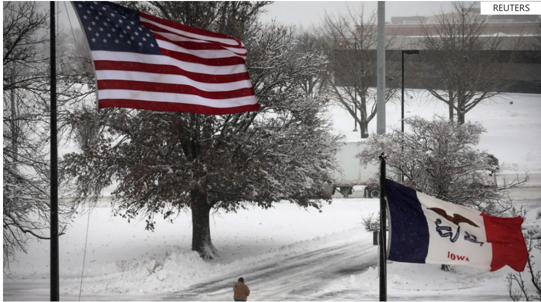
Nevasca e fortes ventos afetaram o transporte aéreo, obrigando as principais companhias aéreas a cancelar mais de 11 mil voos no final de semana

transporte aéreo, obrigando as principais companhias aéreas a cancelar mais de 11.000 voos nos EUA programados para domingo, de acordo com o serviço de rastreamento de voos FlightAware.com. A onda de frio ártico foi acompanhada por rajadas de vento que fizeram com que a sensação térmica – uma medida de quão frio se sente com base na taxa de perda de calor do corpo – despencasse para até -45 graus no norte. Os danos mais significativos à infraestrutura aconteceram na região sul dos EUA.