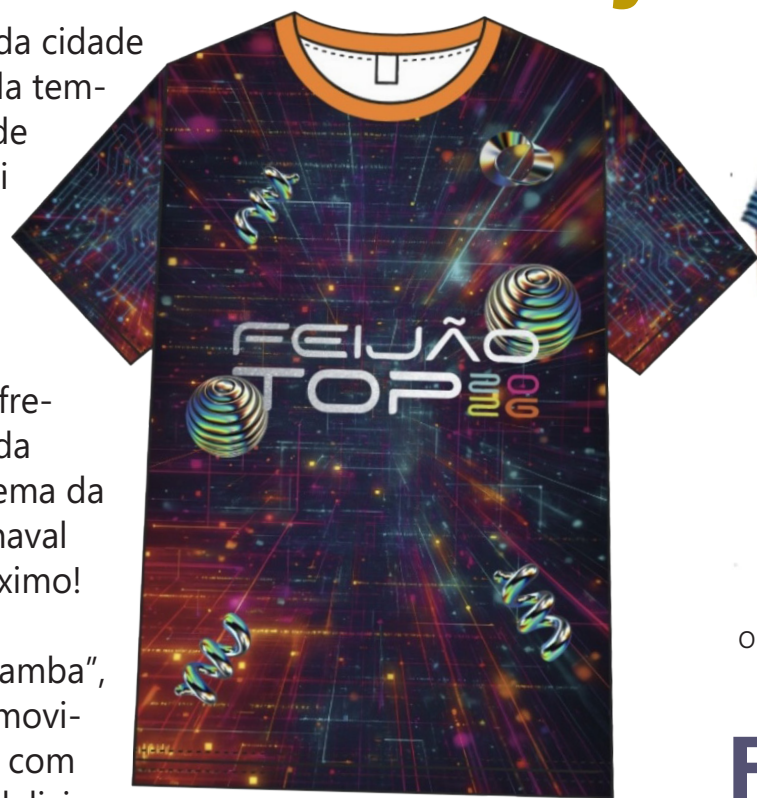
A camiseta/convite do “Feijão Top 2026”, item de acesso à folia chic do dia 7 de fevereiro no Village Festas, que já começa a circular pela cidade. Info-line: 99985-1422 ou 99126-4828

. Eleita pelo elenco top da cidade como ponto obrigatório da temporada pré-carnavalesca de Manaus, o “Feijão Top” vai sacudir a cidade no próximo dia 7 de fevereiro. . O Village Festas será o local da folia chic com os frequentadores usando a linda camiseta/convite com o tema da versão 2026 da festa: Carnaval Tecnológico. Vai ser o máximo! . O grupo “Estatuto do Samba”, antigo “Couro Velho” vai movimentar o palco do Village com sambinhas e no buffet, a deliciosa feijoada com tempero inigualável. Não dá para perder!