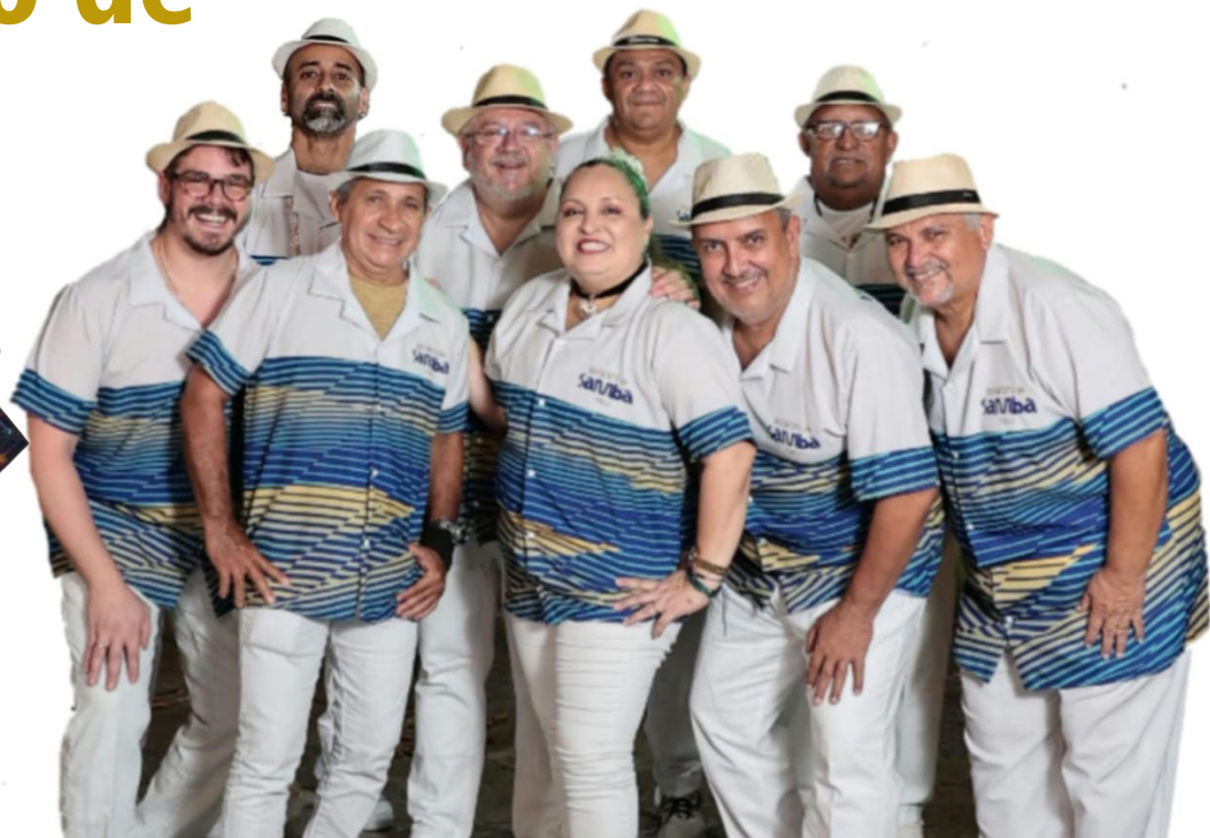
O ótimo grupo “Estatuto do Samba”, atração confirmada do Feijão Top 2026 que vai sacudir o Village Festas no próximo dia 7 de fevereiro