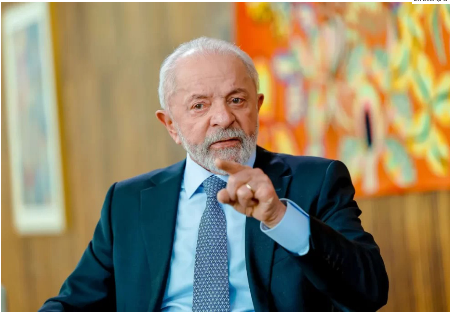
Presidente Luiz Inácio Lula da Silva

três carreiras como de Estado; – No TCU, há a ampliação do número de cargos, a ele-