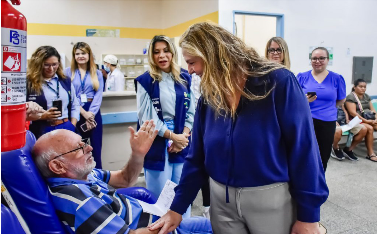
Atendimentos na rede de urgência e emergência de Manaus, durante o período carnavalesco

A Secretaria de Estado de Saúde (SES-AM) registrou 55.367 atendimentos na rede de urgência e emergência de Manaus, durante o período carnavalesco, de 12 a 17 de fevereiro. Os atendimentos na rede de saúde de Manaus podem ser acompanhados no portal Saúde em Tempo Real ( saudeamtemporeal.saude.am.gov.br ) do Governo do Amazonas. Foram registrados, no período, 537 atendimentos de vítimas de acidentes de trânsito, sendo 82 na quinta-feira, 98 na sexta-feira, 86 no sábado, 81 no domingo, 96 na segunda e 94 na terça. Desses, 342 envolveram motocicletas e 24 carros, além de 14 vítimas de atropelamentos e mais 157 relacionados a outros tipos de ocorrências no trânsito. As 25 unidades de urgência e emergência da capital mantiveram seu funcionamento 24 horas, assegurando aten-