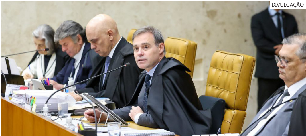
Magistrados divergem sobre inquérito aberto por Alexandre de Moraes

operação e a imposição de medidas cautelares, afirma que os diversos e múltiplos acessos ilegais podem ser tipificados no crime de violação de sigilo funcional. “O caso não se exaure apenas na violação individual do sigilo fiscal, uma vez que a exploração fragmentada e seletiva de informações sigilosas de autoridades públicas, divulgadas sem contexto e sem controle jurisdicional, tem sido instrumentalizada para produzir suspeitas artificiais, de difícil dissipação”, diz a PGR. Moraes decretou busca e apreensão domiciliar e pessoal, afastamento dos sigilos bancário, fiscal e telemático, uso de tornozeleira eletrônica, proibição de deixar o país, recolhimento domiciliar no período noturno e afastamento do cargo aos servidores Luiz Antônio Martins Nunes, Luciano Pery Santos Nascimento, Ruth Machado dos Santos e Ricardo Mansano de Moraes.