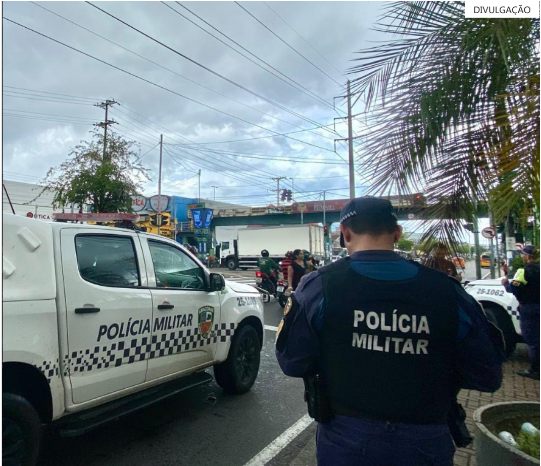
O homem estava sendo procurado desde maio de 2025