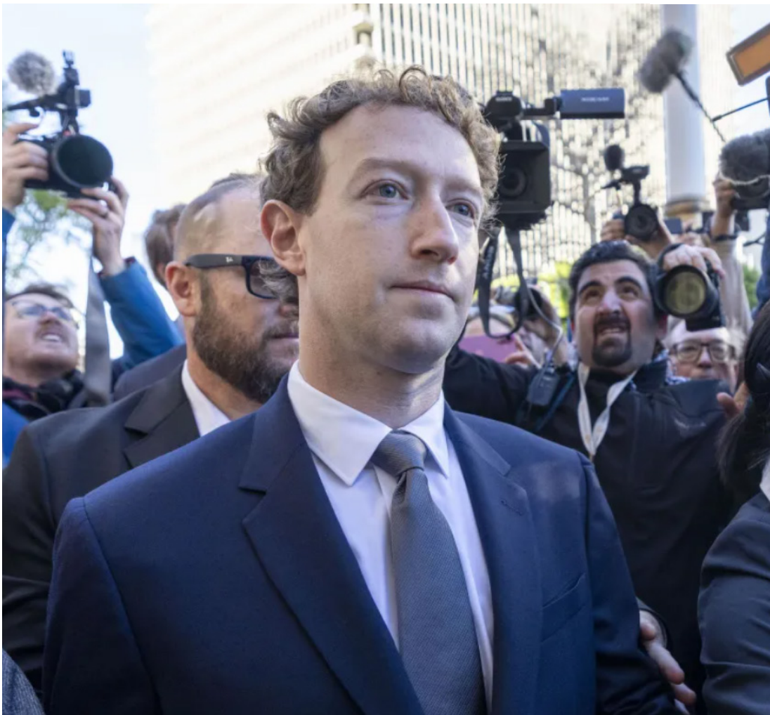
CEO da Meta, Mark Zuckerberg, chegando ao Tribunal Superior de Los Angeles em 18 de fevereiro de 2026

O CEO da Meta, Mark Zuckerberg, foi questionado nesta quarta-feira (18) sobre se a empresa projetou intencionalmente plataformas para viciar os usuários, ao depor em um julgamento histórico sobre alegações de que as redes sociais prejudicam crianças. O depoimento marca a primeira vez que Zuckerberg responde a tais acusações perante um júri. O empresário da tecnologia chegou ao Tribunal Superior de Los Angeles pela manhã, passando por uma multidão de pais, jornalistas e jurados que também aguardavam na fila para entrar. Ele não respondeu a uma pergunta sobre qual seria sua mensagem para os pais que afirmam que seus filhos foram prejudicados pelas redes sociais. Algumas pessoas que dizem que seus filhos foram feridos ou morreram em decorrência das redes sociais viajaram de todo o país para comparecer à audiência. Eles afirmam que esse processo representa um momento crucial de responsabilização para a Meta, após anos de preocupações com a segurança dos jovens nas plataformas Facebook e Instagram. No tribunal, o presidente-executivo da Meta rebateu a sugestão de um advogado de que teria enganado o Congresso sobre o design das plataformas de redes sociais, enquanto prossegue um julgamento sobre o vício dos jovens nas redes sociais. Zuckerberg foi questionado sobre as declarações ao