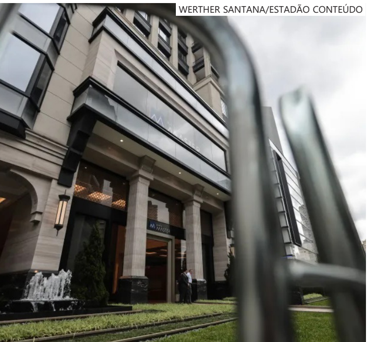
Fachada do Banco Master na cidade de São Paulo