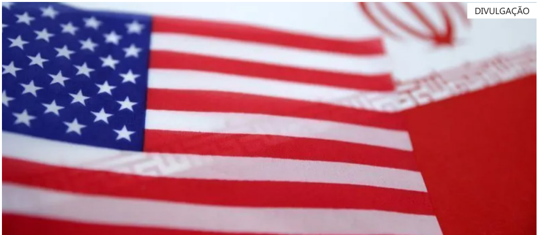
Delegações dos EUA e de Israel se encontraram na Suíça em meio a esforços para fechar um acordo

ocorre após delegações dos EUA e de Israel se encontrarem na Suíça em meio a esforços para fechar um acordo. Um funcionário dos EUA disse após a reunião de terça-feira que “houve progresso, mas ainda há muitos detalhes a serem discutidos.” “Os iranianos disseram que voltariam nas próximas duas semanas com propostas detalhadas para abordar algumas das lacunas em nossas posições.”