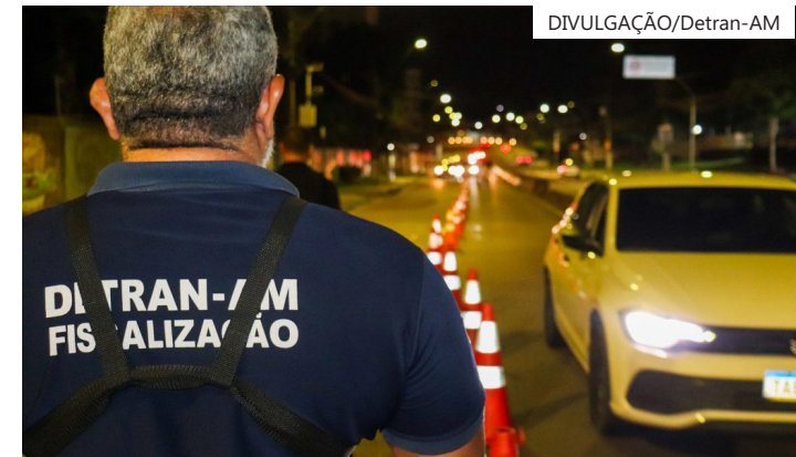
As ações de fiscalização para o Carnaval foram intensificadas a partir do dia 13 de fevereiro

(7), veículo com descarga livre (6), veículo em mau estado de conservação (5), permitir condução a pessoa com habilitação vencida há mais de 30 dias (4), transpor bloqueio viário policial (4), desobedecer ordem da autoridade de trânsito (3), manobra perigosa com arrancada brusca (3), passageiro de motocicleta sem capacete (3), retirar veículo retido sem permissão (2), veículo sem qualquer uma das placas (2), avançar sinal vermelho (2), pedestre desobedecer sinalização específica (2), veículo com característica alterada (2) e dirigir sem atenção ou cuidados indispensáveis (2).