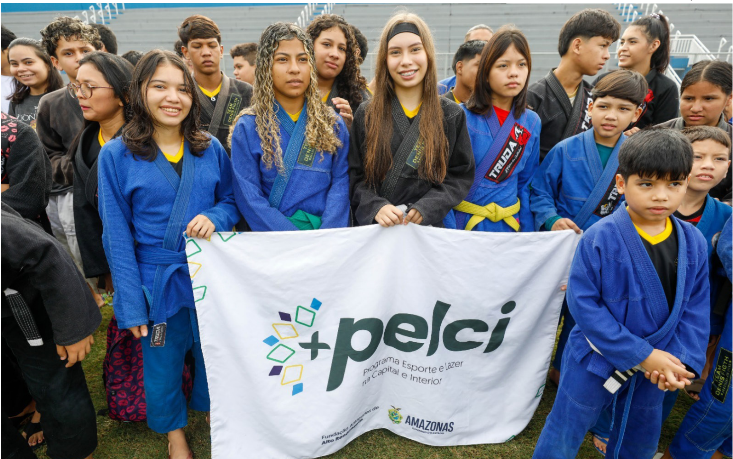
Programa Esporte e Lazer na Capital e Interior (Pelci)