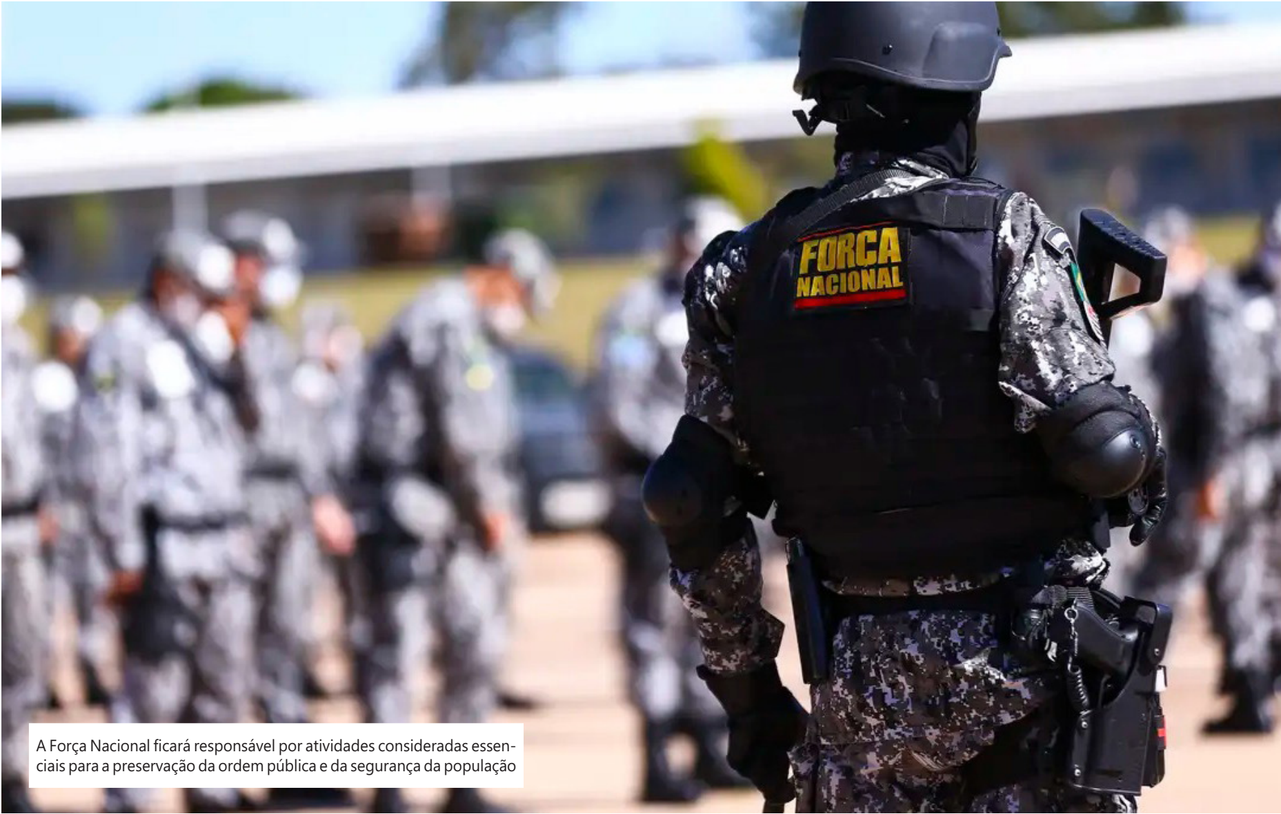
A Força Nacional ficará responsável por atividades consideradas essenciais para a preservação da ordem pública e da segurança da população

Medida, emitida pelo Ministério da Justiça e Segurança Pública, foi publicada no Diário Oficial da União nesta quarta-feira (18) e vale pelos próximos 90 dias