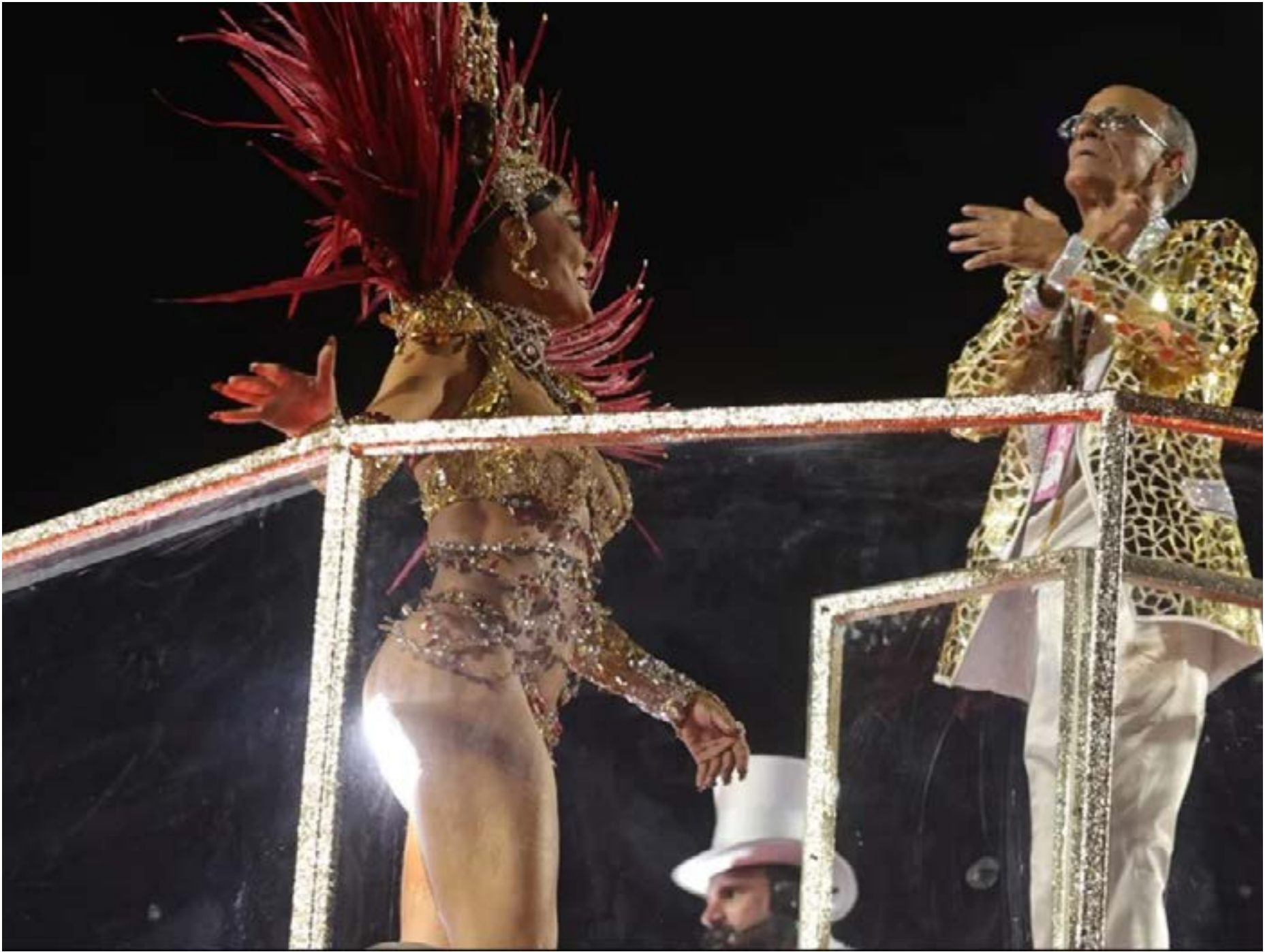
Agremiação carioca levou o troféu e comemorou na quadra da escola nesta quarta-feira (18)

Os desfiles de escolas de samba do Grupo Especial no Rio de Janeiro começaram na noite de domingo (15) com Acadêmicos de Niterói, Imperatriz Leopoldinense, Portela e Estação Primeira de Mangueira passando pelo sambódromo da Marquês de Sapucaí. Cada escola faz apresentações de 80 minutos, com temas que passam por política, música, homenagem a artistas e cultura afro-brasileira. A Acadêmicos de Niterói,