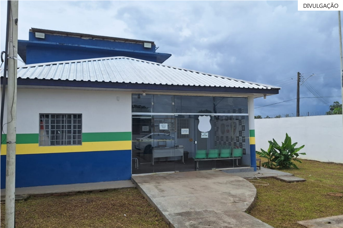
Vítima teve a cabeça decapitada após uma discussão banal

local indicado, onde localizaram o homem. O foragido que estava sendo procurado, desde maio de 2025, foi preso. Ele estava sendo procurado pelo crime de homicídio. O foragido foi conduzido à unidade de Polícia Civil para os procedimentos de polícia judiciária e em seguida, será encaminhado à Justiça.