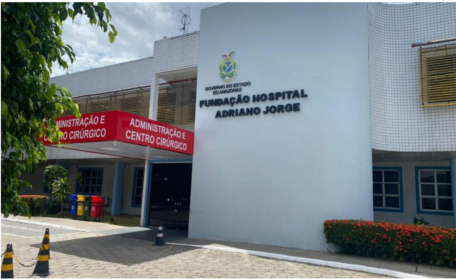
Fundação Hospital Adriano Jorge