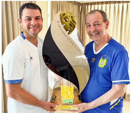
Torcedor do Nacional Futebol Clube, o senador Omar Aziz, candidato ao Governo do Amazonas e deputado Saulo Vianna exibindo o troféu conquistado no Torneio Barezão

Em um balanço das ações realizadas nos primeiros meses de 2026, o Governo do Amazonas, por meio da Sect, já ultrapassou a marca de 1.100 títulos definitivos entregues em todo o Estado. A expectativa do Governo do Amazonas é ampliar ainda mais o alcance das ações ao longo de 2026. Na foto o governador do Amazonas, Wilson Lima com a Secretária da SECT Renata Queiroz