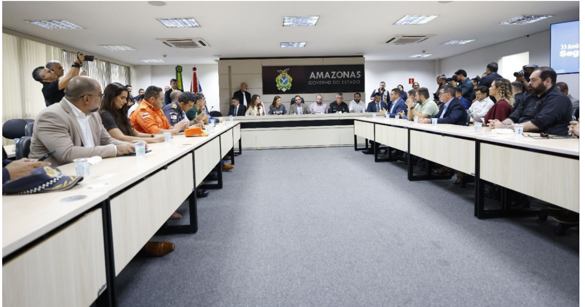
Pacote inclui pagamento da data-base de 2026 e a promoção de 713 militares da Polícia Militar e Corpo de Bombeiros