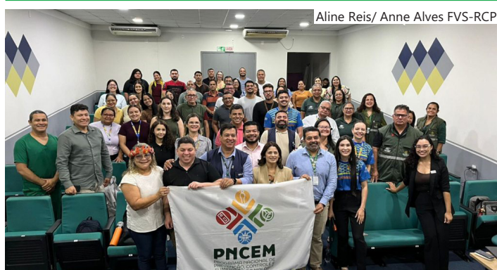
Estratégia fortalece adesão ao tratamento e integra ações do Ministério da Saúde e FVS-RCP

"Precisamos incentivar cada vez mais o uso da tafenoquina, especialmente diante dos desafios no tratamento da malária em crianças. A baixa adesão ao tratamento nessa faixa etária ainda é um problema que acaba contribuindo para a manutenção da cadeia de transmissão da doença. Por isso, é fundamental ampliar o uso da tafenoquina de forma segura, como estratégia para fortalecer o controle da malária", destaca.