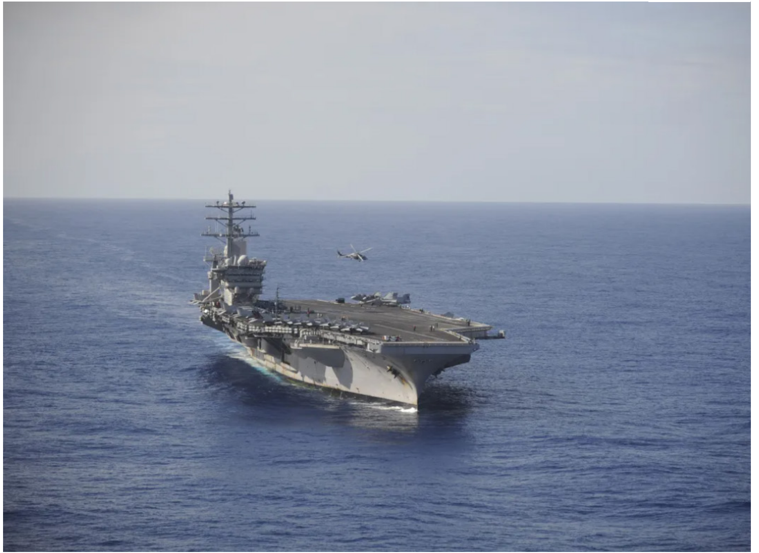
O porta-aviões USS Nimitz no Oceano Pacífico em dezembro de 2013

Segundo a Embaixada dos EUA no Brasil, além do USS Nimitz e do USS Gridley, o exercício vai reunir o Destroyer Squadron 9, as aeronaves F/A-18E/f Super Hornet, EA-19G Growler, C-2A Greyhound e o MH-60R/S Seahawk.