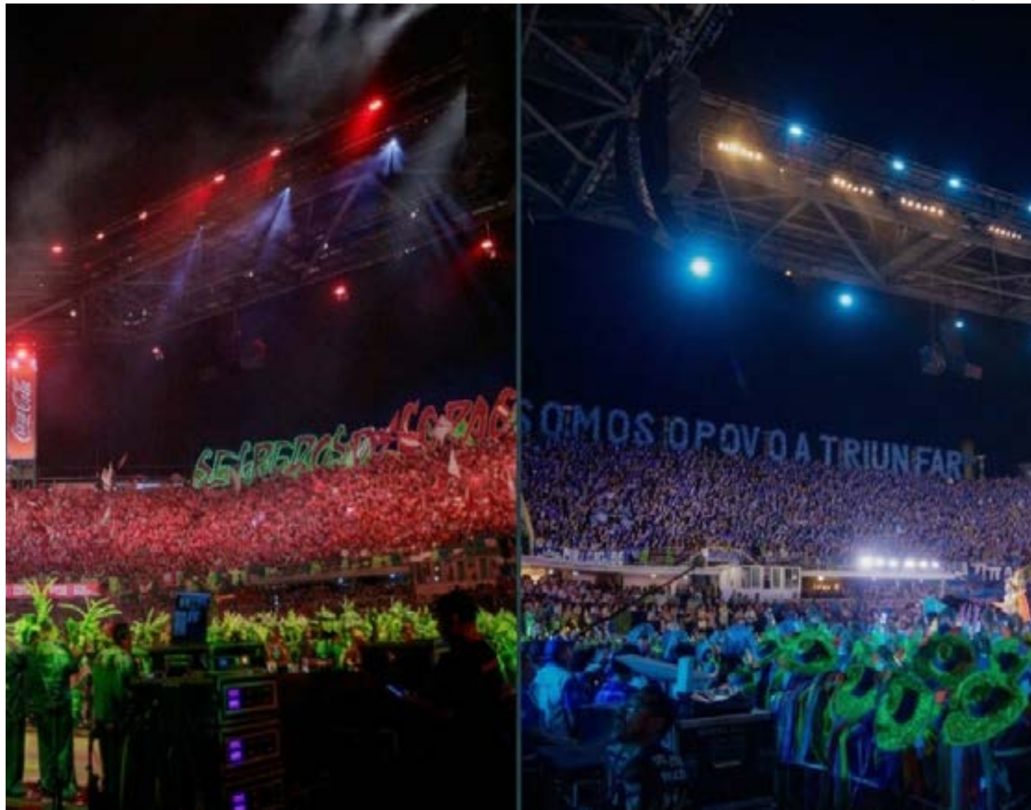
São 30 vagas para PcD, por noite, com direito a um acompanhante

As inscrições são limitadas à escolha de uma noite por