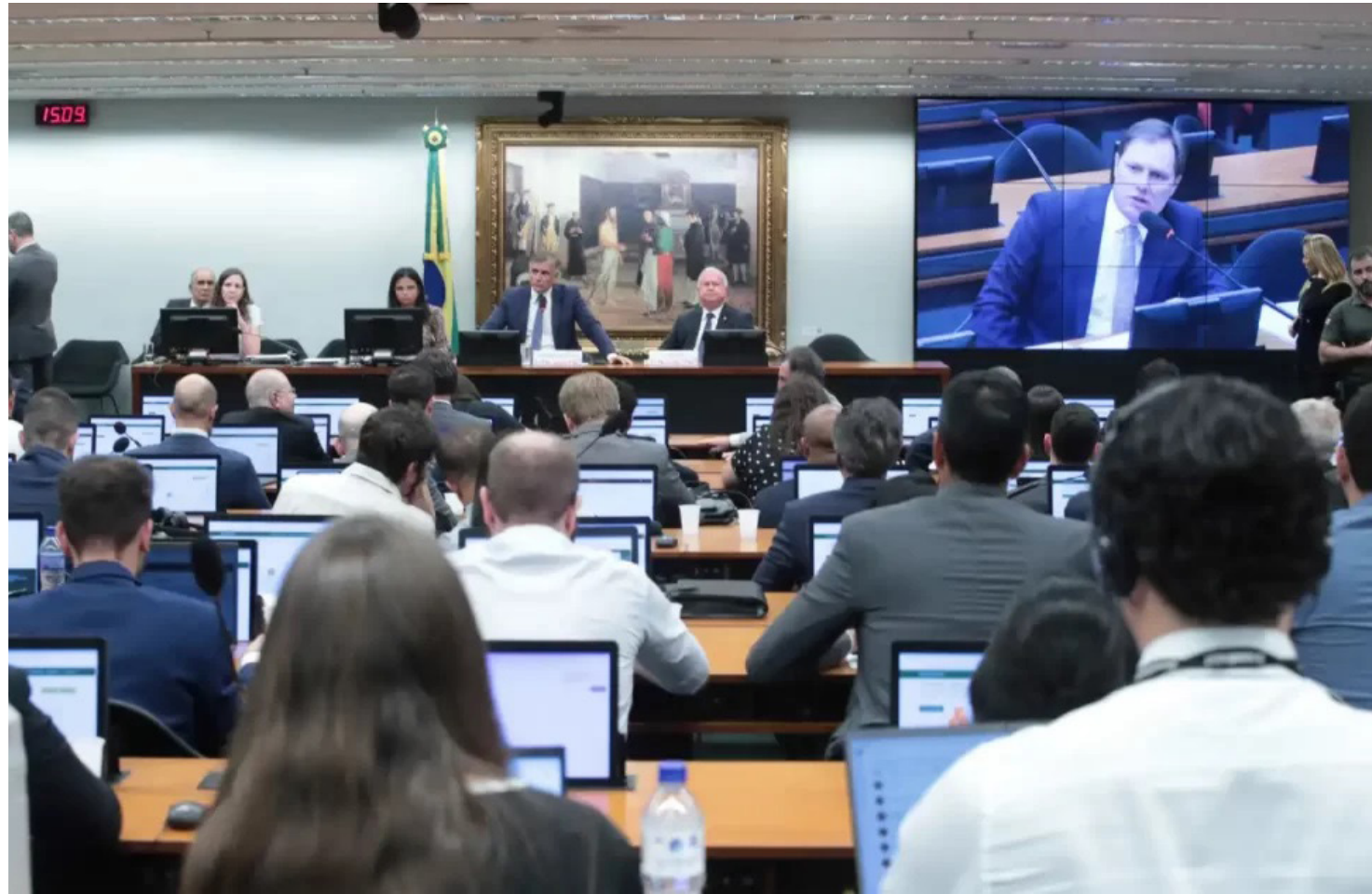
Comissão de Constituição e Justiça (CCJ) da Câmara

“Hoje, no Brasil, quem mais trabalha efetivamente é quem ganha menos”, argumentou o relator na reunião. Segundo