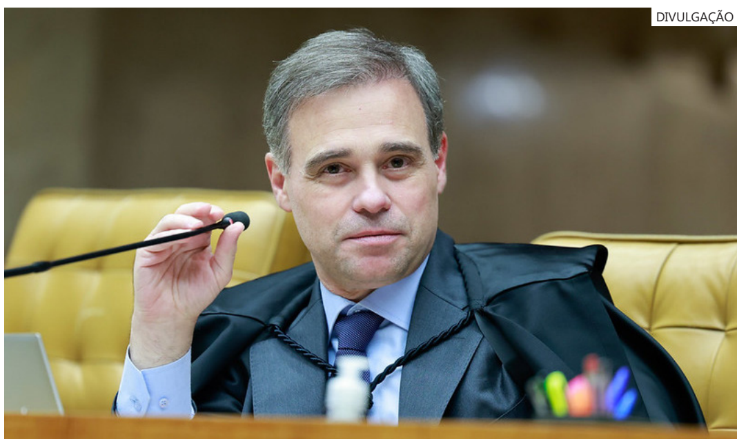
Ministro André Mendonça, do STF

“Prometo manter, defender e cumprir as leis, desempenhando com lealdade o mandato que me foi conferido”, declarou a parlamentar, ressaltando que o trabalho focado nas demandas sociais do estado será sua prioridade.