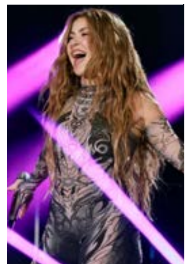
Shakira é a atração confirmada no Todo Mundo no Rio 2026