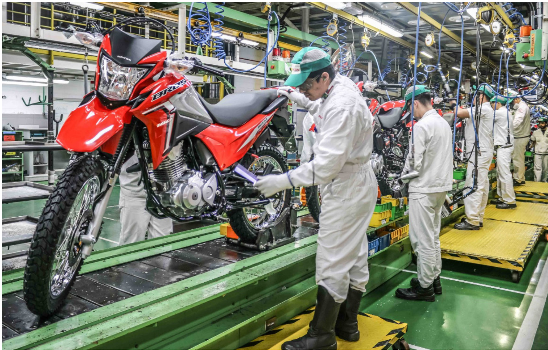
Exportações de ouro para a Alemanha lideram desempenho, enquanto importações mantêm trajetória elevada sustentada por bens intermediários

As exportações amazonenses seguem concentradas em produtos industriais e minerais. A Alemanha foi o principal destino no mês, com destaque para a exportação de ouro, que somou US$ 37,04 milhões e representou 94,39% da pauta exporta-