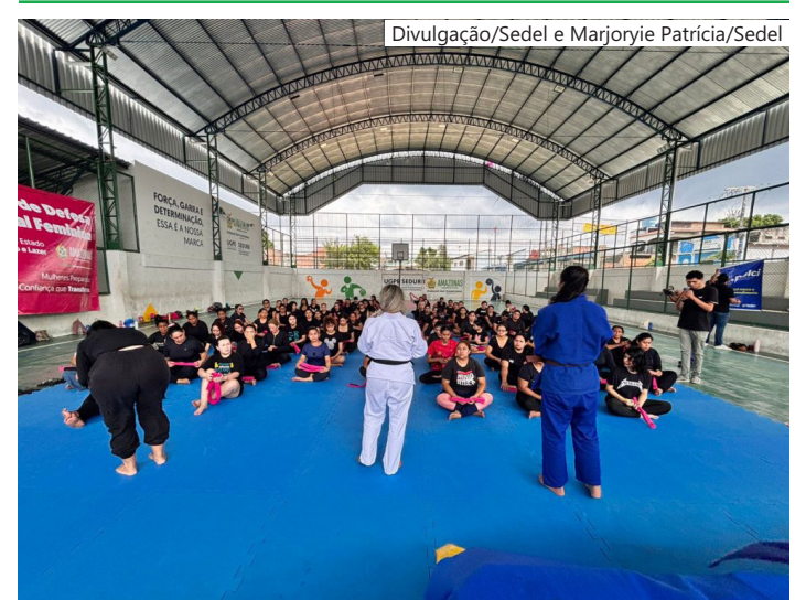
Estão sendo oferecidas 250 vagas para mulheres a partir de 12 anos, no bairro Gilberto Mestrinho

Criado em 2023, o curso integra o Projeto Formando Campeões, vinculado ao Programa Esporte e Lazer na Capital e Interior (Pelci), e já ultrapassou a marca de 5 mil mulheres atendidas em Manaus e no interior do estado. A iniciativa também conta com núcleos fixos e participação em ações como o projeto Vila Aberta Para Todos, ampliando o acesso da população às atividades.